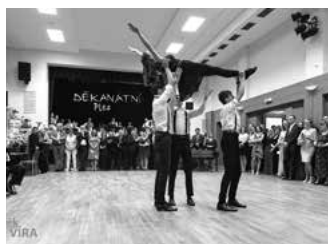
Předtančení na Děkanátním plese