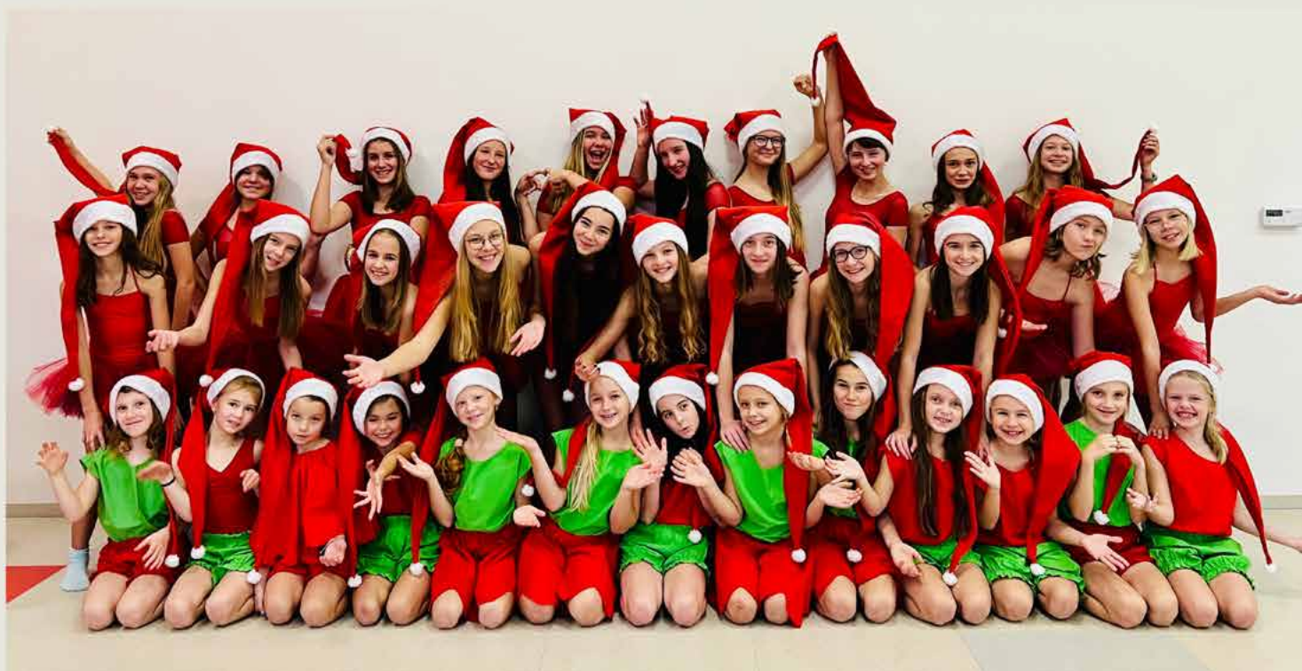
Grafika: Veronika Kaštánková