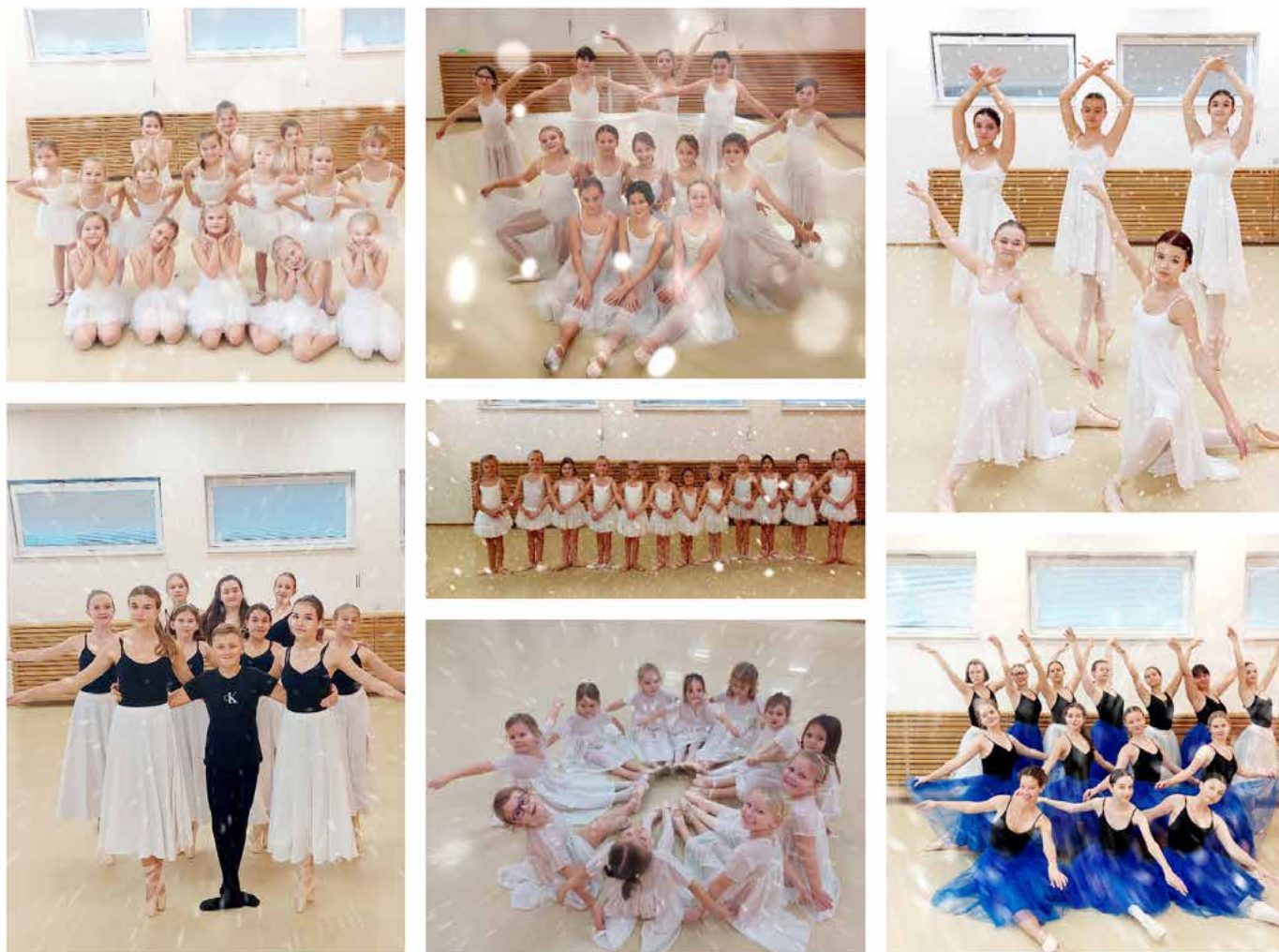
Grafika: Jarmila Krystoňová