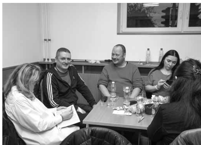
Tabulka vítězů koštu pálenek ve Starém Městě v roce 2023