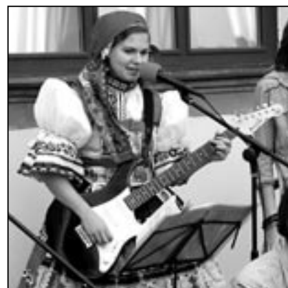
Folklor a folk.

Ve středu 25. listopadu mají svátek Kateřiny. Ve Starém Městě nyní žije celkem 47 držitelek tohoto pěkného a vcelku velmi početného jména. Vždyť na některých místech v okolí jsou pořádány Kateřinské zábavy, které jsou hojně navštěvovány. Všem Katkám, Kačenkám, Kateřinkám posíláme básničku a přejeme zdraví, štěstí a lásku. Milan Kubíček