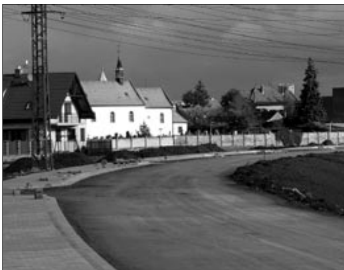
Na Trávníku, v blízkosti řeky Moravy, se staví nová silnice, cyklostezka a chodník