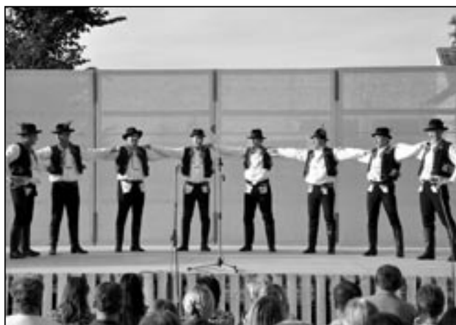
Tančí a zpívají Doliňáci.