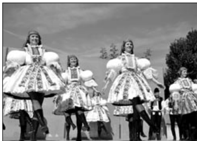
Přívabné děvčice z Doliny.