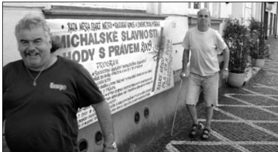
Michalské slavnosti 2009 jsou již minulostí. Hodovali také mnozí staroměstští patrioti, kteří na naše město nikdy nedají dopustit.