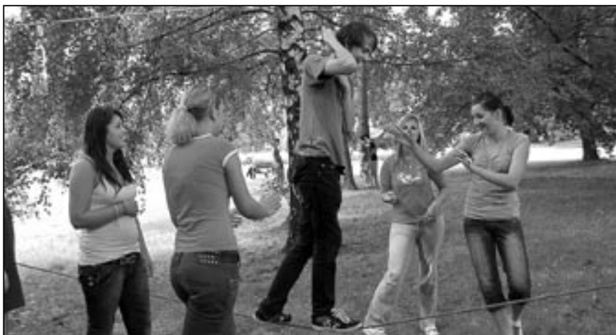
Lanové aktivity pro žáky školy připravilo občanské sdružení Atmosféra z Napajedel.

Nakonec žáci zodpověděli otázky dotazníku, který zjišťoval, jak se jim den „Seznamte se, prosím“ líbil. Dotazník ukázal, co žáci očekávají od studia na SOŠ a Gymnázium Staré Město. Úspěšný adaptační program bude využit i v následujících letech. DZ