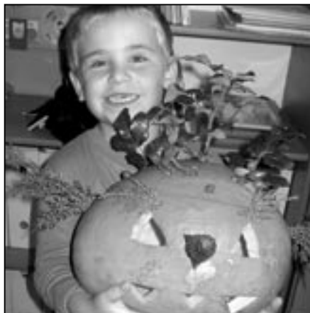
To je ale dílo!