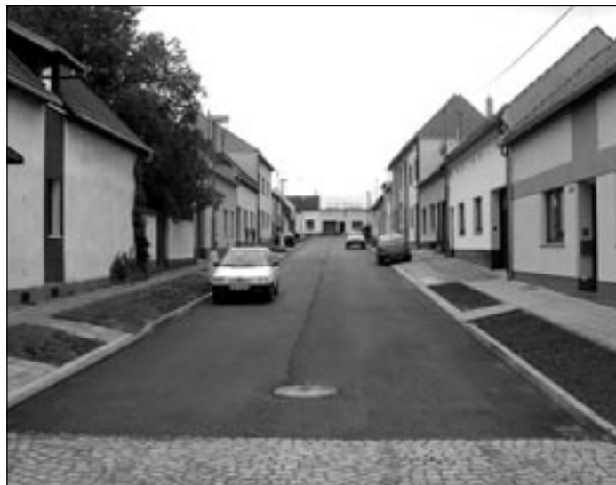
Severní část Kosmovy ulice s novou komunikací a chodníkem.