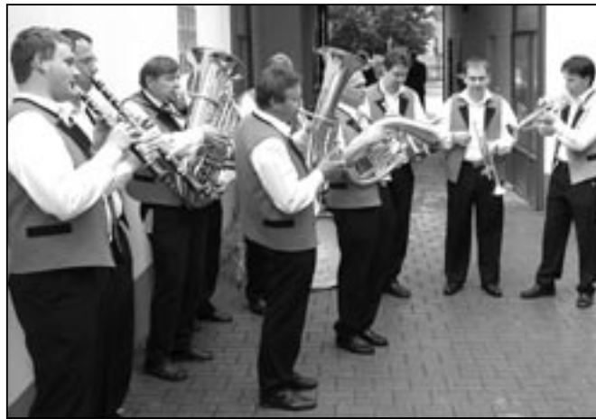
O dobrou pohodu se postarala Staroměstská kapela.