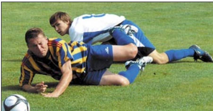
Přejeme hráčům TJ Jiskra, aby co nejméně byli na kolenou.