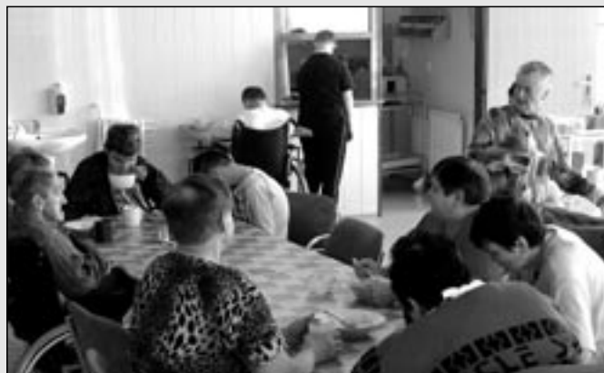
Obyvatelé domova při obědi v jídelně.