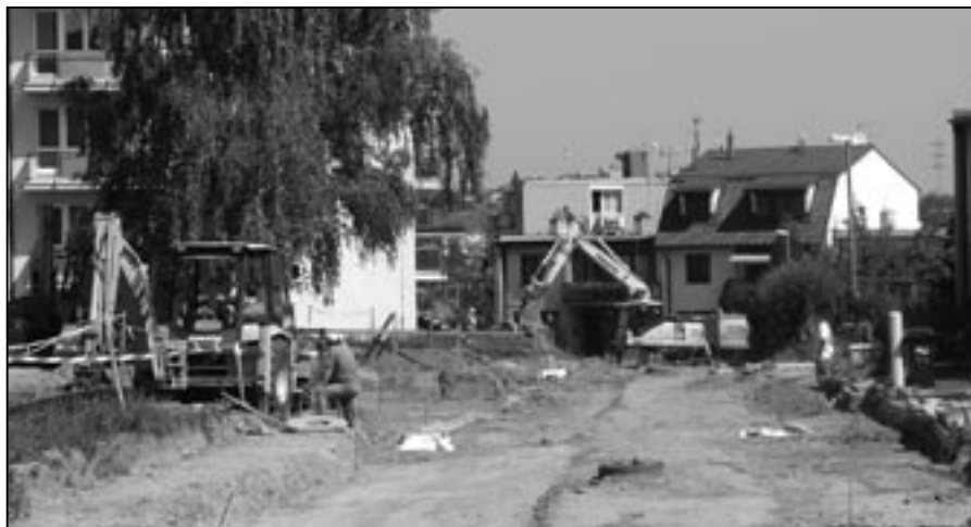
Čilý stavební ruch vládl v průběhu léta a podzimu v lokalitě Kopánky a přilehlých ulicích.

- o vyloučení uchazeče STAVOPROJEKT OLOMOUC a. s., Holická 568/31, 772 00 Olomouc z účasti na zadávacím řízení akce Dopravní terminál ve Starém Městě (dokončení na straně 11)