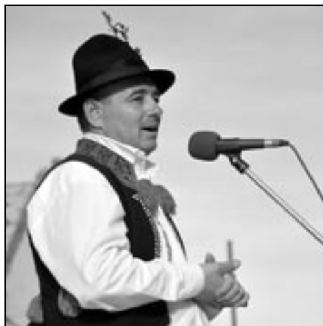
Hodové odpoledne moderoval Josef Bazala.