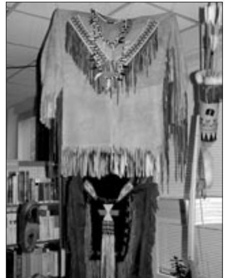
Zhotovení indiánského kroje zabralo více než 150 hodin.

Na přípravě výstavy se podíleli také naše děti a její realizace byla jen střípkem z naší plánované letošní činnosti. Staroměstský oddíl má asi 30 členů a děti jsou rozděleny do tří družin – Kondoři, Mamuti a Orli. Každá z družin se pravidelně schází v klubovně u Čertáku. Alespoň jednou do měsíce, ale spíše dvakrát, společně celý oddíl vyrazí na jedno nebo vícedenní výpravy do přírody, občas i na různé památky. Plánujeme i cyklovýpravy. Každý rok jezdíme na letní tábor, nejčastěji na naše tábořiště u obce Držková. Letos jsme ale byly u přehrady Lipno na Šumavě. Aktivit máme v oddíle celou řadu, kromě těch tradičních slaňujeme, vedoucí jezdí na přepady táborů jiných oddílů (skauti si berou vlajky, podobně jako se krade máj mezi vesnicemi) a začí-