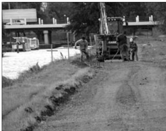
Cyklostezka kolem Baťova kanálu propojí cyklostezku ve směru do Huštěnovic a další cyklotrasu směrem na Kostelany nad Moravou.