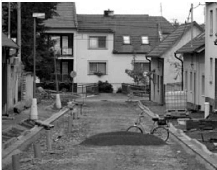
V Kosmově ulici zbývá dokončit jižní část komunikace.