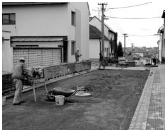
Před dokončením je rekonstrukce Metodějovy ulice na Novém Světě