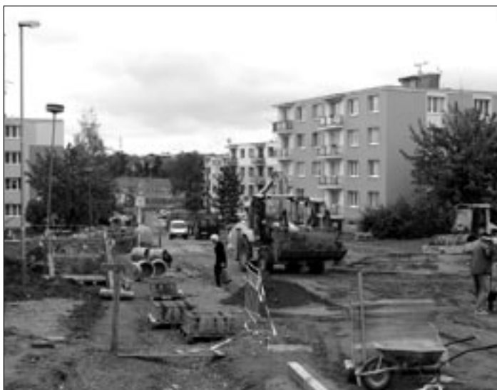
Na Kopánkách se již několik měsíců pracuje na celkové revitalizaci sídliště.