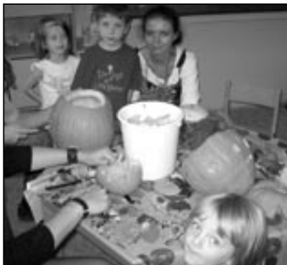
Mateřské škola se proměnila v místo, kde vznikaly z velkých i malých dýní originální strašidylka.