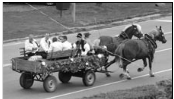
Přímo idylický záběr na Hradištskou ulici. Na silnici I. třídy není vidět žádné auto, pouze pár statných koní a šohaje v krojích s bečkou vína na voze.