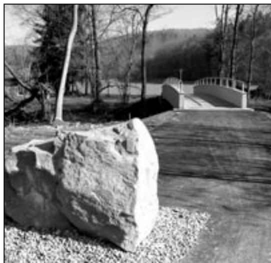
Mostek na cyklostezce Velehrad – Salaš.