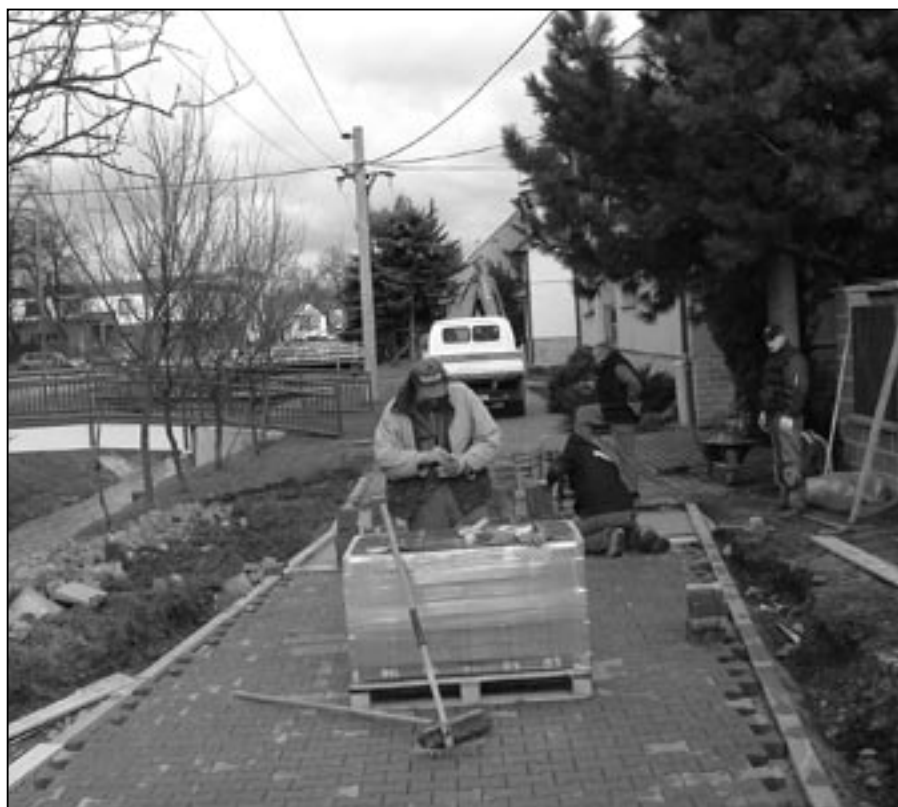
Stavba chodníku v Tyršově ulici byla dokončena v březnu.