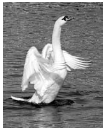
Labuť bílá nám zapózovala nedaleko lávky přes řeku Moravu.