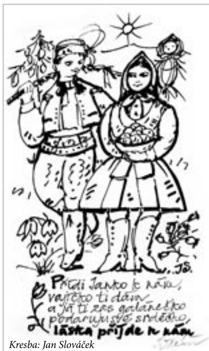
Kresba: Jan Slováček