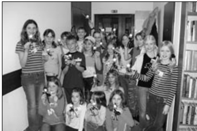
Dětem se v knihovně moc líbilo.