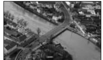
Silniční most přes Moravu spojuje nejen Staré Město, ale i městskou část Rybárny s Uherským Hradištěm.

Na území Srbska na nás čeká druhé překvapení. Nedaleko měst Smederevo a Kovin se vlévá do Dunaje řeka s názvem Velká Morava. Opět