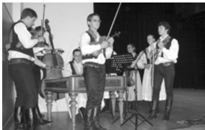
Cimbálová muzika Bálešáci doprovázela děti z Dolinečky.