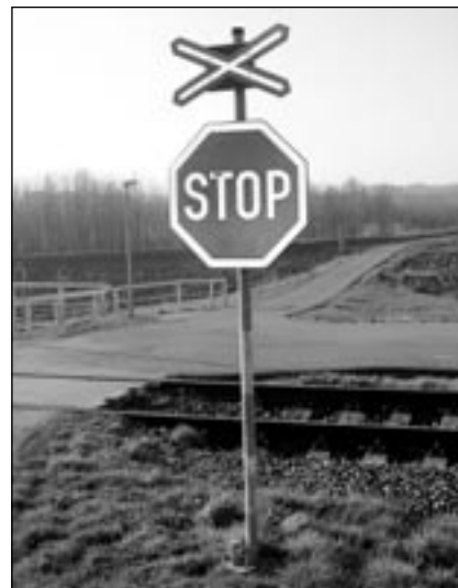
Přejezd ve Starém Městě, na kterém se stala nehoda 16. března 2009, je osazený výstražnými kříži se značkou STOP.

V obvodu SDC Zlín se nachází 355 přejezdů a z tohoto počtu je 169 přejezdů zabezpečených pouze výstražným křížem, 118 přejezdů je zabezpečeno světelným zařízením bez závor a 63 mají světla se závorami. Pouze pět přejezdů v celém Zlínském kraji je zabezpečeno mechanickými závorami a z tohoto počtu