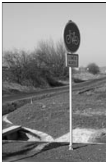
Cyklostezka ze Starého Města do Zlechova.