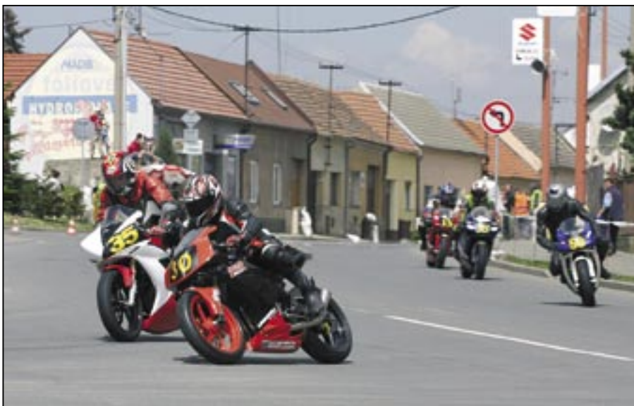
Průjezd jezdců zatáčkou ve směru z Hušťenovské do Velehradské ulice.

Příští číslo Staroměstských novin vyjde 28. května. Uzávěrka je 18. května 2009.