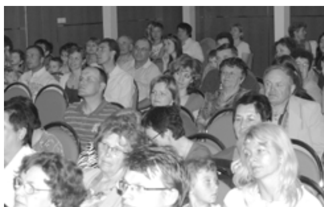
V divadelním sále a na balkonech sledovalo vystoupení více než 250 spokojených diváků.