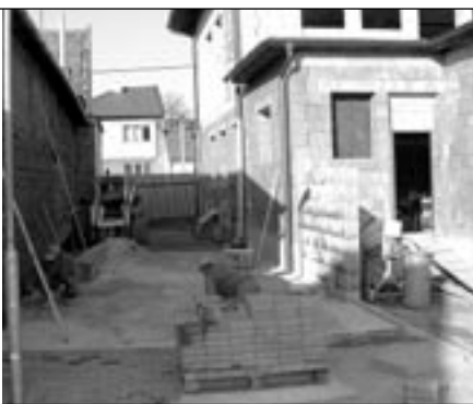
Chodník od Michalské po Velkomoravskou ulici je před dokončením.