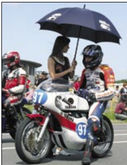
Dvě minuty před startem.

Motosport klub Uherské Hradiště ve spolupráci s městem Staré Město pořádá na okruhu ve Starém Městě ve dnech 9. - 10. května 2009 již VII. ročník Slovácké-