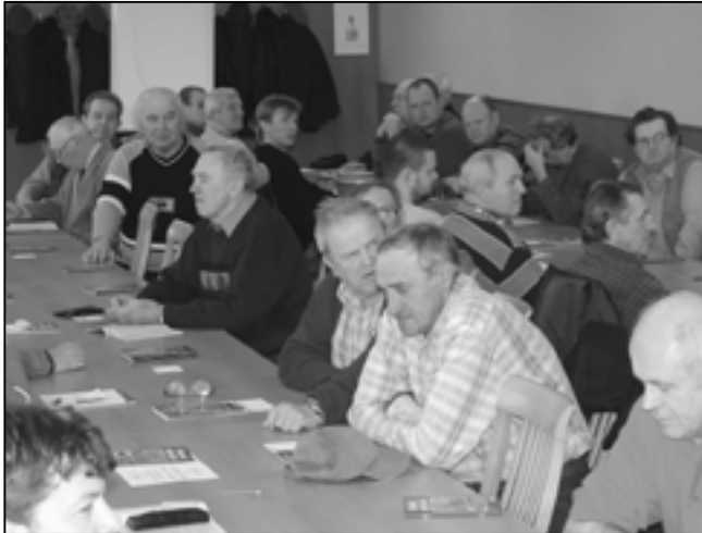
Staroměstští zahrádkáři se sešli na výroční schůzi.