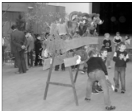
První den výstavy patřil dětem a studentům. Žáci základní školy obdivovali vystavené trofeje.