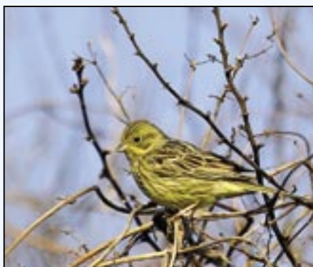
Strnad obecný patří mezi naše hojné ptáky.