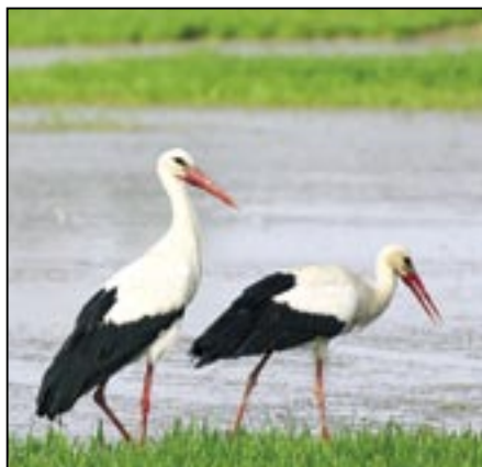
Krátce po přiletu druhého čápa na hnízdo v Klukově ulici se oba „dlouhonozí zobáči“ vydali na první průzkumný výlet za potravou. Zachytili jsme je 9. dubna 2009 krátce po 17 hodině na loukách ve směru na Huštěnovice.