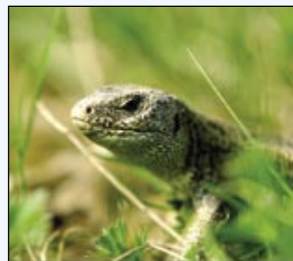
Ještěrka se asi právě probudila ze zimního spánku, protože byla celá od hlíny.