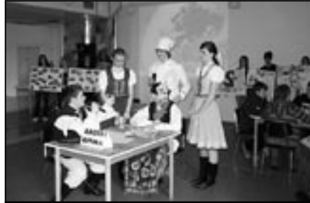
Při oborových dnech v úterý 17. března 2009 navštívili žáci základní školy také Slovensko.