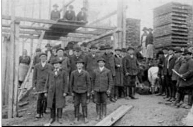
Stavba staroměstské radnice začala v listopadu 1907.

chodbě vytesána tato jména a funkce tehdejších obecních představitelů. Starosta Jan Němeček, 1. radní Tomáš Kafka, 2. radní Jan Černý, 3. rad-