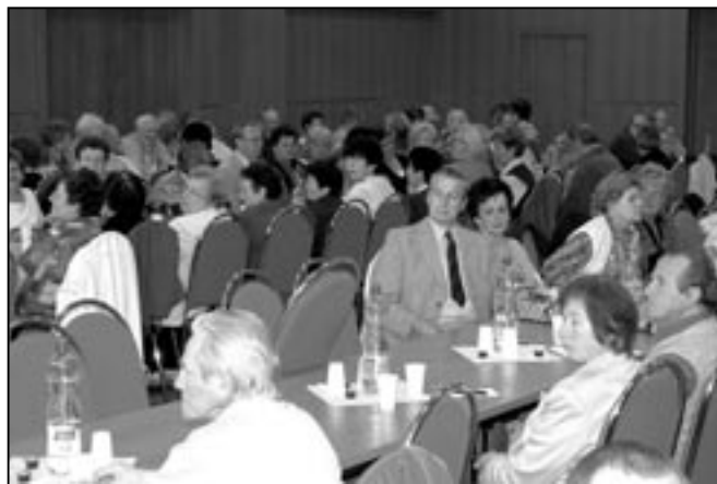
O výroční schůzi byl mezi členy obou organizací zdravotně postižených velký zájem. Po oficiální části jednání bylo podáno občerstvení, nechyběl hudební doprovod a losování tomboly.