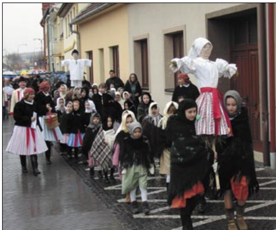
Průvod prochází přes náměstí Hrdinů, již hodně prší.