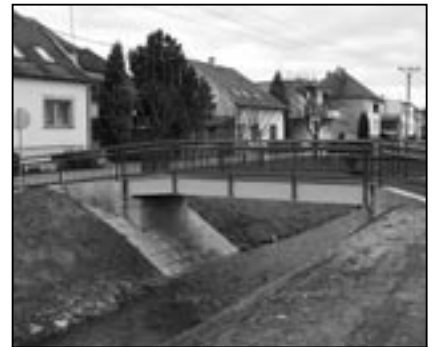
V Tyršově ulici stojí již několik měsíců nový most. Jestlipak víte, kolik je celkem mostků nad Salaškou v úseku mezi Brněnskou ulicí a železniční tratí?