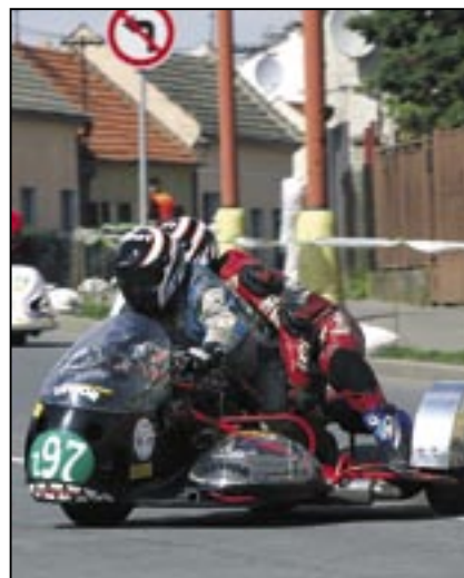
Pro diváky velmi atraktivní závod sidecarů.

V souvislosti s konáním motocyklových závodů ve Starém Městě budou ve dnech sobota