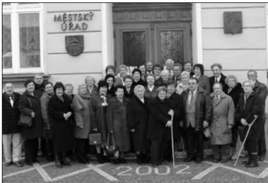
Společný snímek před budovou městského úřadu.