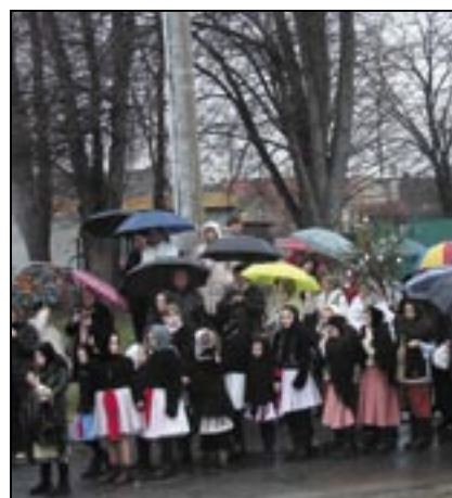
Děti a diváci v Tyršově ulici u Salašky.