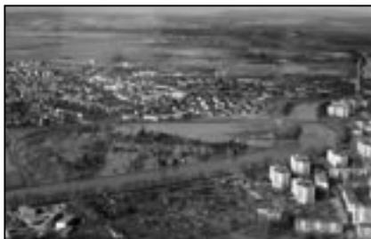
Řeka Morava naposledy vážně zahrozila na přelomu března a dubna 2006.

V Králickém Sněžníku leží uzlový bod rozvodnic tří moří (Severního, Baltského a Černého moře) a v tomto smyslu je možno označit