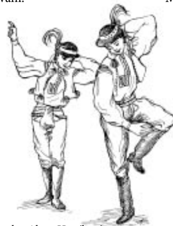
Kresba: Alena Hastíková