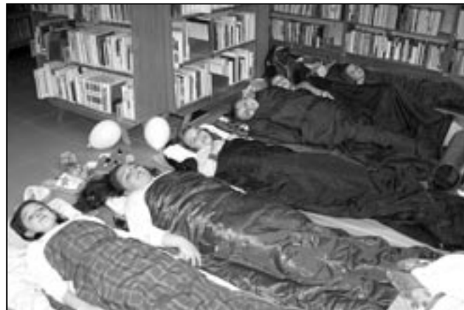
Po zajímavém programu jsme zalezli do spacáků a krásně jsme usnuli.