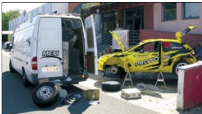
Celý tým Proton nocoval a připravoval své soutěžní speciály ve Starém Městě.