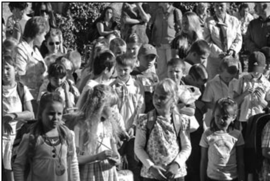
Děti na I. stupni ZŠ poslouchají proslov ředitele školy.