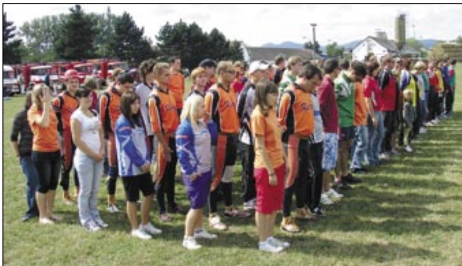
Nástup hasičských družstev na hřišti SOŠ a Gymnázia ve Starém Městě.

týmy z roku 2008 vešly do nejlepší pětky v následujícím pořadí: