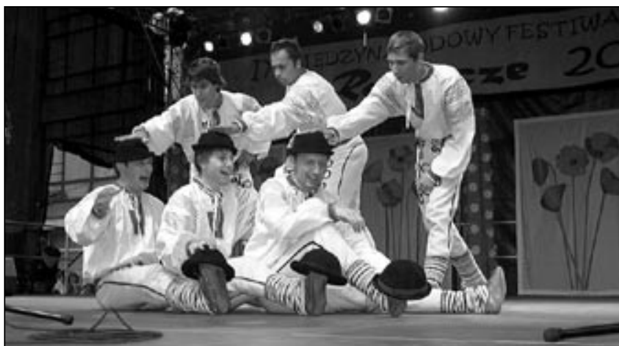
Šohající si zadováděli při Klobúkovém tanci.