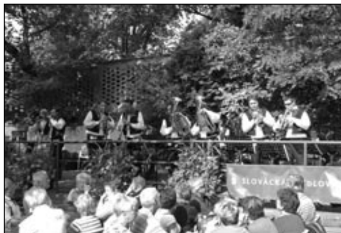
Staroměstská kapela uvedla Slováckou křídlovku v zahradě na Koruně.