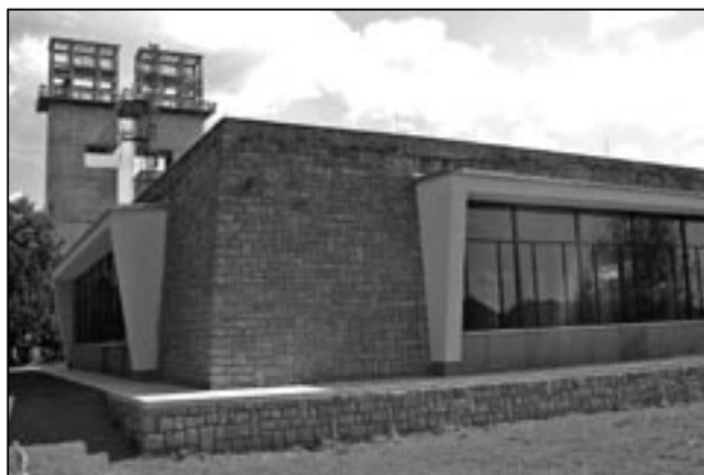
Již brzy bude dokončena rekonstrukce Památníku Velké Moravy. Na návštěvníky čeká zbrusu nová multimediální expozice. Snímek byl pořízen 18. srpna 2009.