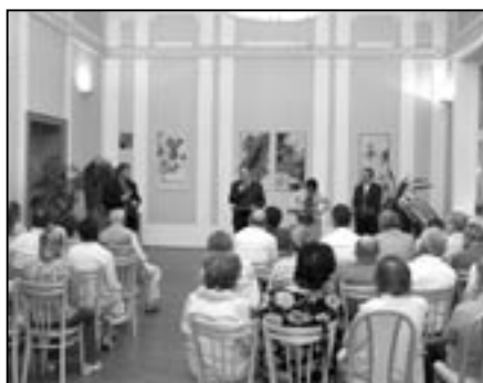
Zasedací sál na radnici se zaplnil občany Starého Města.