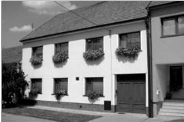
Děkujeme všem spoluobčanům, kteří se vzorně starají o výzdobu svých domů a bytů. Na ilustračním snímku rodinný dům ve Svatovítské ulici. Rádi otiskneme i fotografii vašeho pěkně upraveného obydlí.

1.5 pronájem části pozemku p. č. 240/355 ost. pl. o výměře 14 m 2 v lokalitě ul.