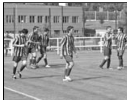
Přejme fotbalistům TJ Jiskra, aby se co nejvíce radovali po vsířelených gólech. V utkání s Babicemi jásalí hned čtyřikrát.