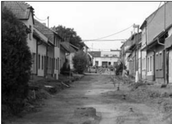
V současnosti probíhá rekonstrukce Kosmovy ulice, kde bude zhotovena nová komunikace a chodníky. Snímek je z 12. září 2009.