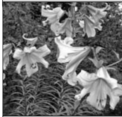
Věrám patří i naše květina lilie královská, která má květ skoro stejný, jako obrácené písmeno „V“.