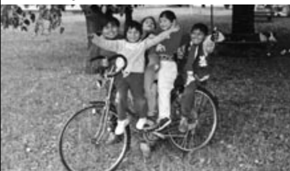
To je moje kolo!