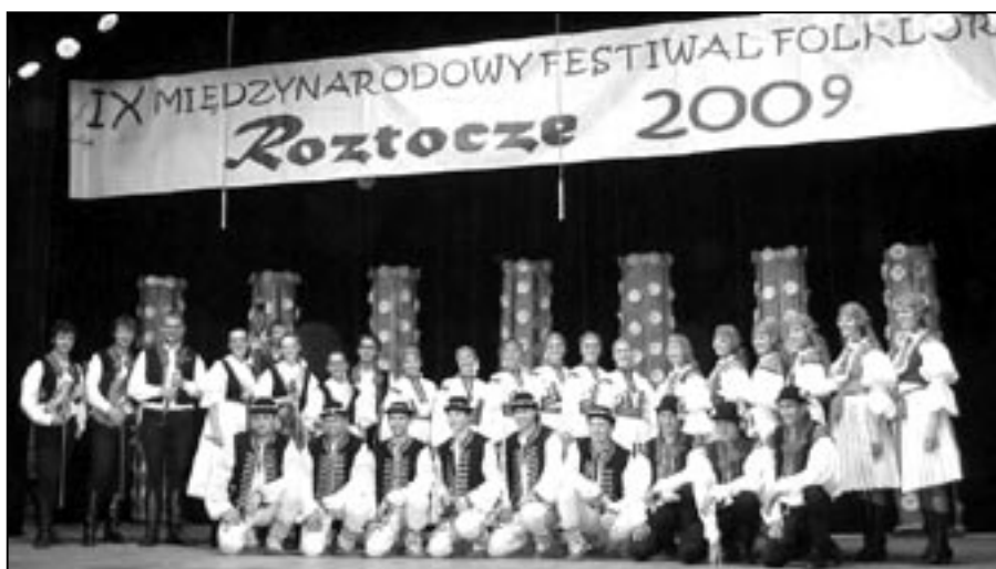
Dolina opět vzorně reprezentovala Staré Město na festivalu v zahraničí.