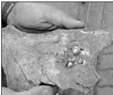
Originální podložka z paroží losa, která sloužila ke zhotovení zlatých gombíků a velkomoravských náušnic.

Množství úlomků keramických předmětů i části keramické pece byly objeveny na přelomu srpna a září 2009 při archeologickém průzkumu na ploše budoucího náměstí Velké Moravy ve Starém Městě v blízkosti stavby kostela sv. Ducha. Při důkladném rozboru na odborném pracovišti v Brně bylo zjištěno, že úlomky velkomoravské pece a další nálezy z dílen zlatníků, šperkařů a kovoliticů obsahují mikroskopické stopy částí zlata, stříbra a mědi. Taktéž byla objevena podložka z paroží losa, která sloužila k tepání zlatých plátek a k následnému zhotovení krásných velkomoravských gombíků a náušnic. Bylo tak odborně posouzeno, že dříve objevené zlaté předměty k nám nebyly dovezeny kupci z byzantského území, ale velká část byla přímo vyrobena zručnými řemeslníky ve