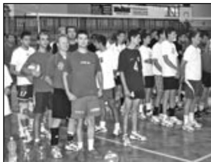
Nástup osmi volejbalových týmů v Městské sportovní hale na Širůchu.