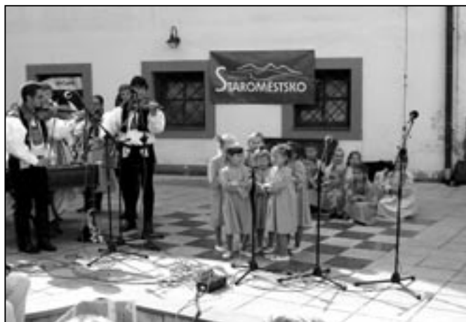
Děvčátka z Dolinečky při vystoupení na nádvoří Staré radnice. Doprovází cimbálová muzika Bálašáci.