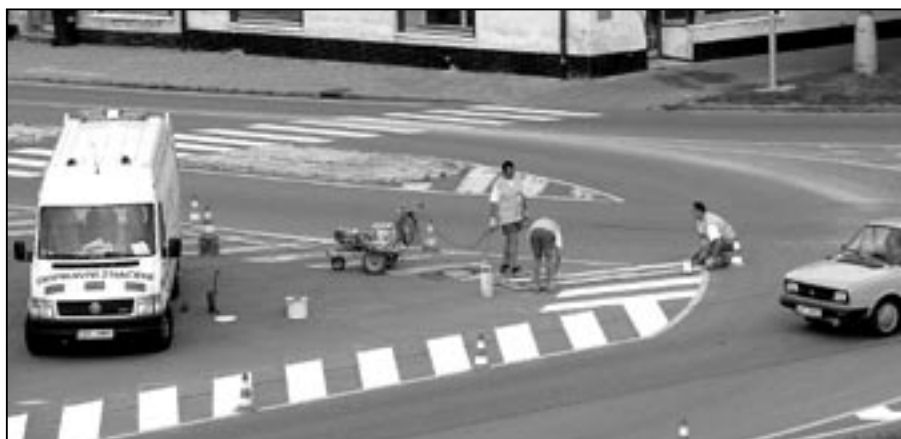
V druhé polovině srpna bylo obnoveno dopravní značení na křižovatce u radnice.