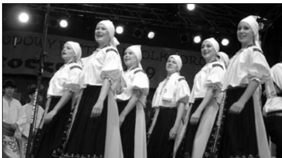
Děvčice z Doliny se velmi líbily polským divákům. Krásné mačky (kočky).