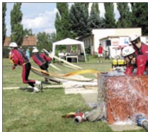
Sympatický „B“ tým z Velkého Ořechova vybojoval druhé místo.