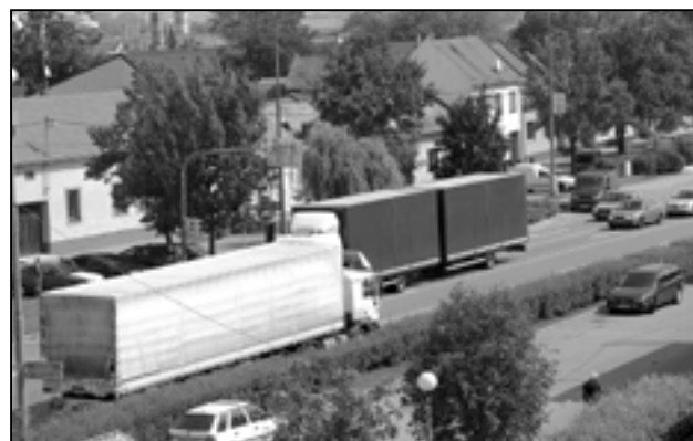
Silnice první třídy I/55 prochází středem Starého Města a je zde velký pohyb motorových vozidel.