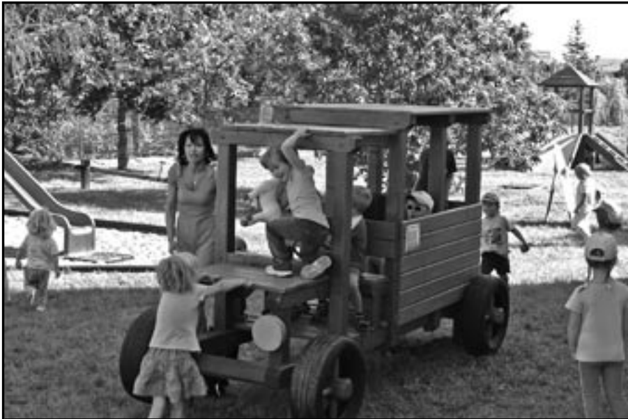
Děti z MŠ v Rastislavově ulici si hrají v zbrusu novém autobusu.