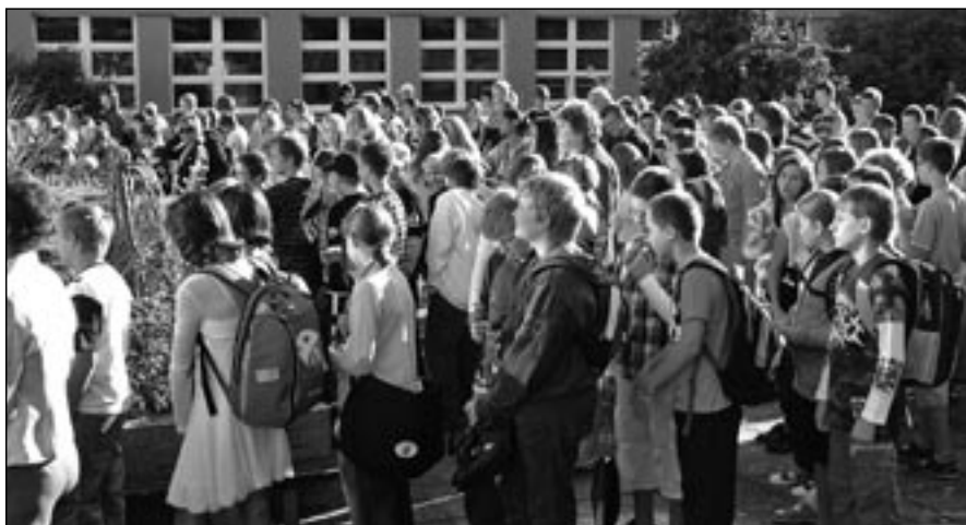
Chlapci a dívky při zahájení školního roku na II. stupni v Komenského ulici.