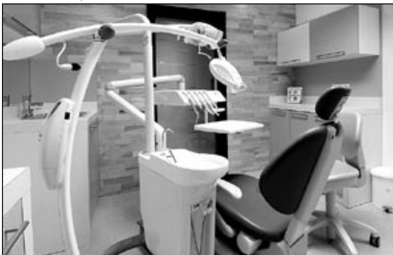
Do zubařského křesla, i když je nadmíru pohodlné, se nikomu z nás nechce. Aby návštěvy u stomatologa probíhaly bez strachu a komplikací, je nutno svého lékaře navštěvovat pravidelně a předcházet náročným a mnohdy zbytečným zákrokům.

rou propojenou s počítačem, kdy počítač na zvětšeném modelu vašich zubů během několika málo vteřin vymodeluje novou korunku nebo inlejí a to s přesností několika mikronů. Tu Vám doktor v ústech zafixuje a hotovo!