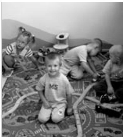
První školní den v mateřské škole v Komenského ulici.

Patříme mezi největší základní školy Uherskohradištska. Jedna třída v ročníku je na II. stupni zaměřena na rozšířenou výuku matematiky a informatiky. Žáci mají k dispozici tři počítačové učebny, tři jazykové učebny, odborné učebny fyziky, chemie, přírodopisu, výtvarné výchovy, kuchyňku, knihovnu, dílny, keramickou