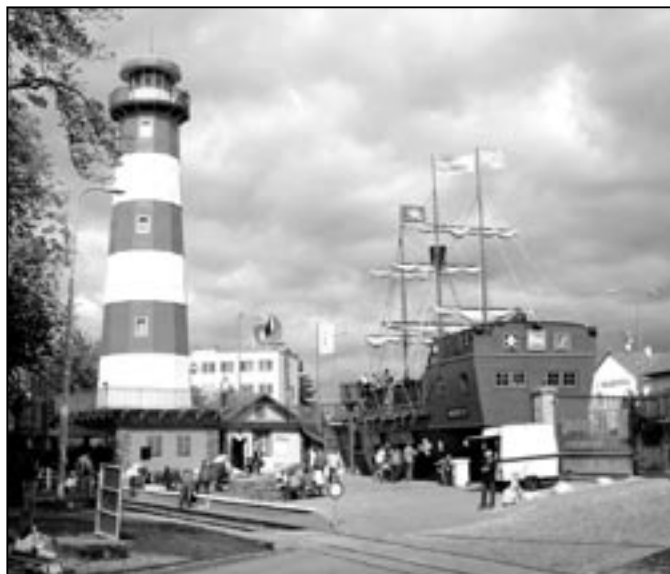
Maják Šrotík je vysoký 27 metrů a váží 15 tun. Vyhlídkový ochoz, na který vede 96 schodů, je ve výšce 23 metrů. Loď Naděje je 20 metrů dlouhá a zdobí ji tři stěžně s plachtami.