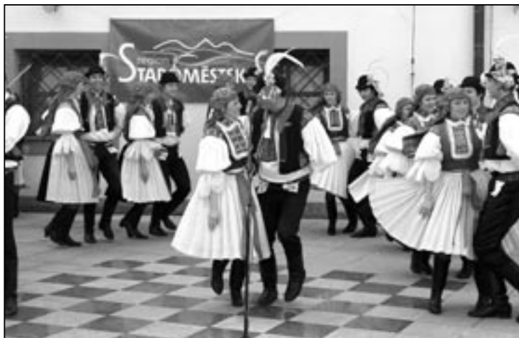
Roztancená Dolina se těšila velkému zájmu diváků.

Staroměšťané patřili mezi nejlepší účinkující