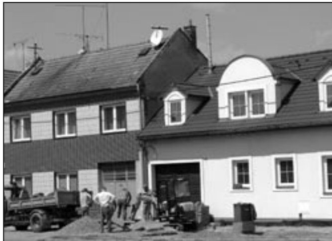
Pokládka zámkové dlažby na chodníku v Hradištské ulici. Další ulice v centru Starého Města prošla modernizací.