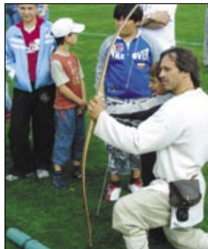
Děti se naučí střilet lukem.