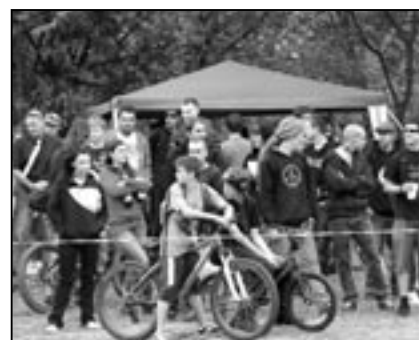
Diváci krátce po zahájení akce.