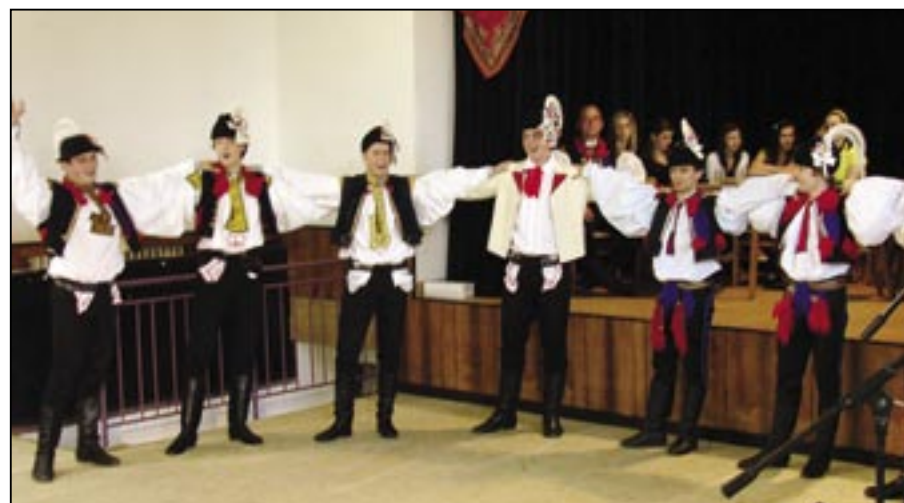
Verbíři při zahřívacím kole.