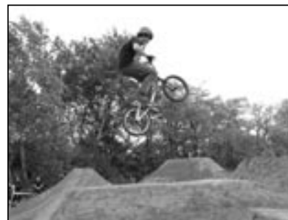
Každou minutu bylo vidět několik takových parádiček.