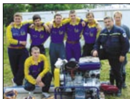
Sbor dobrovolných hasičů předvede ukázkou požárního útoku a vystaví techniku.