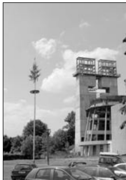
Pěkná a vysoká májka byla i letos postavena na prostranství v blízkosti kostela sv. Ducha.