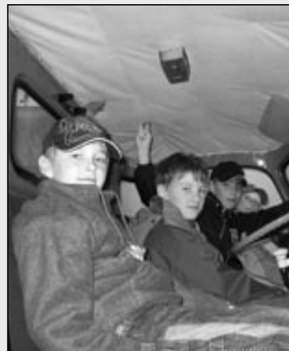
Děti si prohlédly automobilovou techniku.