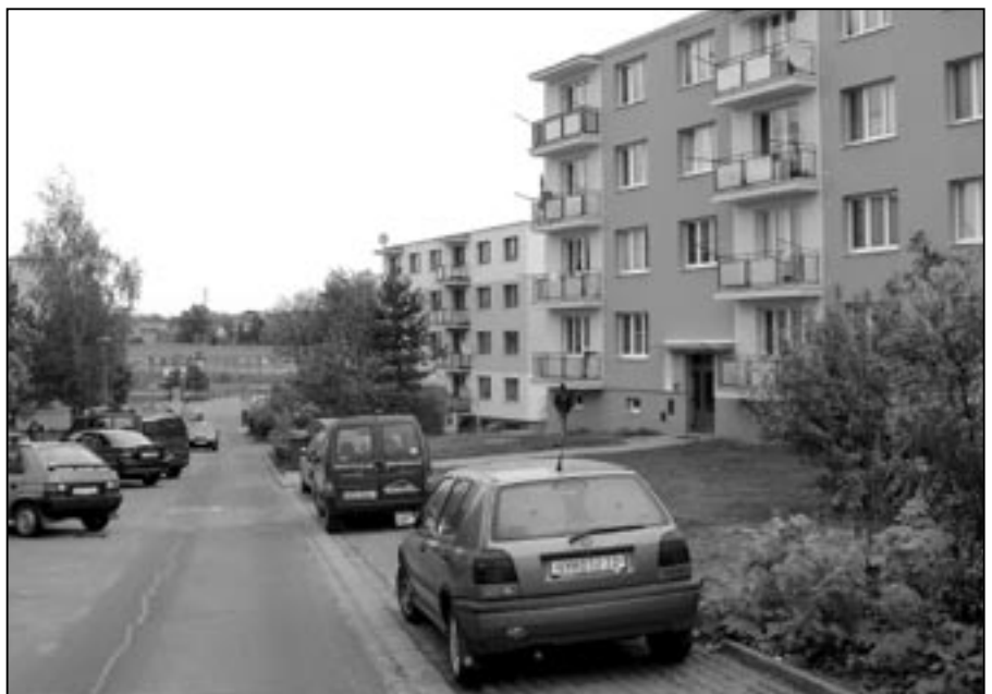
Sídlště Kopánky prochází náročnou rekonstrukcí. Postupně budou rozšířeny komunikace ze 3,5 na 5 metrů, přibudou nové chodníky a plochy na odpadkové kontejnery, počet parkovacích míst se zvýší ze 110 na 190. Za vykácené stromy bude vysazena nová zeleň. Jedná se investici ve výši 36 milionů korun, město zaplatí částku 5,5 milionu, 30,5 milionu získalo Staré Město z evropských fondů. Činí se také majitelé bytových domů. Bytovky postupně získávají nové, barevné fasády a nezbytné zateplení.

Věcné břemeno se zřizuje za úplatu, a to formou jednorázové úhrady, která bude vypočtena soudním znalcem ve znaleckém posudku dle platných cenových předpisů ve smyslu § 18 zákona 151/97 Sb. ve znění pozdějších novel, a to výnosovou metodou, jako pětinašobek ročního užítku, dle cenového výměru MF pro stanovení regulovaných cen. Nelze-li věcné břemeno ocenit výnosovým způsobem, bude činit jednorázová splátka částku 10.000,- Kč + příslušná DPH.