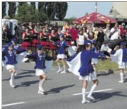
Mažoretky Rolničky z Ostrožské Lhoty při slavnostním zahájení.

Slavnostní zahájení se konalo v neděli 10. května 2009 v 9:30 hod. u výjezdu z depa na Velehradské ulici. Milým zpestřením bylo vystoupení mažoretkové skupiny Rolničky z Ostrožské Lhoty. Příznivce rychlých strojů přivítal sta-