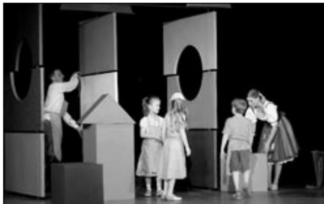
Na prknech, která znamenají svět, si zahrály i děti ze sálu.