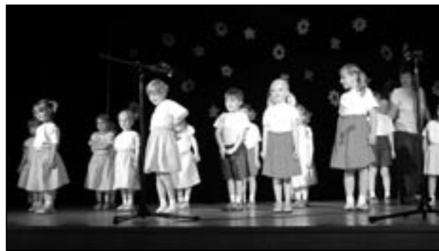
Děti z Křesťanské mateřské školy ve Starém Městě při vystoupení ke Dni matek.