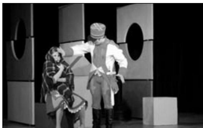
Momentka z pohádky.