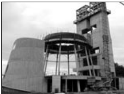
Stavba kostela sv. Ducha koncem dubna 2009.

Kdo to byl Pavel? V Jeruzalémském chrámu před rozvášněným davem, který prahнул po jeho smrti, se sám představuje těmito slovy: „Jsem Žid. Narodil jsem se v Tarsu v Kilíkii, ale vyrostl jsem tady v tom městě a přesně jsem byl vychován, jak to žádá otcovský zákon, ve škole Ga-