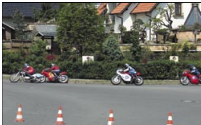
Závod Klasik do 350 ccm. Jezdci projíždí křižovatku ulic Huštěnovská a Velehradská.