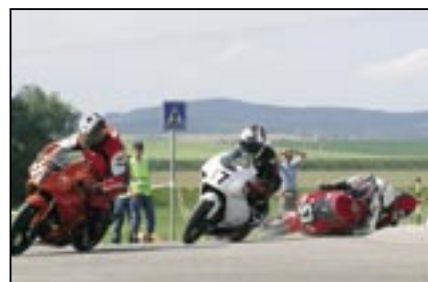
Nakonec to dobře dopadlo.....