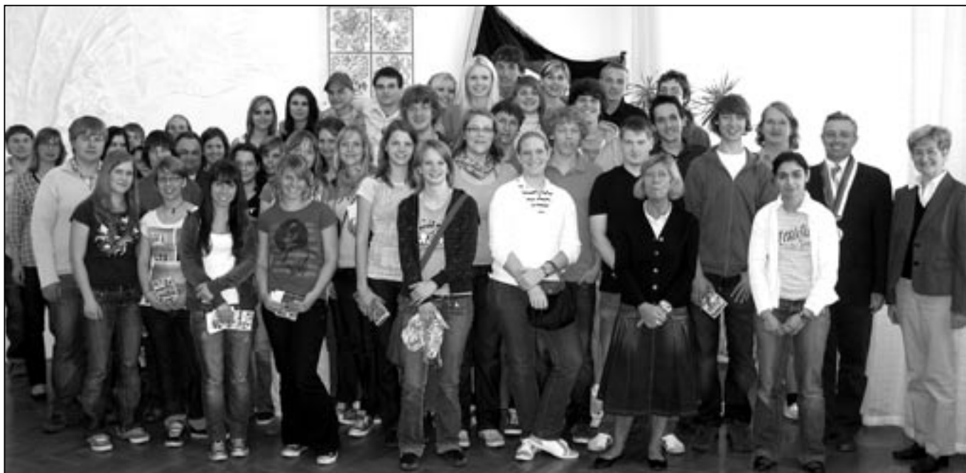
Společný snímek na památku zajímavého setkání.