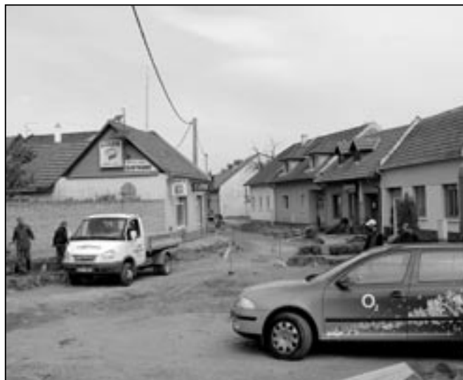
Čilý pracovní ruch panoval také v Obilní čtvrti, kde probíhala rekonstrukce místní komunikace a chodníku.