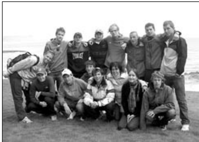
Chlapci a dívky na útesu u pobřeží.