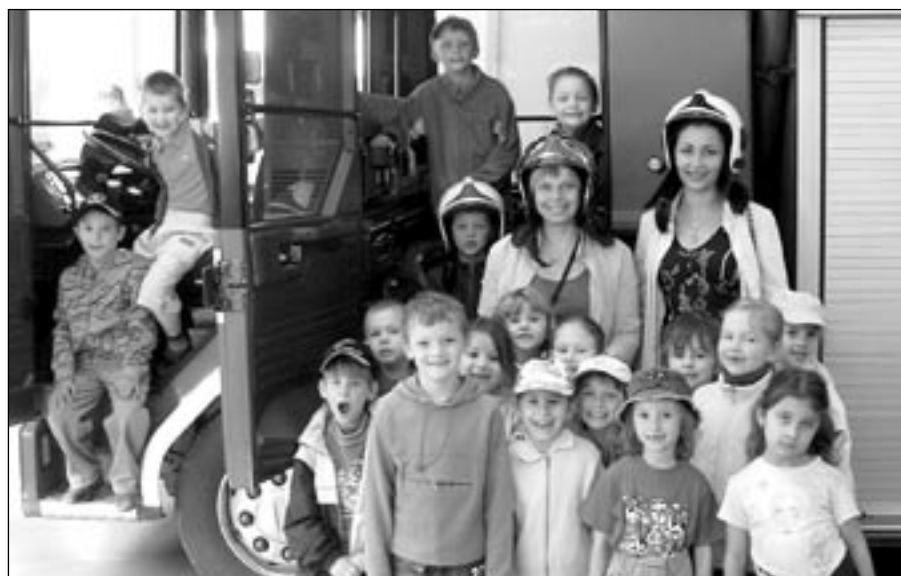
Děti z mateřské školy v Rastislavově ulici si prohlédly hasičskou zbrojnici.

V příštím čísle další články ze života školky.