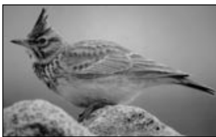
Chocholouš obecný na fotografii Ing. Květoslava Fryštáka.