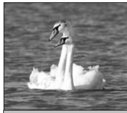
Věrně spolu.

Džentlmen našich dnů je ten, kdo má dost peněz k činnosti, které by provozoval každý hlupák, kdyby si to mohl dovolit. To je konzumuje, aniž cokoliv vyrábí.