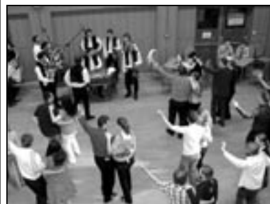
V sobotu 25. dubna jsme si zatancovali s Haraficou.