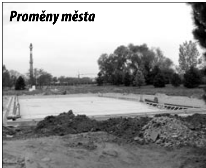
Snímek je z areálu koupaliště na Širůchu, kde se v minulých týdnech uskutečnila modernizace technologie koupaliště a úprava venkovních ploch kolem bazenu.