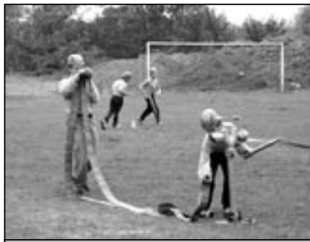
Disciplína s názvem Štafeta požárních dvojic.