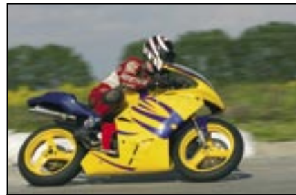
Hádanka pro naše čtenáře. Poznáte jezdce na snímku? Ano, je to Radek Koňářik.