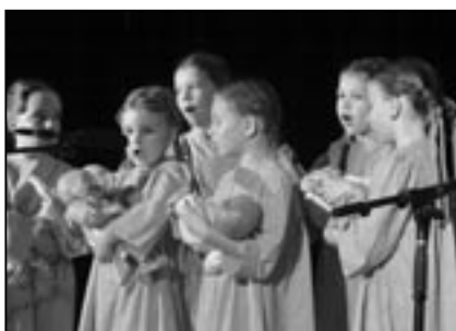
Děvčata z Dolinečky I.