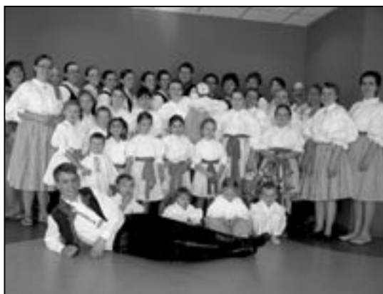
Děti a mladí ze Starého Města rozehráli publikum dříve narozených v Otrokovicích.

Společné vystoupení Dolinečky II, Klubíčka (kroužek lidových tanců a písní pro maminky s dětmi při SVČ Klubko) a dívčího sborku, za doprovodu cimbálové muziky Bálašáci se uskutečnilo v domově důchodců Senior C v Otrokovicích. Bylo to velmi příjemné odpoledne nejen pro dříve narozené diváky, ale i pro nás, kteří jsme vystupovali. Za společné úsilí všem pořadatelům, účinkujícím a v neposlední řadě maminkám a babičkám za nažehlené kroje velmi děkujeme.