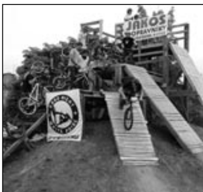
Jeden z prvních bikerů se vydává do „skákačičího“ prostoru.

chalem Vlachynským z Uherského Hradiště - Mařatic jsem hovořil krátce po zahájení, kdy se v areálu pohybovalo více než 150 mladých lidí, většinou na speciálních bicyklech. Michal si pochvaloval vstřícnost Městského úřadu ve Starém Městě a zvláště ochotu místostarosty Radoslava Maliny, který s mladými našel od prvních okamžiků společnou řeč. Obyvatelé nejbližších ulic sice hned zpočátku sepsali petici, ve které vyjádřili nesouhlas s provozováním sportoviště, kde se bude sjíždět větší množství vyznavačů jednoho z největších bikeparků v České republice, ale nakonec mladí dali záruky, že provoz bude bezproblémový. Uvidíme, jak se jim to podaří.