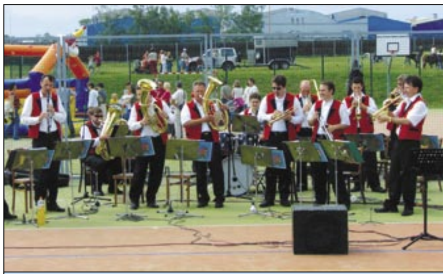
K poslechu zahraje Staroměstská kapela.