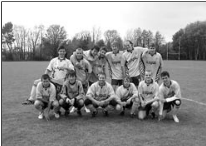
Fotbalový tým sehrál zápasy proti studentům středních škol a sportovním klubům v Bridgwateru, Tauntonu a nejbližším okolí..