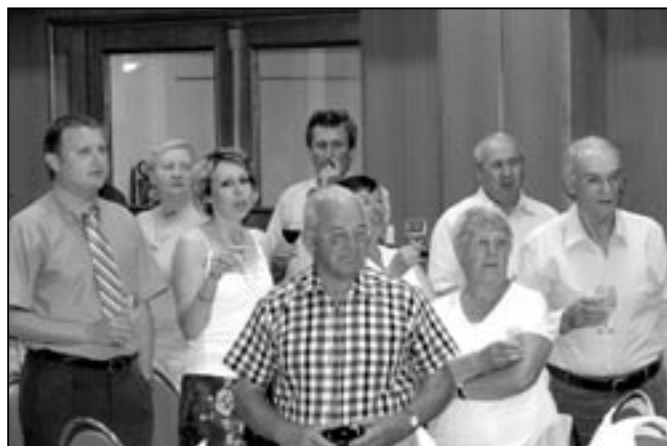
Společný přípitek s francouzskými přáteli.