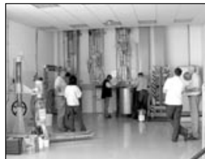
Snímek z výroby barev.