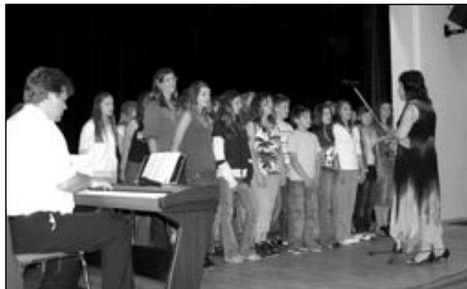
Příležitostný pěvecký sbor základní školy zazpíval devátákům při jejich slavnostním vyřazení.