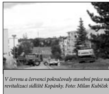
V červnu a červenci pokračovaly stavební práce na revitalizaci sídliště Kopánky.

8.1 o zastavení pořizování změny č. 3 územního plánu města Staré Město z důvodu předpokládaného zahájení pořízení nového územního plánu města v roce 2010.