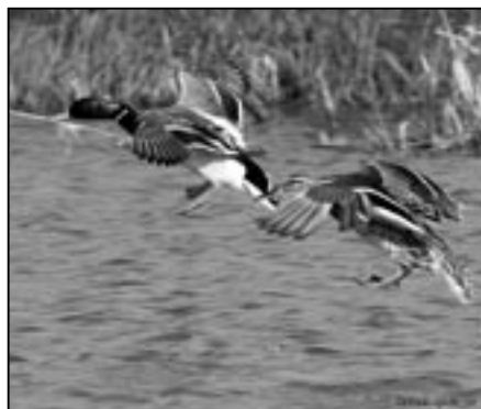
Kachna divoká je častým hostem na řece Moravě a místních rybnících. Pestrý svatební šat získává kačer až na podzim. O mláďata se stará pouze samice, kterou samec obvykle opustí ještě dříve, než se mláďata vylíhnou.

Když si přivstanete a budete pozorovat své okolí dříve, než se ráno probudí k životu hluk města, nebo posadíte-li se na chvíli do trávy stranou od hlučných silnic, uvidíte své okolí ve zcela jiném světle. V současné době, kdy civilizací unavení a stresovaní lidé neustále vymýšlejí nové sporty a pohybové aktivity a hledají další způsoby trávení volného času, není výšlap do přírody žádnou romantickou a přežitou kratochvílí, ale naopak nanejvýš aktuální výzvou, jejíž kouzlu podléhá v poslední době stále více lidí bez rozdílu věku. Na světě žije asi 10.000 druhů ptáků a zhruba 2.000 z nich je více či méně ohroženo a jejich budoucnost je nejistá. V České republice žije asi 400 druhů a více než polovina zde i hnízdí.