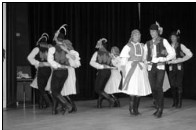
Soubor Dolina opět sklídl ohromný obdiv.