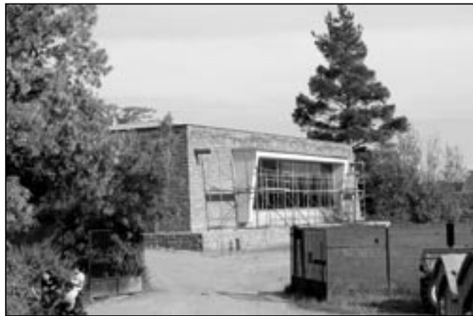
Zadní část Památníku Velké Moravy v průběhu rekonstrukce v červnu.