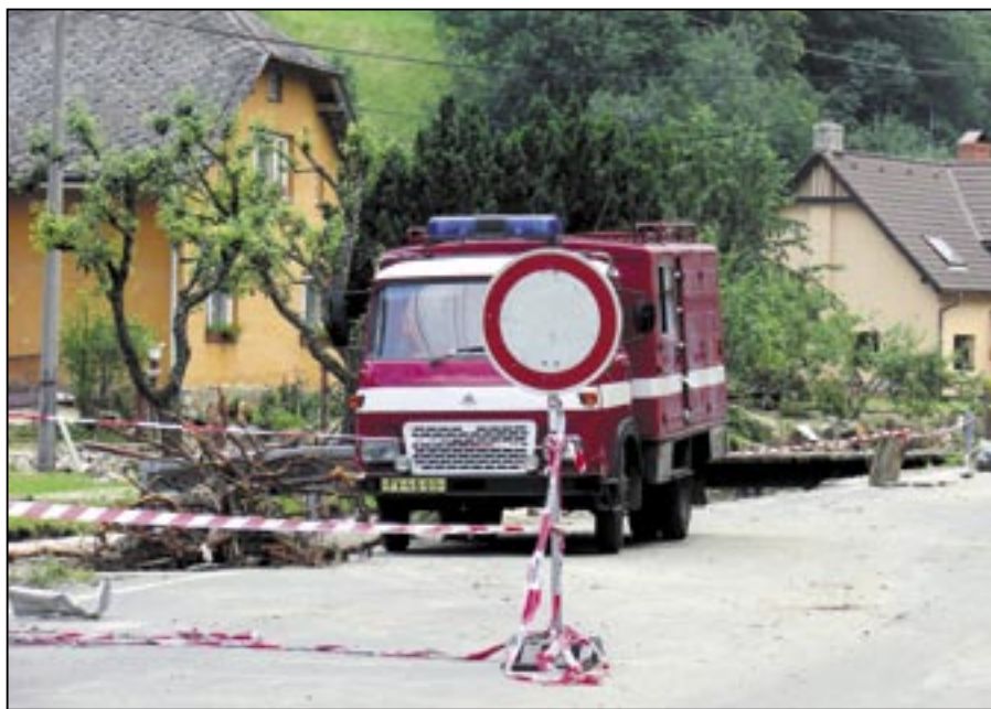
Silnice je uzavřena, do těchto míst se nyní nejezdí. Můžeme zde spatřit pouze vojáky, hasiče a nešťastníky s velkými depresemi po povodni. Pomoc k nim však přichází z více míst, nejen ze Starého Města. A to je dobře.

Bylo naší povinností tuto nezištnou pomoc alespoň v určitém množství vrátit. Poprvé se tak stalo po povodni v srpnu 2002, kdy velká voda poničila mnoho měst a obcí v Čechách. Staroměstšané tehdy oplatili pomoc zaplavené obci Dolní Beřkovice, které jsme poskytli finanční dar ve výši 500 tisíc korun. Dolní Beřkovice leží v těsném sousedství Labe, které ukázalo svou sílu a voda se zde převalila až do výše čtyř metrů. Labe však nebylo jediným živlem, který způsobil velké škody. Zdej-