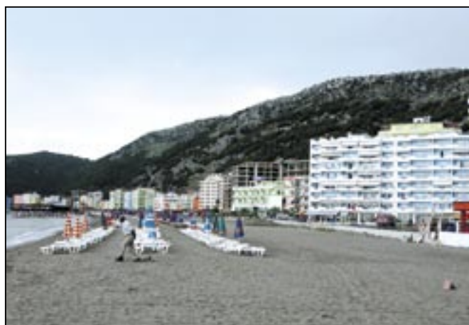
Prímořské letovisko Shëngjin s písčnou pláží a spoustou nových hotelů.