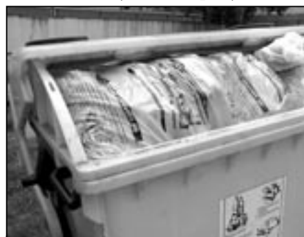
Kontejner na plastový odpad v Komenského ulici dne 17. června 2009.

presný rozpis obdržíte na radnici nebo jej najdete na www.staremesto.uh.cz v sekci městský úřad, odpady. IAP