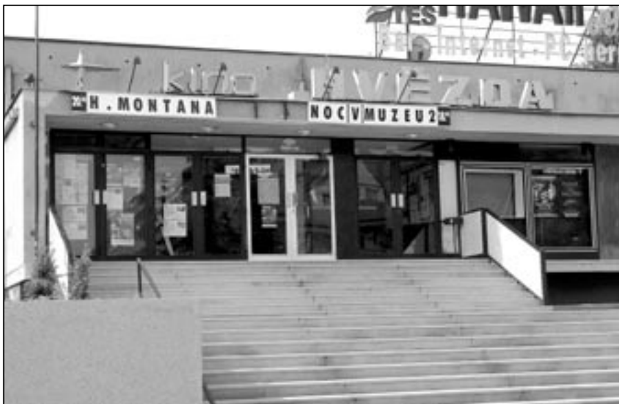
Kino Hvězda, kde se bude odehrávat část akcí Letní filmové školy 2009.

ka: Francouzské neobaroko a další), které budou doplněny množstvím koncertů, divadelních představení, přednášek a workshopů.