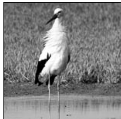
Čáp při lovu na staroměstských loukách.