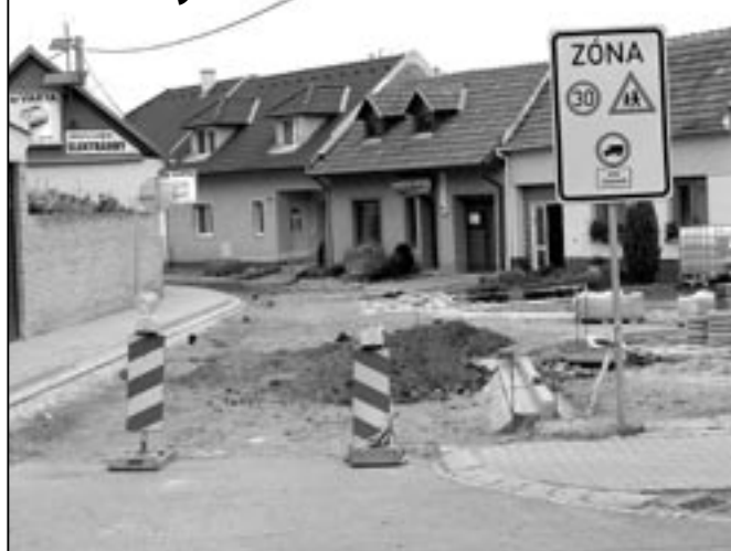
Stavební práce v Obilní čtvrti dne 28. května 2009.