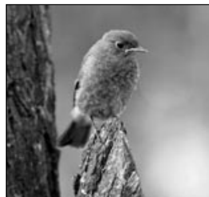
Rehek domácí - komínček je sympatický malinký ptáček. Můžeme jej často spatřit i ve Starém Městě.