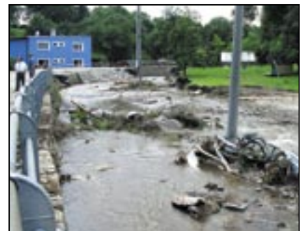
Modrý dům na snímku byl nedávno kompletně rekonstruován. Zdánlivě mu nic nechybí, jeho zadní část je však zavalena hromadou sesuté hlíny a kamení z blízkého svahu. I pět dní po přívalu vod je z potůčku malá řeka.