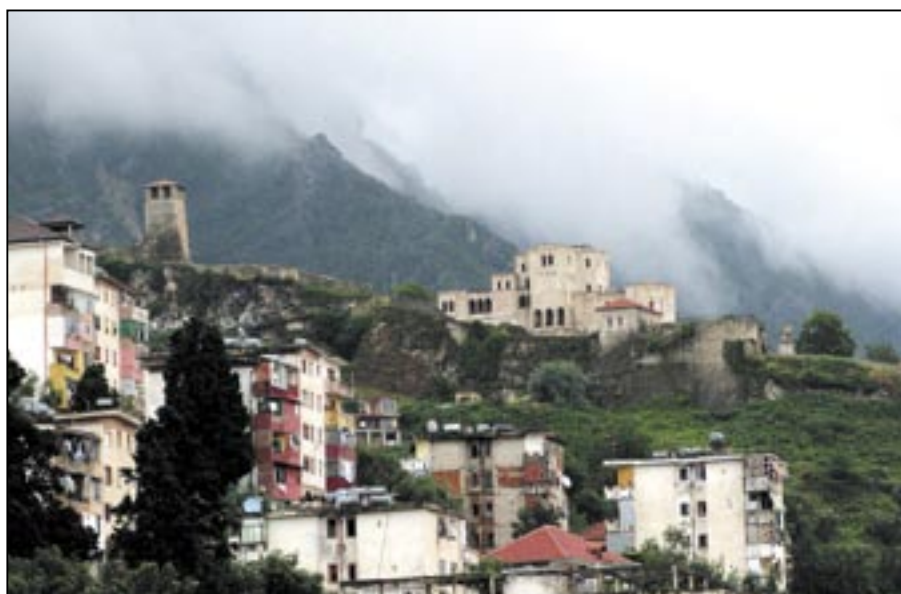
Město Krujë se Skanderbegovou pevností. Odtud čelil albánský národní hrdina Skanderbeg s malou armádou tureckým nájezdům do Evropy v 15. století více než 20 let.