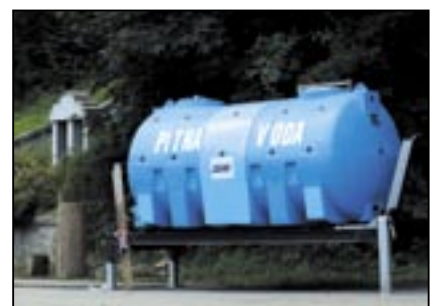
Studny jsou zaplaveny, byla přivezena pitná voda v cisternách.