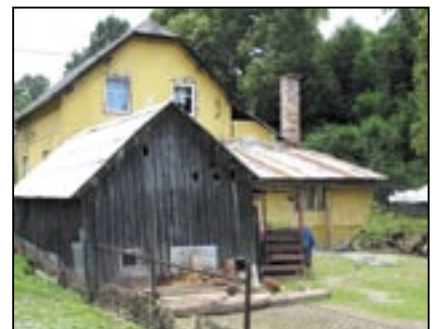
Dům u cesty vypadá na první pohled neporušen. Vpravo však velká voda sebrala jeho část a napáchala velké škody v celém objektu.