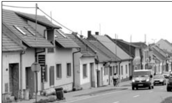
Brněnská ulice s řadou malých a přizemních domků. Pomalu se i tato ulice u hlavní komunikace I/50 modernizuje, proměňuje k lepšímu a jsou stavěny vícepodlažní objekty.