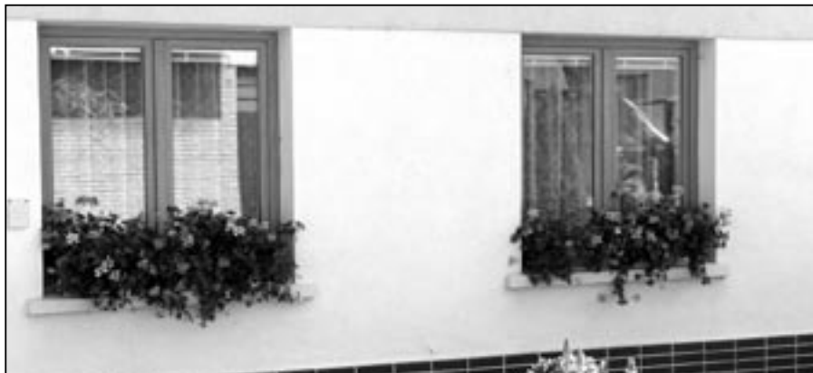
Jistě si vzpomínáte na naše první cesty do vyspělých evropských zemí po roce 1989. Často jsme obdivovali květinové výzdoby v oknech domů v Rakousku, Německu i jiných zemích. Dnes můžeme pochválit mnoho Staroměstšanů, že se vzorně starají o květinový úhled kolem svých obydlí. Na snímku květinový dům v Obilní čtvrti. Text + foto: Milan Kubíček