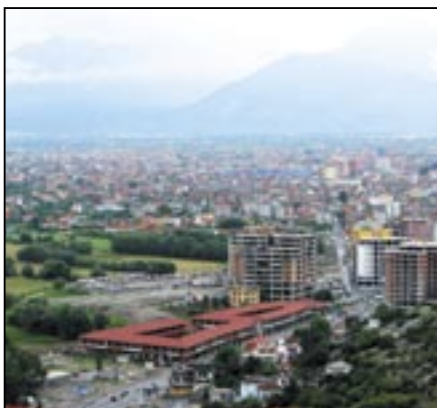
Město Shkodër na břehu Skadarského jezera má 70.000 obyvatel, je třetím největším městem Albánie a jeho symbolem je pevnost Rozafa, která se tyčí na kopci na jižním okraji města.

Turistika v Albánii (v překladu Země orlů) se rychle rozvíjí. Klima je příjemné, albánské pobřeží Jaderského a Iónského moře má délku 420 km. Mezi nejvýznamnější turistická střediska patří okolí Drače (Jadran) a riviéra mezi Vlorou a Sarandou (Iónské moře). Staví se nové ubytovací kapacity. Život v „Zemi orlů“ vám přiblížíme ve foto-reportáži Vladimíra Kučery. MK