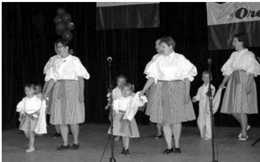
Vystoupení maminek s dětmi z Rodinného centra Čtyřlístek.

Akce proběhla ve dnech 20. – 21. června 2009 v celém areálu Orlovny. Veřejnost si mohla vybrat ze široké nabídky aktivit, ať již v sobotu, která byla věnována sportu, tak i v neděli, jenž se nesla v kulturním duchu.