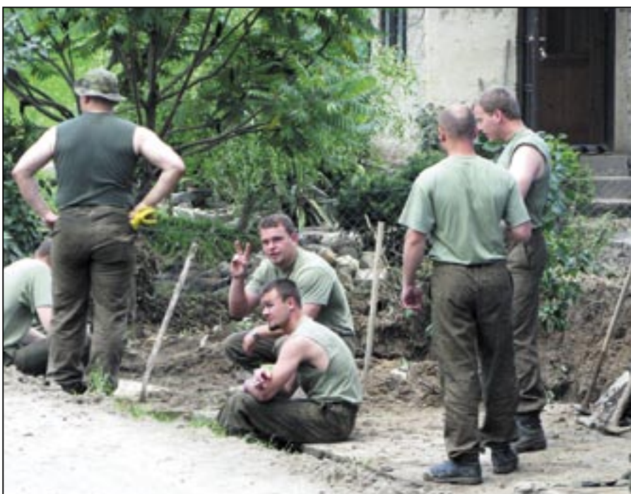
Vojáci pracovali nepřetržitě a vykonali velký kus práce. My jsme je zachytili ve chvíli, kdy jim velitel přiděluje úkoly na odpolední směnu.