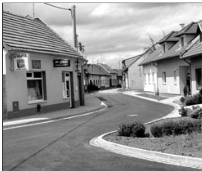
Takto vypadala stejná ulice dne 16. června 2009 po položení živичného povrchu.