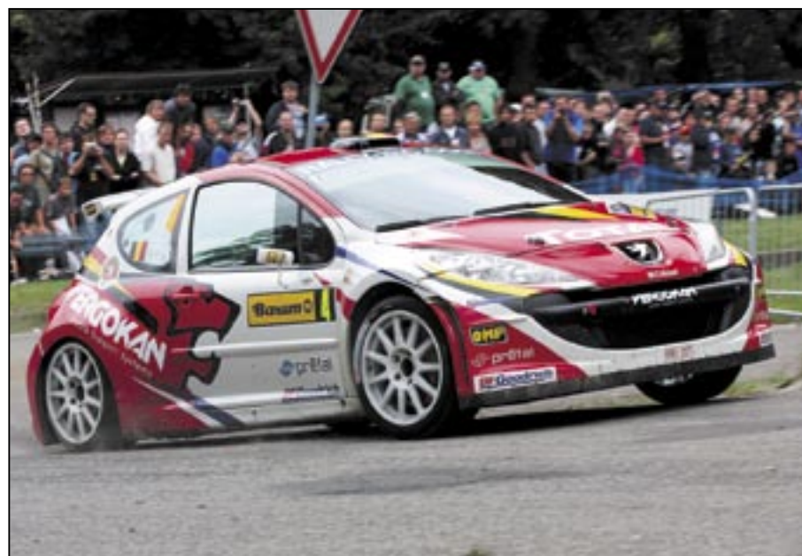
.....a s Peugeotem 207 S2000 v plném tempu na trati v Pohořelících.