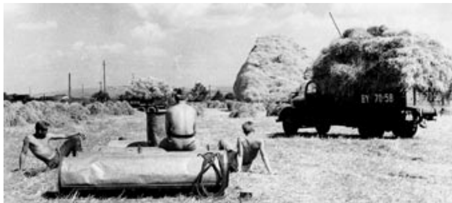
Snímek z padesátých let minulého století. Vojáci vypomáhají při žních ve Starém Městě.