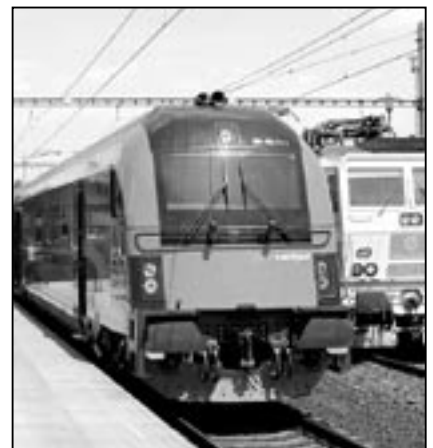
Souprava vlaku RailJet na výstavě železniční techniky v Ostravě.