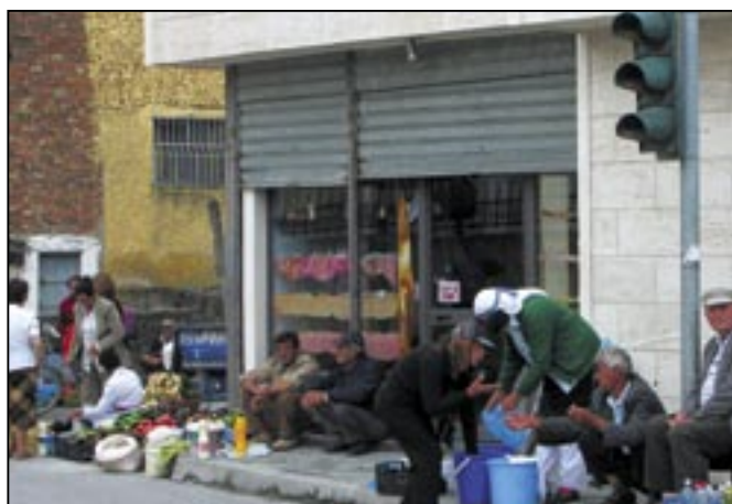
Pouliční prodej funguje ve Shkodëru na každém rohu.