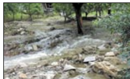
Zdevastované koryto místního potoka.

Také tentokrát jsme nezůstali lhostejní k neštěstí jiných. Na zasedání Zastupi-