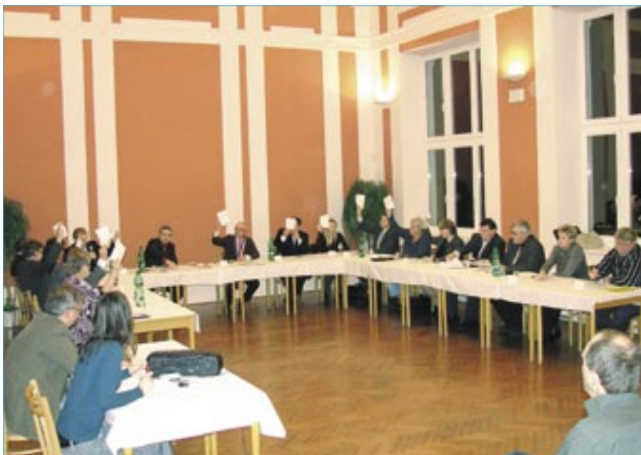
Nově zvolené Zastupitelstvo města Staré Město se sešlo 8. listopadu 2010 v 18 hodin na prvním zasedání.