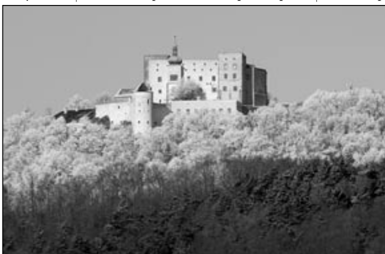
Hrad Buchlov po první sněhové nadílce. Více informací o nejznámějším hradu v okolí Starého Města najdete na www.hrad-buchlov.cz

V něm odborníci z oblasti cestovního ruchu vybrali v každém ze 17 turistických regionů deset aktivit, které nominovali do druhého kola. Celkem tak do veřejného hlasování postoupilo 170 turistických nabídek. Z nich pak mohla veřejnost od 1. července do 31. srpna 2010 vybírat tu nejlepší.