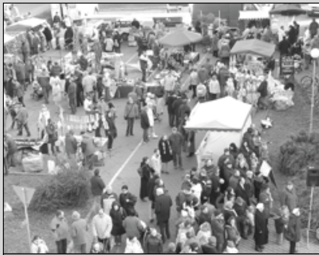
Vánoční jarmark před radnicí v roce 2008.