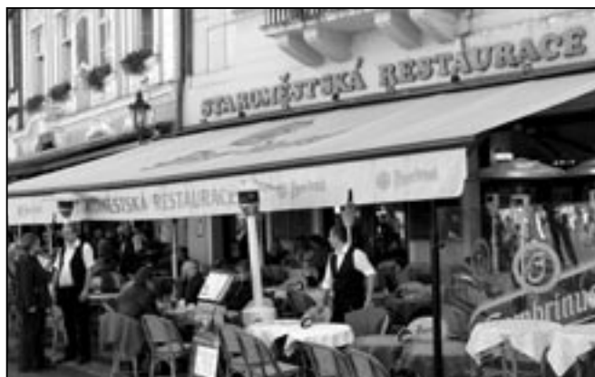
Staroměstská restaurace se nachází přímo na Staroměstském náměstí. Ochutnali jsme pivo Prazdroj 0,3l za 26 Kč. Na rychlý a levný oběd doporučuji restauraci U Betlémské kaple na Betlémském náměstí (asi 5 minut od orloje), meníčko zde stojí 70 Kč. V době naší návštěvy nabízeli čočkovou polévku, segedínský guláš s knedlíkem za 70 Kč. Další tři jídla v meníčku byly za 70 Kč, ale bez polévky.

všech třech částech jsou rozmístěny již od dob Petra Parléře kamenné plastiky. Některé jsou tak malé, že je ze země nemůžeme detailně pozorovat. Souvisejí se symbolikou astrologie, alchymie a také s naukami o bytostech z paralelních světů. Mají většinou ochranný charakter. Huť Petra Parléře tyto kamenné symboly hojně používala i na Svatovítské katedrále.