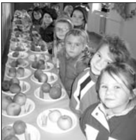
Děti z mateřské školy Rastislavova na výstavě ovoce v základní škole.

Vyvrcholením týdne byla návštěva výstavy ovoce a zeleniny v Základní škole Staré Město. Škola voněla jablky, kterých zde bylo mnoho druhů. A nejenom z vůně se děti mohly radovat, po skončení výstavy totiž dostaly jablíčka do školky a všechny děti je ochutnaly. Iveta Polášková