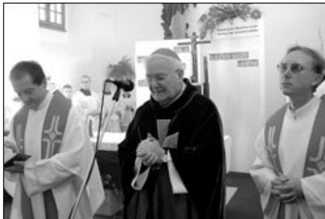
Biřmování ve Starém Městě udělal biskup Mons. Josef Hrdlička (na snímku uprostřed).