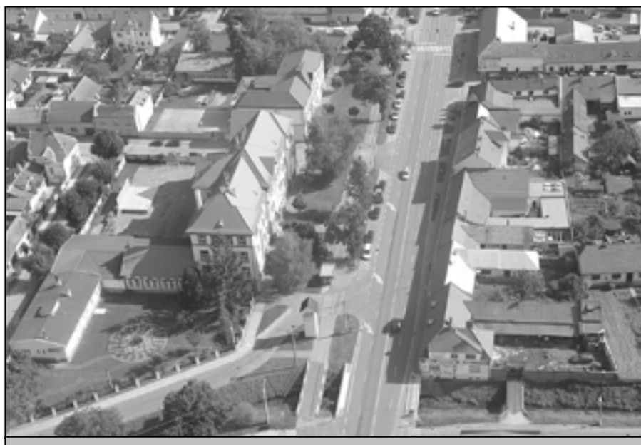
Budovy základní školy na náměstí Hrdinů na leteckém snímku.