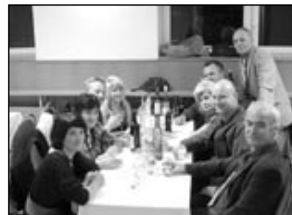
Spokojení účastníci Prčovského bálu.