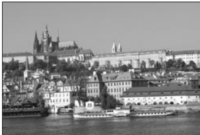
Nádherné panorama Hradčan. Na Vltavě pluje shodou okolností výletní loď Vltava.