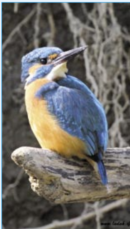
Ledňáček říční v lokalitě v blízkosti Starého Města.