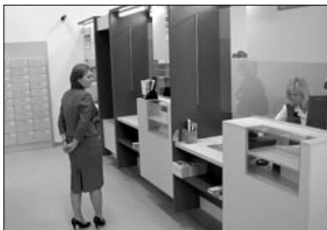
Moderní interiér staroměstské pošty.