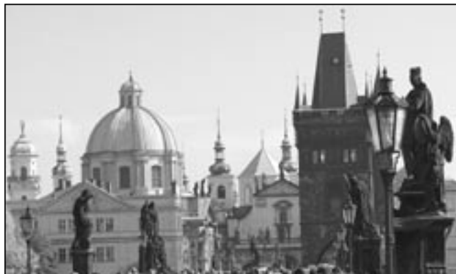
Třeba jen pro tento jedinečný záběr se vyplatí cesta do Prahy. Snímek je pořízen zhruba z poloviny Karlova mostu ve směru na Staré Město. Vlevo vidíme sochu sv. Jana Křtitele z roku 1855, patrona naší kaple na hřbitově, za ní je obdivovaná socha sv. Cyrila a Metoděje.