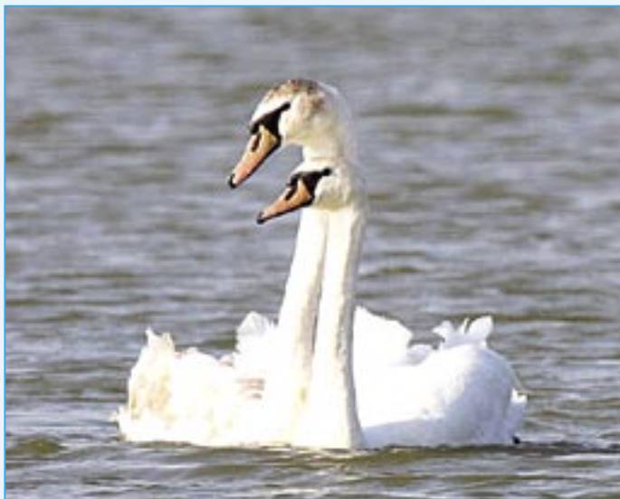
Labutě bílé patří mezi nejněvnějšší páry v přírodě.