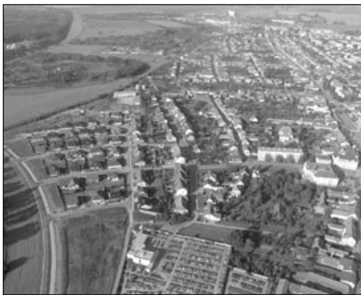
Letecký snímek Starého Města.