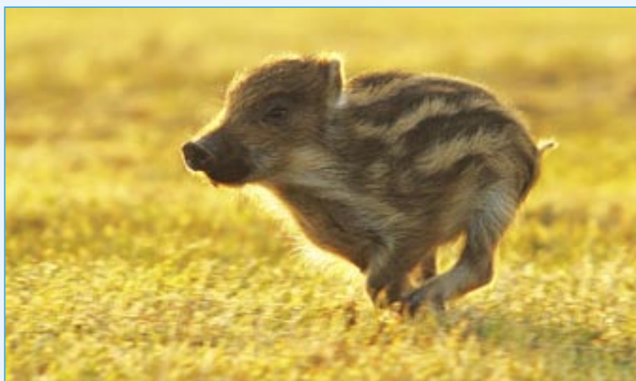
Kaneček Kvido prožívá bezstarostné mládí u dobrých lidí.