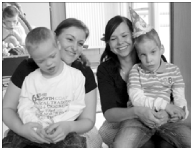
Velehradské děti se svými tetami.

Ergoterapeut Felix Gorissen si všiml zařízení terapeutických dílen a doporučil jejich vylepšení materiálem, aby se klienti