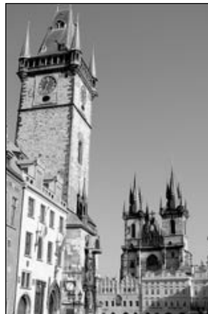
Staroměstská radnice ční do výšky 69,5 metru. Na věži je vyhlídka, odkud je překrásný pohled na „matičku stovčatou.“