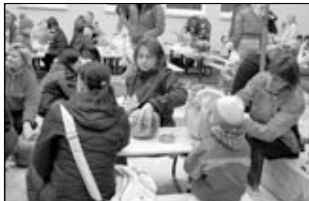
Na výrobě dýňových strašidýlek se podílely především maminky dětí.