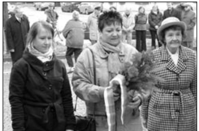
Zástupkyně Orla se poklonily hrdinům, kteří padli v 1. světové válce.