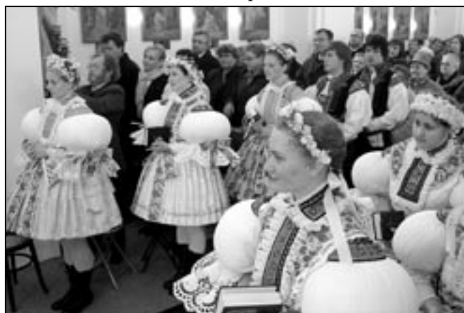
Biřmovanci v krásných slovačkových krojích.