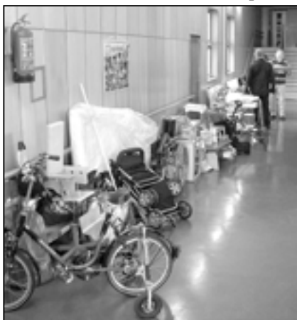
Invalidiní vozík, polohovací křeslo, kompenzační a rehabilitační pomůcky, jízdní kolo, hračky a další tolik potřebné dary zaplnily chodbu domova na Velehradě.

V červencovém vydání Staroměstských novin jsme vás informovali o návštěvě delegace z partnerského města Tönisvorst v čele se starostou Thomsem Gossenem a předsedou partnerského výboru panem Horstem von Brechanem. Pobývali u nás ve dnech 28. - 31. května 2010 a vyvrcholením jejich návštěvy byl společenský večer v SKC – sokolovně, na kterém byl předán finanční dar 500 Euro dětem z Domova pro osoby se zdravotním postižením v blízkém Velehradě. Obálku s penězi