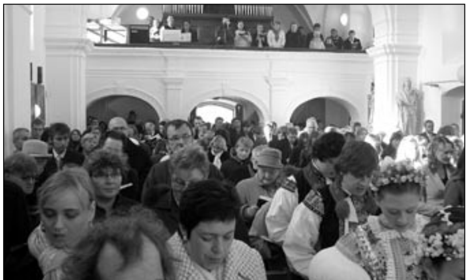
V neděli 31. října 2010 se kostel sv. Michaela zcela zaplnil farníky ze Starého Města a okolních obcí při slavnosti biřmování.