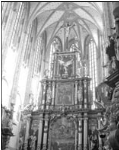
Chrám Panny Marie Sněžné leží v těsné blízkosti Václavského náměstí. Založil ho Karel IV. a měl to být více než 100 m vysoký a nejhonosnější chrám v centru Prahy. Bohužel zůstal nedostavěn a je bez věží. Běžte se tam podívat, uvidíte nejvyšší chrámovou loď a na rozdíl od Svatovítské katedrály budete překvapeni malým počtem přítomných.

V sobotu 9. října 2010 byla na programu významná událost. Staroměstský orloj slavil kulaté výročí. Do provozu byl uveden o 600 let dříve, tedy 9. října 1410. O této události jsme čtenáře informovali již v říjnových Staroměstských novinách a doporučovali jsme výlet do Prahy na extra výhodnou jízdenku SONE+ pro 5 osob, a to na Den železnice 25. září 2010, kdy byla nejvýhodnější tarifní nabídka. Jelikož se považuji za staroměstského patriota a má rád nejen naše Staré Město ale i Staré Město v Praze, vydal jsem se na výlet v sobotu 9. října. Máme toho totiž s matičkou Prahou mnoho společného, i když v historii hraje naše město, zvláště v počátku novodobých dějin, často důležitější roli. Vždyť právě k nám, do velkomoravského Veligradu přijížděli první Přemyslovci získat zkušenosti, na dvoře Svatopluka vznikaly první mocenské dohody a české země tehdy spadaly pod vliv Velké Moravy. Právě u nás, uvádí se místo bývalého kostelíku sv. Víta, který stával na rozcestí Michalské a Svatovítské ulice, byl podle legendy požehnan v roce 884 arcibiskupem Metodějem kníže Bořivoj a jeho žena Ludmila. Zlaté časy Prahy nastaly zvláště v letech 1346-1378, což je epocha Karla IV. Praha byla hlavním městem nejen Českého království, ale i Svaté říše římské.