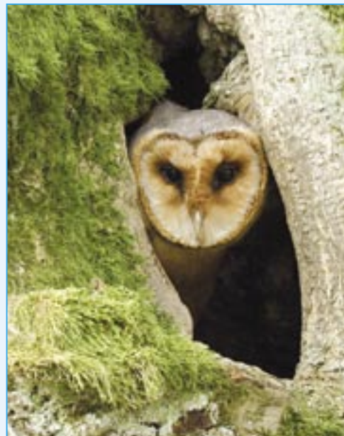
Sova pálená a její pohled na současný svět.