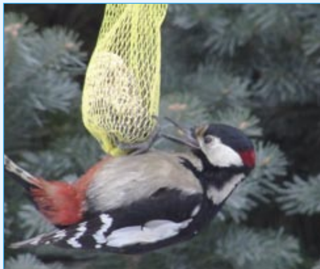
Strakapoud velký již v listopadu přilétá na krmítka.