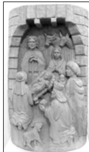
Vánoce, Vánoce přicházejí.