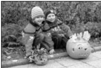
Děti se svými výrobky.

U rodičů, dětí a přátel školy má tato tradiční podzimní slavnost každoročně velký ohlas. Letošní „dýňování“ a svícení nebylo výjimkou. MŠ