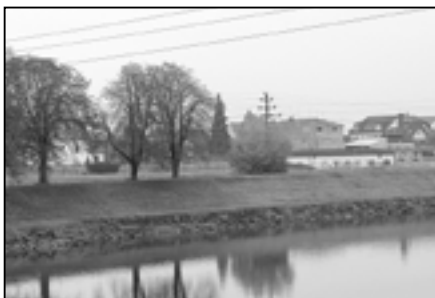
Pohled na řeku Moravu ve směru od železničního mostu 19. října 2010.