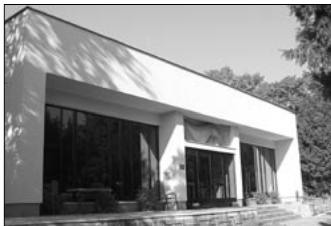
S dějinami z období Velkomoravské říše se můžete seznámit v Památníku Velké Moravy.

kolektivům popřípadě jako rodinný výlet spojený s návštěvou dalších kulturních a historických památek hlavního města Prahy. SM