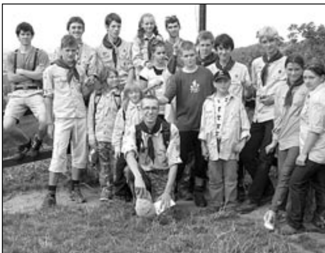
Staroměstský oddíl Permoníci na táboře u obce Držková.

Skautský staroměstský oddíl Permoníci letos opět tábořil v obce Držková. Tábor probíhal ve dnech 15. - 29. srpna 2010 a zúčastnilo se 15 dětí. Tento rok se tábor nesl v duchu stavby kanadské pacifické železnice (druhá polovina 19. až začátek 20. stol.) a cílem stejnojmenné hry bylo spojit východ a západ Kanady železniční tratí. O prvenství bojovaly tři obchodní společnosti a každou z nich reprezentoval tým pěti dětí. Postupem času týmy i jednotlivci získávali za hry a úkoly kanadské dolary, za které si mohli na večerních dražbách koupit stavební materiál, dělníky a inženýry v podobě kartiček a díky nim mohli stavět jednotlivé úseky tratě. Na táboře nechyběly celodenní výpravy do okolí, pestré a náročné aktivity jako slaňování skal za východu slunce, akční výuka první pomoci na věrně simulované autonehodě, noční hry, kde se děti musely spolehnout jeden na druhého, indiánská sauna, vaření masa bez nádob v zemi pomocí vodní páry a mnoho dalších tradičních i netradičních zálešáckých či skautských aktivit. Poslední den se kolem tábora jela jedna z rych-