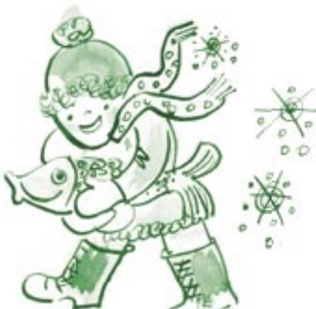
Kresba: Jindra Pelková

hem chvilky, co hovoří, přisedají ke štědrovečernímu stolu i ti, kteří už dávno nejsou s námi – stařenka se stařečkem, kmotřenka Anna, strýc Josef s tetou Veronikou... Je tu i pár našich kamarádů, kteří se odstěhovali do jiných vesnic a jiných měst, a také naše lásky, které o ulici dál či v domě támhle přes pole, v sousední vsi, v nestřeženou chvíli a plaše, aby nebyly prozrazeny, dají o sobě vědět zábleskem plaché vzpomínky. Dnes o Štědrém večeru jsme opět všichni spolu a jsme si blízcí. Rozsvěcujeme