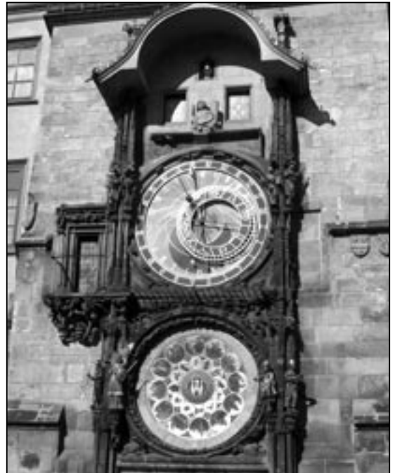
Staroměstský orloj 9. října 2010 v den svého 600. výročí.

Astronomický ciferník pražského orloje – astroláb – je řečí dneška možné považovat za mechanický analogový počítač, který používá speciální zobrazení prostoru – nebeské sféry a převádí je do roviny ciferníku. Tomuto zobrazení se dnes říká stereografická projekce. Roz-