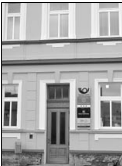
Pobočka České pošty má od 1. listopadu 2010 sídlo v budově radnice.

dějin poštovní služby ve Starém Městě. Na Severní dráze císaře Ferdinanda, která vedla z Vídně přes Břeclav, Staré Město, Přerov, Ostravu do Krakova, byly zavedeny poštovní expozitury na velkých železničních stanicích od první poloviny čtyřicátých let devatenáctého století. Ve Starém Městě (nádraží se tehdy jmenovalo Uherské Hradiště) byla poštovní expozitura zřízena v roce 1843 a od 1. srpna 1850 začaly jezdit vlakové pošty z Vídně do Přerova a Bohumína. Další významnou událostí byla v roce 1847 nově zřízená státní telegrafní linka ve všech stanicích na trati Přerov – Břeclav. Byl to technický zázrak, lidé k sobě měli blíže.