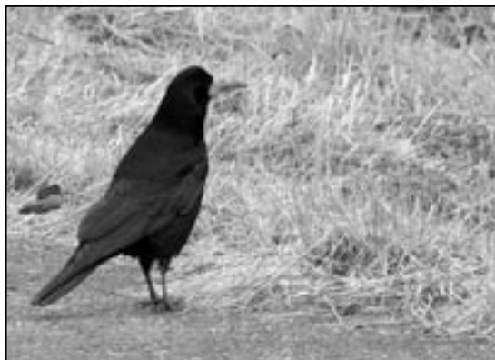
Havrani mají disciplínu a velmi přesný kalendář. Jejich přilet do Starého Města sledujeme pravidelně v rozmezí od 16. do 20. října. Nespletli se ani letos, kdy jsme první předvoj viděli na Trávníku 16. října 2010.