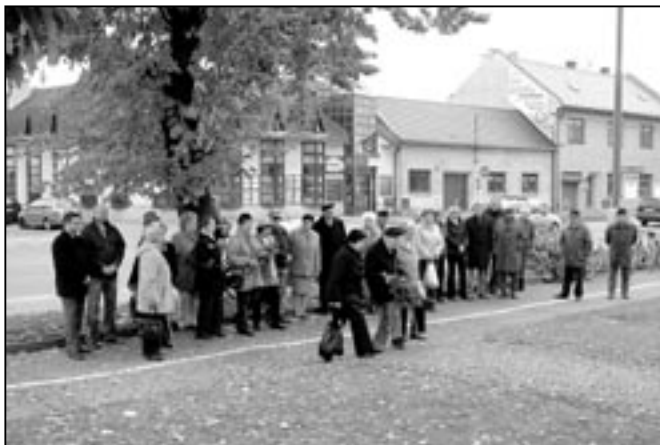
Část účastníků pietního aktu. Celkem přišlo 48 občanů a dětí z našeho města.

bylo na dně, prohrávalo válku a císař Karel I. tomu časem nekladl odpor. Karel I., poslední český král, neuspěl stejně jako jeho spojenec německý císař Vilém a jeho protivník ruský car Mikuláš. Svě koruny