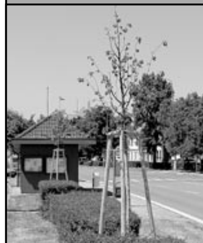
V zimě byly vykáceny přestárle stromy na náměstí Hrdinů. Na jejich místě již rostou nové, mladé stromky, které po několika letech opět zazelení největší plochu v centru města.