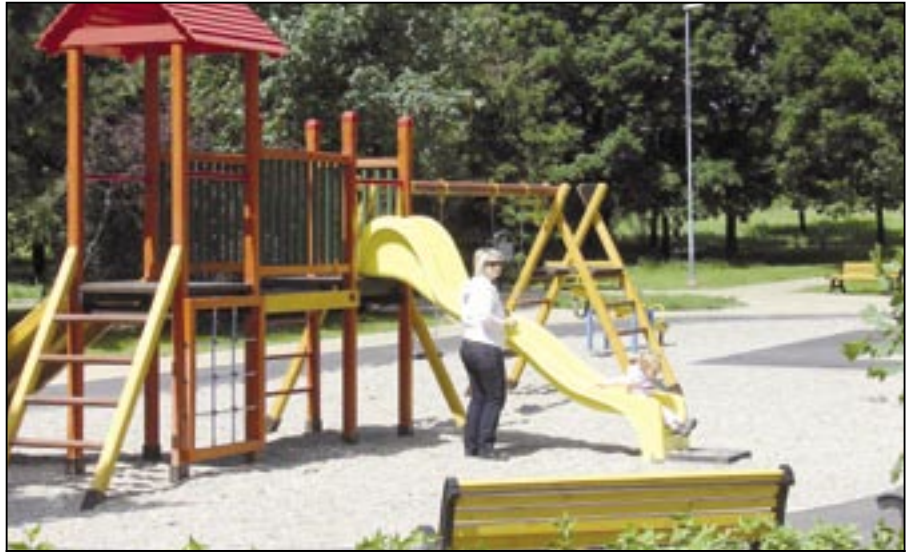
Dětské hřiště s novými hracími prvky v západní části sídliště.

Rekonstrukcí, výměnou a modernizací prošlo také veřejné osvětlení, byl doplněn chybějící mobiliář, jako jsou lavičky, odpadkové koše a stojany na kola. Výrazně je také dosazena veřejná zeleň,