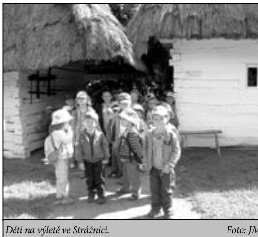
Děti na výletě ve Strážnici.