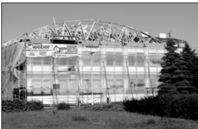
Již od začátku června se pracuje na rekonstrukci budovy zdravotního střediska v blízkosti Velkomoravské ulice. Nejprve bylo postaveno lešení, začalo se s opravou střechy, potom se postupně na míru vyrobily okna v celé budově zdravotního střediska.

Od června 2010 je prováděna rekonstrukce zdravotního střediska, které bylo postaveno v 80. letech minulého století v akci „Z“ a dodnes nedoznalo žádných výrazných změn. Problémy působí rovná střecha, která je příčinou takřka neustálé vlhkosti a obvodový plášť z takzvaných boletických panelů, je zdrojem obrovského úniku tepla a to s ohledem k dnešním hygienickým a energetickým podmínkám.