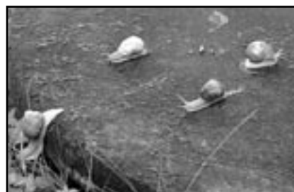
Nutno podotknout, že tento srandovní příběh je nefalšovaný, jen jména aktérů jsme zaměnili.