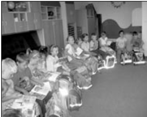
Děti z mateřské školy Komenského již brzy usednou do školních lavic.