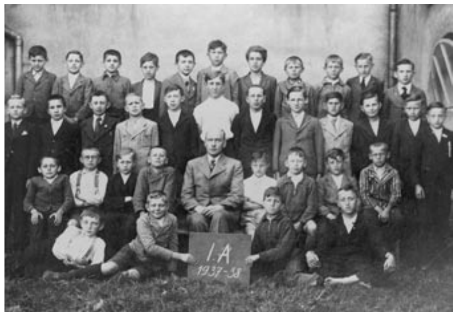
Zavzpomínejme na naše dědečky. Na snímku třída 1. A - ročník 1937 - 38.