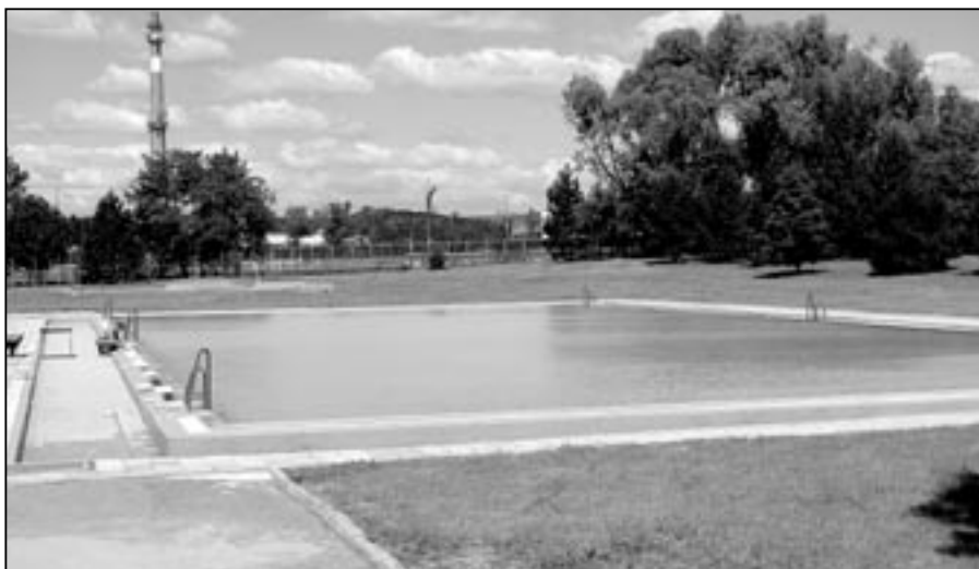
Koupaliště brzy ráno, než přijdou první návštěvníci.