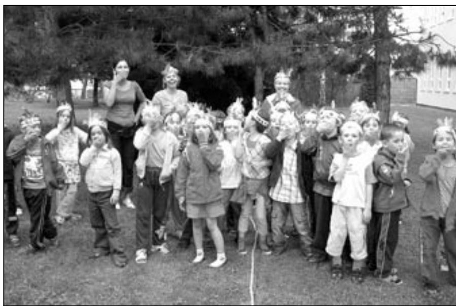
Děti čekal v mateřské škole den plný překvapení. A jak je vidět na snímku, velmi se jim tam líbilo.