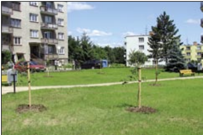
Na Kopánkách bylo vysazeno 3000 stromků a menších i větších keřů.