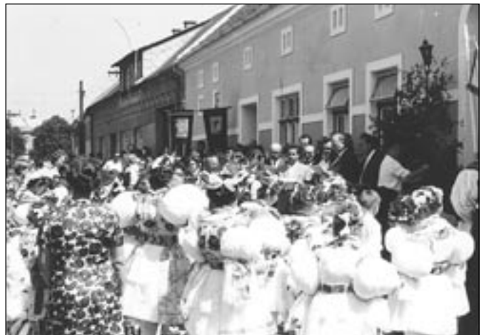
Krojovaní účastníci slavnosti Božího Těla na náměstí Hrdinů v minulosti. Přesný rok se nám nepodařilo zjistit, snad 1938. Pomůže nám někdo z našich čtenářů?