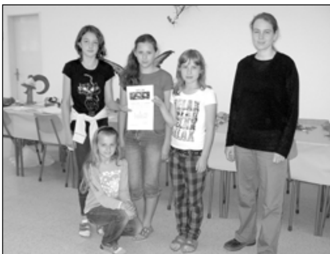
Holčíci tým z 5.B se umístil na pěkném druhém místě.