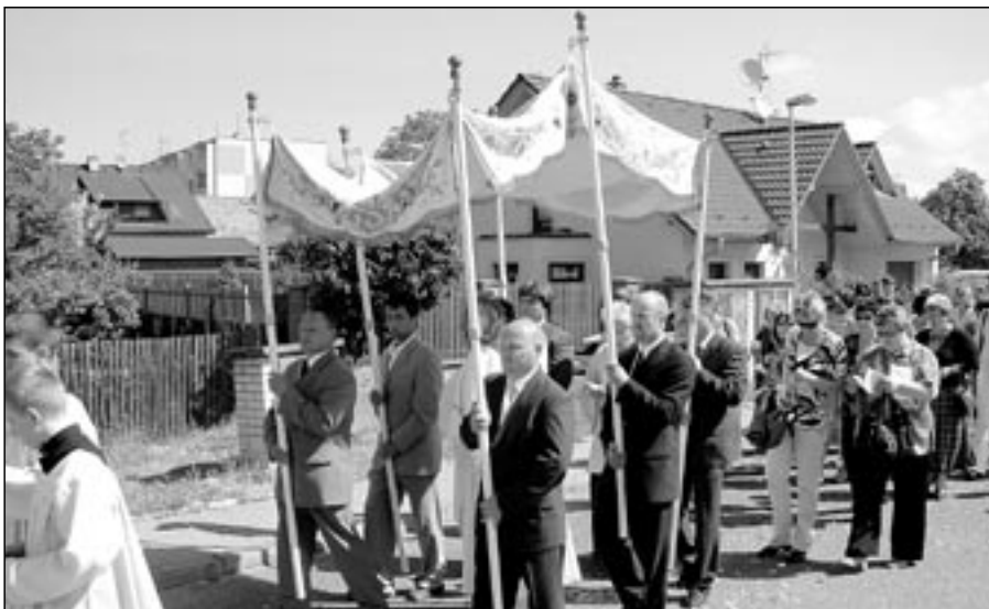
Svátku Těla a Krve Kristovy v neděli 6. června 2010 se zúčastnilo více než 200 farníků. Kněz nese pod baldachýnem v monstranci Nejsvětější svátost – proměněnou velkou hostii.