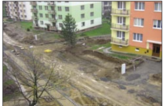
Kopánky v průběhu stavebních prací.