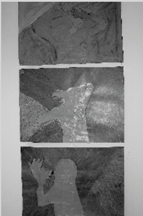
Výtvarné práce dětí.