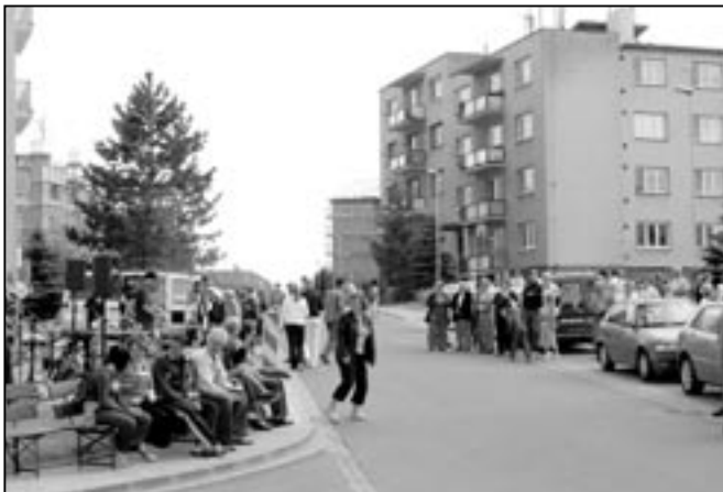
Na slavnostní zahájení postupně přišlo více než 200 občanů a dětí. Byla dobrá pohoda a pěkné počasí.