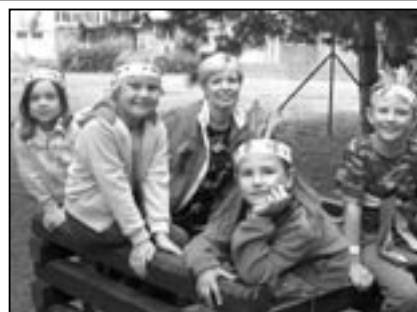
Indiáni se ve školce bezvadně vydováděli. Také jejich rodiče a prarodiče zavzpomínali na doby, kdy byli velmi zbožňováni Vinnetou a jeho láska z kmene Assiniboinů Ribanna, Nšo-či a starý lišák Old Shaterhand.