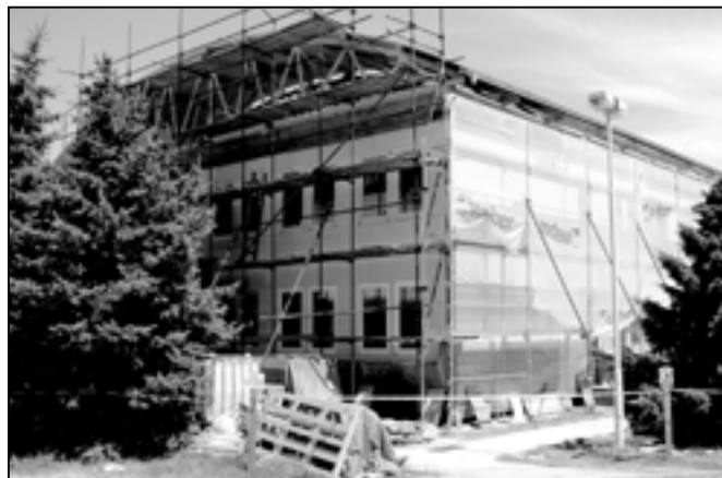
Budova zdravotního střediska ve směru od hasičské zbrojnice 4. července 2010.

„Výměna pláště, zateplení a nová vazníková střecha přijdou město na 12 milionů korun. Ze Státního fondu životního prostředí získalo Staré Město částku 3,2 milionu korun. Vítězem výběrového řízení se stala společnost Kodrila s. r. o. z Huštěnovic, která podala nejvýhodnější nabídku,“ sdělil starosta Josef Bazala.