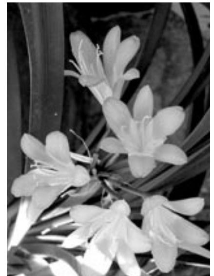
Všem našim milým čtenářkám posíláme pro potěšení květy klívie.