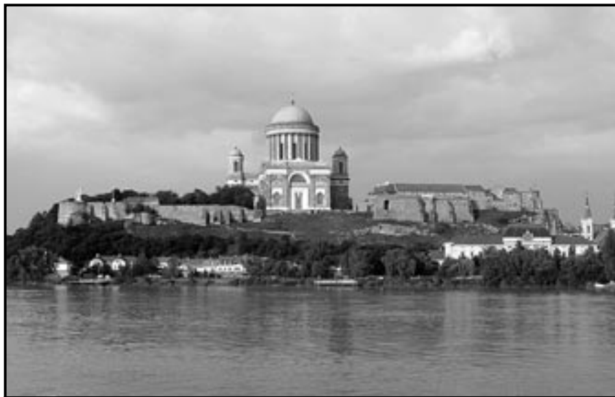
Katedrála v Ostřihomi je největším chrámem Maďarska.

Přijíždíme k městu Esztergom (Ostřihom), neodmyslitelně spjatým s křesťanskou minulostí Maďarska. Tu byl korunován sv. Štěpán, tu byla postavena katedrála zasvěcená sv. Vojtěchu-Adalbertovi, tu byla první uherská mincovna, do časů vpádu Tatarů je nejen centrem církve, ale i centrem uherského království Arpádovců. A právě proto jeho stavební historické památky skončily během těž-