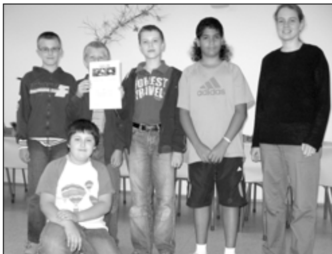
Nejlépejší družstvo z 5.B bylo vlastně mužstvo, protože bylo složeno ze samých chlapců.