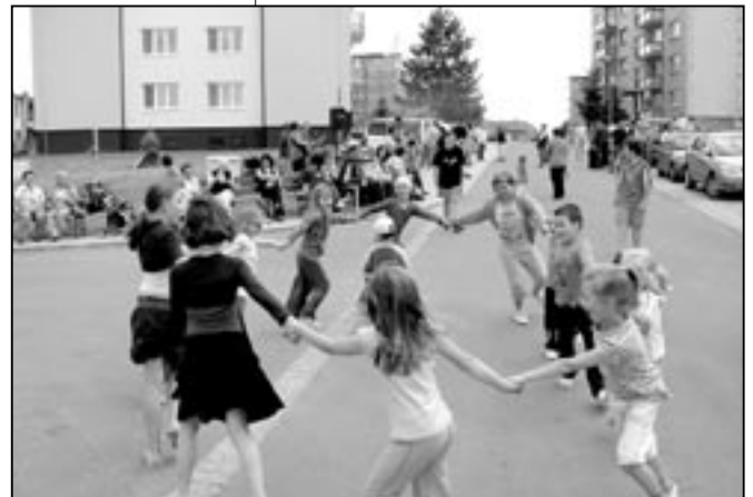
Na Kopánkách si děti zatančily při svěží country hudbě.