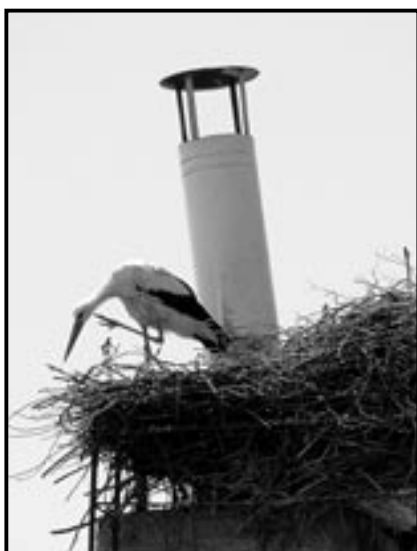
Je neděle 4. července 2010 a čapí máma upravuje hnízdo v Klukově ulici.