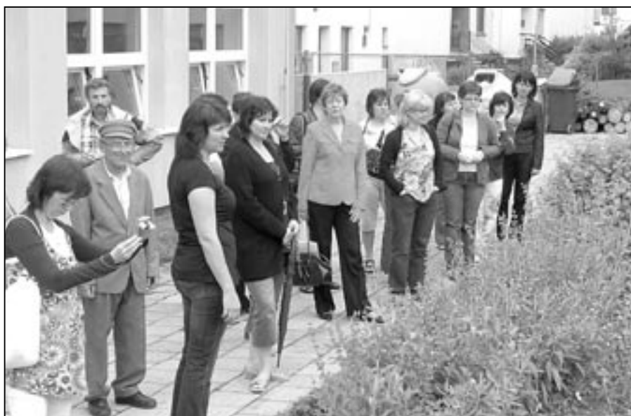
Učitelé z oblasti Zlínského kraje si se zájmem prohlédli školní zahradu.