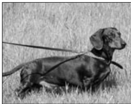
Jezevčík je lovecký pes a v terénu je nejraději.