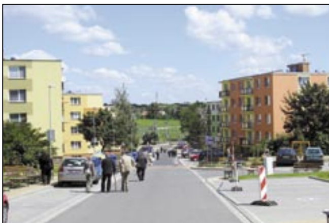
Sídliště a jeho nádherná proměna.

Celkové náklady na realizaci projektu 36 097 833 Kč. Město obdrželo finanční příspěvek ve výši 30 683 158 Kč z toho 28 997 389,19 Kč poskytl Evropský fond regionálního rozvoje a prostřed-