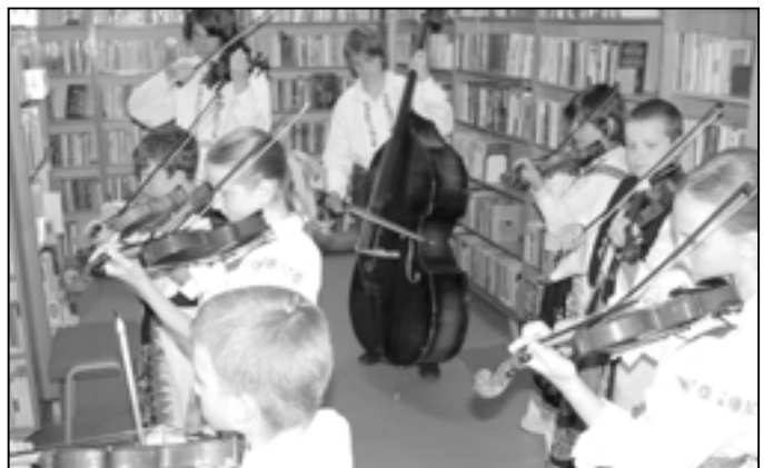
Zahrála cimbálová muzika ZUŠ.