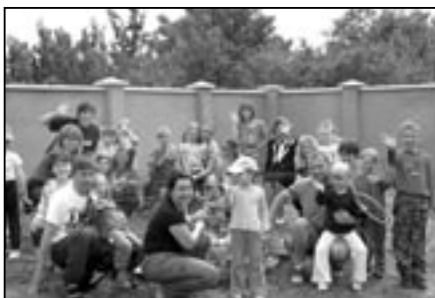
U nejmladších oddílů se táboráku zúčastnili rodiče i někteří prarodiče.

U nejmladších oddílů se táboráku zúčastnili rodiče i někteří prarodiče. Všichni se již těší na zahájení nové cvičební sezóny, která se bude konat začátkem září „Odpolednem plným her“ na