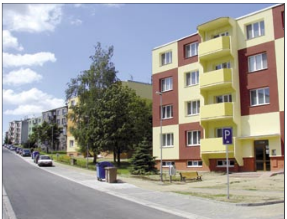
Pohled na Kopánky ze spodní strany od koupaliště.