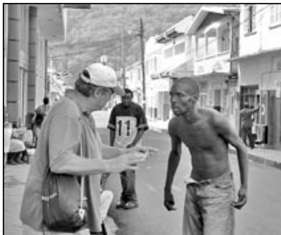
Při rozhovoru s domorodcem.