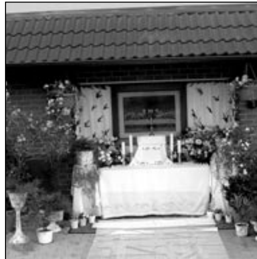
Nádherně připravený oltářík v ulici Sées.