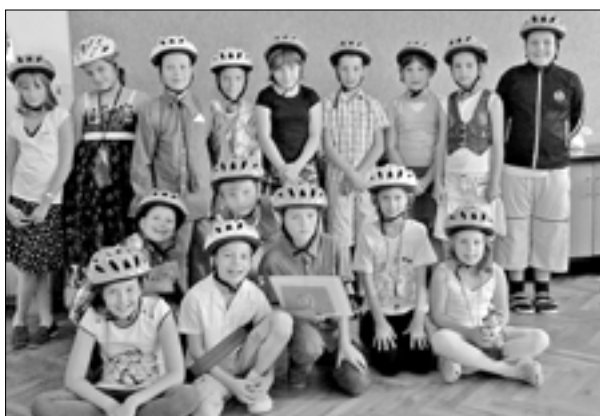
Žáci 3.C se zúčastnili soutěže s názvem Doprava a získali milý dárek – barevnou cyklistickou přilbu pro každého.

Povinnou součástí cyklistické výbavy každého mladého cyklisty je cyklistická přilba.