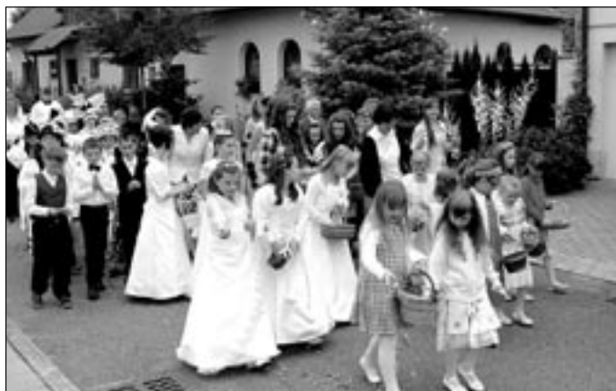
Prvního svatého přijímání se zúčastnily dvě desítky dětí. Družičky sypaly na vozovku okvětní lístky pivoňek.