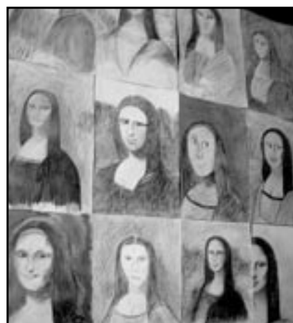
Tajuplný obraz Mona Lisa od Leonarda da Vinciho je patrně nejslavnější portrét všech dob. „Giocondu“ namalovaly také děti z výtvarného oboru ZUŠ. Originál obrazu vznikl již v roce 1503 a je vystaven v pařížském Louvru.