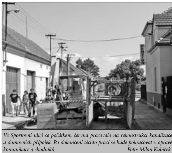
Ve Sportovní ulici se počátkem června pracovalo na rekonstrukci kanalizace a domovních přípojek. Po dokončení těchto prací se bude pokračovat v opravě komunikace a chodníků.

plocha a nádvoří o výměře 840 m 2 a p. č. st. 2254 zast. plocha a nádvoří o výměře 430 m 2 , které se nachází pod budovami zdravotního střediska