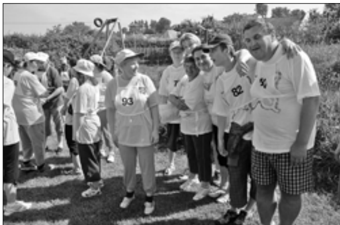
Sportovní hry se staly tradicí.

Sportovní klání bylo rozděleno do více disciplín dle stupně postižení. Sportovci urputně mezi sebou soutěžili, aby získali pro svůj domov co nejvíce medailí, za velké podpory přítomných diváků. Podpořit je přijeli také hosté z krajského úřadu v čele s pa-