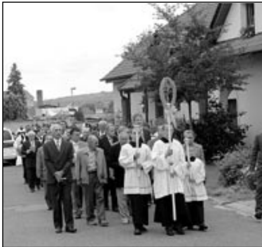
Průvod vyšel krátce po desáté hodině z kostela sv. Michaela. Přes hřbitov a ulici Sées pokračoval k domu manželů Číhalových.