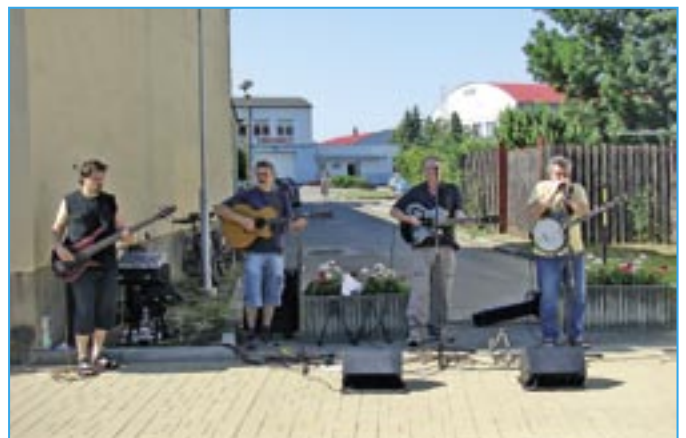
Zahrála country kapela Štrůdl a posluchačům se velmi líbila.