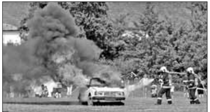
Členové Sboru dobrovolných hasičů ze Starého Města ukázali na Rybníčku bleskové uhašení požáru automobilu.

Po telefonickém oznámení všímavého občana výjezd na místo v Luční čtvrti,