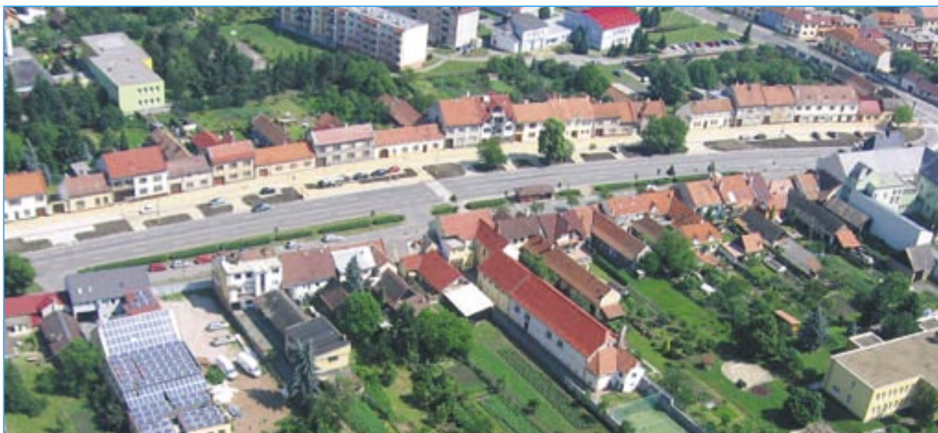
Letecký snímek náměstí Hrdinů a nejbližšího okolí z 29. května 2011.