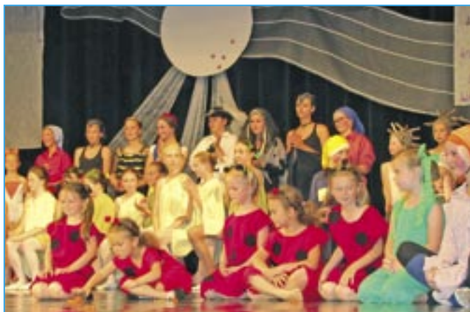
Děvčata z tanečního oboru se loučí s publikem před přestávkou.