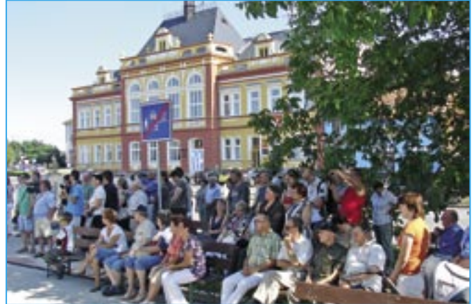
Noblesní budova radnice v den otevření severní strany náměstí Hrdinů.