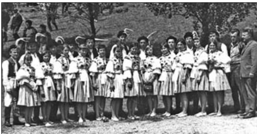
Vystoupení Dolinečky v rámci Kopaničářských slavností v Hrozenkově 13. července 1969.

no ve sborníčku, který byl k tomuto výročí vydán. Mnohé informace se nezakládají na pravdě a já bych rád uvedl historii Dolinečky na pravou míru. Věřím, že mi autoři brožurky odpustí, ale považuji to za svou povinnost.