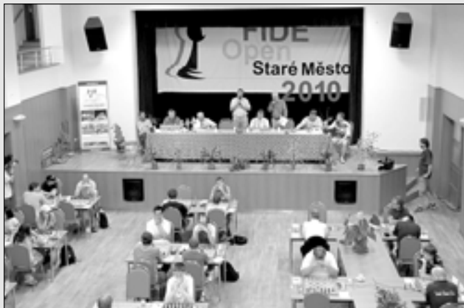
Slavnostní zahájení turnaje v minulém roce.

Šachový klub Staré Město pořádá ve dnech 12. - 20. srpna 2011 v pořadí již IX. ročník mezinárodního šachového turnaje FIDE OPEN Staré Město 2011. Turnaj se uskuteční v obou sálech Společensko-kulturního centra ve Starém Městě. Hraje se švýcarským systémem na 10 kol. Na finančních cenách bude rozděleno celkem 50 000 Kč, pro vítěze turnaje je určeno 12.000 Kč. Slavnostní zahájení se koná v pátek 12. srpna v 15:00 hod.