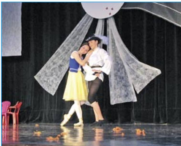
Přišel princ a Sněhurka procitla.