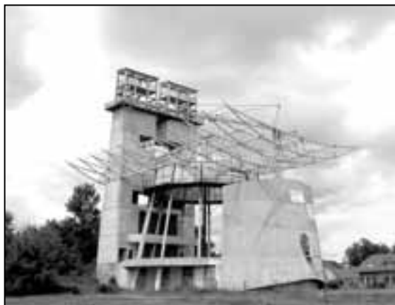
Velkomoravský koncert se uskuteční na nově budovaném náměstí Velké Moravy.

V současné době vrcholí přípravy na benefiční Velkomoravský koncert, který uspořádá Římskokatolická farnost, Jednota Orel a město Staré Město. Koncert se uskuteční v neděli 11. září 2011 v 16:30 hod. na nově budovaném náměstí Velké Moravy ve Starém Městě.