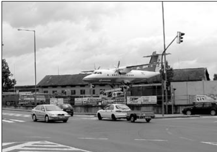
Na snímku dopravní letoun L 610, který je umístěn v areálu firmy Kovosteel při vjezdu do Starého Města ve směru od Brna.

4.1 vyjádření města k zahájení územního řízení dle § 79 zákona č. 183/2006 Sb. v platném znění dle zápisu.