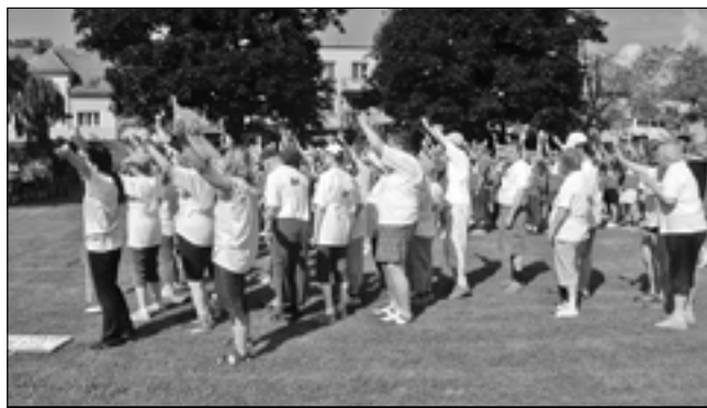
Sportovci se velmi snažili, aby získali pro svůj domov co nejvíce medailí.