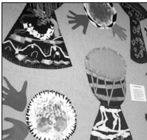
Jak se vám líbí kolekce obrázků s názvem Africké rytmy?