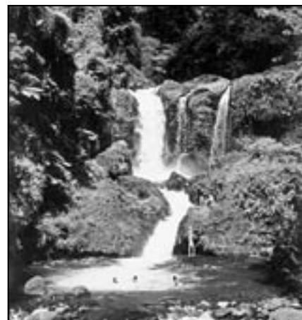
Za klidného stavu vody se mohou turisté v blízkosti vodopádu Trinity Falls koupat. V den tragédie tropický déšť zvedl hladinu vody a došlo k neštěstí.