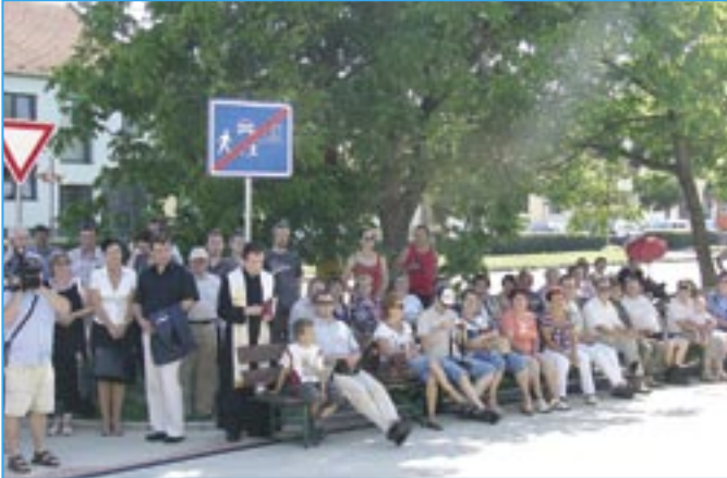
Na slavnostní akci přišlo více než 100 občanů.