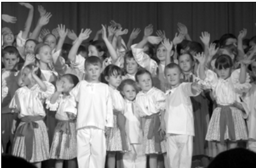
Děti se loučí s nadšeným publikem po skončení pořadu k 55. výročí založení souboru Dolinečka.