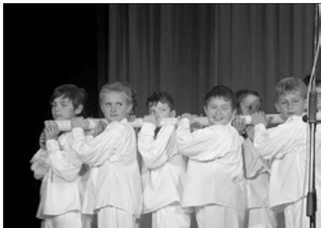
Chlapci z Dolinečky při vystoupení na pódiu SKC – sokolovny.