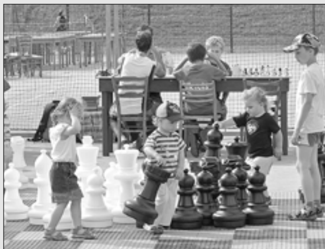
Na Staroměstském dni se představily nejmladší šachové naděje.