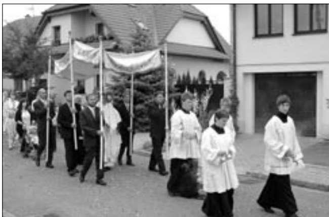
Církevní svátek Těla a Krve Páně zdůrazňuje živou přítomnost Ježíše Krista ve svátosti oltářní.