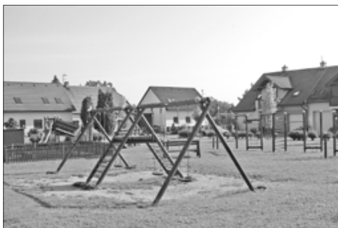
V Lučnící čtvrti je umístěno moderní dětské hřiště.

Ve Starém Městě máme celkem deset dětských hřišť, která jsou umístěna v různých čtvrtích našeho města. Nejnovější hřiště byla otevřena v červnu loňského roku na sídlišti Kopánky v rámci revitalizace této místní části. Maminky a ostatní rodinní příslušníci zde mohou navštívit se svými dětmi velké dětské hřiště v sousedství Domu s pečovatelskou službou a v blízkosti hlavní místní komunikace se nachází malé hřiště Kopánky. Další dětská hřiště jsou umístěna v Nerudově ulici, v sousedství Společensko-kulturního centra, v ulici Sées, trochu skryté veřejnosti je hřiště na Zerzavici. Velké oblíbené se těšilo hřiště v Lučnící čtvrti a chvíle odpočinku a oddychu s dětmi nabízejí ještě hřiště