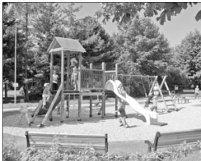
Dětské hřiště na Kopánkách je nejnovější. Do provozu bylo uvedeno v červnu 2010.