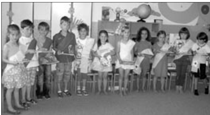
Chlapci a dívky po prázdninách nastoupí do základní školy. Na svou mateřinku budou všichni dlouho vzpomínat.