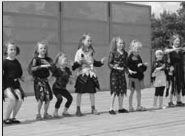
Malé tanečnice - čarodějničky z Orla při vystoupení na Staroměstském dni.