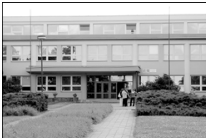
Budova Gymnázia a Střední odborné školy Staré Město.