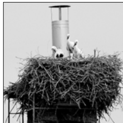
Na komíně bývalého stolařství v Klukově ulici se mají čile k světu tři čápa. Staří čápi se ohánějí a neustále přináší z okolních luk potravu.