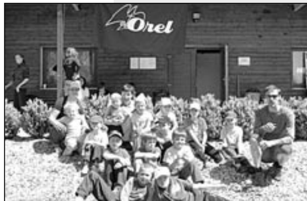
Děti na atletických závodech.