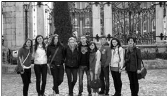
Výlet do Budapešti všechny nadchnul.