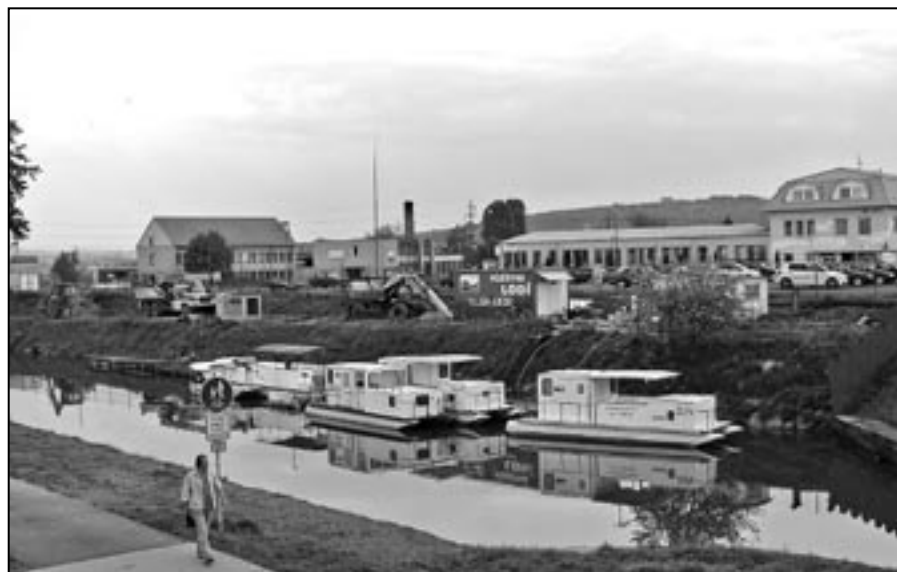
V sobotu 30. dubna 2011 byla zahájena plavební sezona na Baťově kanálu. Přístaviště ve Starém Městě je v současnosti v rekonstrukci, na místě jsme viděli kotvící lodě Zlín, Pálava, Rochus a další.

1.17 žádost společnosti VÁCLAV HRABEC, s. r. o., Uherské Hradiště, J. E. Purkyně 365 o snížení nájemného z nebytových prostor restaurace Victoria včetně zázemí a nájemného za movité věci.