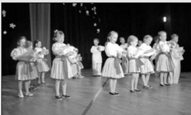
Děti z Dolinečky poděkovaly ke Dni matek svým maminkám za lásku a péči.