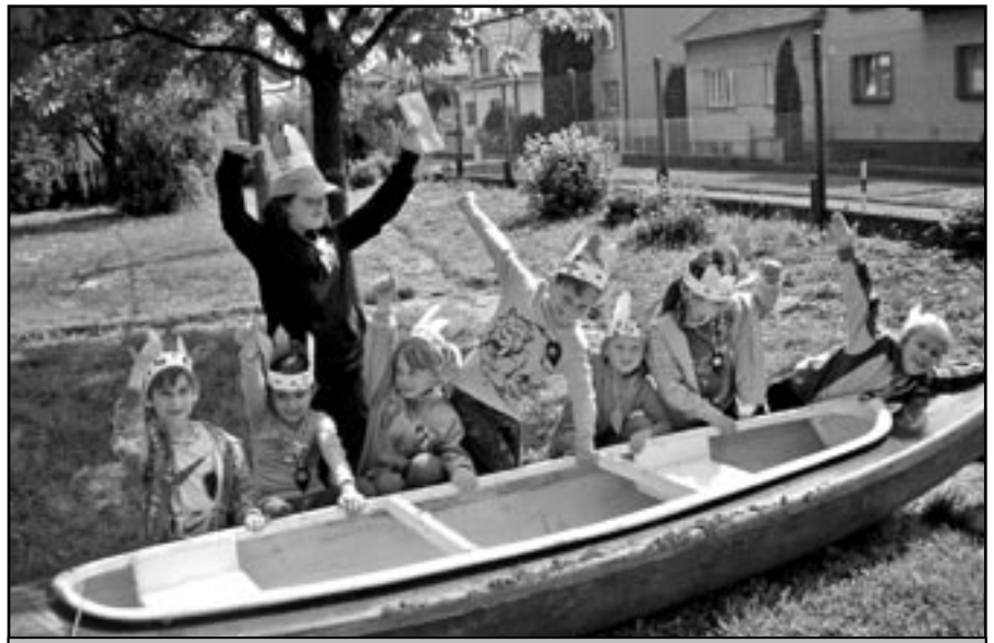
Indiáni a indiánky na zahradě Střediska volného času Klubko.