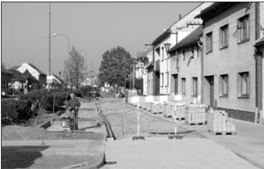
Během měsíce května pracovníci firmy STAVAKTIV s. r. o. Ing. Lubomíra Hučička dokončovali stavební práce na severní straně náměstí Hrdinů. Občanům bude sloužit bezbariérový chodník, upraví se veřejné plochy, přibude parkoviště, veřejné osvětlení a městský mobiliář. Stavební práce byly podpořeny ze Státního fondu dopravní infrastruktury z programu zaměřeného ke zvýšení bezpečnosti dopravy a jejího zpřístupňování osobám s omezenou schopností pohybu a orientace.

2.5 dokumentaci pro stavební povolení na akci Parkoviště Za Radnicí Staré Město, 1. část.