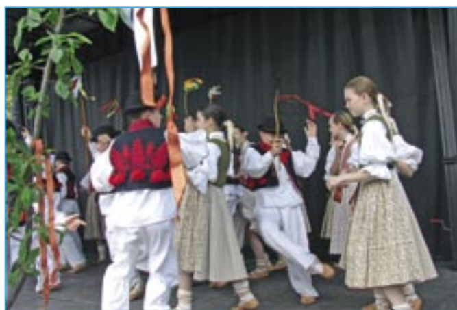
Šlahacka Dolinečky proběhla na pódiu již o velikonoční neděli.