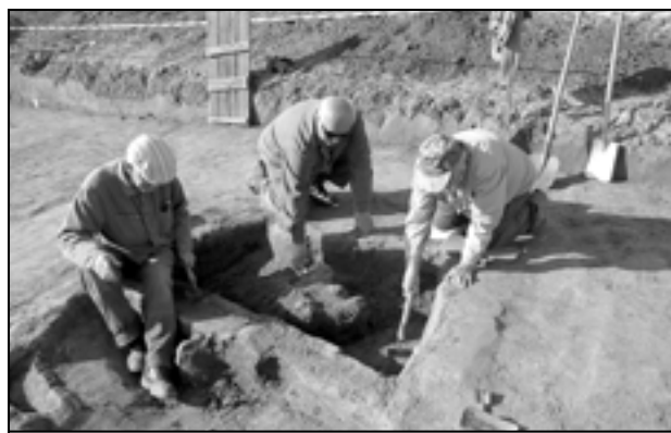
Dne 22. dubna 2011 trojice archeologů odkrývala velkomoravskou pec.