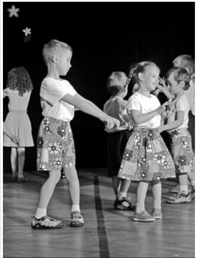
Děti z Křesťanské mateřské školy z ulice Za Radnicí při vystoupení ke Dni matek, které se uskutečnilo 14. května 2011 v SKC - sokolovně.