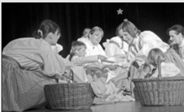
V Rodinném centru Čtyřlístek se schází maminky se svými dětmi a nacvičují vystoupení pro veřejnost.