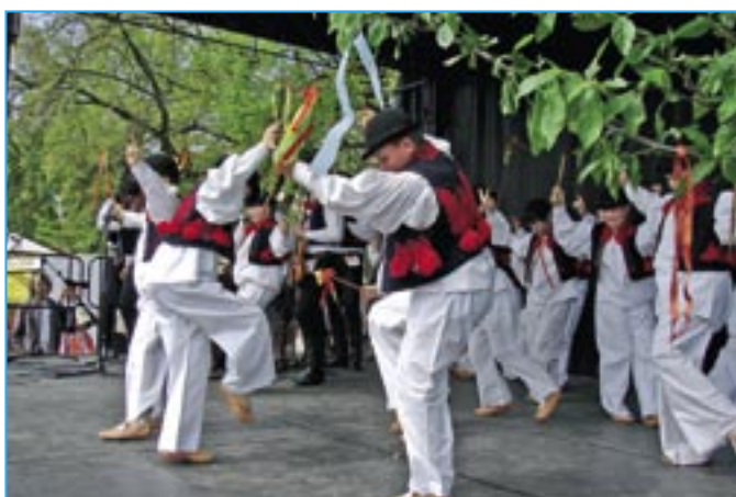
Velikonoční verbuňk tančí šohajiči z Dolinečky.