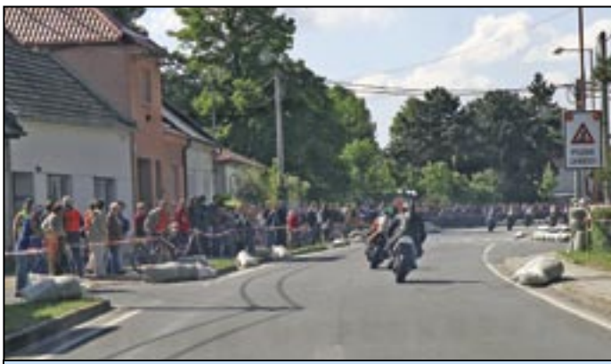
Na Velehradské ulici závody sledovaly stovky diváků.

Jelo se celkem devět závodů a jezdci byli hodnoceni v jedenácti kategoriích. Pořadí závodů bylo následující: třída Klasik do 175 ccm, Klasik do 250 ccm, Klasik do 350 ccm, Klasik do 500