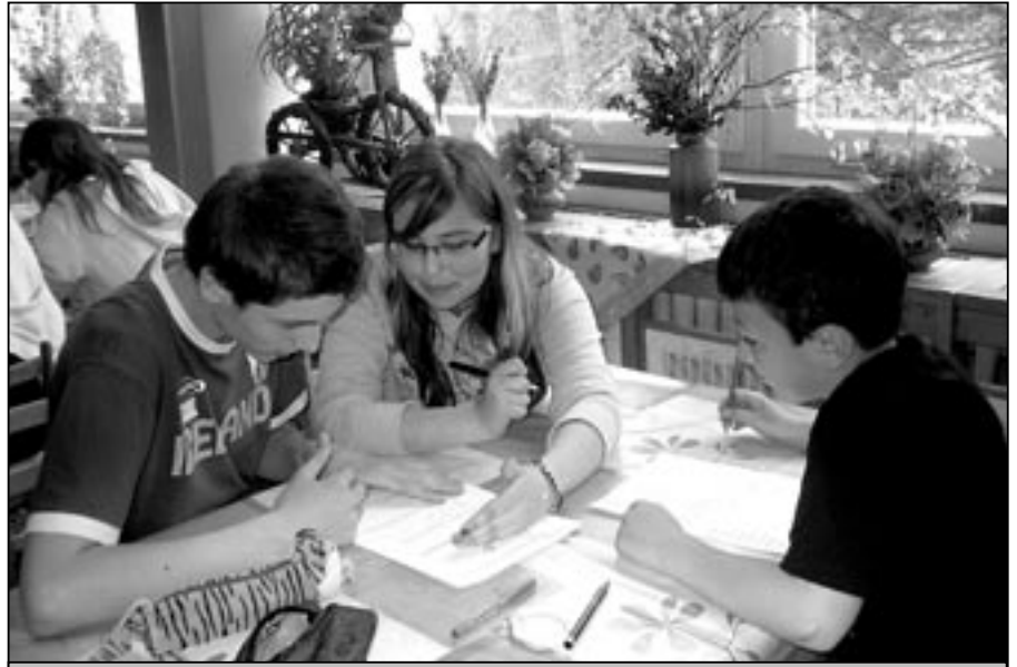
V rekreačním středisku Kopánky Mikulčín vrch proběhlo matematické soustředění žáků tříd 6. D a 8. D.