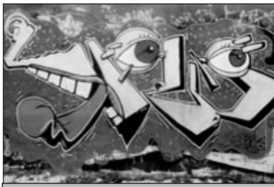
Také díla ulice, graffiti, si občas najdou cestu do galerií.