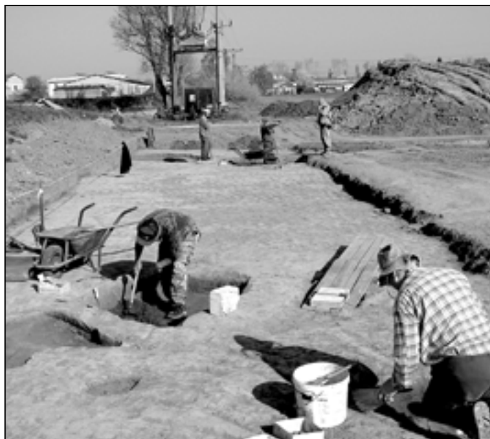
Celkový pohled na lokalitu průzkumu naší dávné historie.