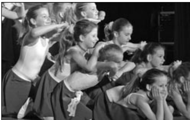
Děvčata z tanečního oboru ZUŠ si své vystoupení pěkně užívala.