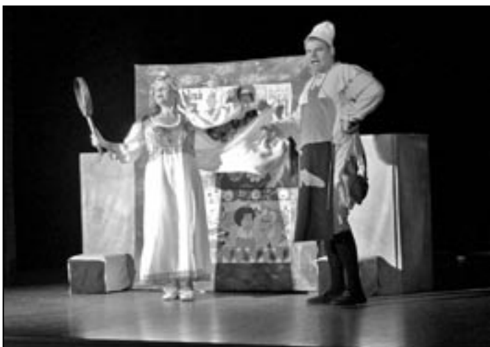
Pohádku Pyšná princezna zahráli dětem herci z divadélka s poetickým názvem „Rád Červených Nosů.“