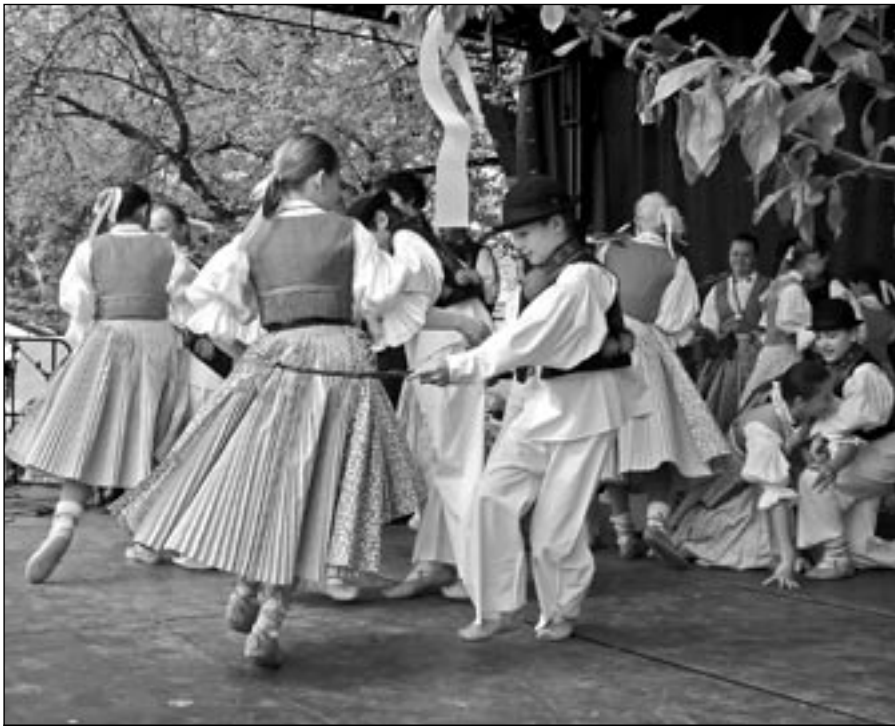
Dolinečka při „šlehačkovém“ vystoupení v Uherském Hradišti na Velikonočním jarmarku v neděli 24. dubna 2011.

Před více jak 50 lety se pomalu začala rozvíjet činnost národopisného kroužku při Základní škole ve Starém Městě. Děti se učily první taneční kroky, lidové písničky, nacvičovaly pásma.