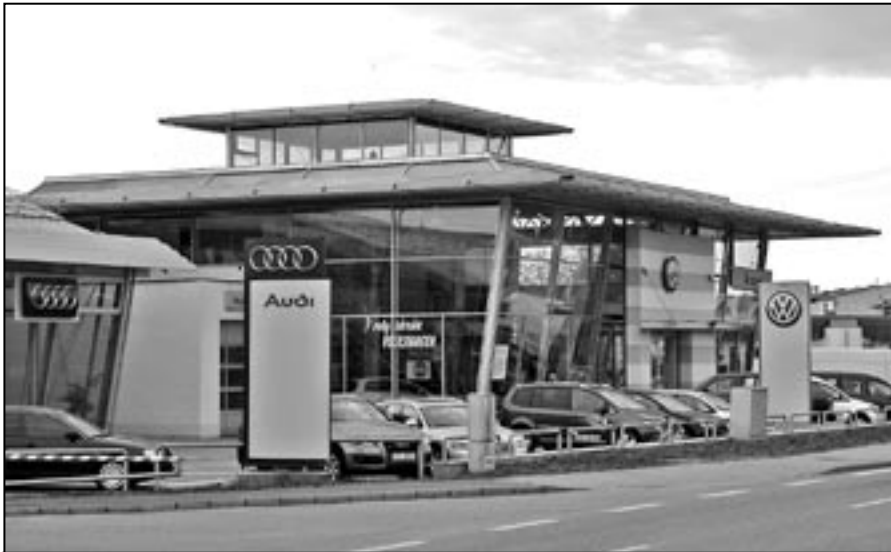
Staré Město lze nazvat městem autosalonů. I když u nás žije pouze 6.900 obyvatel, zájemce o nový vůz si zde může zakoupit osobní automobil značky Škoda, KIA, Volkswagen, Audi, Fiat i Chevrolet.