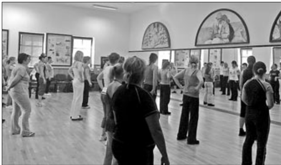
Cvičitelky Orla ze Starého Města se zúčastnily semináře v Kunovicích.