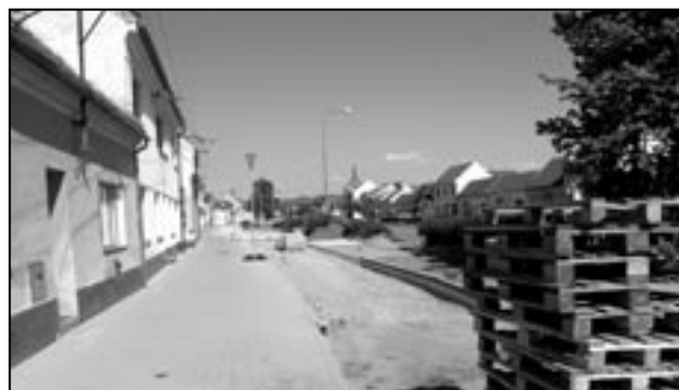
Již jen několik metrů zbývalo 12. května 2011 k dokončení pokládky zámkové dlažby na náměstí Hrdinů.

Na zasedání Zastupitelstva Zlínského kraje ve Zlíně a následně na zasedání Zastupitelstva města Staré Město byl schválen prodej obchodního podílu ve společnosti Školní hospodářství do majetku