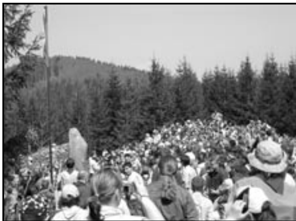
Na Ivančině se sešli skauti z celé Moravy.