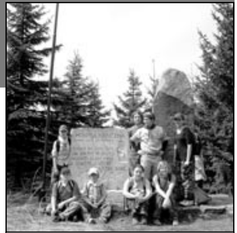
Staroměstští skauti u mohyly účastníků odboje.