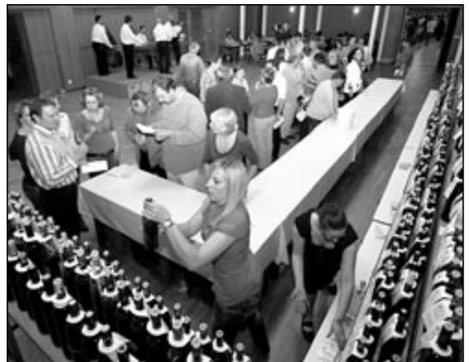
V divadelním sále SKK - sokolovny byla připravena kvalitní nabídka červených vín.

Veltlínské zelené (Batůšek + Příkryl 18,8), Veltlínské červené rané (Stanislav Švec 18,8), Neuburské (Virginio Sigismondi 18,9),