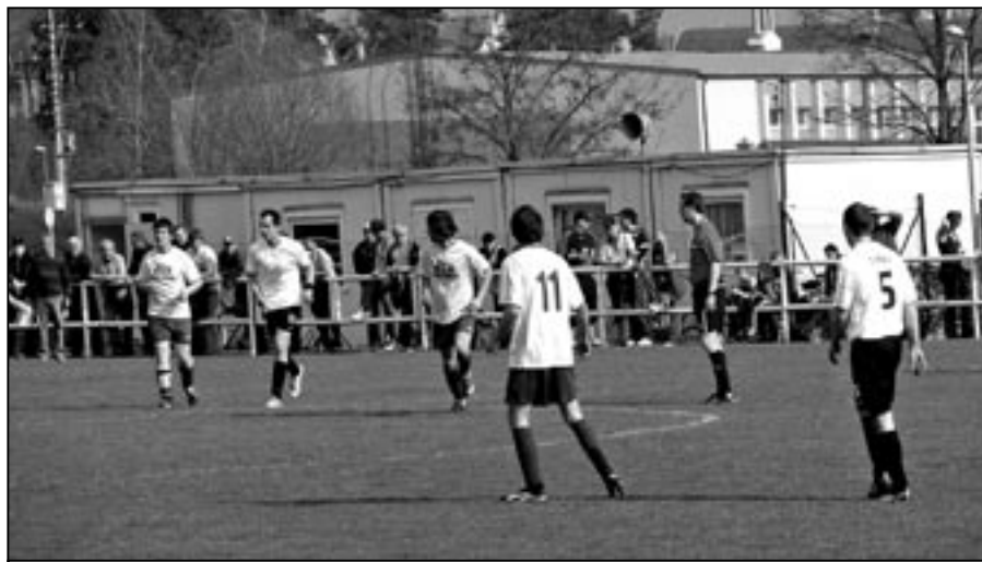
Fotbalisté TJ Jiskra Staré Město hrají svá utkání okresní soutěže ve sportovním areálu na Rybníčku.