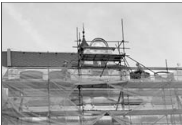
Oprava pravého křídla budovy radnice bude dokončena do poloviny června. Remeslníci obnovují původní historické detaily.