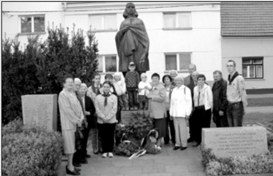
Čtyři generace účastníků z našeho města.