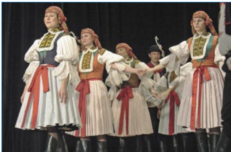
Děvčata ze souboru Dolina při vystoupení na Staroměstském dnu v roce 2009.