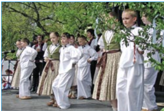
Dolinečka se velmi líbila divákům.

V Uherském Hradišti na Masarykově náměstí byl středem zájmu široké veřejnosti tradiční Velikonoční jarmark, který se uskutečnil v neděli 24. dubna 2011. Všichni návštěvníci se mohli započouvat do pestrého programu, který připravily obce mikroregionu Staroměstsko.