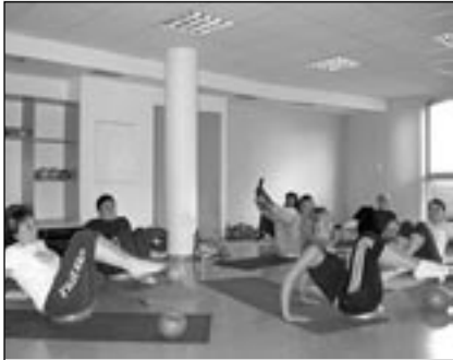
Cvičitelky na vzdělávacím semináři.