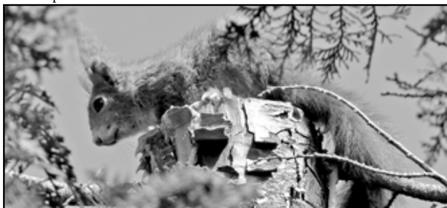
Veverka obvykle dorůstá 19 až 23 cm a dosahuje hmotnosti 250 až 340 g. Huňatý ocas má 15 až 20 cm dlouhý, používá ho nejen jako kormidlo při skocích na stromech, ale i jako pokrývku těla při spánku.