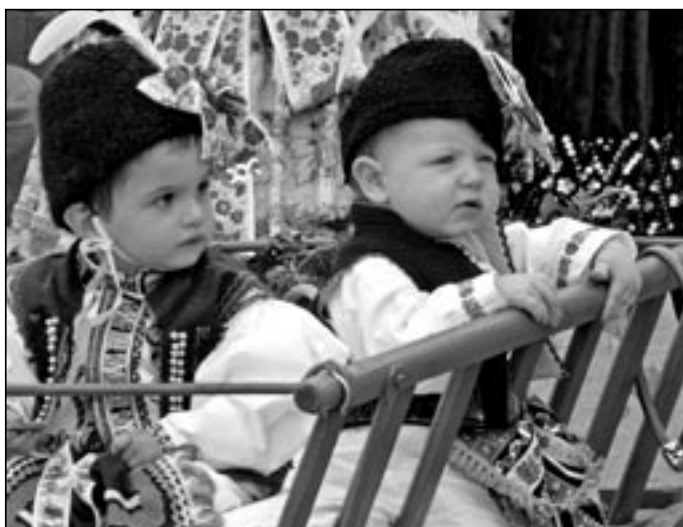
Dědávci a babičky, vaše starosti na naše hlavičky!

kem, který teď ve všech oborech rychle postupuje. Je třeba stále číst, chodit do knihovny, studovat, vyhledávat nové informace na internetu a mít zájem o všechno dění kolem. Čím delší bude náš zájem o vše nové, o to déle budeme mladými. Vždyť mnohý sedmdesátník je mladší třicátníka svou životní svěžestí, elánem a zájmem o novinky. Známe ženy padesátnice, které mají chůzi jako srna a sametově hebkou pleť, na rozdíl od některých otrávených a zamindrákovaných třicátnic, které svým vzhledem připomínají hroudu