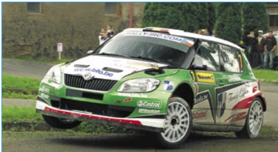
Nečekaný vítěz loňského ročníku Freddy Loix a Škoda Fabia S2000.