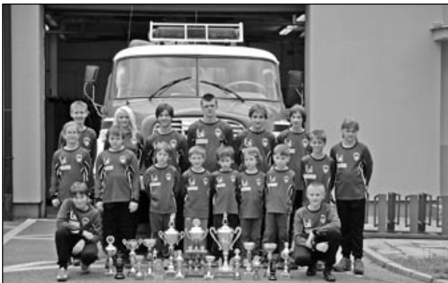
Kolektiv mladých hasičů před hasičskou zbrojnicí ve Starém Městě.

Na okresním kole hry Plamen ve Vlčnově jsme soutěžili s mladším i starším družstvem. Mladší družstvo skončilo na pátém místě. Starší družstvo si udrželo koncentraci po celou dobu soutěže a tím se umístilo celkově na druhém místě. Zajistilo si tak postup na krajskou soutěž Mladých hasičů v požárním sportu.