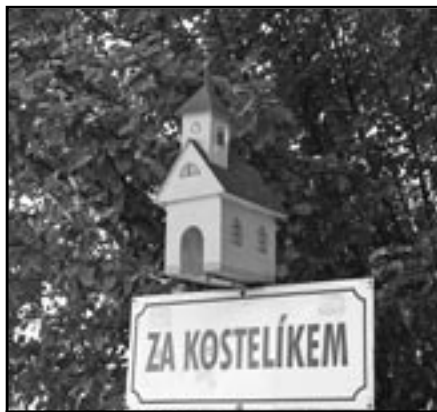
Maketa kostelíka sv. Víta, který stával až do konce osmnáctého století na rozcestí současných ulic Michalská a Svatovítská.