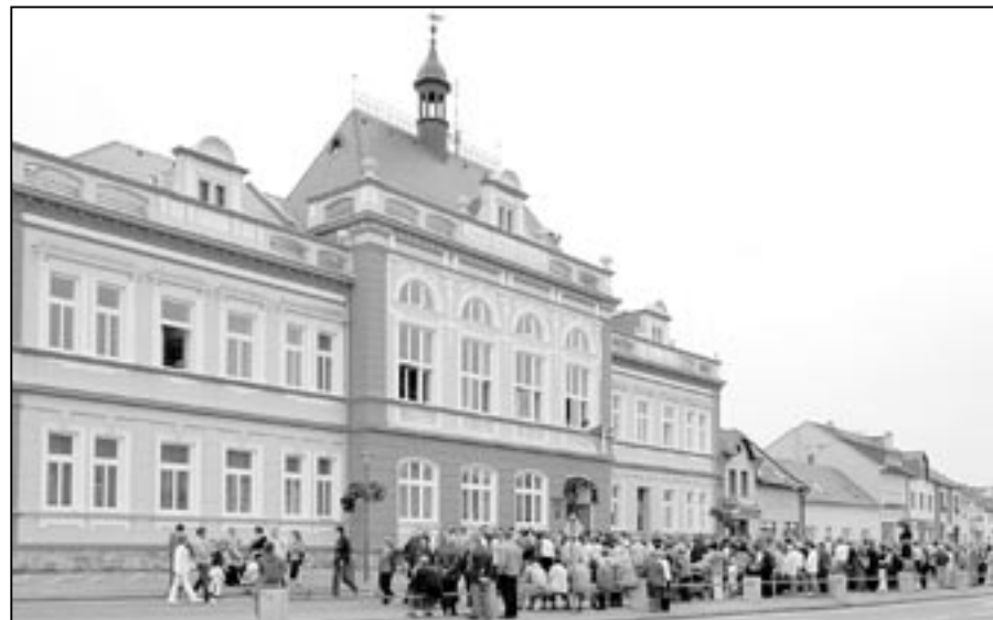
Radnice v hodovou sobotu 25. září 2010.