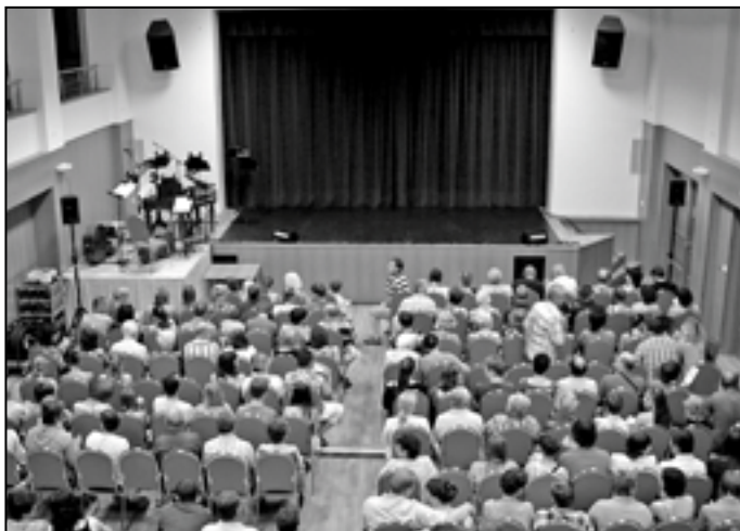
Již pět minut před začátkem představení souboru Ondráš byla všechna sedadla v přízemí, na balkoně i galerii obsazena.