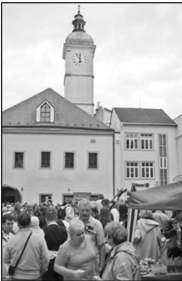
Program se uskuteční na nádvoří Staré radnice v Uherském Hradišti.