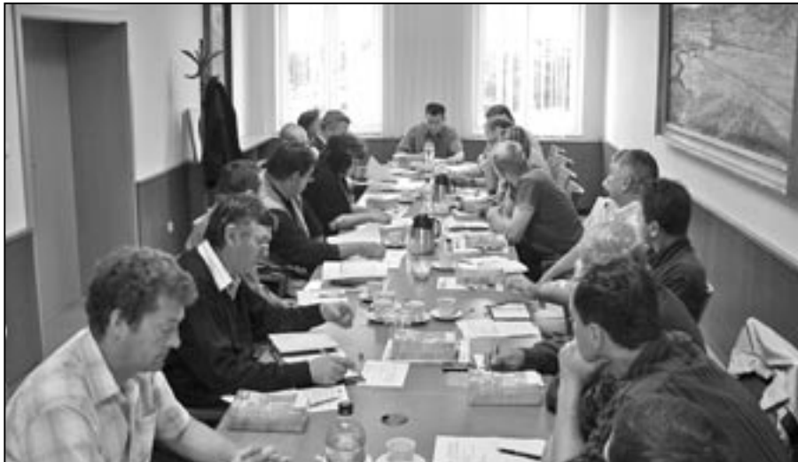
V úterý 26. července 2011 se uskutečnilo v zasedací místnosti radnice jednání zástupců mikroregionu Staroměstsko. V programu bylo schválení auditu, informace firmy DAT, účast mikroregionu na slavnostech vína a také informace o systému protipovodňové ochrany a o výběrovém řízení na dodavatele energií. Členy mikroregionu Staroměstsko jsou obce Babice, Boršice, Huštěnovice, Jalubí, Jankovice, Kostelany nad Moravou, Košíčky, Kudlovice, Nedakonice, Ořechov, Polešovice, Staré Město, Sušice, Traplice, Tučapy, Tupesy, Újezdec, Vážany a Zlechov.