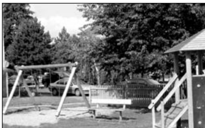
Dětské hřiště v Alšově ulici. Na připomínku občanů starosta zareagoval okamžitě a bylo zajištěna výměna písku na hřišti.