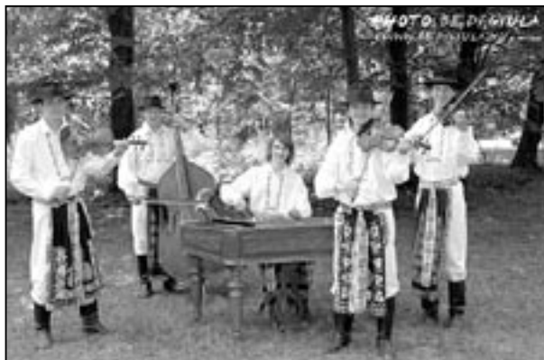
Při zájezdu v Maďarsku nás doprovázela cimbálová muzika Rubáš.

Celý měsíc jsem čekala a připravovala se na odjezd. No, a jak to vždycky dopadá? Určitě to znáte. Balení na poslední chvíli a pár věcí stejně zůstane doma. Musím se