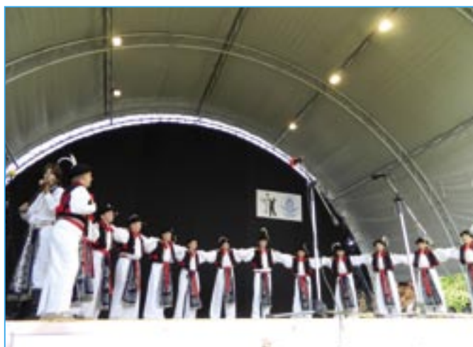
Dolinečka se velmi líbila i v městě Uszód.