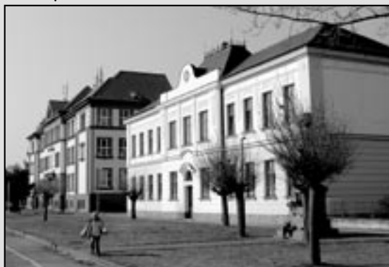
Budovy základních škol na náměstí Hrdinů mají pěkné barevné fasády.