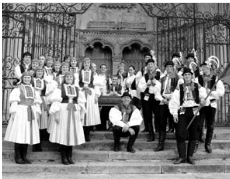
Chlapci a děvčata ze souboru Dolina a cimbálová muzika Bálašáci skvěle reprezentovali Staré Město při všech vystoupeních ve Francii.