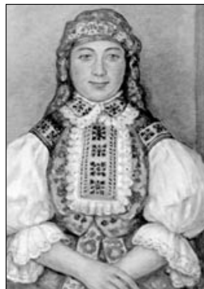
Děvče ve staroměstském kroji. Obraz od prof. Jana Slováčka