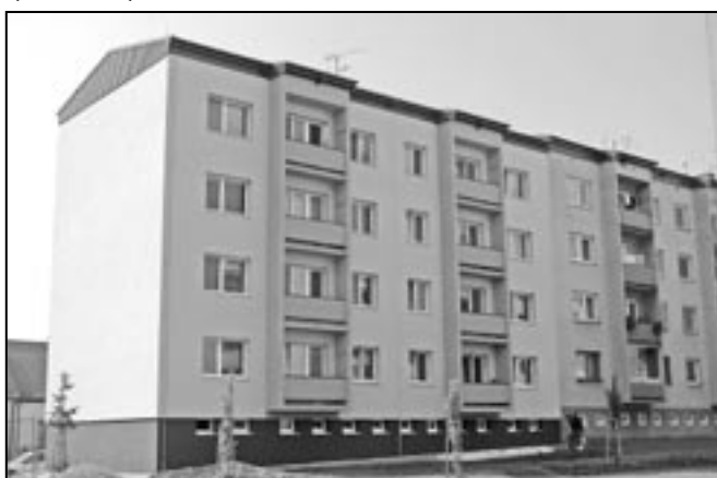
Bytové domy v Alšově a Úprkové ulici se mění k nepoznání. Mají nové zateplení a barevnou fasádu. Na snímku bytový dům v Alšově ulici.

ském Hradišti 9. - 11. září 2011. Slavnostním zahájením slavností byla letos poctěna Dolina. Soubory mikroregionu Staroměstsko budou vystupovat na tradičním místě na nádvoří Staré radnice. V neděli 11. září v 16:30 hod se koná na náměstí Velké Moravy ve Starém Městě Velkomoravský koncert, na kterém vystoupí Hradišťan a Spirituál kvintet. Pozvánky na obě akce najdete na str. 15.