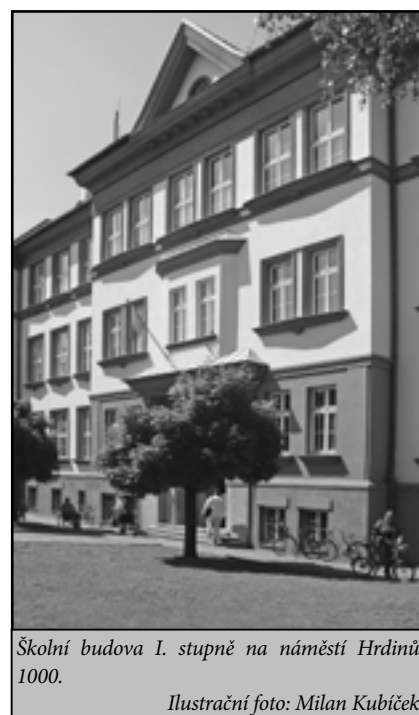
Školní budova I. stupně na náměstí Hrdinů 1000.