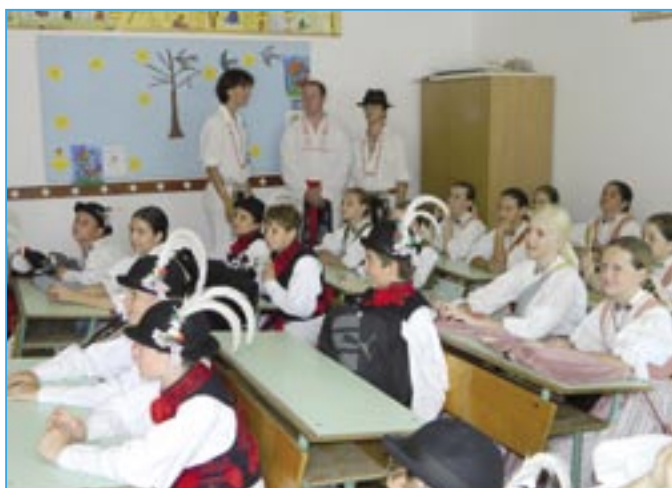
Děti při návštěvě učebny v základní škole v Géderlaku.