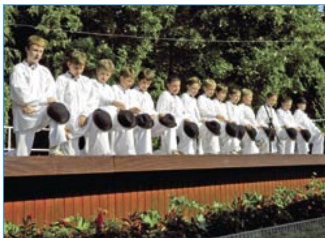
Chlapci zaujali publikum při představení v Géderlaku.