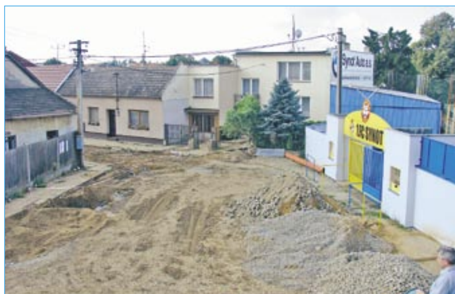
Prostranství před vchodem do fotbalového stadionu na Širůchu v době rekonstrukce Sportovní ulice dne 2. srpna 2011.