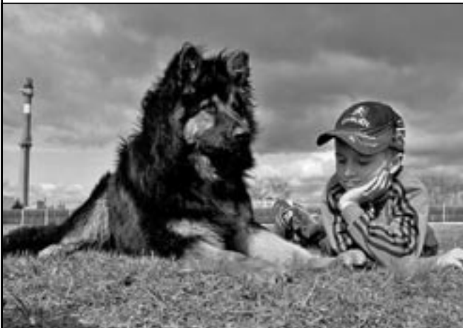
Chlapec se svým milovaným psem.