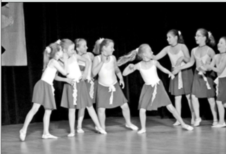
Děvčata si velmi oblíbily taneční obor základní umělecké školy.

Zahájení školního roku 2011/2012 ZUŠ proběhne ve čtvrtek 1. září 2011 v 16 hodin v prostorách Společensko-kulturního centra ve Starém Městě.