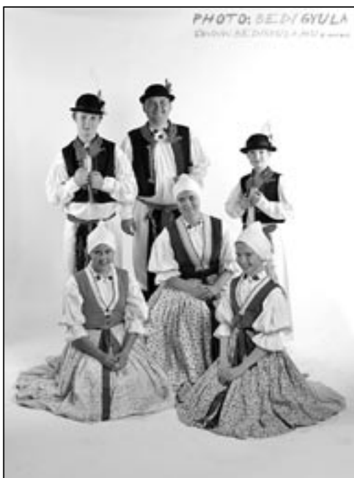
Starosta města Kalocsa je profesionální fotograf. Ve studiu Dolinečky pořídil několik snímků.

A co mě tak napadá za postřeh? Když jsme se rozhlíželi v jednom z místních zelinářství, všimli jsme si, že v Maďarsku je všechno větší než u nás. Půlmetrové mrkve, listy od kapusty, že bychom se s nimi přikryli, no a o hruďkách našich sympatických průvodkyň ani nemluvě... JB