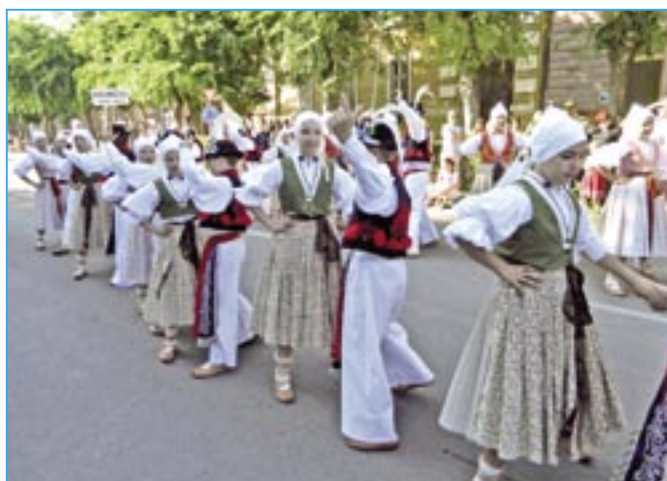
Dolinečka při průvodu souborů v městě Kalocsa.