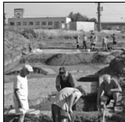
Desetičlenná skupina archeologů při práci v pátek 8. července 2011.