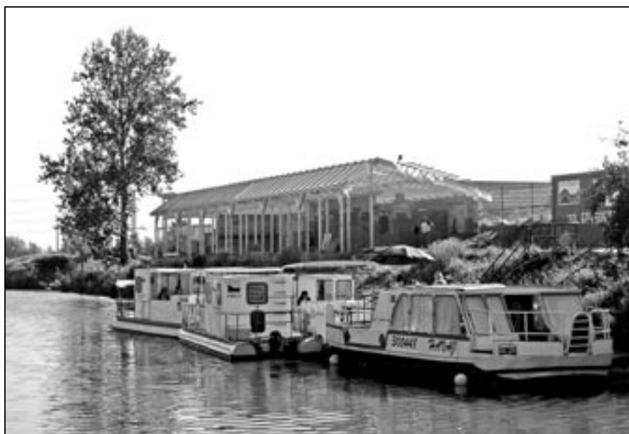
Přístaviště na Baťově kanálu mění svou tvář. V současnosti zde vyrůstá objekt, který bude poskytovat zázemí uživatelům služeb, nebude chybět i občerstvení.

3.2 mimořádný termín svatebního obřadu 5. 8. 2011.