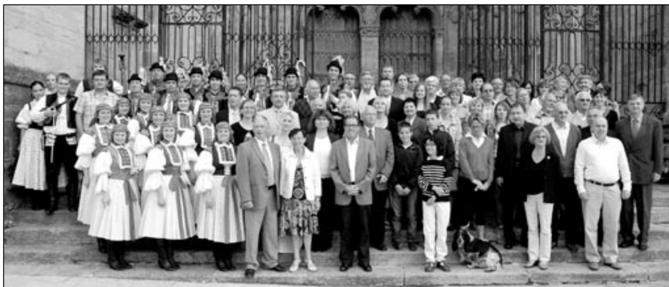
Fotografie účastníků delegace Starého Města společně s francouzskými představiteli před katedrálou v městě Sées.

„ Po intenzivní přípravě a doladování programu s francouzskou stranou, jsme dorazili na místo ve čtvrtek 7. července v podvečer. Staré Město bylo zastoupeno 30 účastníky tzv. „oficiální delegace“, kterou tvořili jak zástupci města, tak především spoluobčané, kteří se při minulé návštěvě aktivně podíleli na ubytování