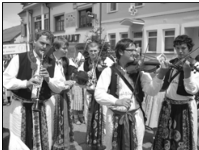
Cimbálová muzika Bálašáci se velmi líbila divákům.