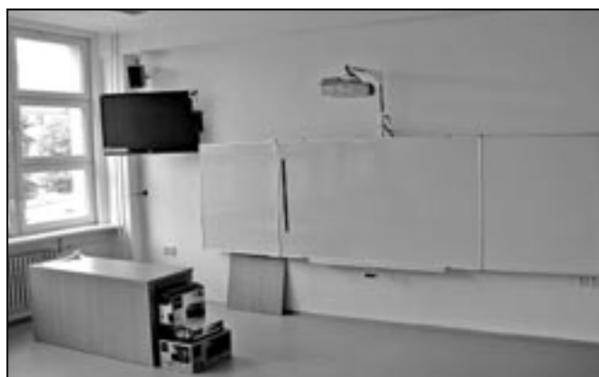
Z pohledu techniky nejvíce inovací do školního zařízení přinesou instalace nových počítačových učeben a interaktivních tabulí. Na snímku jazyková učebna v budově ZŠ Komenského.