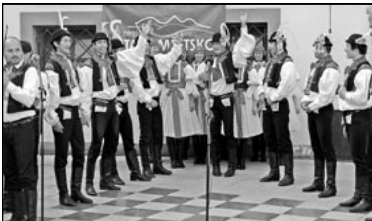
Folklorní soubor Dolina při vystoupení na Slováckých slavnostech vína.

Předprodej vstupenek od 1. září 2011 v Městské knihovně - Informačním centru Staré Město, tel.: 572 541 009, E-mail: knihst mesto@uh.cz