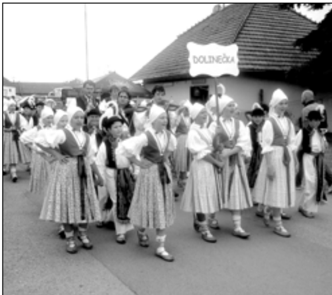
Dolinečka při průvodu folklorních souborů v Kunovicích.