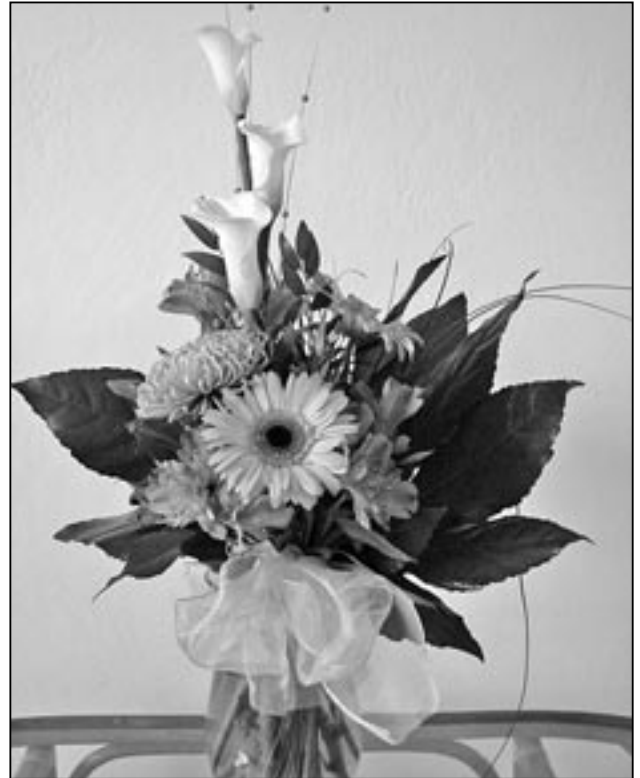
Kytice květů pro všechny Marušky.