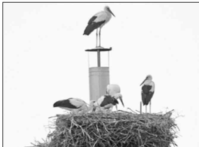
Kompletní čapí rodinka na hnízdě v Klukově ulici. Poznáte dva dospělé a tři mladé čápy?