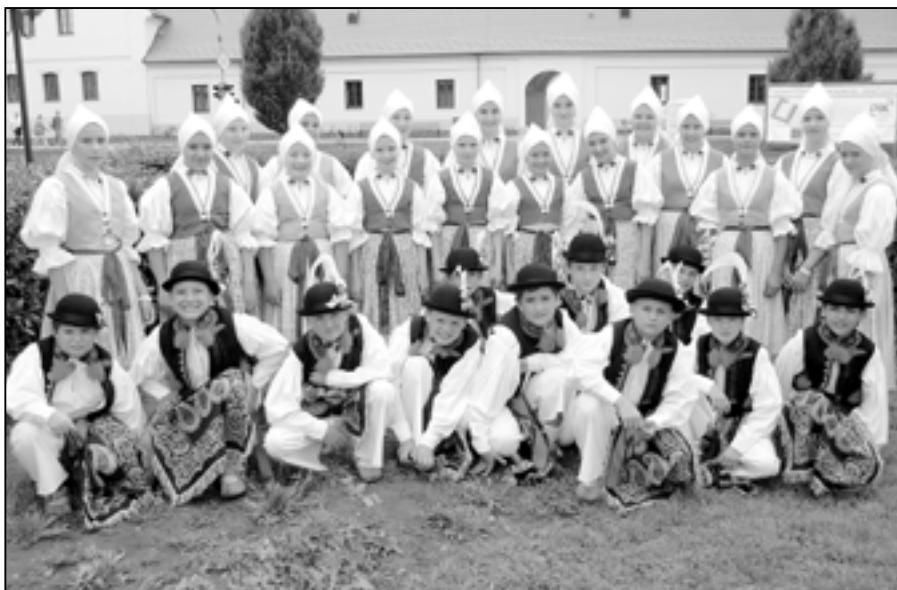
Společná fotografie v centru Kunovic.

Pozn. redakce: O cestě Dolinečky za svými kamarády do Maďarska si přečtěte na straně 26.