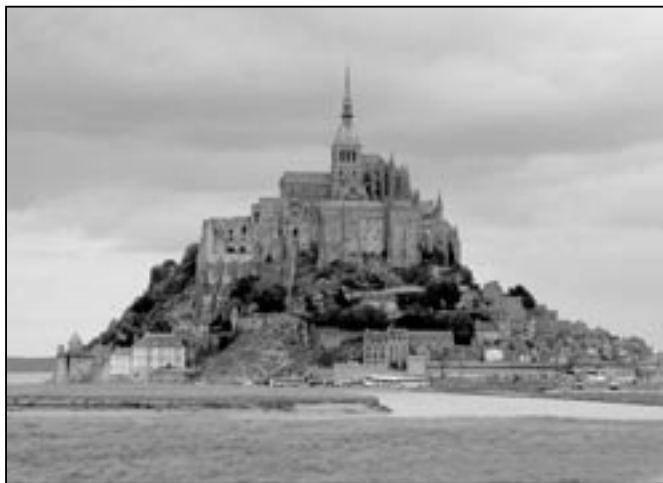
Opatství Mont Saint-Michel.