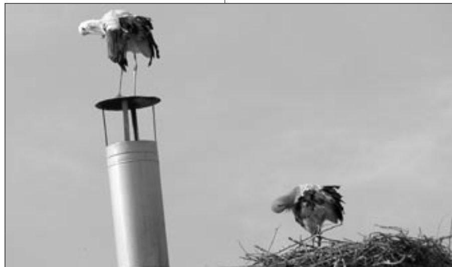
Čápi na komíně v Klukově ulici, aneb, když dva dělají totéž.