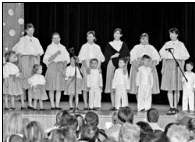
Maminky s dětmi z Rodinného centra Čtyřlístek při vystoupení ve Společensko-kulturním centru ve Starém Městě.