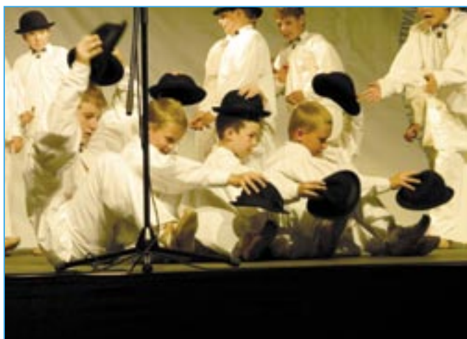
Šohajičci předvedli Klobúkový tanec divákům v městě Kalocsa.