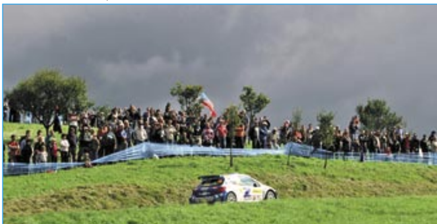
Atmosféra loňské barumky hodně připomínala letošní léto.

Příští číslo Staroměstských novin vyjde 27. září. Uzávěrka je 19. září 2011.