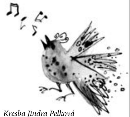
Kresba Jindra Pelková