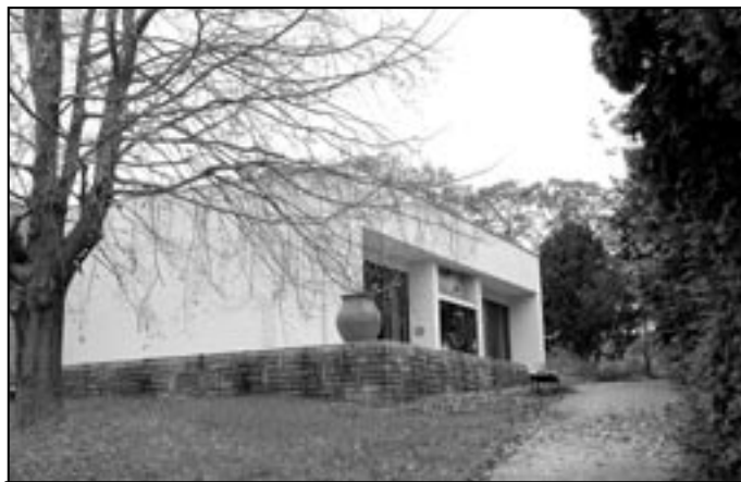
Průvodci z Památníku Velké Moravy ve Starém Městě zvou k návštěvě všechny občany našeho města, především děti a mládež. Otevřeno mají denně od 9 do 17 hodin, včetně pondělí, s krátkou polední přestávkou.