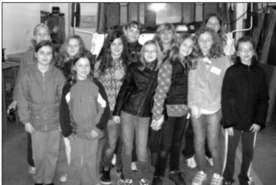
Společná návštěva v hasičské zbrojnici.

„Letošní Noc s Andersenem byla pěkná. Ze začátku jsme si vyrobily jmenovku a povídaly si o Václavu Čtvrtkovi. Navštívily jsme hasičskou zbrojnici. Tady nám ukázali všechny věci, které se potřebují k hašení. Jak jsme došly zpět do knihovny, byla krátká přestávka. Potom jsme se naučily tančit country tanec. Vyráběly jsme si čepičku Křemílka. První jsme ji sprejovaly, potom jsme ji šily. Kreslily jsme kytičku, mašličky a oblíbené postavy na Čtvrtkovník. Potom jsme se rozdělily do tří skupin po čtyřech a hledaly jsme dušičky. V nich byly lístečky a ty jsme měly složit.. Po-