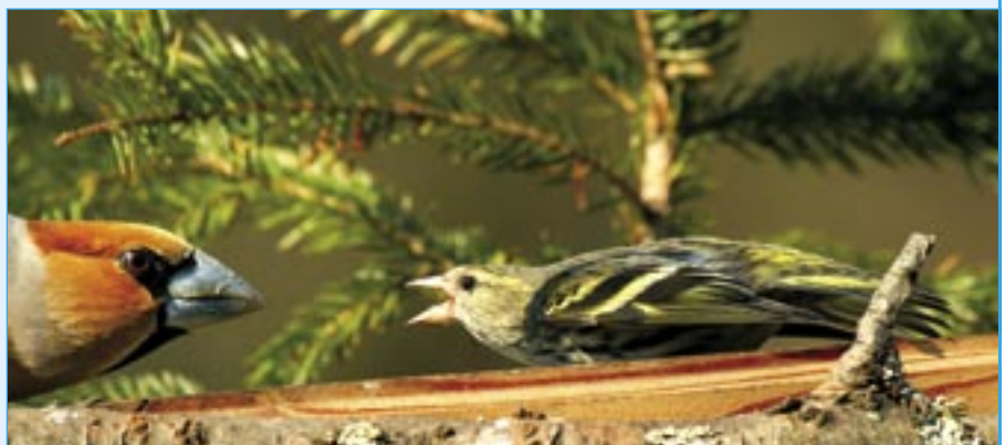
Nejmenšího na krmítku, čížka lesního, nevyžene od oběda ani pětikrát větší dlask.