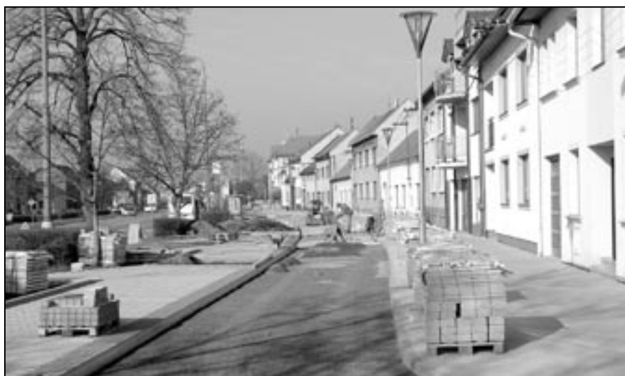
Pracovní četa firmy STAVAKTIV s. r. o. pokračuje v dláždění střední části náměstí Hrdinů.

Dolina, soubor písní a tanců Staré Město - 60.000,- Kč