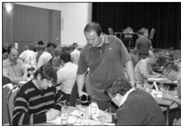
Na snímku účastníci hodnocení vín ve Starém Městě v loňském roce.