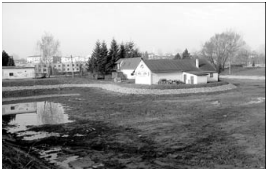
Vypuštěný rybníček na Širůchu dne 24. března 2011. Začátkem letošního roku zde probíhaly nutné opravy včetně zpevnění břehů a vybagrování nánosů bahna.

Věcné břemeno spočívá v právu zřízení a provozování zařízení distribuční soustavy spočívající v umístění nového