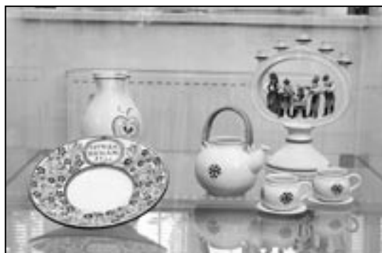
Přijďte se podívat do Centra péče o tradiční lidovou kulturu. Čeká na vás pestrá nabídka sortimentu vycházejícího z tradiční lidové výroby.