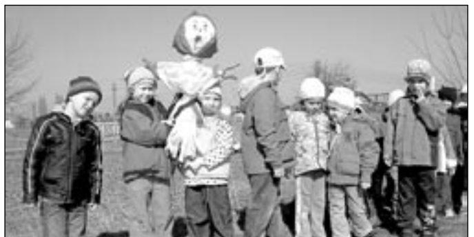
Jaro v naší mateřské škole v ulici Za Radnicí vítáme vynášením Moreny.