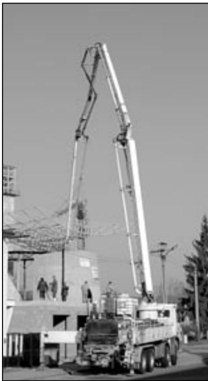
Nezvyklý pohled se naskytl přítomným na Velkomoravské ulici dne 30. března 2011, kde pracovníci stavební firmy prováděli betonáž na stavbě rodinného domu na rozcestí Velkomoravské a Jezuitské ulice.