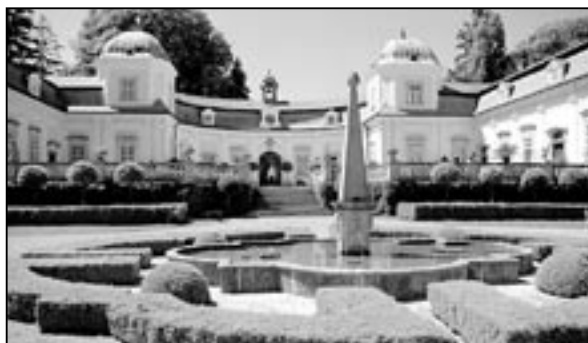
Zámek Buchlovice je častým místem výletů mnoha Staroměstšanů.