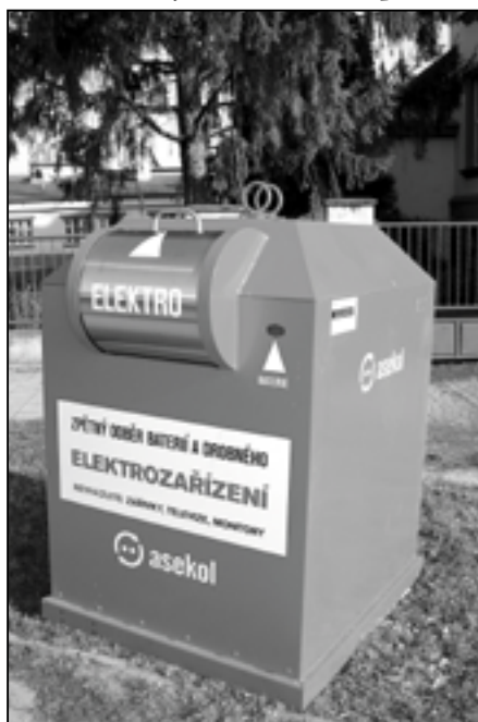
Na snímku kontejner červené barvy pro zpětný odběr baterií a drobného elektrozařízení, který je umístěn na náměstí Hrdinů u novinového stánku před základní školou.

Alena Pluhařová, odbor správy majetku a životního prostředí