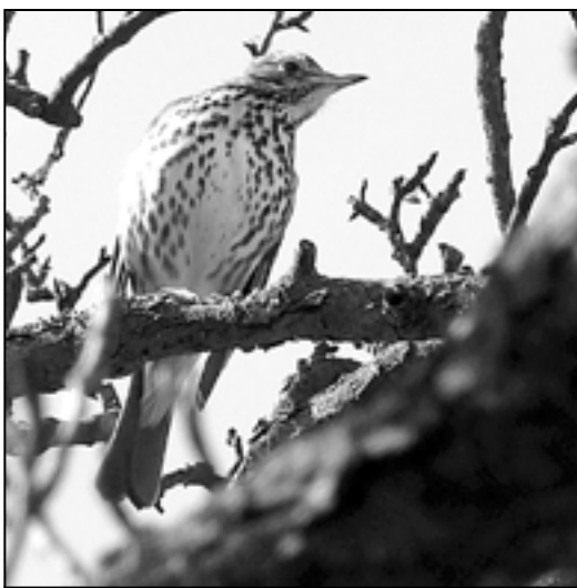
Drozd zpěvný patří mezi nejvytrvalejší a nejznámější pěvce. Usadí se na nejvyšší pozorovatelně v okolí a předvádí svůj pěvecký um, který je nepřekonatelný.