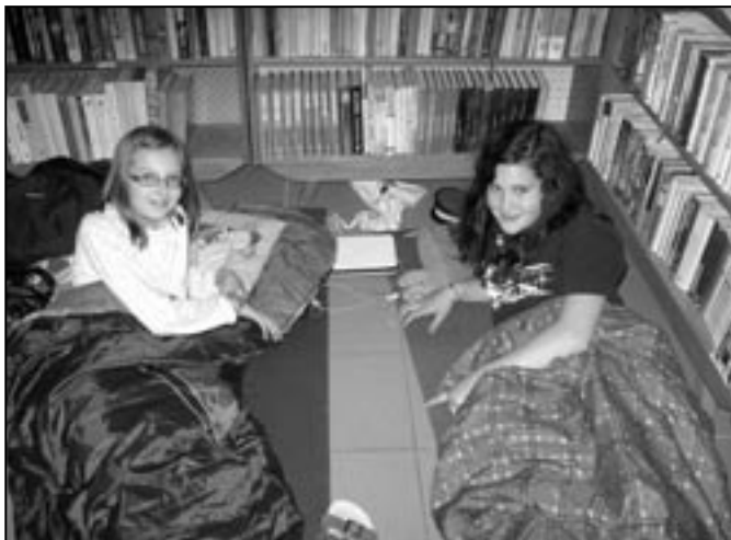
Letošní Noc s Andersenem se sice konala na apríla, ale všechny děvčata byly v pohodě.

„Dne 1. 4. 2011 jsem šla spát do knihovny. Začaly jsme seznamovací hrou. Dál si