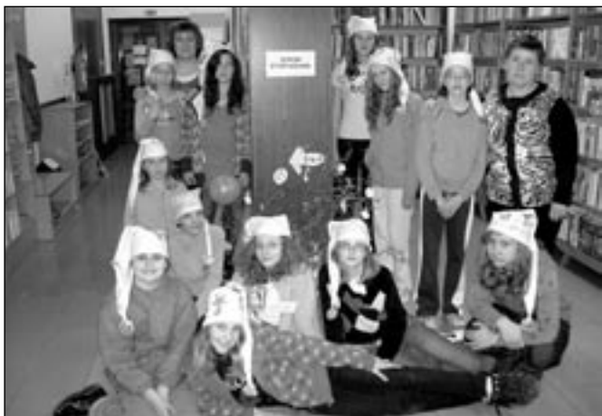
Dívky prožily pěkný večer i noc v městské knihovně v ulici Za Radnicí.