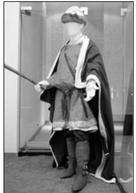
Kníže Mojslav, fiktivní panovník z období Velkomoravské říše, vás provede modernizovanou expozicí Památníku Velké Moravy.