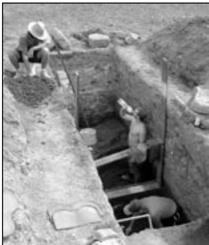
Vykopávky v blízkosti památníku Velké Moravy 27. srpna 2009.