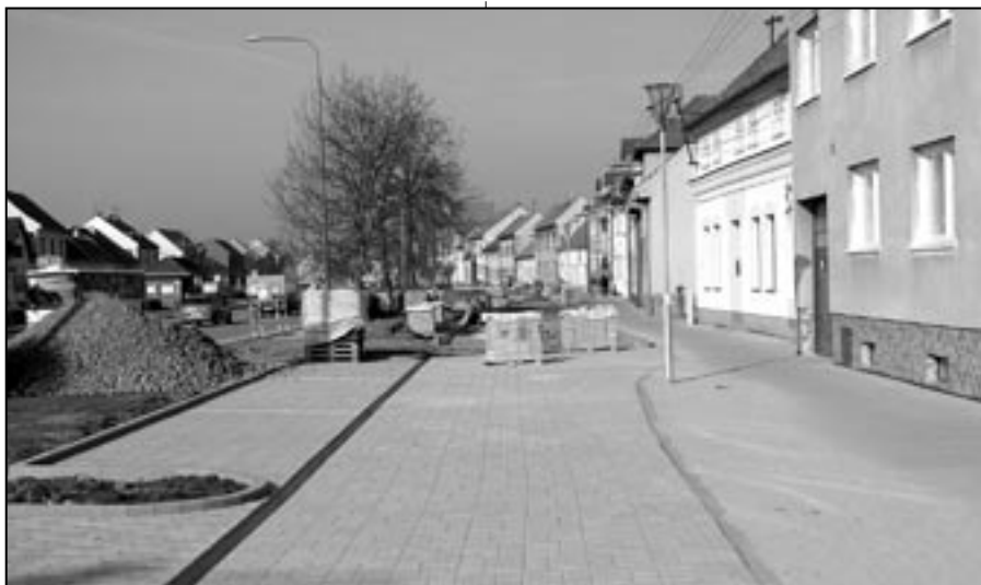
Koncem března bylo dokončeno vydláždění první části komunikace na severní straně náměstí Hrdinů ve směru od světelné křižovatky.