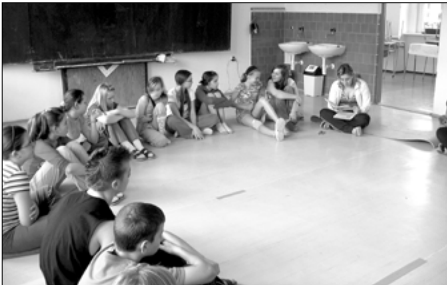
V pátek 1. dubna 2011 se pětadvacet šestáků zúčastnilo „Noční výpravy do světa pohádek.“