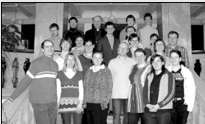
Mladí Orli se setkali s arcibiskupem Mons. Janem Graubnerem.