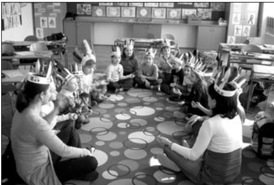
Indiáni v první třídě základní školy.