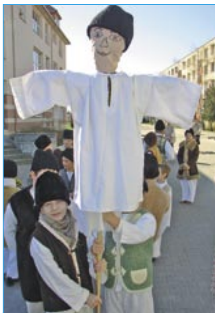
Ve Starém Městě máme specialitu. Dívky nevynášejí pouze symbol zimy Mařenu, ale zapojují se i chlapci, kteří se rozloučí s Mařákem.

Ve Starém Městě jsem jako kronikář města absolvoval již nespočet loučení s Mařenou, ale letošní rok byl rekordní, když přišlo 102 krojovaných. Překonali