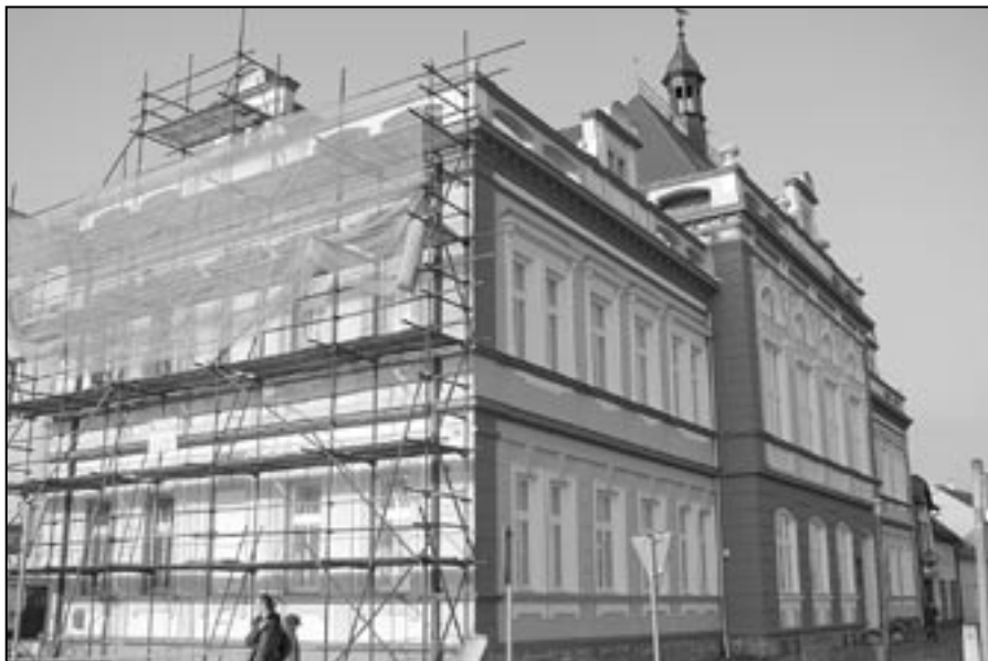
Radnice se opět zahalila lešením dne 25. března 2011. Během příštích týdnů bude dokončena oprava fasády pravého křídla budovy městského úřadu.

- Smlouvu č. 10063593 o poskytnutí podpory ze Státního fondu životního prostředí ČR v rámci Operačního pro-