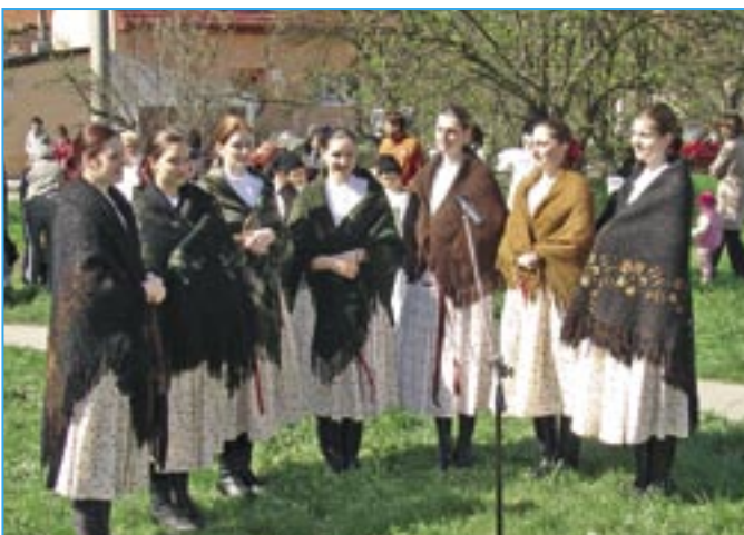
Dívčí sborek Repetilky obohatil vystoupení u Salašky.