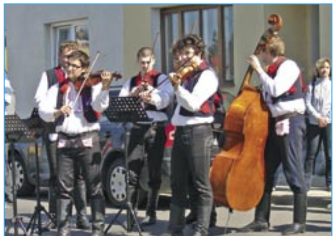
Cimbálová muzika Bálašáci se postarala o hudební doprovod.