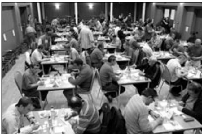
Vzorky se budou hodnotit dvacetibodovou stupnicí v pondělí 9. května 2011.

K poslechu bude hrát cimbálová muzika Dolina. Zpestřením výstavy bude nehodnocená ochutnávka zahraničních, přírodně sladkých vín.