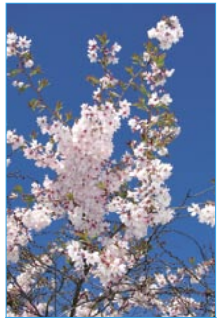
Kvetoucí sakury na náměstí Hrdinů.