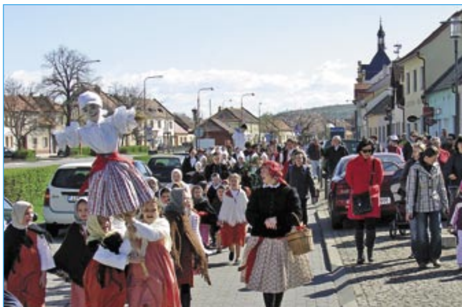
V průvodu na náměstí Hrdinů jsme napočítali 102 krojovaných a více než 220 členů doprovodu a příznivců lidových tradic.