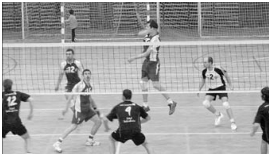
Volejbalisté VSK Staré Město při zápase s Dobřichovicemi v pátek 25. února 2011, který vyhráli 3:1 (-22, 15, 20, 15).

Kozoroh – trpělivost vám může přinést růže, ale pozor! Ať na vás čert neušije plachtu. Jenom nehleďte na svět jako kyselá zelí. Raději si kupte pikantní beraní rohy.