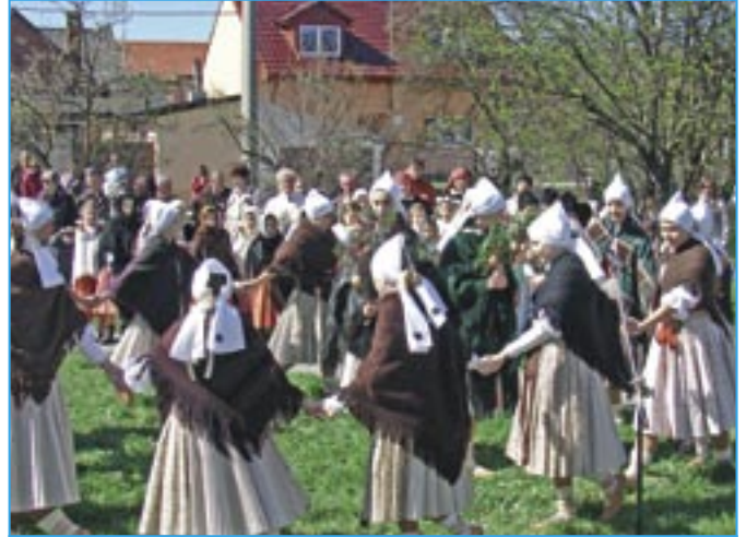
Děvčice tančí kolem symbolu „létěčka“, což je malý smrček, na němž jsou zavěšeny ozdoby, u nás většinou vyfouknutá vejce.