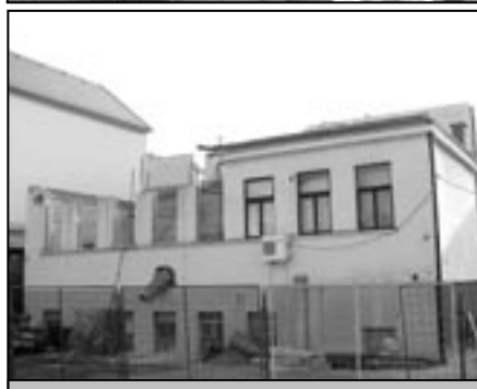
Poznáváte torzo bývalé budovy České pošty v sousedství radnice? Koncem března zde probíhaly bourací práce a následovat bude rekonstrukce objektu na bytové jednotky.