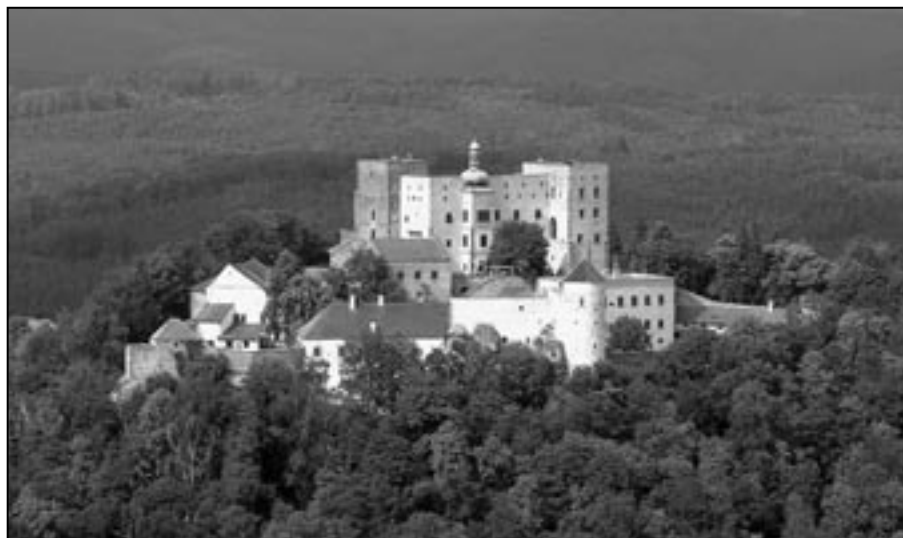
Hrad Buchlov byl založen ve 13. století jako jeden z nejstarších hradů u nás. V roce 1645 o jeho dobytí marně usilovali Švédové.