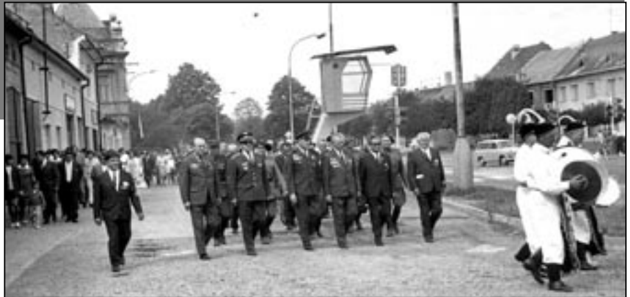
Na snímku průvod k odhalení památníku v Hradištské ulici ve Starém Městě dne 2. září 1973.

V městech a na vesnicích byly postaveny památníky a položeny pamětní desky, připomínající oběti obou světových válek, účastníky všech druhů odboje ve vlasti i v zahraničních složkách čsl. armády.