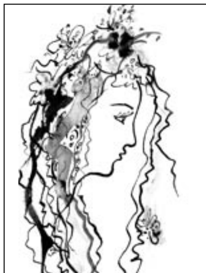
Kresba Jindra Pelková