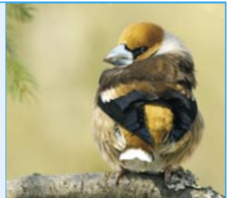
Otoč se prosím tě dozadu, sedí tam papoušek Kakadu.

Když se podíváte na tu ptačí nádheru na snímcích, tak vám bude určitě velmi líto, že dlask tlustozobý se dožívá v přírodě jen dvou až pěti let. Hnízdí pouze jednou ročně, v květnu a červnu. Samice snáší 4-5 vajec, sedí na nich necelé dva týdny a samec přináší potravu. Potom ještě dva týdny krmí mláďata. Rozlouskne i nejtvrší brouky. Je specialista na rozlouskávání jader třešní a trnek. Ale mějte se před ním na pozoru! Když je ohrožen, brání se klováním, může v zobáku vyvinout tlak 45 kg a bez námahy kousne až na kost.