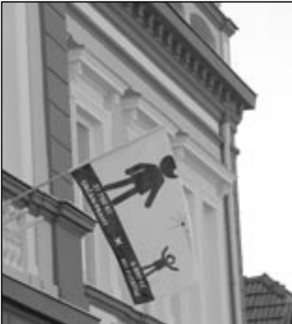
Na budově radnice zavlála od 1. listopadu 2011 protestní černobílá vlajka se vzkazem vládě České republiky. Oproti velkým městům jsou menší města a obce diskriminovány ve výši přidělených finančních prostředků na jednoho obyvatele.

V pondělí 7. listopadu 2011 jsem opět vyjel do terénu se starostou Josefem Bazalou. Naším cílem byla kontrola všech investičních akcí na území Starého Města, dále kontrola úklidu města ve veřejných prostorech a také zastavení s občany, kteří se vždy svěřují se svými problémy a starostmi. Ne všem může starosta pomoci, někteří lidé trpí nedostatkem finančních prostředků, když si v minulosti nabrali množství půjček, které po ztrátě zaměstnání nebo nemoci nedokážou splácet. Zvláště líto je nám především lidí, kteří pracují, ale zaměstnavate-