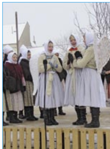
Děti z Dolinečky při vystoupení na pódiu u radnice.