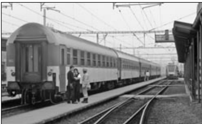
Na snímku rychlík do Prahy, na konci soupravy je zařazen vůz 1. třídy.