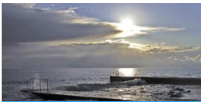
Podzimní západ slunce po bouře nad Istrií. Foto: Vladimír Kučera 6 x