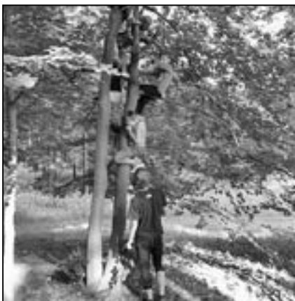
Šplh na stromě? Žádný problém!

(více fotografií z tábora si můžete prohlédnout na webovém albu Picasa přes: http://www.h-dvojka.cz )