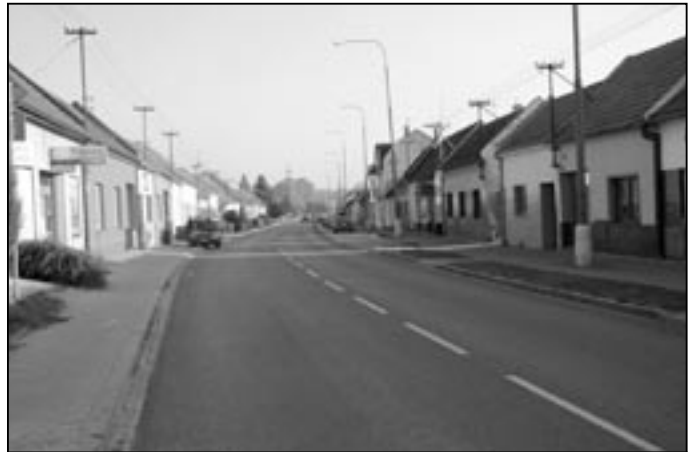
V pěší korzo se proměnila Huštěnovská ulice byla od 15. září do 15. listopadu 2011. V této době probíhala náročná rekonstrukce silnice I/55 v Huštěnovicích a doprava ve směru do Zlína byla vedena objížďkou přes Bílovice a Napajedla.