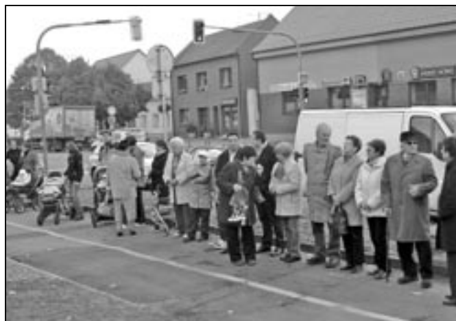
Účastníci oslavy 93. výročí vzniku Československa.