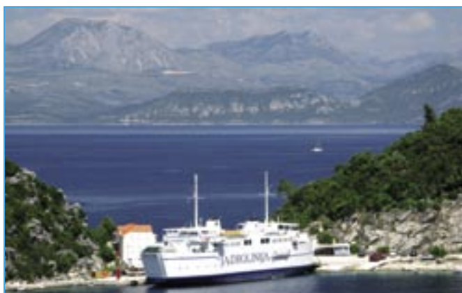
Sobra je trajektovým přístavem na ostrově Mljet. Na ostrově se nachází národní park se dvěma slanými jezery a klášterem na ostrůvku ve velkém jezeře. Mljet je nejižnější a nejzelenější chorvatským ostrovem.