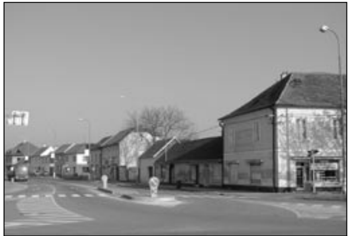
Velkomoravská ulice prochází centrem města a začátkem listopadu zde byla dokončena výstavba nových chodníků.

V ulici Za Radnicí byla 1. listopadu zahájena oprava chodníku, který byl posunut ve směru k bytovce a na přilehlém prostoru pak bude vybudováno parkoviště pro devět