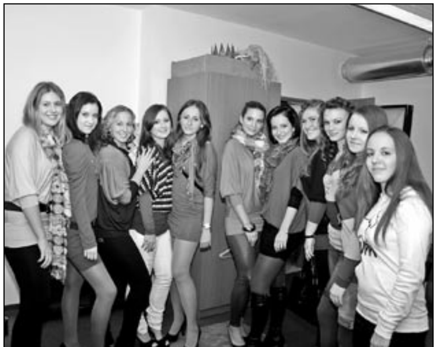
Modelky a moderátorky nám společně zapózovaly. Viděli jsme úžasné vypasované modely s hezkými vzory, půvabně oblečení v ležérním stylu i klasické dámské oblečení. Obdivovali jsme účesy modelek, jejich příjemně vonící kosmetiku i ladnou chůzi mladých dam.