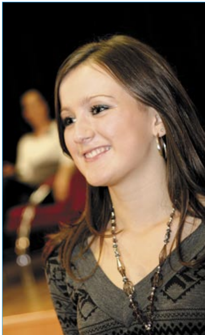
Pěkné oblečení doplní vkusný šperk.