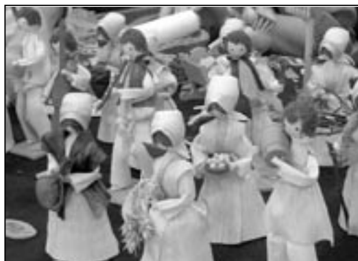
Nádherné postavičky z kukuřičného šustí.