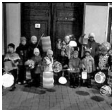
Společné foto před procházkou.