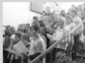
Pěvecký sbor školy při vystoupení na jarmarku v roce 2010.

Na Vaši návštěvu se těší žáci i učitelé.