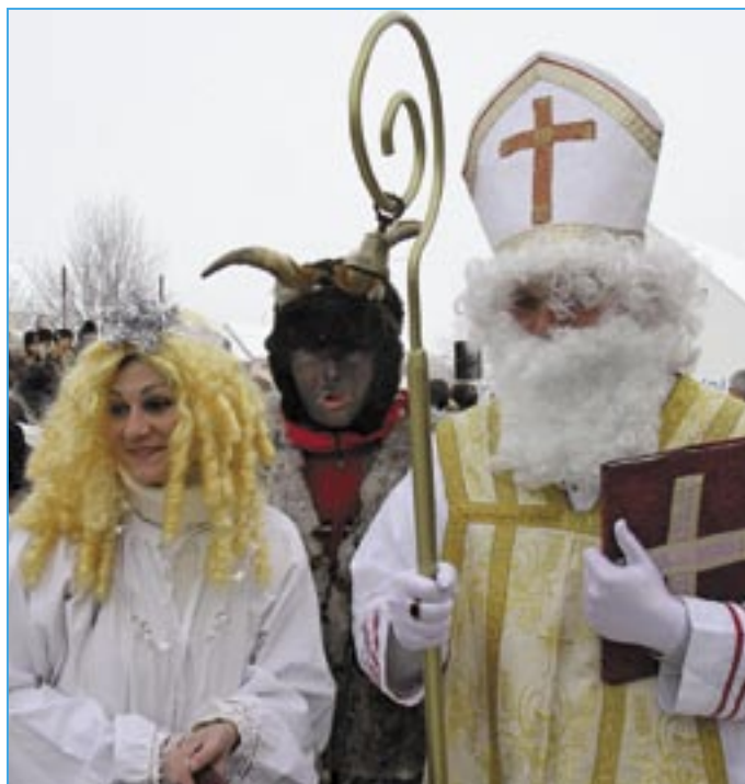
Samozřejmě nebude chybět Mikuláš, anděl a čert.