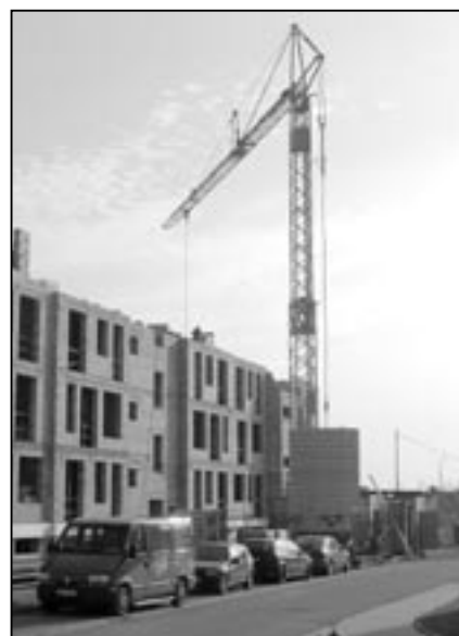
Bytový dům na konci sídliště Alšova, Uprkova opět pořádně povyrostl.