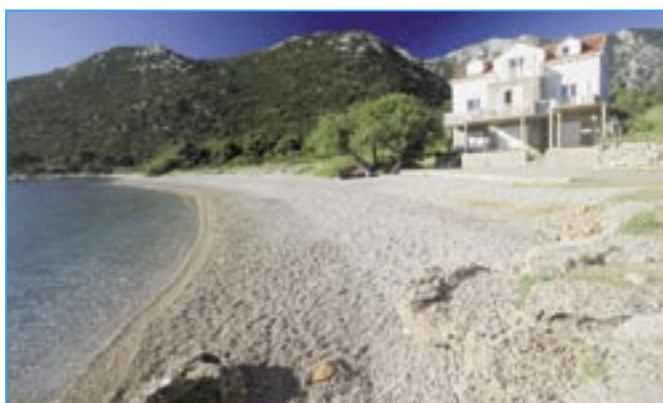
Pláž Duba Pelješka se nachází na severní straně poloostrova Pelješac. U 300 metrů dlouhé oblázkové pláže je pouze jeden apartmánový dům a tak je tu oáza naprostého klidu.