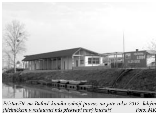
Přístaviště na Baťově kanálu zahájí provoz na jaře roku 2012. Jakým jídelníčkem v restauraci nás překvapí nový kuchař?