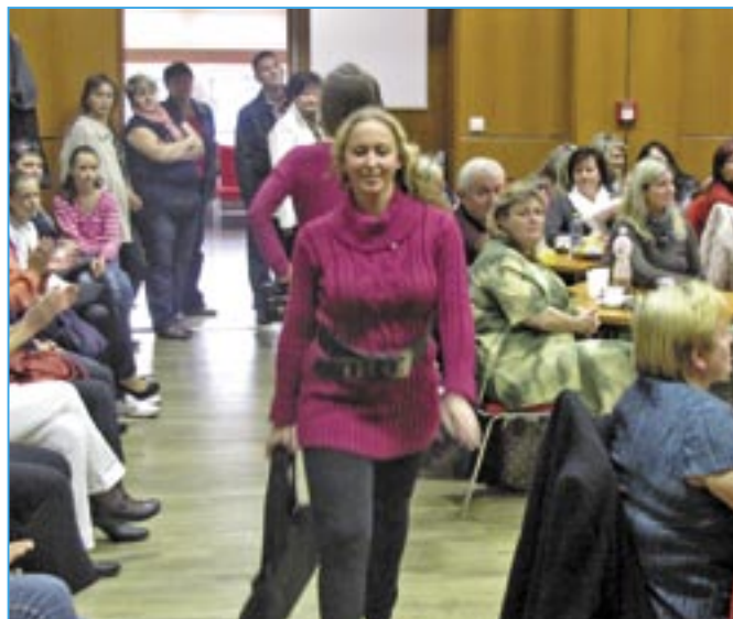
Pletená móda je vhodná pro nastávající zimu.