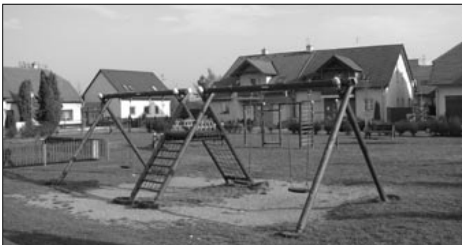
Hřiště v Luční čtvrti je v současnosti bez části hracích prvků, které budou přes zimu opraveny. Na jaře přibudou nové atrakce pro děti.