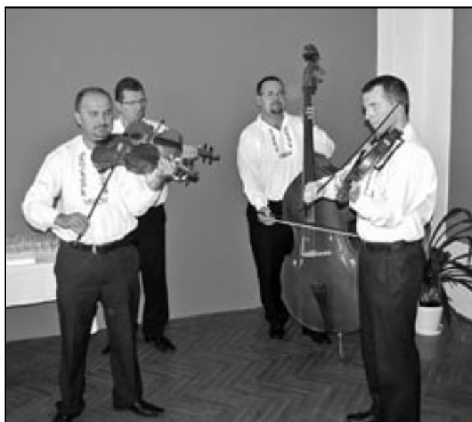
Zahrála a o dobrou pohodu v sále se postarala muzika souboru Dolina.