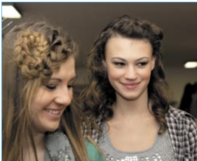
Krásně upravené vlasy jsou korunou ženy.