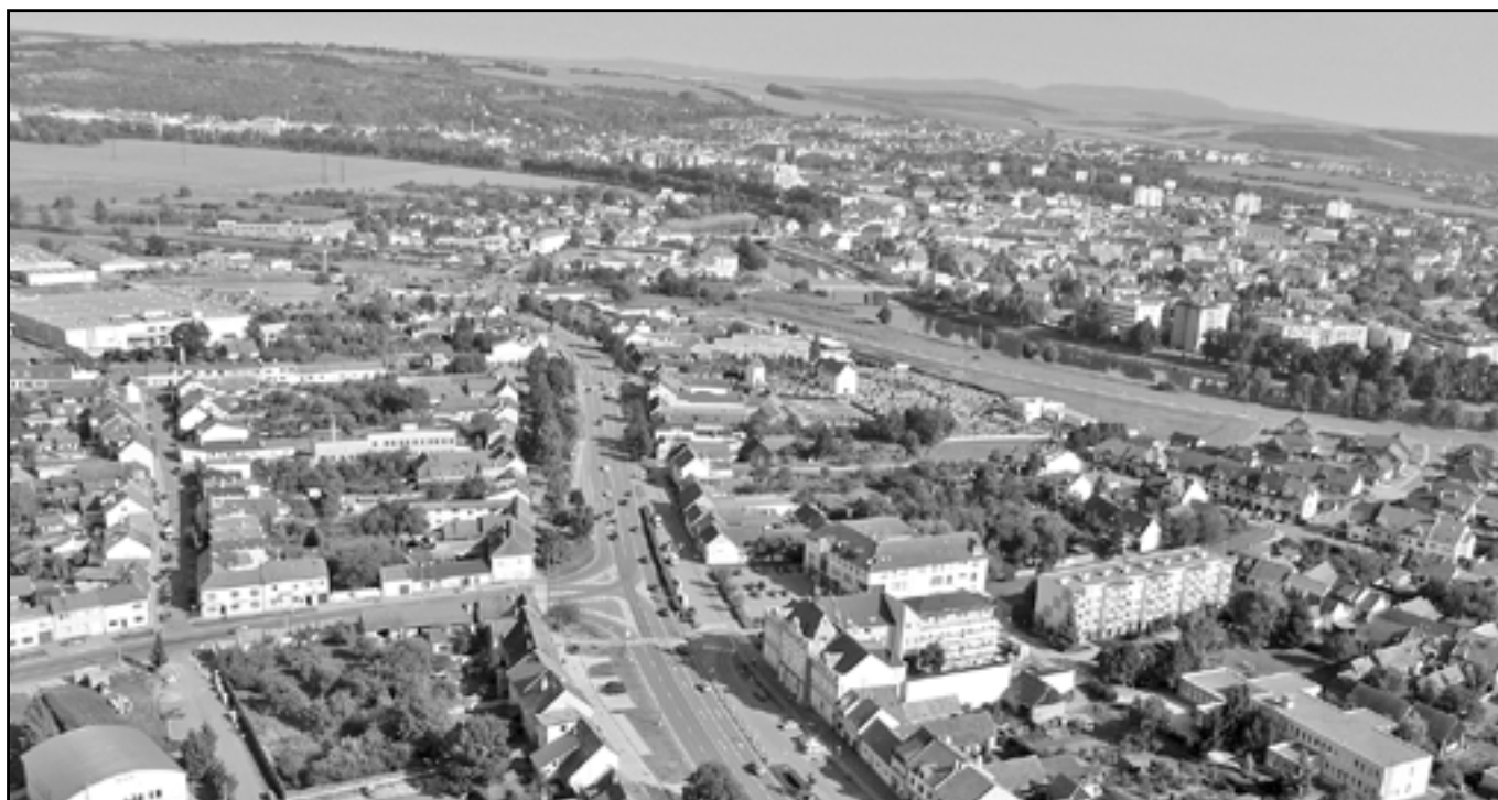
Náměstí Hrdinů ve Starém Městě a okolní ulice z ptačí perspektivy.