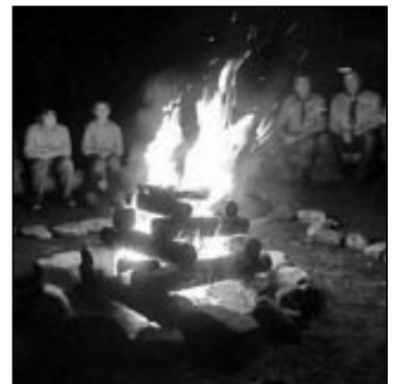
Večerní posezení u ohně plné kouzel, zpěvu a vyprávění.