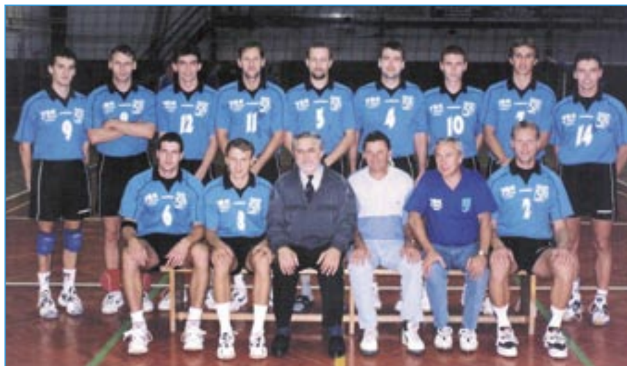
Družstvo volejbalistů na přelomu tisíciletí v ročníku 2000/2001.

Příští číslo Staroměstských novin vyjde již 17. prosince. Uzávěrka je 12. prosince 2011