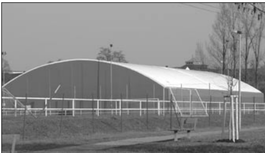
Na Rybníčku, v sousedství fotbalového hřiště, vyrostla 55 m dlouhá, 36 m široká a 10 m vysoká tmavě modrá sportovní hala, kde budou po dokončení k dispozici tři tenisové kurty.