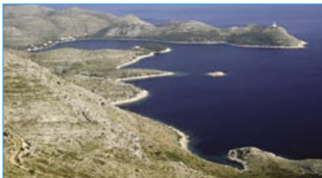
Maják Skrivena Luka na ostrově Lastovo. Lastovo je nejmenším chorvatským ostrovem, který je dostupný pravidelnou trajektovou linkou a zároveň je nejvzdálenější od pobřeží. Proto také plavba na ostrov ze Splitu trvá několik hodin, včetně přestupu na Korčule.