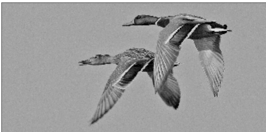
Kachny divoké při přeletu nad Starým Městem.

• Krmítko na zahrádce či okenní římsce kolemjdoucí upozorní, jací lidé žijí v rodinných domech či bytech. Nejvhodnějším krmivem pro všechny ptáky jsou olejnata semena, tedy slunečnice, lněná, maková či řepková semínka. Vítaným zdrojem energie jsou i ovesné vločky, strouhanka, piškoty, ovoce, drcené bukvice, rozsekaná jádra ořechů, šípky, jeřábinky, semínka ze šišek smrku či borovice. Kosům se zavděčíme jablky, sýkorky si pochutnají na kousku loje.