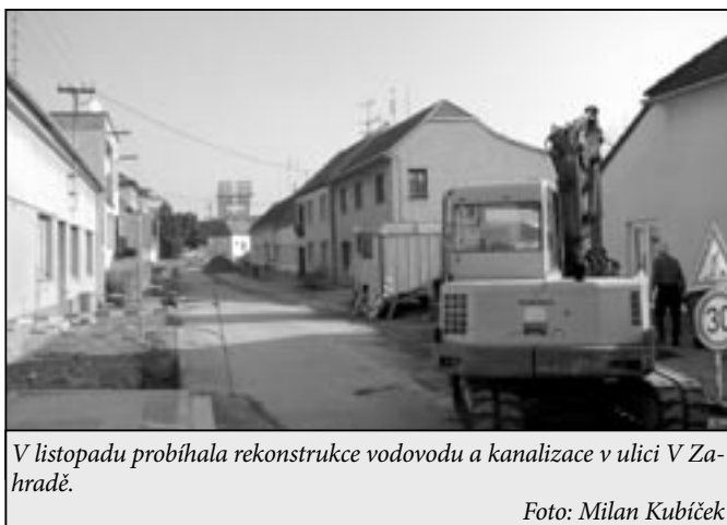
V listopadu probíhala rekonstrukce vodovodu a kanalizace v ulici V Zahradě.