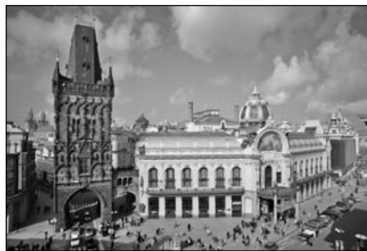
Obecní dům se nachází v sousedství Prašné brány.