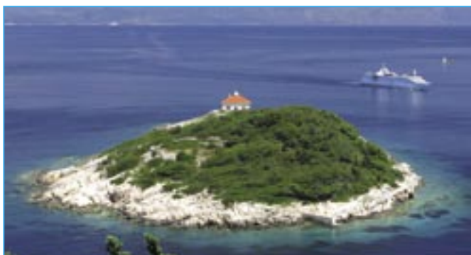
Maják Host stráží přjezd lodí na ostrov Vis. Ostrov byl až do roku 1991 turistům zapovězen, protože jej užívala Titova armáda. K lákadlům ostrova patří nádherná malá pláž Stiniva sevřená mezi skalními masivy a Modrá jeskyně na nedalekém ostrůvku Biševo.