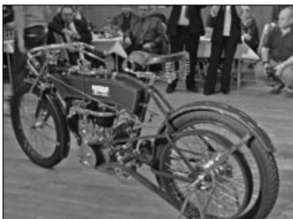
Historický motocykl TORPEDO si všichni se zájmem prohlédli.