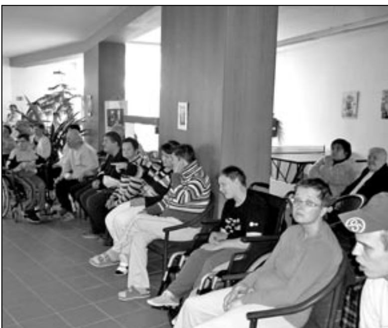
Ve Starém Městě nalezlo nový domov 64 obyvatel s mentálním nebo kombinovaným postižením.

Je tomu již 10 let, kdy se první uživatelé z velehradského ústavu začali stěhovat do nového bydliště ve Starém Městě Kopánky 2052. Nový domov zde nalezlo 64 obyvatel s mentálním a kombinovaným postižením.