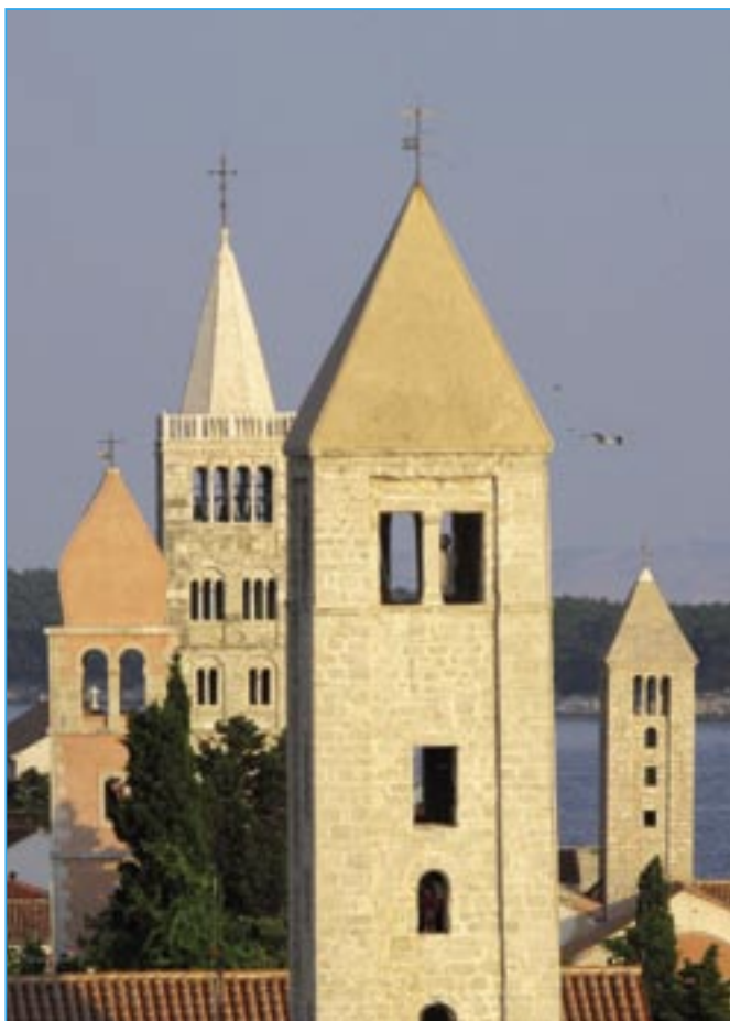
Rab – město čtyř věží. Rab je hlavním centrem stejnojmenného ostrova. Městská historická zástavba v mnohém připomíná věhlasnější Dubrovnik, jen je tu všechno jaksi menší.