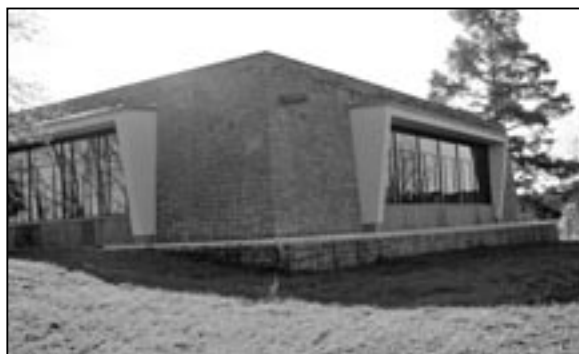
Budova Památníku Velké Moravy, jak ji většinou neznáme, ve směru od ulice Na Hradbách.