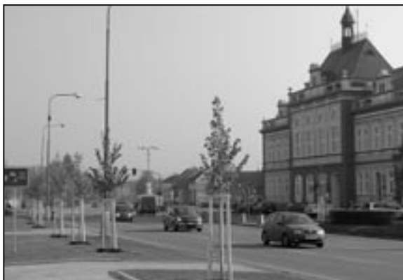
V pátek 28. října 2011 byly vysázeny nové stromy na náměstí Hrdinů. Nahradily staré a nemocné stromy, které zde byly vykáceny v minulém roce.

V druhé etapě, která bude realizována od března 2012 do dubna 2012 v lokalitách ulice Hradištská, ulice Brněnská, ulice Velehradská, ulice Huštěnovská a Trávníky, bude celkově vykáceno 111 ks stromů, 345 ks keřů a nově vysazeno 61 ks stromů, 692 ks keřů a 1018 ks půdopokryvných dřevin.