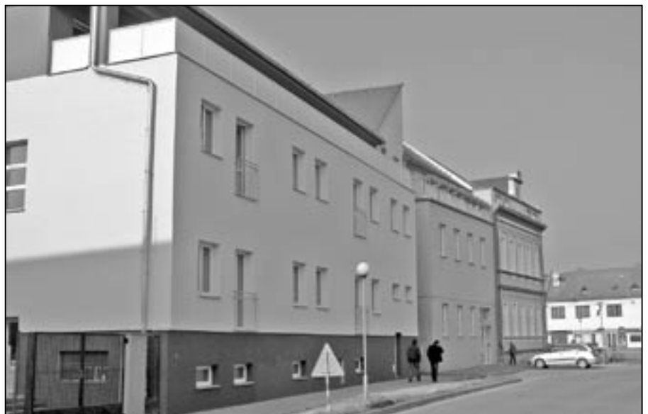
Vedle radnice byla zrekonstruována budova, ve které dlouhá léta sídlila Česká pošta. Nyní bude sloužit jako bytový dům.