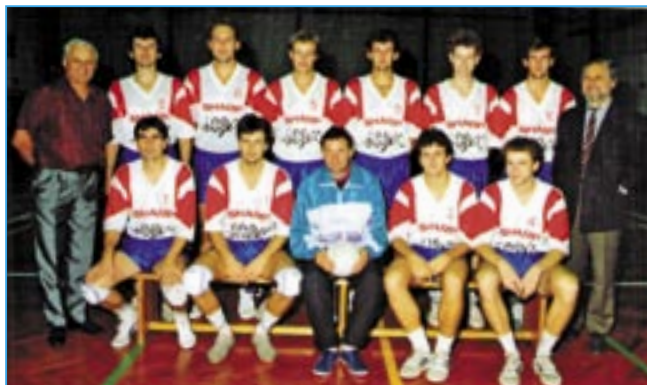
Volejbalový tým po postupu do 1. ligy v sezoně 1993/1994.

Sledujete volejbal na světové úrovni? Který tým a hráči mají vaše největší sympatie?