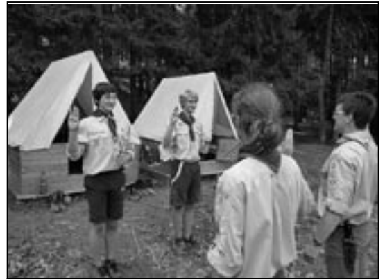
Skautský tábor u obce Držková.

My, skautští vedoucí, nepřipravujeme mládež na akapalypsu, ale snažíme se ji naučit to, co škola neučí a co považujeme za důležité vzdělání. Nejdůležitějším, největším prvkem vzdělávacího a výchovného procesu je rodina, rodiče. Škoda, že my, staroměstští skauti, nemáme ve svých řadách starší generaci, který by nám dvacátníkům dokázala interpretovat některé tradice, které si sami