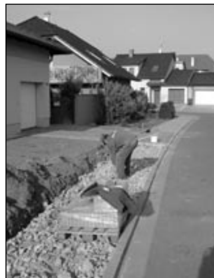
Výstavba první části chodníku v lokalitě Trávník.