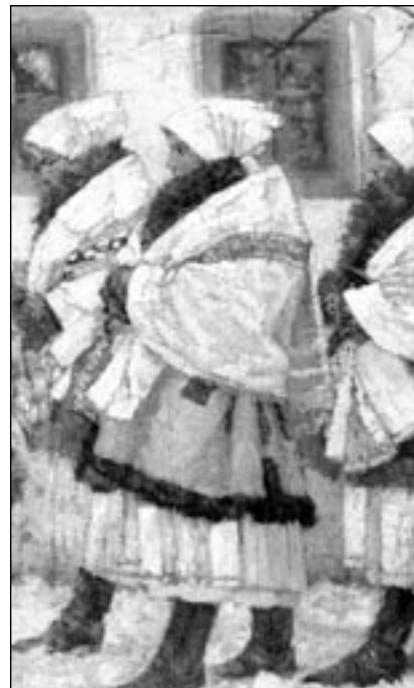
Výstava obrazů Joži Uprky ve Valdštejnské jízdárně.

Dalším bodem našeho programu byla návštěva výstavy obrazů Joži Uprky ve