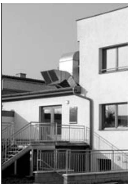
Vchod do objektu je ze zadní strany SKC – sokolovny.

Od poloviny listopadu je opět v provozu bowling, vinárna a restaurace v budově Společensko-kulturního centra (sokolovny) ve Starém Městě.