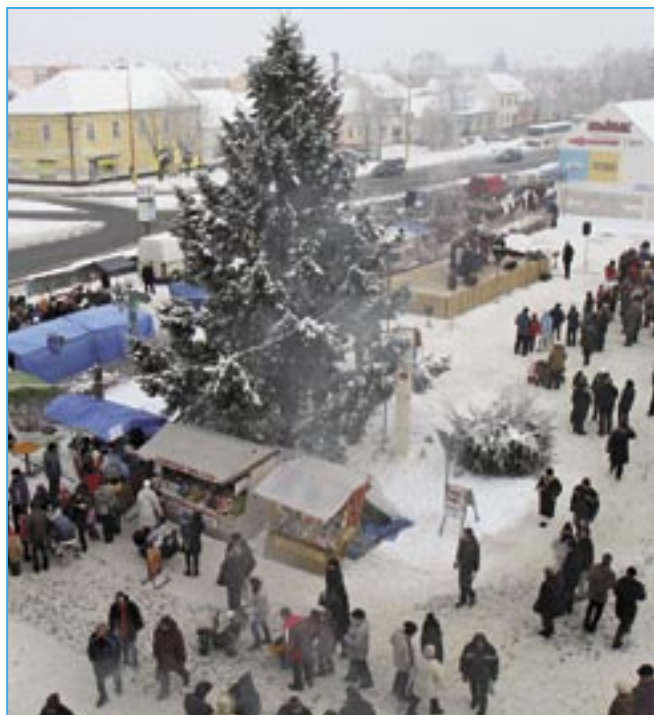
Na jarmarku v roce 2010 bylo velmi chladné a mrazivé počasí, přesto přišlo hodně lidí.