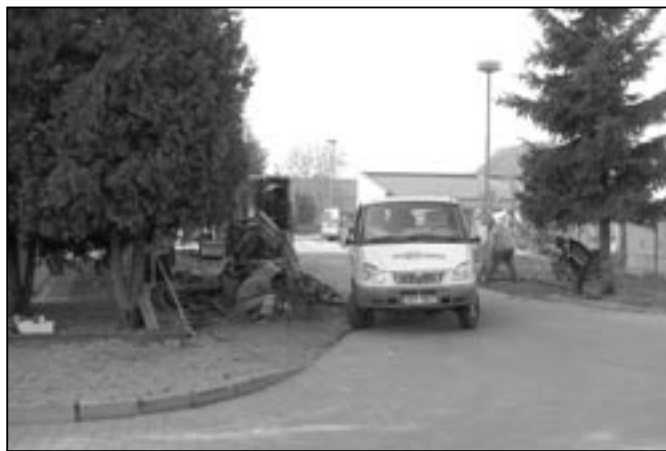
V ulici za Radnicí dne 1. listopadu 2011 začala rekonstrukce chodníku, který byl posunut a na přilehlém prostoru bylo vybudováno devět parkovacích míst. Akci provádí firma EKOSTAV.