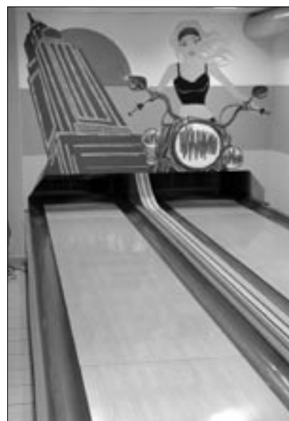
Bowlingová dráha má skvělé parametry.