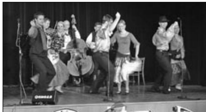
Vojenský umělecký soubor Ondráš při perfektním vystoupení.