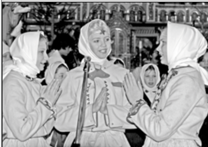
Děti z Dolinečky při vánočním vystoupení v loňském roce.