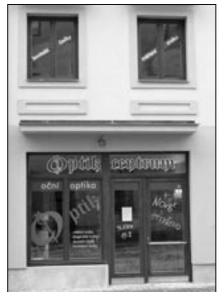
Nové sídlo Optikcentra v Uherském Hradišti ve Františkánské ulici naproti salonu Kohel.