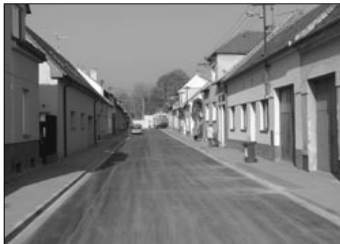
Jak se vám líbí Sportovní ulice, jejíž celková rekonstrukce kanalizace, vozovky a chodníků byla ukončena k 31. říjnu 2011?