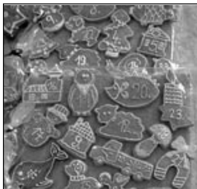
Perníčky hezky vyzdobili naši nejmenší.