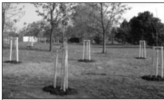
V rámci první etapy projektu bylo vysázeno 84 ks nových stromů. Na snímku výsadba nedaleko koupaliště na Širůchu.

V první etapě se zahájily práce v září 2011, ukončeny byly v říjnu 2011 v lokalitách náměstí Hrdinů - základní škola, náměstí Hrdinů, koupaliště Širůch a zdravotní středisko. Bylo vykáceno celkem 87 ks stromů a 140 ks keřů, vysazeno bylo celkem 64 ks nových stromů a 600 ks keřů.