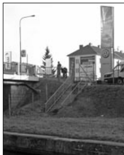
U silničního mostu přes Baťův kanál byly vybudovány nové schody, které usnadní přístup k přístavišti a sousednímu autobazaru.

Následně jsme navštívili staveniště bytového domu na konci sídliště Alšova, Uprkova, kde bude po dokončení 66 bytových jednotek. Na závěr jsme se zastavili na Rybníčku. Tam v sousedství fotbalového hřiště TJ Jiskra vyrostla tenisová sportovní hala. V tmavě modré hale jsou tři tenisové kurty, které bude možno využívat po celý rok. Investorem stavby je te-