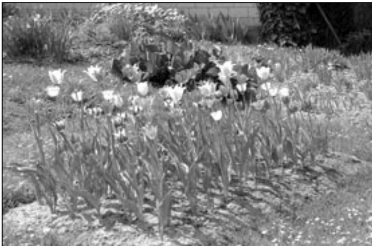
Nejedna staroměstská milovnice květin, a zvláště tulipánů, se již těší na letošní pestrobarevnou nádheru na záhoně před domem nebo v zahrádce.

Pokud to zkusíte a bude to účinné, dejte nám do redakce vědět. Nebo nám napište, jak vy hubíte dotěrného škůdce, který se k nám rozšířil ve velkém počtu z jihozápadu Evropy. Milan Kubíček