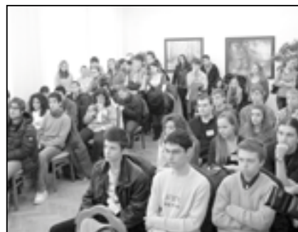
Do obřadní síně na radnici přijelo 36 hostů ze zahraničí a také 30 studentů SOŠ a Gymnázia Staré Město.