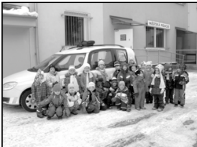
Společná fotografie před služebnou městské policie ve dvoře radnice.