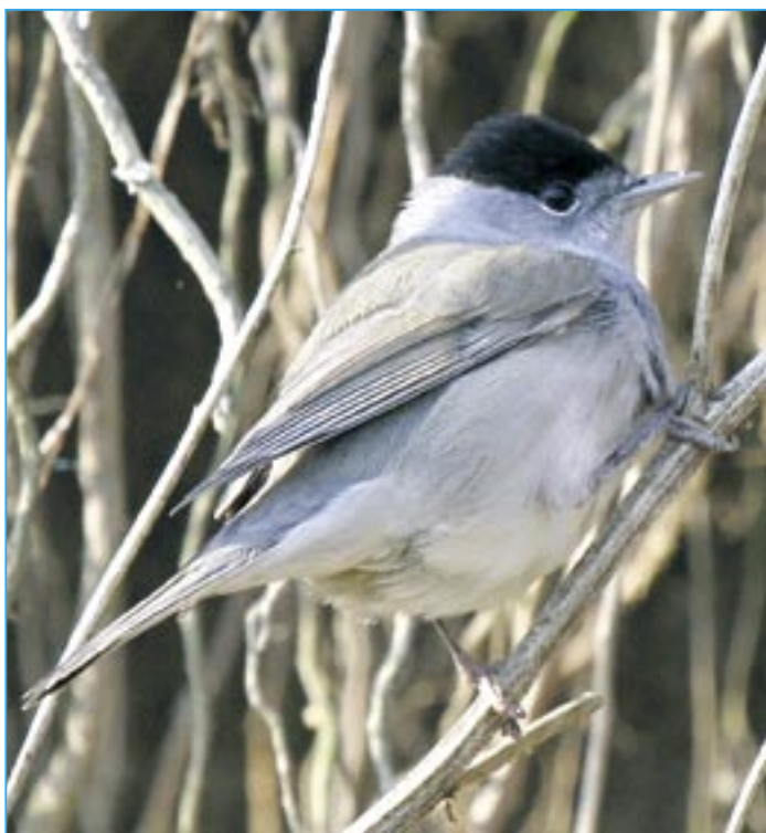
Pěnice černohlavá je poměrně vzácná.