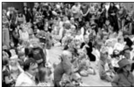
Chlapci, děvčata i rodiče se zájmem sledují pohádku.