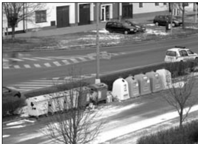
Na mnoha místech Starého Města jsou umístěny kontejnery pro ukládání papíru, plastu, bílého i barevného skla. Ne všichni občané však udržují v blízkosti sběrných nádob pořádek.

Závěrem můžeme konstatovat, že občané Starého Města přistupují k problematice odpadů zodpovědně, což dokazují nejenom uvedená čísla, ale i to, že se naše město pravidelně umísťuje na předních příčkách v hodnocení množství vytříděných odpadů. Ing. Alena Pluhařová