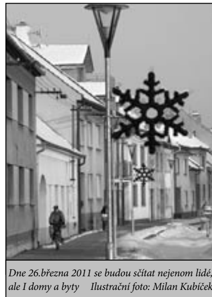
Dne 26. března 2011 se budou sčítat nejenom lidé, ale i domy a byty

Rozsah informací i kvalita dat se začala významně zvyšovat od roku 1869, kdy se uskutečnilo první moderní sčítání lidu na našem území. Jediné sčítání, které se v novodobé historii Československa nekonalo, bylo v roce 1940 kvůli 2. světové válce.