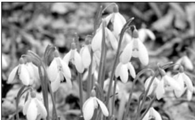
Sněženky jsou krásné na místě svého výskytu. Jejich podzemní části – cibule jsou chráněné. A právě tuto sněženkovou nádheru posíláme všem čtenářům Staroměstských novin jako předjarní pozdrav.