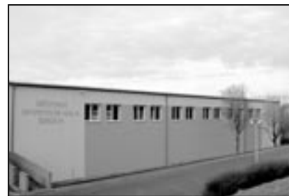
Městská sportovní hala na Širůchu byla přes zimu důkladně zateplena a má novou slušivou fasádu.

ne ve prospěch města Staré Město na právo umístění stavby „Bezbariérový chodník na ulici Velkomoravské ve Starém Městě“ na části pozemku p. č. 4547/39 ost. plocha/silnice o výměře 21 m 2 a části pozemku p. č. 4547/9 ost. plocha/silnice o výměře 48 m 2 , vše v lokalitě ul. Velkomoravská ve Starém Městě, k. ú. Staré Město u Uh. Hradiště, ve vlastnictví Zlínského kraje, Zlín, třída Tomáše Bati 21 ve správě Ředitelství silnic Zlínského kraje, Zlín, K majáku 5001.