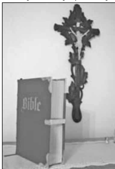
Každý výtisk je ručně zhotoveným unikátem vysoké umělecké hodnoty. Bible na snímku má pořadové číslo 180.

Knihu všech knih jsem si důkladně přečetl a opět jsem si i při-