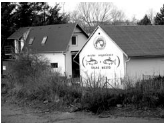
Místní organizace rybářů sídlí na rybníčku ve Starém Městě v blízkosti koupaliště. V současné době se zde pilně pracuje na úpravě a zpevnění břehů a vyčištění dna od nánosů bahna.