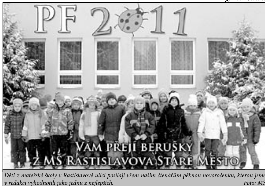
Děti z mateřské školy v Rastislavově ulici posílají všem našim čtenářům pěknou novoročenku, kterou jsme v redakci vyhodnotili jako jednu z nejlepších.