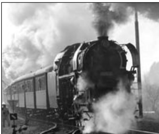
Na snímku parní lokomotiva 498.106 „Albatros“ v čele historického vlaku v trati Staré Město - Uherské Hradiště.

■ Ze Starého Města do Brna jezdí ve směru na Uherské Hradiště, Veselí n. M.,