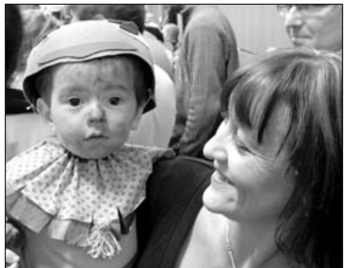
Středisko volného času Klubko uspořádalo v neděli 23. ledna 2011 Karneval pro děti. Viděli jsme tam i tohoto pěkného vodníka.