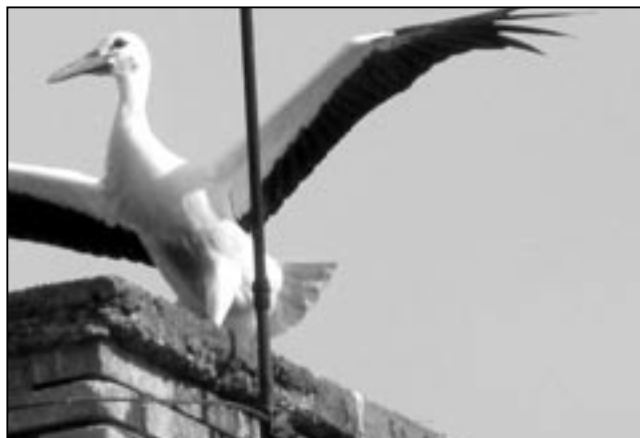
Mladý čáp bílý z hnízda v Komenského ulici vytvořil nový rekord. Ze Starého Města odletěl na jih až po Michalských hodech koncem září 2010.