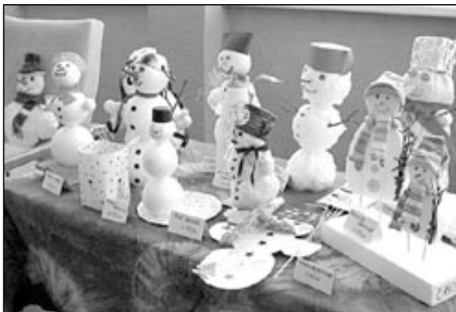
Jeden sněhulák pěknější než druhý.