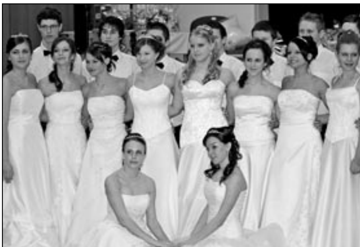
Společné foto při nácviu polonézy.