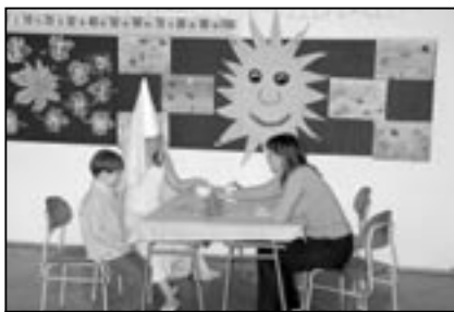
Než půjdu poprvé do školy, musím o sobě něco povědět.

dětí dobře připravili a na místě nechybělo nejedno překvapení. MK