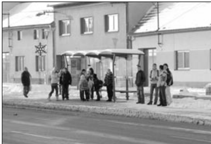
Autobusová zastávka u Lidového domu byla zrekonstruována v rámci stavebních úprav na severní straně náměstí Hrdinů.