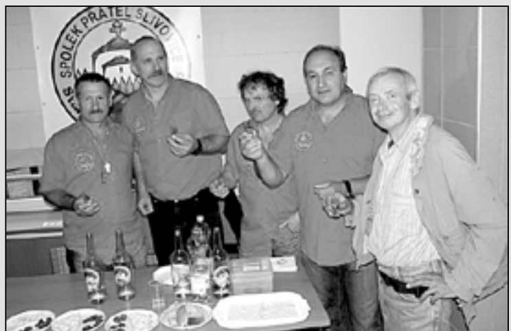
Těšíme se na setkání s Vámi na „jedničkovém koštu.“ Bude totiž v pořadí již jedenáctý!