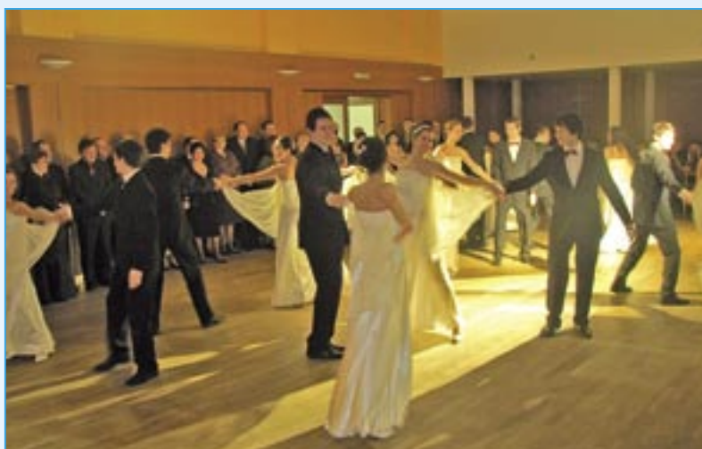
Polonézu zatančili studenti SOŠ a Gymnázia Staré Město.