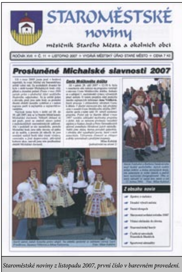
Staroměstské noviny z listopadu 2007, první číslo v barevném provedení.

ní teprve tehdy, až tragédie vstoupí i do jejich domu. A další nemilá skutečnost, vězí v tom, že majitelé novin na českém trhu jsou převážně Němci a Švýcaři. Například Švýcar Michal Ringier u nás vydává Blesk, Aha!, Sport, Reflex atd. V podstatě si dnes noviny může založit kdejaký hochštapler, a pak hlásat do světa ty své pravdy, když získá do týmu lokaje s novinářskou zkušeností.