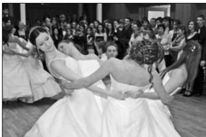
Chlapci a děvčata z devátých tříd si spolu pěkně zatančili.