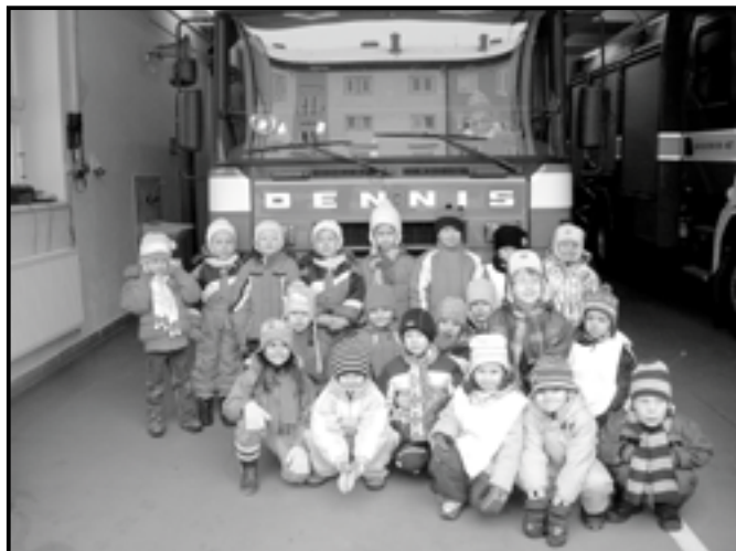
Děti na návštěvě v Hasičském záchranném sboru v Uherském Hradišti.