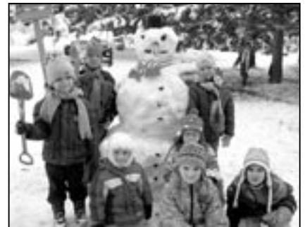
Na snímku děti z mateřské školy Rastislavova, které si společně postavily nádherného sněhuláka.

Podávání žádostí o přijetí dítěte do mateřské školy Rastislavova, křesťanské mateřské školy Za Radnicí a mateřské školy Komenského bude probíhat v týdnu od 18. do 22. dubna 2011 v těchto MŠ. Žádosti musí být potvrzeny lékařem dítěte. IP