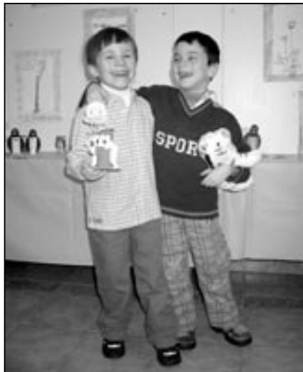
Už se těšíme do naší školky.