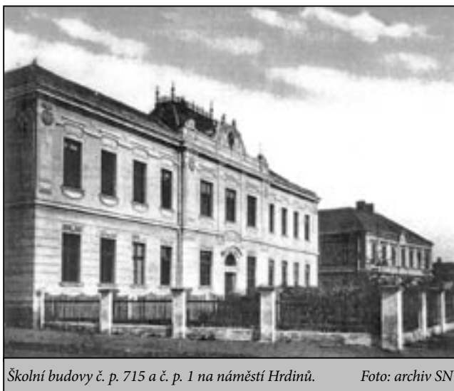
Školní budovy č. p. 715 a č. p. 1 na náměstí Hrdinů.