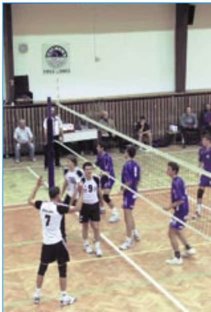
První dva zápasy čtvrtfinálové série play-off Staroměšťané zahráli jako z partesu a oba dovedli do vítězného konce.