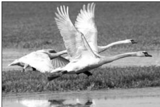
Labutí trojka při vzletu na loukách za Starým Městem ve směru na Huštěnovice.