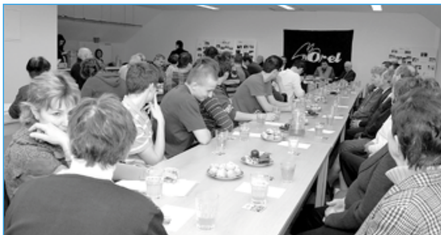
Účastníci výroční členské schůze Orla, která se konala v pátek 4. února v sále Orlovny ve Starém Městě.