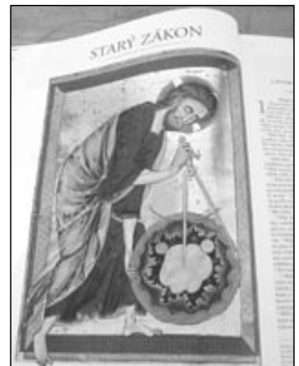
Ilustrace úvodní části Starého zákona.