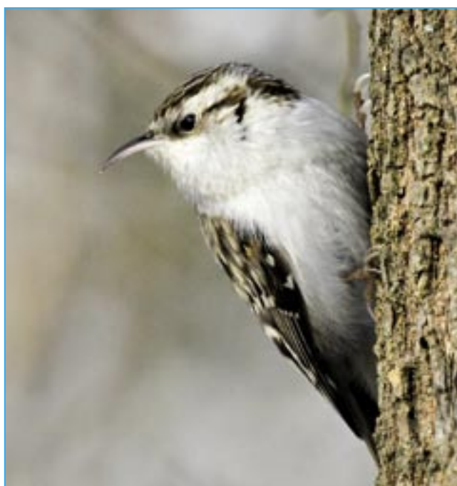
Šoupálek dlouhoprstý je k vidění v Kunovském lese. Trhavým pohybem šplhá po stromech a větvích.