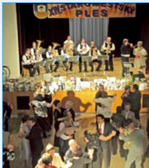
V divadelním sále vyhrávala dechovka Boršičanka.