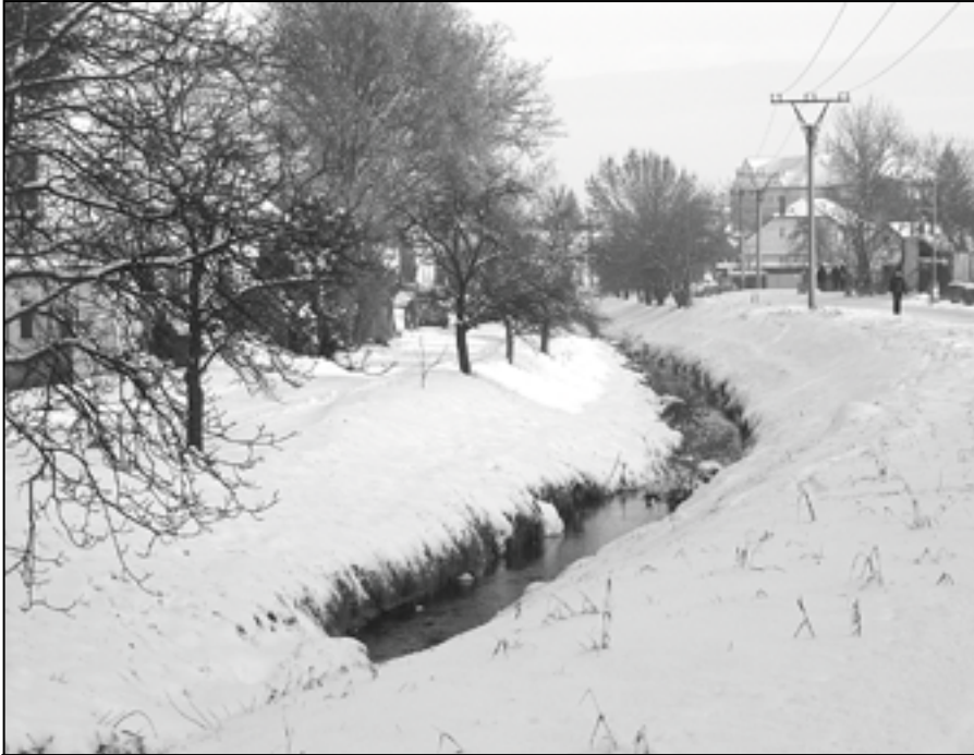
Potok Salaška v blízkosti Salašské ulice pod sněhovou nadílkou.