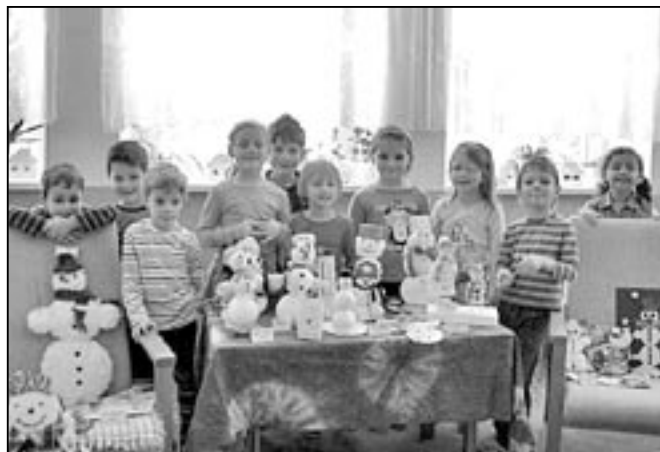
Chlapci a děvčata z MŠ Rastislavova se svými sněhuláčky.