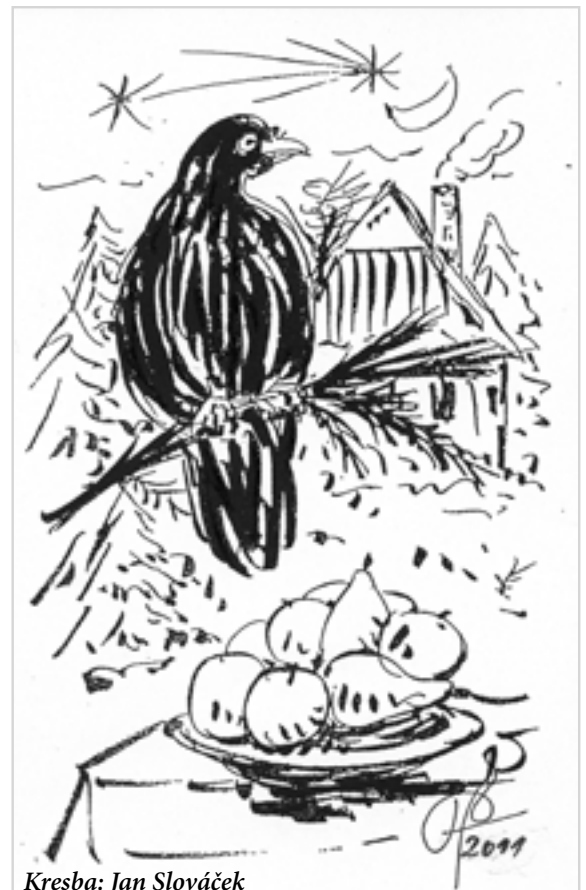
Kresba: Jan Slováček