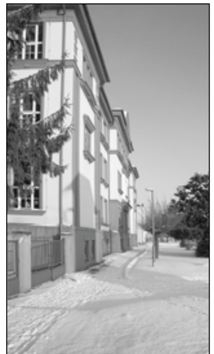
Budovy základních škol v zimě.