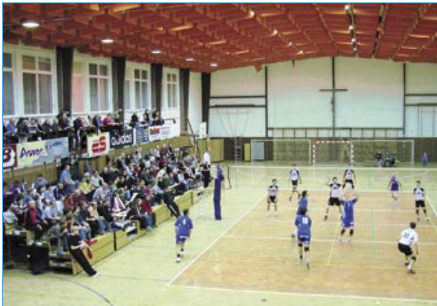
Vítězství VSK Staré Město nad mužstvem z Brna v poměru 3:1 přihlížela v pátek 4. února 2011 zaplněná Městská sportovní hala na Širůchu.