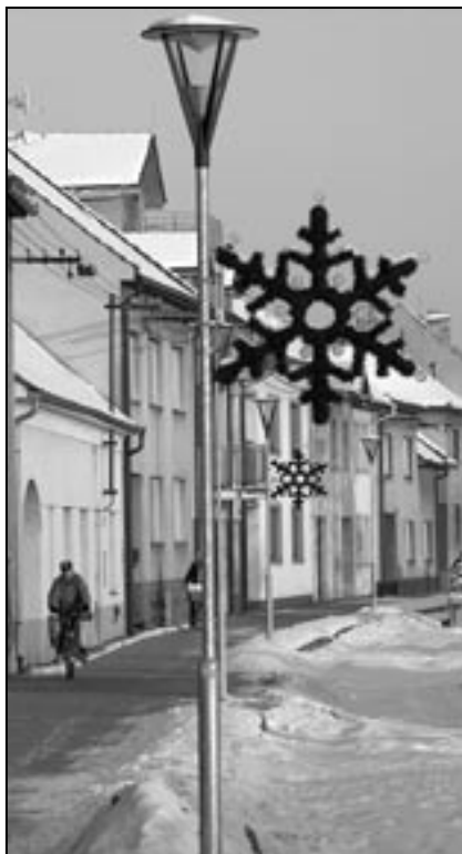
Náměstí Hrdinů v průběhu rekonstrukce.