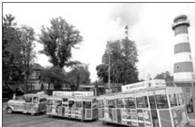
Firma KOVOSTEEL se zabývá mnoha činnostmi, jednou z nich je likvidace odpadu. Společnost sídlí v areálu bývalého staroměstského cukrovaru a mezi veřejností je dobře známa svým sloganem „S námi se v moři odpadů neztratíte.“ Na snímku vláček Steelinka, který slouží k turistickým i propagačním jízdám.