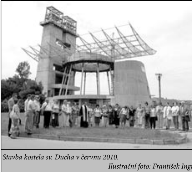
Stavba kostela sv. Ducha v červnu 2010.