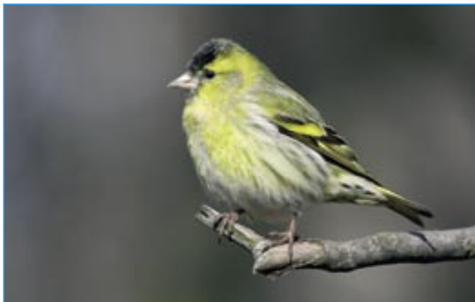
Čížek lesní je nápadný žlutým zbarvením.