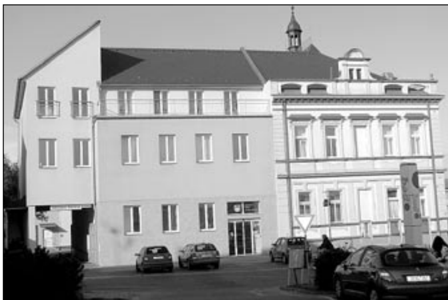
Jakmile to povětrnostní podmínky dovolí, bude se pracovat na obnově fasády pravého křídla radnice.

„Také v průběhu zimy se podle klimatických podmínek pracovalo na dokončení rekonstrukce severní strany náměstí Hrdinů. Chodníky byly dokončeny již v průběhu konce minulého roku a letos do 31. května bude zhotovena komunikace a provedeny terénní úpravy na zbylé ploše severní části náměstí Hrdinů. V rámci realizace úspor energie byla zateplena Městská sportovní hala na Širůchu, která má novou slušivou fasádu. Také se pokračuje na rekonstrukci rybníčku na Širůchu, kde budou zpevněny břehy a provedeno odbahnění. V průběhu jara nastoupí pracovníci vodovodů a kanalizací do Sportovní ulice, kde bude probíhat rekonstrukce kanalizace a po jejím dokončení ve Sportovní ulici provedeme rekonstrukci komunikace a chodníků. V dalších měsících bude pokračovat obnova Alšovy ulice, připravujeme II. etapu revitalizace sídelní zeleně.