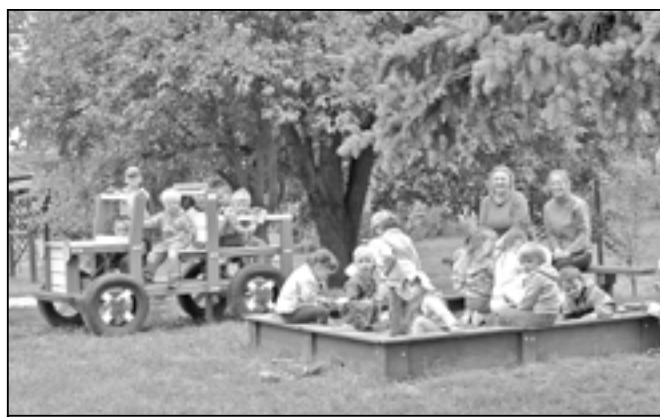
První den školního roku 2012/2013 v KMS v ulici Za Radnicí.