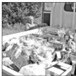
Tombola bylo velmi bohatá, rybáři připravili celkem 101 cen. Na snímku v pozadí dlouholetý staroměstský rybář Jiří Jiřík.