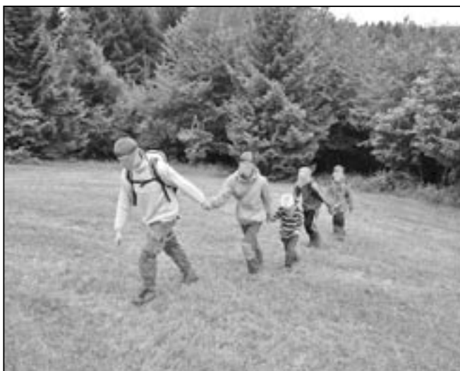
Už jste si někdy zkusili chůzi poslepu?

Hlavní náplní jsou však hry během dne. Letos byla celotáborová hra na motivy televizní show Survivor – Kdo přežije. Nejsilnější zážitky pak připravily hry na překonání sebe sama. V nádobě se slizkým hnusem hledat „perly“, sníst chili papričku nebo plechovku žrádla pro kočky, (kde byl ovšem nachystán guláš, což děti nevěděly), a samozřejmě