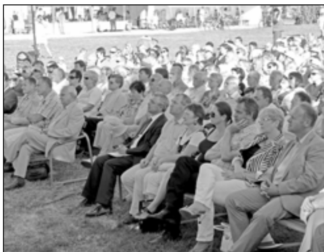
Koncertu se zúčastnilo mnoho významných hostů.