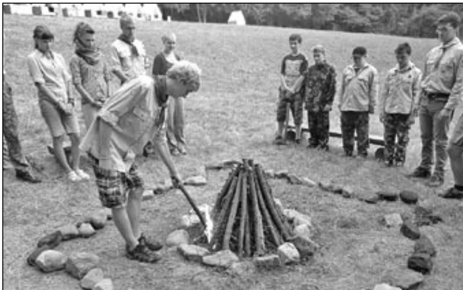
Skauti při zapalování ohně.

Jak možná víte, staroměstští skauti uspořádali začátkem letních prázdnin stanový tábor, na který i prostřednictvím našich novin zvali zájemce z řad veřejnosti. Sešlo se 27 účastníků z nichž bylo pět neskautů. A čím že se skautský tábor lišil od jiných z minulých let? Jiné jsou především rituály. Ať již tradiční pro skauty, nebo například zvyklosti místního oddílu. Základ je ale stejný. Den začíná budíček, následuje ranní nástup a zpěv skautské hymny, denní program a večer se končí většinou