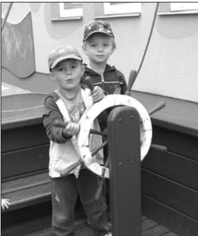
Malí kormidelníci na dřevěné lodi v zahradě mateřské školy v Komenského ulici.