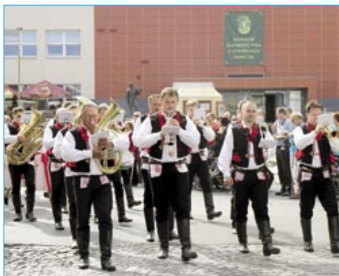
Hraje Staroměstská kapela.