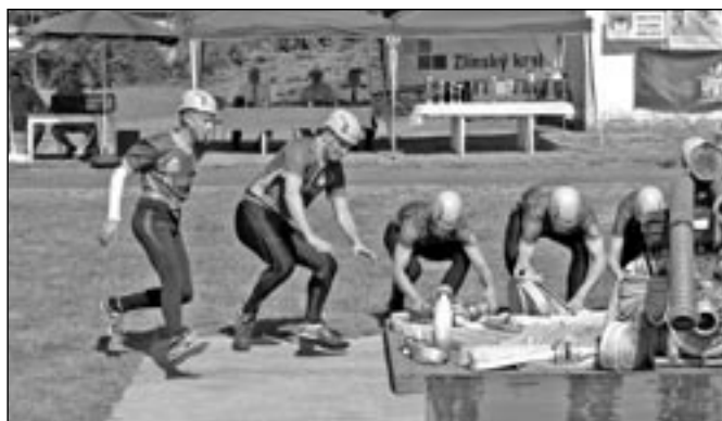
Soutěž zahájili hasiči ze Starého Města a dosáhli solidní čas 20:70.