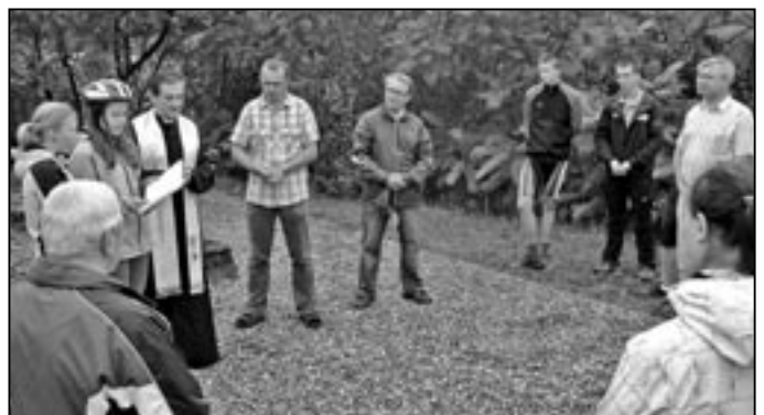
V sobotu 1. září 2012 se farníci vydali na putování na kolech. Jejich trasa vedla po místech spjatých s působením slovanských věrozvěstů Cyrila a Metoděje. Na snímku účastníci akce při prvním zastavení v archeologické lokalitě Špitálky.