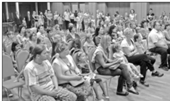
Rodiče a žáci ZUŠ poslouchají proslov starosty města.