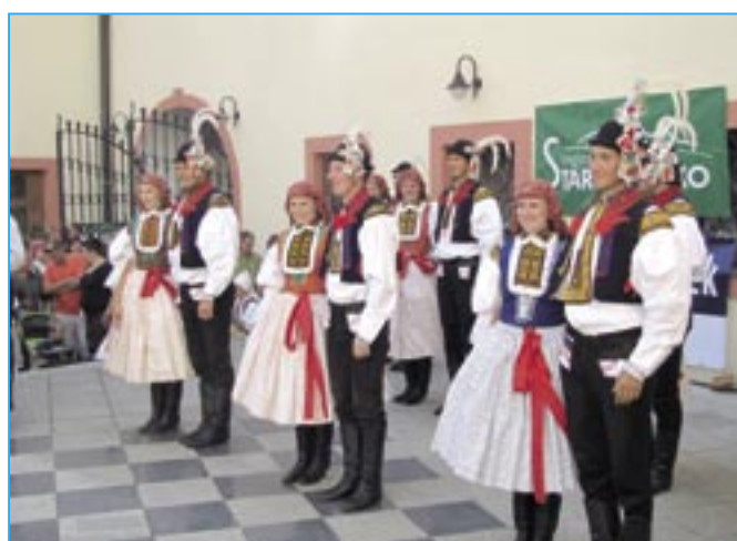
Tanečníci souboru Dolina se velmi líbili divákům.