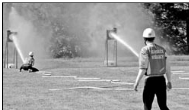
Nejrychlejší útok předvedli hasiči týmu Vésky „A“.