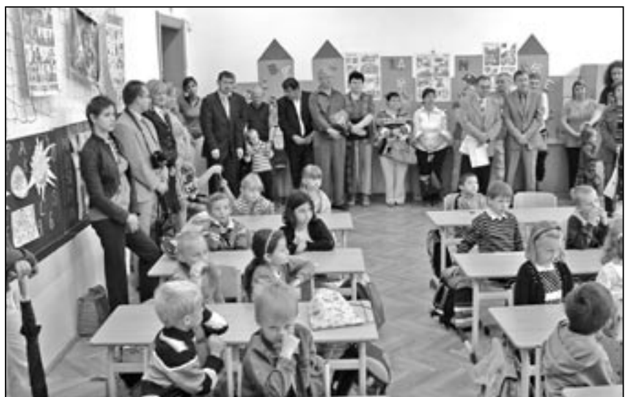
V pondělí 3. září 2012 začal nový školní rok. V učebnách jsme přivítali také 60 prvňáčků, které do tříd doprovodili rodiče.

1.9 ukončení pronájmu bytové jednotky č. 107 v domě s pečovatelskou službou, Bratří Mrštíků 2015 ve Starém Městě, k. ú. Staré Město u Uh. Hradiště, paní Ludmile Stuchlíkové, bytem Staré Město, Hradišská 71, dohodou k 31. 8. 2012.