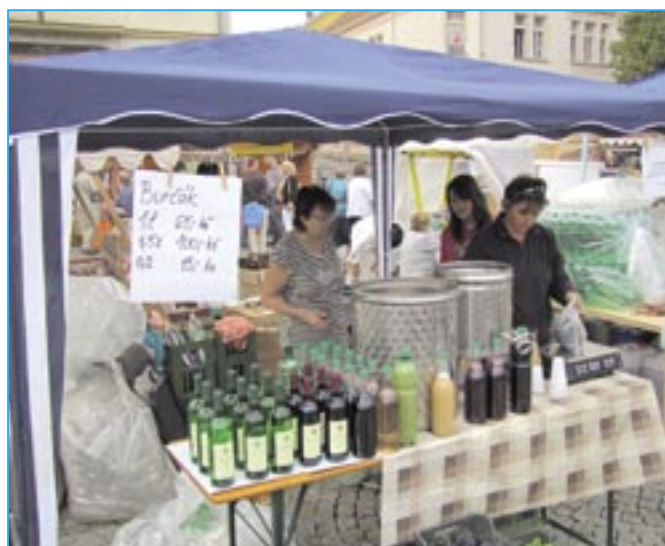
Burčák byl k dostání na mnoha místech v centru Uherského Hradiště.