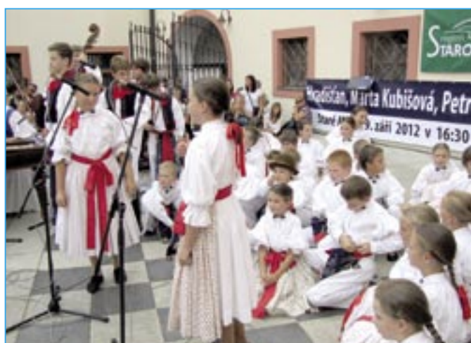
Děti ze souboru Dolinečka při vystoupení na nádvoří Staré radnice.