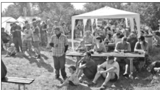
Na Čertáku se sešlo celkem 130 rybářů, většina z nich ale byla z okolí našeho města. Je známo, že někteří Staroměstšané raději loví až v týdně po závodech. Ptáte se proč? Vyjde to levněji.