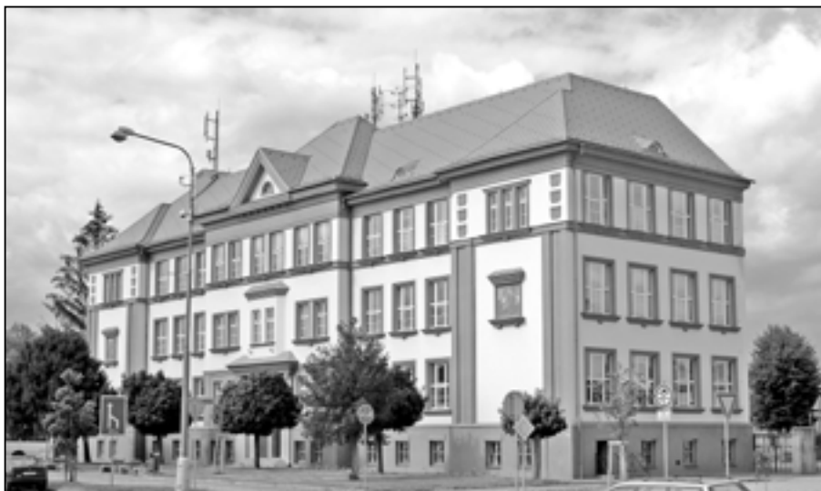
V budově základní školy na náměstí Hrdinů 1000 budou sídlit volební okrsky č. 1 a č. 4.