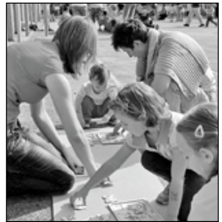
Děti v kategoriích od 1 roku do 10 let si změřily svůj postřeh, zručnost a rychlost pod bdělými zraky rozhodčích.