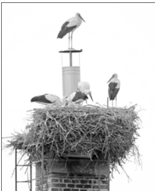
Čapí rodinka na hnízdě v Klukově ulici.