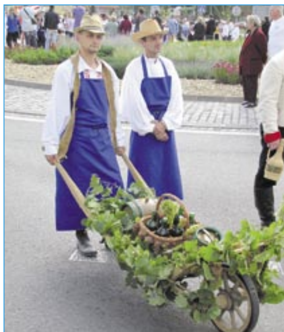
Tož vítajte na slavnostech vína!