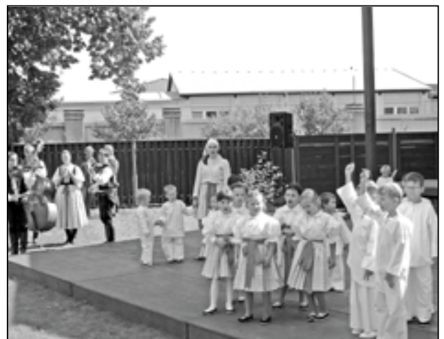
V programu vystoupila Dolinečka II za doprovodu cimbálové muziky Bálešáci.