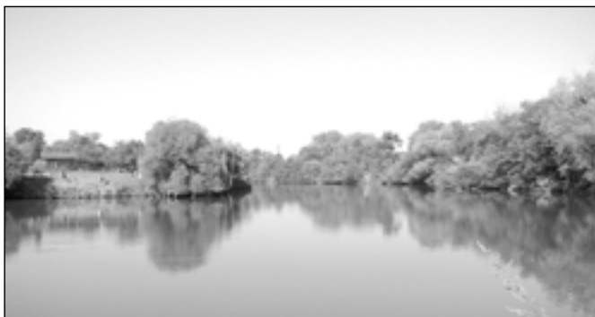
V sobotu 18. srpna bylo na Čertáku velmi horko a ryby příliš nebraly. Z celkového počtu 500 nasazených kaprů jich rybáři vylovili jen šest desítek.