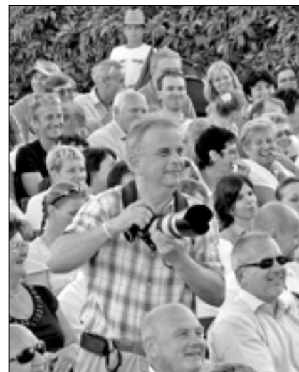
Fotoreportáž z koncertu pořídil Vladimír Kučera. Můžete si ji prohlédnout na www.staremesto.uh.cz