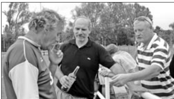
Diváci sledovali zajímavé utkání.