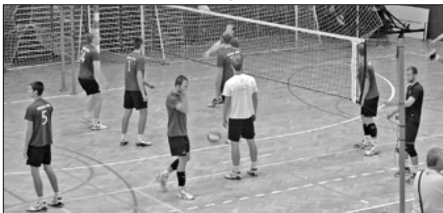
Turnaje se zúčastnily pouze týmy z české a slovenské extraligy. Na snímku hráči volejbalového klubu Slovenská polnohospodárska univerzita Nitra.