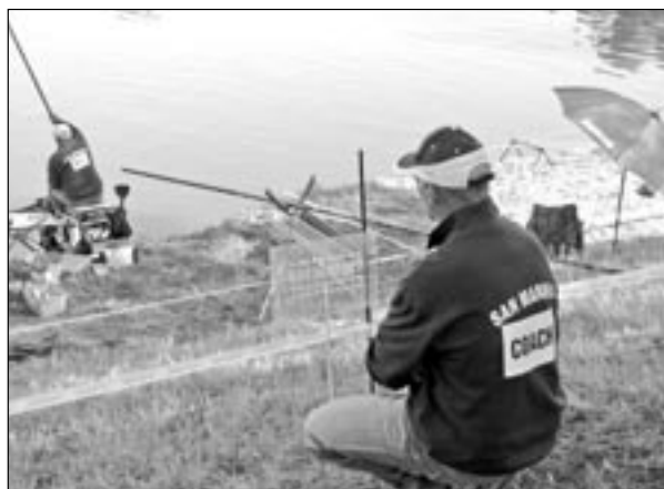
Nechyběli ani rybáři ze San Marina, první republiky v Evropě. V hlavním městě San Marinu žije pouze 4361 obyvatel, to je o dva a půl tisíce méně než ve Starém Městě.