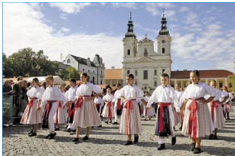
Děti ze souboru Dolinečka na Masarykově náměstí.