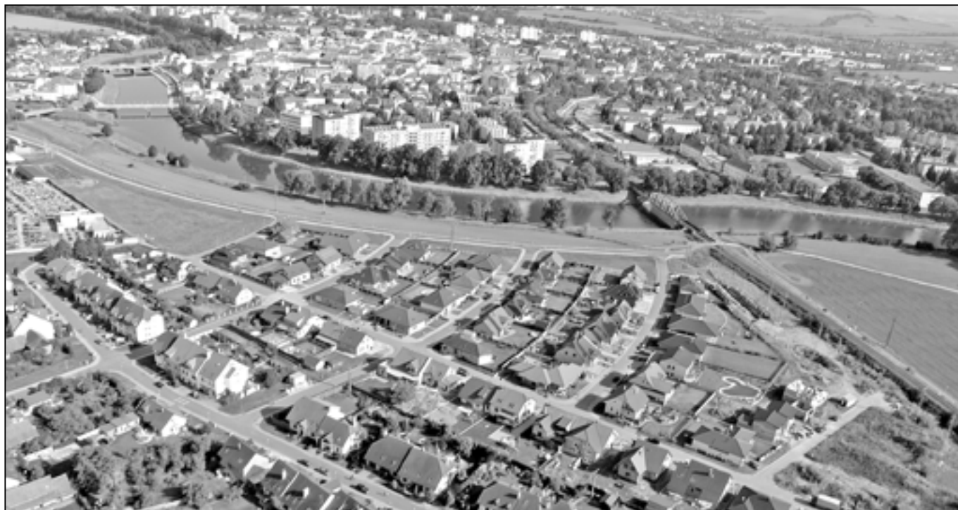
Staré Město neustále mění svou tvář. V lokalitě Trávník bylo vybudováno několik desítek rodinných domů, další občané si postupně vylepšují své bydlení. Pomáhat stavebníkům se snaží i zastupitelé našeho města, zájemci si mohou požádat o půjčku z Fondu rozvoje bydlení s výhodným úrokem. Na snímku vidíme nové rodinné domy na Trávníku a v ulici Sées. Od města Uherské Hradiště nás rozděluje již jen řeka Morava.