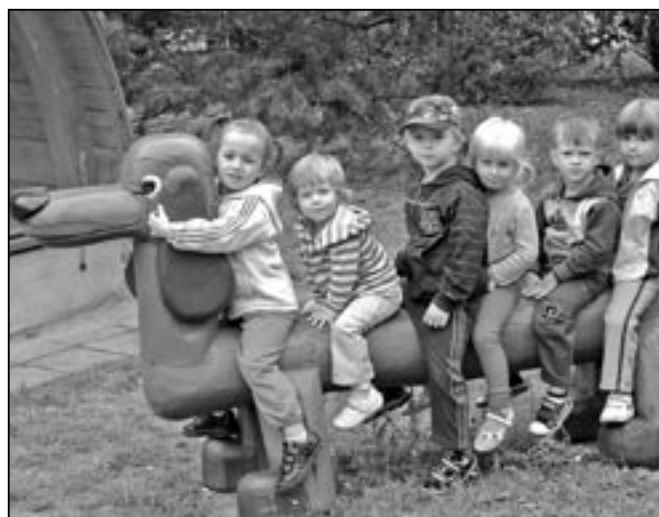
Chlapci a děvčata z MŠ Komenského osedlali v zahradě svého originálního jezevčika.