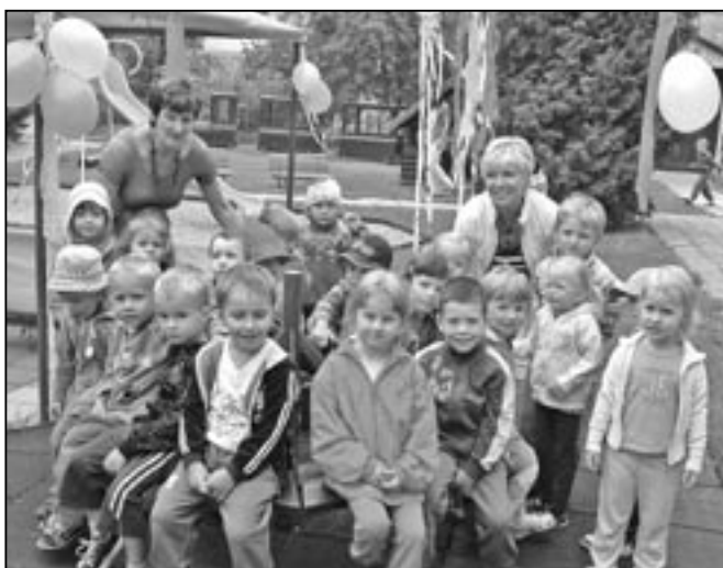
Děti z MŠ Rastislavova s učitelkami první den ve školce.