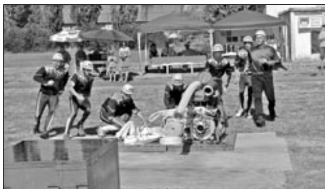
SDH Horní Bečva v první fázi požárního útoku.