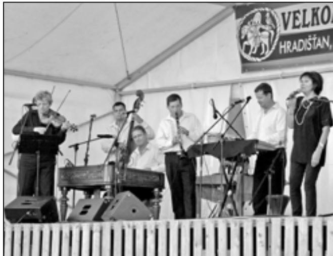
Marta Kubišová si zazpívala s Hradištanem.