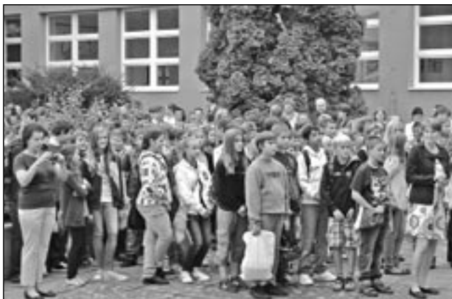
Učitelé a děti při zahájení výuky na ZŠ v Komenského ulici.