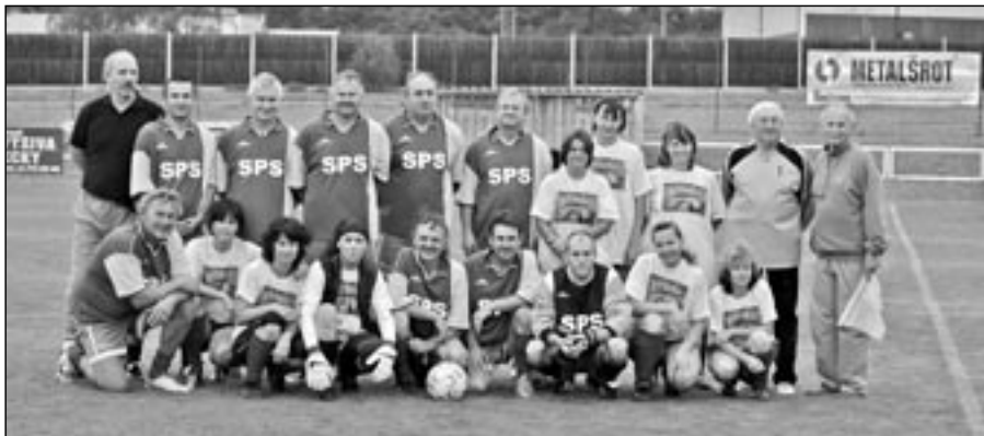
Společná fotografie Ajaxu Medlovice a týmu Spolku přátel slivovice Staré Město.

v pálení slováckého elixíru se velmi snažili i na zeleném trávníku a po jedinečné akci se jim podařilo vsítit první branku. Jejím