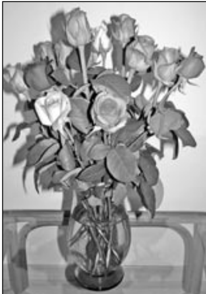
V letošním roce posíláme Mariím kytici růží.

Téměř každý rok nezapomeneme v našich novinách poblahopřát k svátku všem staroměstským Mariím. Patří to ke slušnosti. Hlavním důvodem je ale skutečnost, že Marie je stále nejčastější jméno v našem městě ze všech ženských