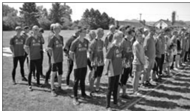
Nástup účastníků hasičské soutěže. V popředí chlapci ze Starého Města.