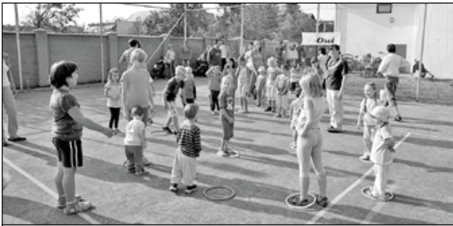
Sluníčko doprovázelo účastníky akce po celou dobu.