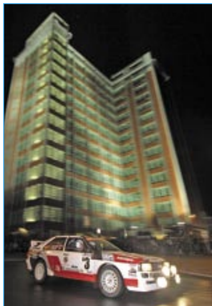
Audi Quattro Coupé před zlínskou 21 (budova Krajského úřadu) v rámci Star Rally Historic.