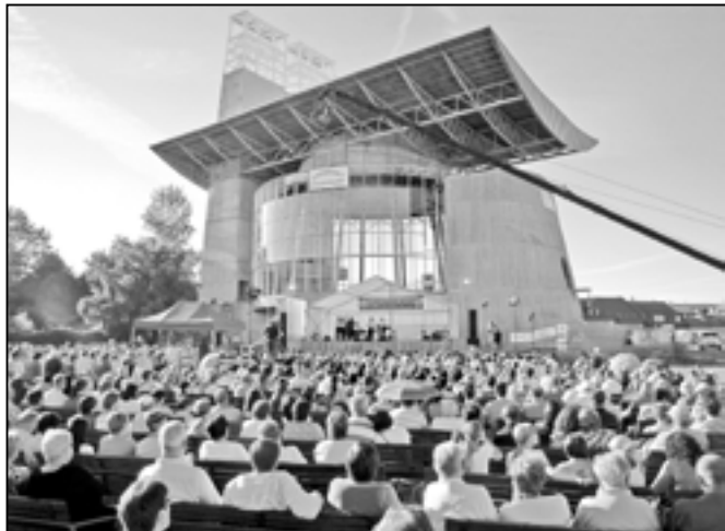
Velkomoravský koncert sledovalo více než 1000 spokojených diváků.