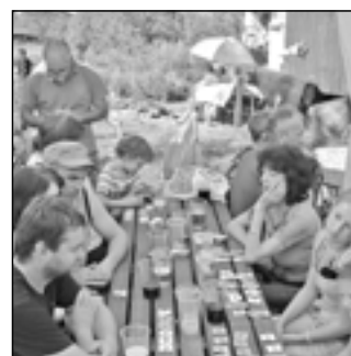
Účastníci rybářských závodů si nakoupili lístky do tomboly a s napětím čekali, zda-li se na ně neusměje štěstí.