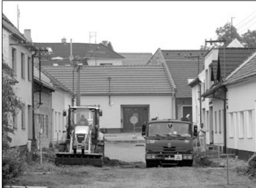
Po několikátýdenním odkladu byla po vydání stavebního povolení konečně zahájena rekonstrukce Rastislavovy ulice. Stavební práce zde budou pokračovat do konce listopadu.