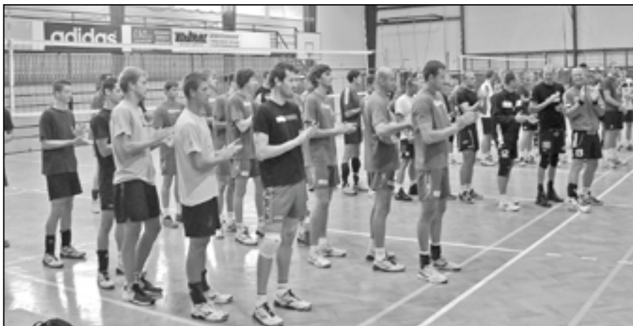
Slavnostní zahájení volejbalového turnaje 1. září 2012 v 9 hodin. Staroměstšané stojí vpředu.