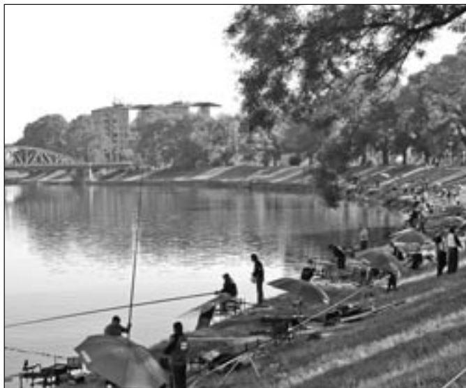
Na břehu řeky Moravy se sešli rybáři z celého světa.

V pořadí již devětapadesáté mistrovství světa v rybolovu se uskutečnilo na řece Moravě. Hlavní závody v lovu ryb udicí – plavané se konaly ve dnech 15. a 16. září 2012 v době od 10 do 14 hodin. Zúčastnilo se 37 týmů z celého světa, což obnášelo více než 218 závodníků a dalších 300 členů jejich doprovodu. Chytalo se v pěti sektorech od staroměstského jezu až po železniční most a dále pak od budo-