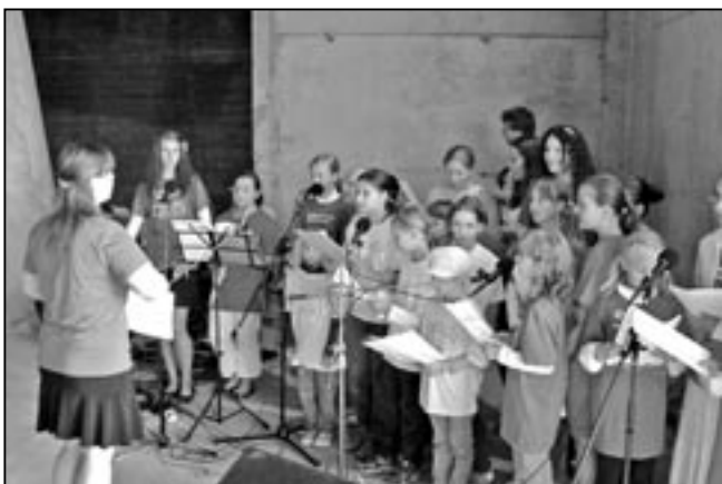
Společné vystoupení Scholy Staré Město a Mysločovice při zahájení školního roku 2012/2013.