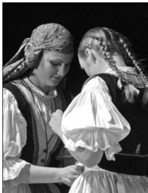
Momentka z vystoupení.

Vystoupení folklorního souboru Dolina se mi velmi líbilo. Bylo živé, veselé, mělo nápad a spád. Tanečníci předvedli výtečné výkony až na profesionální úrovni. Taktéž cimbálo-