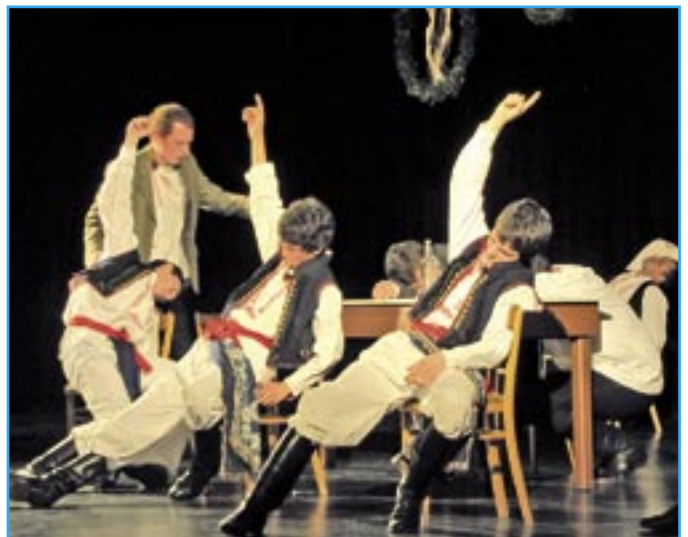
Šohaji při jedné scéně zobrazující koloběh života. Když se narodí členu souboru dítě, je třeba ho zapít.