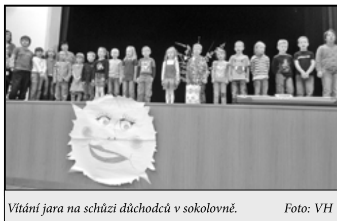
Vítání jara na schůzi důchodců v sokolovně.