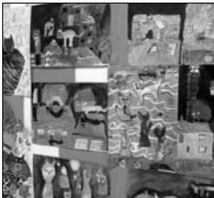
Obrázky koček štětcem našich dětí.