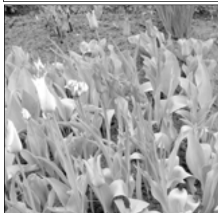
Na zahrádkách vykvetly pestrobarevné tulipány.

Rozrušený řidič linky MHD přiběhne do zadní části autobusu. „Proč tady máte tolik čoudu?“ Noblesní dáma v bílém klobouku pohotově reaguje: „Ale dědeček mi chtěl něco říci a ono se mu to vykouřilo z hlavy.“ PI