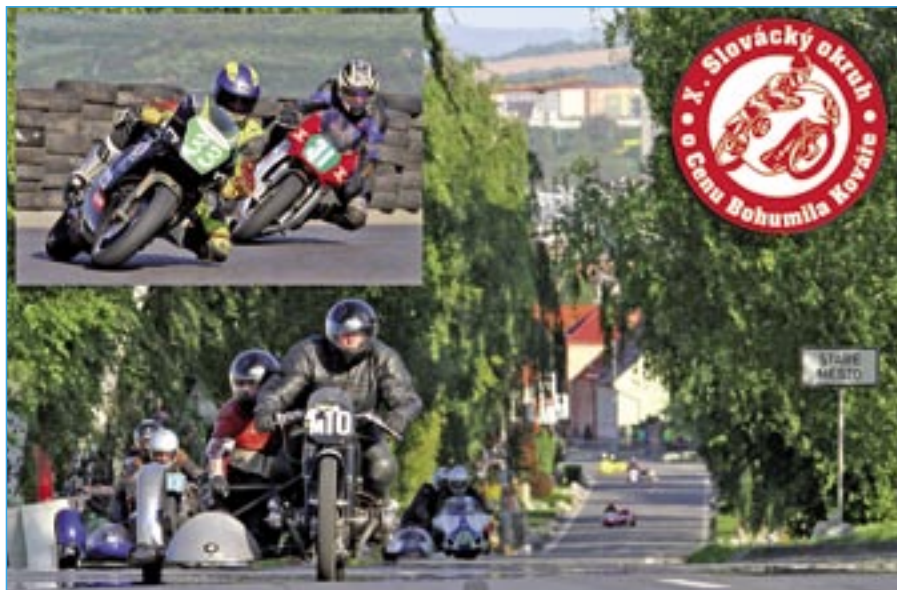
Přijďte povzbudit kompletní domácí jezdce z Motosport klubu.

V početné startovní listině se společně s kompletní domácí elitou objeví jezdci z Rakouska, Slovenska, Německa a dalších zemí. V doprovodném programu vystoupí mažoretky a k vidění bude výstava historických vozidel a motocyklů. Přesný program Slováckého okruhu najdete na straně 34.