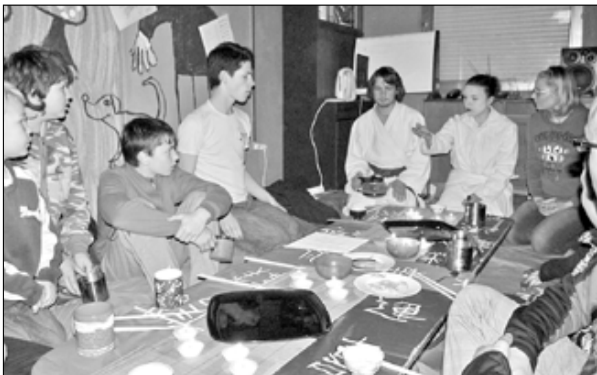
Císařovna Suiko všechny přivítala a společně se svým kuchařem nabídla přítomným tradiční japonské jídlo.