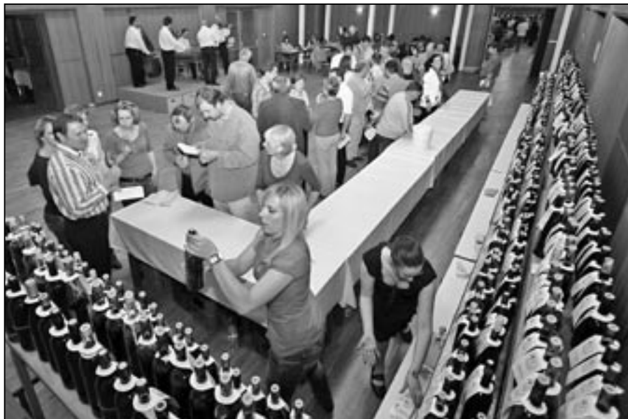
Milovníci dobrého vína se mají na co těšit, protože ročník 2011 byl velmi kvalitní. Loňská vína jsou harmonická, plná a buketní.

červená vína a kde se taktéž usku- teční i vystoupení mladých verbířů ze Starého Města. Pro návštěvníky, kteří se budou chtít věnovat pře- de- vším vínu, budou připraveny pro-