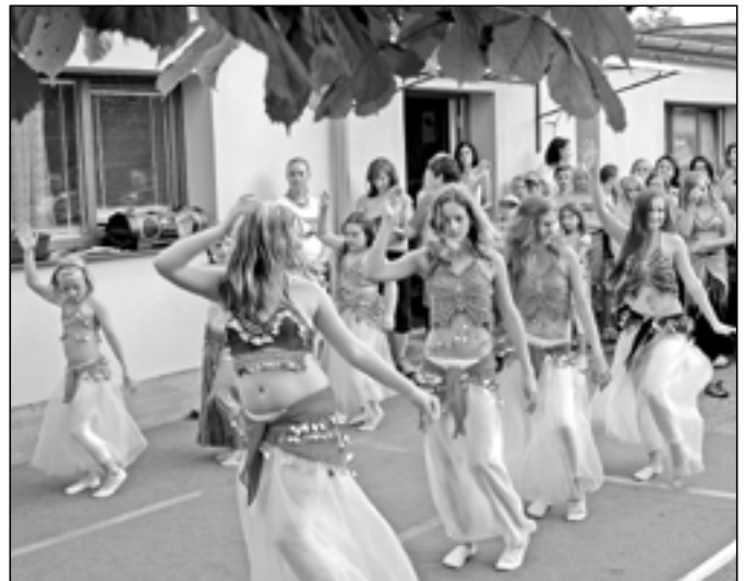
Tanečnice při vystoupení na Galerii - přehlídce výsledků činnosti Střediska volného času Klubko v červnu 2011.

Kurz masáží miminek vedené odbornou fyzioterapeutkou. Na přání i ukázky šátkování a cvičení na velkých míčích. S sebou: přezůvky a nepropustnou podložku pod miminko.