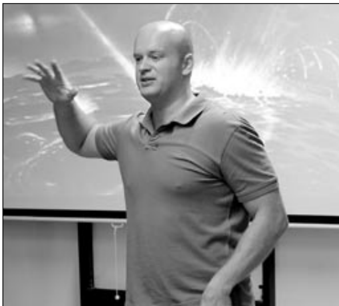
Michael Londesborough ve své show, která byla nabitá energií i vtipem.

pro české/slovenské mladé anorganické chemiky. Spolupracuje na projektech s British Council v Praze a na popularizačních projektech Akademie věd ČR, České televize a Národního technického muzea. Zaměřuje se zejména na zpřístupňování vědy široké veřejnosti, vyučování mladých lidí a vytváření vztahů mezi mladými vědci ve Velké Británii a České republice. Michael Londesborough má vynikající dar řeči