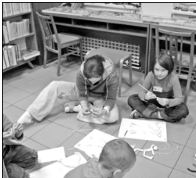
Děti nám ukázaly své malířské schopnosti.

Po příchodu z kostela jsme měli přichystaný další úkol, kde jsme ukázali své malířské schopnosti. Na chvíli se z nás stali ilustrátoři a kreslili jsme pravou i levou rukou, nohou a také jsme se snažili kreslit ústy. Pro mnohé z nás to byla velká dřina. Pan Jiří Trnka byl také znám tím, že vyráběl loutky,