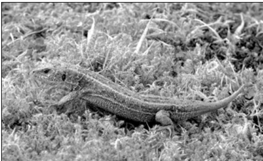
Ještěrka je v České republice zvláště chráněna jako silně ohrožený druh a je zakázán i její odchyt a chov v zajetí. Ale poručte třeba čápovi....