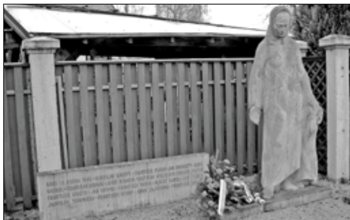
Pomník obětem bombardování cukrovaru dne 16. dubna 1945. Zahynulo 17 zaměstnanců cukrovaru, na místě a v nejbližším okolí sedm osob, šest občanů později zemřelo v nemocnici a zraněno bylo dalších 30 lidí. Hromadný pohřeb obětí se konal 18. dubna 1945 za velké účasti obyvatel.