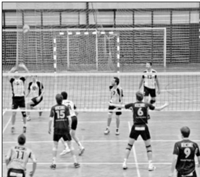
Ve třetím utkání play – off se volejbalisté VSK Staré Město utkali s týmem EGE České Budějovice v městské sportovní hale na Širůchu.