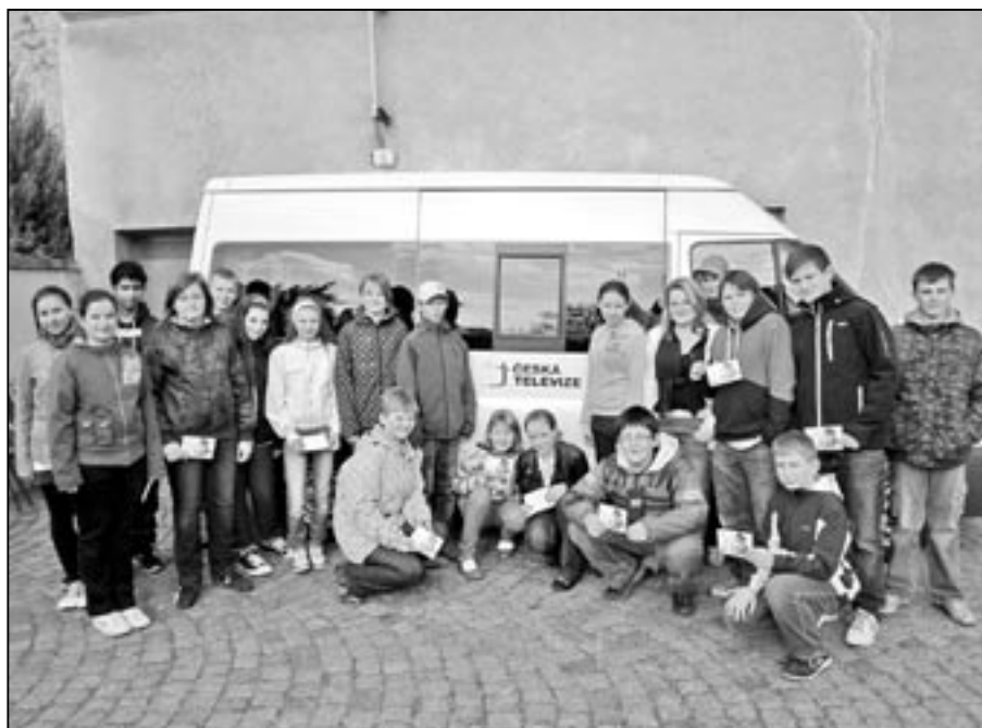
Chlapci a dívky ze třídy 7. B budou k vidění na televizních obrazovkách 2. května 2012 od 17:30 h. na ČT2 v rámci Planety YÓ.