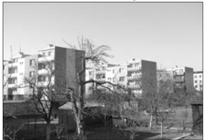
Nezvyklý pohled na sídliště Michalská ve směru od místa, kde dříve stával kostelík sv. Víta.