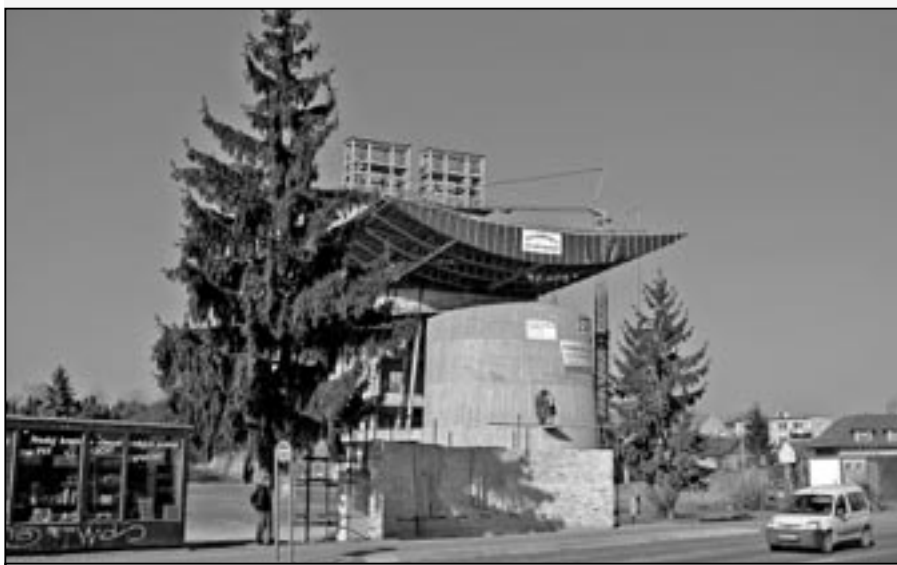
Veřejná sbírka na stavbu nového kostela Svatého Ducha proběhne v našem městě ve dnech 14. května až 20. května 2012.

omilostněna. Její stále aktuální poselství nám je obsaženo v jejích slovech v Káni: Dělejte všechno, co vám můj Syn řekne.