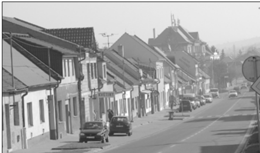
Část Brněnské ulice leží na mírném kopci. Při pohledu dolů spatříme většinou starší domky. Každý z nich je jiný a domky mají i rozdílné barevné fasády.