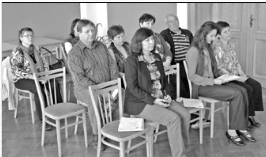
Účastníci zasedání zastupitelstva.