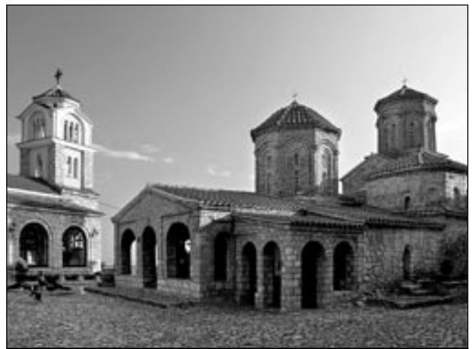
Na snímku chrám sv. Sofie v Ochridu.

byl v Ochridském klášteře pohřben. Jako svého nástupce si však arcibiskup Metoděj vybral biskupa Gorazda a těsně před svou smrtí 6. dubna 885 si k sobě svolal Moravany a představil jim svého nástupce slovy: „Toto je muž svobodný a z vaší země, dobře obeznalý v latinských knihách a zbožný. To budiž Boží vůle a vaše láska, jakož i má.“ Na Metodějovu volbu měly zásadní vliv především Gorazdovy znalosti jako i jeho zbožnost. V naší zemi je stále dáván na první místo za arcibiskupa Metoděje biskup Gorazd, zatímco jinde je většinou do popředí staven biskup Kliment.