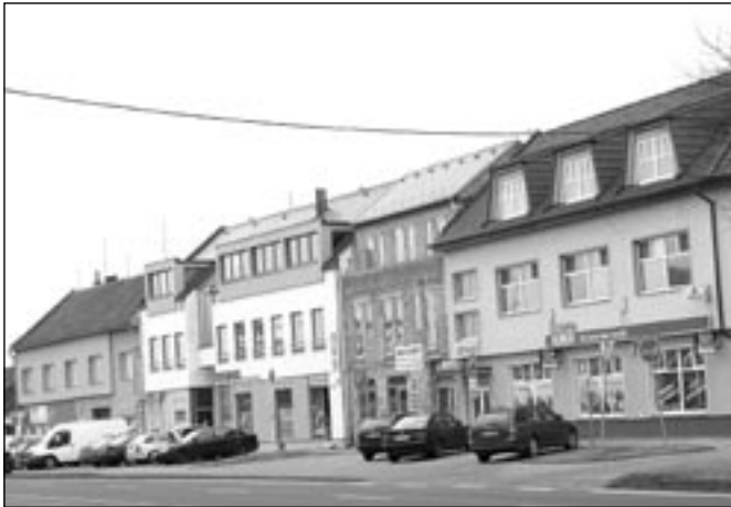
Původní zástavba nízkých domků byla v Hradištské ulici nahrazena novými, vícepodlažními objekty.