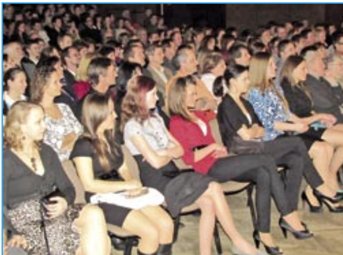
Místa v sále Kulturního klubu v Uherském Hradišti byly po oba dny vyprodány.