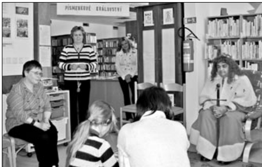
Jednou za rok se městská knihovna promění v Písmenkové království. Knihovnice a král Knihoslav zde přivítají žáky 1. tříd se svými učitelkami. Prvňáčci se pochlubí, jak pěkně se naučili číst slovíčka a jednoduché věty.

Děti mají rády komiks, Thomase Brezina, fantasy literaturu, Deník malého poseroutky. U dospělých je to Nora