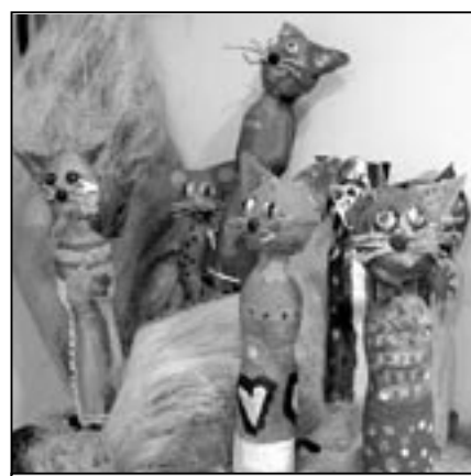
Kočky malované na skle.