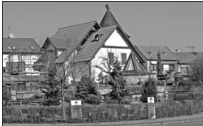
Ráj pro všechny milovníky bonsajů najdeme v areálu firmy Isabelia na rozcestí ulic Huštěnovská a Velehradská. K vidění je také muzeum špičkových bonsajů, které šikovní lidé z Isabelie prezentují na prestižních evropských výstavách. Otevřeno mají od pondělí do pátku v době od 8:30 do 17:30 h. a v sobotu od 8:30 do 16:30 h.

Střední odborná škola a Gymnázium Staré Město 20.000 Kč, zastoupena ředitelem školy Mgr. Bedřichem Chromkem na výměnný pobyt studentů