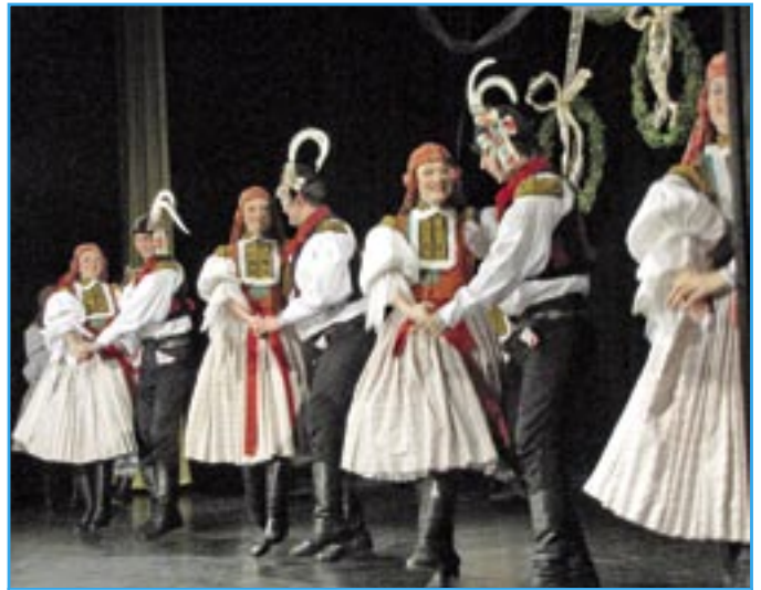
Dolina v první části vystoupení.