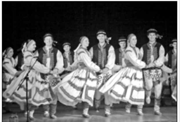
Šohají a děvčice ze souboru Dolina byli opět perfektní a potěšili publikum v sále.