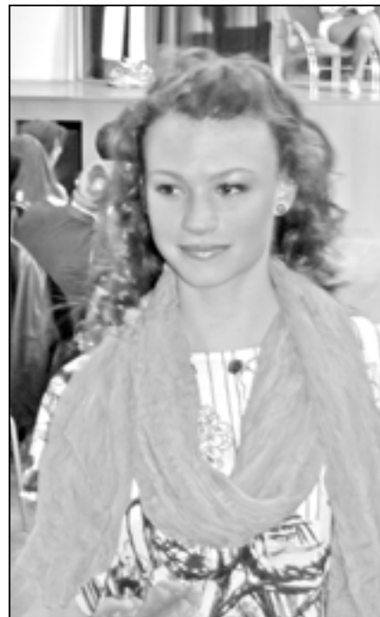
Už víte, co je to móda?

Móda je o tom, co o nás naše oblečení vypovídá. I za pár korun si lze v dnešní době obstarat zajímavé, originální a módní oblečení. Velmi důležité je, aby měl člo-