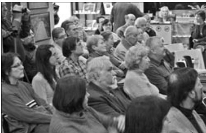
Pohled do zaplněného přednáščího sálu Památníku Velké Moravy.