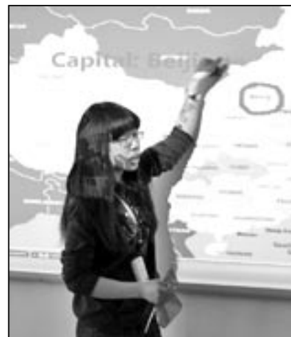
Studentka z Číny.