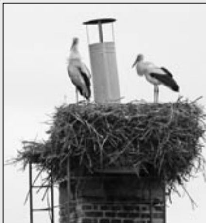
Čapí dvojice na hnízde v Klukově ulici.