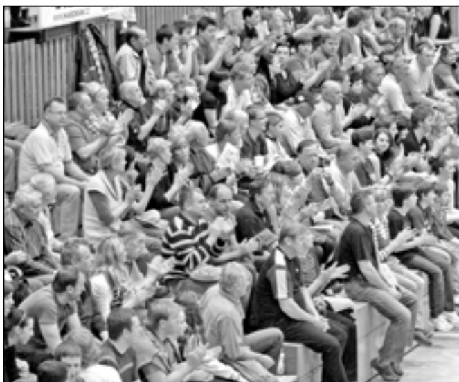
Fandové domácího týmu neúnavně povzbuzovali.

První utkání se hrálo v pátek 16. března 2012 v Českých Budějovicích a skončilo se znamenitým výsledkem pro Staré Město, které zvítězilo hladce 3:0 (18, 22, 19). Hlavně v prvním