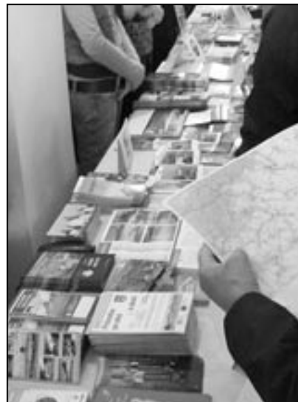
Návštěvníci miniveletrhu měli k dispozici propagační materiály jednotlivých mikroregionů ze Slovácka. Nechyběly i mapy, pohlednice a turistické prospekty ze Starého Města.

„Slovácko je aktivní destinací, která se snaží své služby neustále zlepšovat a přicházet s nějakými novinkami. Navíc je zde viditelná spolupráce mezi