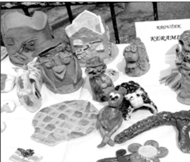
Výrobky šikovných dětí z Klubka - kroužku keramiky.

Koloběžkádu a jízdy zručnosti, Dny dětí a Jarní olympiádu