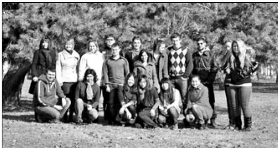
Účastníci mezinárodního projektu Edison.

Zahraničním studentům se věnovali naplno nejen učitelé anglického jazyka, ale zejména studenti, kteří jim poskytli ubytování. Při zahájení studenty anglicky přivítal a pak se zájmem dění na škole sledoval ředi-