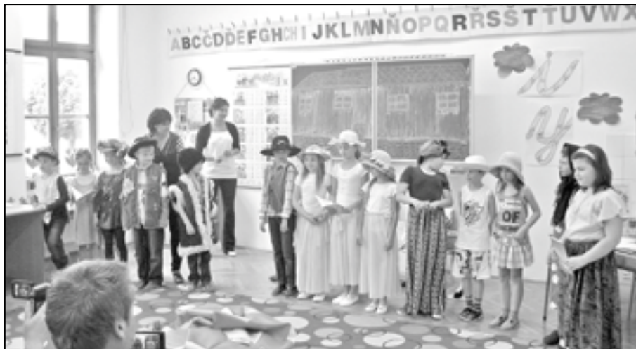
Chlapci a dívky z 2. A. nazkoušeli pohádku.