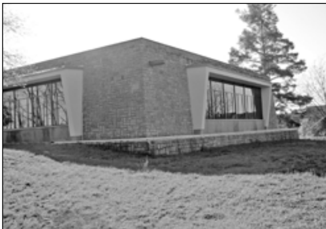
V Památníku Velké Moravy se 18. května 2012 uskutečnila Noc řemeslníků.