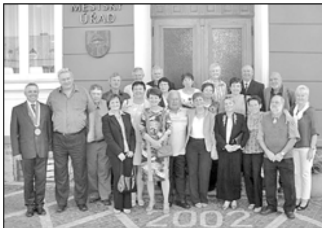
Muži a ženy z bývalé třídy 9. B se sešli v největším počtu.