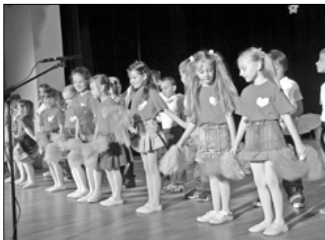
Děti z mateřské školy Rastislavova při tanečním vystoupení na písně Michala Davida.