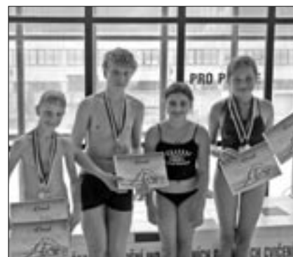
Úspěšní plavci jednoty Orel Staré Město.