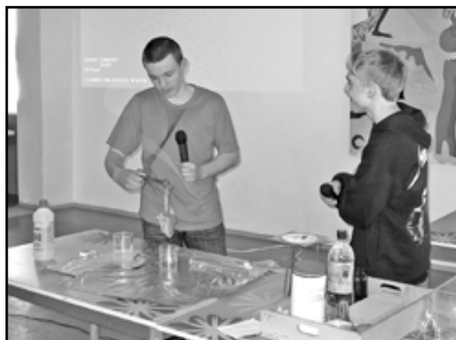
Při Oborových dnech jsme si zahráli na světoznámé chemiky.