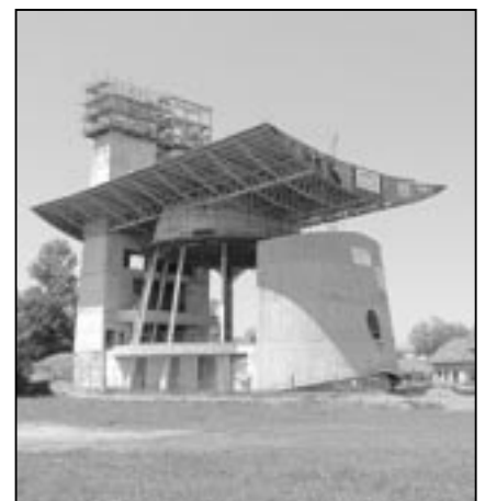
Veřejná sbírka na stavbu kostela sv. Ducha se uskutečnila ve dnech 14. - 20. května. Všem dárcům upřímně děkujeme. Na snímku nová dominanta města v sobotu 19. května 2012.

Kdekoliv se dáme do hovoru o věcech obecných, narazíme na deziluzi lidí v souvislosti s úpadkem uplatňování politiky a práva. Neuspokojí ani vědomí, že to není nic nového pod sluncem, byly brutálnější časy. V církvi se v celých jejích dějinách vyskytují mučedníci za věrnost křesťanské víře a účtu k mravním a právním zásadám inspirovaným křesťanstvím jako biskup Jan Fisher a královský tajemník Tomáš Moore-patron politiků a právníků, dva vynikající a věrní synové Anglie spolu s dalšími 53 lidmi pevného charakteru, které tak vyspělá kulturní země nechala r. 1535 popravít