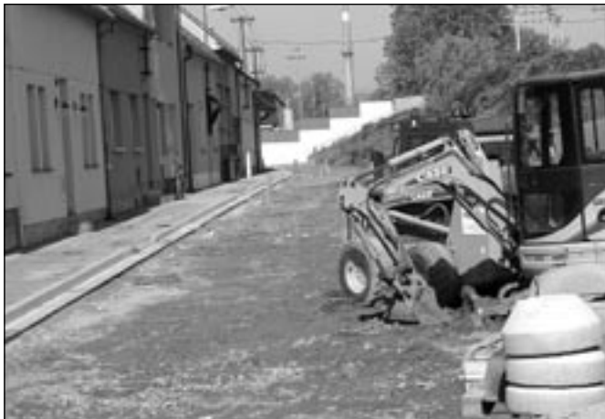
V současné době probíhá rekonstrukce ulice U Potoka. Již v brzké době zde bude dokončena nová komunikace a chodník.

disku ve Starém Městě, k. ú. Staré Město u Uh. Hradiště, společnosti Lékárna Za Mlýnem s. r. o., Za Mlýnem 1857, Staré Město, od 1. 6. 2012 na dobu neurčitou a stávající nájemné (lékárna 1.038 Kč/m 2 /rok, sklady 885 Kč/m 2 /rok, chodby 520 Kč/m 2 /rok s inflační doložkou k 1. 7.), za účelem provozu lékárny.