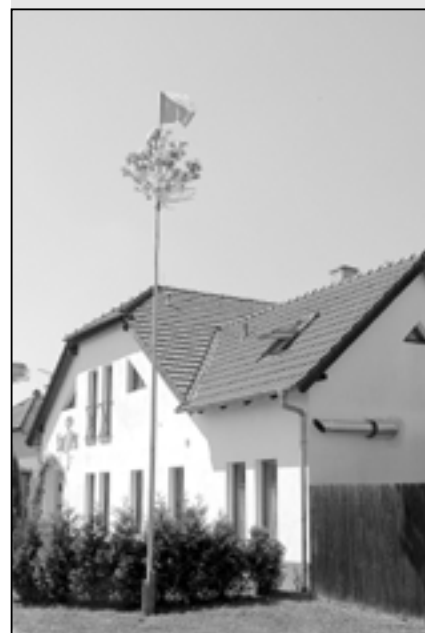
Jedna z májek ve Starém Městě, která byla postavena v blízkosti hospůdky u Svatého Petra.