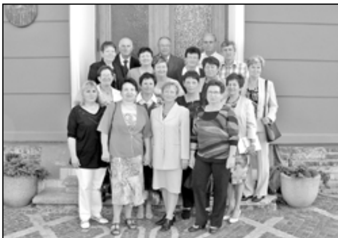
Bývalá třída 9. A na setkání 45 let po ukončení základní školy.