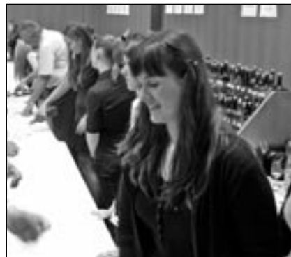
U vzorků bílých vín bylo stále živo.