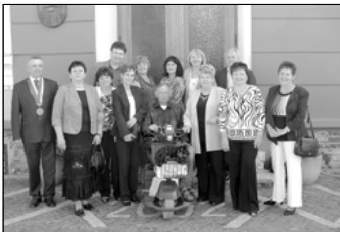
Třída 9. C u staroměstské radnice, kde proběhlo přijetí starostou města.