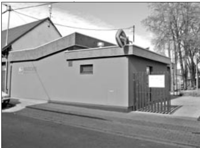
Vstup do relaxačního centra je z Kosmovy ulice.

Již vybudovaná zařízení, tenisové kurty a beach volejbalové kurty se zastřešenou pergolou, které provedli svépomocí volejbalisté Starého Města za finančního příspěví svých mecenášů, jsme tak převzali pronájmem a dále jsme provedli stavební úpravy. Ukončením pře-