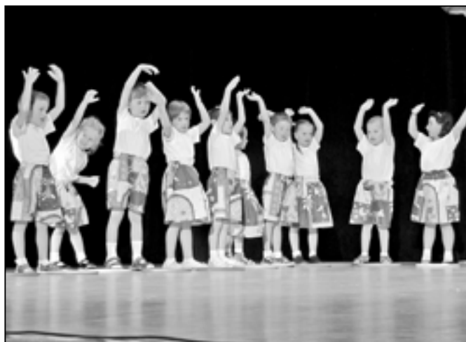
Básničky a cvičení s názvem Mravenčí ukolébavka předvedly děti z Křesťanské mateřské školy v ulici Za Radnicí.