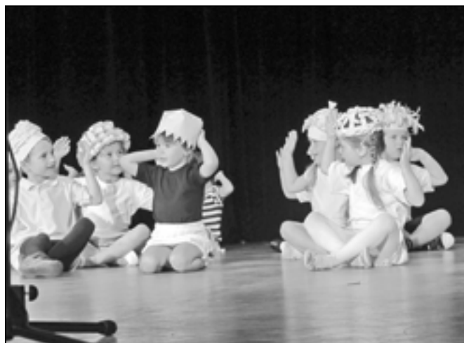
Děti z Orla při cvičení a pohybových hrách.