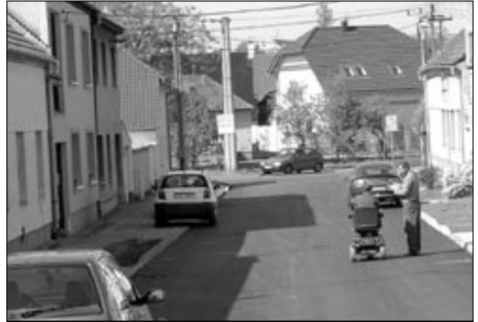
Ulicí V Zahradě nyní projíždíme po novém asfaltovém povrchu.