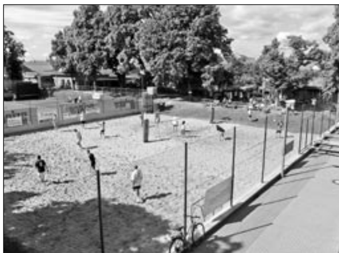
Na kurtech za sokolovnou si všichni zájemci mohou zahrát tenis a plážový volejbal.