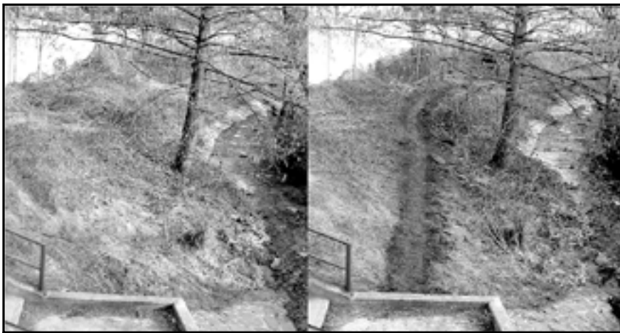
Cyklostezka před několika měsíci a v současnosti.