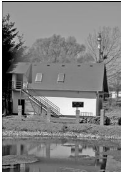
Klubovna rybářů na Rybníčku je po rekonstrukci s novou střechou a elegantním pláštěm budovy.

e-UtilityReport – Elegantní řešení pro podání žádosti o vyjádření k existenci sítí