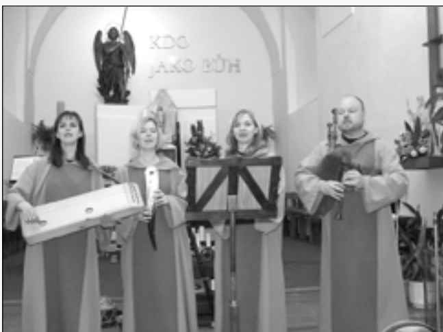
Kvartet zpěváků a instrumentalistů skupiny Solideo.

Neděli 6. května 2012 se uskutečnil v kostele sv. Michaela ve Starém Městě koncert skupiny Solideo. Kvartet zpěváků a instrumentalistů předvedl 25 dobových nástrojů období gotiky, renesance a baroka se skladbami z téhož období. Přítomní diváci byli vtaženi do hudby a zpěvu, děti měly možnost si na závěr prohlédnout nástroje z různých kostí, rohů,