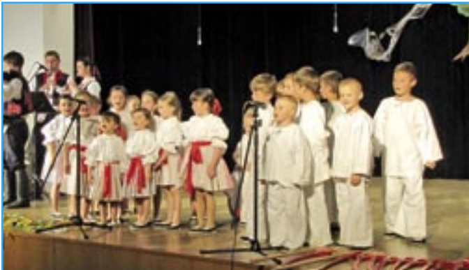
Pohled do dávné historie nám nabídla Dolinečka II s vystoupením Na Turka.