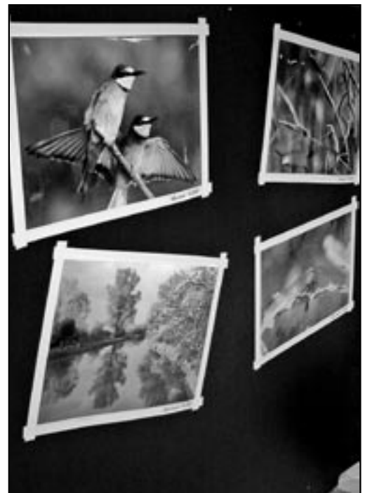
Příroda je mocná čarodějka a nacházíme v ní jevy neskutečné.