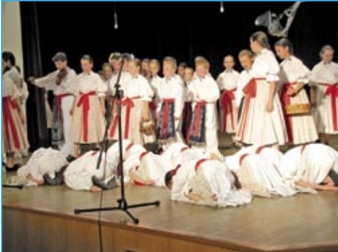
Nový pořad s názvem Život stromu zahájila Dolinečka I pásmem Jak sme sadili střešně.