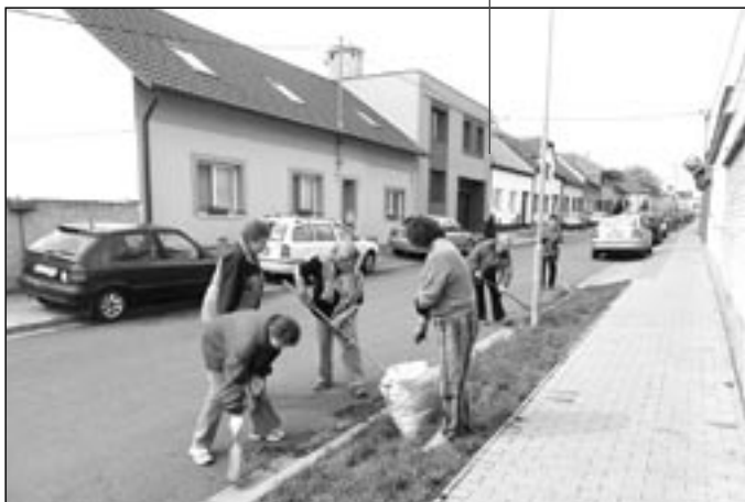
Skupina žen se zapojila do úklidu v Kosmově ulici.