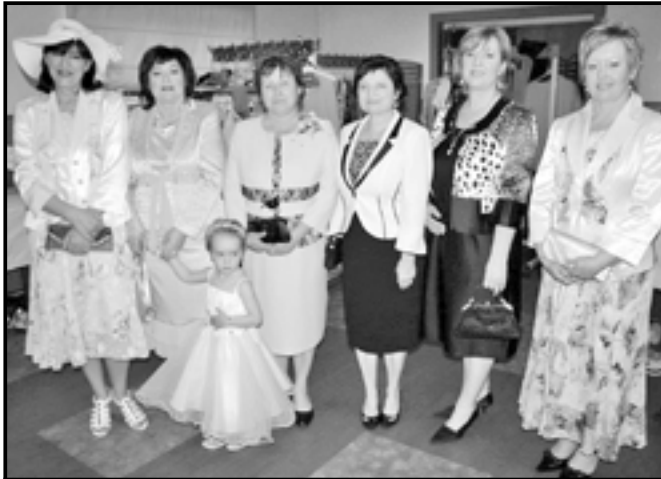
Modelky a družičky se předvedly v krásně sněhobílých svatebních šatech.