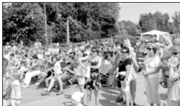
Staroměstský den se letos uskuteční v jiném termínu a na jiném místě. Těšíme se na Vás v areálu výstavy Zahrada Moravy v neděli 17. června 2012 od 14 do 15:30 hod. Na snímku účastníci Staroměstského dne na Rybníčku v červnu 2011.