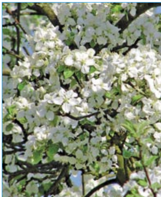
Krásně rozkvetlá jabloň.