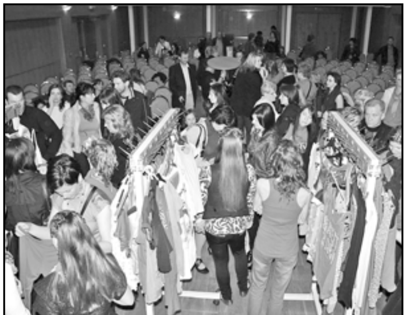
Všechny předváděné modely si mohli zájemci zakoupit ihned po skončení přehlídky.