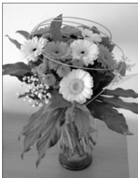
Všem našim babičkám posíláme krásnou kytici květů. Proč? Jen tak pro radost a potěšení.