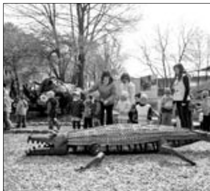
V Kovosteelu mají jedinečnou KOVOZOO, ve které je k vidění 31 zvířat. Jedním z nich je také krokodýl.

Dobrý kamarád rád sluníčku pomůže. V mateřské škole Komenského se dobrých kamarádů našlo hodně. Bě-