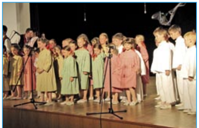
Dolinečka IV nadchla zaplněný sál sokolovny svou skladnou Čížček.