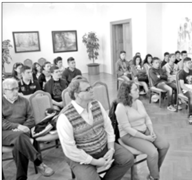
Obřadní místnost staroměstské radnice se zaplnila italskými studenty a jejich vyučujícími.

obdobím. Na území Starého Města totiž vznikl v devátém století první státní útvar Velkomoravská říše. Latina má také úžasnou historii. I když současné město Latina bylo založeno teprve v roce 1932 asi 60 km jižně od Říma, antická historie Latiny se traduje ještě z doby před vznikem mocného Římského impéria. Nyní žije v Latině asi 110 tisíc