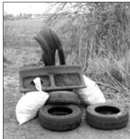
Jedni se snaží, druzí zas dělají nepořádek a znečišťují přírodu a životní prostředí. Dnes a denně se setkáváme s nečinností některých spoluobčanů, jejich lhostejností a opovržením tímto světem.

Každý by měl začít u sebe a uklidit si. Je mnoho lidí, kteří tak činí a všichni, kteří jdou kolem jejich rodinných domů, bytů, zahrádek a prostran-