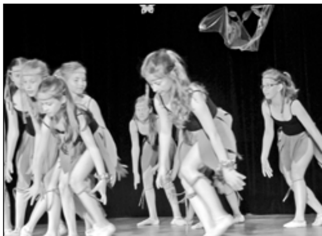
Dívky ze 4. ročníku tanečního oboru ZUŠ při vystoupení Divošky a Čanki.