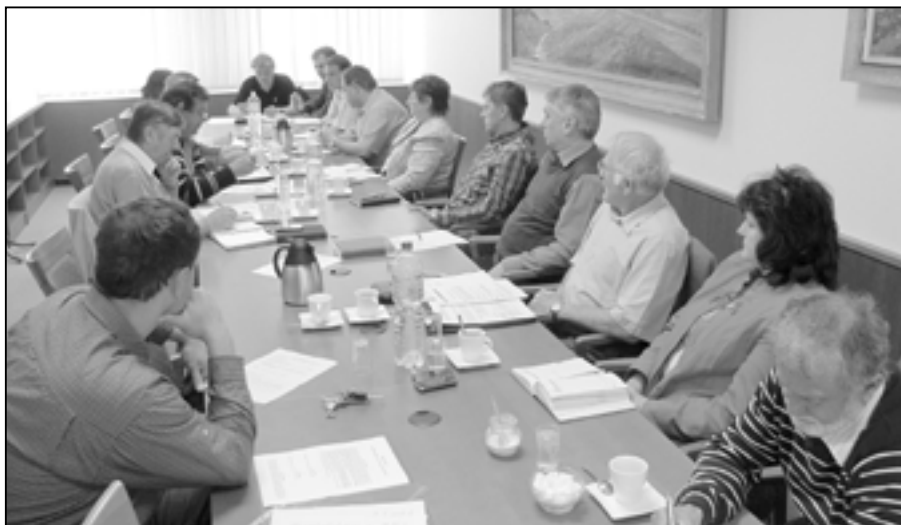
Zástupci mikroregionu Staroměstsko při zasedání na radnici ve Starém Městě.