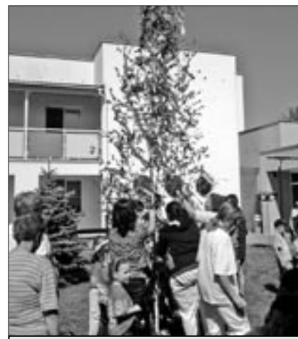
Děti z mateřské školy Komenského pomohly vyzdobit májku klientům Ústavu sociální péče na Kopánkách.