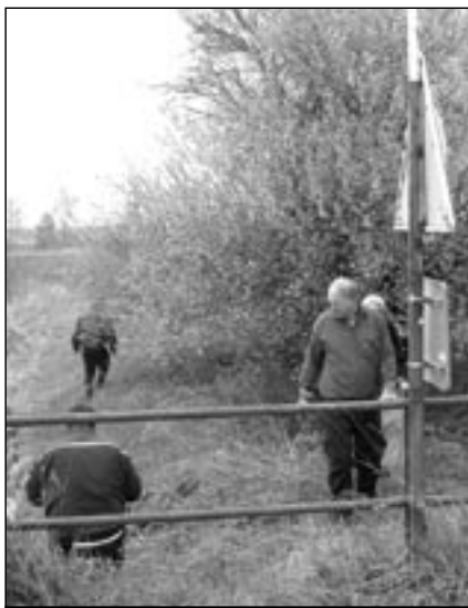
Myslivci při úklidu odpadků v přírodě.

Stejně jako v minulém roce, také letos se v našem městě uskutečnil Den Země 2012 společně s akcí Pojďme