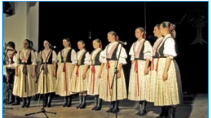
Dívčí sborek Repetilky a jejich vystoupení s tajemným názvem Zakletí.