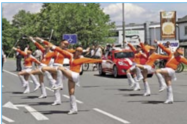
Mažoretková skupina Rolničky z Ostrožské Lhoty.