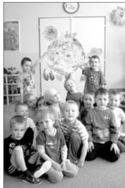
Týden Země s dětmi v mateřské škole Rastislavova.