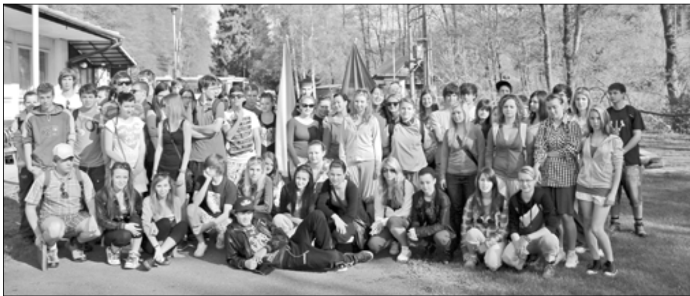
Společná fotografie studentů.