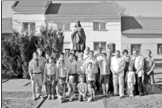
Společná fotografie účastníků pietního aktu.

V pondělí 30. dubna 2012 v 17 hodin se uskutečnil pietní akt u památníku obětí druhé světové války v Hradištské ulici.