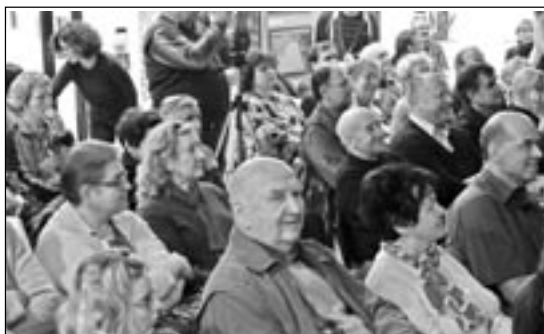
O přednášce v Památníku Velké Moravy je vždy velký zájem. Jak vidíme na snímku, převažují lidé střední a starší generace. Jsou zváni i studenti a další mladí lidé.