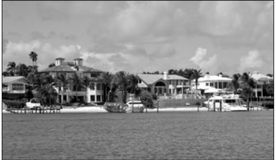
Záliv Juno Beach, kde měl ještě nedávno zámeček o rozloze 17 tisíc čtverečních stop golfista Tiger Woods.

Dále to byla večerní návštěva Disneylandu se všemi možnými atrakcemi.