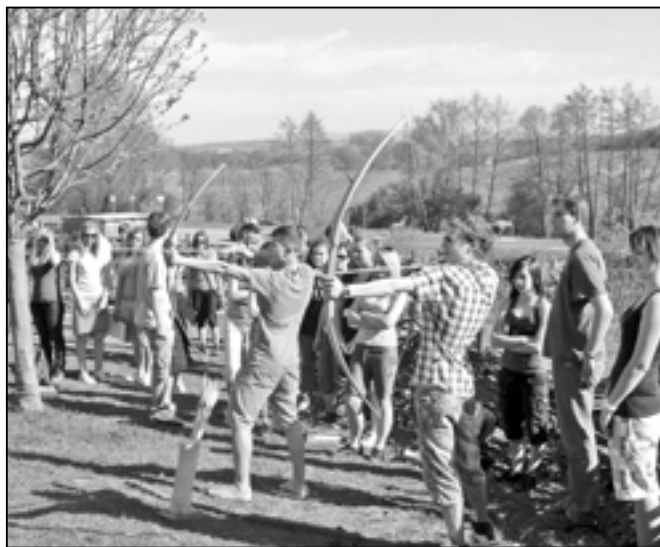
V archeoskanzenu na Modré si studenti vyzkoušeli střelbu z luku.