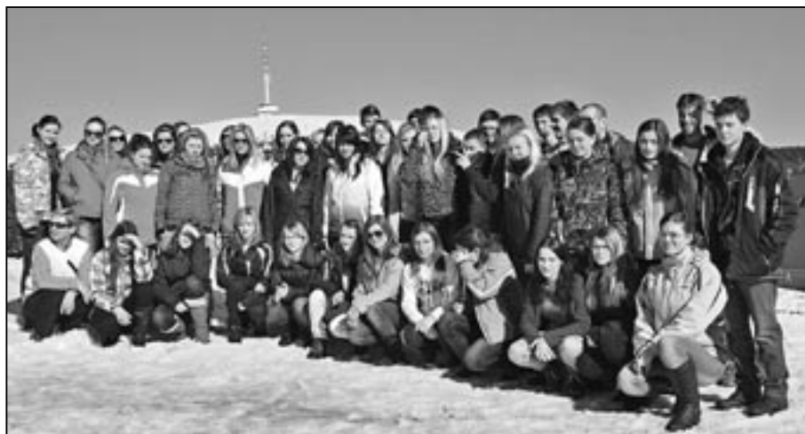
Studenti ze Střední odborné školy a Gymnázia Staré Město se vypravili na týden do Jeseníků.