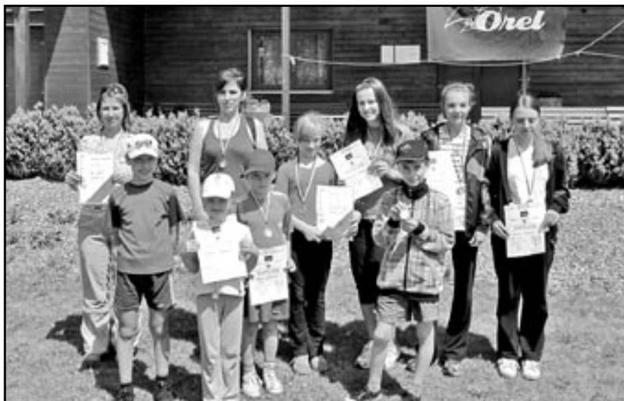
Atletičtí ze Starého Města na závodech v Nivnici.