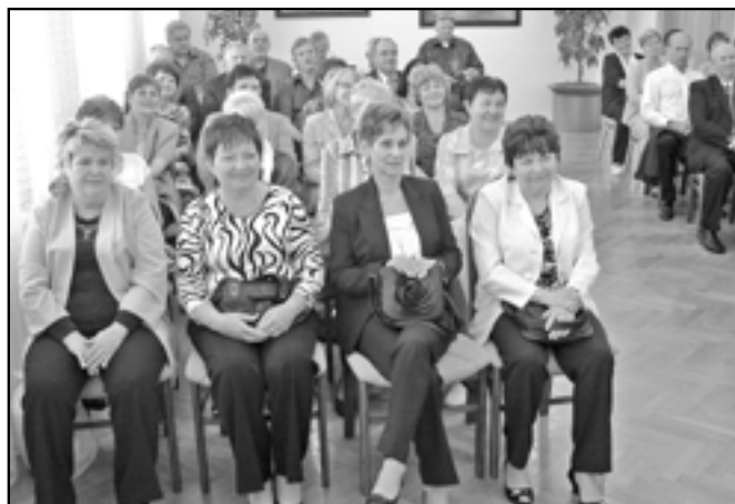
Jubilanti v obřadní síni na radnici.