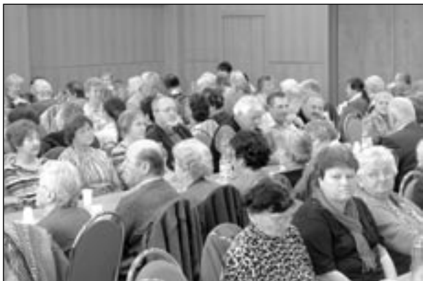
Sportovní sál SKC - sokolovny se zaplnil do posledního místa.

termální koupaliště. Letos uspořádají dva zájezdy, jeden 13. června a druhý 8. srpna. Každý účastník musí mít platný doklad totožnosti a zdravotní pojištění při cestě do ciziny. A vzhledem k tomu, že Slováci mají evropskou měnu, je nutno si opatřit eura. Třetí letošní zájezd zavede všechny zájemce do Beskyd na Pustevny s vycházkou k soše Radegasta, případně i ke kapli Cyrila a Metoděje. Pro zlepšení zdravotního stavu členů organizací jsou určeny rekondiční pobyty v Luhačovicích v moderně rekonstruovaném hotelu Pohoda, který je vybaven také bazénem. Dva turnusy pobytů jsou na programu v červnu a jeden v listopadu 2012. Další zájemci se mohou přihlásit na ozdravný pobyt ve Vrbně pod Pradědem v hotelu