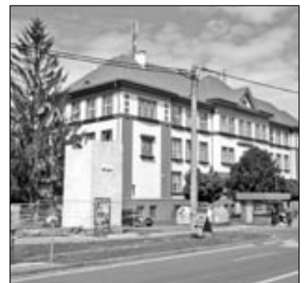
V květnu byla zbourána bývalá trafostanice u základní školy.