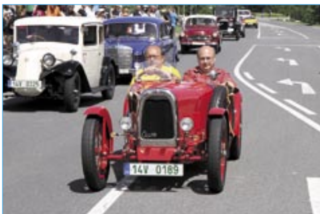
Historické skvosty z Veterán klubu Kunovice v prostoru startu a cíle.

Příští číslo Staroměstských novin vyjde 29. června. Uzávěrka je 18. června 2012.