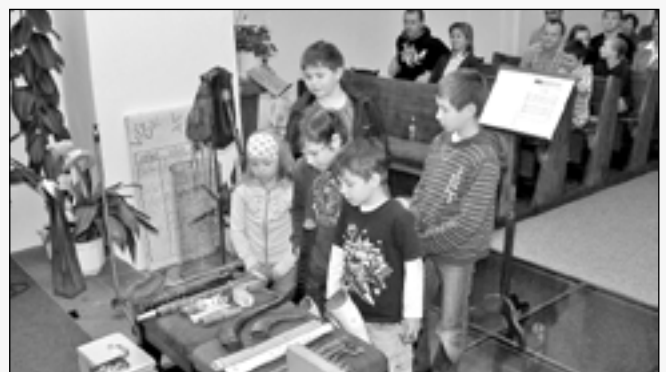
Děti si na závěr koncertu prohlédly nástroje z různých kostí, rohů, bubínky a další starobylé strunné nástroje.

bubínky, nástroje připomínající dudy a starobylé strunné nástroje a všichni odcházeli domů s pěkným zážitkem z poslechu nevěšední hudby.