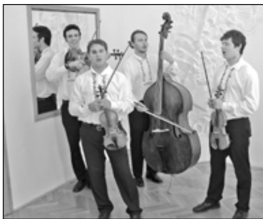
K dobré pohodě zahrála CM Báležáci.