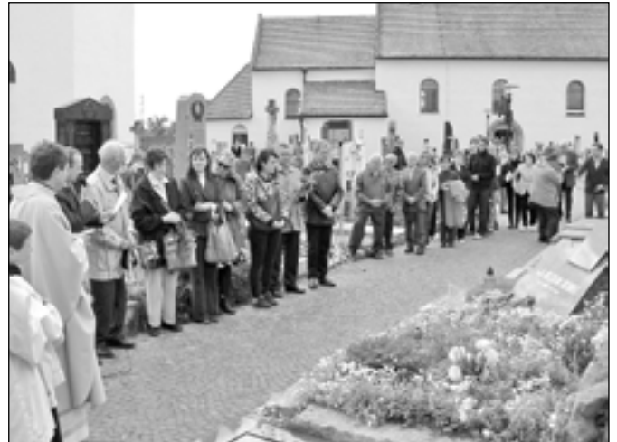
Vzpomínkové setkání u hrobu Dr. Ing. Rostislava Sochorce se uskutečnilo v neděli 13. května 2012 na hřbitově ve Starém Městě.