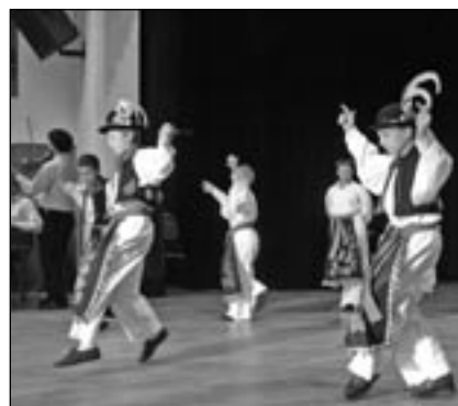
V kulturním programu vystoupili tanečníci slováckého verbuňku.