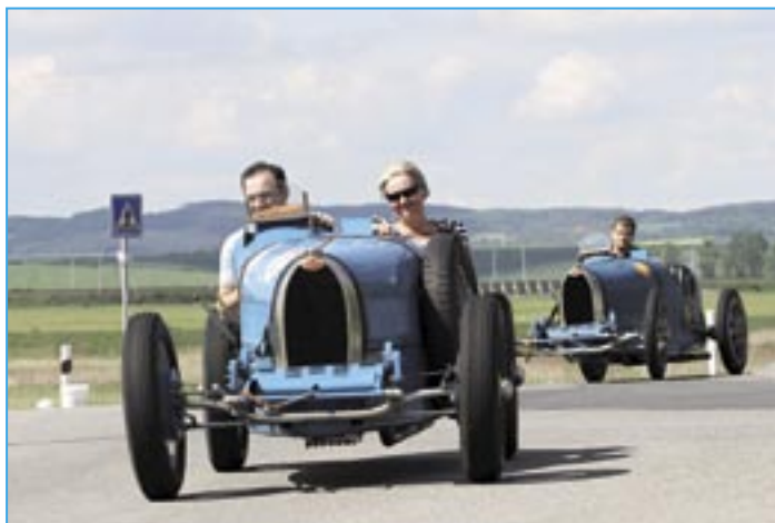
Mezi jednotlivými závody kroužily po trati repliky bugatek z Muzea Aloise Samohýla.