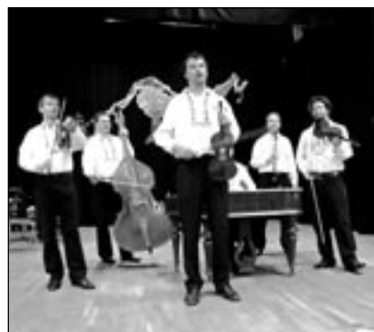
K dobré pohodě zahrála cimbálová muzika Mladí Burčáci.