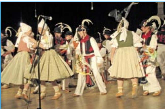
Děvčice a šohaji z Dolinečky III nám předvedli Velikonoce na Slovácku.