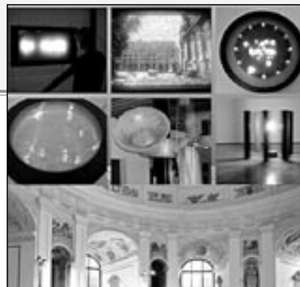
Interaktivní výstava Actis Effector (Tvořeno světlem) bude v Rotundě Květné zahrady v Kroměříži instalována od 5. června do 26. srpna 2012.

nelů, LCD obrazovek, počítačem řízených objektů i zvukových instalací. Důležitým prvkem celé výstavy je citlivé zakomponování těchto technicky propracovaných artefaktů do prostoru i převážně interaktivní ráz vystavovaných artefaktů. Návštěvníci budou mít příležitost měnit světelnou atmosféru Rotundy vlastním pohybem, mohou na velkoplošných panelech proměňovat obrazce a společně vytvářet a sledovat výstavu v mnoha akčních proměnách. Uvnitř raně barokní Rotundy Květné zahrady v Kroměříži naleznete u nás zatím ojedinělé ukázky nového druhu umění, které díky počítačové technologii pracuje se světlem a jeho barvami, s pohybem objektů v prostoru, s animačním oživením sochy a také s výtvarnými symboly, jež přímo dokreslují význam tohoto místa zapsaného na Seznam památek UNESCO.