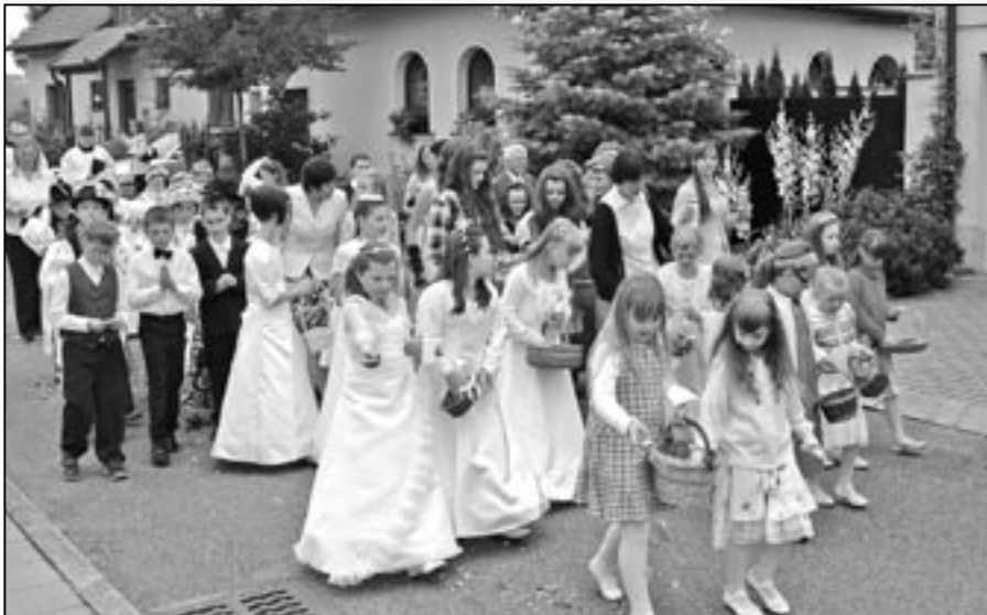
Vzpomínka na svátek Božího Těla a první svaté přijímání dětí v neděli 26. června 2011.