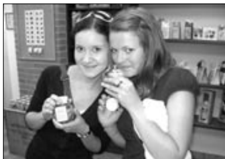
Poslední týden školního roku na SOŠ a Gymnázium Staré Město byl ve znamení exkurzí.

Poslední týden školního roku organizuje SOŠ a Gymnázium Staré Město pro své studenty výběrové exkurze či jiné zájmové aktivity. Zájemcům o chemii nabízíme exkurze do potravinářských a chemických podniků našeho kraje.