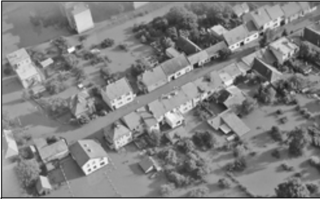
Svatovítská ulice byla několik dní pod vodou.