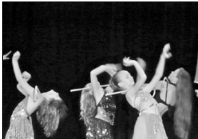
Orientální tanečnice v akci.