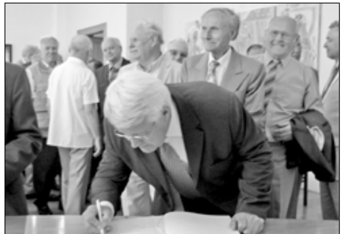
Do Pamětní knihy Starého Města se zapisuje držitel zlaté olympijské medaile Josef Panáček.