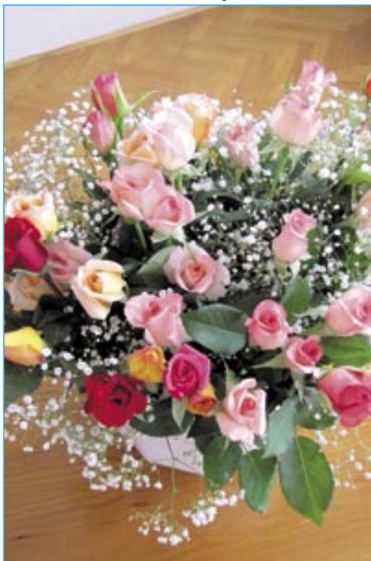
Kytice růží maminkám dětí, které se zúčastnily obřadu Vítání občánků.