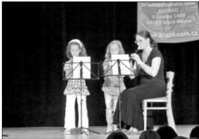
Dívčiny se svou učitelkou zahrály na flétny.