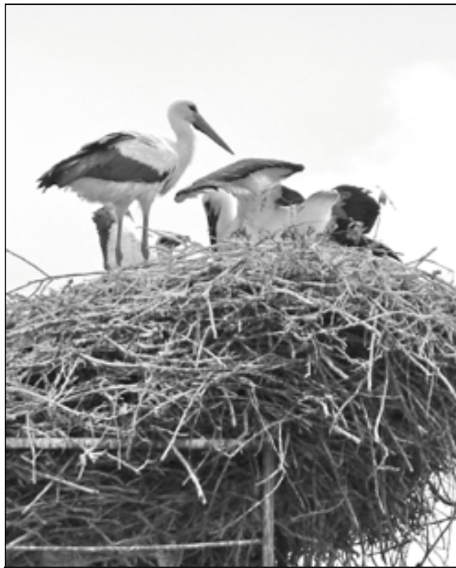
Čápice si hraje s již odrostlými čápaty na komíně v Klukově ulici.