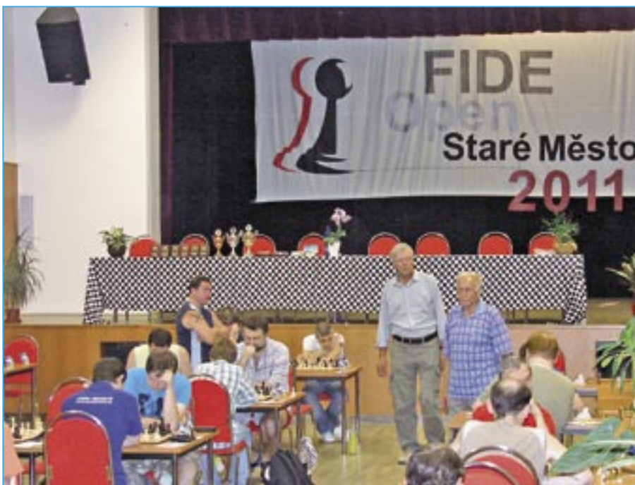
Z průběhu turnaje FIDE OPEN Staré Město 2011.