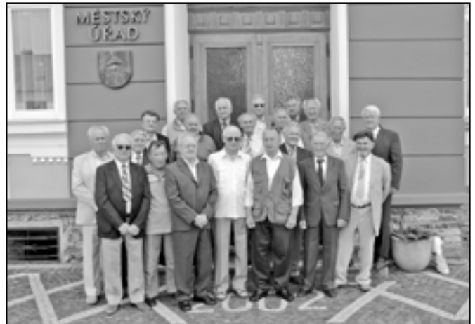
Muži ročníku 1937 na setkání 60 let po ukončení základní školy.