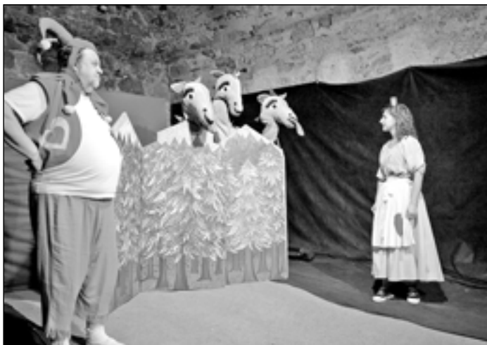
Sérii pohádek o Kašpárkovi můžete vidět o prázdninách na hradě Buchlov v podání herců Hoffmannova divadla.