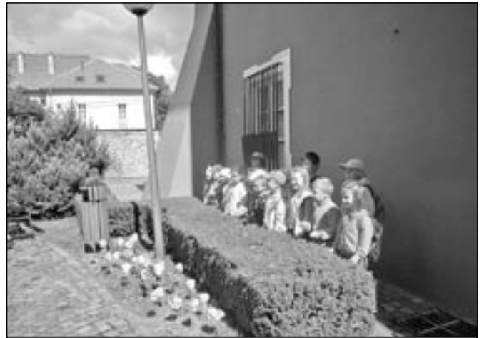
Chlapci a děvčata zasadili papírové květiny na nádvoří galerie.