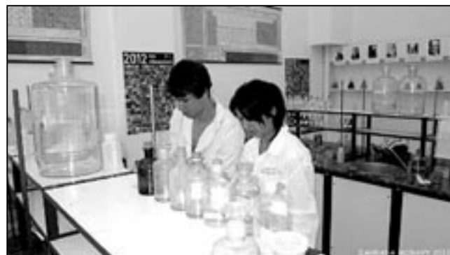
Návštěvníci výstavy Zahrada Moravy mohli přinést vzorky své vody k rozboru.