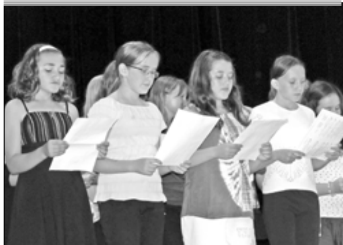
Pěvecký sbor základní školy při vystoupení v SKC - sokolovně dne 28. června 2012.