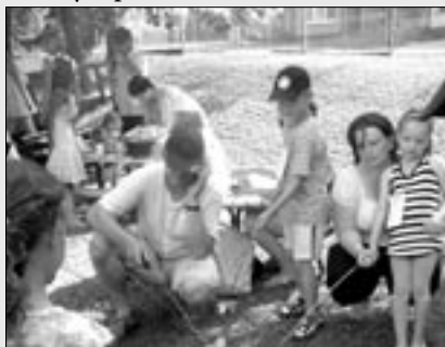
Zahradní slavnost a opékání špekáčků.