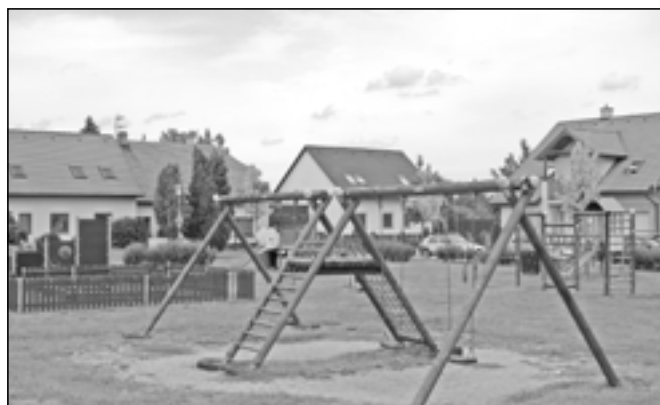
Dětské hřiště v Luční ulici doznalo změn. Byly vyměněny a opraveny opotřebované části jednotlivých prvků hřiště.