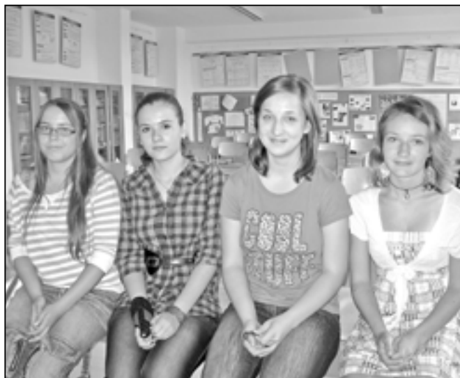
Úspěšné účastnice literární a výtvarné soutěže Píšu povídky, píšu básně.