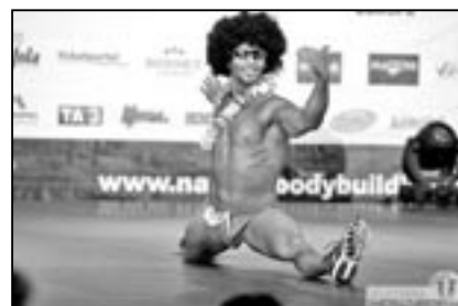
Ukázka ze sestavy kategorie Body - Fitness.