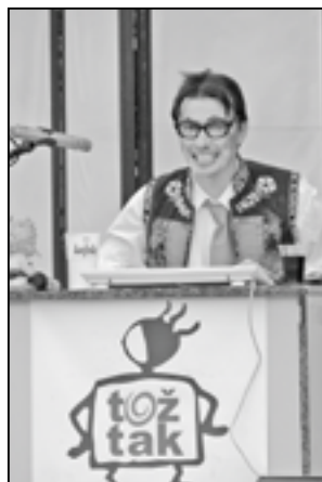
TV TOŽ TAK je závislé televizní vysílání aneb Všechno dobrí rodáci.