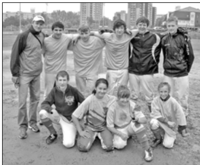
Softbalisté Základní školy Staré Město dosáhli velmi pěkného úspěchu a obsadili páté místo v České republice.