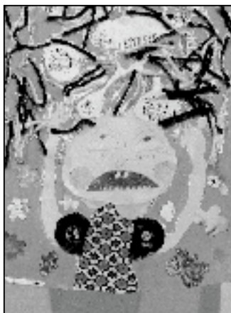
Dětská výtvarná tvorba.

Také vy jste srdečně zváni do naší městské knihovny k prohlídce zajímavé výstavy.