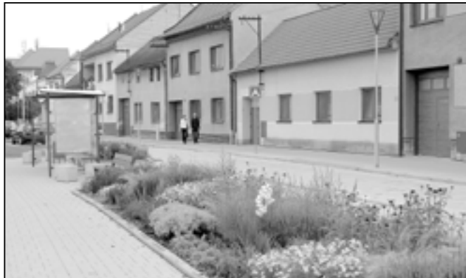
Kolemjdoucí obdivují záplavu květů.