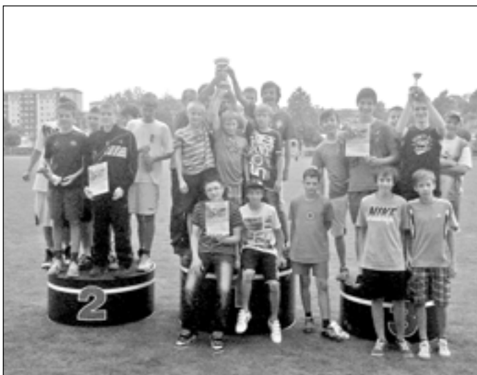
Velmi úspěšné družstvo mladších žáků Základní školy Staré Město při krajském finále celostátní atletické soutěže „Pohár rozhlasu“, kde získali krásné třetí místo.