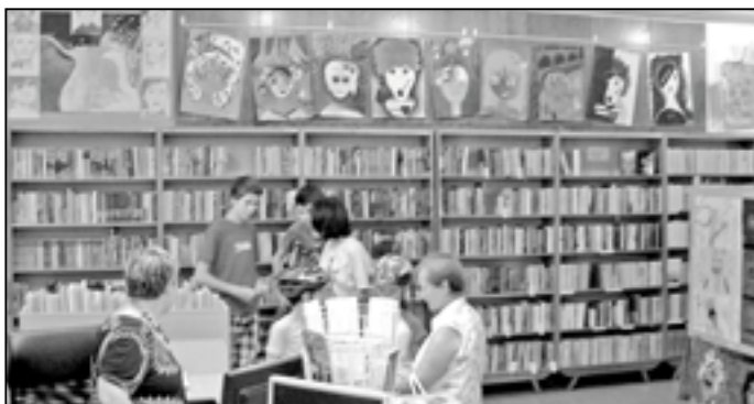
Městskou knihovnu vyzdobily obrázky dětí ze základní umělecké školy.