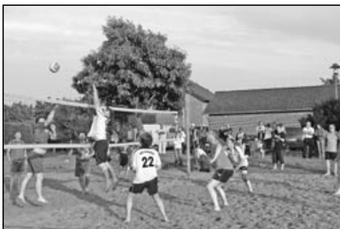
Po skončení volejbalového utkání se uskutečnila sbírka na pomoc potřebným dětem ve Starém Městě.

ku. Po společném obědě byla na programu návštěva v „Action meteor“, což je organizace pro pomoc potřebným. V podvečerních hodinách pak zasedli ke společnému stolu delegace SOŠ a Gymnázia Staré Město a Gymnázia Michaela Endeho z Tönisvorstu. Závěr dne pak patřil společenskému večeru, kde vyhrávala Staroměstská kapela.