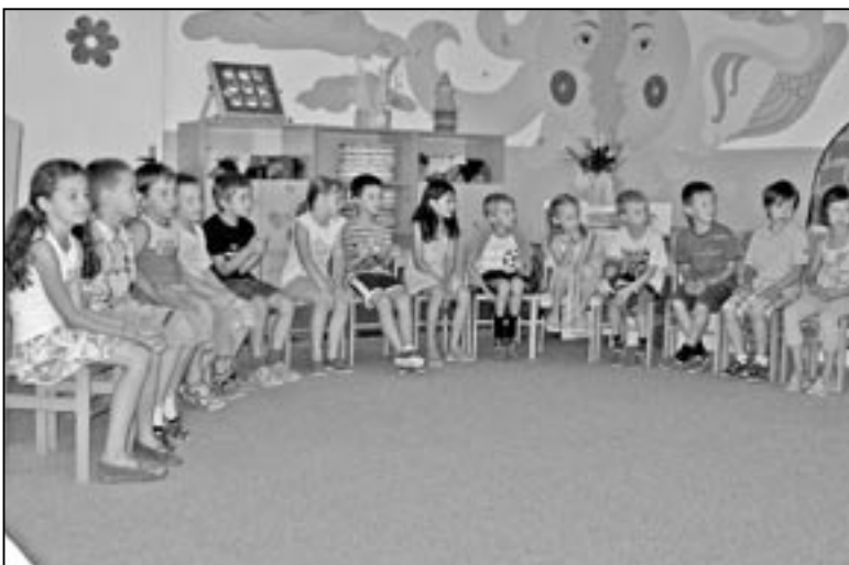
Chlapci a dívky z MŠ Rastislavova jsou připraveni na pasování.