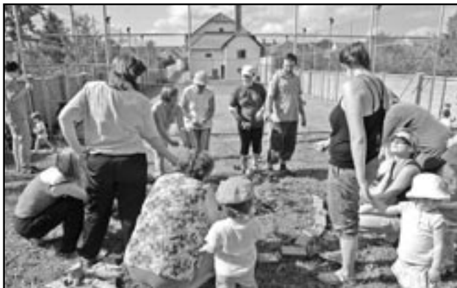
Opékání špekáčků na Orlovně ve Starém Městě.

Za krásného počasí si ve čtvrtek 21. června 2012 děti z oddílu Cvičení rodičů s dětmi, zacvičily, zahrály hry a opekly špekáčky, aby jako první oddíl ukončily sezonu školního roku 2011/2012. Stejná akce proběhla ještě v pondělí 25. června, a to oddíly Cvičení a pohybové hry I a II. Závěr patřil následující pátek oddílu Rekreační sporty. Přejeme všem cvičencům i jejich rodičům pěkné prázdniny a těšíme se na zahájení nové