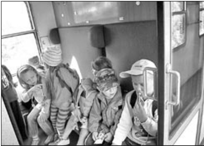
Děti ve vlaku do Uherského Hradiště obsadily kupé osobního vozu.