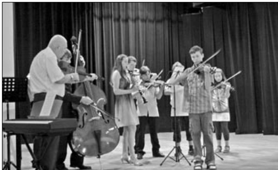
Folklorní soubor základní školy zahájil slavnostní obřad.