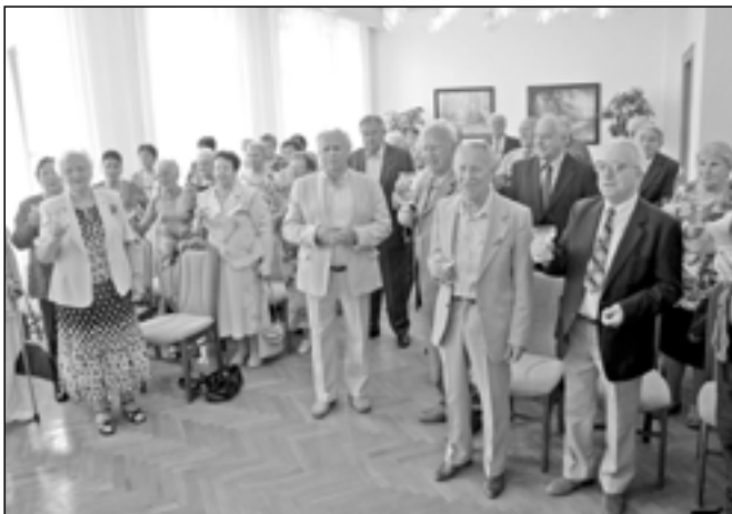
Společný přípitek v obřadní síni.