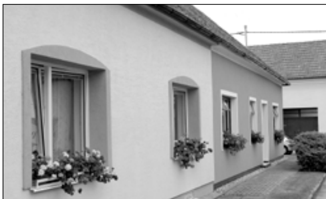
Mnoho domů v našem městě zdobí květiny v oknech i v předzahrádkách. Na snímku květinové domy v Michalské ulici.