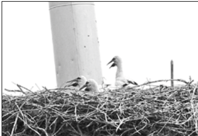
„Tři mušketýři“ na komíně v Klukově ulici.