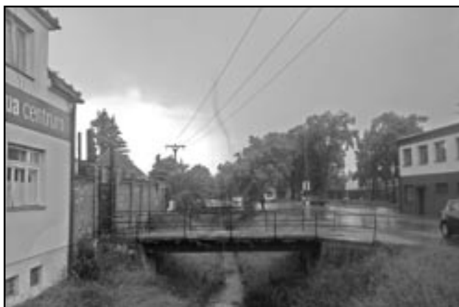
Tornádo jsme vyfotografovali ve směru od sokolovny do Tyršovy ulice.

Nebývá častým jevem, abychom ve Starém Městě pozorovali tornádo. Naším čtenářům se podařilo vyfotografovat tento nezvyklý přírodní úkaz. Jednalo se o tornádo, které bylo pozorováno v úterý 12. června 2012 v 15:15 hod. Naštěstí nenapáchalo žádné škody na zdraví občanů a jejich majetku. MK