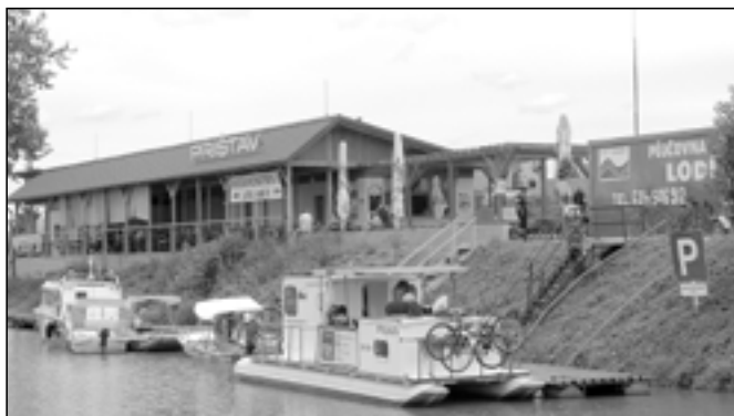
Již od 26. května 2012 slouží veřejnosti a všem zájemcům o plavbu po Bažově kanálu nový přístav. Přichází sem i mnoho lidí, jen tak posedět a občerstvit se.