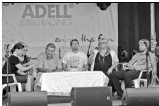
Herci divadelního spolku BAVSA při vystoupení.