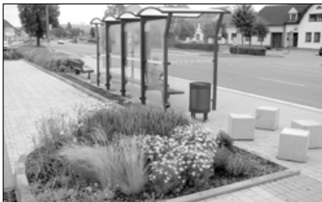
Květinová výzdoba u autobusové zastávky před Lidovým domem.