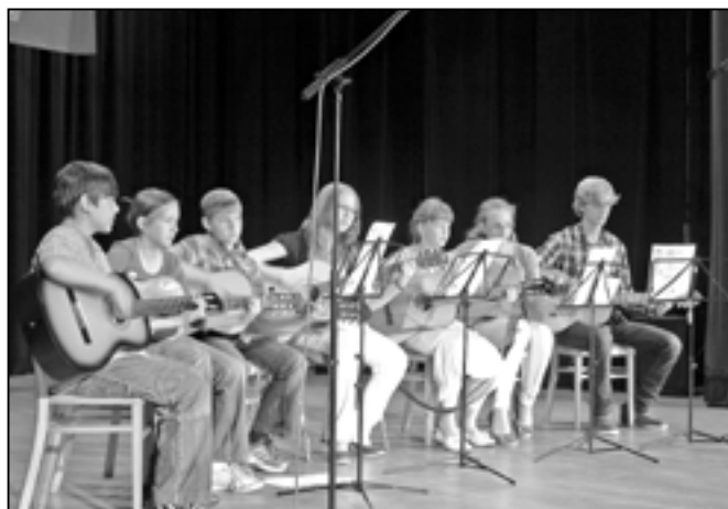
Mladí kytaristé nám předvedli, co všechno se za minulý školní rok v kroužku naučili.