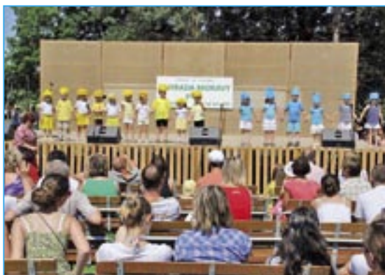
Naši nejmenší se na vystoupení velmi těšili.