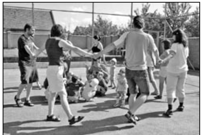
Společné hry rodičů a dětí.