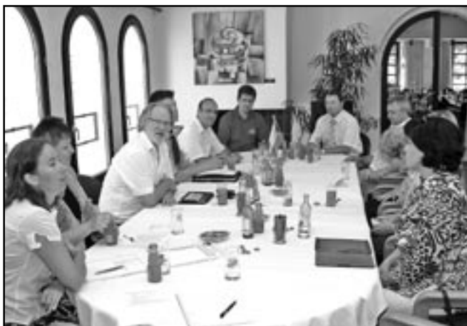
Zasedání partnerských výborů se uskutečnilo v sobotu 30. června 2012.