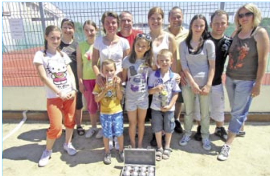
Orli ze Starého Města hráli petangue v Uherském Hradišti.