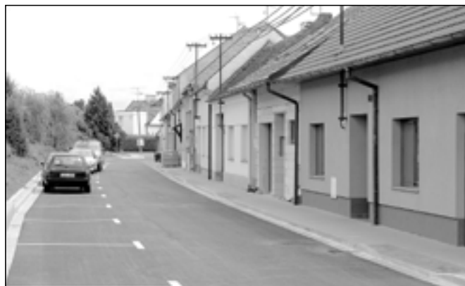
Ulice U Potoka prošla náročnou rekonstrukcí a změnila se k nepoznání.