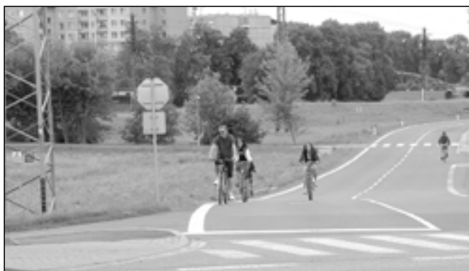
O prázdninách jsou velmi využívány cyklostezky v okolí Starého Města. Bylo jich vybudováno celkem sedm. Takovým počtem cyklostezek se může pochlubit jen málokteré město srovnatelné velikosti.