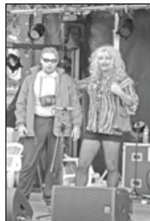
Reality show ve staroměstském provedení.