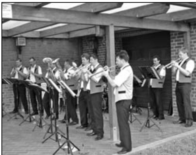
Staroměstská kapela vyhrávala na společném večeru i na náměstí u kostela sv. Godeharda.