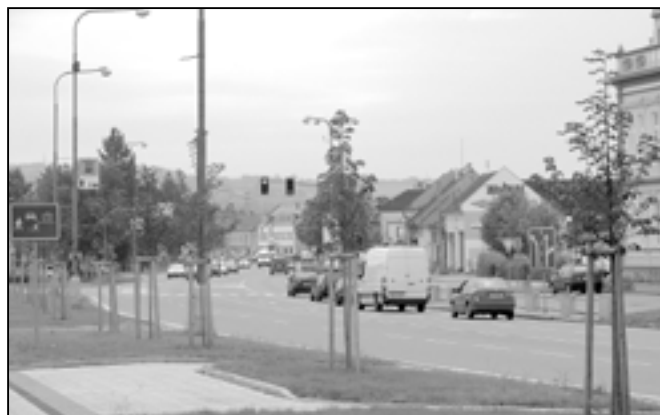
Stromky na náměstí Hrdinů, které byly vysázeny v říjnu 2011.