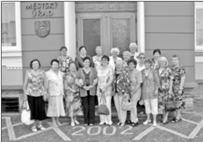
Jubilantky na společném snímku před radnicí.