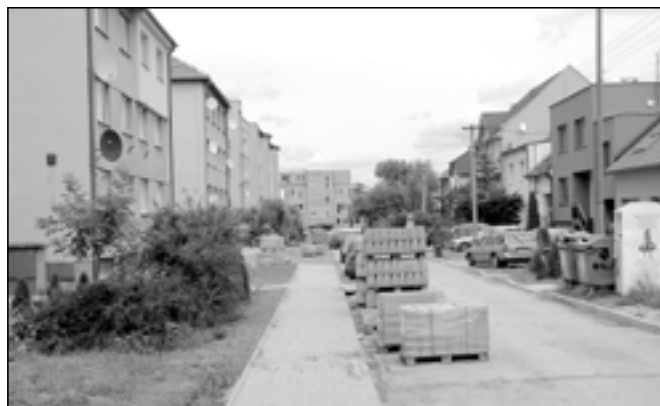
V průběhu prázdnin pokračuje rekonstrukce Alšovy ulice.