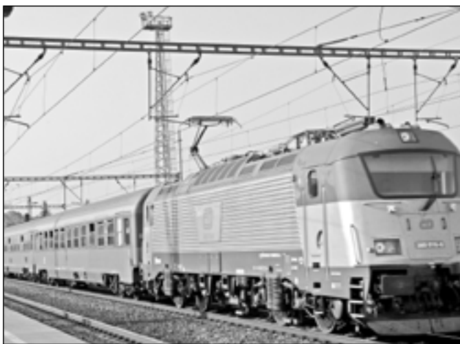
Rakouské vozy řady Bmz nabízejí vyšší komfort cestování. V čele expresu Šohaj je nejnovější elektrická lokomotiva řady 380, která pro svůj obrovský výkon získala přezdívku „Bivoj“. Pokud si vyberete na cestu do Prahy expres „Šohaj“, pojedete rychlostí 160km/hod.