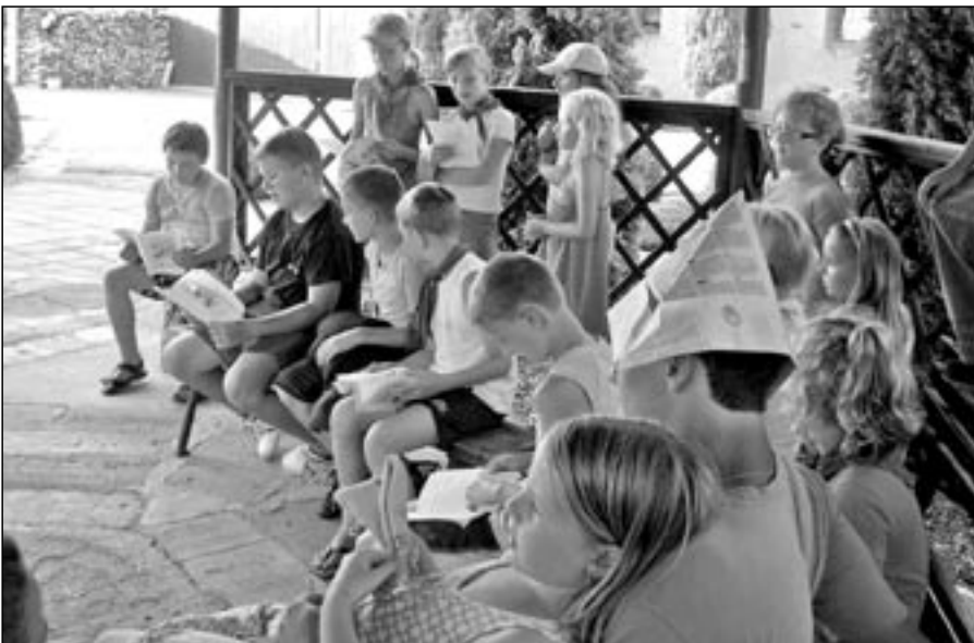
Děti na farním táboru.