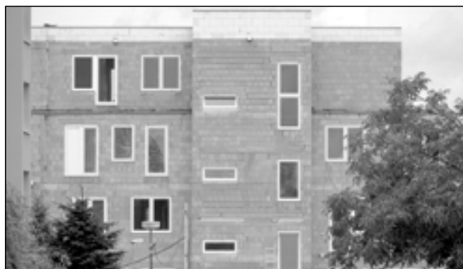
Na konci Alšovy ulice se dokončuje bytový dům, který staví firma Tradix. Bude v něm celkem 66 bytových jednotek a jeho dokončení je naplánováno na konec září.