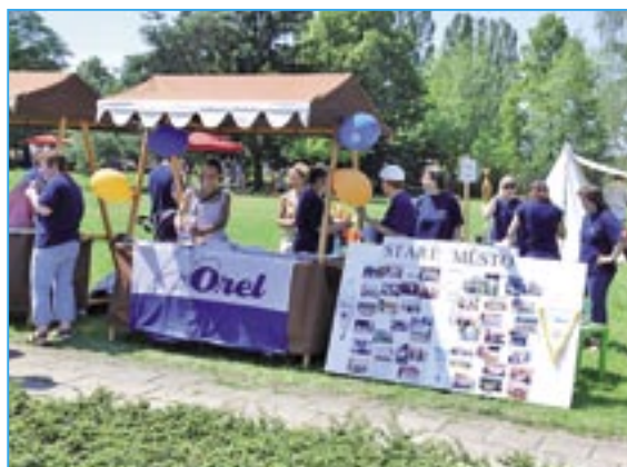
Stanoviště Orla bylo stále středem zájmu návštěvníků Zahrady Moravy a Staroměstského dne.

orelských dětí zatančila mládež z oddílu Rekreační sporty a moderní tanec, jejíž choreografii si sama připravila. Mimo Orel vystoupily děti i z dalších spolků a organizací ze Starého Města. Naše jednota se prezentovala také stánkem, kde si návštěvníci mohli vybrat zdarma z propagačních materiálů např. pexesa, pravítka, pohlednice, samolepky, omalovánky, časopisy, župní zpravo-