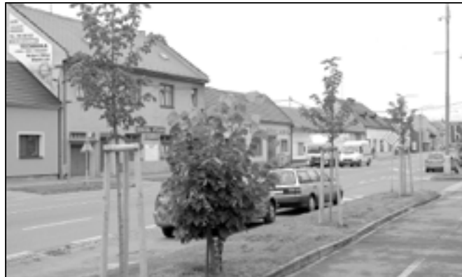
Nová výsadba před základní školou na náměstí Hrdinů.