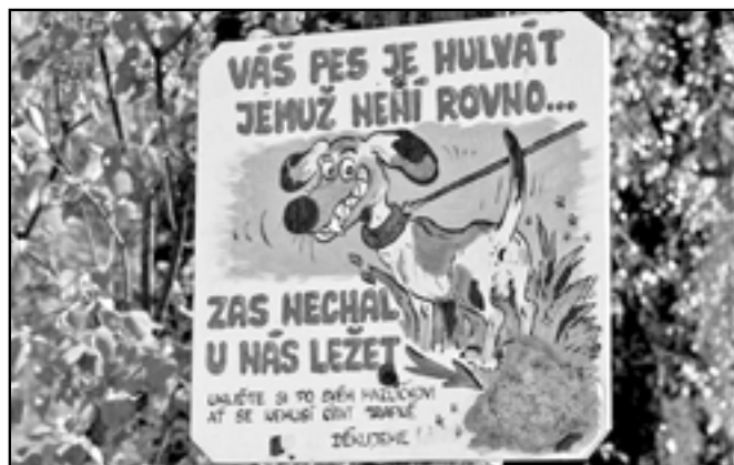
Pes bývá většinou věrným obrazem svého pána.

• Městští policisté uspořádali osvětovou a preventivní akci pro žáky prvních tříd základní školy na náměstí Hrdinů. Strážníci se zaměřili na pravidla jízdy na jízdním kole, na postup při setkání s cizím člověkem, se psem nebo jiným zvířetem a na přecházení po-