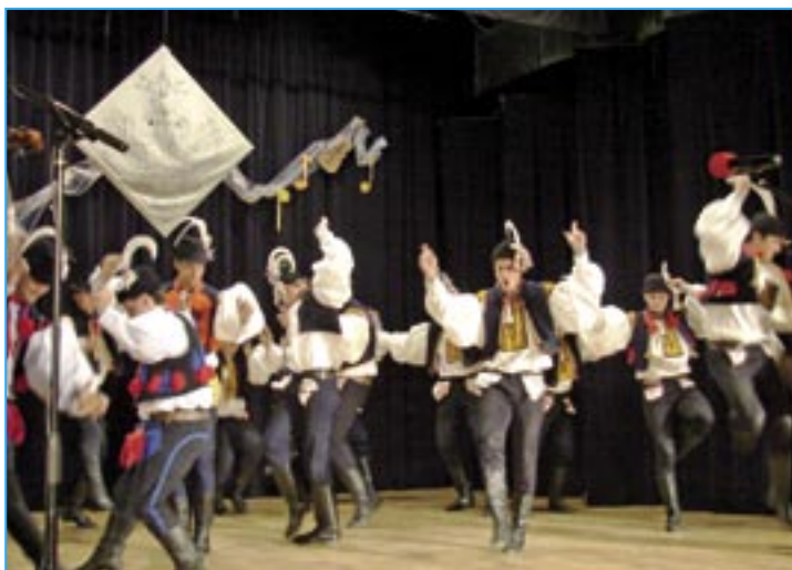
Verbíři si společně zatančili před začátkem soutěže.