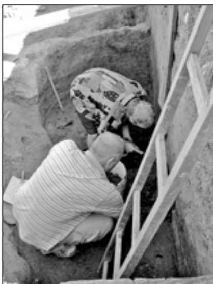
Před zahájením stavebních prací je vhodné se poradit s odborníky na stavebním úřadu.

Chci si postavit hospodářskou stavbu, přístřešek pro auto – pokud se jedná o nepodsklepenou stavbu do 25 m 2 a do 5 m výšky, nebudou zde pobytové místnosti ani nebude sloužit k ustájení zvířat a splní další náležitosti, postačí rovněž vyplnit formulář s názvem „Oznámení o záměru v území“ a dolo-