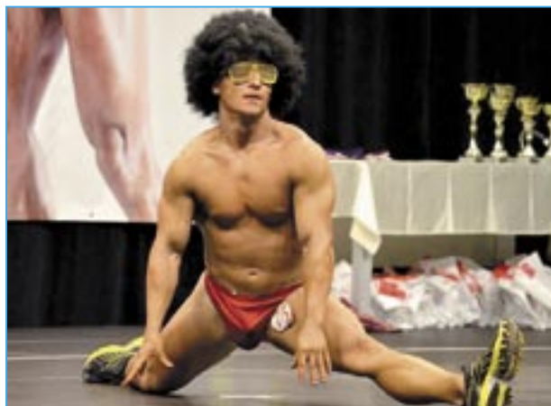
Staré Město bude mít svého zástupce na vrcholové světové soutěži.