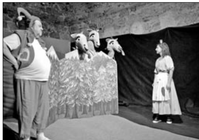
Sérii pohádek o Kašpárkovi můžete vidět o prázdninách na hradě Buchlov v podání herců Hoffmannova divadla.

Kašpárek bude hrát své rozverně pohádky na Buchlově každou neděli v 10:00 hodin (dětský prohlídkový okruh je pak v 11:00 hodin) a ve 13:00 hodin (dětský prohlídkový okruh navazuje ve 14:00 hodin.). Pohádek bude několik, takže děti mohou přijít opakovaně a uvidí každé jinou pohádku.