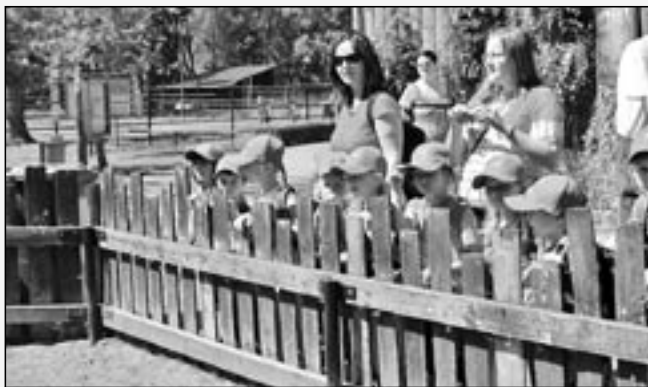
Návštěva v Zoologické zahradě Hodonín.

V pátek 11. května 2012 šly děti z nejstarší třídy „motýlků“ potěšit písničkou, tanečkem i přáníčkem babičky do Domu s pečovatelskou službou ve Starém Městě. V neděli 13. května vystoupili chlapci a děvčata ke Dni matek v sále Společensko-kulturního centra ve Starém Městě. Dne 21. května naše děti prokázaly svoji fyzickou zdatnost na sportovní olympiádě. Ve středu 23. května vyjela celá mateřská škola na výlet do ZOO Hodonín. Velmi se nám výlet za zvířátky vydařil a všem se moc líbil. Dne 24. května starší děti jely autobusem do Buchlovic a zúčastnily se projektu Zahrada je hra, kde se seznámily se zásadami správné péče o zahradu. V. H.