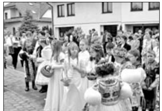
Svátek Božího Těla a první svaté přijímání 15 dětí v neděli 10. června 2012.