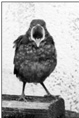
Všem účastníkům soutěže symbolicky a nesměle zazpíval malý kos.