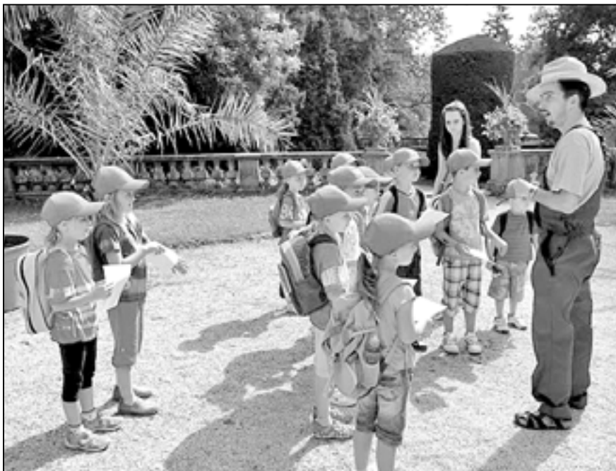
Děti z mateřských škol byly v Buchlovicích velmi spokojené. Program „Zahrada je hra“ zaujal nejen děti, ale i jejich učitelky.