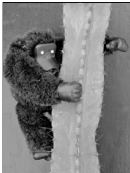
Opičáků ve Starém Městě přibývá. Jeden z nich šplhá po kaktusu ve Velkomoravské ulici.

Největší potupou je, když člověka pochválí blbec.