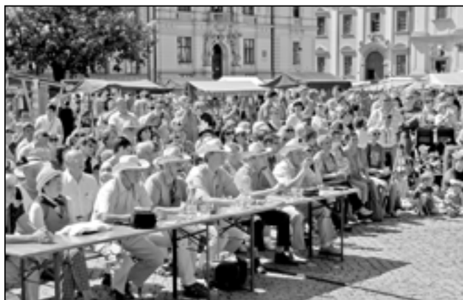
Odborná porota také tropické teploty nepodcenila a do soutěže se vybavila apartními klobouky.