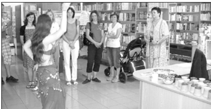
V kulturním programu jsme viděli vystoupení břišní tanečnice.