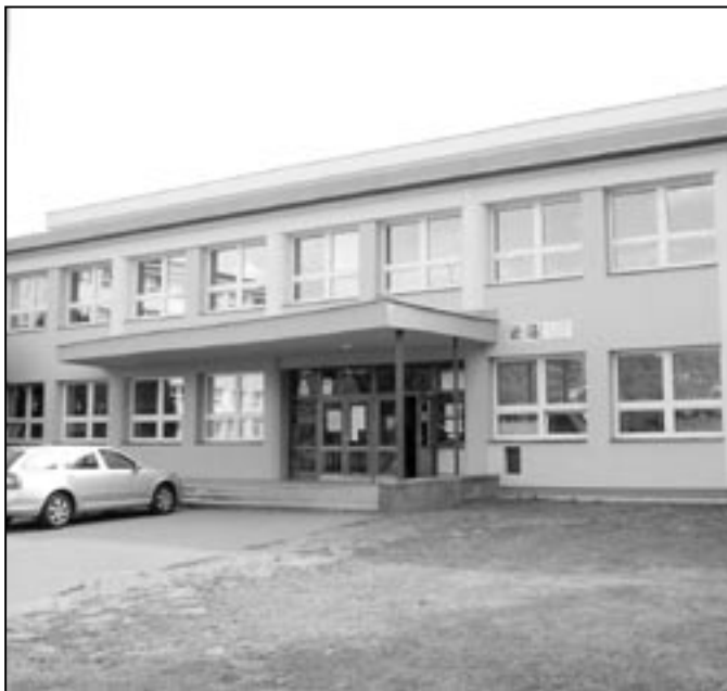
Budova SOŠ a Gymnázia v den předání maturitních vysvědčení.