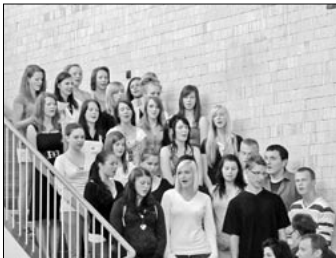
Školní pěvecký sbor složený z žáků prvních a druhých ročníků se postaral o kulturní program.