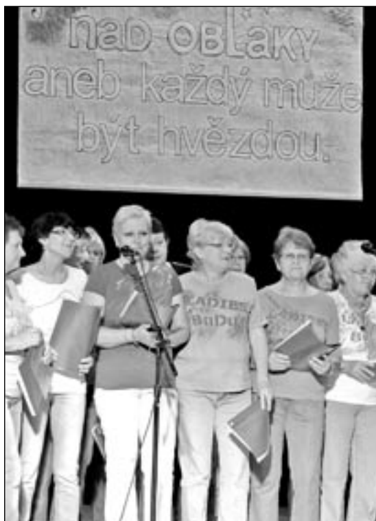
V úvodu soutěže zazpíval pěvecký sbor Ladies BuDu (Buchlovický Dúchodák) z Domova pro seniory Buchlovice.