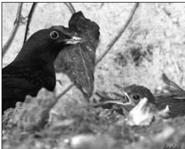
V polovině května kosí rodinka vyvedla malá ptáčata.