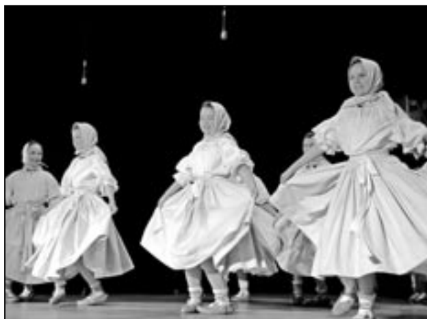
Skladba Zelé a děvčice z Dolinečky III.