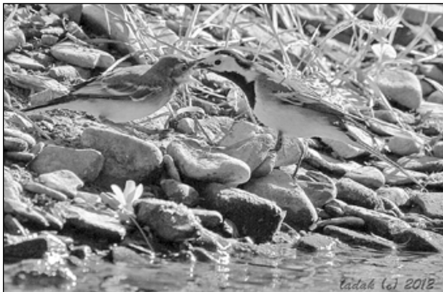
Konipas bílý s mládětem na stanovišti u potoka.