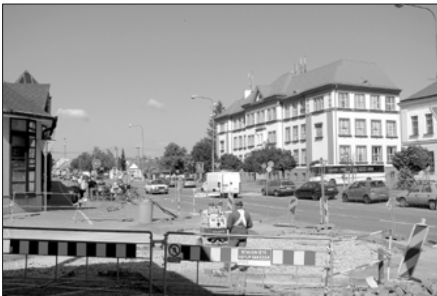
V květnu proběhly stavební práce v ulici Za Špicí a na rozcestí s náměstím Hrdinů. V pozadí vidíme budovu základní školy již bez typického objektu trafostanice, která byla zbourána v květnu 2012.