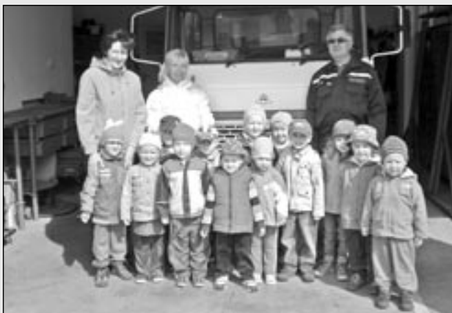
Mladší děti si prohlédly hasičskou zbrojnici ve Starém Městě.