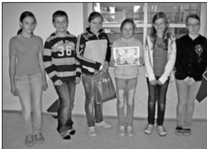
Na druhém místě skončilo pět děvčat a jeden chlapec z družstva 5. B.