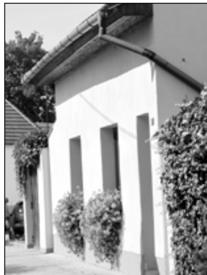
Mnoho rodinných domů ve Starém Městě je po rekonstrukci, část z nich krásí také květinová výzdoba.

Opakovaně se také setkáváme s tím, že stavba, rodinný dům, garáž je v katastru nemovitostí vyznačena v jiném tvaru či zde dokonce není vyznačena vůbec. Toto je potřeba řešit, dohledávat doklady, konzultovat se stavebním úřadem ještě před tím, než projektant zpracuje projektovou dokumentaci na rekonstrukci takovéto stavby. Z tohoto důvodu je také třeba, aby vlastník stavby uchovával po dobu životnosti stavby veškerá povolení, rozhodnutí