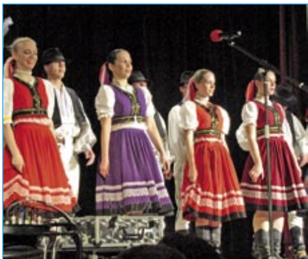
Šikovné děvčice z ostravského souboru Šmykňa.