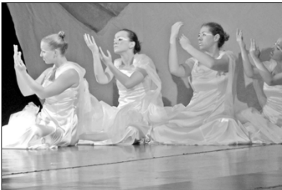
Dívky tanečního oboru předvedly divákům hodně pěkných okamžiků.