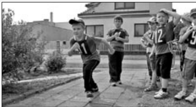
Chlapci a dívky prokázali svoji fyzickou zdatnost ve sportovní olympiádě.