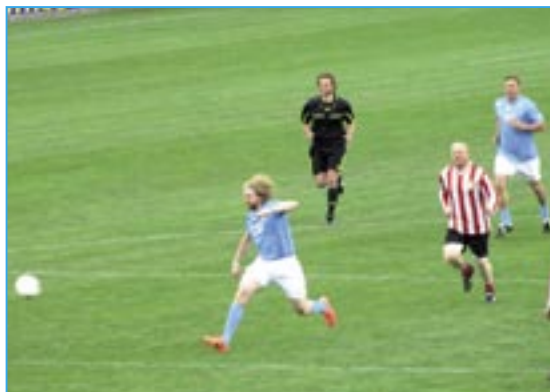
Zběsilý úprk Jakuba Voráčka na branku Houslic. Spoluhráč Jaromíra Jágra z týmu Philadelphia Flyers a mistr světa z roku 2010 všem ukázal, že umí nejen dobře bruslit, ale i sprintovat na trávníku.