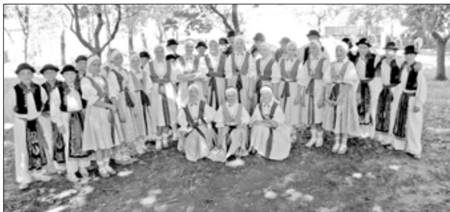
Na výstavě Zahrada Moravy jsme v neděli 17. června 2012 vyfotografovali děti z folklorního souboru Dolinečka III. Moc jim to slušelo.

vše v lokalitě areálu Dolina ve Starém Městě, k. ú. Staré Město u Uh. Hradiště, společnosti DOLINA Staré Město, a. s., Staré Město, Velehradská 1698, IČ 25322681, za cenu 600 Kč/m 2 , za účelem narovnání vlastnických vztahů pod budovami.