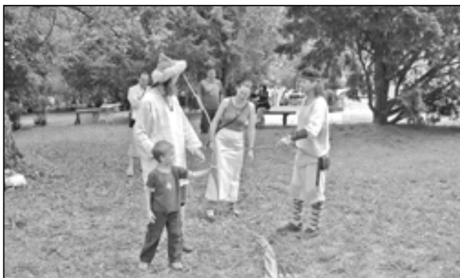
Největšímu zájmu chlapců i dívek se těšila výuka lukostřelby, kterou zajišťovali členové skupiny historického šermu Morrigan.

Středisko volného času Klubko Staré Město a Slovácké muzeum Uherské Hradiště společně uspořádaly v neděli 3. června od 14:30 do 17 hodin na zahradě Památníku Velké Moravy pro všechny děti i dospělé tvořivé odpoledne plné úkolů a soutěží na téma Velké Moravy. Chlapci a dívky si mohli vyzkoušet střelbu z luku, výrobu velkomoravských šperků, společně ochutnali placky, vyrobili si šperky, proběhli se v historické zbroji a vyzkoušeli si i mnoho dalších činností. Pro všechny přítomné bylo