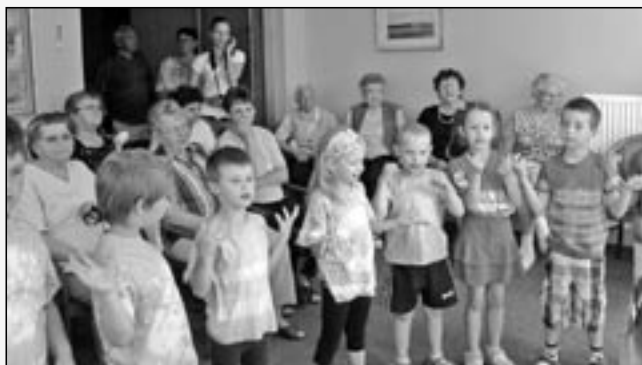
Děti z mateřské školy v Komenského ulici potěšily svým kulturním vystoupením babičky v Domě s pečovatelskou službou v ulici Bratří Mrštíků.