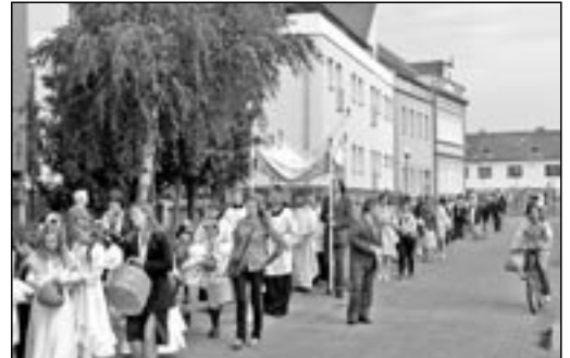
Farnost prožila krásný svátek 10. června 2012.

Cisterciácký náhrobek na Velehradě Velehrad je tu díky cisterciáckému řádu, který zde působil v letech 1205 - 1784. Při generální opravě velehradské baziliky ve 30. letech 20. století z důvodu zajištění