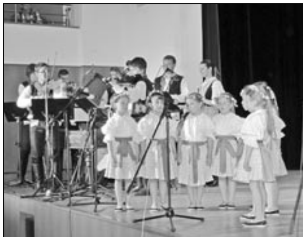
Děvčata z Dolinečky II ve vystoupení s názvem Na Turka.