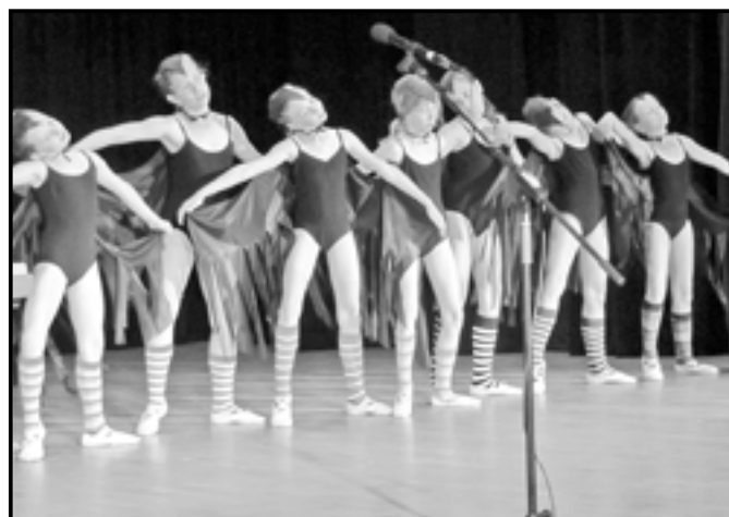
Dívky 4. ročníku tanečního oboru ve skladbě Havrani.