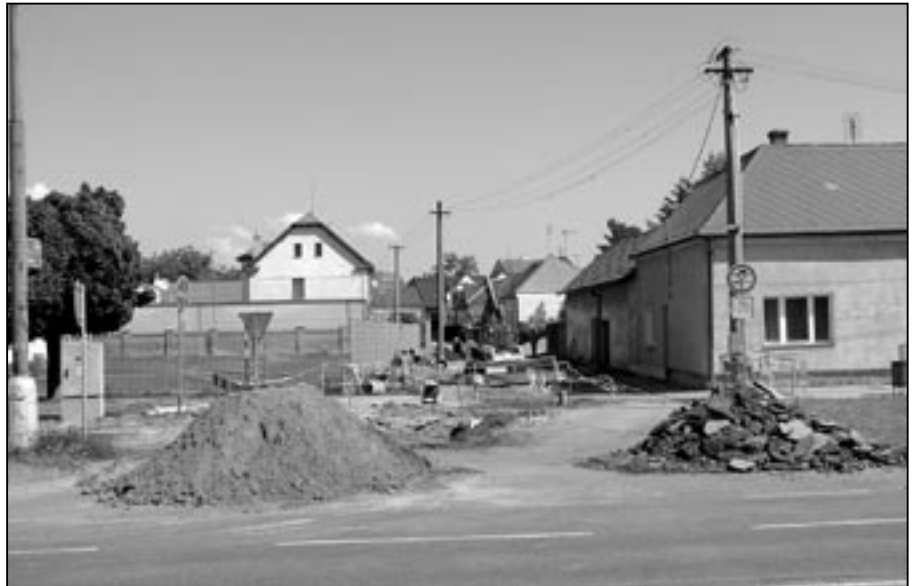
Během měsíce června byl omezen provoz v Rastislavově ulici, kde byla na programu rekonstrukce místní komunikace a výstavba chodníku a parkoviště.