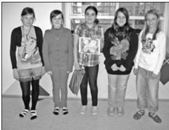
Samá děvčata tvořily družstvo z 5. C, které obsadilo třetí místo.