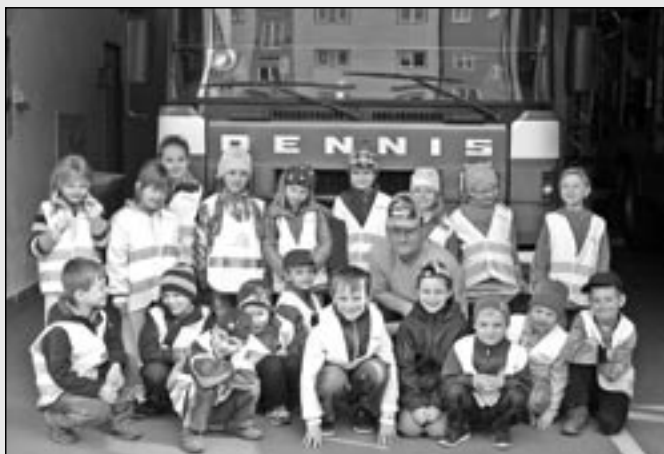
Starší děti jely za profesionálními hasiči do Uherského Hradiště.