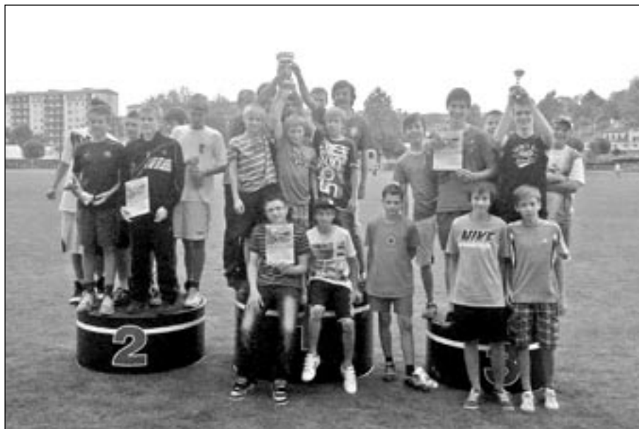
Velmi úspěšné družstvo mladších žáků Základní školy Staré Město při krajském finále celostátní atletické soutěže „Pohár rozhlasu“, kde získali krásné třetí místo.