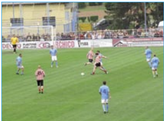
Útočí Slavoj Houslice.