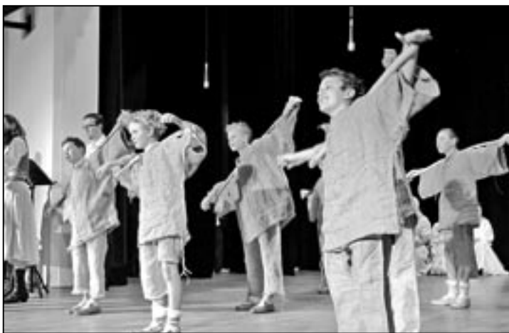
Šohaji z Dolinečky III ve skladbě Zelé.