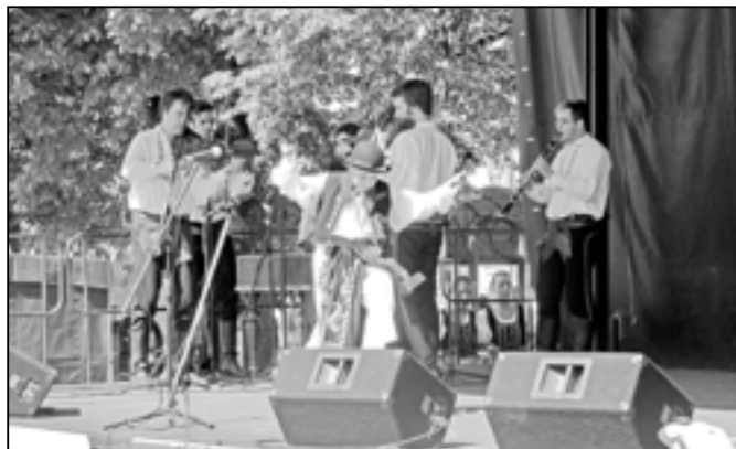
Tanečníci slováckého verbuňku soutěžili za úmorného vedra.