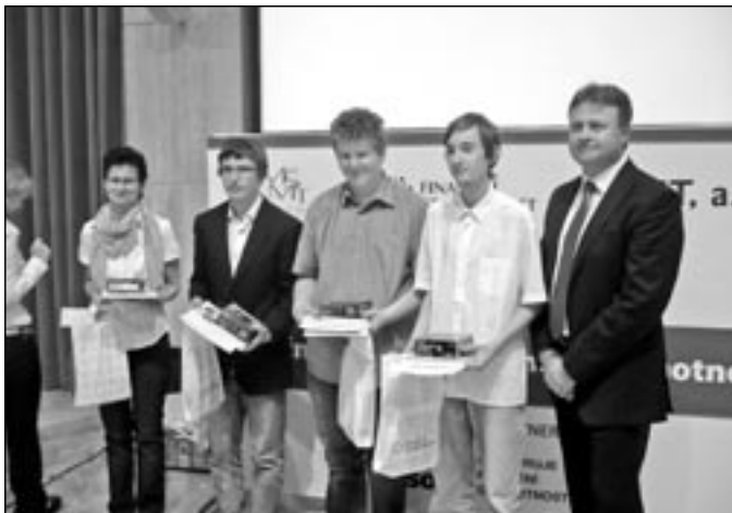
Staroměstšané skončili na nádherném 2. místě.