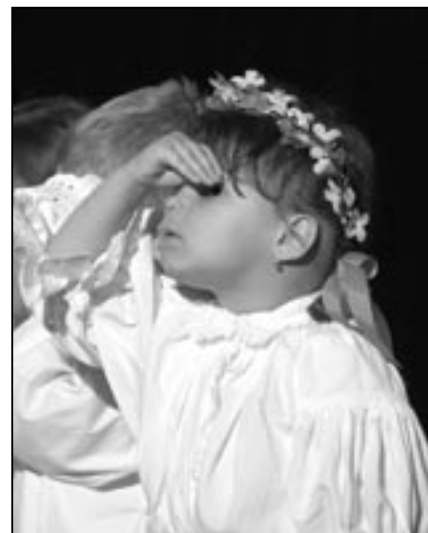
Kdepak to sedí naši? Reflektor svítí přímo do očí a já nic nevidím....