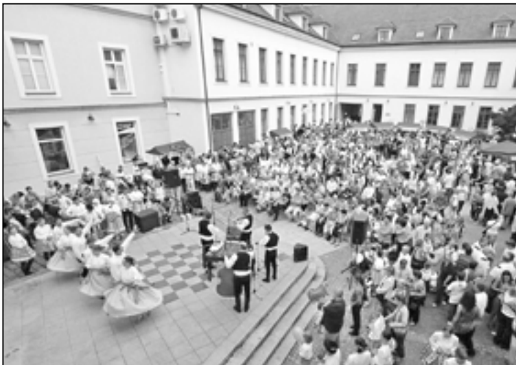
Folklorní soubory, cimbálové muziky a dechové hudby z mikroregionu Staroměstsko budou vystupovat v sobotu 8. září 2012 na nádvoří Staré radnice.