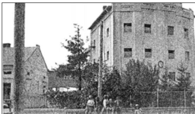
Skupina dětí u plotu před Schilderovým mlýnem.