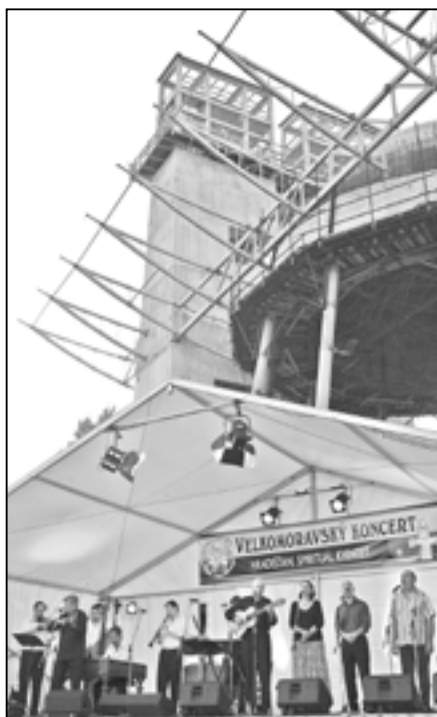
Hradišťan a Spirituál kvintet při vystoupení v neděli 11. září 2011.

9. září 2012 vystoupí legendární zpěvačka Marta Kubišová a doprovázet ji bude klavírista a skladatel Petr Malásek, manžel herečky Dany Morávkové. Martu Kubišovou jistě nemusíme našim čtenářům představovat. Je trojnásobnou vítěžkou čtenářské ankety časopisu Mladý svět Zlatý slavík, v období normalizace měla téměř dvacet let zákaz vystupování. V letošním roce Marta Kubišová oslaví významné životní jubileum. Petr Malásek je také velmi známý, jeho umění jsme mohli ocenit při společných koncertech s Hanou Hegerovou, kterou doprovází od roku 1990.