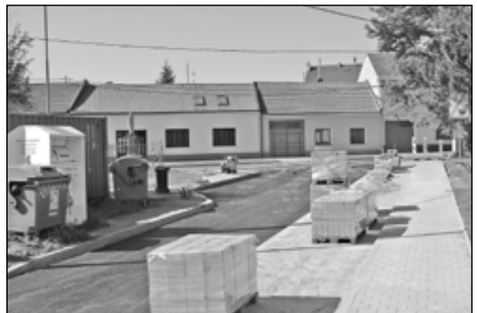
V Alšově ulici byla položena zámková dlažba na chodníku o délce 200 metrů a šířce 1,5 metru a dále bylo vybudováno 39 parkovacích míst. Stavební práce budou ukončeny koncem měsíce srpna.