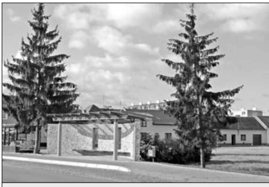
Nový přístřešek autobusové zastávky na Dvorku již slouží veřejnosti.