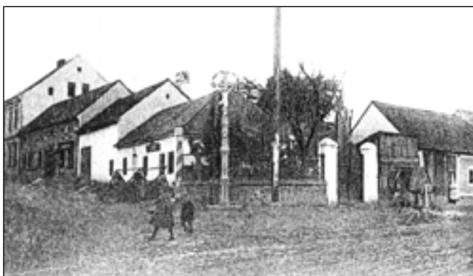
Na tomto místě na rozcestí ulic Huštěnovská a Velehradská nyní stojí Bonsai centrum ISABELLA.