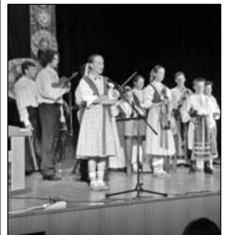
Cimbálová muzika základní umělecké školy při koncertu v květnu 2012.