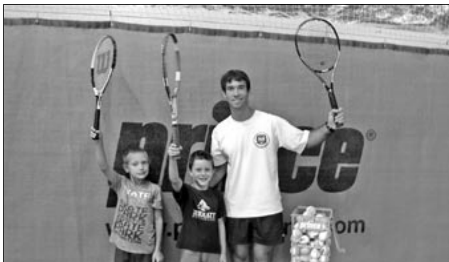
Chlapci a děvčata, přijďte mezi nás do tenisové haly na Rybníčku.