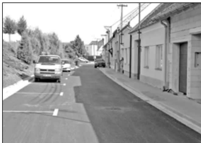
Ulice U Potoka ve směru od fotbalového stadionu. V ulici je nyní 12 nových parkovacích míst.