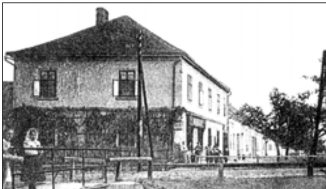
Dům rodiny Juříků na rozcestí ulic Velkomoravská a Hradištská.