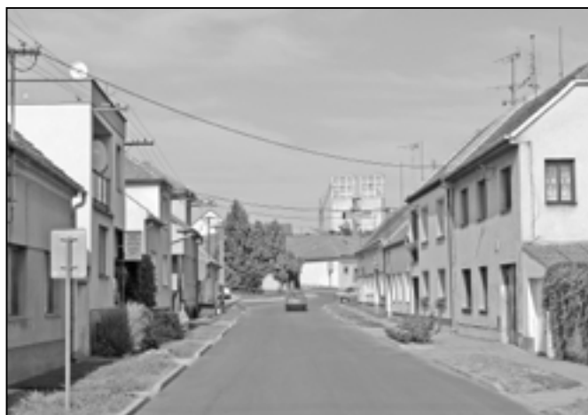
V ulici V Zahradě byla provedena oprava místní komunikace. Byly dosazeny nové obrubníky, vozovka o délce 125 m a šířce 6 m má nový asfaltový povrch.