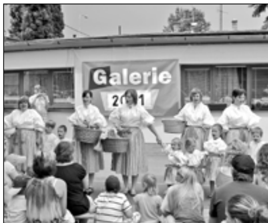
Maminky s dětmi při vystoupení na Galerii v červnu 2011.

ZAHAJOVACÍ SCHŮZKY, KDE SE DOMLOUVAJÍ DNY A ČASY JEDNOTLIVÝCH KROUŽKŮ, PROBĚHNOU 18. - 20. 9. 2012 DLE ROZPISU VYVĚŠENÉHO NA WEBU. PRAVIDELNÁ ČINNOST KROUŽKŮ PAK ZAČNE V TÝDNU OD 24. 9. 2012