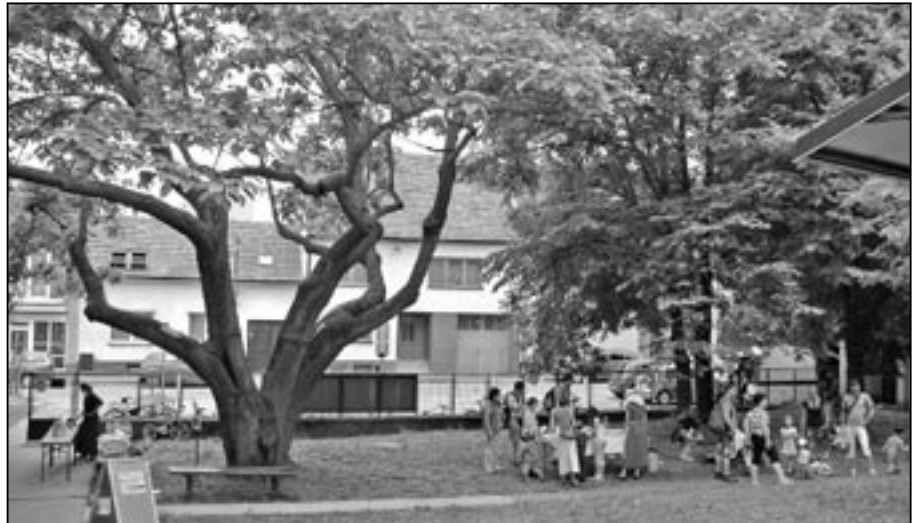
Hned při vchodu do objektu Památníku Velké Moravy najdeme vzácný strom – pavlovnií plstnatou. Nesnáší stín jiných stromů, daří se jí, když ostatní převyšuje.

Dřevo pavlovnie je vyhledávané pro své kaštanově hnědé zbarvení na obklady, dýhy, nábytek. Má velmi dobré rezonanční vlastnosti, proto se v Asii používá na výrobu hudebních nástrojů.