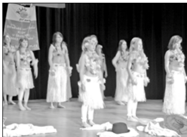
Vystoupení děvčat z Klubka při Galerii 2012, která se uskutečnila v SKC – sokolovně 10. června 2012.