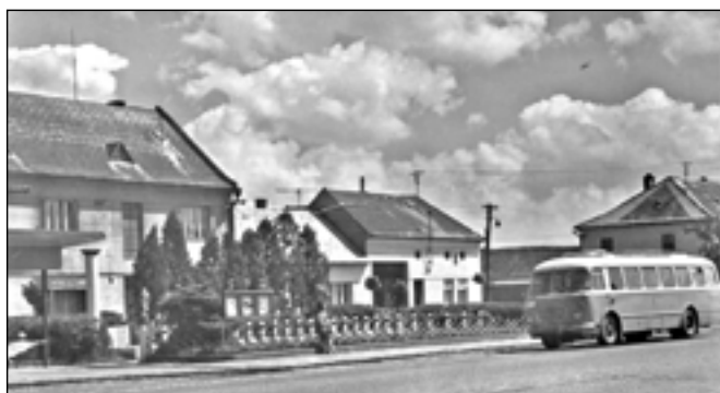
Na snímku z šedesátých let minulého století vidíme pomníčky hrdinů s lampičkami, které byly umístěny naproti radnici.