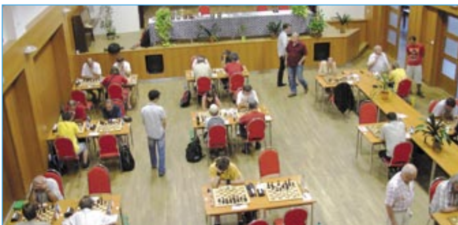
Turnaj FIDE OPEN 2012 se uskutečnil v obou sálech Společensko-kulturního centra ve Starém Městě.

Příští číslo Staroměstských novin vyjde 25. září. Uzávěrka je 17. září 2012.