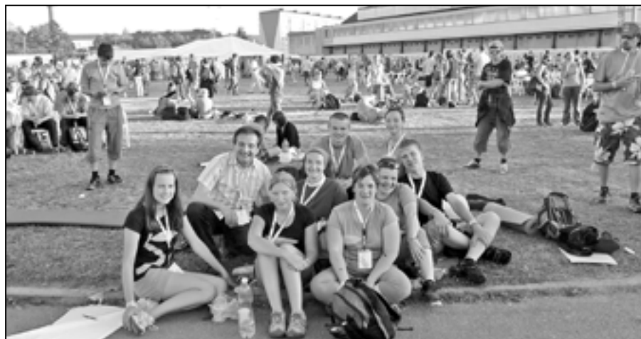
Staroměstská delegace na celostátním setkání mládeže ve Žďáru nad Sázavou.