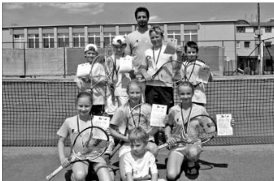
Úspěšní mladší žáci z tenisového klubu TC Staré Město po postupu do vyšší výkonnostní skupiny.