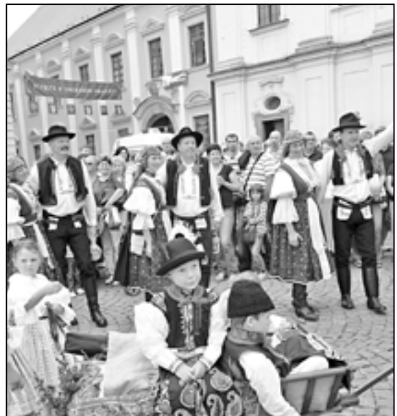
Staroměstšané na Slováckých slavnostech v Uherském Hradišti 10. září 2011.

Slovácké slavnosti vína a otevřených památek jsou jednou z největších akcí na Slovácku. Do Uherského Hradiště přijede v sobotu 8. září a v neděli 9. září 2012 několik tisíc krojovaných ze 70 měst a obcí (loňský rekord 5.256) a desítky tisíc návštěvníků a vyznavačů folkloru a lidových tradic. Co čeká návštěvníky slavností? Program je velmi bohatý a pestrý (více na internetové adrese http://www.slavnostivina.uh.cz/ program ) Občané Starého Města se jistě zastaví na nádvoří Staré radnice v Prostřední ulici, kde budou vystupovat soubory a muziky z mikroregionu Staroměstsko.