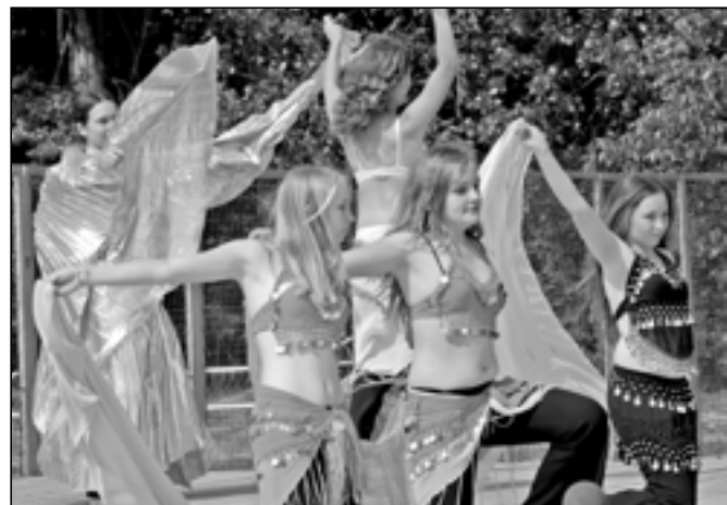
Kroužek orientálního tance při vystoupení na Staroměstském dnu v červnu 2011.

na DDM nebo SVČ vystřídalo 43 pedagogických pracovníků, 4 účetní, 8 uklízeček a 6 údržbářů. S organizací činnosti nám pomáhalo přes 600 externistů a dobrovolníků. Pravidelnými kroužky prošlo přes 15 000 účastníků, zorganizovali jsme 4500 akcí, kterých se zúčastnilo zhruba 245 000 lidí.