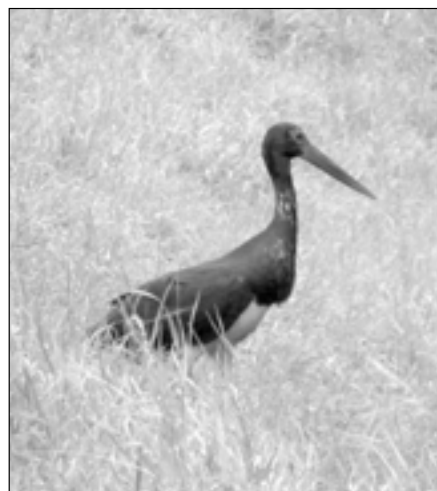
Čáp černý nejprve chytal rybky v potoce Sالاška, potom se přesunul k nedalekým domům v Obilní čtvrti.