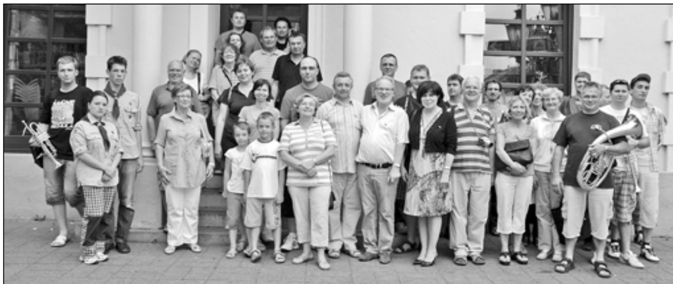
Delegace partnerských měst Tönisvorst a Staré Město.