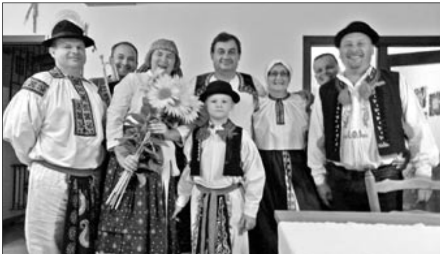
„Lužané“ se postarali o vřelé přijetí svého kamaráda po návratu z folklorního festivalu v rumunském městě Braila.