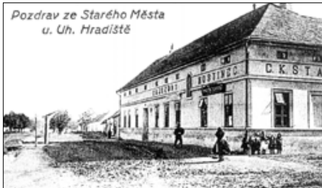
Zájezdní hostinec Na Špicí.