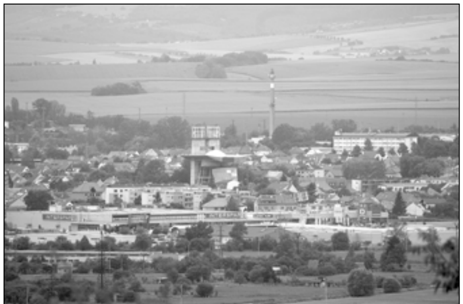
Pokud si uděláte výlet ke kapli sv. Rocha v Uherském Hradišti, naskytne se vám podobný pohled s krásným výhledem na Staré Město.