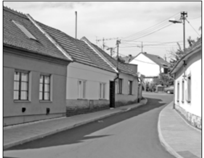
Část místní komunikace v ulici Konstantinova po rekonstrukci vozovky a chodníku.

1.4 zveřejnit na úředních deskách záměr na pronájem nebytových prostor (vinárna a pivnice ve SKC) v budově č. p. 1249, ul.