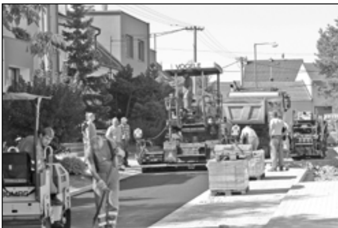
Ve středu 15. srpna 2012 byl položen asfaltový povrch na 192 metrů dlouhé vozovce v Alšově ulici. Rekonstrukci chodníků a komunikace provádí firma Kartusek Ekostav s. r. o. Rozpočet stavebních prací je 3,7 mil. Kč.