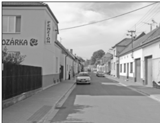
Rekonstrukce Sportovní ulice proběhla od září do listopadu 2011.