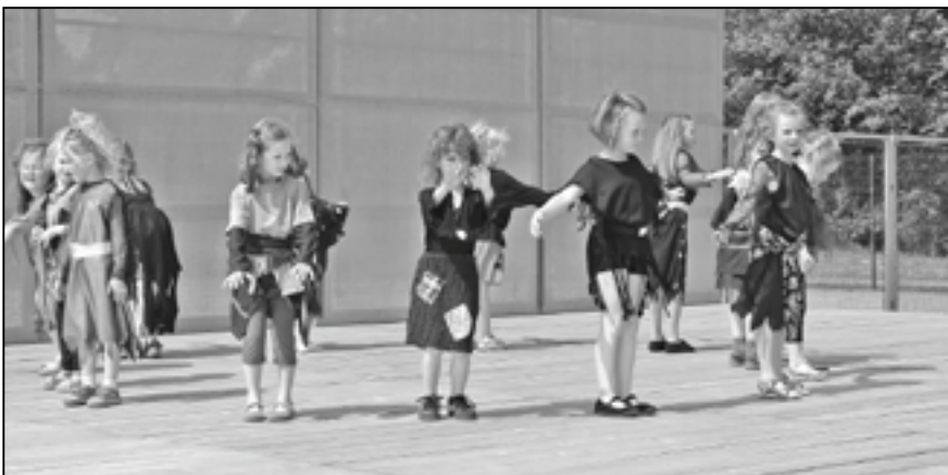
Děvčata z Orla při vystoupení na Staroměstském dnu v roce 2011.