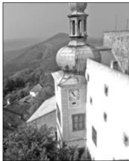
Cílem letošního zájezdu pro důchodce bude kraj pod hradem Buchlovem.