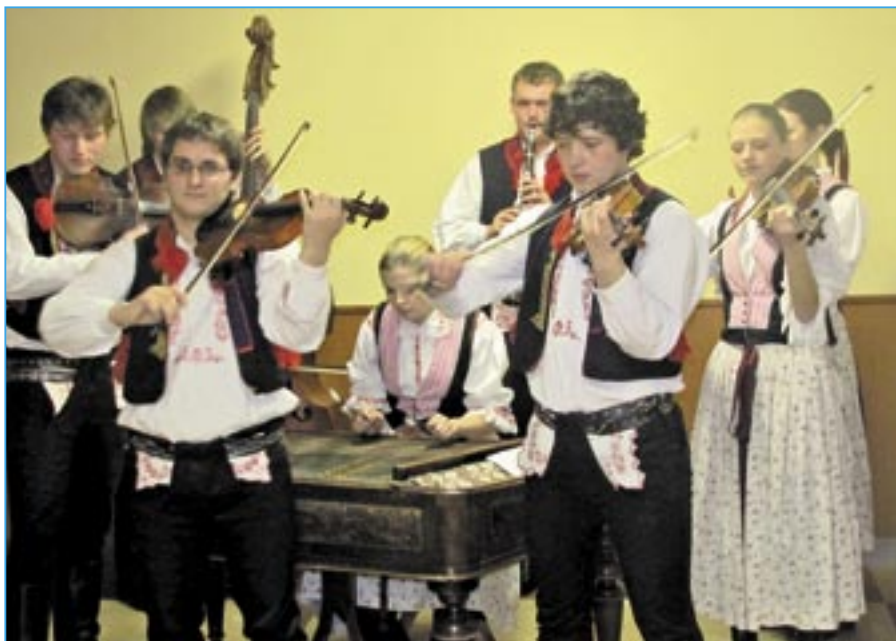
K dobré pohodě zahraje a v kulturním programu vystoupí cimbálová muzika Bálešáci.