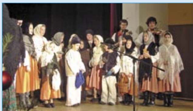
Závěr Vánočního zpívání patřil Dolinečce I a cimbálové muzice Bálešáci.