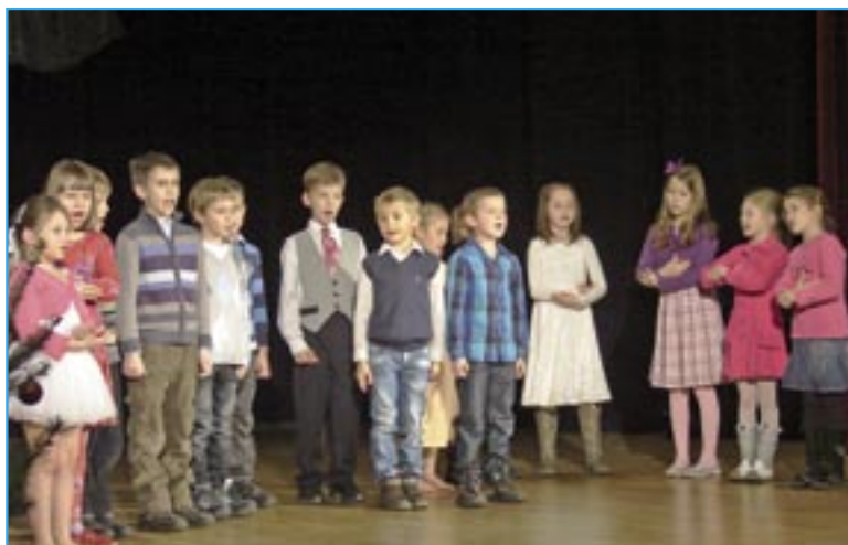
Chlapci a děvčata zazpívali koledu Půjdeme spolu do Betléma.