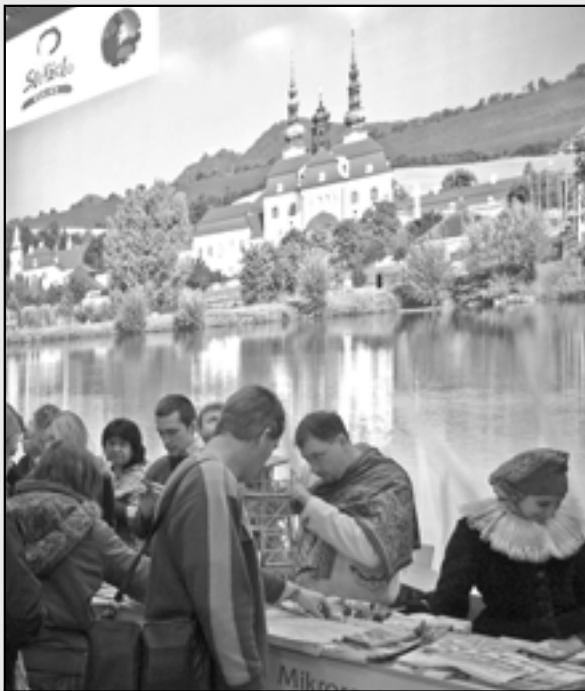
Expozice Slovácko, ve které byly k dispozici propagační materiály mikroregionu Staroměstsko.

Ve dnech 12. – 15. ledna 2011 se uskutečnila na brněnském výstavišti dvojice veletrhů. Mezinárodní veletrh průmyslu cestovního ruchu GO 2012 a Mezinárodní veletrh turistických možností v regionech REGIONTOUR.