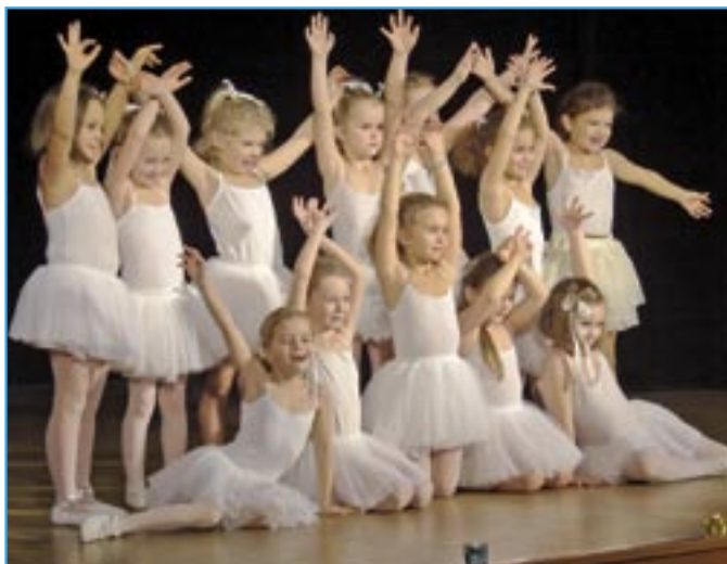
Děvčátka 1. ročníku ve skladbě Snížek od Jiřího Pavlici.