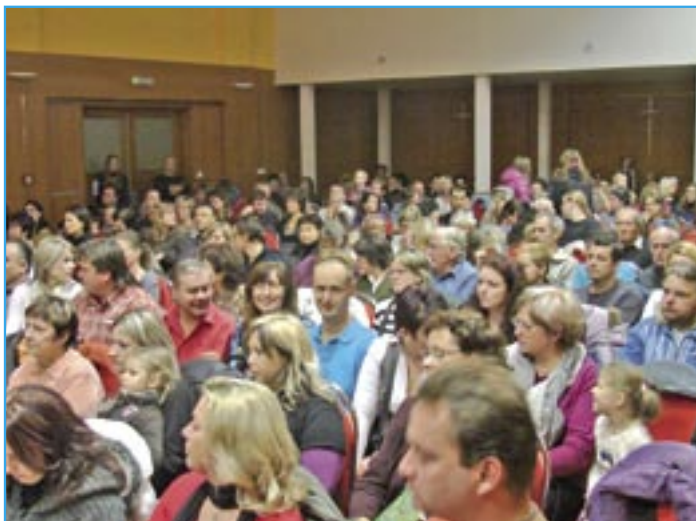
Diváci sledují vánoční koncert ve zcela zaplněném sále sokolovny.