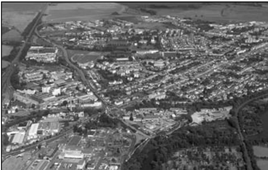
Letecký snímek Starého Města. V popředí průmyslový areál firmy Kovosteel, za ním objekt Colorlaku.