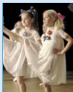
Žákyně 2. ročníku tanečního oboru základní umělecké školy připravily divákům pěkný kulturní zážitek.