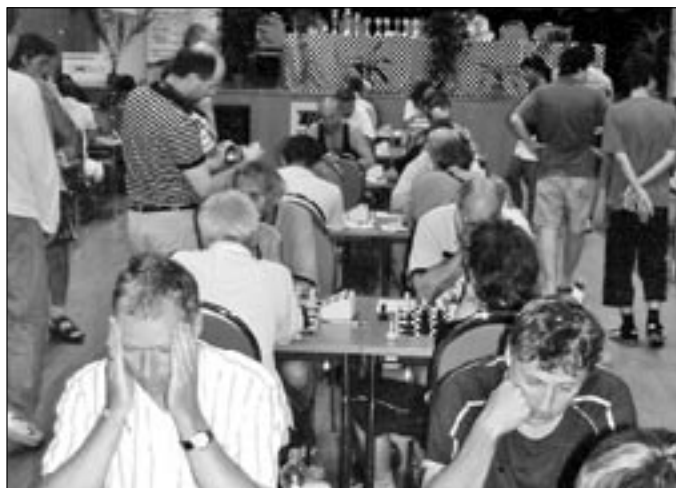
Ilustrační snímek z turnaje ve Starém Městě.