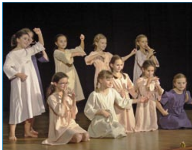
Taneční vystoupení žákyně 3. ročníku s názvem Betlémská muzika.