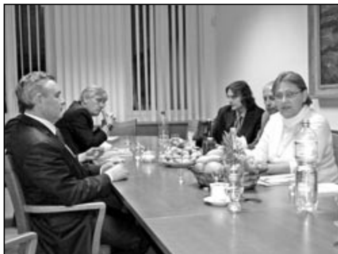
Představitelé našeho města hosty z Brazílie seznámili s historií i současným děním ve Starém Městě.

Jan Antonín Baťa byl v čele firmy v letech 1932 až 1939. Za tuto krátkou dobu se počet Baťových závodů zvýšil z 24 na 120, počet prodejen obuvi z 1045 na 5810 a počet zaměstnanců z 16 560 na 105 700 po celé zeměkouli. Po abdikaci prezidenta Edvarda Beneše se o Janu Baťovi spekovalo jako o možném kandidátu na prezidenta. Jan Baťa byl rozhodným zastáncem obrany státu a Benešovi vytykal jeho pasivitu. Rovněž je zaznamenán Baťův rozhořčený protest proti postoji spojenců, kteří po Mnichovské dohodě vydali demokratické