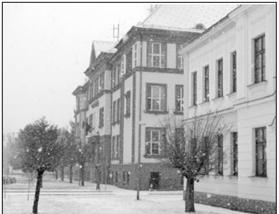
Budovy základní školy na náměstí Hrdinů pod sněhovou pokrývkou.