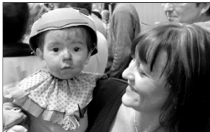
Jste srdečně zváni na dětský karneval, který se koná v neděli 29. ledna 2012 od 15 do 17 hodin v SKC - sokolovně.

SOBOTA 10. 3. 2012 8:00-11:00 h. BURZA DĚTSKÝCH VĚCÍ