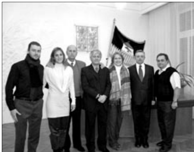
Společná fotografie v obřadní síni na radnici.