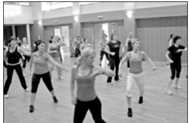
Divadelní sál SKC – sokolovny se zcela zaplnil při cvičení zumbly v neděli 11. prosince 2011.