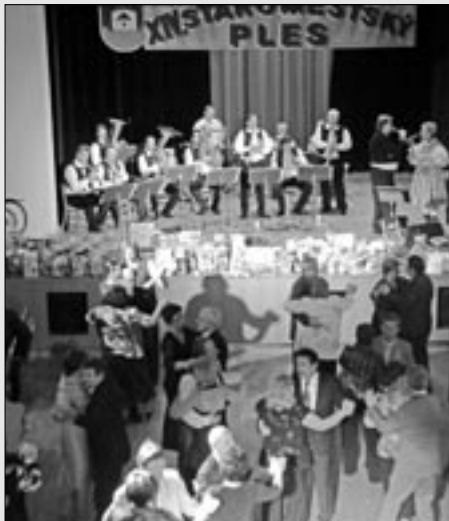
Jste srdečně zváni na patnáctý Staroměstský ples v sobotu 28. ledna 2012.