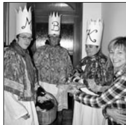
Tři králové při pochůzce po Starém Městě. Poznáte Baltazara, Kašpara a Melichara?