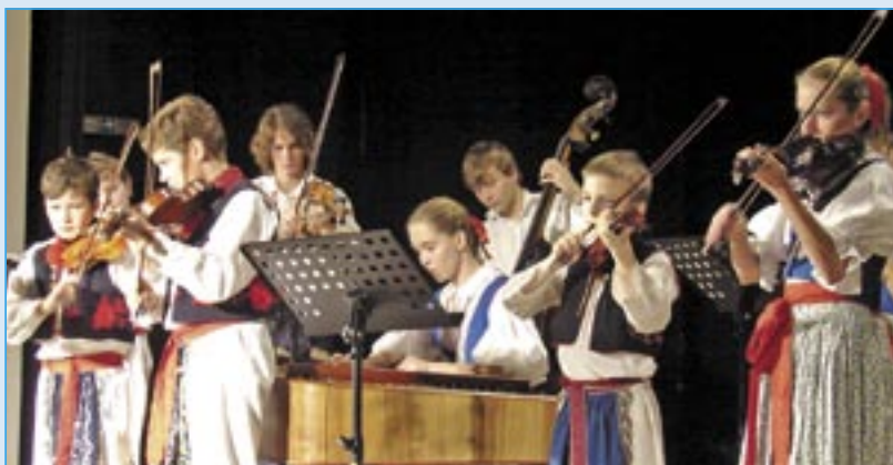
Cimbálová muzika základní umělecké školy.