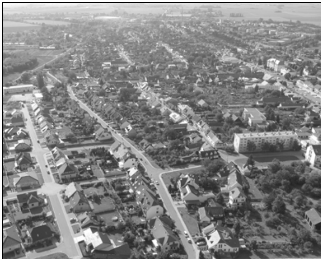
Letecký snímek Starého Města. Pohled na lokalitu Trávník, ulice Sées a Za Radnicí.

5.5 zrušení vnitřní směrnice č. S 02/2008 Zásady vymezení majetkových práv a povinností příspěvkové organizace Sportovní a kulturní centrum.