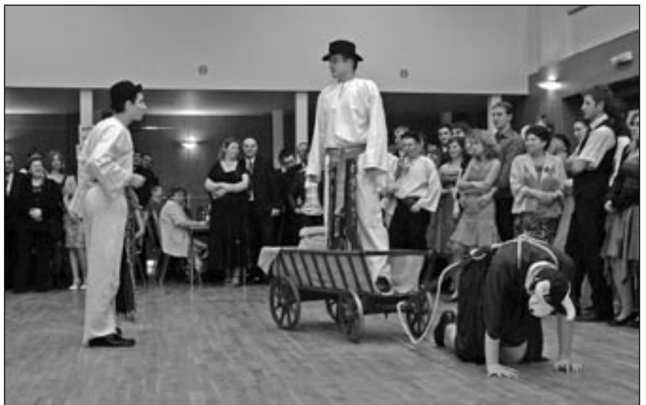
Návštěvníkům Děkanátního plesu se velmi líbil kulturní program a pohodové prostředí.