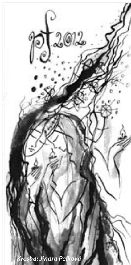
Kresba: Jindra Pelková

A přece každý den je o chlupejší než včerejšek, i když lidé dělají psí kusy, aby tomu tak nebylo.