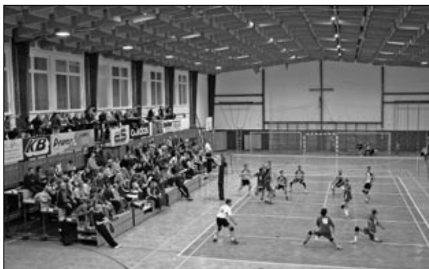
Přijďte povzbudit naše volejbalisty do městské sportovní haly na Širůchu. Čtvrtfinále play-off se hraje v pátek 3. února v 18:30 hod. a v sobotu 4. února 2012 v 17:00 hod.