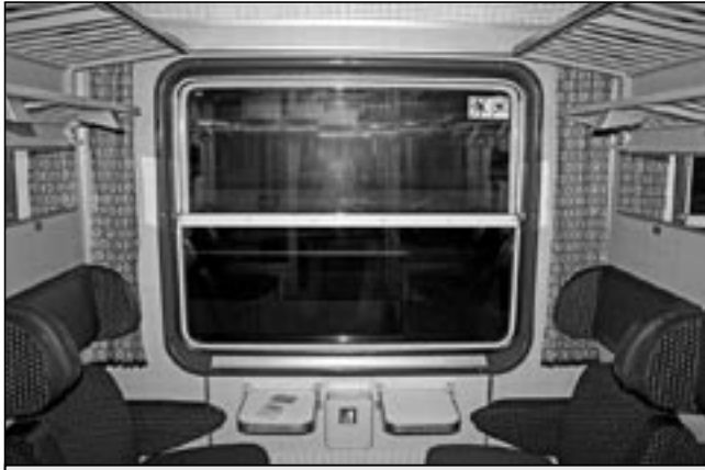
Rakouské vozy nabízejí vyšší komfort osobní dopravy.

České dráhy nasadily od října do prosince 2011 na rychlíku „Buchlov“ Praha – Staré Město u Uh. Hrad. a expresu „Mojmír“ Praha – Staré Město - Luhačovice osobní vozy pro dálkovou dopravu, které zakoupily v Rakousku. Jedná se sice o vysloužilé osobní vozy rakouských železnic, ale přesto pro tuzemské cestující představují vyšší kvalitu. Místo koženky a umakartu nabízejí polohovatelné, textilem potažené sedačky, v kupé je pouze šest míst k sezení a tedy i větší komfort. Výhodou je také povolená maximální rychlost vozu 160 km/hod, to