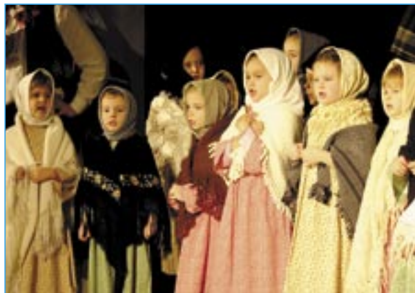
Dolinečka IV při své premiéře na jevišti.

Před zcela zaplněným sálem sokolovny vystoupily děti z Dolinečky I a cimbálová muzika Bálešáci, premi-