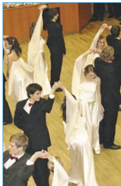
Opět se můžeme těšit na polonézu studentů Střední odborné školy a Gymnázia Staré Město.

Cena vstupenky 100 Kč, místenky 20 Kč. Předprodej vstupenek v Městské knihovně a informačním centru ve Starém Městě. Občerstvení zajištěno.