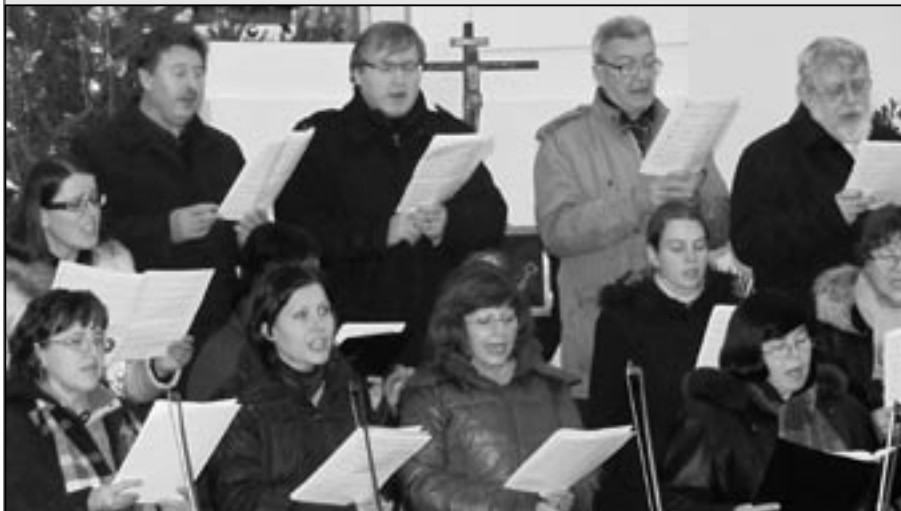
Chrámový sbor z Uherského Hradiště při vystoupení v kostele sv. Michaela v neděli 8. ledna 2012.