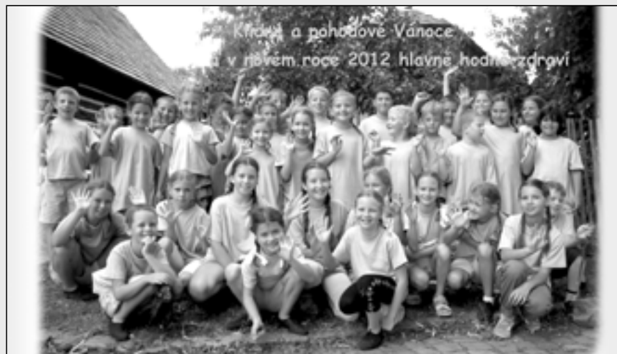
Ve Starém Městě již pracují čtyři soubory Dolinečky. Na snímku Dolinečka I, kterou vám představíme na novoročním blahopřání.