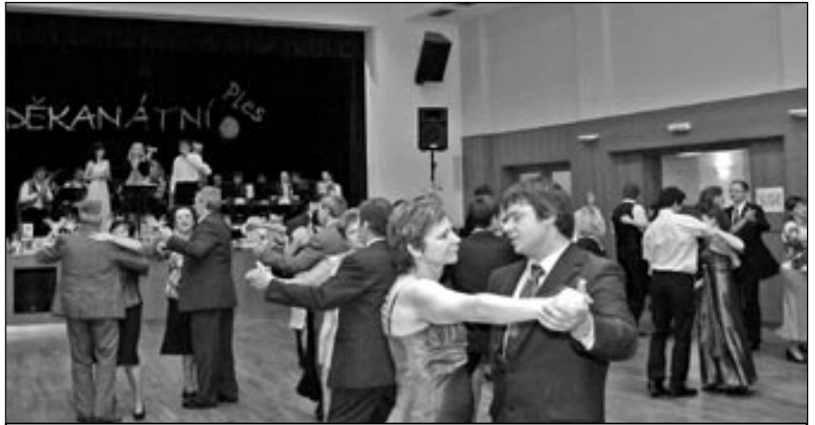
V divadelním sále vyhrávala k tanci a poslechu Staroměstská kapela.

Manžel se zdržel na školním plese s učitelkou svého synka. Po příchodu domů vtrhne do ložnice a ve skříni najde cizího muže. „Tak mluv borečku! Jsi zloděj, darebák nebo milenec mé ženy!? Dopadený odpoví nemesně: „Prosím, já jsem jenom mol šatní!“