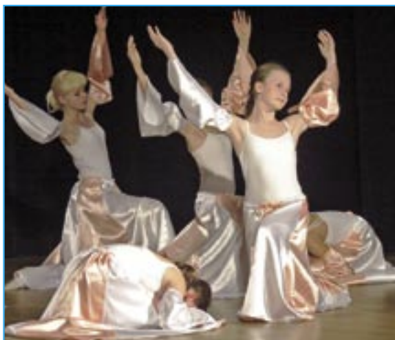
Vánoční sen od P. I. Čajkovského zatančily žákyně 6. a 7. ročníku.