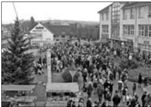
Během nedělního dopoledne přišlo na jarmark více než 1000 lidí. Všichni měli velkou příležitost potkat se a popovídat se známými a přáteli, vypít pohárek svařeného vína a poslechnout si zdařilá kulturní vystoupení.