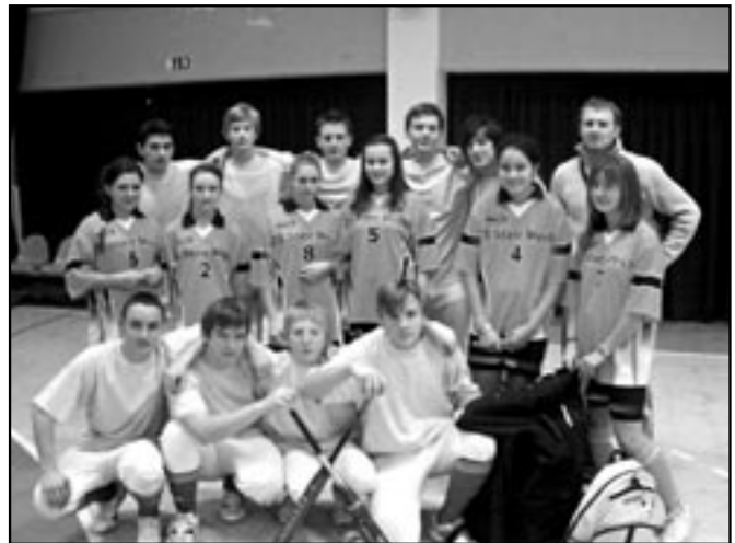
Družstva chlapců a dívek ze Základní školy Staré Město. Naši chlapci v turnaji softbalové ligy zvítězili, dívky skončily na pěkném třetím místě.