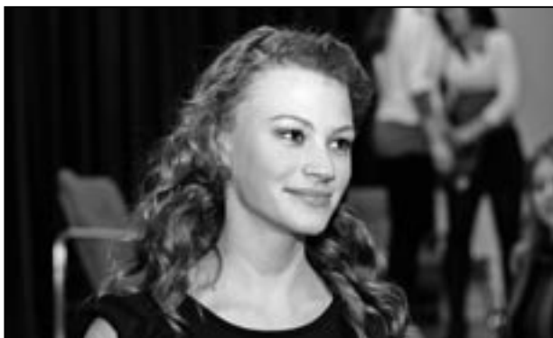
Co je to móda? Nejenom nové oblečení, krásné upravené vlasy, ale je to také náš styl oblékání, kterým se řídíme.

Jaké jsou horké novinky ve světě módy? Jak se nejlépe oblékat? Rada od odbornice na módu je asi taková: „Horkých novinek ve světě módy je spousta. Takovou největší radou je, aby si ženy oblékaly to, v čem je jim nejen pohodlně, ale také v čem jsou sebejisté a přirozené. Na tuto radu by si některé z nás mohly říci, že si zrovna můžou obléct