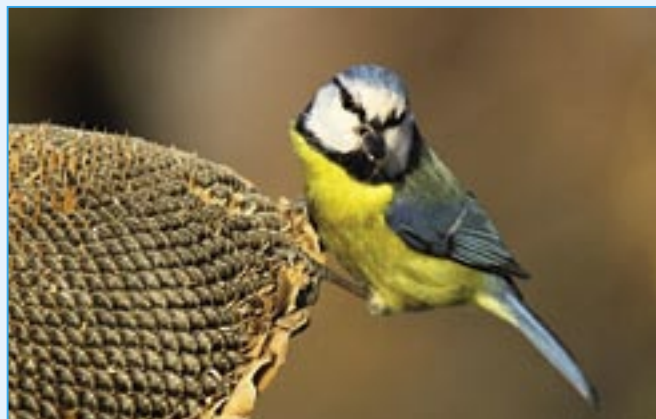
Sýkora modřinka má typický znak – azurově modrou, u mláďat nazelenalou čepičku a azurově modrá křídla a ocas. Velmi obratně šplhá po tenkých větvičkách stromů. Hnízdí většinou jednou do roka, ale je rekordmankou v počtu mláďat. Samice snáší až 15 vajec. V zimě si pochutnává na semínkách slunečnice.