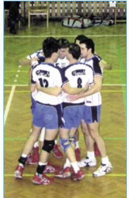
Radost týmu po vítězném setu.