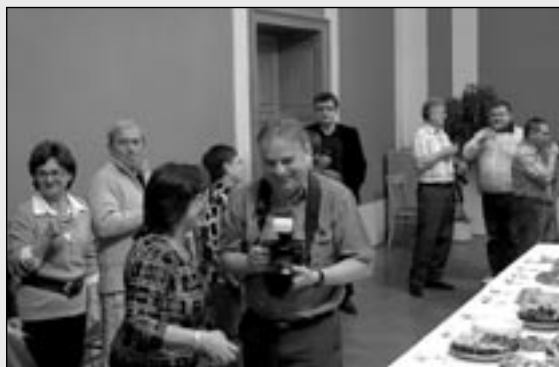
Účastníci setkání si připili na další úspěšnou činnost a hlavně na zdraví v následujícím roce 2012.