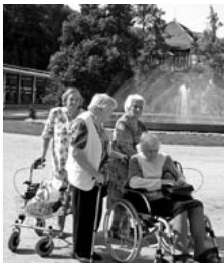
Seniorky na výletě v Luhačovicích.

placené. Mezi základní poskytované činnosti patří pomoc při převlékání a přemísťování se v prostorách centra, podávání a příprava stravy, dodržování pitného režimu, pomoc při osobní hygieně, výchovně-vzdělávací a aktivizační