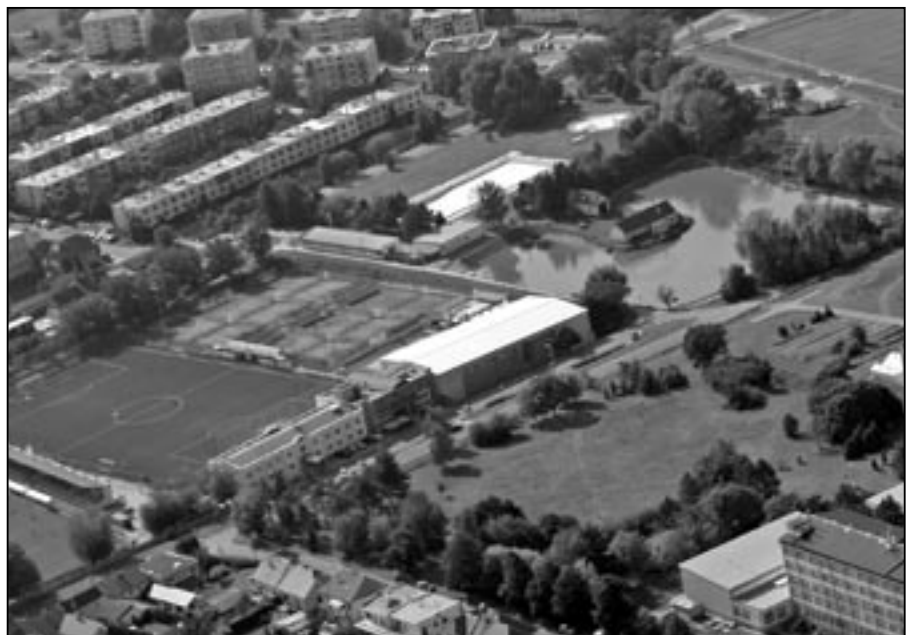
Letecký snímek ve směru na Šírůch, Rybníček a sídliště Kopánky.

2.2 dodatek č. 2 ke smlouvě o dílo na akci Revitalizace významné sídelní zeleně z důvodu změn oproti projektové dokumentaci a změny ceny díla.