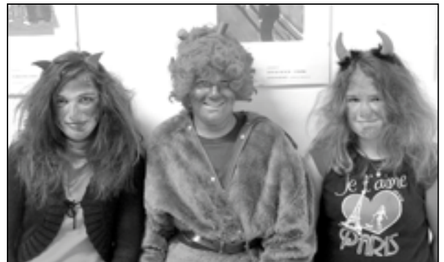
Čertovská trojice nešetřila nikoho z přítomných.