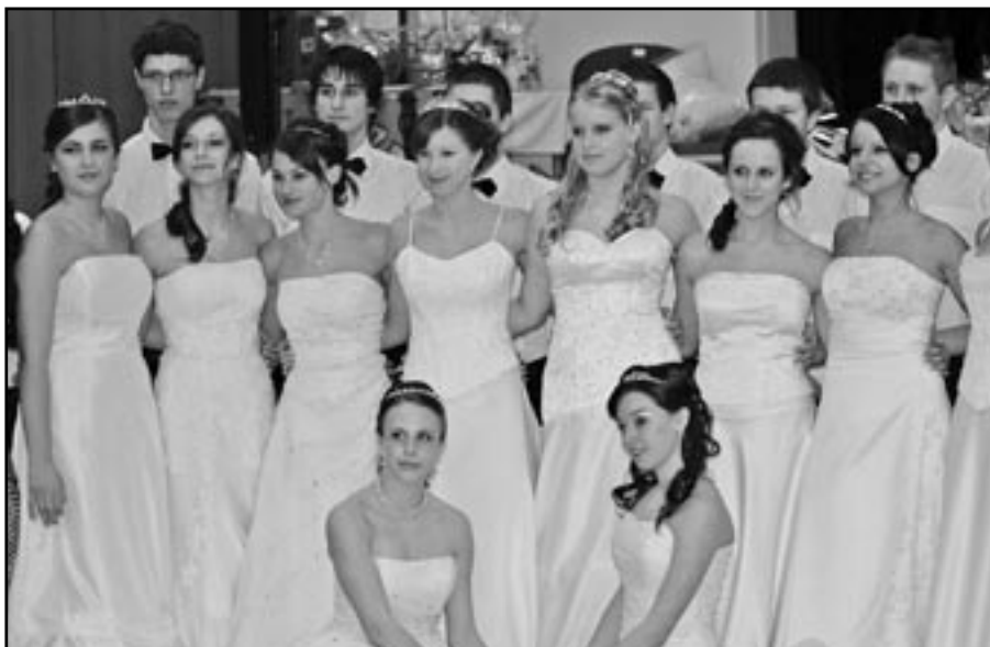
Na snímcích polonéza na Plese rodičů ZŠ v roce 2011.