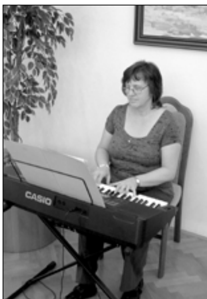
O hudební doprovod se postarala Alena Pluhařová.