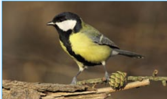
Sýkora koňadra je naše největší sýkora. Je jedním z nejhojnějších ptáků u nás. Žije ve všech typech lesů, dále v zahradách, parcích. V zimě většina z nich navštěvuje krmítka a nejraději mají semena slunečnice, lnu, jádra ořechů, tykví, jablek a lůj.

V dnešní fotoreportáži Vladimíra Kučery vám představíme jedny z našich nejhojnějších ptáků. Sýkory jsou velmi malí ptáčci, žije jich u nás šest druhů. Tito převážně lesní ptáci hnízdí v dutinách stromů, často i v budkách, které jim vyrobí hodní lidé a ochránci přírody. Nejčastěji můžete spatřit sýkoru koňadru, běžná je sýkora modřinka, v našem okolí můžeme pozorovat sýkoru babku, méně početná je sýkora parukářka, sýkora lužní a naše nejmenší sýkora uhelníček. Nezapomínejte v zimě na vyhladovělé ptáčky a pomozte jim přežít období, kdy je krajina pod sněhem a ledem. Bohatě se vám odmění v průběhu jara a léta sběrem škůdců a hlavně svým zpěvem.