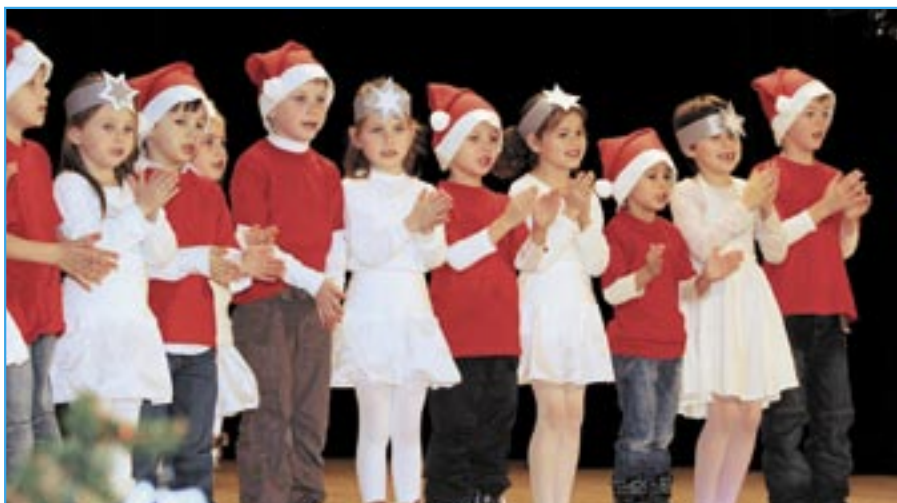
Děti z mateřské školy při Vánočním zpívání v roce 2010.