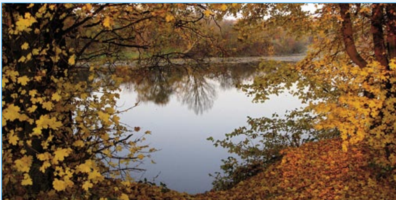
Pestrobarevný podzim na Čertáku.