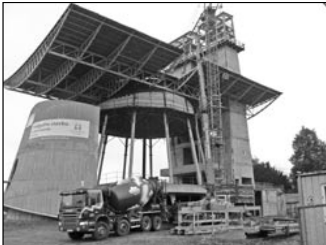
...a čerpáme beton a čerpáme. Stavba kostela Svatého Ducha 24. října 2011.

Téměř současně s kupolí začaly práce na bednění střechy. Na ocelové krovy byly přišroubovány dřevěné krokve, zhruba jeden kilometr celkové délky, na ně se pak přibíjely půldruhacoulové desky z kvalitního modřínu. Že je to všechno zelené? Před položením nahoru se všechno dřevo nejdřív máčelo do speciální lázně, „aby nám střechu ani červotoč, ani dřevomorka ...“. Nakonec byla na bednění přibita lepenka. Je tam jen provizorně, než se dokončí všechny drobnosti a střecha se opatří speciální folií.