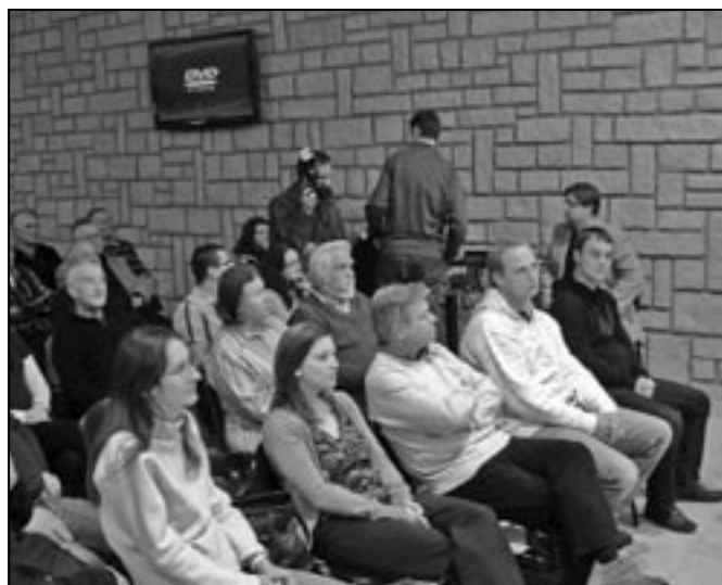
Účastníci přednášky o archeologických výzkumech na Slovácku za posledních pět let, která se konala 22. listopadu 2011.