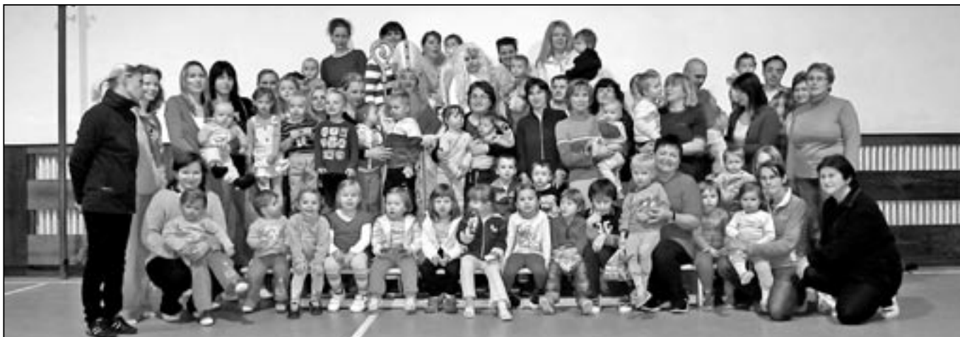
Mikuláš naděloval dětem na Orlovně.