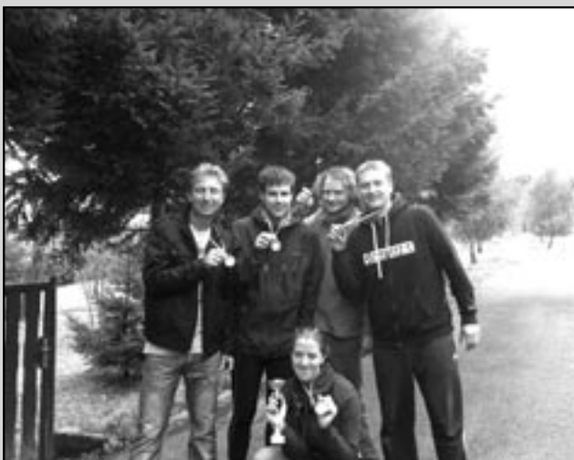
Pětičlenná výprava jednoty Orla Staré Město.