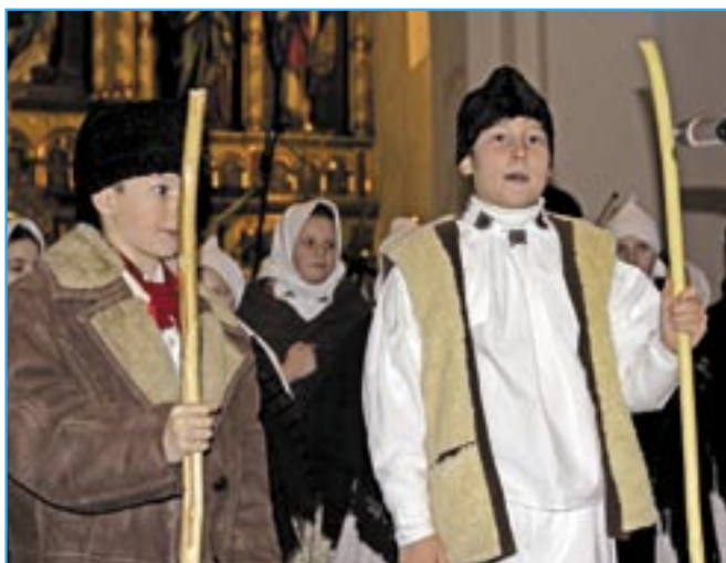
Chlapci a děvčata se opět těší na vánoční vystoupení.