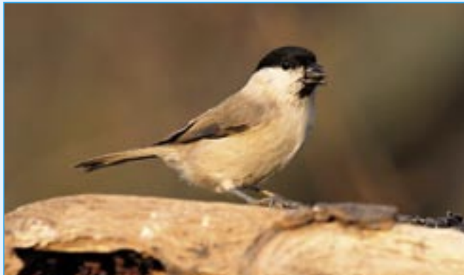
Sýkora babka je menší než vrabec. Je šedohnědá, má třpytivě černé temeno hlavy, bílé líce a malou černou skvrnu na bradě. Hnízdí ve světlých listnatých lesích, v zahradách a parcích. Poměrně hojná je v Kunovském lese.