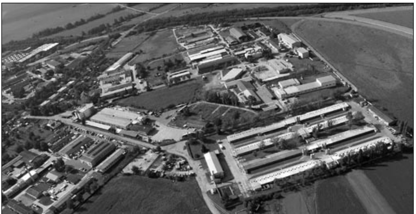
Průmyslová část Starého Města.