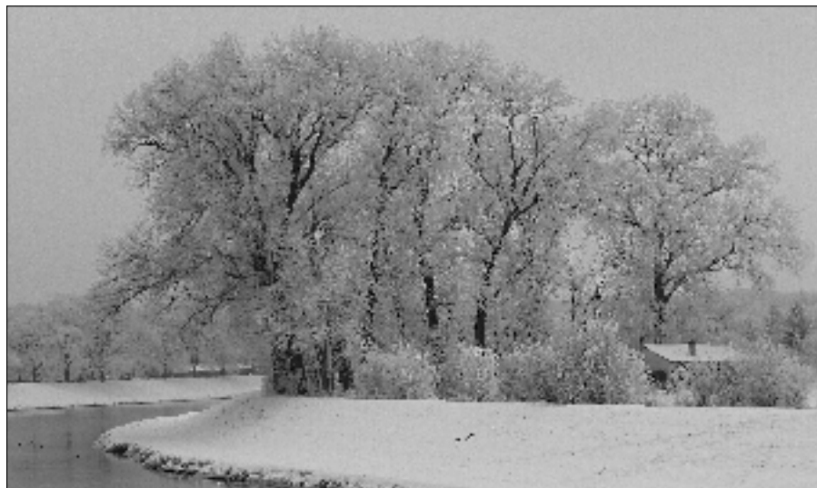
Podzím pomalu končí a již 22. prosince nastupuje svou tříměsíční vládu paní Zima. Snímek je z pravého břehu řeky Moravy za železničním mostem z 30. ledna 2010.