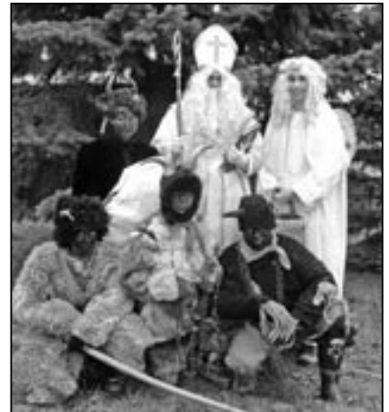
Mikuláš, anděl a družina čertů pod vánočním stromem, který byl rozsvícen při zahájení jarmarku v 10:10 hodin.

I když nebyl sníh, jak se k pravému Vánočnímu jarmarku sluší, bylo to nakonec velmi příjemné