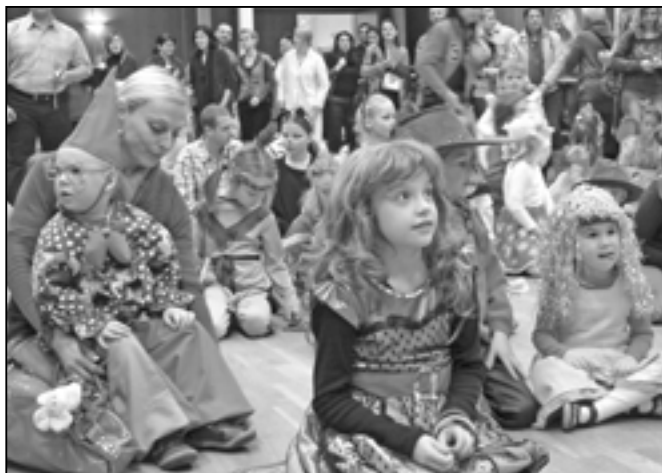
V neděli 29. ledna 2012 jste srdečně zváni na Karneval, který pořádá SVČ Klubko ve Společensko-kulturním centru (sokolovně)