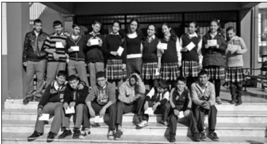
U tureckých žáků sklidily naše dopisy velký úspěch.