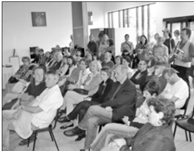
Účastníci mezinárodní vědecké inference byli s přijetím v Památníku Velké Moravy velmi spokojeni.