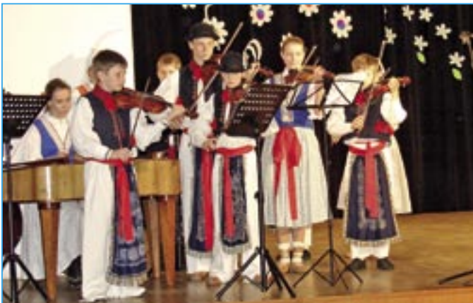
Cimbálová muzika základní umělecké školy.