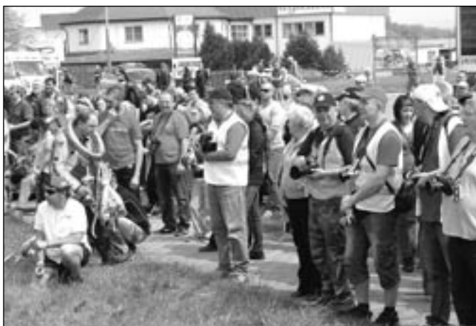
Mnoho atraktivních záběrů pořídil na závodech fotograf Vladimír Kučera (na snímku čtvrtý zprava). Jeho nejvydařenější snímky si můžete prohlédnout ve fotogalerii na www.staremesto.uh.cz .