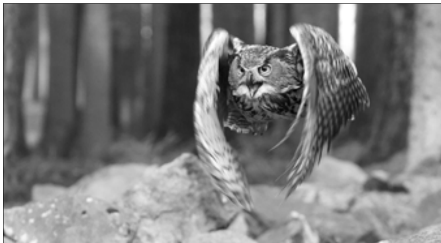
Výr velký je noční pták. Je největší žijící sovou. Často se mu přezdívá král noci.