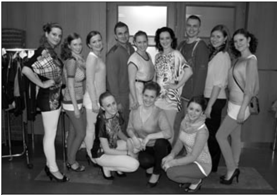
Modelky měly letos velmi příjemnou společnost. Na staroměstské přehlídkové molo nastoupili i dva sympatičtí muži. A ohlas byl veliký!