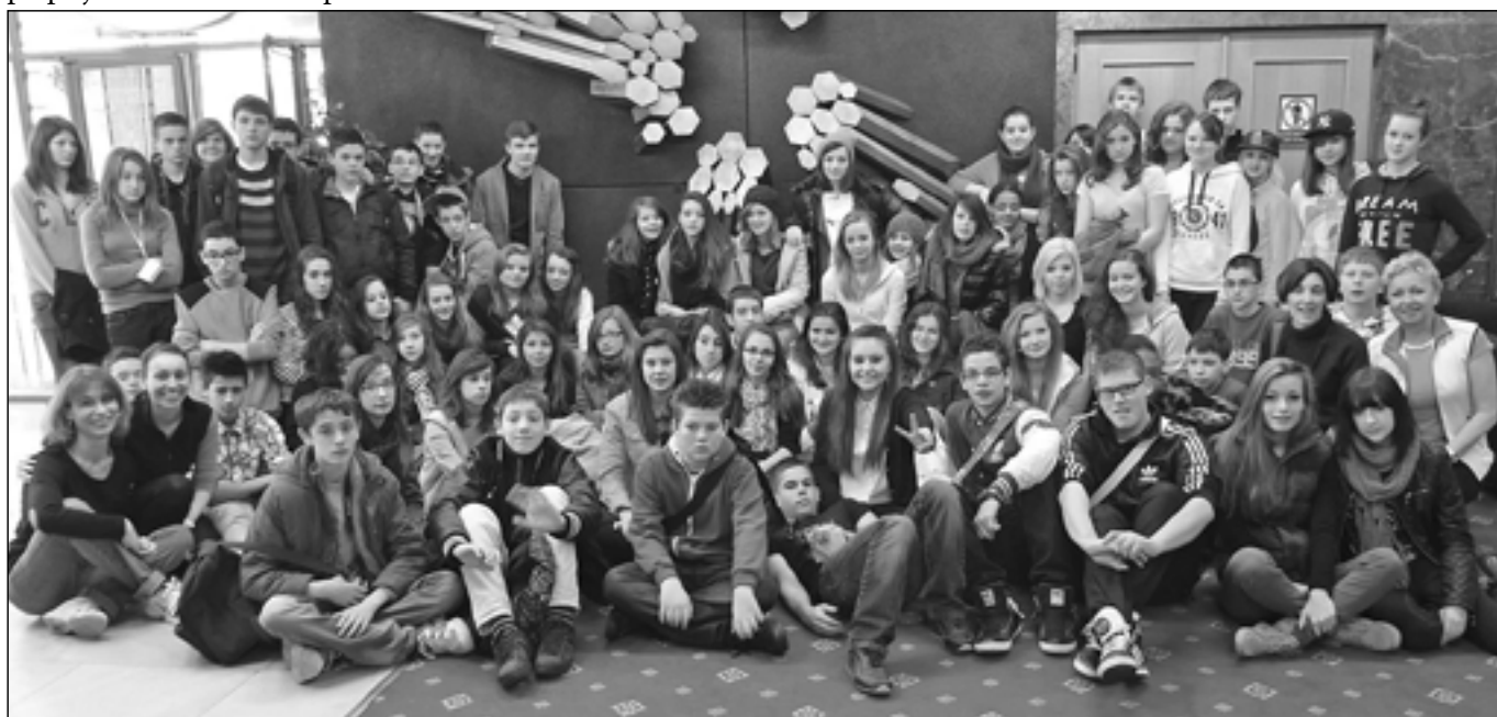
Chlapci a děvčata ze Základní školy Staré Město se v Praze setkali s delegací žáků a studentů z partnerské školy z francouzského města Gençay.