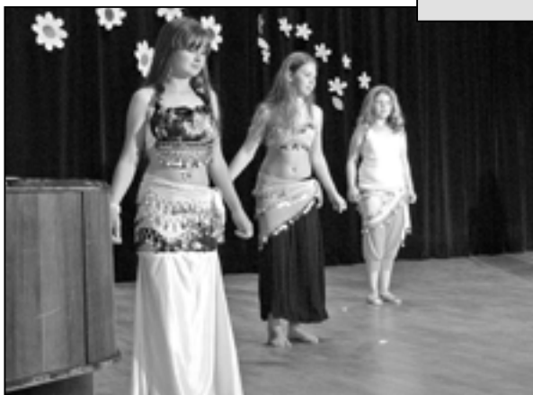
Břišní tanečnice z Klubka se představily při vystoupení k Svátku matek v neděli 12. května ve Společensko – kulturním centru ve Starém Městě.