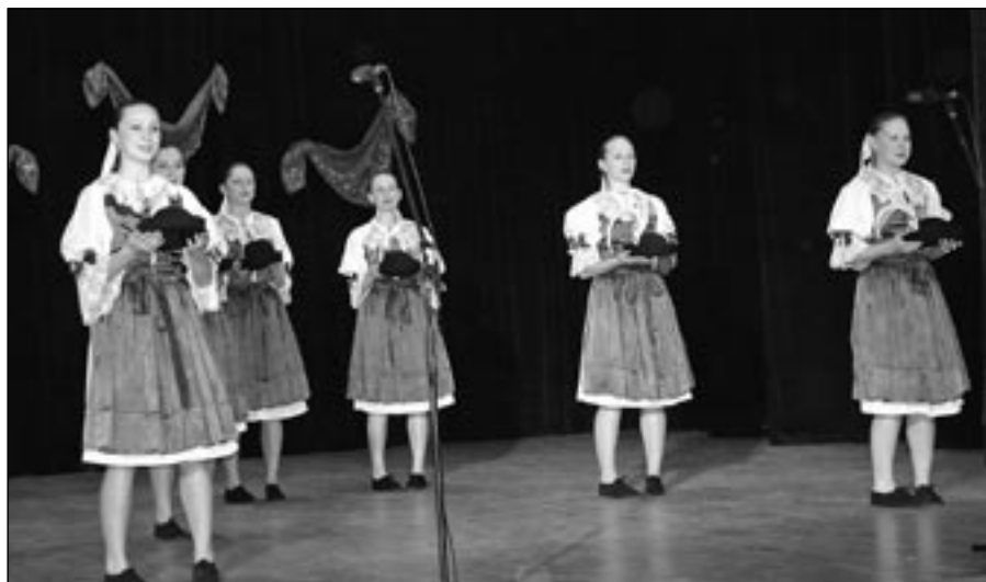
Děvčice ze souboru Dolina při vystoupení v kulturním programu.