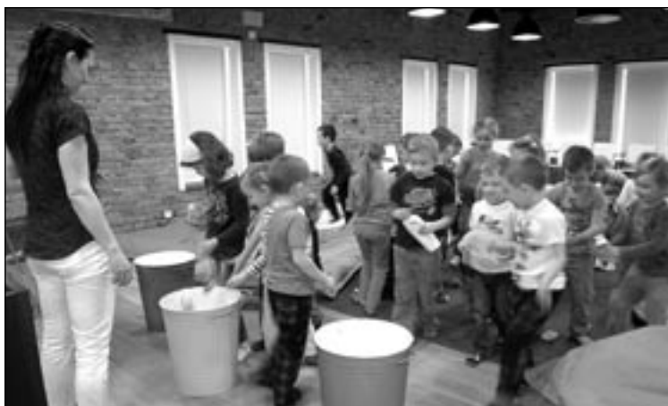
V zajímavé přednášce se děti učily třídit odpad.