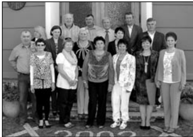
Třída 9. A u staroměstské radnice, kde proběhlo přijetí starostou města.