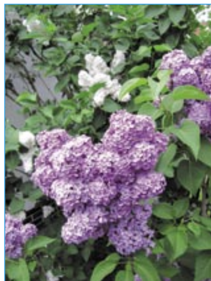
Všude kolem nás voněly šeříky.

I přes nepříznivé počasí přišlo do divadelního sálu více než 300 lidí, kteří sledovali vystoupení dětí z mateřských škol Komenského, Rastislavova, Za Radnicí, dále se představily soubory Dolinečka I a Dolinečka III, které doprovodily cimbálové muziky Rubáš a ZUŠ, nechyběli mladí muzikanti a tanečnice ze základní umělecké školy, Orel vyslal na přehlídku dětské tvořivosti rodiče s dětmi, dvě skupinky předvedly pohybové hry a čtvrtá skupinka moderní tanec. Nedělní pořad