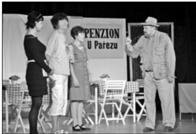
Plesník se chystá na cestu a před svým odjezdem si vybírá zástupkyni.