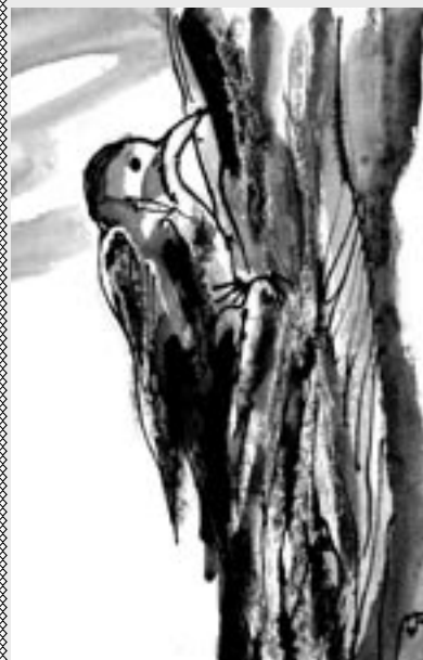
Kresba: Jindra Pelková

Tak často mně to připadá, že když přivinu Tě k sobě, žeš kvůli mně zde na světě a já že kvůli Tobě.