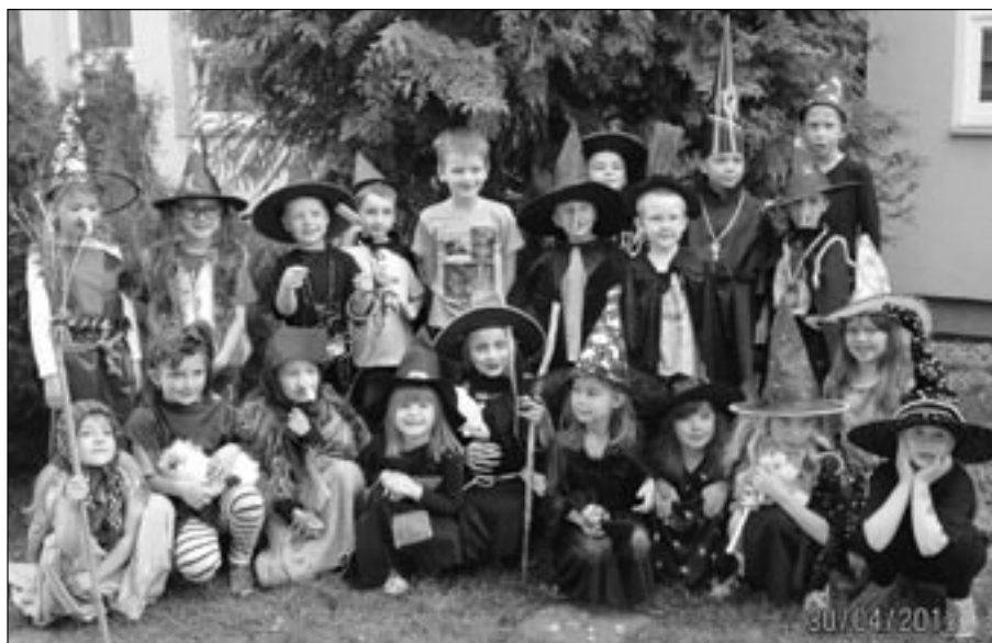
Do mateřské školy Rastislavova přišlo 30. dubna plno malých čarodějů a čarodějnic.

Poslední den měsíce dubna se nese v čarodějném duchu. Mateřská škola Rastislavova se připravovala už od začátku měsíce, kdy jsme vyhlásili soutěž pro rodiče a děti „O nejstrašnější čarodějnici.“ Celý měsíc se plnil vstup do mateřské školy krásnými výtvarnými tvorbami, které rodiče a děti malovali a vyráběli. V úterý 30. dubna toto výtvarné tvoření vyvrcholilo REJEM ČARODĚJNIC. Do školky přišlo plno malých čarodějů a čarodějnic.