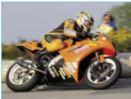
Milan Šobáň na motocyklu KTM 690 ve třídě Supermono skončil v první části startovního pole na 9. místě.