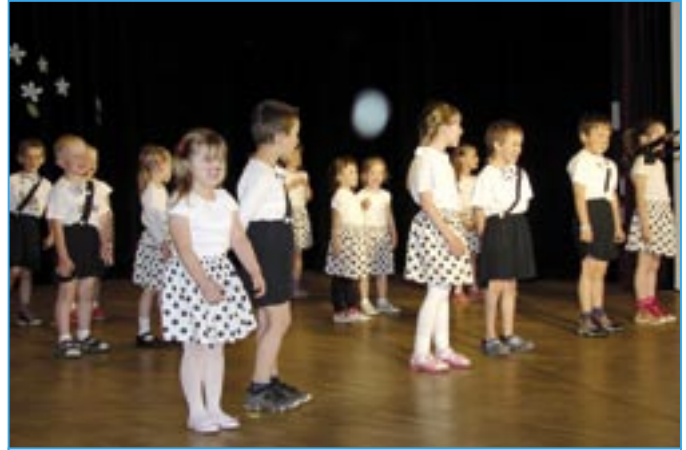
Děti z Křesťanské mateřské školy v ulici Za Radnicí nacvičily se svými učitelkami vystoupení s názvem „Čumáčkování“.