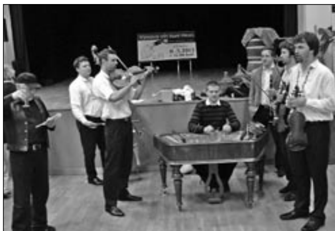
K dobré pohodě zahrála cimbálová muzika Mladí Burčáci.