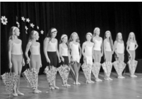
Dívky z tanečního oboru ZUŠ ve skladbě Setkání v dešti od Jiřího Pavlici při oslavě Svátku matek v neděli 12. května v SKC.

Největší počítačová LAN párty v České republice a Slovensku