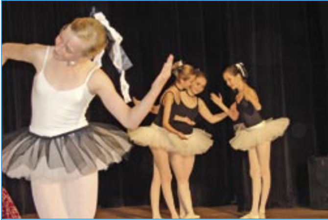
Žákyně 6. ročníku tanečního oboru ZUŠ v baletu Petra Iljiče Čajkovského Mistr a jeho loutky .