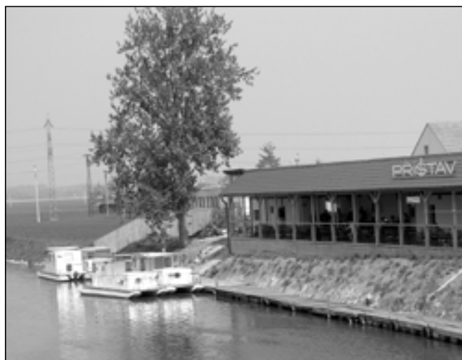
Výletní loď Pannonia I, Pannonia II a Havaj odpluly, v přístavu zůstala jen menší plavidla.