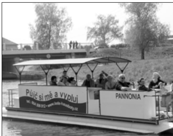
Jako první odjela na vyhlídkovou plavbu loď Pannonia.