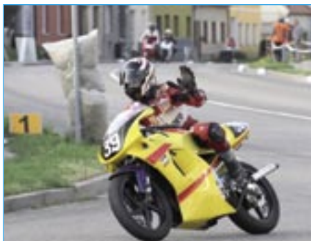
Radek Koňářik trénoval na Aprilii RS 125 ve třídě 125 SP.