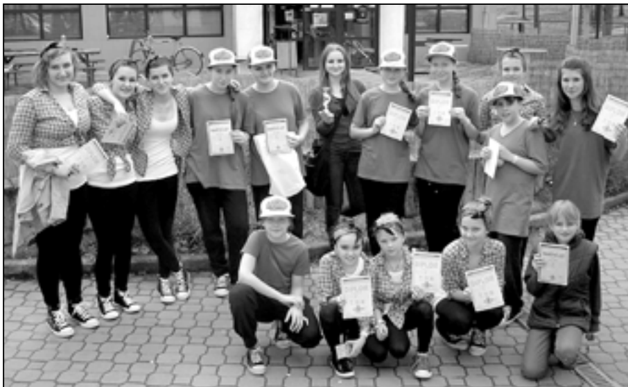
Tanečnice ze Střediska volného času Klubko získaly další úspěchy na soutěžích.