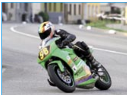
Pavel Matuš při tréninkové jízdě ve třídě Supermono na stroji Kawasaki KLX 650.