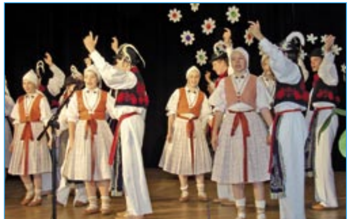
Dolinečka III při vystoupení.