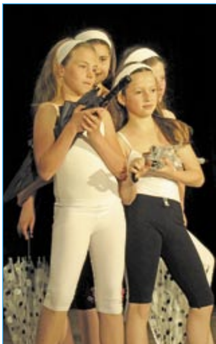
Dívky z tanečního oboru ZUŠ ve skladbě Setkání v dešti od Jiřího Pavlici.