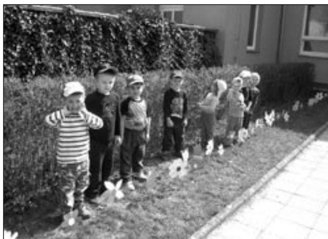
Přesně v den svátku, 22. dubna, děti popřály Zemi k svátku papírovou kytičkou.