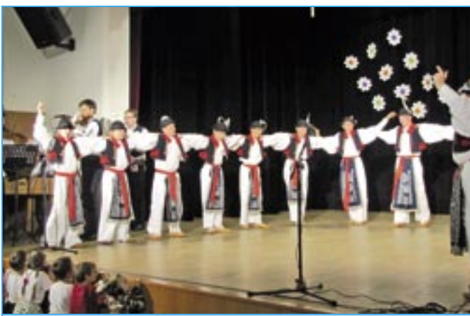
Verbíří z Dolinečky III.