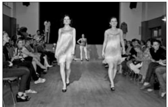
Vzdušné, lehké a velmi slušivé letní šaty.

ské splňuje veškeré parametry k daným sportům. Modely byly z materiálů lehkých, prodyšných, voděodolných, větruodolných, s antipachovou ochranou, odolné vůči UV záření a s chladivým efektem. V případě aktivního způsobu života doporučujeme navštívit obchod Anisport paní Anny