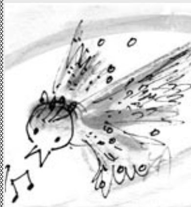
Kresba: Jindra Pelková