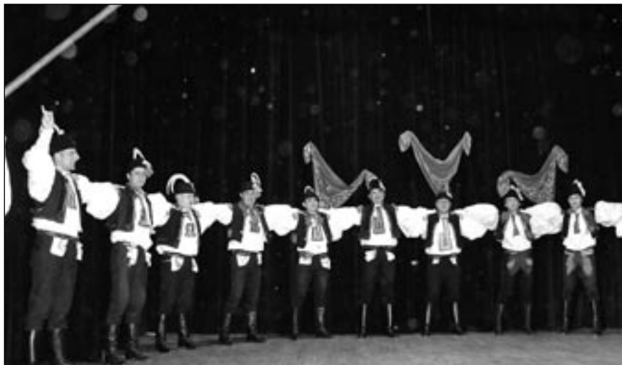
Verbíři si společně zazpívali a zatančili před začátkem soutěže.