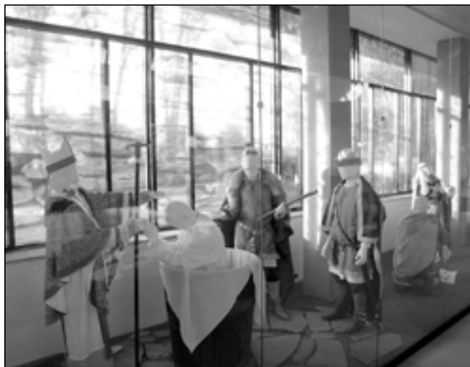
Součástí expozice jsou i Velkomoravané v historickém oblečení.