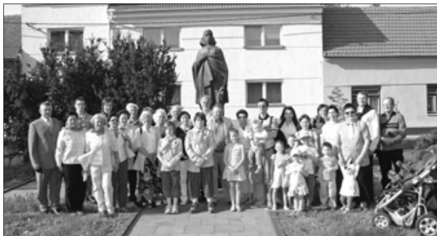
Společná fotografie účastníků pietního aktu.