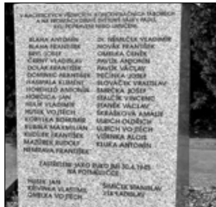
V nacistických věznicích, koncentračních táborech a na frontách druhé světové války padli, byli popraveni nebo umučeni naši spoluobčané.