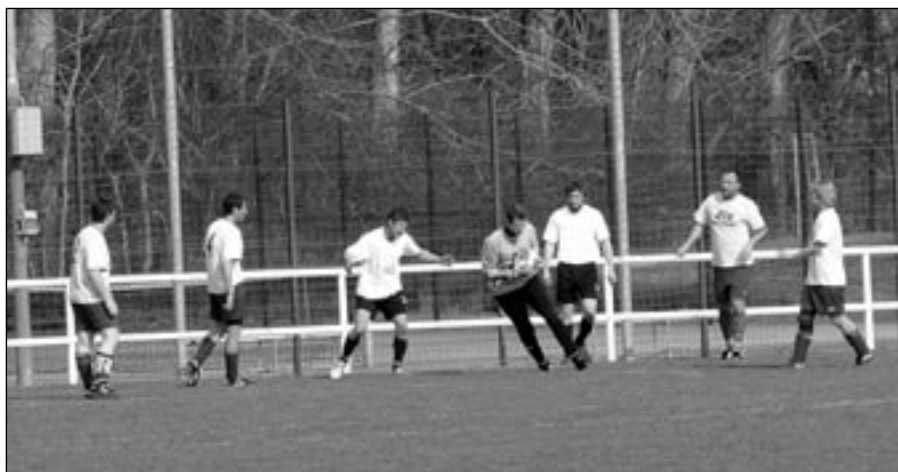
Fotbalové utkání na Rybníčku. Fotbalisté Jiskry zde prohráli pouze jeden zápas.