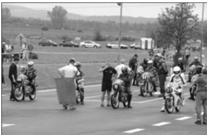
Okamžik před startem prvního závodu třídy Klasik 175 ccm.