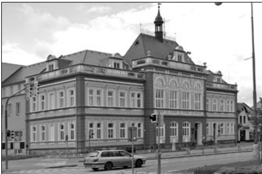
Přijďte diskutovat na radnici ke kulatému stolu v pondělí 17. června od 17 hodin ve velkém zasedacím sále na radnici.