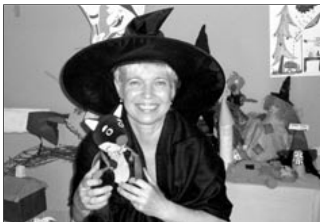
Také paní učitelky přilétly na koštětech.