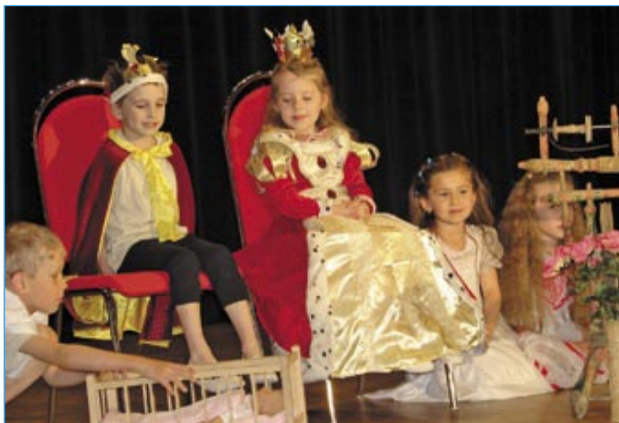
Děti z mateřské školy Rastislavova zahrály pohádku O Šípkové Růžence .