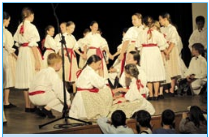
Dolinečka I v samém závěru oslavy Svátku matek.