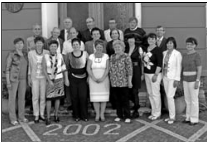
Setkání se zúčastnilo 20 mužů a žen z třídy 9. B.