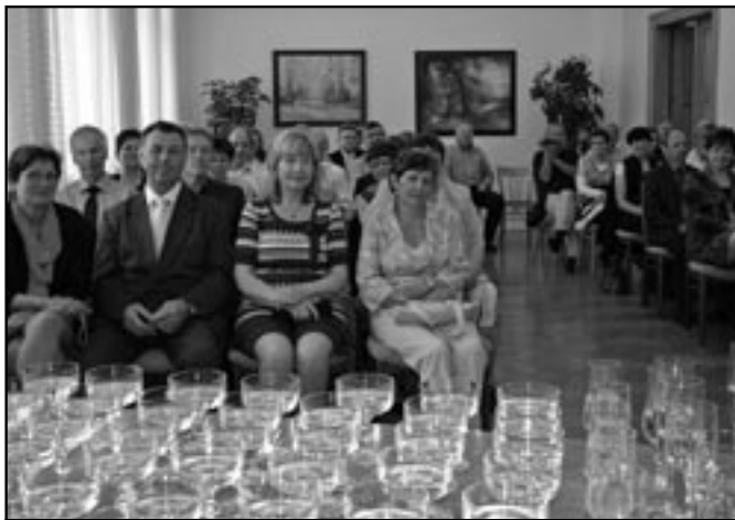
V obřadní síni na radnici se sešli muži a ženy ročníku 1952-1953.