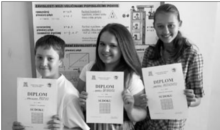
Úspěšní účastníci okresního kola základních škol v Sudoku.