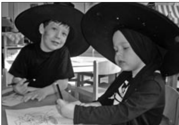
Kouzelný den se nám ve školce povedl.

Celý den děti soutěžily, létaly na koštětech, lovily hady v čarodějně láhvi, bě-