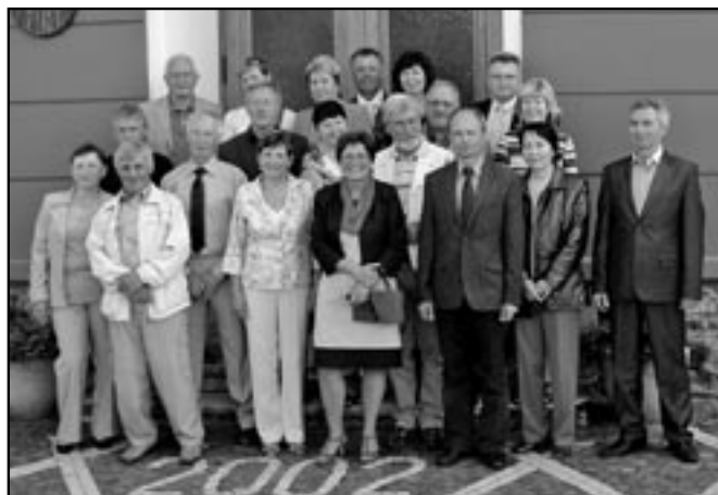
Bývalá třída 9. C na setkání 45 let po ukončení základní školy.