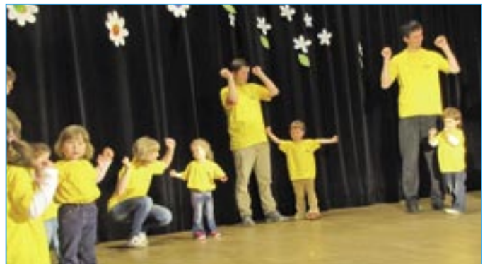
Říkančky a básničky pod názvem „Co všechno jsme se naučili“ nám předvedli chlápci a děvčata z Orla společně s rodiči.