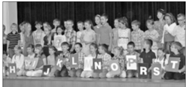
Děti z 1. tříd divákům v sále předvedly říkanky na jednotlivá písmenka abecedy.