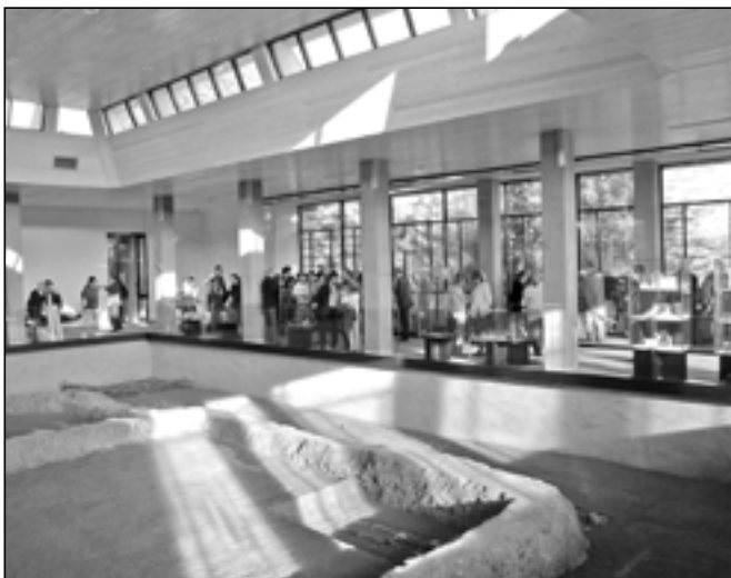
Expozice v Památníku Velké Moravy se těšila velkému zájmu přítomných.