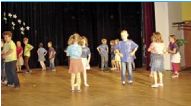
Veselé tanečky v podání dětí z mateřské školy Komenského.