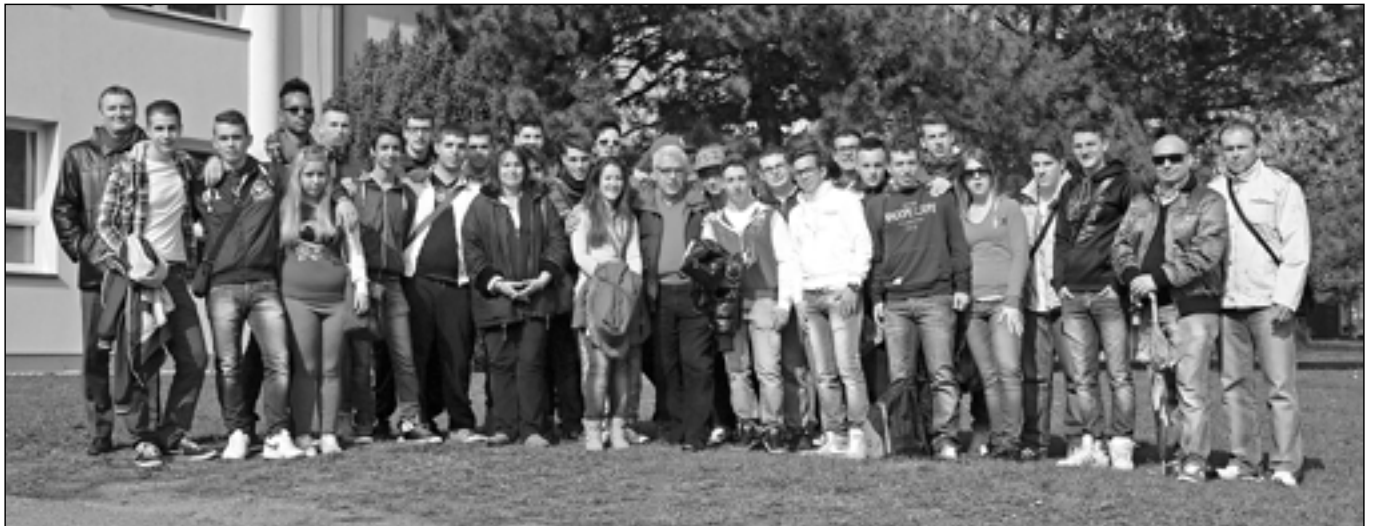
Studenti z Itálie byli s pobytem ve Starém Městě velmi spokojeni.