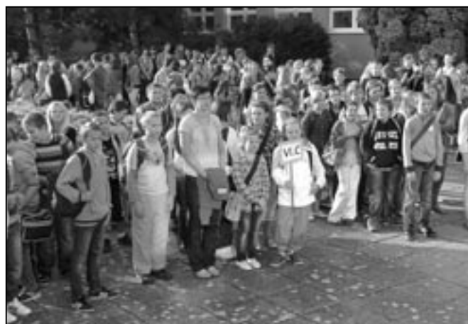
Učitelé a děti při zahájení výuky na ZŠ v Komenského ulici.