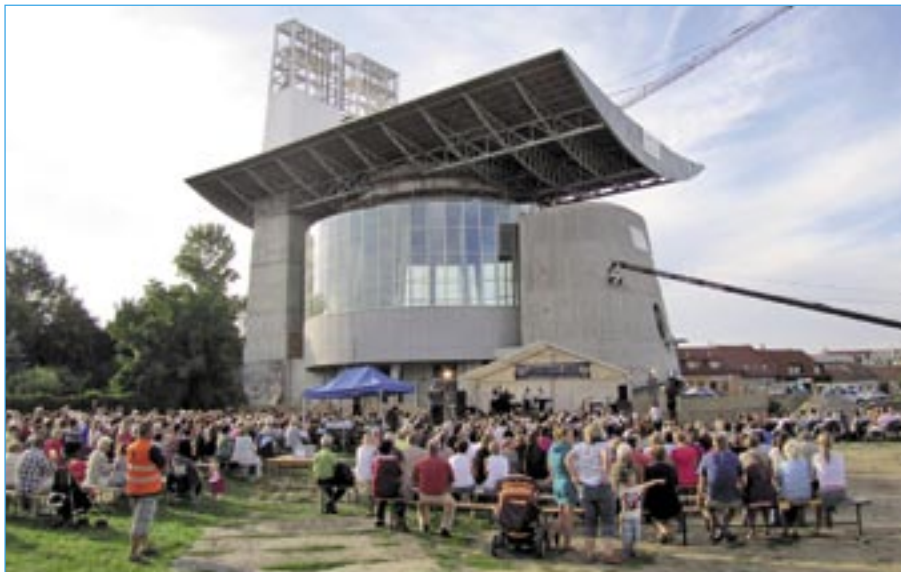
Velkomoravský koncert sledovaly stovky spokojených diváků.