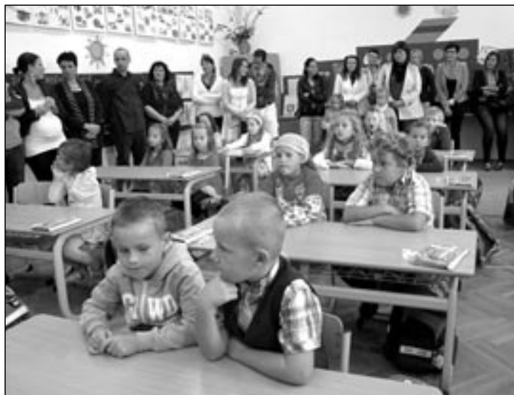
Prvňáčci zasedli do školních lavic.