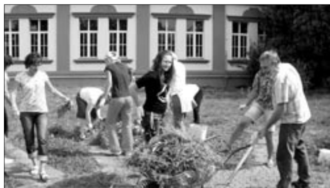
V rámci projektu Zahrada v proměnách času se buduje školní zahrada i na I. stupni základní školy na náměstí Hrdinů. Na snímku učitelé při přípravě školní zahrady.