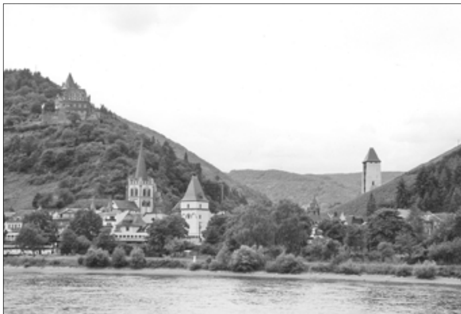
Městečko Bacharach leží v Německu na levém břehu Rýna. V březnu 1349 zde Karel IV. uzavřel sňatek s Annou Falckou.