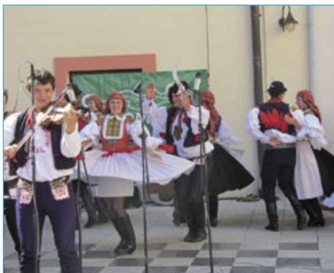
Dolina se divákům velmi líbila.