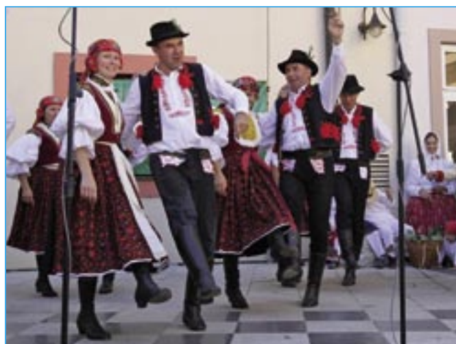
Doliňáci na pódiu nádvoří Staré radnice.