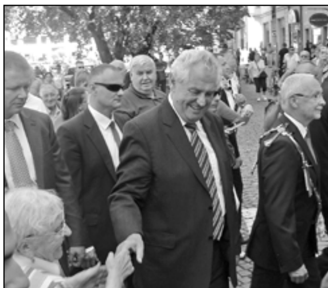
Před radnicí se prezident Miloš Zeman pozdravil s občany.