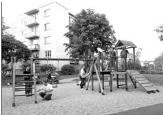
Tatínčí natírají houpačky a skluzavku.