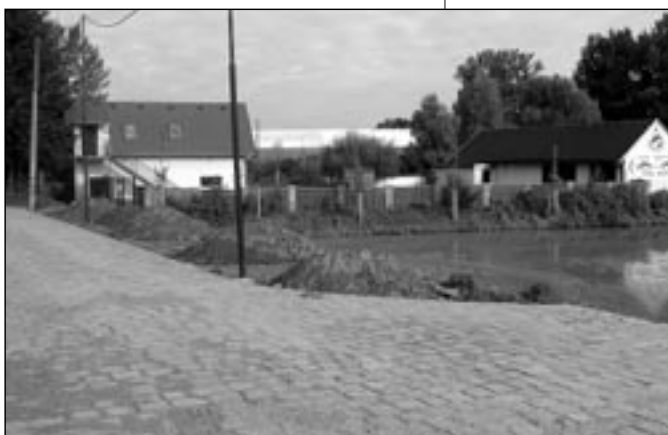
Na Rybníčku byla zrekonstruována komunikace k objektu staroměstských rybářů.