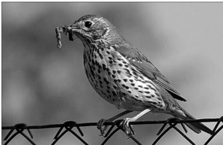
Drozd zpěvný patří mezi vyhledávané pěvce.

Rozum volí noviny, srdce si žádá Staroměstské