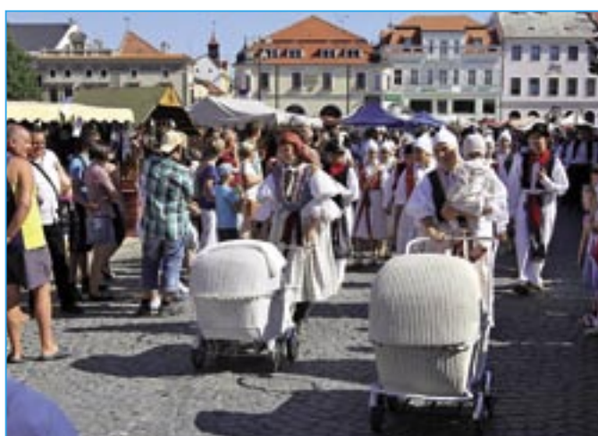
Dolníčka v centru Uherského Hradiště.