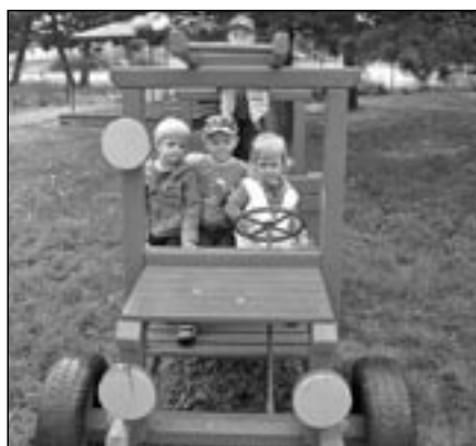
Děti z MŠ Rastislavova v hasičském autě.