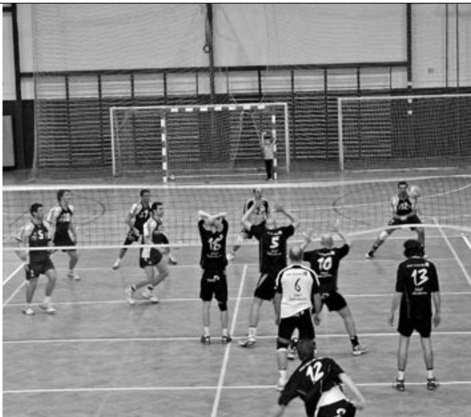
Volejbalové utkání v městské sportovní hale na Širůchu.