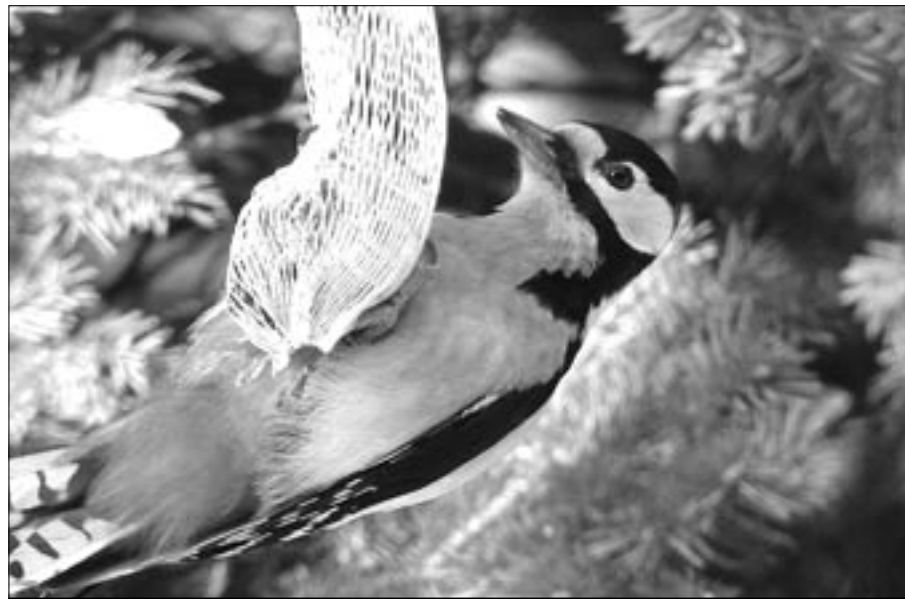
Strakapoud v zimě přilétá na krmítko, v létě hnízdí v dutinách stromů.

Ve středu 18. dubna nastal tolik očekávaný okamžik. Po dlouhé zimě přiletěly vlaštovky. Vesele švitořily na drátě a oznamovaly definitivní příchod jara. Letos nám vlaštovky připravily velké překvapení. V hnízdečku v bývalém chlévě čekalo na každodenní přísun potravy šest malých vlaštoviček. Dění v okolí hnízda jsem pozoroval dlouhé hodiny. A tak jsem zjistil, že při vábení vydává vlaštovka zvláštní zvuk „tsvuit“,