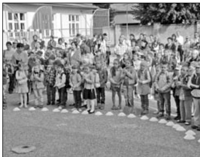
Prvnáčky na školním dvoře ZŠ na náměstí Hrdinů.