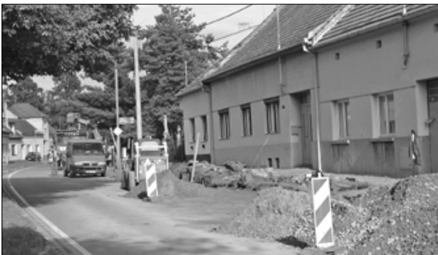
Na Velehradské ulici v září probíhaly stavební práce. Na programu byla rekonstrukce vodovodního potrubí a přípojek do domácností, kterou prováděly Slovácké vodovody a kanalizace Uherské Hradiště. V dalších týdnech bude probíhat investiční akce města, rekonstrukce chodníků a výstavba parkovacích míst před rodinnými domy.

1.11 s umístěním energetického zařízení a schválila zřízení úplatného věcného břemene ve prospěch společnosti E.ON Distribuce, a. s. se sídlem České Budějovice, F. A. Gerstnera 2151/6, IČ: 28085400, zastoupené společností E.ON Česká republika, s. r. o., se sídlem České Budějovice, F. A. Gerstnera 2151/6, IČ: 25733591,