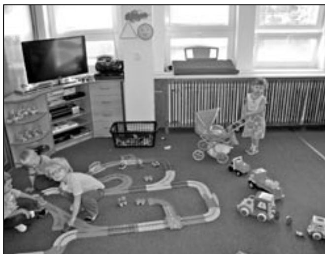
Chlapci a děvčata v MŠ Komenského mají zbrusu novou dráhu na hraní.