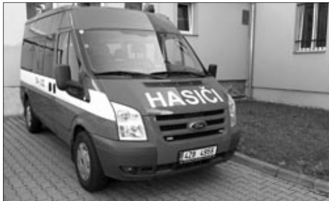
Moderní vůz Ford Tranzit již slouží Sboru dobrovolných hasičů ve Starém Městě.