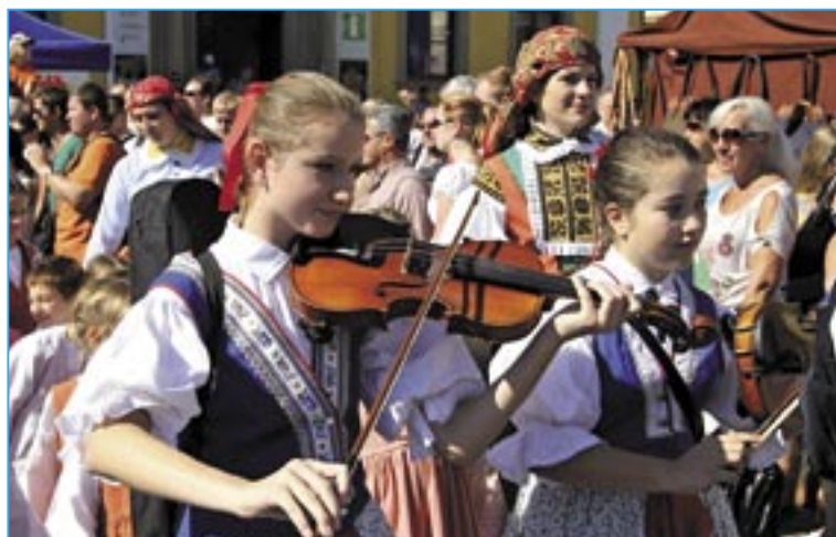
Děti ze souboru Dolinečka na Masarykově náměstí.