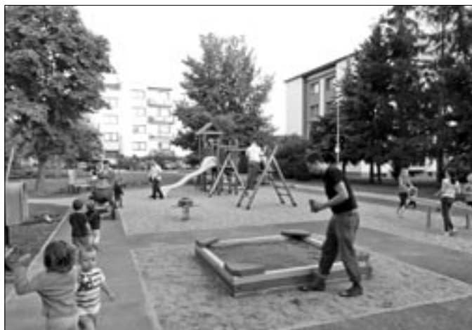
Brigáda na dětském hřišti na Kopánkách.