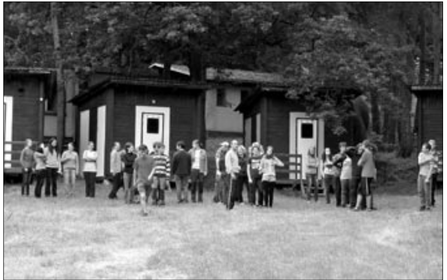
Účastníci ústředního kola olympiády z českého jazyka v Lažánkách u Blatné.

Hned v sobotu jsme dostali první zadání – gramatický úkol na téma „Pravidla pro určování slovesných vidů“. Na vypracování jsme měli čas do dalšího dne. V neděli ráno čekal II. kategorii mluvní projev. Chodili jsme jednotlivě a po přečtení tématu měl každý tři minuty na přípravu, a po-