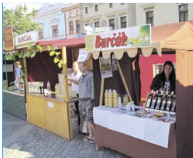
Burčák a víno si mohli návštěvníci slavností zakoupit na mnoha místech.