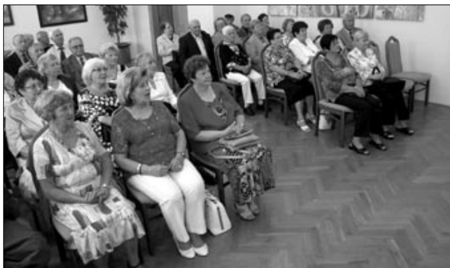
Ročník 1942 – 1943 v obřadní místnosti na radnici.