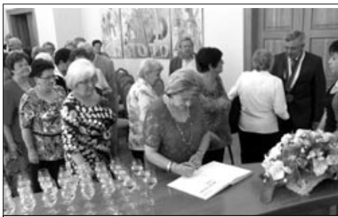
Všichni přítomní se podepsali do Pamětní knihy města.