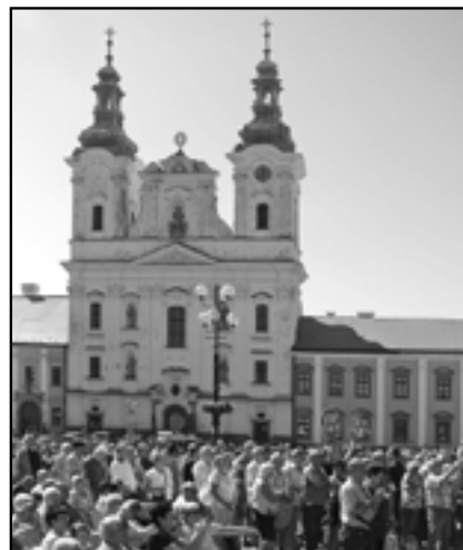
Vystoupení Miloše Zemana si přišlo poslechnout asi 600 občanů.