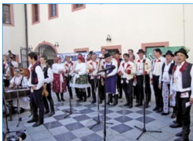
Společné zpívání starostů a místostarostů.