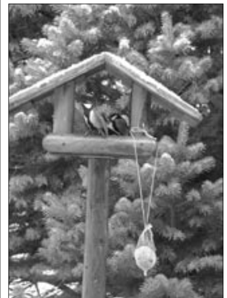
Sýkory koňadry na krmítku.

Začátkem dubna přilétá konipas bílý. Hnízdo rehka domácího loni vyplnila kuna, tak se zabydlel v jednom z pěti hnízd vlaštovek. Nechtěl bych, abyste