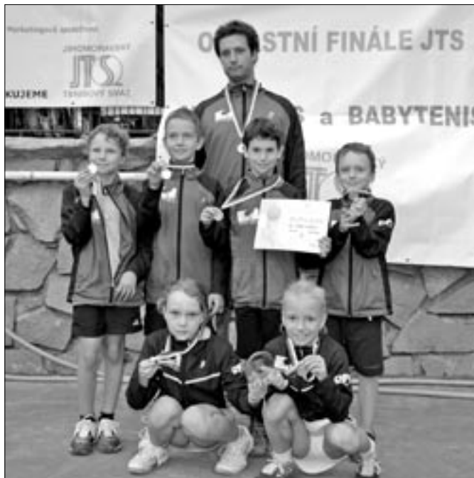
Úspěšní babytenisté Starého Města vybojovali postup do I. ligy.

Na jaře se tak fanoušci mohou těšit na ligová utkání, včetně souboje s mistry České republiky v této kategorii. Na