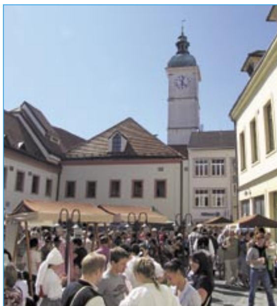
Na nádvoří Staré radnice se představili zástupci obcí regionu Staroměstsko.