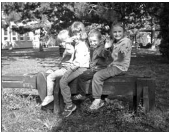
Ve školce je fajn.....