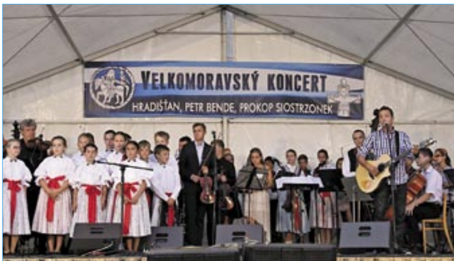
Společné vystoupení všech účinkujících na závěr koncertu.