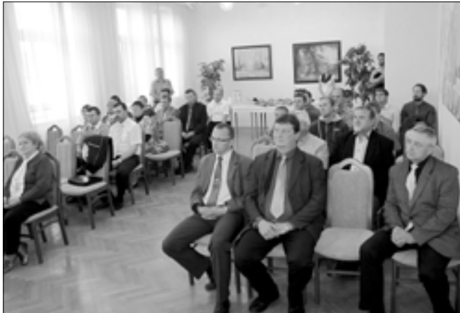
Zástupci spolků a neziskových organizací se sešli s vedoucími představiteli města v obřadní síni na radnici.