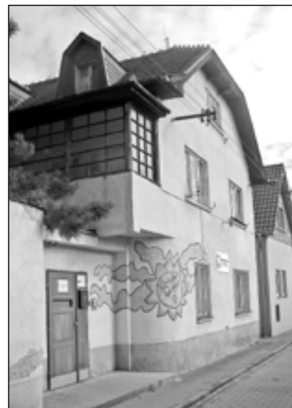
Připravuje se modernizace azylového domu svatého Vincence v ulici Na Hradbách. Objekt bude zateplen a v celém rozsahu budou provedeny nové podlahy.

1.6 zveřejnit záměr na převod majetku - prodej části pozemku p. č. 340/130 orná půda o výměře 14 m 2 , který se nachází pod trafostanicí, ul. Tovární