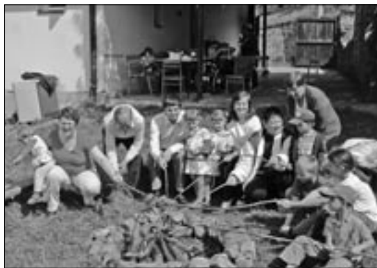
Společně jsme si opekli špekáčky na farním dvoře.