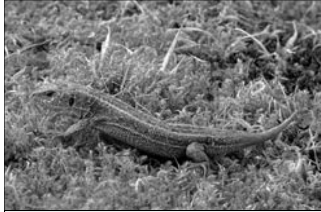
Jestěrk je v České republice zvláště chráněna jako silně ohrožený druh a je zakázán i její odchyt a chov v zajetí. Ale poručte třeba čápovi.

zřejmě vrabci domácí i polní. Ze sýkor je to koňadra, modřinka, babka a vzácně také parukářka, dále strakapoud velký,