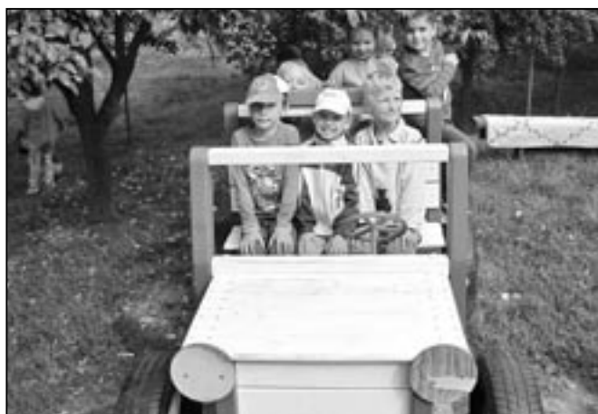
Děti z KMŠ Za Radnicí si hrají ve školní zahradě.