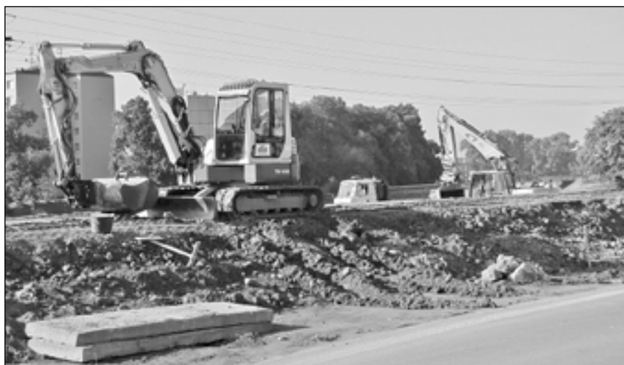
V průběhu měsíce září pokračovaly práce při výstavbě protipovodňových hrází.