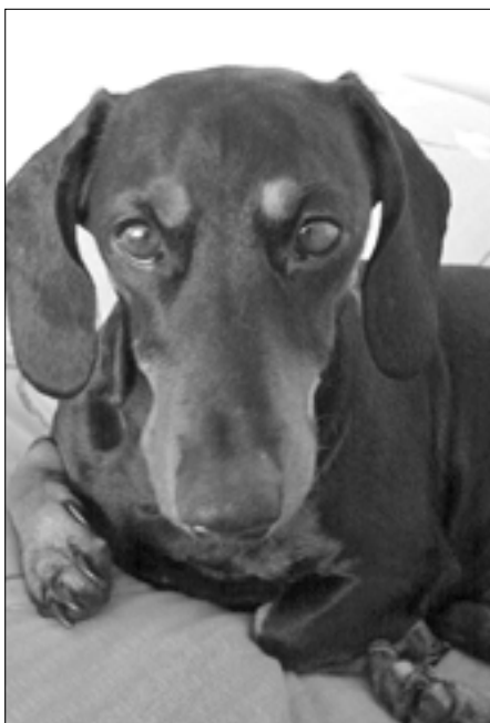
Jezevčík je milující a oddaný pes, ale i skvělý hlídač a norník.