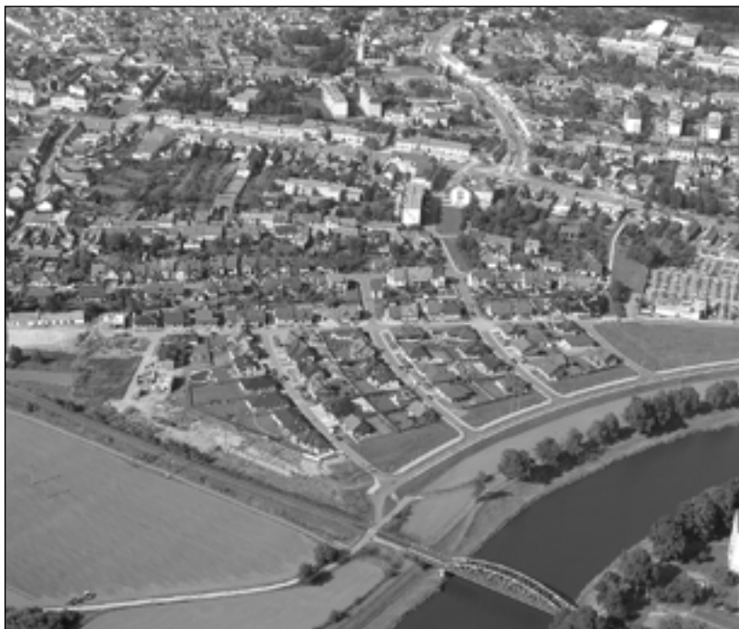
Přivítejme jaro společným úklidem Starého Města!

město Staré Město a Relaxační centrum Madis