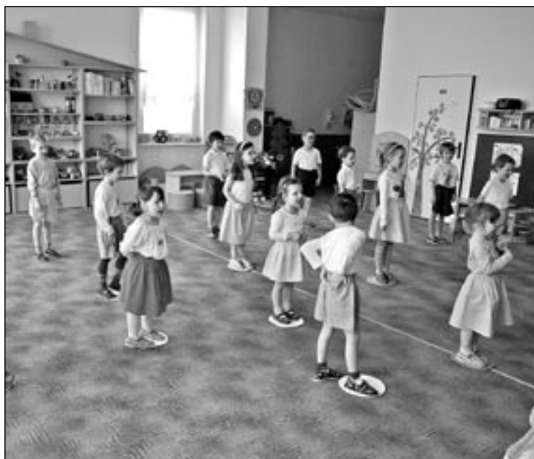
Besídka pro všechny babičky a dědečky se velmi vydařila.