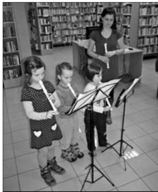
Na úvod vystoupily dívky z mateřské školy, které zahrály na flétny.