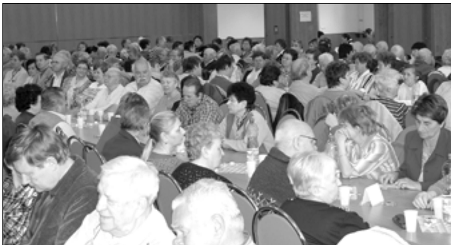
Výroční schůze zdravotně postižených se konají každý rok v první polovině dubna.