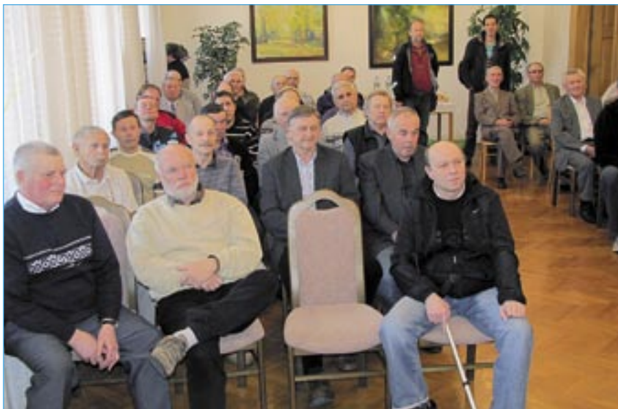
Do obřadní místnosti Městského úřadu ve Starém Městě přišlo celkem 45 bývalých hokejistů.