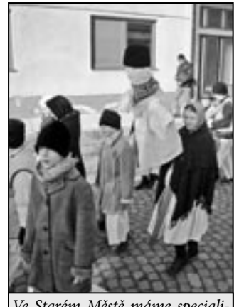
Ve Starém Městě máme specialitu. Chlapci mají svůj symbol zimy – Mařáka.