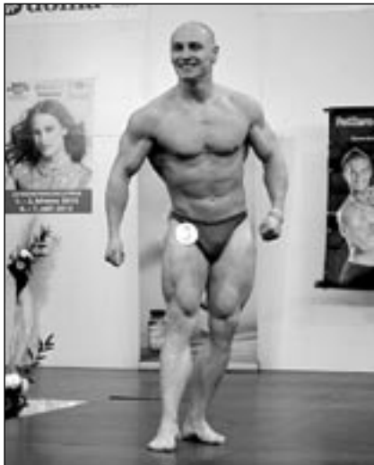
Při sólovém vystoupení.

V sobotu 2. března se v Praze uskutečnila exhibiční fitness soutěž FatZero Beauty a Fitness Cup 2013, kterou pořádala firma Natur – Sport. Generálním partnerem akce byla firma Aminostar.