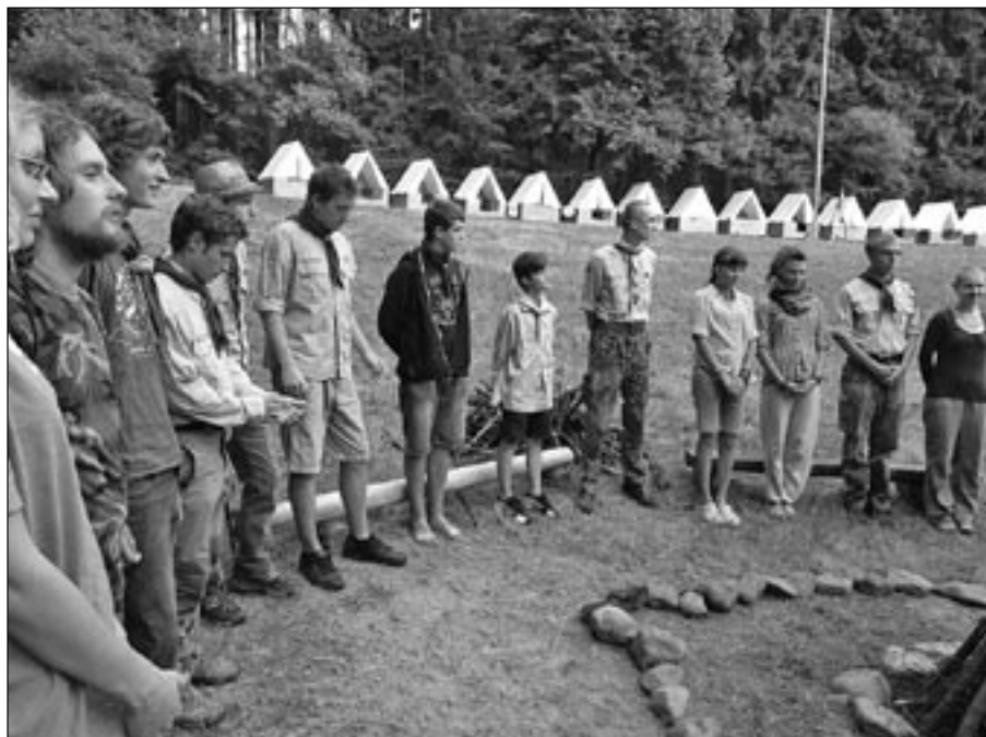
Pojďte se s námi vydat po stopách starých skautských tradic.