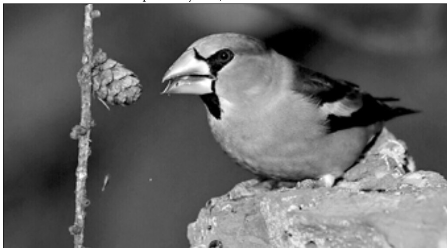
Zobák tlustý jako necky, rozlouskne s ním tvrdé pecky. Po nich jenom mlaská, poznáte ho, dlaska?