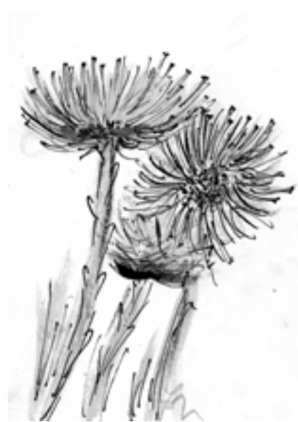
Kresba: Jindra Pelková

Skupinka MIDva vystoupí v restauraci na Špici v sobotu 27. dubna od 20 hodin Rezervace na tel.: 572 541 190