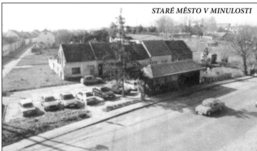
STARÉ MĚSTO V MINULOSTI

Na snímku lokalita Dvorek krátce před velkou povodní v roce 1997. V průběhu záplav byly domky na Dvorku pod vodou, a protože stavebním materiálem byly hliněné cihly kotovice, domky nevydržely a postupně popadaly. Text MK