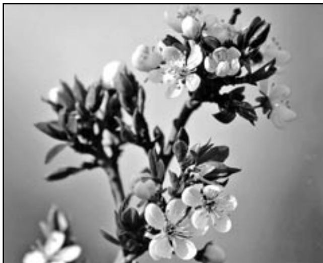
Jaro je tady a brzy pokvetou stromy.

Chceš-li si užít pytel legrace a ještě k tomu rozvinout svůj talent, přihlaš se na SVC Klubko . Přihlášky jsou ke stažení i na webu www.klubkosm.cz