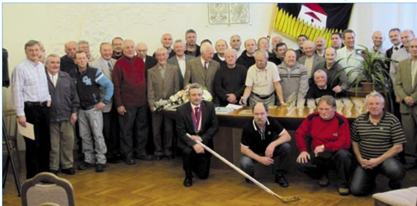
Společnou fotografii jsme pořídili po skončení oficiální části setkání.