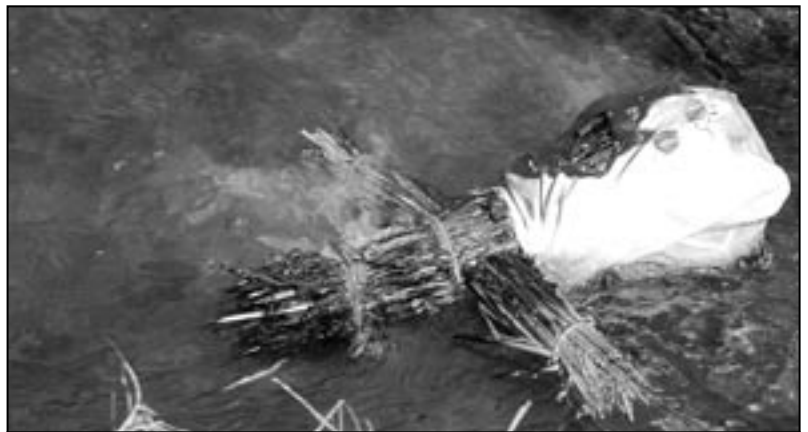
Mařena jen velmi pomalu odplouvá Salaškou k nedaleké řece Moravě.