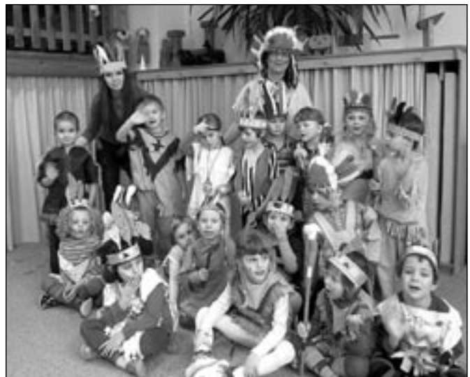
Děti se pečlivě převlékly a namalovaly.