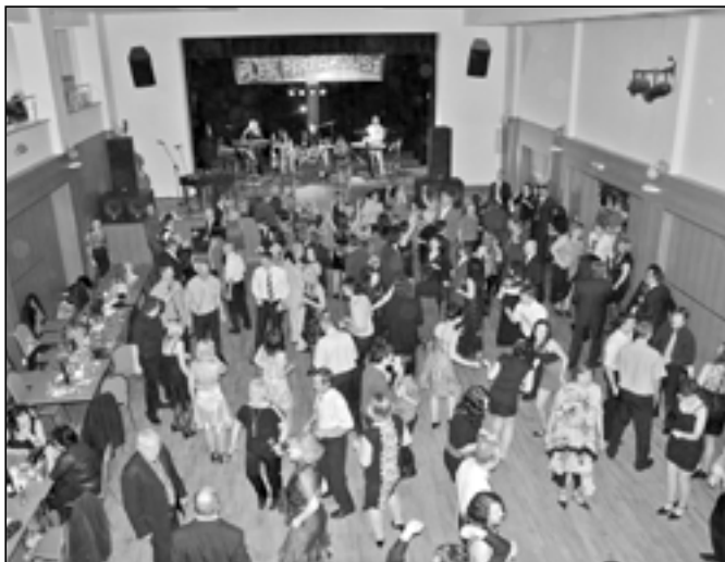
Návštěvníci plesu se skvěle bavili s hudební skupinou Herbalia band.