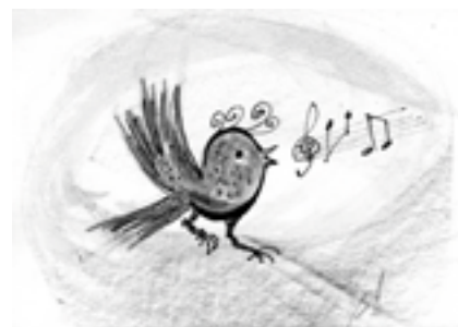
Kresba: Jindra Pelková

V sobotu 30. března ve 20 hodin se uskuteční country večer v restauraci Na Špici se skupinou KALÍŠEK Rezervace míst na tel.: 572 541 190