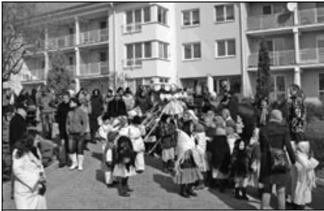
Děti z Dolinečky II a IV se společně loučí se symbolem zimy.