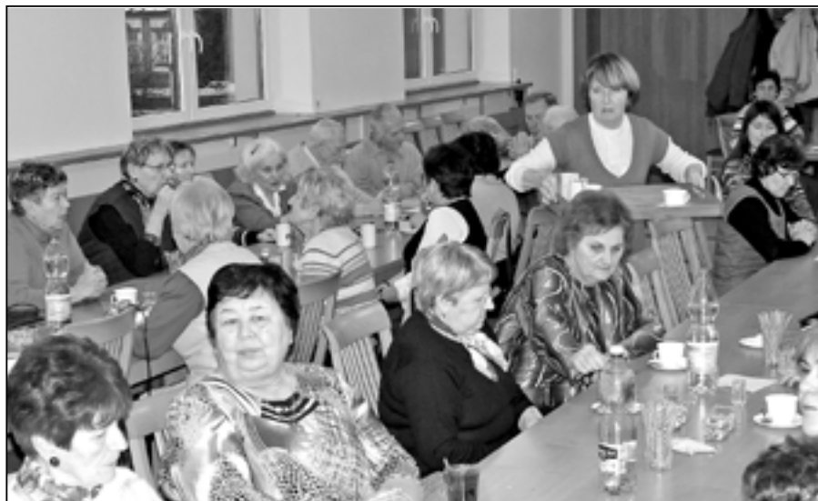
Účastníci sokolské schůze poslouchají zprávu o činnosti za rok 2012.