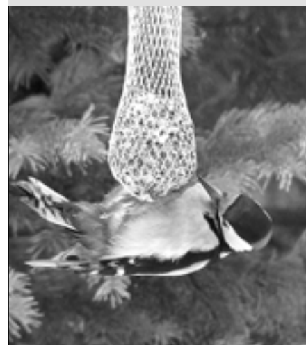
Strakapoud velký v poloze horizontální.