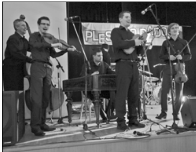
Cimbálová muzika Harafica odvedla perfektní výkon.