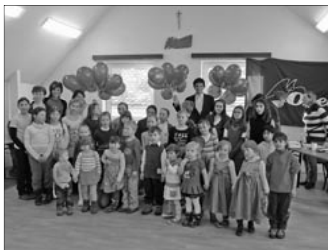
Domanínského slavičku se zúčastnilo 27 chlapců a dívek, kteří soutěžili ve třech kategoriích.