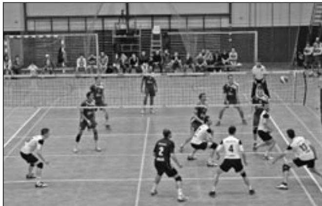
V sobotu 2. března byl odehrán zápas VSK Staré Město - Aero Odolena Voda. Ve druhém setu bylo utkání velmi vyrovnané.