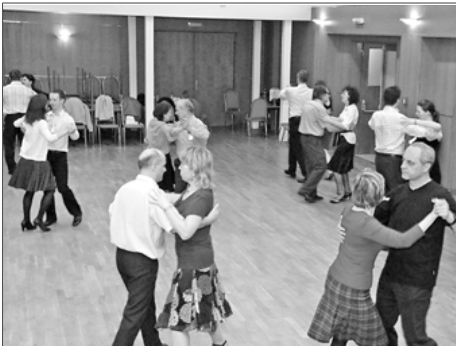
Účastníci tanečních kurzů si osvěžili svůj taneční um a zároveň se zdokonalili v choreografiích standardních tanců – valčík, waltz, tango a quickstep, ale i těch latinskoamerických – čača, jiwe, rumba a mambo.