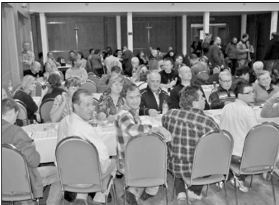
První stůl v divadelním sále si tradičně na koštu rezervují členové Sboru dobrovolných hasičů Staré Město se svými přáteli.