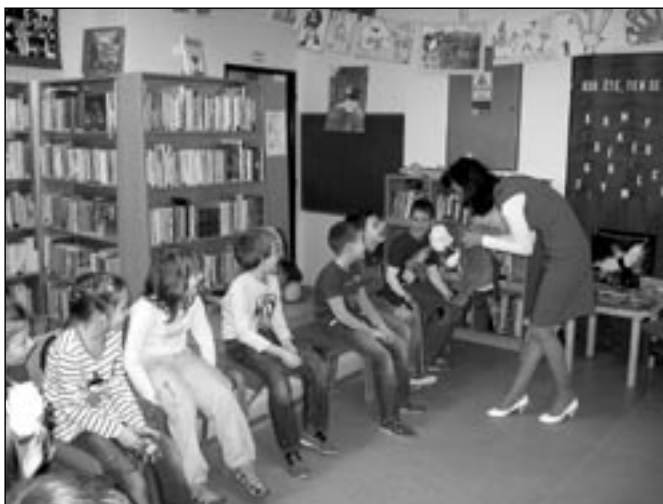
Děti byly seznámeny s knihami jako „Terežka a Šáša Šišulác.“

Poté následovalo krátké seznámení o tom, jak se paní spisovatelka dostala k psaní knih. Původní profesí je učitelka, takže s dětmi má bohatou zkušenost a už tehdy začala psát do časopi-