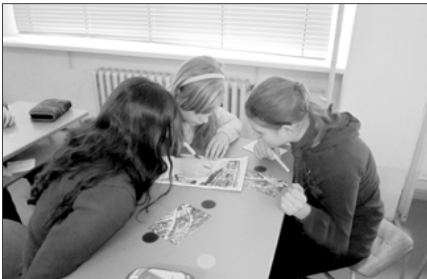
Žáci pátých tříd ze základních škol Jalubí, Nedakonice a Staré Město se setkali ve středu 20. února.