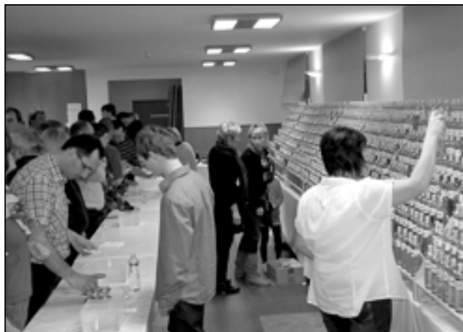
Vzorky pálenek z ovocných kvasů byly v obležení návštěvníků. Obsluha se měla co otáčet...