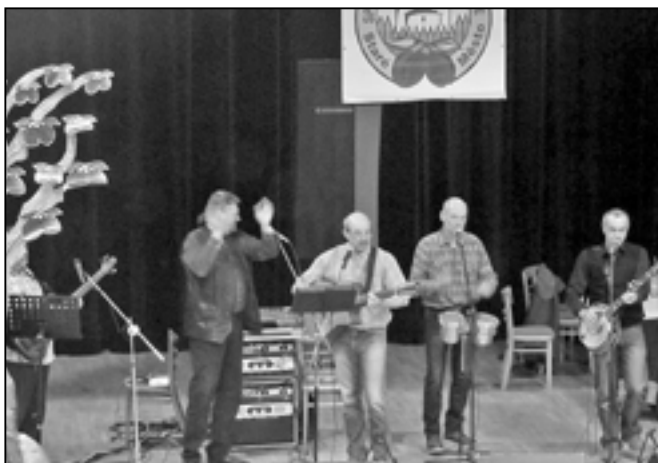
V divadelním sále zahrála country kapela Jižané.