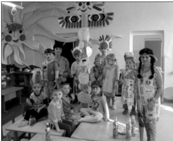
Karneval v indiánském duchu.