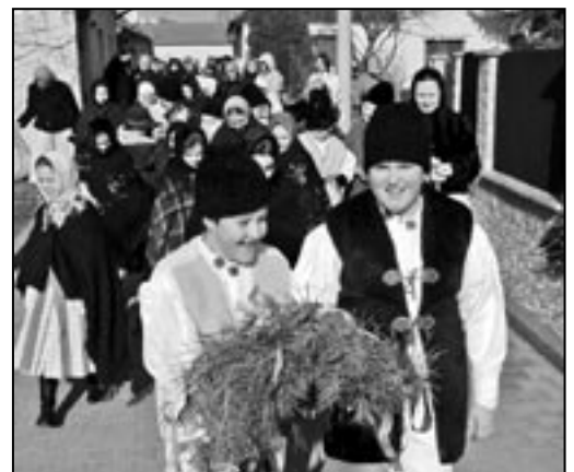
Chození s létěčkem, které symbolizuje poselství jara a nového života.