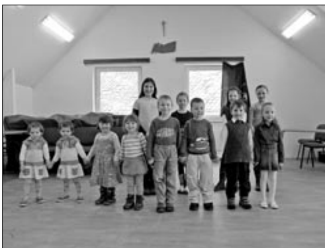
Všechny děti se velmi snažily podat co nejlepší výkon.