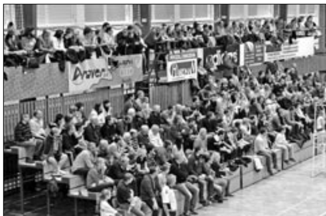
Do Městské sportovní haly na Širůchu přicházelo 275 až 350 diváků. Největší zájem byl o derby zápas s Brnem.