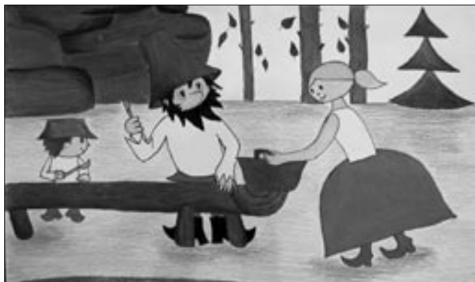
Kresba Zuzany Dočkalové získala diplom za 2. místo.