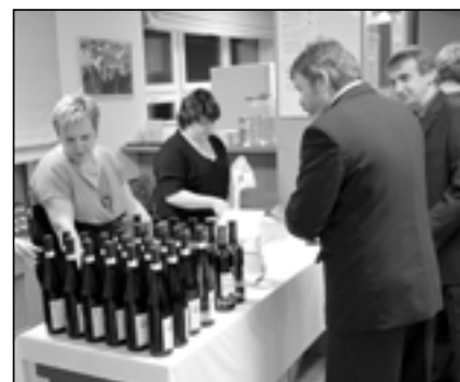
Pánové, dáte si bílé nebo červené?