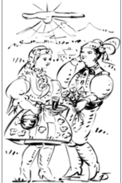
Kresba: Jan Slováček