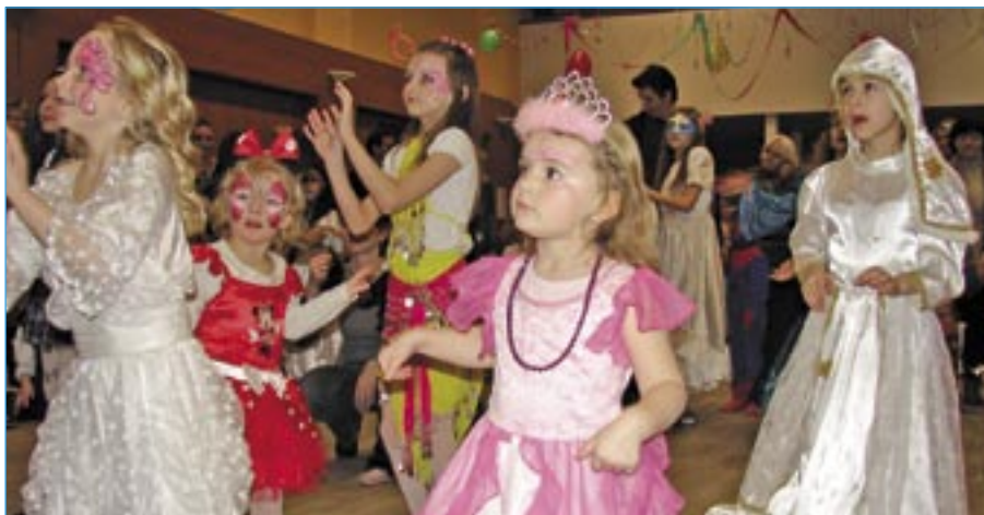
Tanečky v divadelním sále.