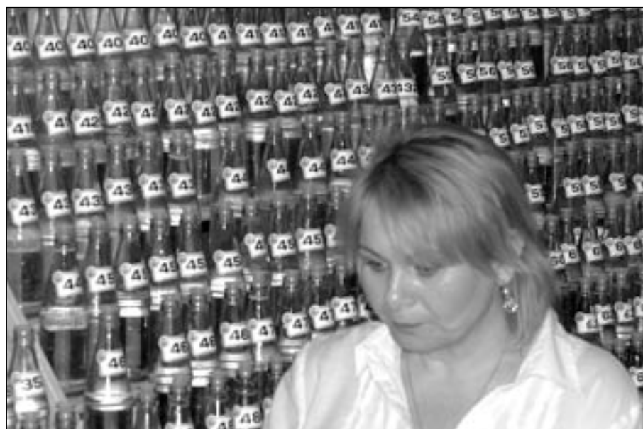
Na staroměstském koštu bude velký výběr pálenek.