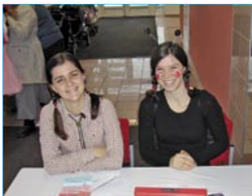
Pojďte dál, právě začínáme...