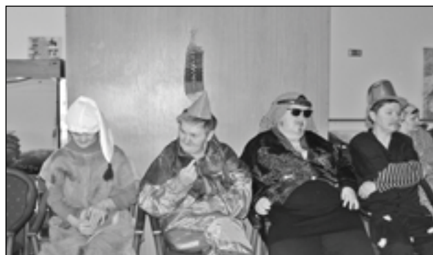
Klienti domova obyvatel se zdravotním postižením se na fašanky vždy velmi těší.