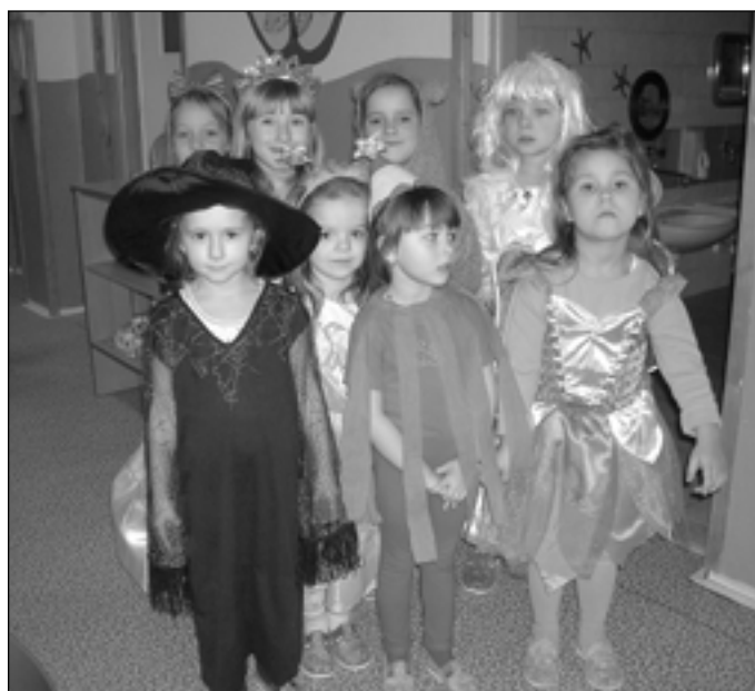
Děti mají rády karneval.