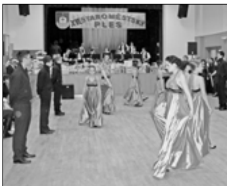
Polonézu zatančili studenti Střední odborné školy a Gymnázia Staré Město.

STAVAKTIV s. r. o. Staré Město SVS – CORRECT spol. r. o. Bílovice PWS Plus s. r. o. Staré Město Odpady – Třídění - Recyklace a. s. Uherské Hradiště R. K. SERVIS spol. s r. o. Uherské Hradiště C. S. O. spol. s r. o. Staré Město MĚSTO Staré Město