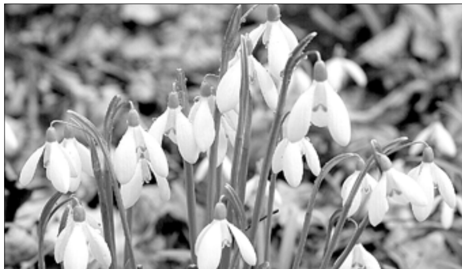
Již od konce února můžeme v přírodě spatřit sněženku.