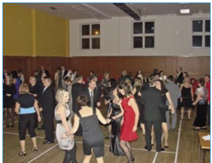
Veselo bylo ve sportovním sále se skupinou V. S. P. Band.