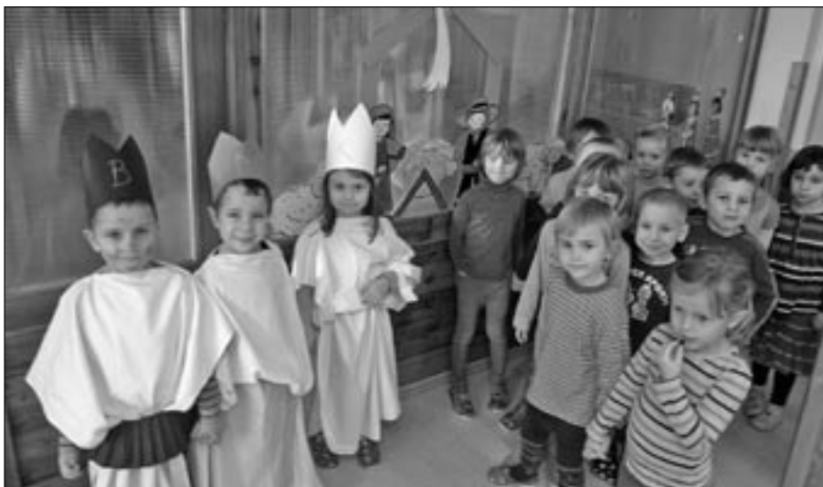
V mateřské škole Komenského se stalo tradicí, že děti ze třídy Kašpárků obcházejí školku s Tříkrálovou koledou a popřejí všem štěstí, zdraví.