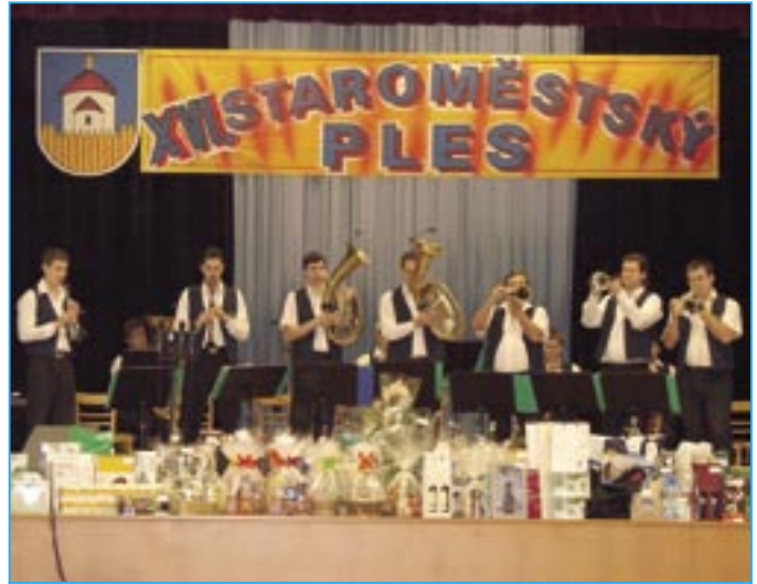
V divadelním sále vyhrávala dechová hudba Liduška z Dolních Bojanovic.