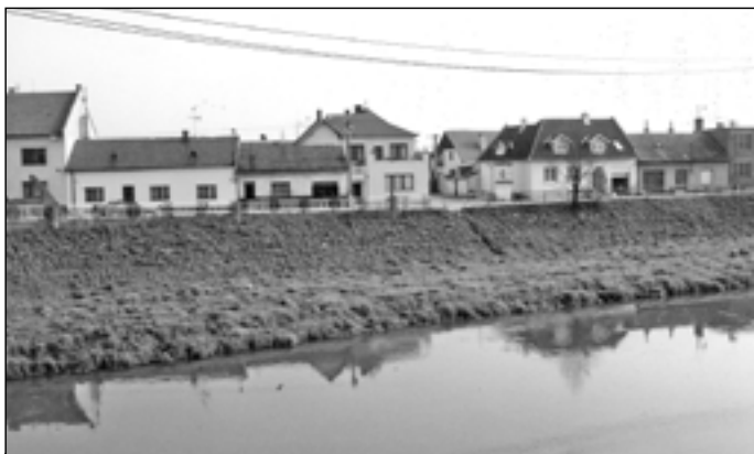
Pohled na Rybárny z Moravního mostu.