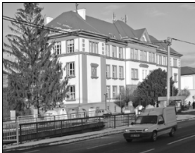
Do budovy základní školy na náměstí Hrdinů přicházeli občané z volebních okrsků č. 1 a č. 4.

Ve Starém Městě bylo zapsáno ve volebním seznamu celkem 5548 voličů. Volební účast byla 62,82 %. Odevzdaných bylo 3469 platných hlasů (99,57 %). Z těchto čísel vyplývá, že prezidentských voleb ve Starém Městě se nezúčastnilo 2079 oprávněných voličů, případně se k volbám dostavili, ale jejich hlas byl neplatný. Výsledky voleb ve Starém Městě jsou poně-