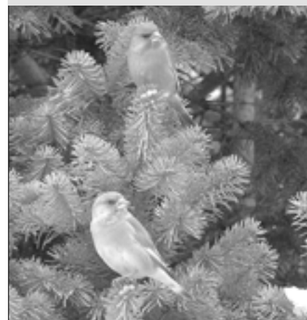
Zvonek zelený je přibližně velký jako vrabec. A víte, jak ho poznáte za letu? Jednoduše, létá ve vlnovkách.