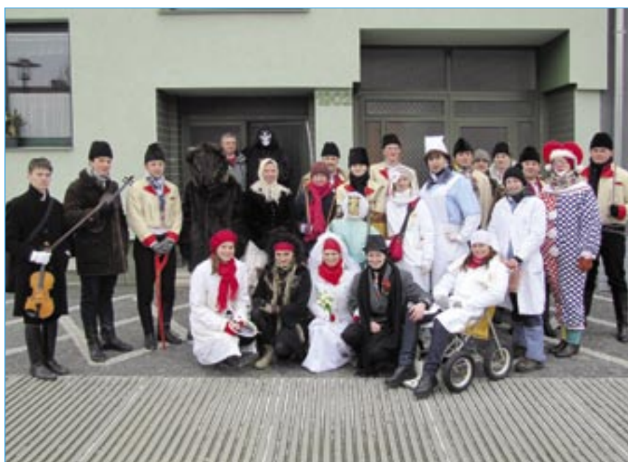
Společná fotografie 26 fašancářů.