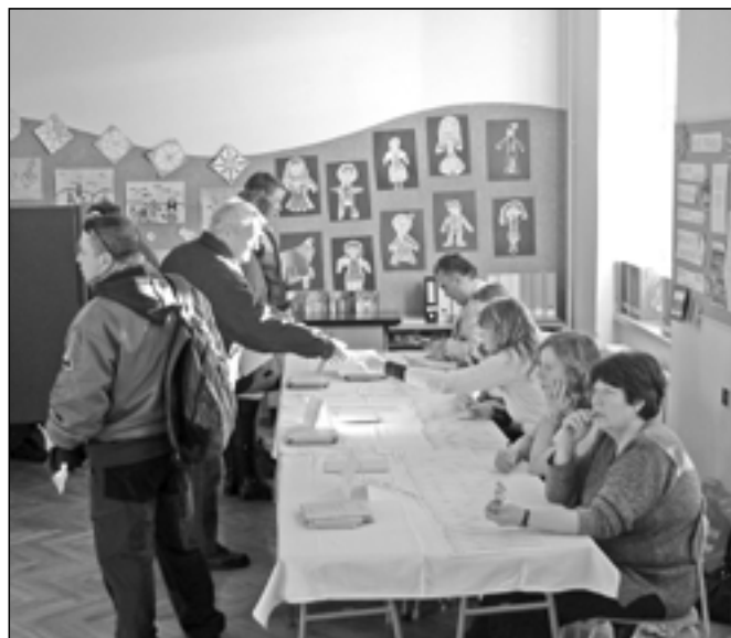
Členové volební komise č. 1 zasedli ve třídě základní školy na náměstí Hrdinů 1000. Ve volebním okrsku č. 1 zaznamenali největší počet hlasů pro Karla Schwarzenberga (57,66 %).

Jediným městem v celém Zlínském kraji, kde výrazně vyhrál Karel Schwarzenberg, byly Vizovice. Kandidát TOP 09 zde dostal 55,06 % hlasů, zatímco Miloš Zeman jen 44,93 % hlasů.