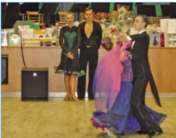
Moderní tance představlí taneční klub ROKASO.