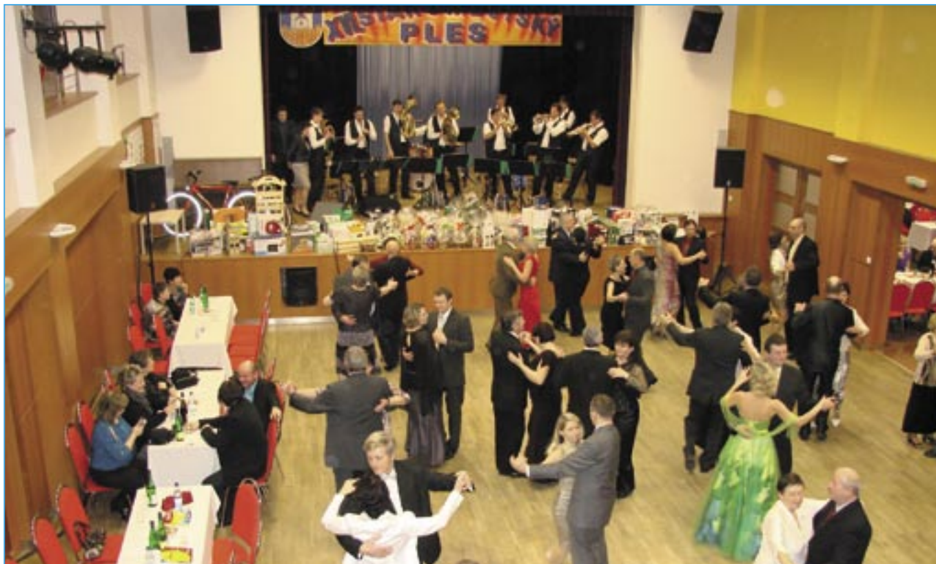
Divadelní sál se zaplnil již od prvních tónů dechové hudby Liduška, která k nám přijela z Dolních Bojanovic.