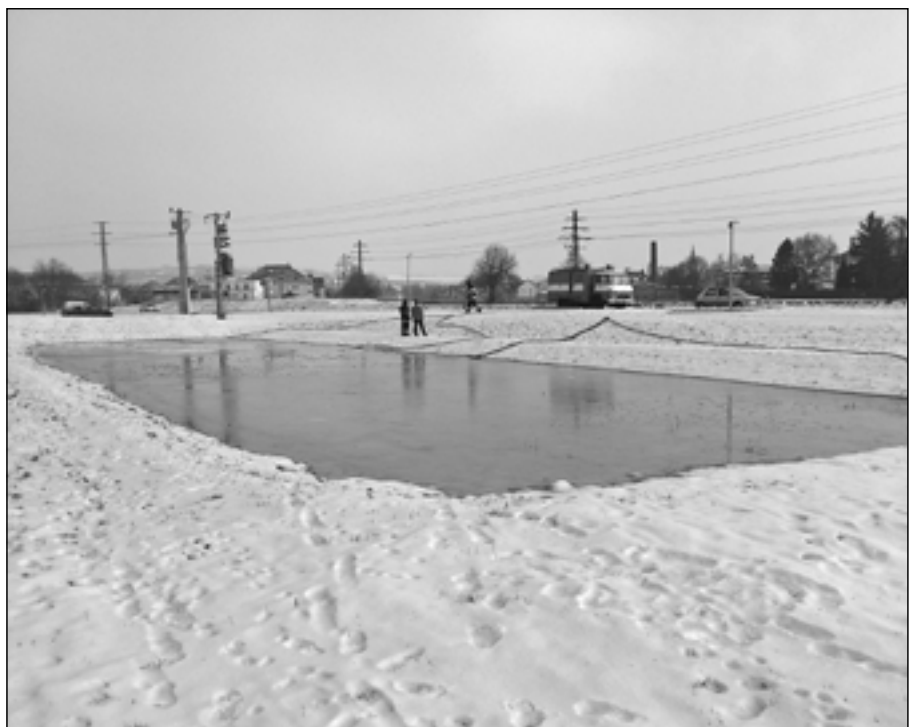
Staroměstští hasiči připravili přírodní kluziště v místě mokřadu mezi hřbitovem a nábřežní komunikací. Již od soboty 26. ledna se v těchto místech bruslilo.