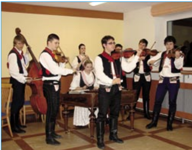
V horním sále se setkali příznivci cimbálové muziky Bálašáci.