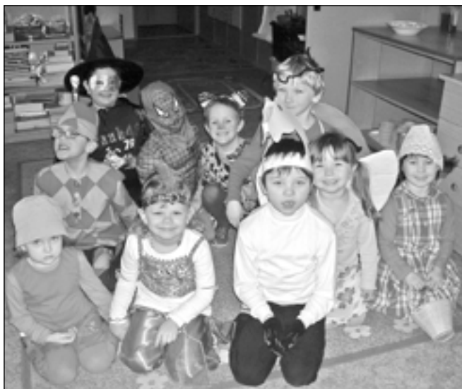
Všechny třídy ve školce se zaplnily oblíbenými postavami z pohádek.