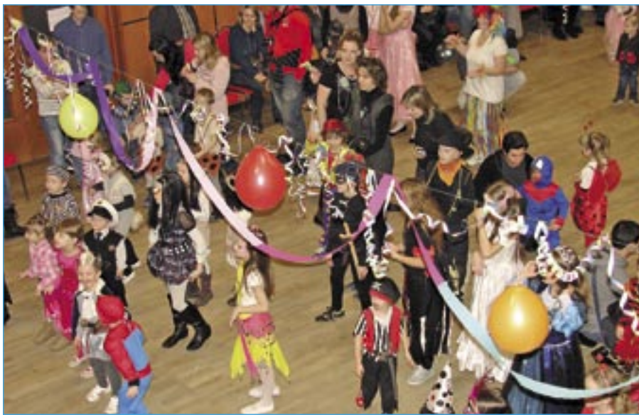
Karneval patřil dětem, které se přišly pobavit.