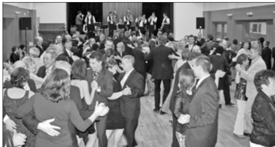
Na Staroměstském plese vládla dobrá nálada.