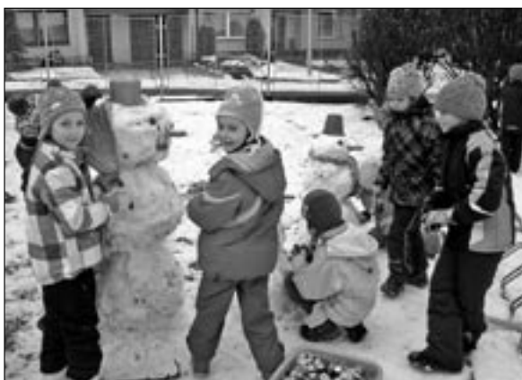
Jak jsme stavěli sněhuláky. V loňském roce jsme v naší školce sněhuláky nestavěli, tak si letos užíváme. K stavění sněhuláků je spousta říkanek a písniček. Děti jsme letos naučili tuto říkanku: Kuli, kuli, kuli, to je koule sněhová, kuli, kuli, kuli, koule už je hotová. Aj tak tak, aj tak tak, tak se staví sněhulák.