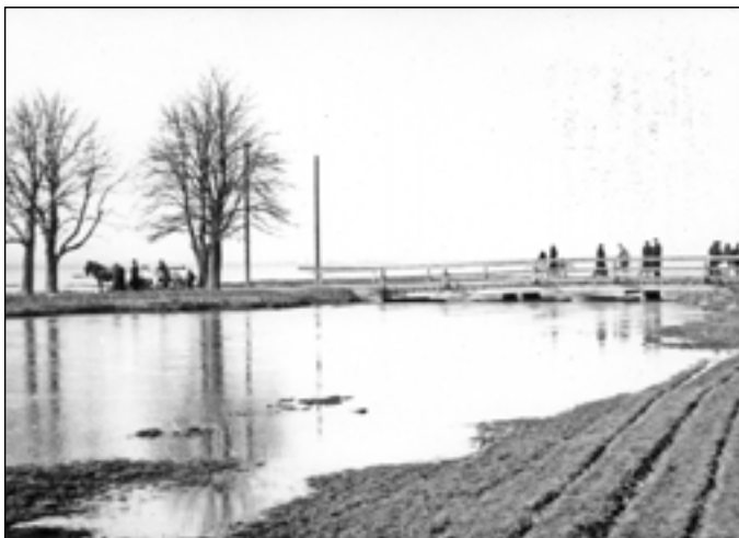
Rybárny a Staré Město spojovala silnice, která vedla přes Zervavici. V době povodní se procházelo s velkými obtížemi.