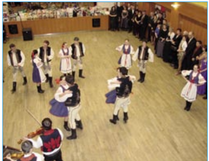
V programu vystoupili tanečníci souboru Dolina.