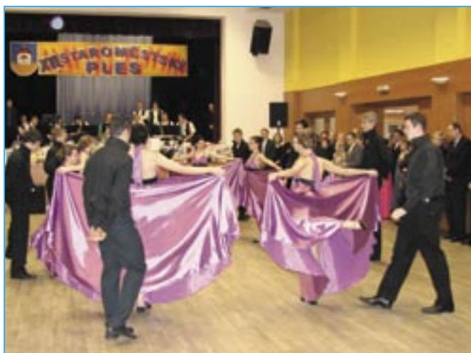
Polonézu zatančili studenti Střední odborné školy a Gymnázia Staré Město.