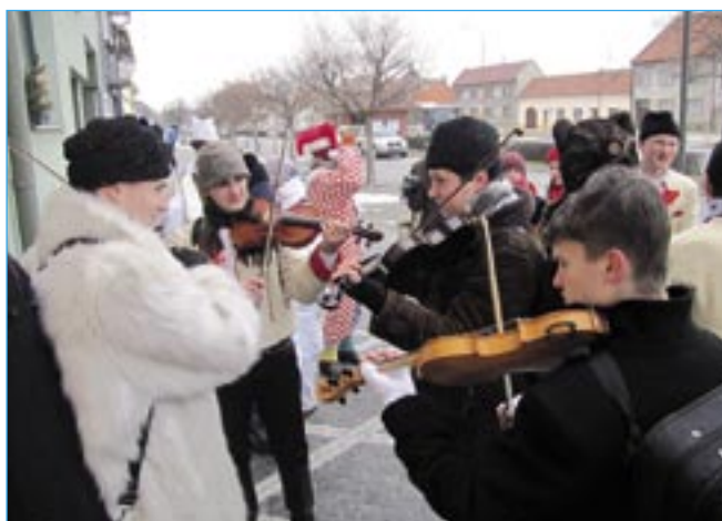
Bálešáci v akci