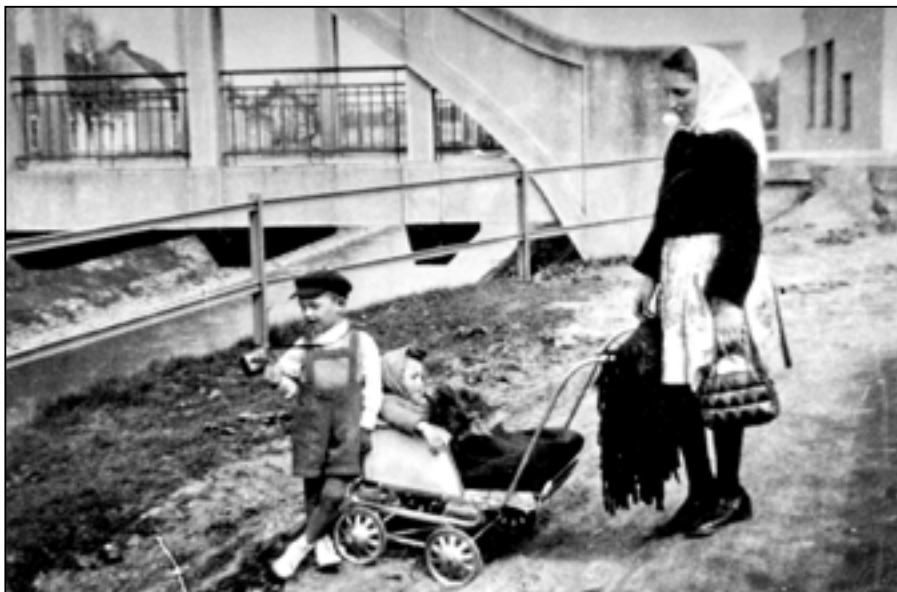
Vzpomínky na minulé léta.