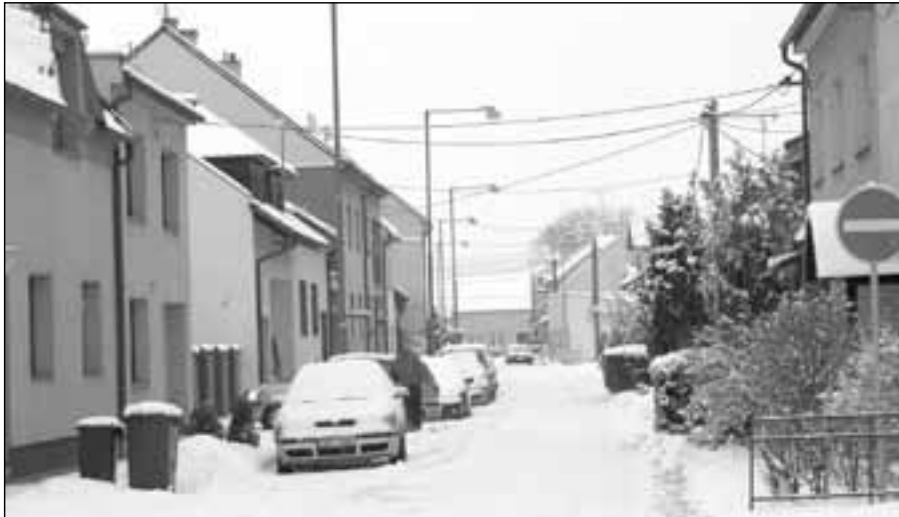
Zasněžená Klukova ulice v úterý 11. prosince 2012.