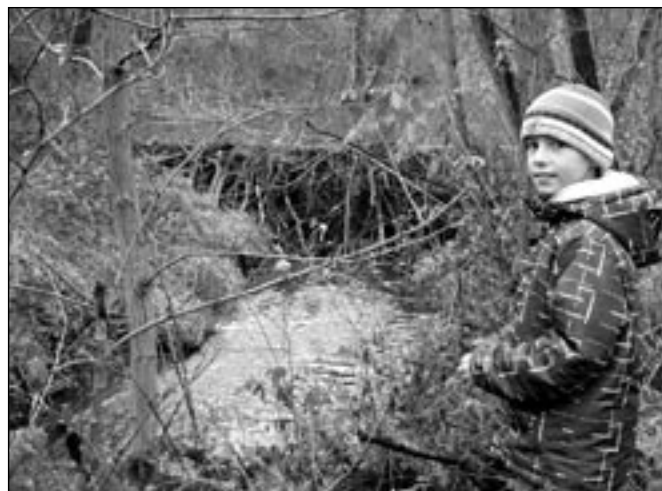
Bobří hráz na Salašce je nyní opět o něco vyšší a širší, než na snímku z 30. listopadu 2012.

vočichy. V posledních letech se bobři přemnožili, před dvaceti lety jsme je mohli spatřit u větších řek především v údolních nivách. Vyskytovali se u ramen řeky Moravy u města Litovel, postupně se bobří rodinky přesouvali dále na jih podél toku řeky Moravy až k dolnímu toku.