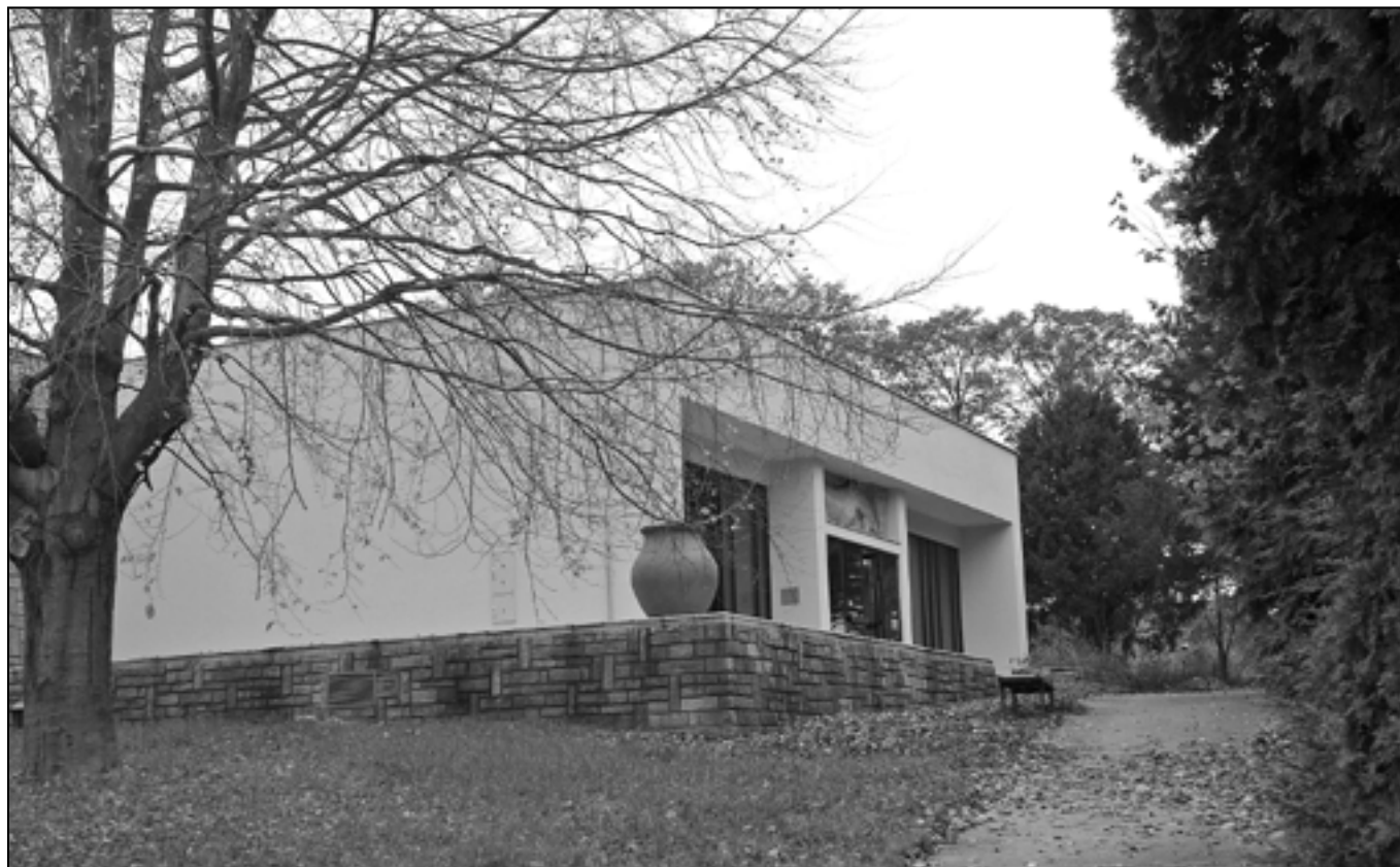
Velmi významnou a dlouho očekávanou investicí v roce 2013 bude projekt s názvem Event centrum u Památníku Velké Moravy, který by měl zajistit úpravu horního (kostelního) náměstí, to je prostor mezi novým kostelem Svatého Ducha a Památníkem Velké Moravy.