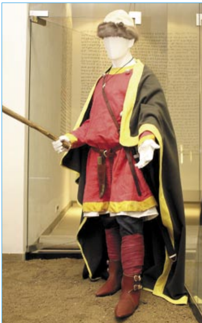
Kníže Mojslav, imaginární průvodce expozic v Památníku Velké Moravy.

kde je mezi námi skutečně a reálně stále přítomný jejich významný odkaz. Oni budovali věci mnohdy desetiletí s přesvědčením a vizí do budoucna, aby se vše jednou projevilo v životě jejich vnuků a pravnuků. To pak přinášelo své jedinečné plody v životě a rozvoji našeho města. Važme si lidí, kteří chtějí něčím přispět k dobru nás všech. A to nejen v roce, kdy si připomínáme 1.150 výročí příchodu bratří sv. Cyrila a Metoděje k nám na Moravu.