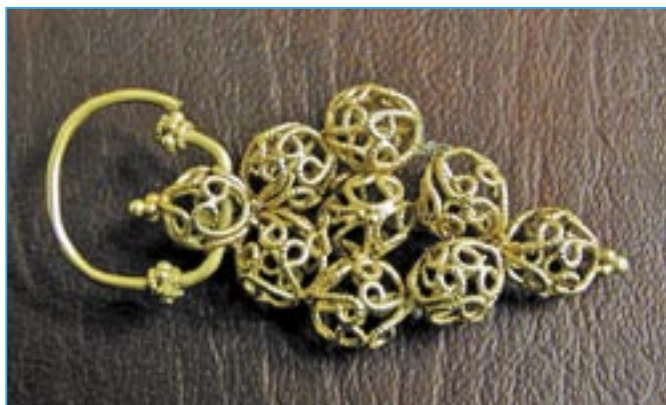
Velkomoravská náušnice nalezená ve Starém Městě.