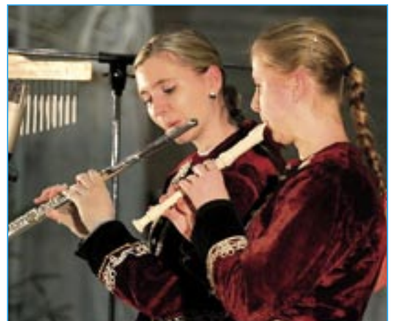
Flétnistky z cimbálové muziky Friška.