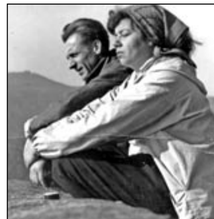
S manželkou Boženou ve Vysokých Tatrách. Rosůlkovi jsou spolu neuvěřitelných 65 let!