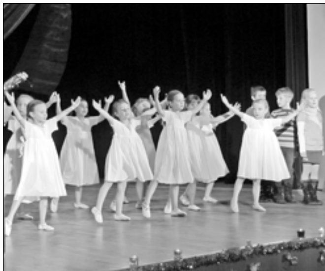
Děti z přípravné hudební výchovy na prknech, která znamenají svět.