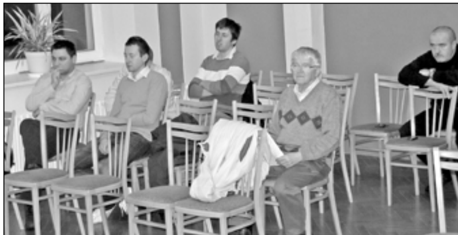
Občané sledují zasedání zastupitelstva města.