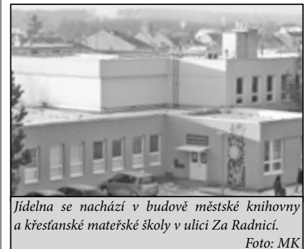
Jídelna se nachází v budově městské knihovny a křesťanské mateřské školy v ulici Za Radnici.

KOMPLETNÍ ZAJIŠTĚNÍ SLUŽEB BEZ STRESU!!!