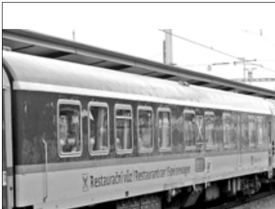
Ve většině vlaků kategorie EuroCity jsou řazeny restaurační vozy.

Nákladní přeprava na trati Přerov – Břeclav oproti minulosti značně poklesla,