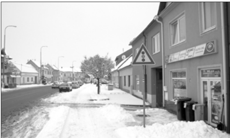
První vydatná sněhová nadílka přišla do našeho města ve dnech 9. - 11. prosince 2012. Většina chodníků a komunikací byla včas ošetřena. Na snímku Velkomoravská ulice 11. prosince 2012.

5.2 schválit rozpočtové opatření č. 04/2012