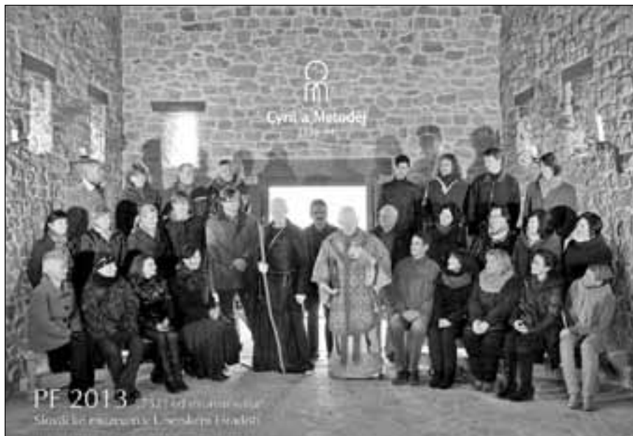
Zajímavou novoročenku nám do redakce zaslali pracovníci Slovákého muzea v Uherském Hradišti. Jsou na ní vyfotografováni společně se slovanskými věrozvěsty Cyriilem a Metodějem, jejichž 1.150 výročí příchodu na Velkou Moravu si letos připomínáme.