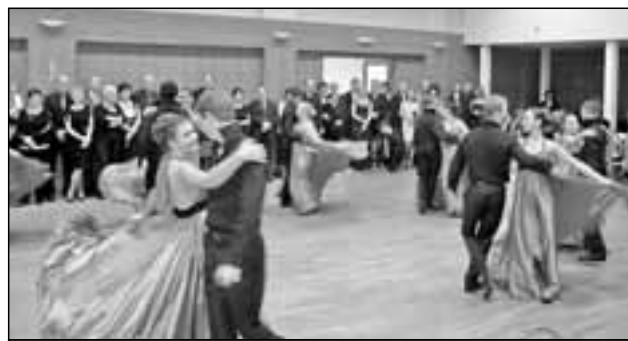
Studenti Střední odborné školy a Gymnázia tančí polonézu na Staroměstském plese v roce 2012.