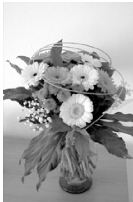
Naším seniorkám posíláme krásnou kytičku, která nikdy neuvadne.