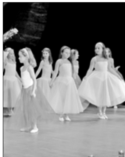
Děvčata 2. ročníku tanečního oboru ve skladbě Princezny na bále.