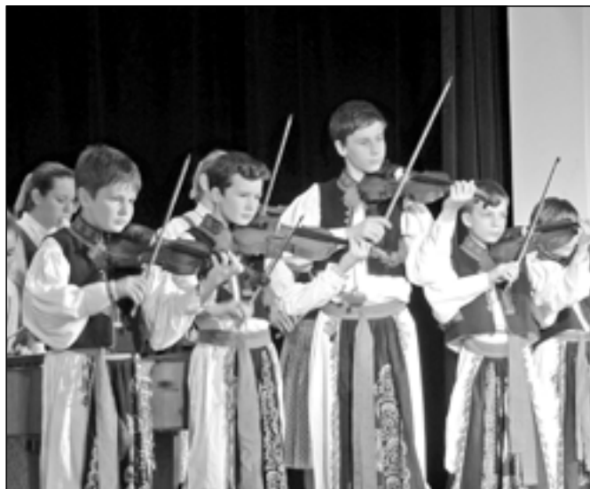
Cimbálová muzika základní umělecké školy.