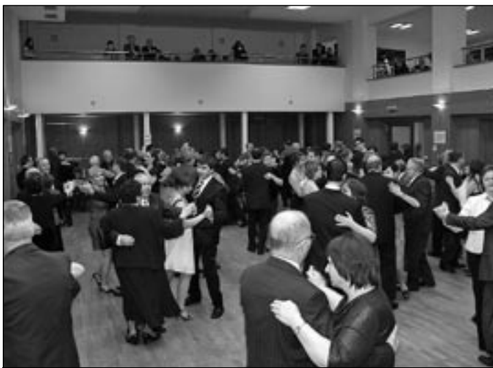
Taneční parket se zcela zaplnil krátce po zahájení plesu.