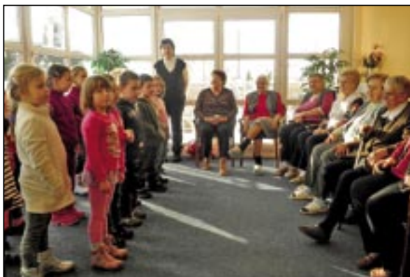
Veselá vánoční píseňka pro obyvatele DPS v ulici Bratří Mrštíků.