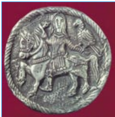
Sokolník je stříbrný terčák s vyobrazením jezdce se sokolem. Byl objevený v lokalitě Špitálky.

Naši předkové nám za nemalých osobních obětí zanechali dědictví a vystavěli zde místo,