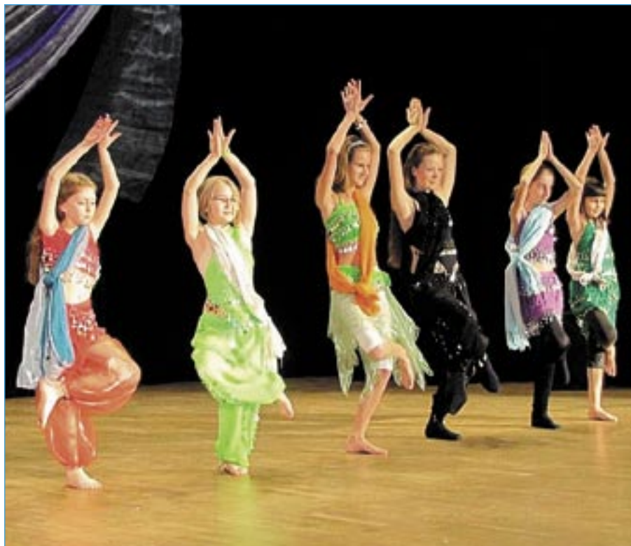
Nejmladší tanečnice na pódiu.