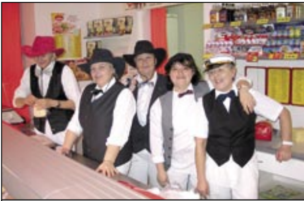
S úsměvem jde všechno líp!