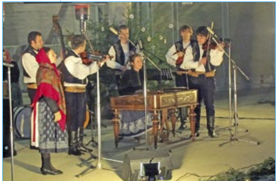
Cimbálová muzika Májek z Brna.