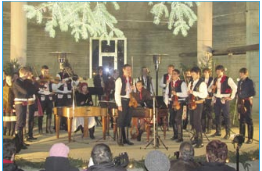
Společný závěr CM Bálašáci, CM Friška a CM Májek.