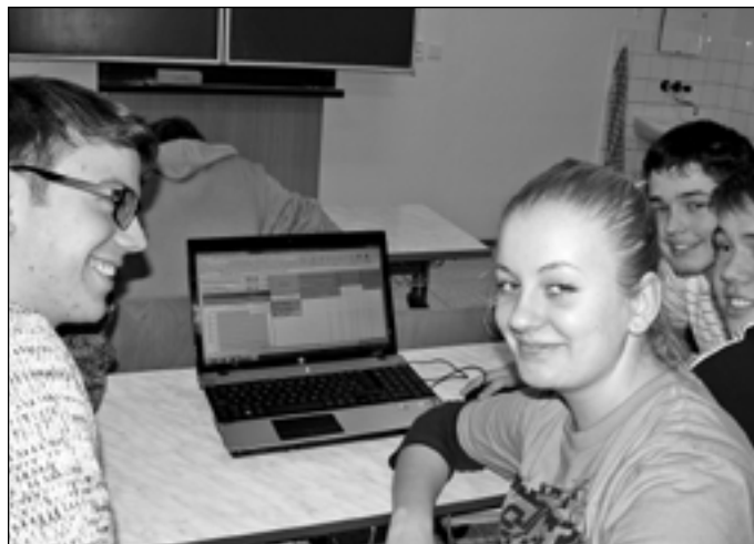
Studenti z SOŠ a Gymnázia Staré Město si studium na své škole vesměs pochvalují.