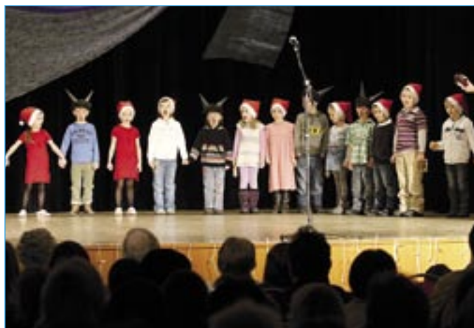
Chlapci a děvčata z křesťanské mateřské školy předvedli pásmo od Mikuláše do Vánoc.