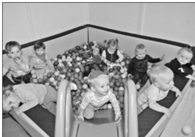
Děti si hrají v Rodinném centru Čtyřlístek.