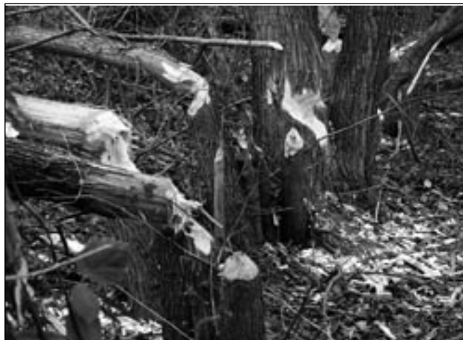
Pokácené stromy v sousedství potoka Salaška.

Hubit bobry však není povoleno, patří mezi zvláště chráněné ži-