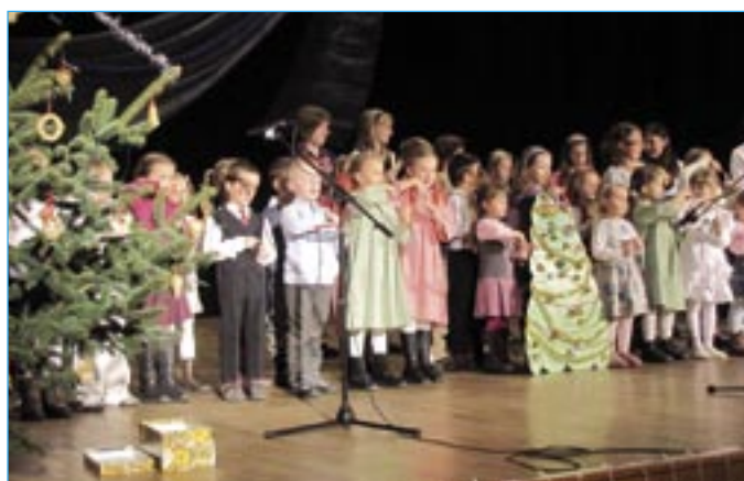
Děti z Orla si nacvičily vystoupení s názvem U stromečku.