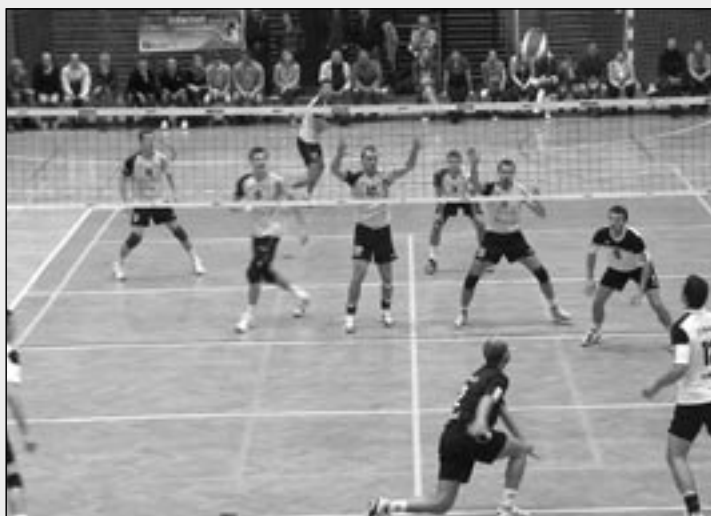
Přijďte povzbudit staroměstské volejbalisty do Městské sportovní haly na Širůchu.

22. kolo 16. březen v 17 hod. Staré Město – Zlín