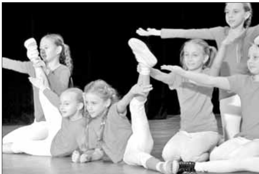
Vánoční koncert se uskutečnil 17. prosince za velkého zájmu diváků. Po skončení tance následoval dlouhý potlesk.