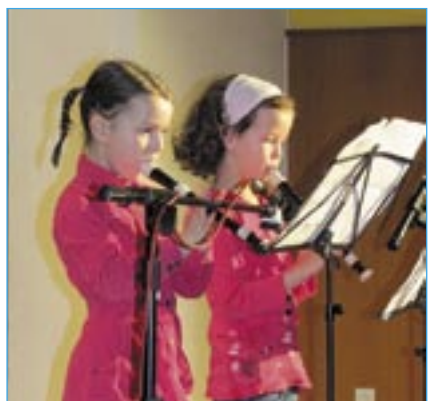
Dívky zahrály na flétny.