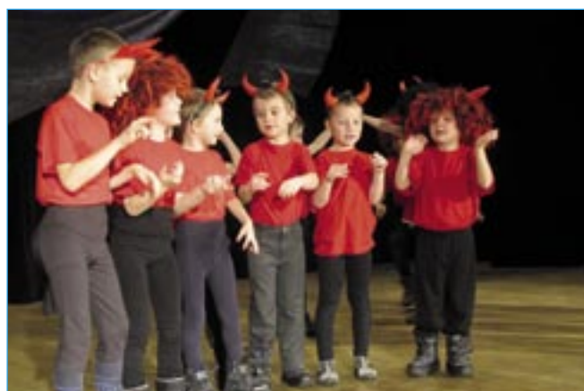
Čertíci z MŠ Rastislavova.