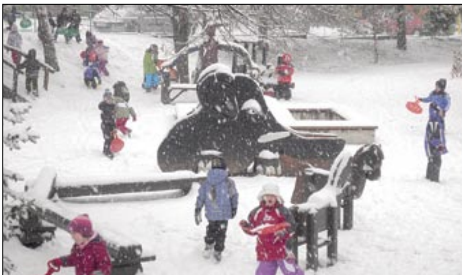
Zimní pohádka v zahradě MŠ Komenského.