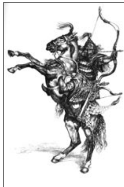
Attila, přezdívaný Bič Boží, nejmocnější král hunské říše.