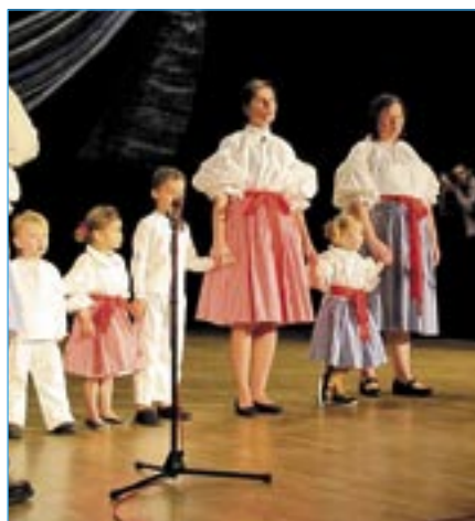
Maminky s dětmi si připravily pěkné pásmo.