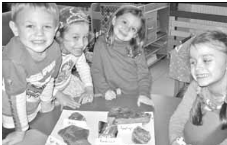
Děti ze třídy „Kofátek“ Mateřské školy Rastislavova se celý týden věnovaly projektu s názvem Minerál.