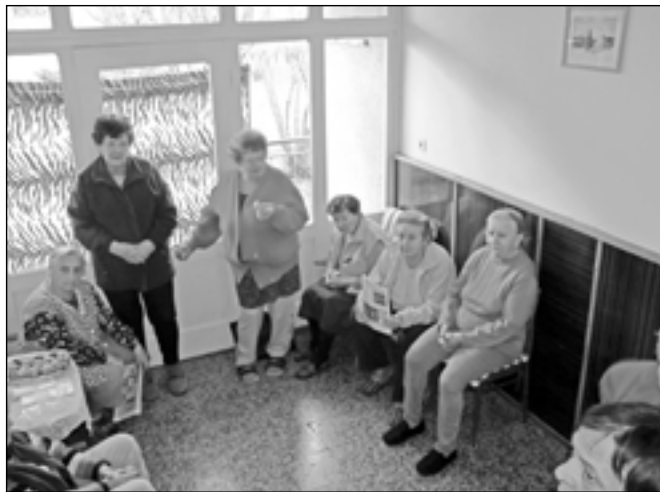
Obyvatelky Domu s pečovatelskou službou na Velehradské ulici diskutují se starostou města.