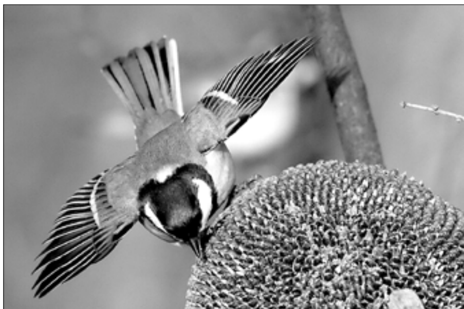
Sýkora koňadra si pochutnává na semínkách slunečnice.