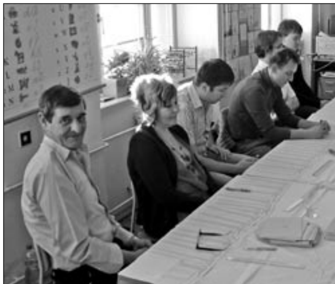
Členové volební komise č. 4 zasedli v jedné třídě základní školy na náměstí Hrdinů 1000. Ve volebním okrsku č. 4 zaznamenali nejvyšší volební účast ve Starém Městě, která činila 69,01 %.

Ve Starém Městě bylo zapsáno ve volebním seznamu celkem 5574 voličů. Volební účast byla 64,32 %. Odevzdaných bylo 3562 platných hlasů (99,41%). Z těchto čísel vyplývá, že prezidentských voleb ve Starém Městě se nezúčastnilo 2012 oprávněných voličů, případně se k volbám dostavili, ale jejich hlas byl neplatný. Výsledky voleb ve Starém Městě jsou téměř totožné s výsledky za celou Českou republiku. Pouze Zuzana Roithová si vyměnila místo v celkovém pořadí s Vladimírem Franzem. Také vítězství Miloše Zemana je u staroměstských voličů výraznější, než je republikový výsledek prvního kola voleb.