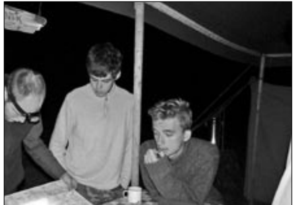
Skauti prožili čtrnáct dní v táboře na Držkové.

A jak probíhala naše družba s hochy ze Vsetína? Úplně bezproblémově! Naši kluci by se od nich mohli hodně co naučit, co se týká třeba zručnosti s náradím nebo přístupu k nočním hlídkám. Ale na všem se dá zapracovat a do dalšího tábora je času dost.