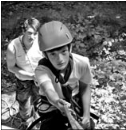
Zdokonalili jsme se v mnoha dovednostech.

Tento rok jsme se rozhodli, že tábor pojmem jako návrat ke kořenům skautingu. Tak jako ho dělal v Anglii zakladatel skautingu lord Baden-Powell nebo u nás A. B. Svojsík. Co k tomu patřilo?