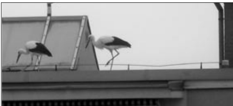
Mladí čapí na střeše domu na Kopánkách.