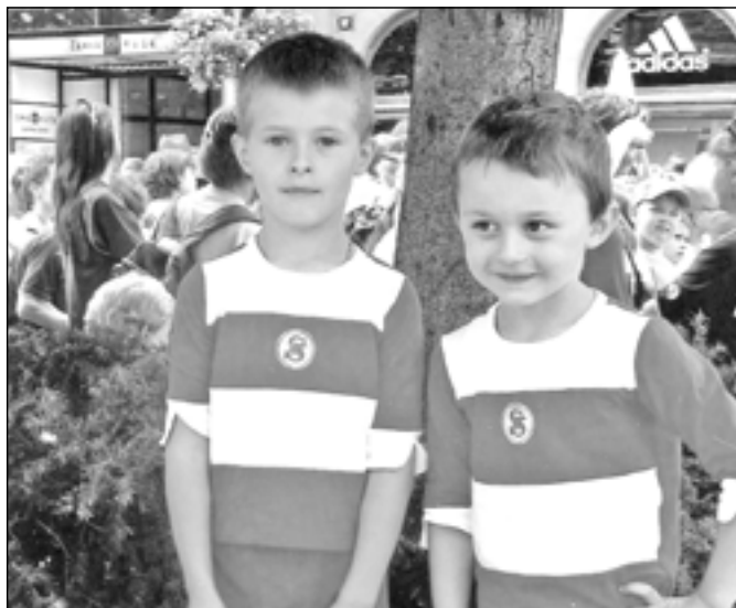
I nejmladší sokolové si slet pěkně užívali.