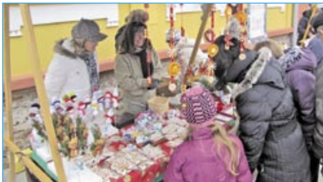
Prodejní stánek staroměstské školní družiny byl středem zájmu příchozích.

sledovali zajímavá kulturní vystoupení, další si něco nakoupili nebo ochutnali zabíjačkové speciality. Bylo to sice krátké, ale i v mnohém přínosné nedělní dopoledne. Lidé by zkrátka měli více chodit do společnosti, držet při sobě a pomáhat si v nesnázích.