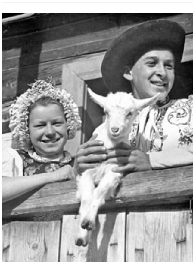
Kožkař také prováděl porážku kozlat, koz a ovcí.

Dalším řemeslem, na které rád vzpomínám, byl kolář . Ve Starém Městě byl jedním z mistrů kolářských strýček