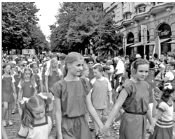
Před sletovým průvodem v centru Prahy 1. července 2012.