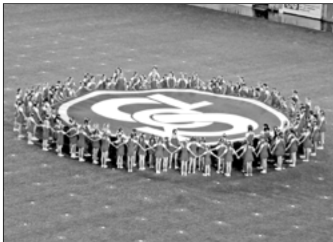
Zahájení XV. všesokolského sletu.