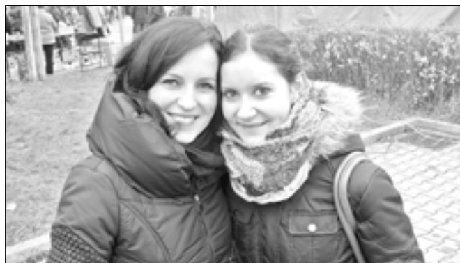
Ve Starém Městě žijí nejen remcalové, ale i mnoho mladých lidí, kteří jsou s životem ve městě spokojeni. Příkladem mohou být i mladé dámy na snímku, které jsme potkali na vánočním jarmarku.