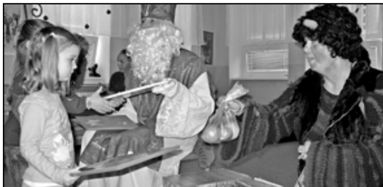
Herci Slovákého divadla se převlékli do kostýmů a vypravili se za dětmi do MŠ Rastislavova.