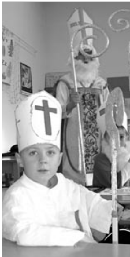
Mikulášům to velmi slušelo.