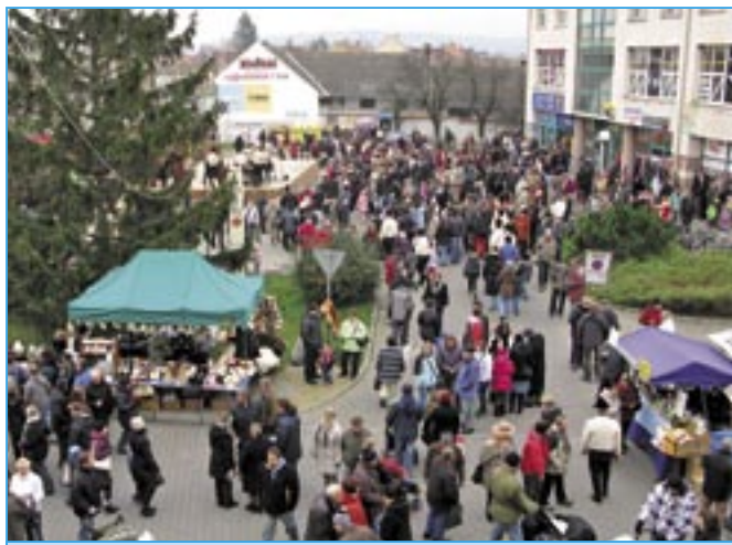
Během první prosincové neděle přišlo na jarmark u radnice více než 1000 lidí.

V nedělní dopoledne 2. prosince se opět po roce uskutčnil na prostranství u radnice vánoční jarmark. Po přivítání občanů starostou Josefem Bazalou byl rozsvícen urostlý vánoční strom. Na sousedním pódiu začal asi dvouhodinový kulturní program, v sále na radnici byla po 11 hodině sehrána pohádka Kašpárek a čert. Středisko volného času Klubko se představilo pěkným adventním pásmem, v městské knihovně byly pro všechny zájemce připraveny tvořivé dílničky. Někdo se přišel jen tak podívat a setkat se s přáteli, druhý přivedl děti a společně