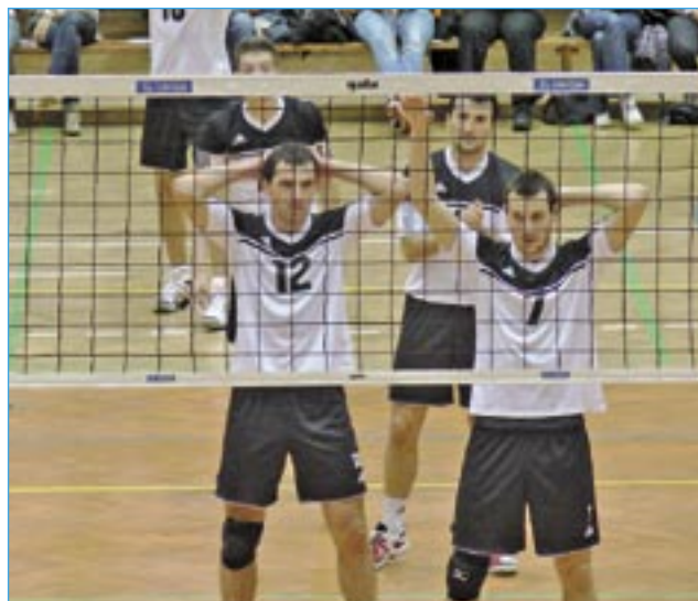
Domácí tým v prvním extraligovém utkání s volejbalisty ČZU Praha v sobotu 27. října.

Můžeme se těšit od začátku příštího roku na nějaké změny v klubu?