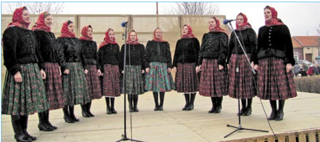
Dívčí sbor Repetilky při pěkném vystoupení.