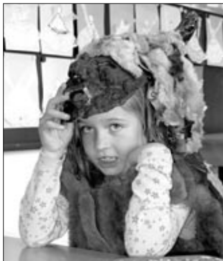
Pod maskou čerta se skrývala milá tvář.