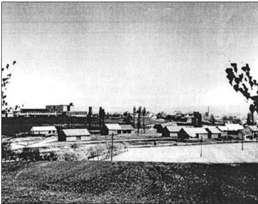
Takto kdysi vypadalo prostranství na Širůchu, kde stály stodoly.