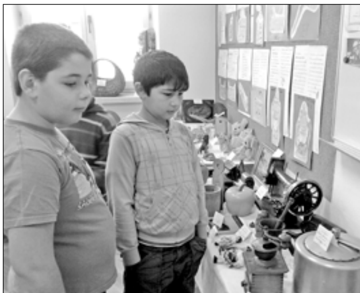
Děti si prohlédly výstavku historických předmětů denní potřeby.

Odpořď na tuto otázku jsme hledali s dětmi 3. tříd nejen v hodině prvouky, ale i doma rozhovorem s rodiči nebo návštěvou prarodičů.