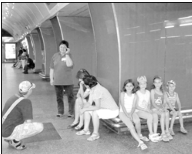
Oblíbené cesty metrem.