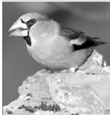
Dlask tustozobý - ptačí krasavec.