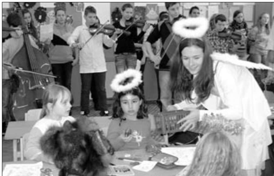
Ve škole vládla úžasná atmosféra.