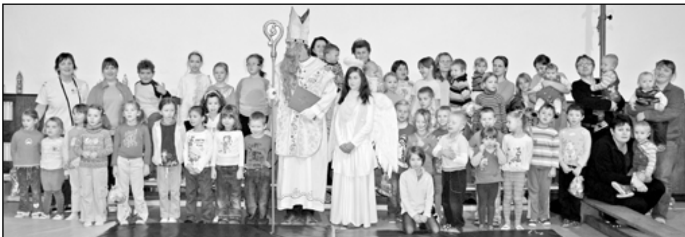
Všichni jsme na závěr pořídili společnou fotografii.