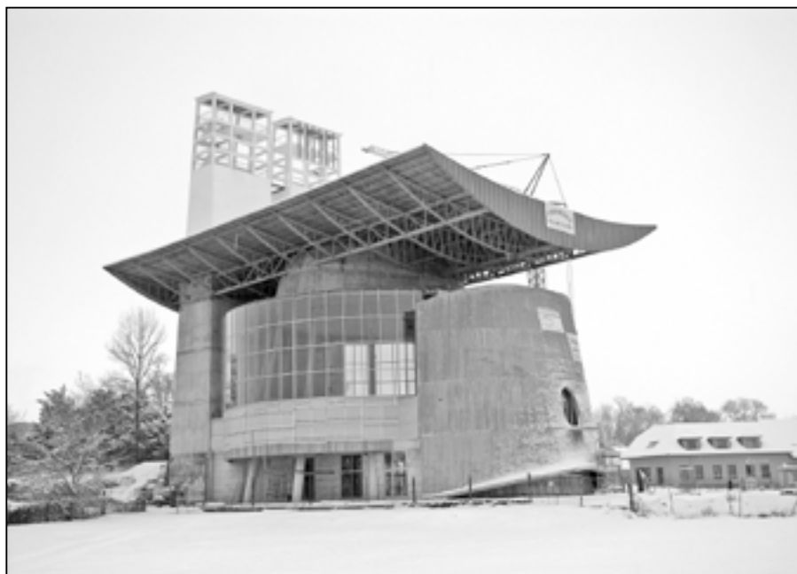
Jste srdečně zváni k návštěvě kostela Svatého Ducha, kde se v pátek 28. prosince v 18:30 hod. uskuteční jedinečný koncert. Uspořádá ho pro vás cimbálová muzika Bálašáci.

Je čestnou povinností poděkovat všem podporovatelům stavby nového staroměstského kostela: našemu městu za dlouhodobé dotace a celkovou přízeň a podporu, Nadaci Děti-kultura-sport, sponzorům, kteří nechtějí, aby jejich dobrá vůle byla zveřejňována, větším i drobnějším dárcům, kteří své korunky vhazují do kasiček při veřejné sbírce po městě, či do košíků při bohoslužbě v kostele. Bez dobré vůle a spoluúčasti všech těchto příznivců bychom nebyli schopni tuto výjimečnou stavbu uskutečnit.