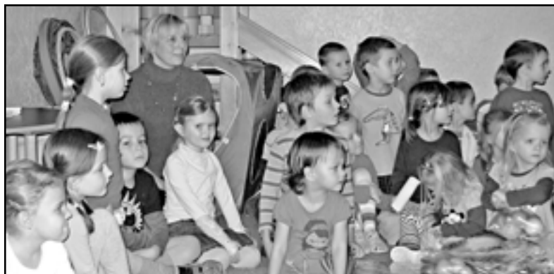
A co děti? Nestačily se divit...