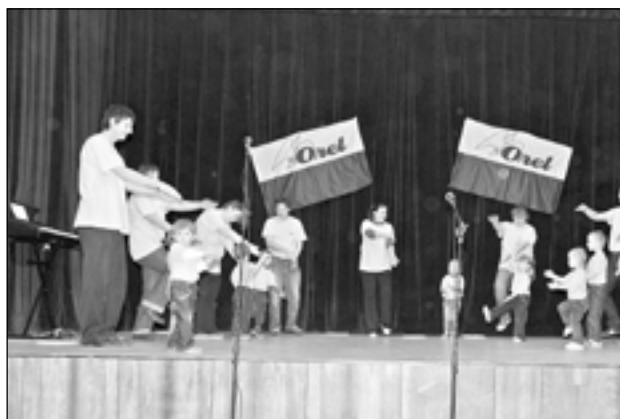
Rodiče s dětmi při cvičení.