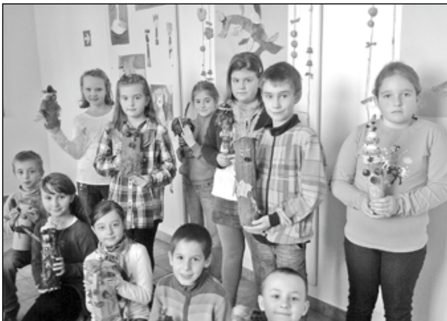
Děti ze třetích tříd Základní školy Staré Město vytvořily nádherné podzimní skřítky.