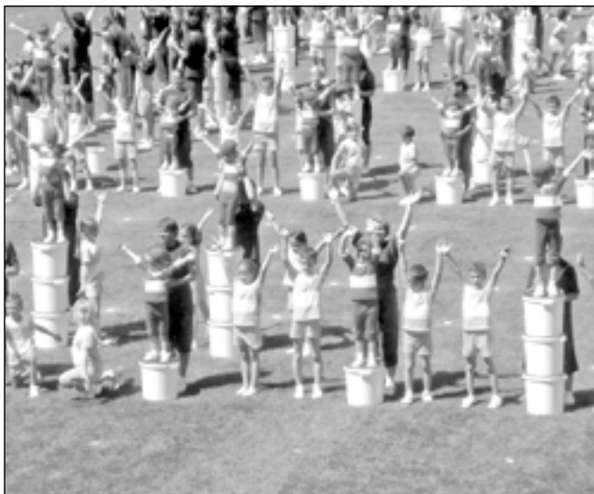
Skladba pro rodiče a děti Ať žijí duchové .