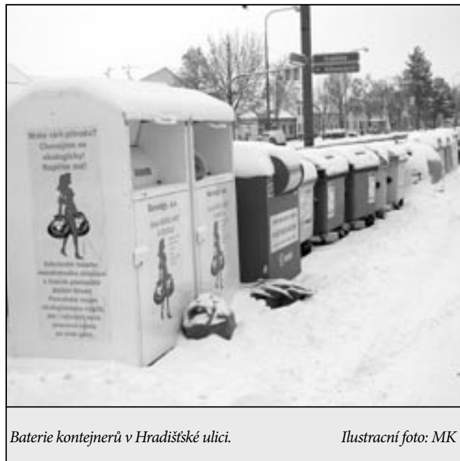
Baterie kontejnerů v Hradištské ulici.