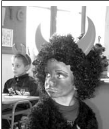
Čertům samozřejmě také.