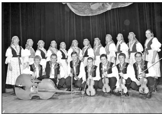
Cimbálová muzika Bálašáci na společné fotografii s Repetilkami.