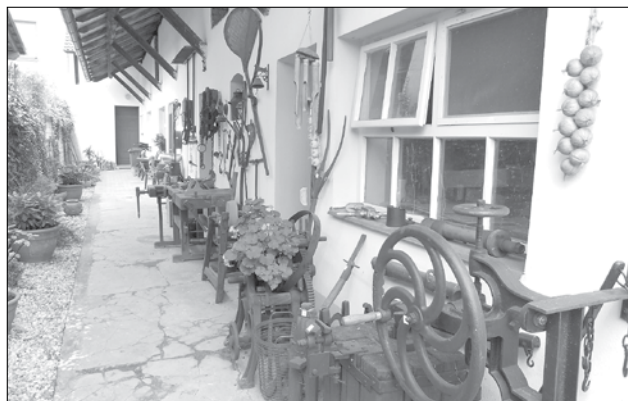
Přijďte si prohlédnout exponáty drobného nářadí do knihovny ve Starém Městě.