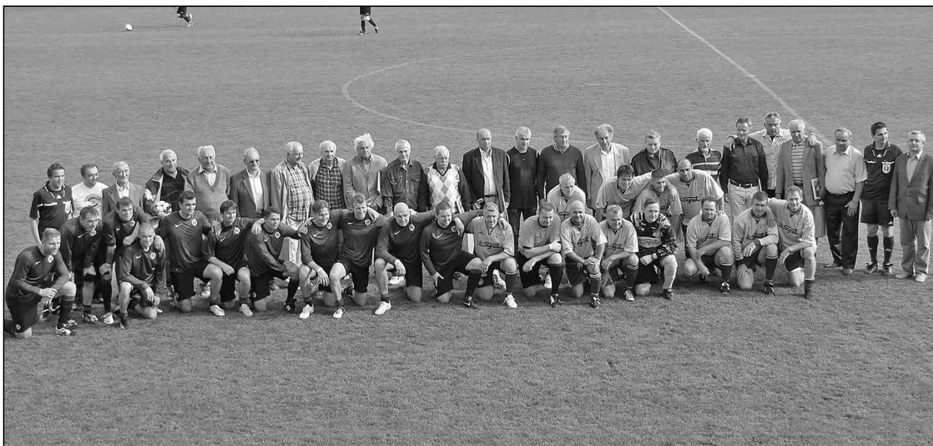
Fotbalisté Sparty Praha a TJ Jiskra/Synot Staré Město na společné fotografii s oceněnými fotbalisty a funkcionáři.