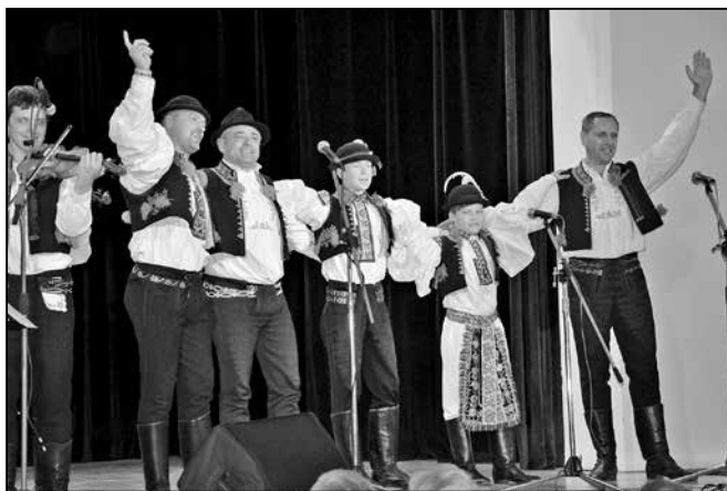
Společné vystoupení mladé a starší generace zpěváků a tanečníků.