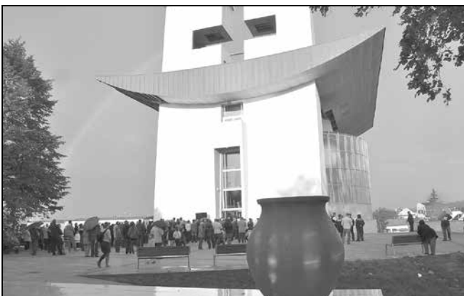
V kostele bylo přítomno asi 650 věřících, další lidé stáli před kostelem. V průběhu žehnání chrámu se na obloze objevila duha.