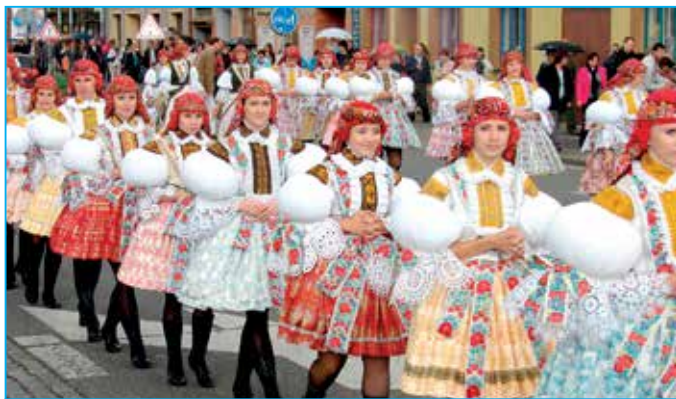
Staroměstské děvčice v plné parádě.