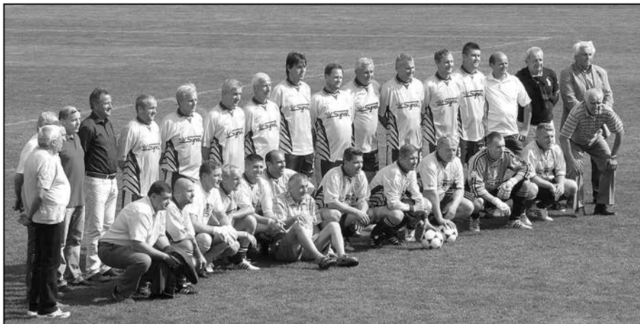
Fotbalisté TJ Jiskra/Synot Staré Město před začátkem utkání.