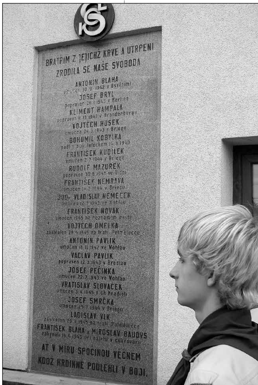
Umučeným a padlým sokolům byla na budově sokolovny odhalena pamětní deska. Devatenáct jmen, devatenáct osudů.

Na počest synů, kteří jejich cestou kráčeli k smrti jako za nevěstou za to, že chtěli zabít mnohohlavou saň! Na jejich počest. Prapore pozor! K poctě zbraň!