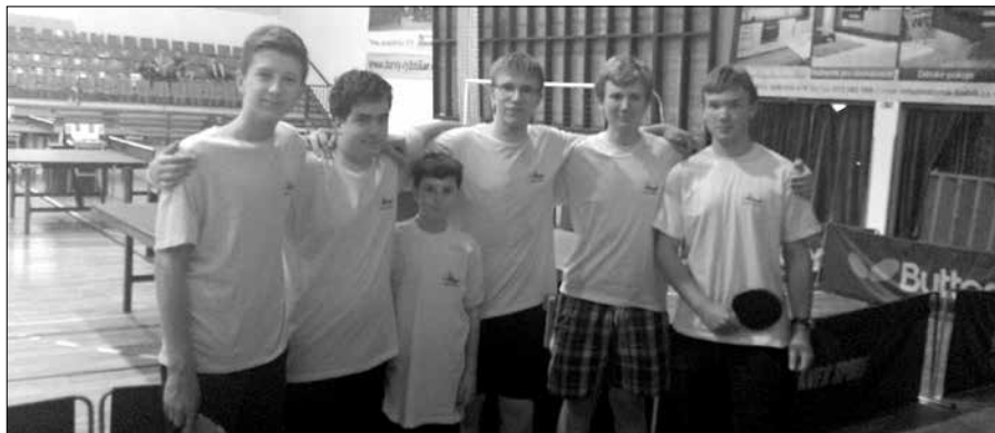
Úspěšní účastníci turnaje ve stolním tenisu.

Turnaj začal promluvou zdejšího duchovního otce, která pojednávala o tom, abychom se nehonili jen za vítězstvím, ale hráli přátelsky a čestně. Promluva byla zakončena společnou modlitbou Otčenáše.