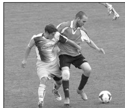
Jiskra Staré Město nastoupila proti Ořechovu v mistrovském utkání 1. B třídy a zvítězila 3:0.

Od 15:30 hodin bylo sehráno mistrovské utkání 1. B třídy, kde Jiskra Staré Město nastoupila proti Ořechovu. V prvním poločase se hrálo vyrovnané utkání, ale nepadl žádný gól. Teprve v druhé půli utkání se Jiskra osmělila. Následovaly góly Karla Doseděla, Zelinky a Pavla Vlčka, které zajistily