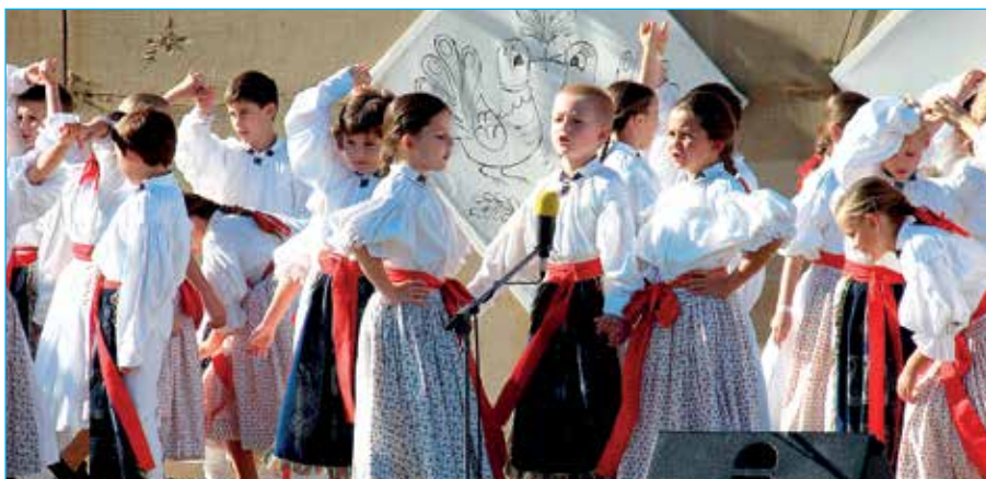
Děti z Dolinečky byly ozdobou nedělního vystoupení.