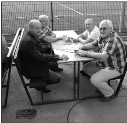
Než hráči nastoupili na zelený pažit, fandové důsledně rozebrali sestavy obou týmů.