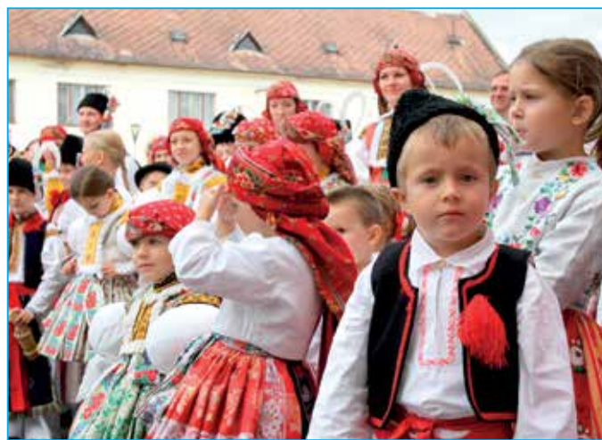
Děti z Dolinečky.