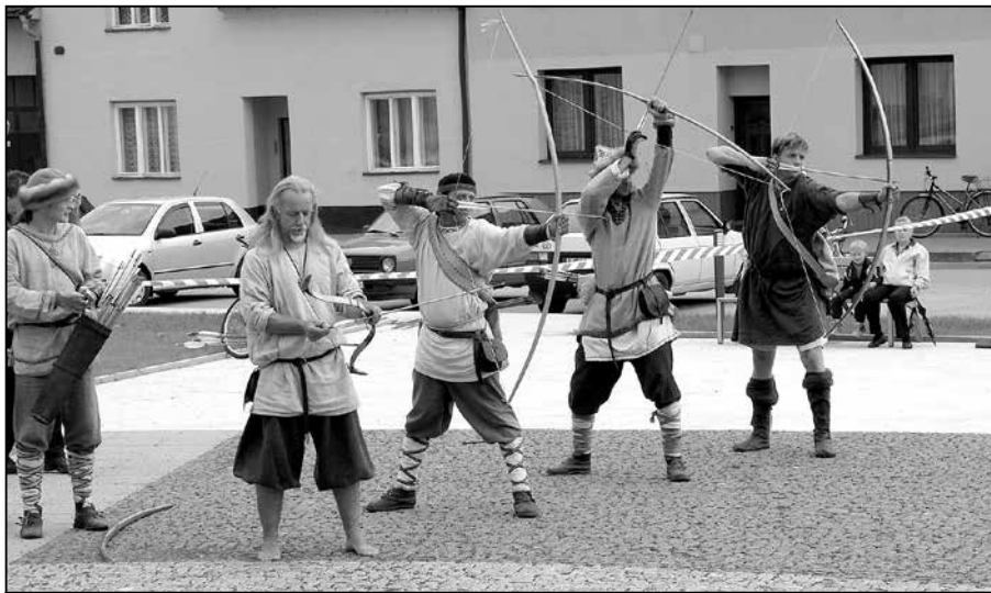
Na přehlídce Procházka středověkem, která se uskutečnila na náměstí Velké Moravy 23. srpna, návštěvníci viděli lukostřelce ze skupiny historického šermu Morrigan ze Starého Města a také členy výjimečného uskupení střelců ze silných luků Česko - Slovenské Warbow Society.