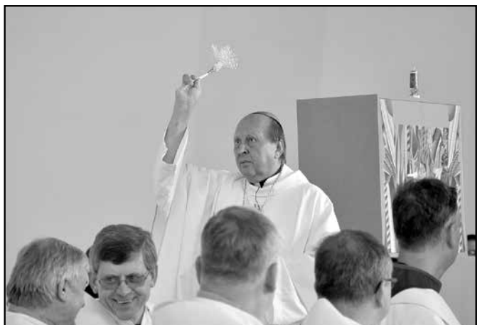
Kostel Svatého Ducha požehnal Mons. Pavel Posád, světící biskup českobudějovický.