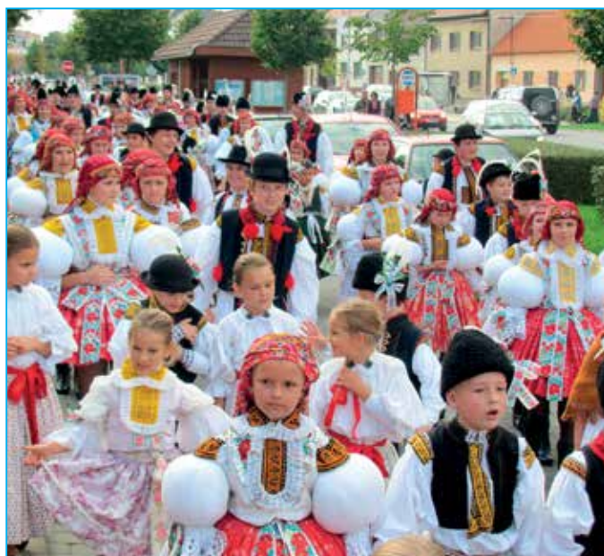
Děti z Dolinečky v hodovém průvodu.