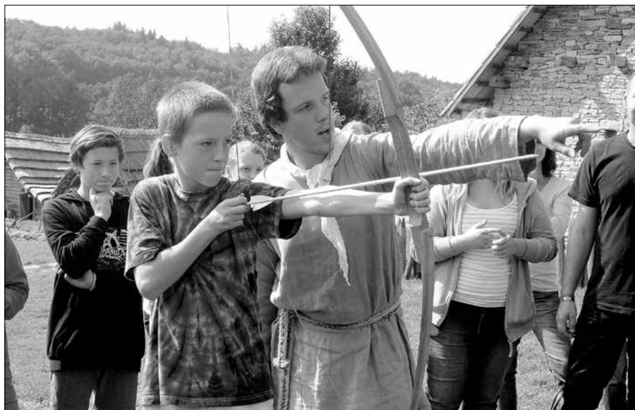
V rámci akce Týden pro školy byl pro žáky 7. tříd připraven pestrý program v archeoskanzenu.