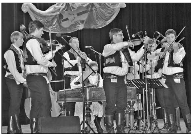
Hrají a zpívají Bálašáci.