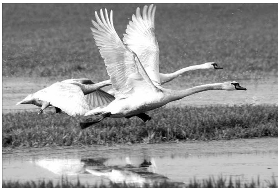
Sněhobílé labutě s dlouhými krky již brzy přistanou na vodách řeky Moravy a vodních plochách v okolí.