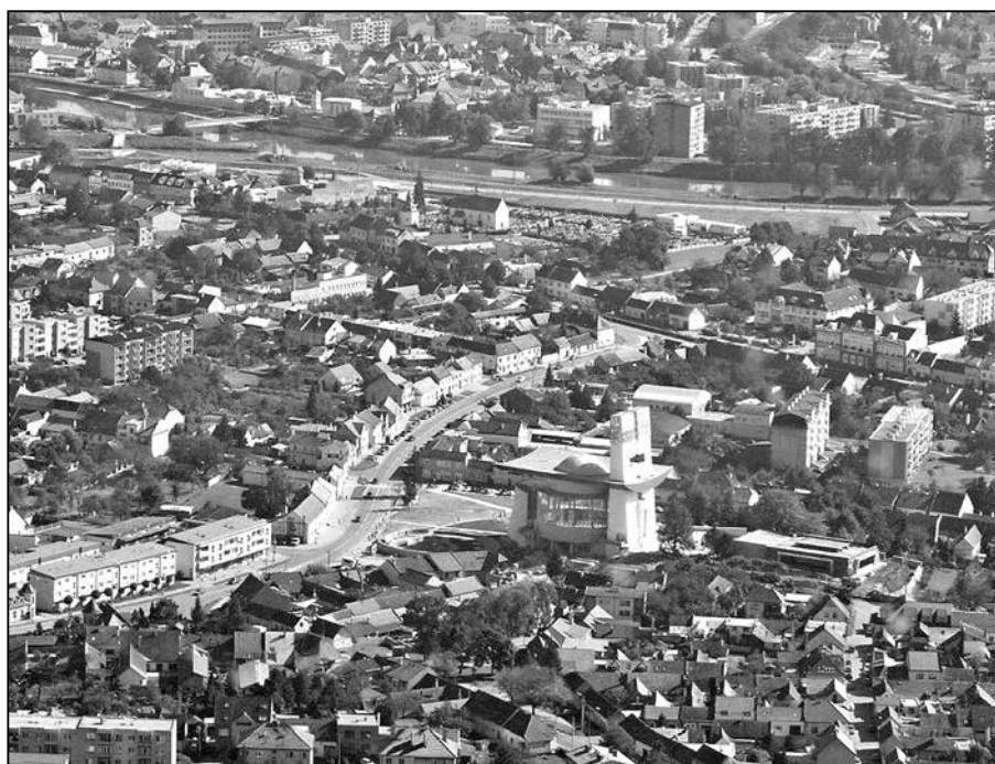
Letecký snímek Starého Města.

V sobotu 15. listopadu a 13. prosince 2014.