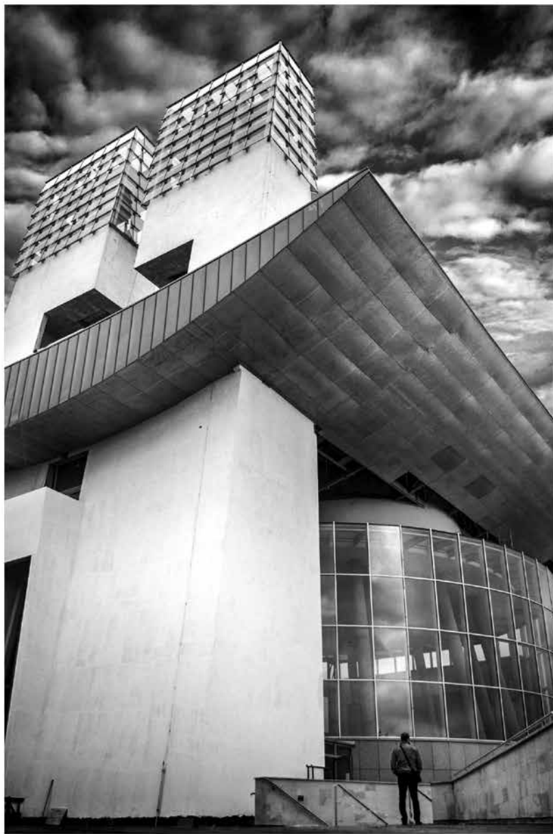
Zajímavý pohled na kostel Svatého Ducha ve směru od Památníku Velké Moravy. Střecha kostela je ve tvaru čtvrtkruhového oblouku připomínající baldachýn a symbolizující lehkost – vznášení. Ze strany od památníku se nachází vchod. Dvě věže jsou mírně skloněné směrem k vlastní stavbě, představují dva slovanské věrozvěsty – sv. Cyrila a Metoděje. Věže jsou uprostřed propojeny křížem, jehož tvar vychází z nálezů při archeologickém výzkumu této lokality. Projekt navrhl Ing. architekt Ivo Goropevšek ze Slovinska.