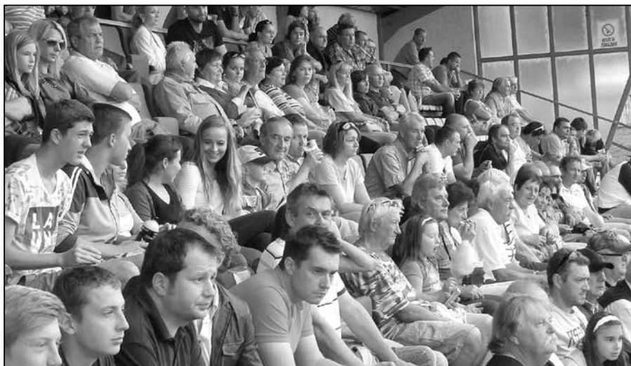
Diváci zaplnili tribunu na Širůchu.