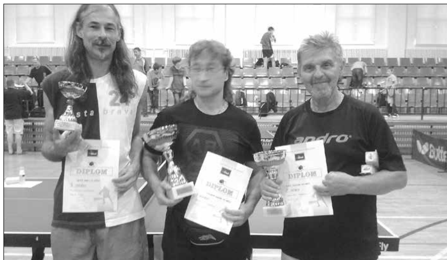
Muži ze Starého Města obsadili celé stupně vítězů.