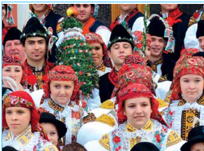
Část účastníků na společné hodové fotografii.