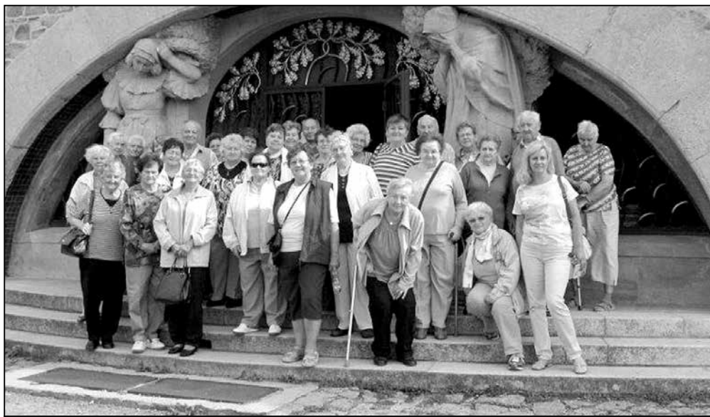
Důchodci ze Starého Města se společně vyfotografovali před Památníkem Mohyla míru.