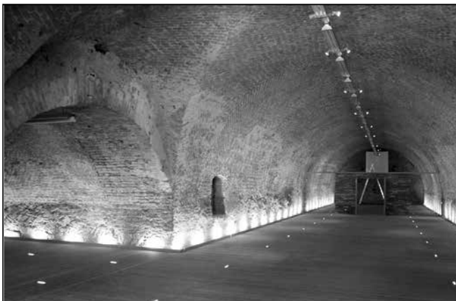
Jezuitský sklep se nachází v suterénu pod kostelem Svatého Ducha. Na snímku vnitřní prostory jezuitského sklepa krátce před dokončením v srpnu 2014.

6.3 „Zastavovací studii v areálu Školního hospodářství s. r. o. ve Starém Městě“ zpracovanou firmou GG Archico, Uh. Hradiště.