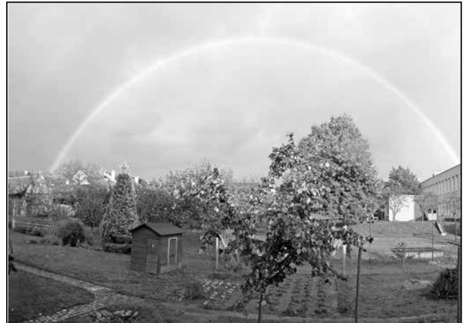
Při žehnání nového kostela Svatého Ducha v neděli 5. října ozdobila oblohu nad Starým Městem krásná duha.

1.6 s umístěním energetického zařízení a zřízením úplatného věcného břemene ve prospěch společnosti E. ON Distribuce, a. s. se sídlem České Budějovice, F. A. Gerstnera 2151/6, IČ 28085400, zastoupené společností E.ON Česká republika, s. r. o., se sídlem České Budějovice, F. A. Gerstnera 2151/6, IČ 25733591, na právo umístění stavby „St. Město, Velehradská, kab. NN“, umístění kabelu NN (kabel NN 140 m), na pozemcích p. č. 6053/310, 4538/15, 4538/14, 4538/13, 4538/17, 4538/12, 4538/3, 6046/13, 6046/251,