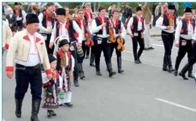
Šohaji a šohajičci.