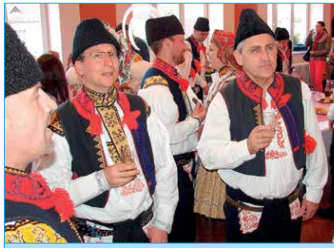
Doliňáci při pohoštění na radnici.