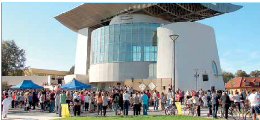
Hodové odpoledne se poprvé konalo na náměstí Velké Moravy. Bylo krásné počasí, přišlo více než 900 lidí.