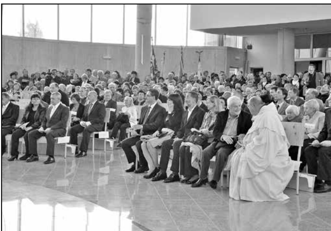
Účastníci slavnostního žehnání zcela zaplnili kostel Svatého Ducha.