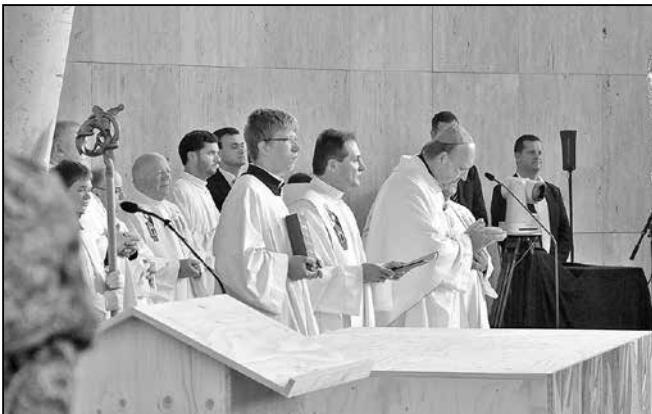
Světitel biskup českobudějovický Mons. Pavel Posád (na snímku vpravo) a duchovní otec staroměstské farnosti P. Miroslav Suchomel při bohoslužbě.