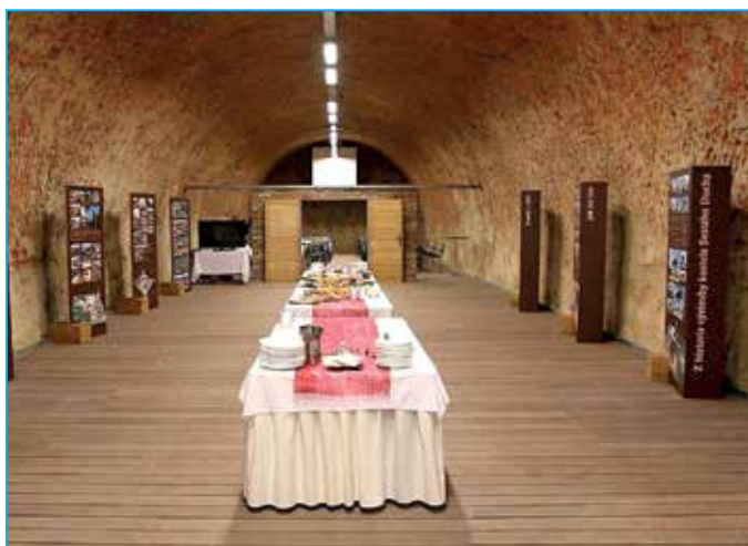
V jezuitském sklepe byla k vidění výstava o historii výstavby náměstí.