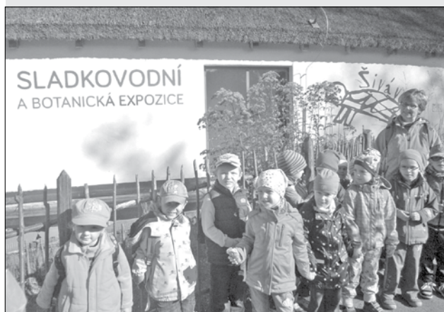
Děti si prohlédly expozici Živá voda na Modré.