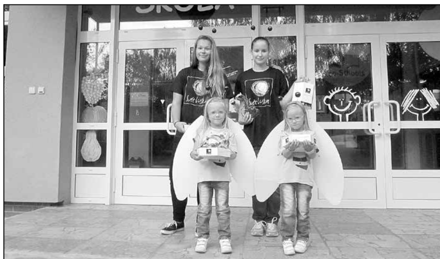
Světlušky navštívily základní školu.