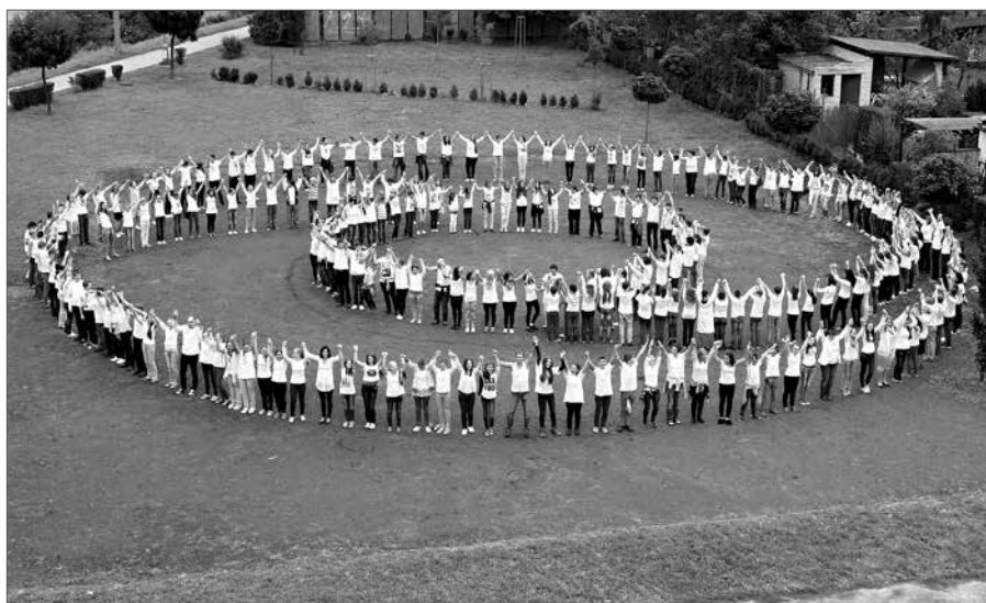
Žáci Základní školy Staré Město se zapojili do celorepublikové akce Měsíc za mír a nenásilí.

Žáci a učitelé II. stupně školy se zapojili do celorepublikové akce Měsíc za mír a nenásilí, jejímž cílem je prevence násilí v sobě, svém nejbližším okolí i ve světě.