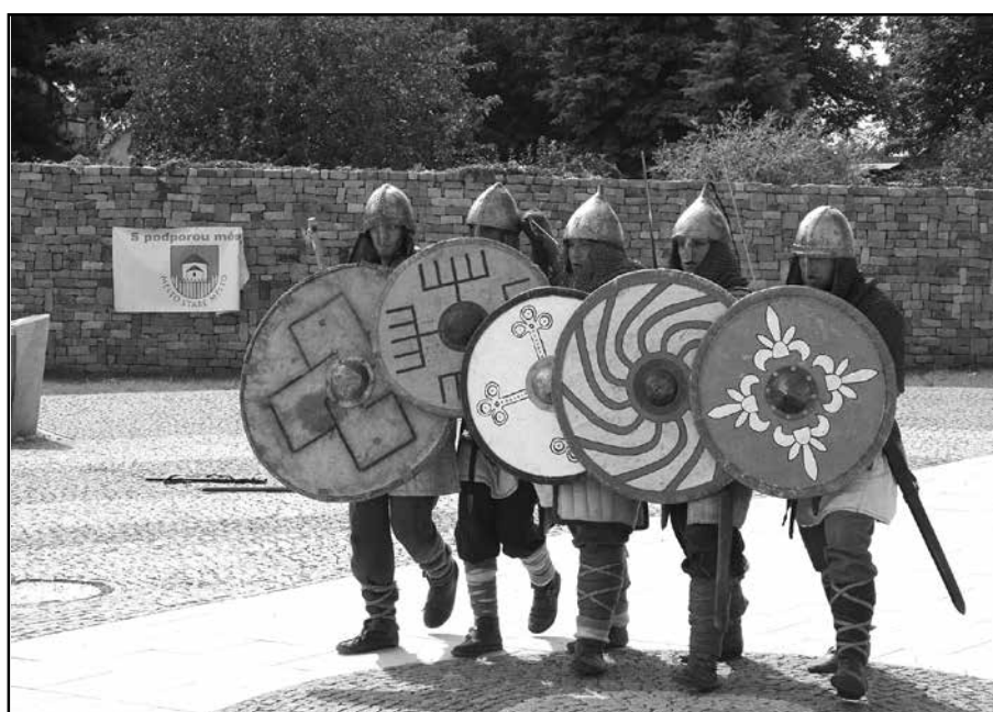
Na náměstí Velké Moravy se uskutečnilo již několik společenských, kulturních a sportovních akcí. Na snímku bojovníci, kteří se zúčastnili Středověkého odpoledne v sobotu 23. srpna 2014.