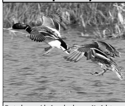
Pestrobarevný kačer s kachnou při přeletu nad vodním tokem.