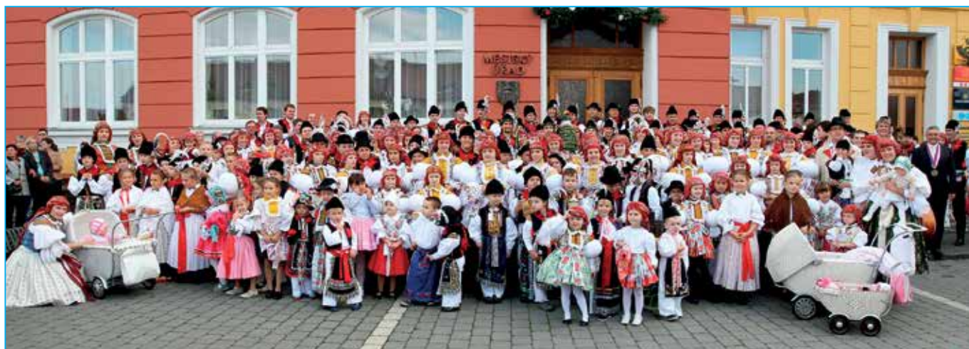
Michalské hody nemají v širokém okolí konkurenci v počtu krojovaných účastníků. Svědčí o tom i letošní účast 237 dětí, mládeže a dospělých v kroji. Většinu z nich jsme vyfotografovali před radnicí v sobotu 27. září.