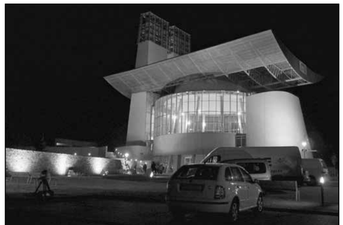
Osvětlený kostel v neděli 5. října v průběhu bohoslužby.