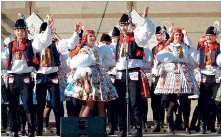
Soubor Dolina při vystoupení na náměstí Velké Moravy.