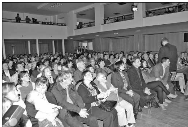
Divadelní sál společensko - kulturního centra se zaplnil do posledního místa.