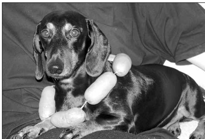
Jezevčík je pes, který se nerad nechá ovládat. Povely důsledně vyhodnocuje a plní jen ty, které uzná za vhodné a jsou pro něj výhodné. A když se zasekne, nekoupíte si jeho poslušnost ani náhrdelníkem ze špekáčků.

Musíme si uvědomit, že chyba není v psovi. Pes nám nedělá žádné naschvály, nechce nás naštvat, jen využívá každé situace ve svůj prospěch. Honit se za jiným psem a pak se porvat, skákat na lidi, až mávají rukama a křičí, pronásledovat cyklistu, řvát za plotem, nebo pádit po stopě v lese, to jsou pro psa úžasné adrenalinové zážitky, odměna, kterou si rád dopřeje. Jsou zábavné a pes si při nich hezky vybije přemíru energie. Co místo nich nabízí pániček? Pomalou procházku každý den stejnou, zákazy a napominání. Fuj, nesmíš, místo, k noze, komu by se to líbilo? Omezovací a nepochopitelné povely, cukání za obojek, táhnutí na vodítku, občas i něco drsnějšího. Je snad jasné, čemu