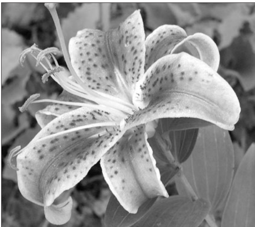
Nádherný květ lilie pro všechny staroměstské Marušky. Díky kráse a eleganci květů se lilie stala erbovním symbolem králů. Lilie je také pradávným symbolem plodnosti, naděje a budoucnosti. Prostřední okvětní lístek představuje střílku kompasu a znamená schopnost jít přímo a neobcházet překážky.