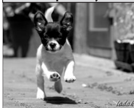
Už jste ji potkali? Jmenuje se Majda a má se čile k světu.