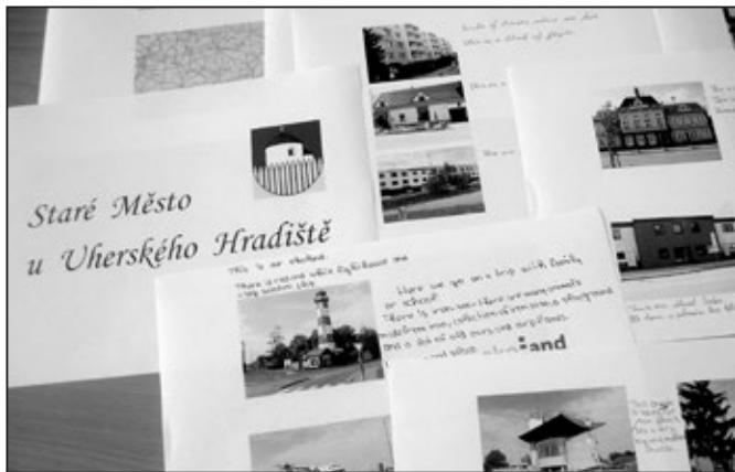
Naši školu a město jsme zpracovali formou knihy.