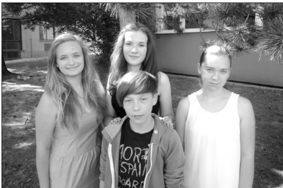
Žáci Základní školy Staré Město v soutěži zazářili a skvěle reprezentovali naše město.