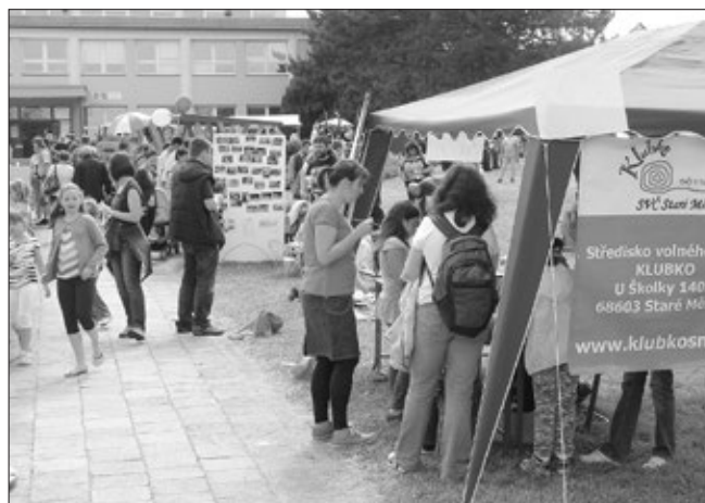
Stánek Střediska volného času - Klubko na Staroměstském dnu v areálu SOŠ a Gymnázia Staré Město.