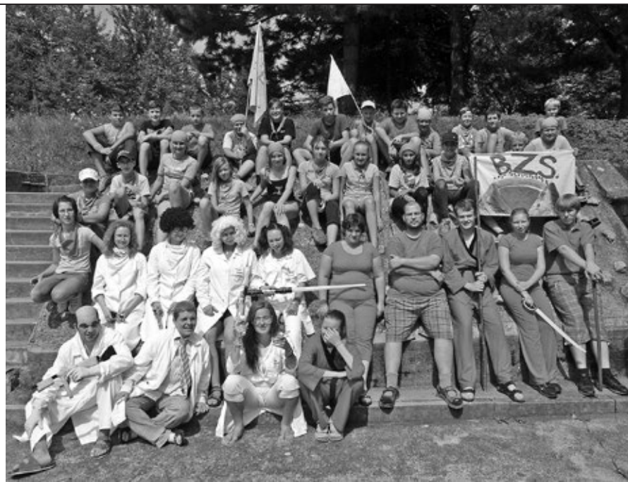
Společná fotografie účastníků tábora.