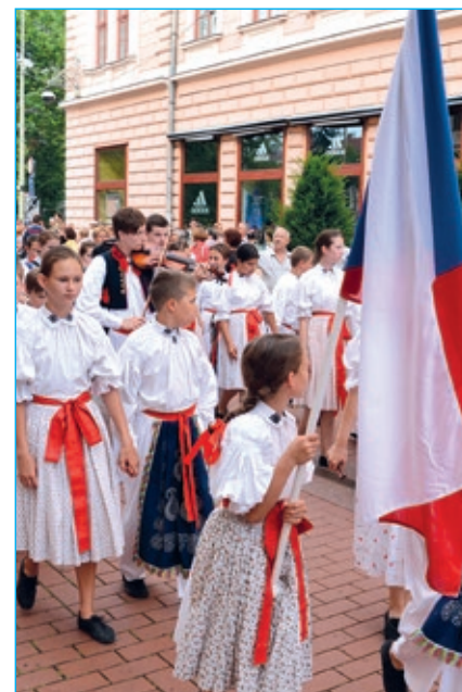
Dolinečka v průvodu v Segedínu.

Ve čtvrtek nás čekal perný den. Přesunutá vystoupení na náměstí a velký