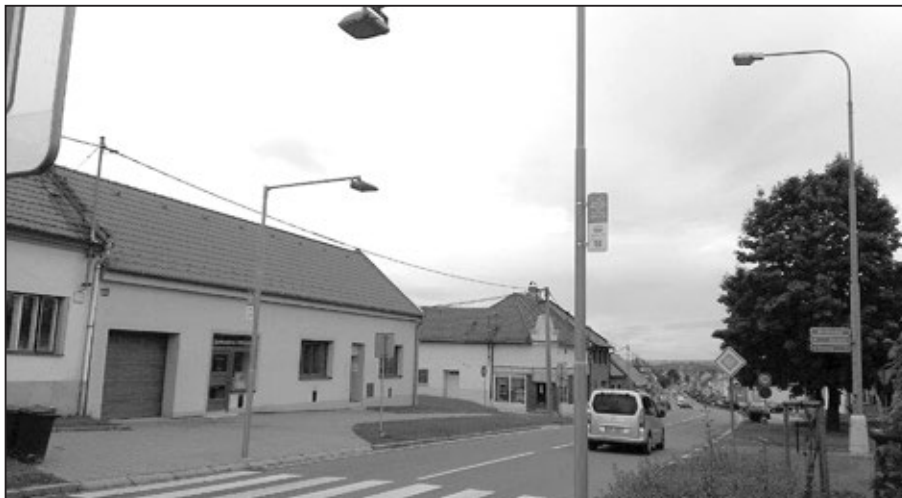
Nově osvětlený přechod pro chodce na Brněnské ulici.