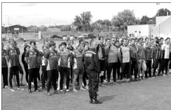
Nástup 14 týmů mužů a šesti družstev žen na hřišti Rybníček.