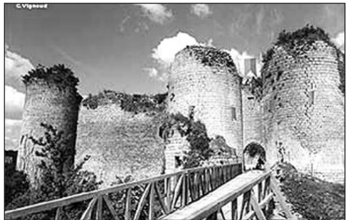
Hrad v Gençay.