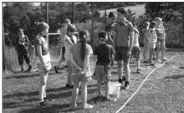
Děti z tábora Lovci záhad na Ječmínku v Osvětimanech.