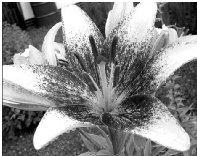
Lilie s kapičkami deště.