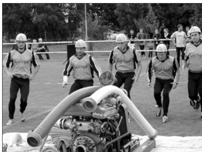
Hasiči z Částkova si běží pro velmi solidní umístění.