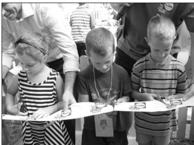
Děti přestřihly bílou stuhu se symbolem Rákosníčka.