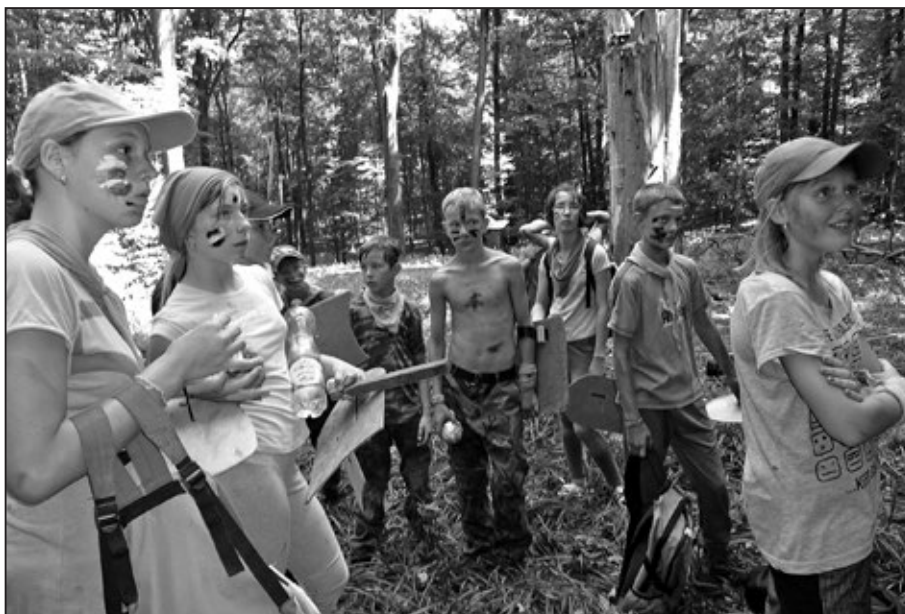
Na táboře nám nic nechybělo a poznali jsme spoustu dobrých kamarádů.

„Po příchodu do tábora nás čekala scénka, kde jsme se dozvěděli, že na naší Zemi se noc nepřírozně prodlužuje a den naopak zkracuje. Tento problém řešili představení z mnišského řádu Kalitů a vědci z celého světa. Byly dvě teorie, proč se tak děje na naší Zemi. Buď naším špatným a neukázněným chováním, nebo polohou Proximi Centauri, která se od nás vzdálila neobvykle daleko. Tak i tak jsme museli tento problém vyřešit. Rozhodli jsme se, že pocestujeme do země Světlotemna, která je mimo naše vnímání a tam navštívíme Nicotu, která ovládá noc na naší Zemi, a také Zdroj, který naopak ovládá den a světlo. Nebylo jediného důvodu, proč by naše skupina nechtěla bojovat za dobro na Zemi“ říká účastnice.