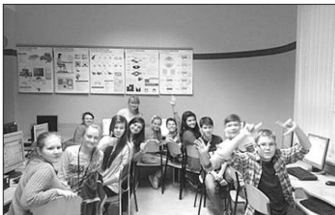
A nyní si užíváme prázdniny.