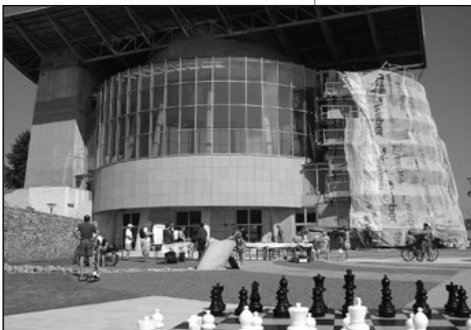
V sobotu 9. srpna byla na náměstí Velké Moravy sehraána simultánka šachového turnaje FIDE OPEN 2014.