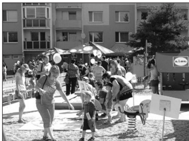
Čilý ruch na hřišti v ulici Za Mlýnem.