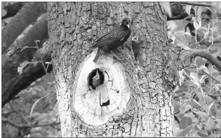
O tom, že špačci zpívají trojhlasně, nebo lépe řečeno nedočkavě křičí, nás přesvědčí naše fotografie ze zahrady.