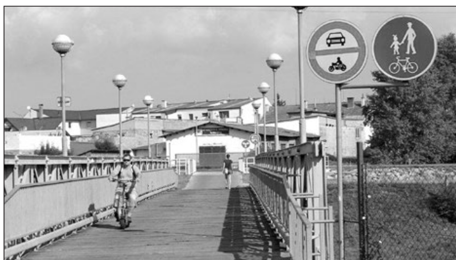
Lávka přes Baťův kanál byla postavena na podzim roku 1994. Po dvaceti letech je rekonstrukce velmi potřebná.