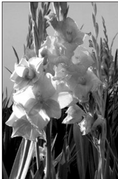
Mečíky neboli gladioly.

V zahrádkách se vždy těšíme na začátek dubna, kdy vykvetou tulipány. Růžím se říká královna květin, tulipán je králem cibulovin. Je to zcela určitě nejvznešenější ozdoba jarních