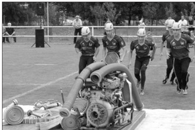
Staroměřšané při požárním útoku.