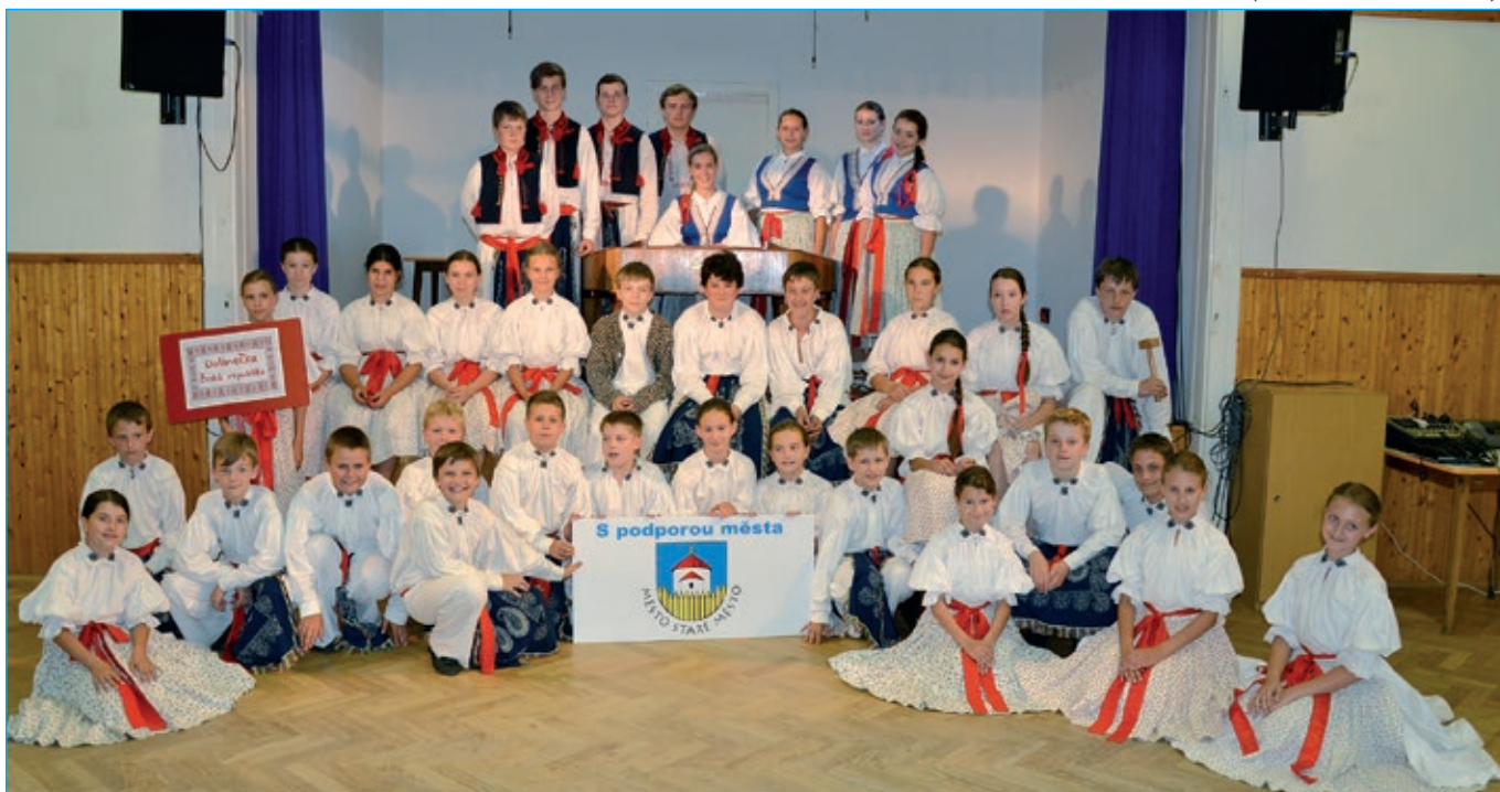
Na vystoupení jsme se pečlivě připravili.