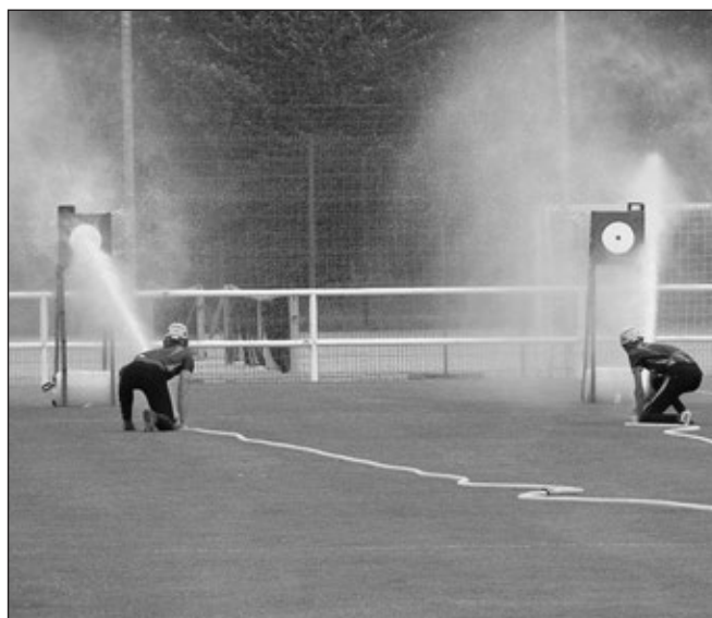
Hasiči SDH Staré Město dosáhli čas 21.938. Oproti minulému roku si pohoršili a skončili dvanáctí.