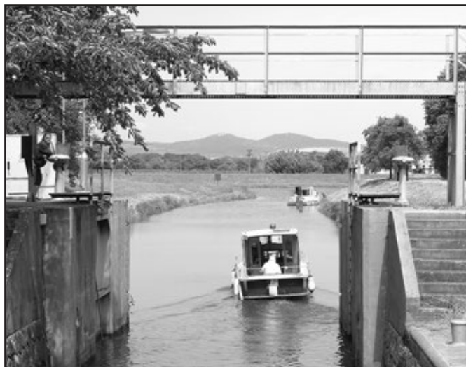
Poznáte jez na Baťově kanálu? Pokud si myslíte, že se jedná o jez neda-konický, máte pravdu.

(původně část p. č. 6073/71 orná půda o výměře 1.508 m 2 ) původně část p. č. 6073/73