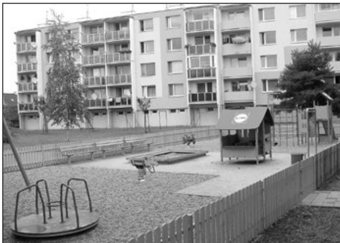
Rákosníčkově dětské hřiště v ulici Za Mlýnem.