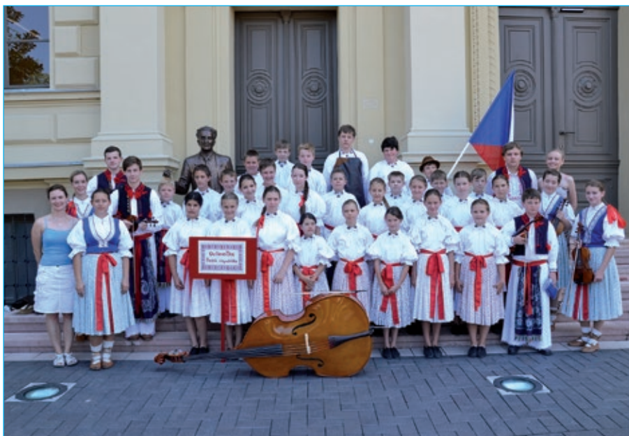
Dolinečka před univerzitou v Segedínu.

Příští číslo Staroměstských novin vyjde 24. září. Uzávěrka je 14. září 2014.