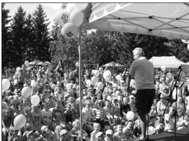
Michal z Kouzelné školky měl velmi početné publikum.