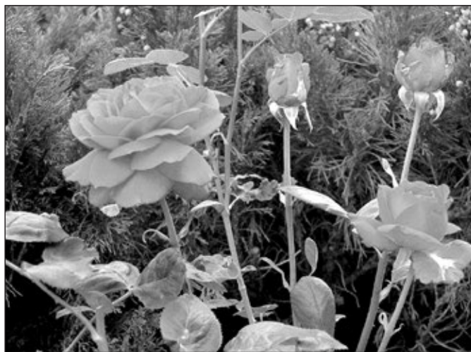
Růže, královna květin.