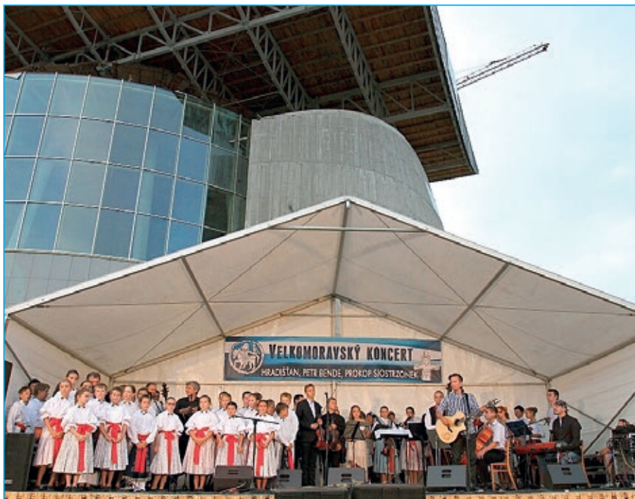
Připomeňme si Velkomoravský koncert, který se uskutečnil 8. září 2013.