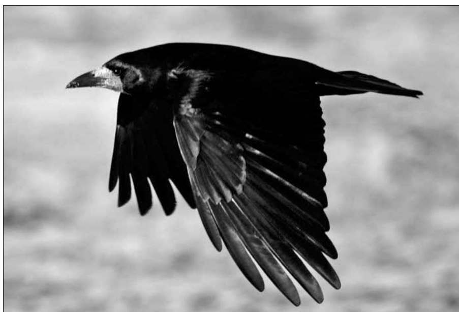
Havran polní v letu.