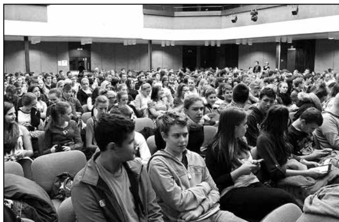
Studenti zaplnili celý sál Klubu Kultury.