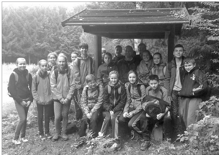
Žáci Základní školy Staré Město se vydali po stopách partyzánů.