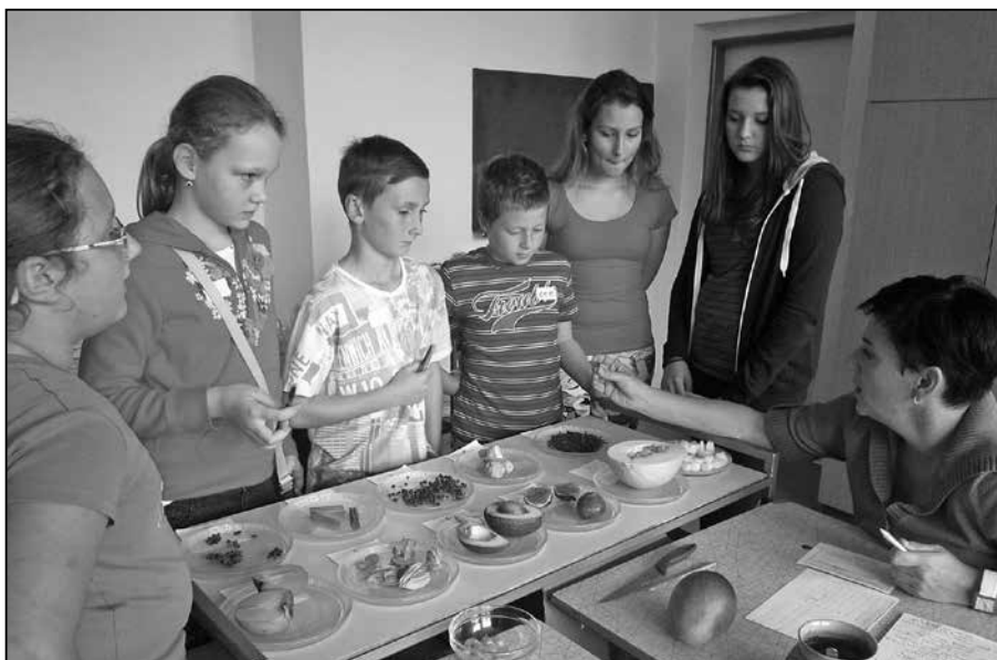
Přírodovědná soutěž se vydařila.

Ve středu 15. října jsme na ZŠ Staré Město připravili již třetí ročník přírodovědné soutěže pro žáky pátého ročníku základních škol o „Putovní pohár mladých přírodovědců“. Soutěžní pětičlenná družstva tvořili žáci ZŠ Staré Město, ZŠ Nedakonice, ZŠ Jalubí, ZŠ Uherské Hradiště Větrná, ZŠ Ostrožská Nová Ves a ZŠ Zlechov. V letošním roce jsme na naší škole přivítali rekordní počet účastníků – celkem soutěžilo téměř 140 dětí. Soutěž se tradičně skládala z teoretického testu přírodovědných znalostí a praktických úkolů. Žáci postupně procházeli pěti stanovišti a sbírali body. Poznávali zástupce kvetoucích rostlin a stromů, v učebně přírodopisu určovali živočichy, v přípravně přírodopisu zavonělo exotické koření a cizokrajné plody, na zelené stezce se třídil odpad a v teraristickém kroužku LEGU-ÁNEK řešili žáci úkoly s živými plazy. Celou akci doprovázela skvělá nálada, nadšení žáků z plnění úkolů i bojovná