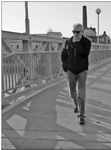
Lávky opět slouží pěším i cyklistům.

Obě lávky jsou hojně využívány chodci i cyklisty, neboť jejich umístění zajišťuje bezpečné spojení Uherského Hradiště a Starého Města mimo velmi frekventovanou silnici I/55 s dopravní