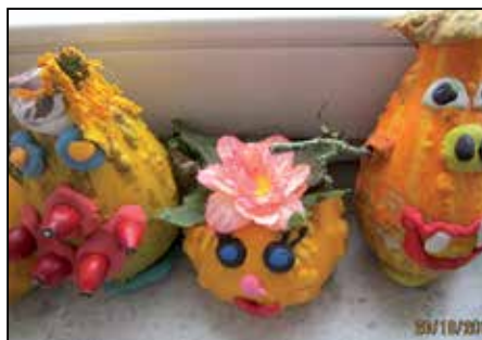
Děti skřítky tvořily z vlastnoručně vypěstovaných dýní.