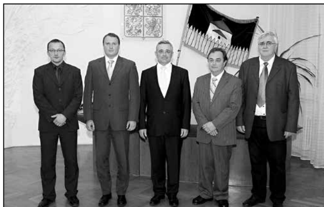
Rada města pro období 2014 - 2018