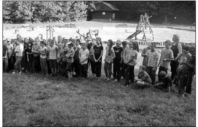
Děti si olympijský den užily.