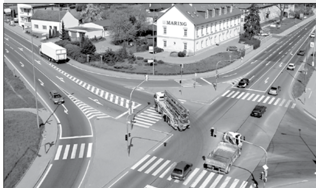
Pohled na křižovatku na ulici Brněnská.