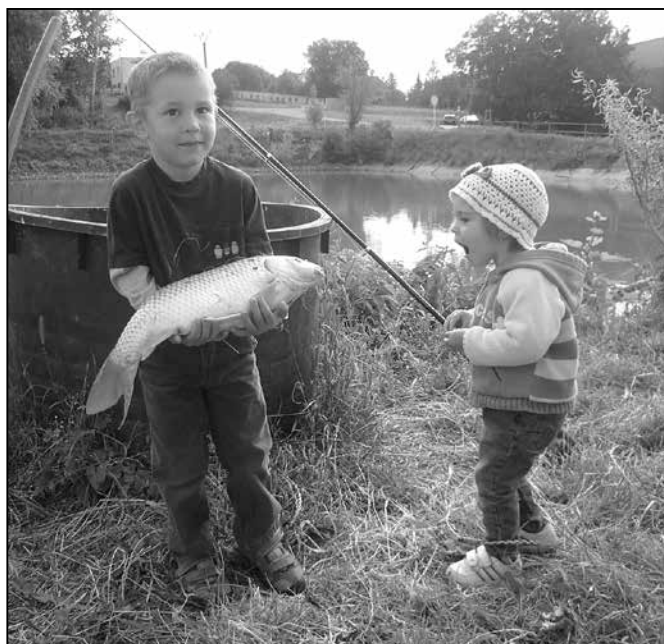
Na chovném rybníce Širůch se tradičně pořádají rybářské závody pro nejmenší.