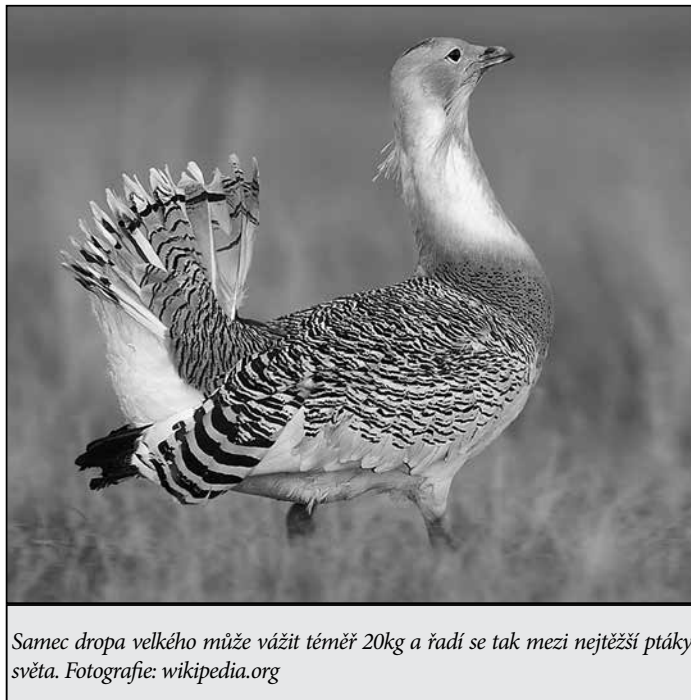
Samec dropa velkého může vážit téměř 20kg a řadí se tak mezi nejtěžší ptáky světa.

jelenů přechází od velehradského háje až ke Slezanu a pak dále k řece Moravě. Občas se objeví i daněk, v honitbě nám zdomácněl nevídaný přistěhovalec z východu psík mývalovitý, rapidně přibývalo též kun. A množství okousaných a pokácených stromů ukazuje, jak staroměstské prostředí svědčí bobrům. Jen