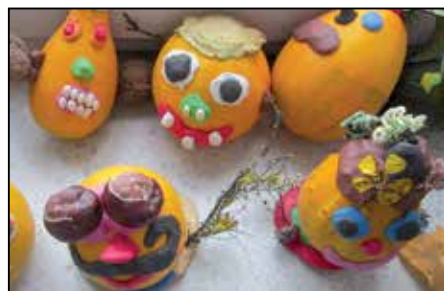
Fantazii se meze nekladly.