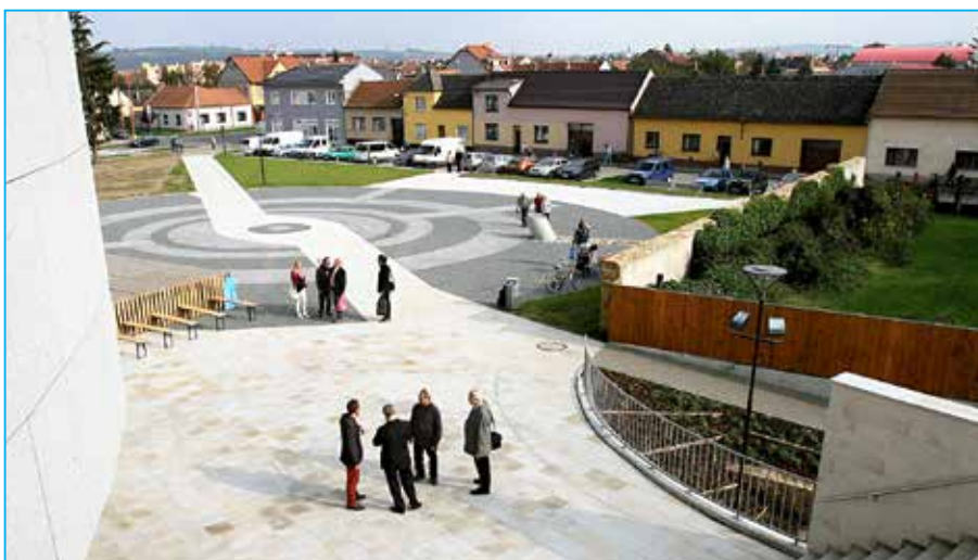
Jarmark letos proběhne na novém náměstí.

Přijďte nasát vánoční atmosféru na VIII. Staroměstský Vánoční jarmark, který se uskuteční v neděli 7. 12. 2014 od 9 hodin, poprvé v prostoru nového Náměstí Velké Moravy. V programu na pódiu vystoupí například dětský folklorní soubor Dolinečka, CM Bálašáci, děti z MŠ Komenského, Cimbálová muzika ZUŠ Staré Město, mužský pěvecký sbor ze Starého Města, ženský pěvecký sbor Babčice ze Spytihněvi nebo country kapela Štrúdl. Na náměstí budou připraveny stánky s občerstvením, vánočními cukrovinkami nebo tradiční řemeslnou výrobou. Zabijačkové speciality, pečené maso a další dobroty pro Vás připravuje Staroměstské uzenářství manželů