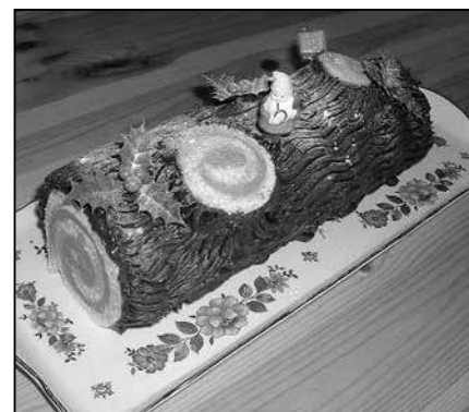
La bûche de Noël – tradiční francouzské vánoční cukroví.

v kruhu rodinném. Večer 24. prosince dávají děti své vyčištěné boty před domácí krb nebo na jiné místo v obytné místnosti. Věří a hlavně doufají, že Pere Noel (Otec Vánoč) jim boty naplní dárečky. S Pere Noelem chodí ve Francii