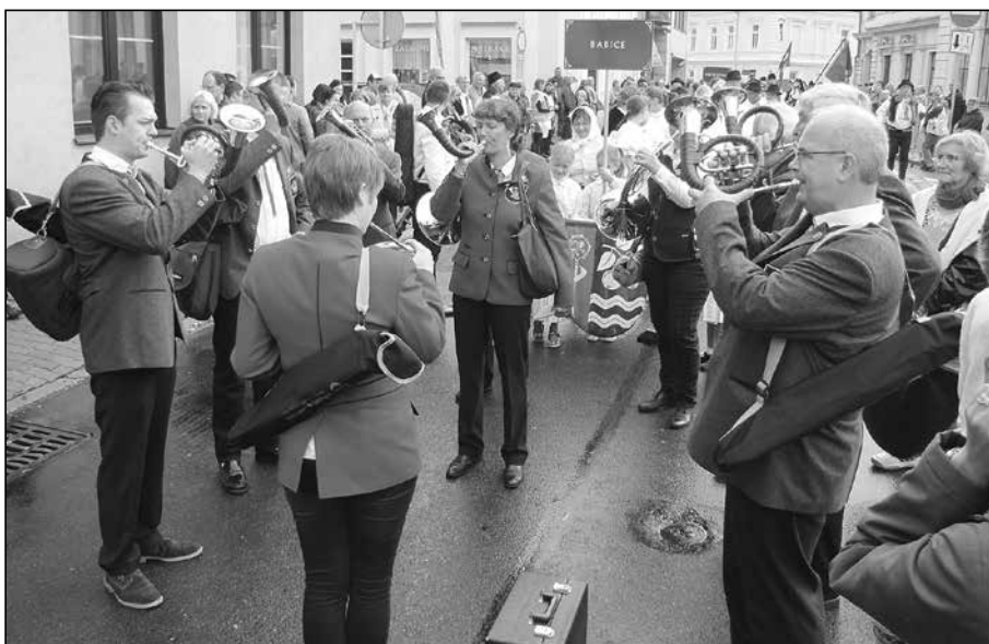
Němečtí přátelé z partnerského města Tönisvorst v průvodu při Slavnostech vína a otevřených památek v Uherském Hradišti v sobotu 13. září. Dechový orchestr Nette Fuchse přihlížející velmi zaujal.

Po prohlídce hradištských památek, ochutnávce burčáku a vín a shlédnutí četných vystoupení folklorních souborů, zamířili naši přátelé zpět do Starého Města. V podvečerních hodinách se hráli naši volejbalisté přátelské utká-