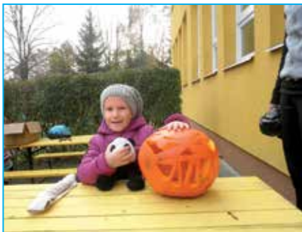
Některé dýně působily vskutku děsivě.