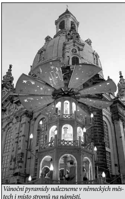
Vánoční pyramidy nalezneme v německých městech i místo stromů na náměstí.