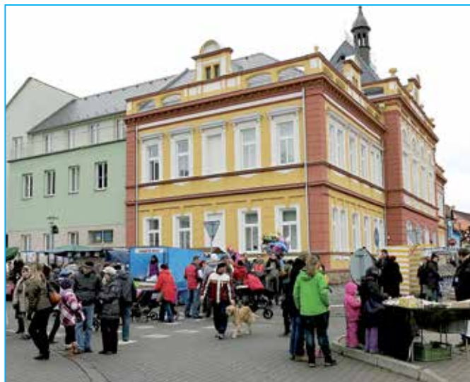
Město pořádá jarmark již po osmé.

zábavné aktivity organizované SVČ Klubko. Všichni jste zváni k příjemnému prožití předvánočního času na náměstí Velké Moravy.