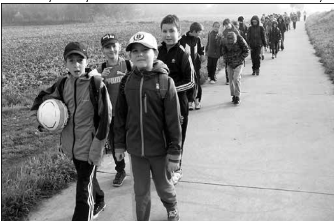
Třetíci putovali pěšky do Kostelan.