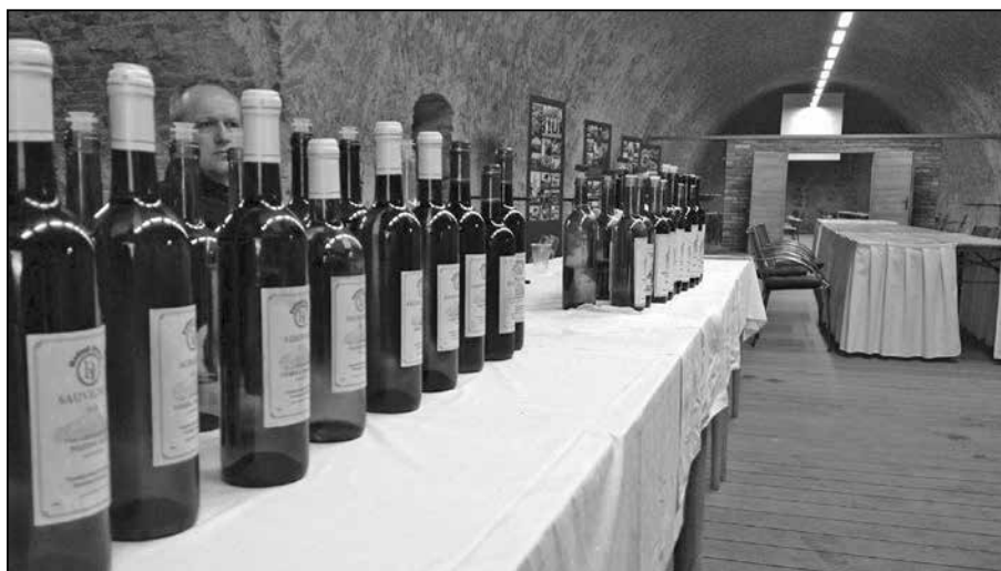
Vína poskytli členové Klubu přátel vína Staré Město a také další místní vinaři.