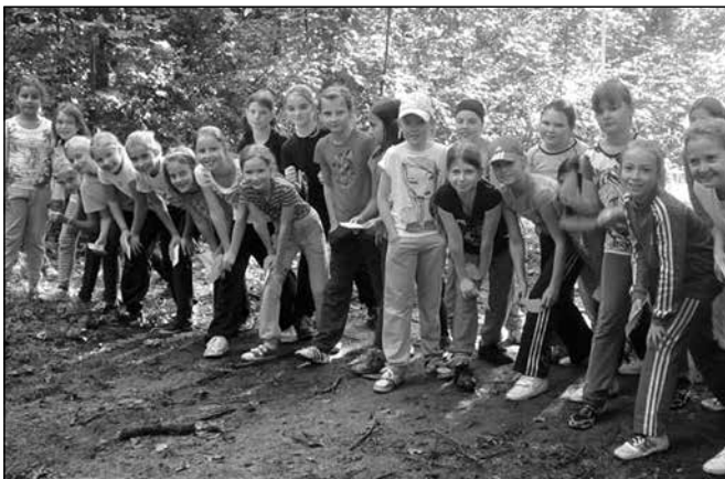
Orientační závod probíhal v Kunovském lese.

a podnikli pěší výlet do Kostelan. Zpočátku nebylo počasí úplně přívětivé. Zima