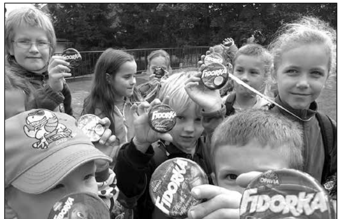
Medaile si nakonec odnesli všichni.