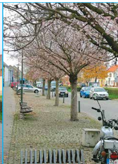
Vladimír Kučera zachytil stromy na Náměstí Hrdinů, které se v polovině listopadu zahály do květů.