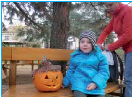
Děti byly na své výtvoře patřičně pyšné.