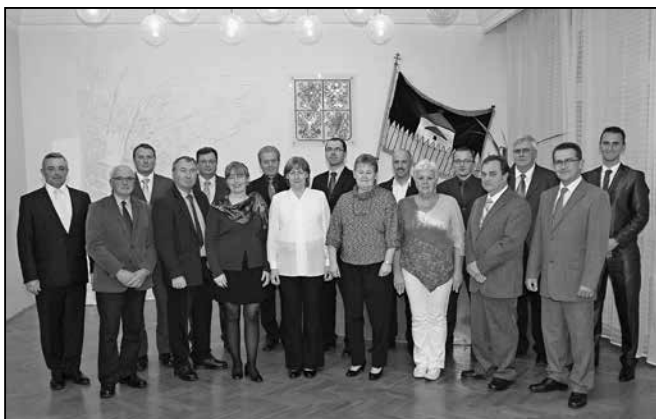
Zastupitelstvo města pro období 2014 - 2018.