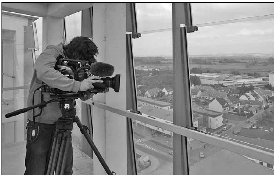
Kameraman České televize snímá Staré Město z věže kostela Svatého Ducha.