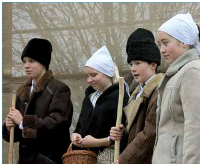
Koledníci z Dolinečky.