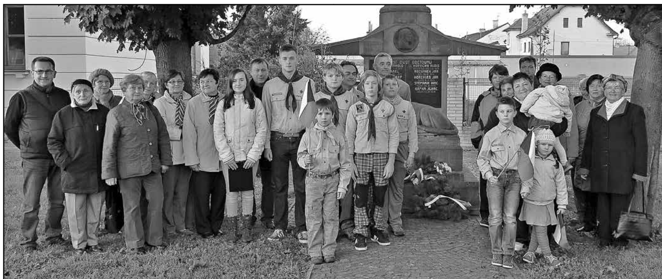
Společná fotografie účastníků vzpomínkové slavnosti.