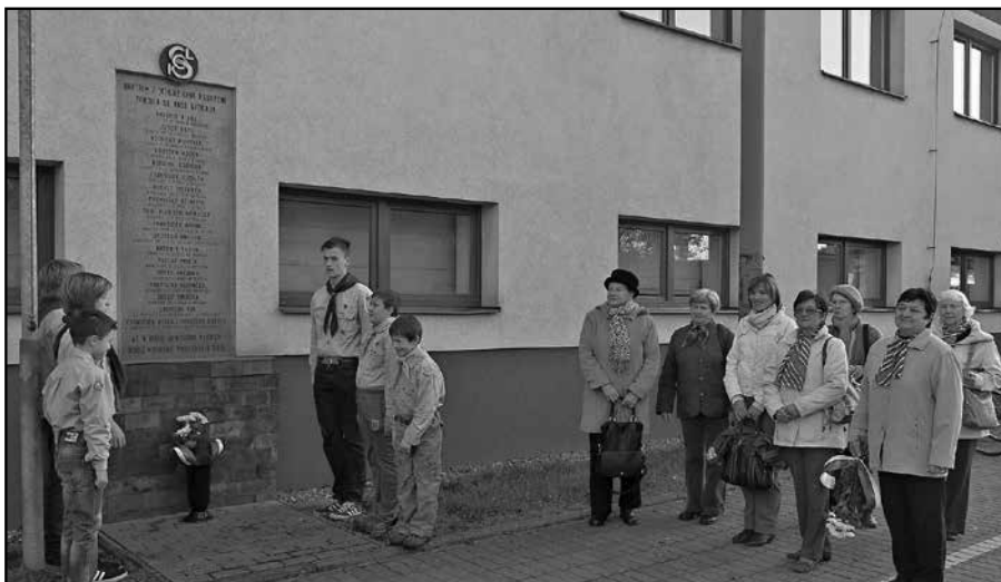
Nejprve se uskutečnil slavnostní akt u pamětní desky na sokolovně.