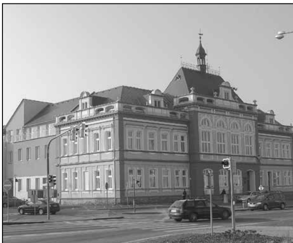
Budova radnice je dominantou centra města.