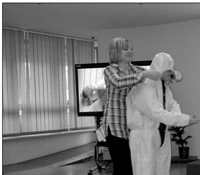
Zajímavá exkurze žáků osmých tříd ZŠ Staré Město do Experimentária v Otrokovicích.