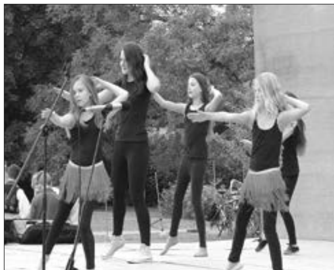
Vystoupení děvčat z Klubka při Staroměstském dnu, který se uskutečnil 21. června v areálu SOŠ a Gymnázia Staré Město.

Kurz masáží miminek vedené odbornou fyzioterapeutkou. S sebou: přezůvky a nepropustnou podložku pod miminko. Vstupné: 70,- Kč