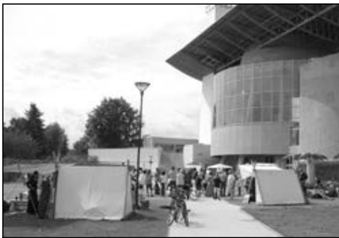
Náměstí Velké Moravy se proměnilo v období středověku.