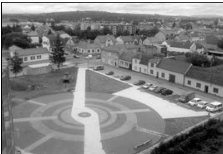
Pohled na náměstí z plošiny dne 14. srpna 2014.

Koncem měsíce září bude zahájen projekt revitalizace Nádražní ulice. Předmětem projektu je celková revitalizace ve-