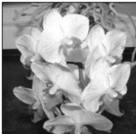
Věrám k svátku posíláme květ orchideje.