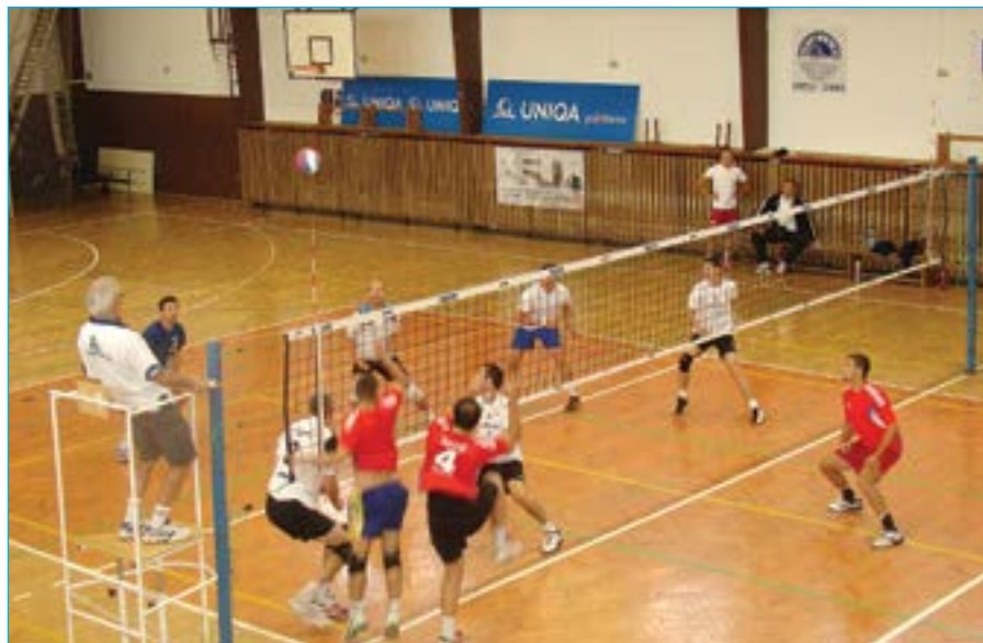
Volejbalisté VSK Staré Město (v bílých dresech) obsadili pěkně 3. místo.