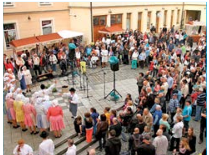
Soubory z mikroregionu Staroměstsko vystoupily na nádvoří Staré radnice.