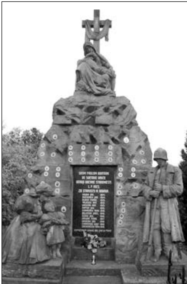
Pomník s plačící slováckou matkou a děti pod kamenným křížem věnovali Staroměšťané v roce 1923 svým padlým v první světové válce.