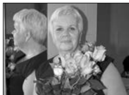
Jubilantka s krásnou kyticí růží.