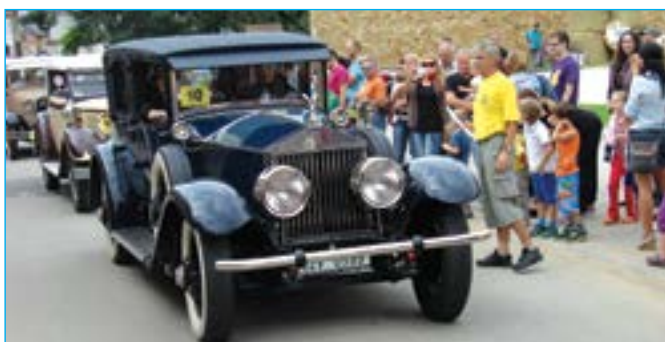
Jedna z limuzín.