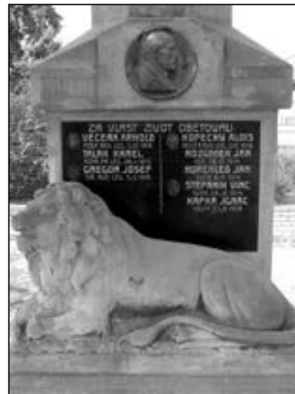
Pomník legionářů u budovy základní školy na náměstí Hrdinů.