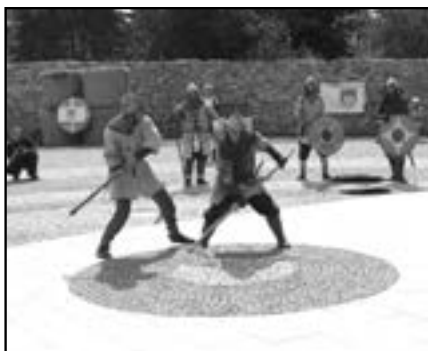
Vstoupení středověkých bojovníků.