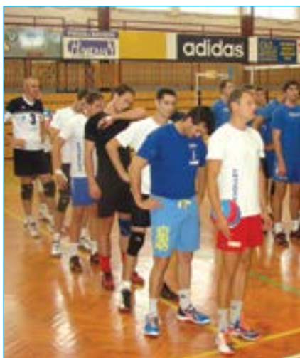
Nástup týmů před zahájením turnaje. Vpředu družstvo VSK Staré Město.