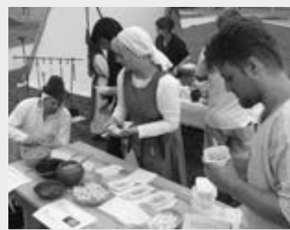
Ukázka středověké kuchyně.