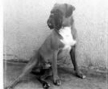
Boxer je pes pevných nervů, sebevědomý, veselý, přátelský a oddaný rodině. Rokyn na snímku je také elegantní a manekýn.