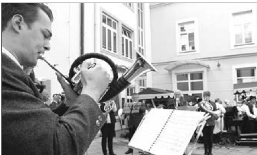
Dechový orchestr Nette Fühse vystoupil také na nádvoří Staré radnice v Uherském Hradišti v expozici mikroregionu Staroměstsko.