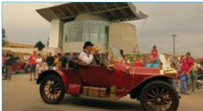
Zastavení u náměstí Velké Moravy.