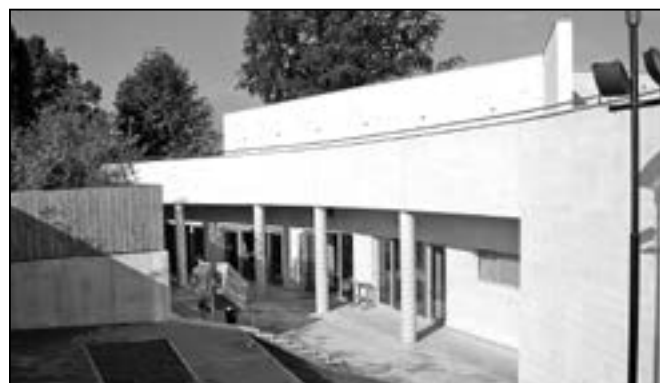
Rekonstruovaný jezuitský sklep (založen cca roku 1650) nabídne prostory pro ochutnávku vín, besedy u cimbálu, zázemí pro účinkující při koncertech.