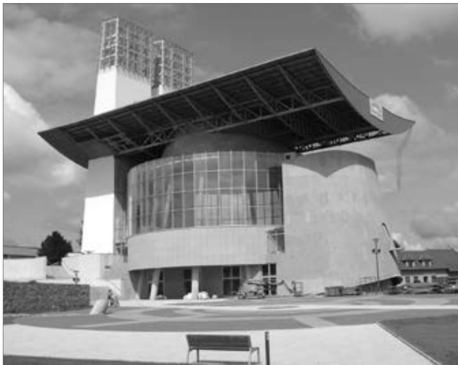
Kostel Svatého Ducha a dokončená část náměstí Velké Moravy dne 21. srpna 2014.

Daleko rozmanitější ruch panuje uvnitř kostelních prostorů. Na dokončení a úspěšné vyzkoušení podlahového vytápění se už na stavbě téměř zapomnělo. Teď člověk vidí lesklou dlažbu v hlavní lodi i v presbytáři, ve které se zrcadlí prosklený plášť kostela. Tam kde byla před nedávnem spleť elektrických kabelů, vidí jednolitou kruhovou stěnu z travertinových desek. Nad hlavou ve výšce bílou kupoli podepřenou dvanácti nakloněnými sloupy.