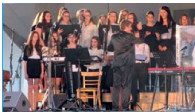
Pěvecký sbor Viva la musica.