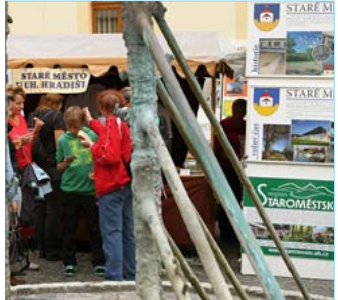
Stánek Starého Města a informační panel o městě na nádvoří Staré radnice.