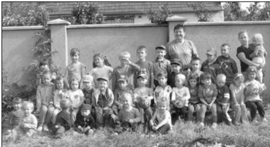
Spokojení účastníci táboráku na orelské zahradě.