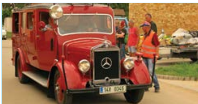
Hasiči z Bojkovic se svým mercedesem.