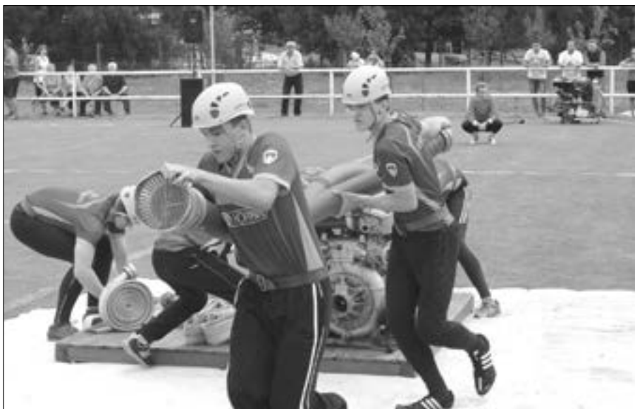
Hasiči SDH Staré Město nastoupili hned v úvodu soutěže. Jejich čas 21.938 stačil na 12. místo.