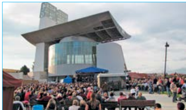
Koncert sledovalo 950 spokojených diváků.