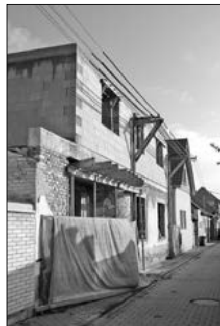
Azylový dům v průběhu rekonstrukce v září 2014.