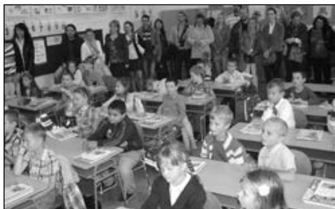
Na první den ve škole šestileté a sedmileté děti určitě nezapomenou.