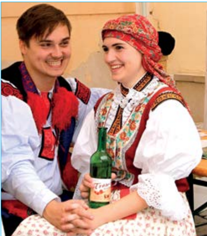
Pěkné děvčice pijí červený Tramín a švarný šohaji s nimi.