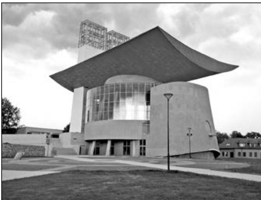
V neděli 5. října v 16 hodin při pontifikální mši svaté požehná kostel Svatého Ducha Mons. Pavel Posád, světící biskup českobudějovický.