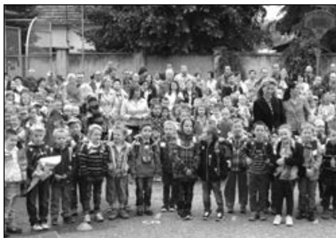
Prvňáčci na školním dvoře ZŠ na náměstí Hrdinů.