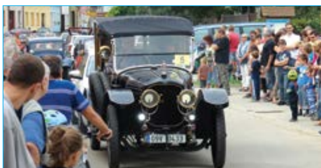
Přibližně čtyři stovky diváků viděly unikátní vozy.