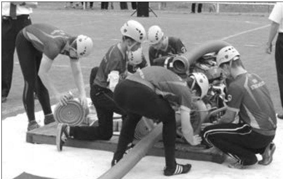
Před zahájením požárního útoku si Staroměšťané důkladně připravili techniku.