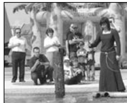
Také ženy nám předvedly, jak se sekalo ostrými meči.