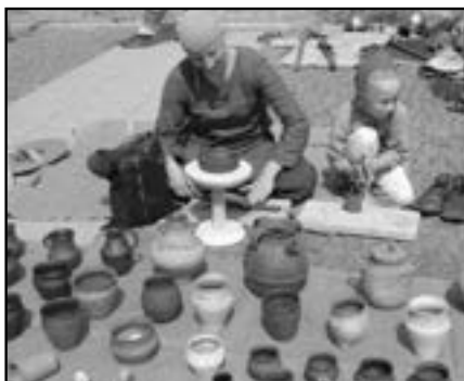
Prohlídka výrobků z keramiky.