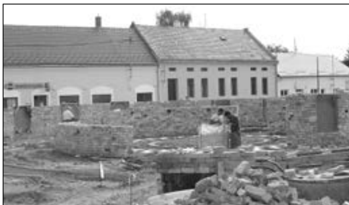
V sobotu 30. srpna byl čilý pracovní ruch při výstavbě náměstí Velké Moravy.