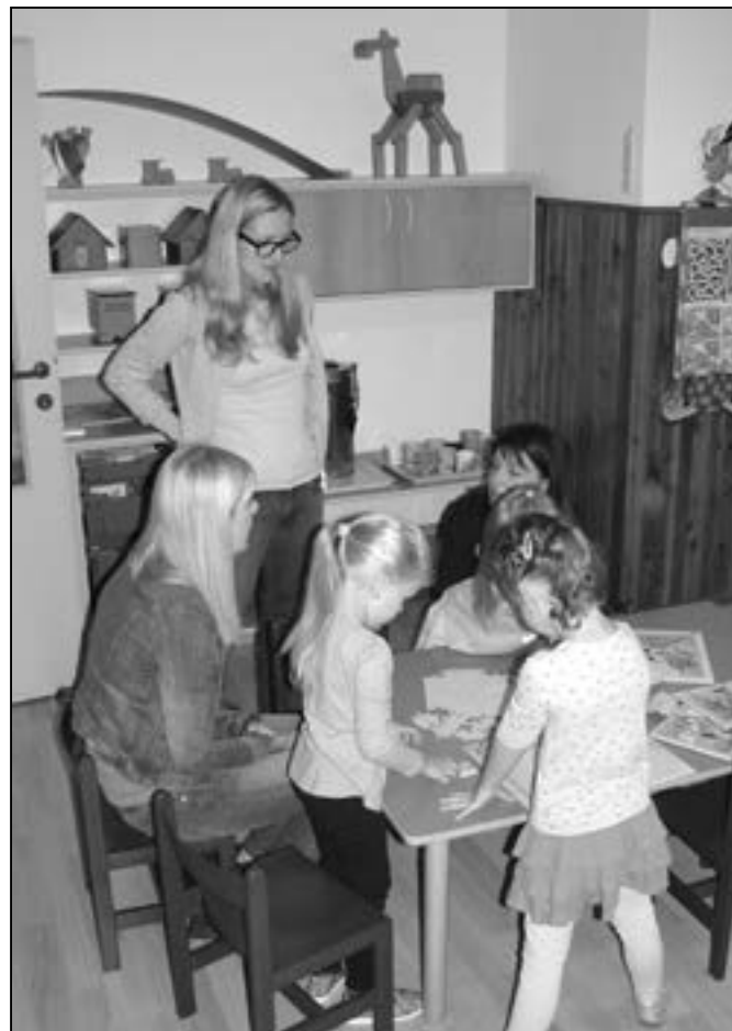
Dětské hárky v mateřské škole Komenského.