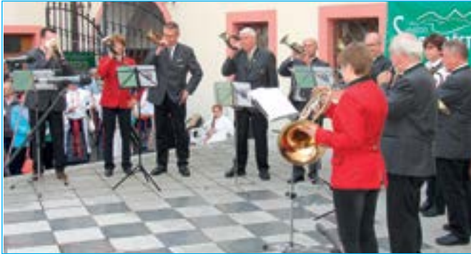
Hosté z partnerského města Tönisvorst představili dechový orchestr Nette Fühse.