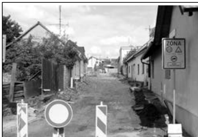
V ulici Zelntiusova pokračují stavební práce na rekonstrukci komunikace a chodníků.