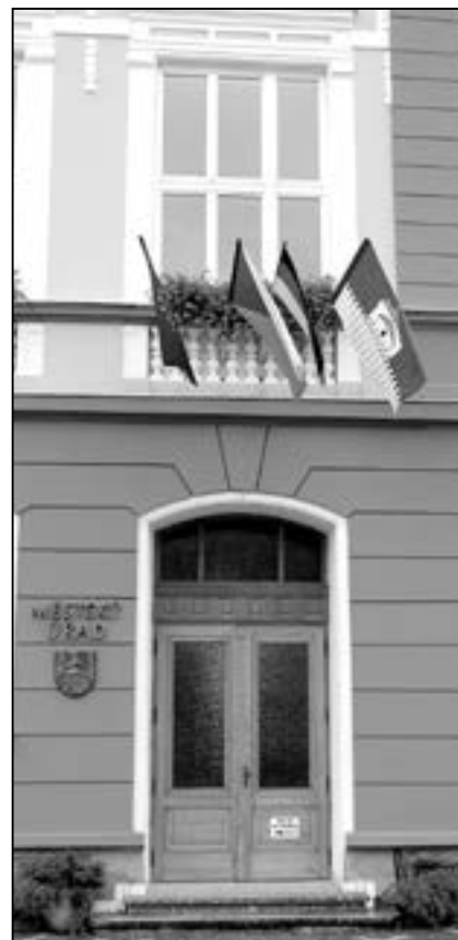
Na radnici zavály vlajky Evropské unie, Německa, České republiky a Starého Města.