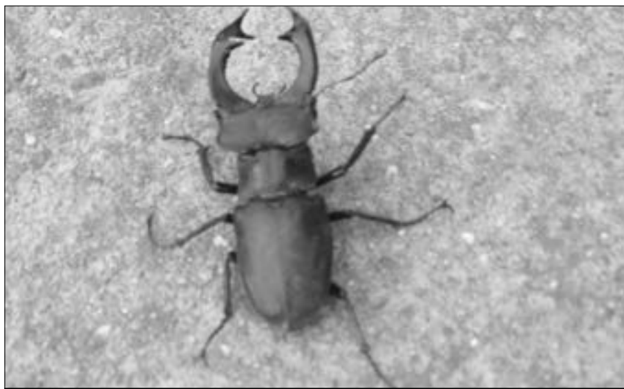
Roháč obecný je největší brouk Evropy. Samci měří 35 až 92 mm, samice jsou podstatně menší 35 až 45 mm. Larva v posledním stadiu před zakuklením má délku až 100 mm.