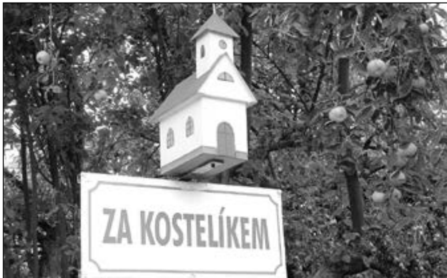
Již jen maketa na rozcestí ulic Michalská a Svatovítská nám připomíná místo, kde před mnoha lety stával kostelík sv. Víta.

První převratné události se udály přímo na katastru dnešního Starého Města a možná právě na rozcestí Michalské a Svatovítské ulici, kde stával kostelík sv. Víta, v němž podle legendy arcibiskup Metoděj pokřtil Přemyslovce Bořivoje a jeho ženu Ludmilu, babičku sv. Václava. Je známo, že kněžna Ludmila se později stala první českou svatou, když byla svatořečena v 11. století. Kníže Bořivoj (852 – 889) měl své sídlo na Levém Hradci v blízkosti Prahy, kam jsem se před časem vypravil, abych poznal genium loci tohoto místa. O Bořivojovi je známo, že vládl pod silným tlakem velkomoravského knížete Svatopluka, který chtěl mít vliv na politickou situaci v české kotlině. Proto