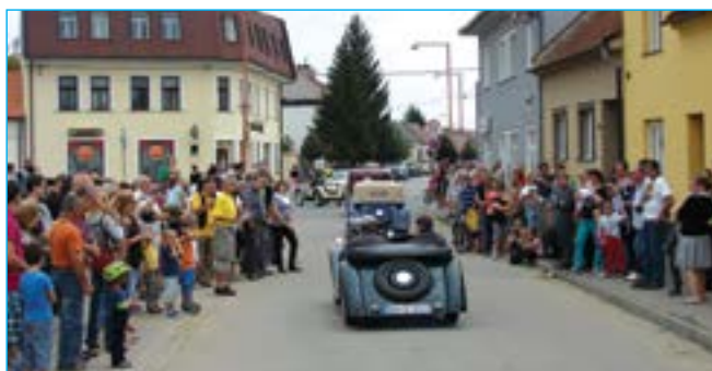
Ze Starého Města řidiči za volanty veteránů pokračovali směr Velehrad.