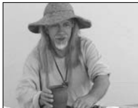
Pánové, dáte si medovinu nebo si prohlédnete výrobky z kůže?