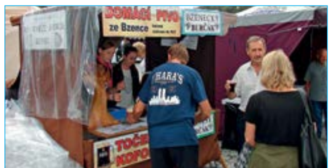
K dostání byl nejen burčák, ale i domácí pivo. Skvělá kombinace!