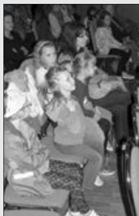
Rodiče s dětmi při zahájení nového školního roku ZUŠ.

Nabídka oborů na staroměstské ZUŠ je velmi bohatá, předkládáme vám seznam učitelů a oborů, které vyučují.