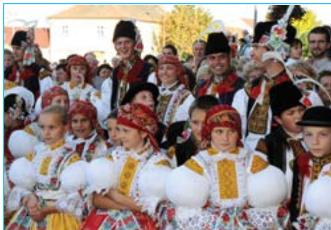
Při povolení Michalských hodů před radnicí v roce 2011 bylo velmi veselo.