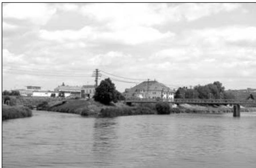
Lávky přes Bařův kanál a řeku Moravu jsou v současnosti uzavřeny, probíhají zde stavební práce. Předpokládaný termín ukončení rekonstrukce lávek pro pěší a cyklisty je 31. říjen 2014.