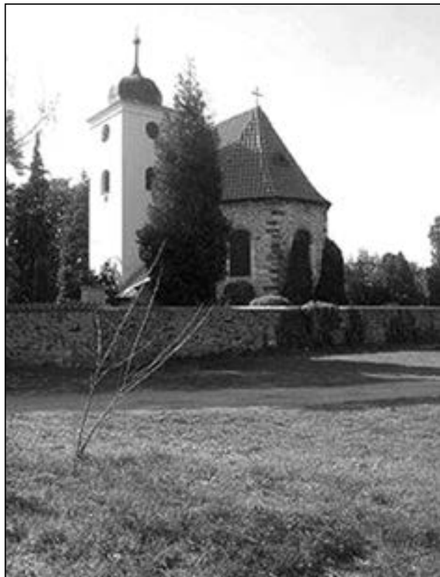
Kostel sv. Klimenta na Levém Hradci stojí na základech prvního křesťanského kostela v Čechách - rotundy sv. Klimenta.