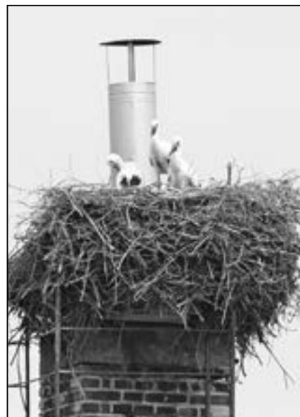
Čápi trojčata na komíně v Klukově ulici v roce 2011.