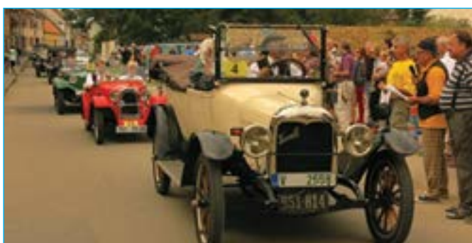
Jezuitská ulice se zaplnila historickými automobily.