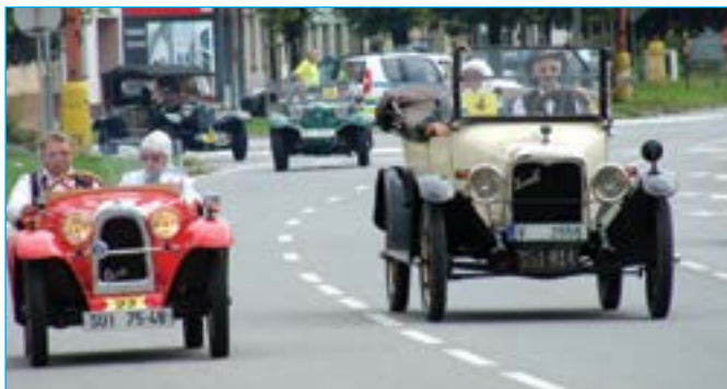
Náměstí Hrdinů jako v době před osmdesáti lety.