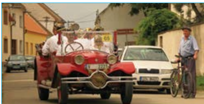
Hasiči z Luhačovic v otevřeném voze značky Tatra.