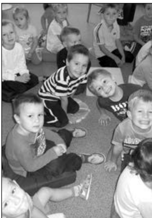
Děti nejvíce zaujaly a potěšily hračky.