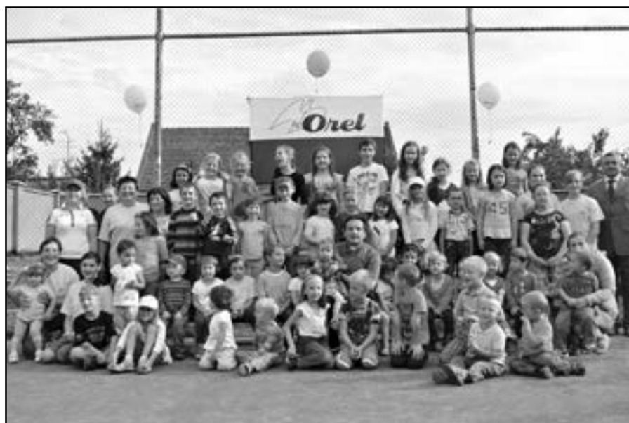
Společná fotografie účastníků orelského odpoledne.