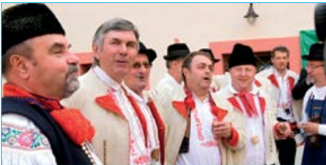
Společné zpívání starostů a místostarostů z mikroregionu Staroměstsko.