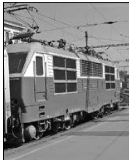
Jezděte vlakem, příroda vám poděkuje.