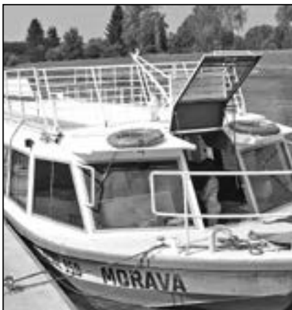
Lod Morava je připravena k plavbě po řece Moravě.