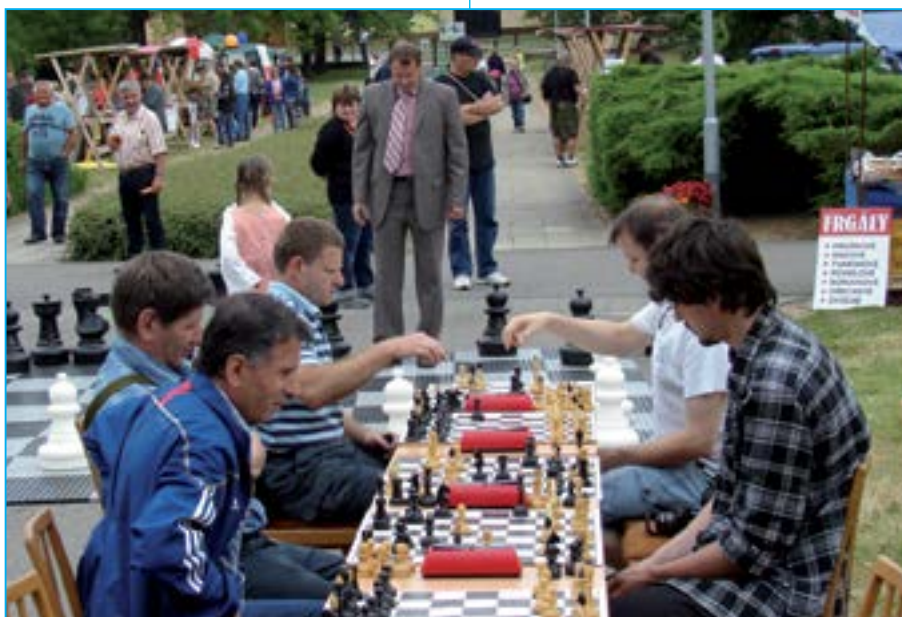
Zájemci o hru na 64 polích si mohli zahrát klasické i obří šachy.