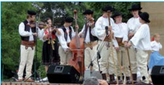
Slovenský folklorní soubor Fialka z města Partizánske má výstižné motto: Kde sa spieva a tancuje, tam zostaň s radosťou, zlí ľudia nemajú piesne...