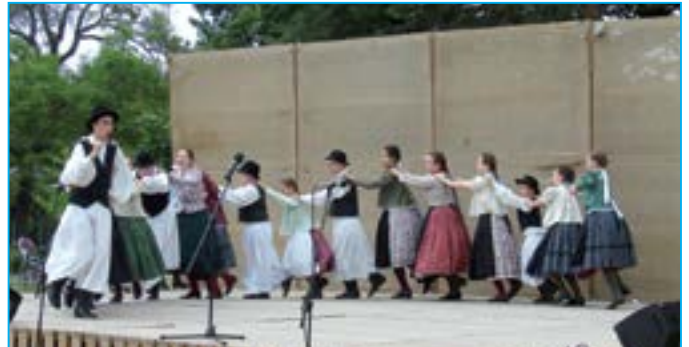
Dětský folklorní soubor Nádikó z maďarského města Kalocsa se patrně inspiroval pořadem Staroměstská lokálka, který nedávno předvedla Dolinečka.