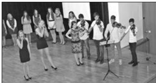
Kulturní program připravili žáci 8. ročníku.