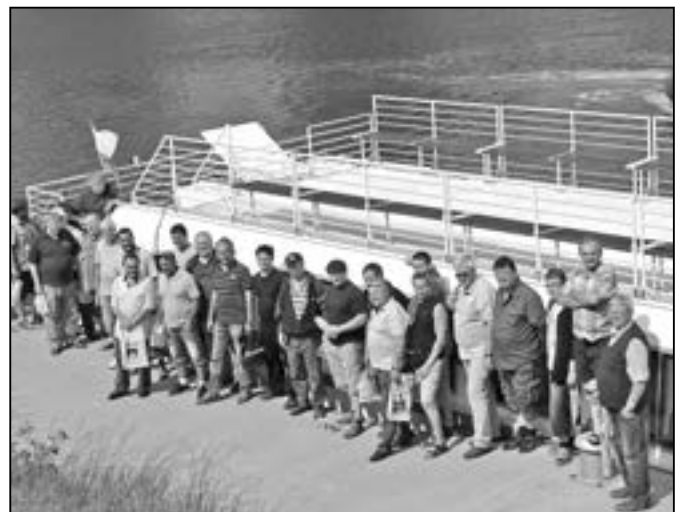
Společný snímek rybářů u lodi Morava před vyplutím z Uherského Ostrohu.