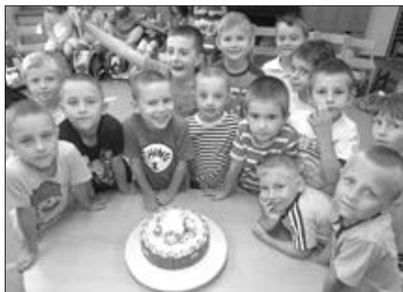
Páni kluci z mateřské školy Komenského.