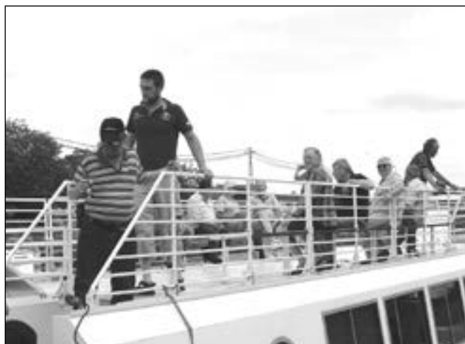
Krátká zastávka v přístavu v Uherském Hradišti.

Přibližný termín uzavření lávek je do 31. října 2014.