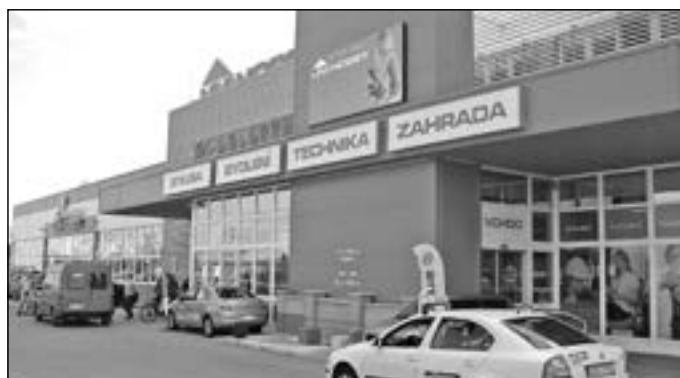
Market UNI HOBBY ve Starém Městě je v pořadí osmý v České republice. Další najdeme ve Valašském Meziříčí, Jihlavě včetně pěti bývalých OBI – marketů (Brno, České Budějovice, Hodonín, Pardubice, Zlín).