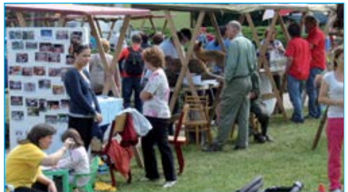
Návštěvníci Staroměstského dne se zastavovali u stánků, kde měli expozice spolky a společenské organizace.