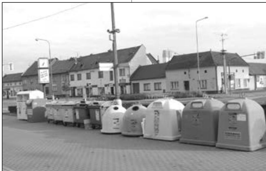
Občané Starého Města již získali mnoho ocenění za výsledky v třídění komunálního odpadu v rámci měst Zlínského kraje. Na snímku kontejnery pro uložení plastů, textilu, papíru, elektroodpadu, barevného i bílého skla v Hradištské ulici u radnice. Děkujeme, že odpad pečlivě třídíte.

1.4 schválit majetkoprávní vypořádání – bezúplatný převod pozemků ve Starém Městě, k. ú. Staré Město u Uh. Hradiště, mezi městem Staré Město a Zlínským krajem. Jedná se o pozemky pod chodníky, odstavným stáním a veřejnou zelení v lokalitě ulice Velehradská ve Starém Městě, které Zlínský kraj převede do vlastnictví města Staré Město: