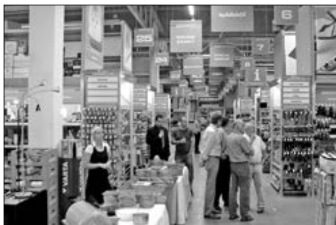
První zákazníci si prohlíží novinky a trendy.