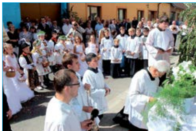
Zastavení u oltáře v ulici Za Radnicí.