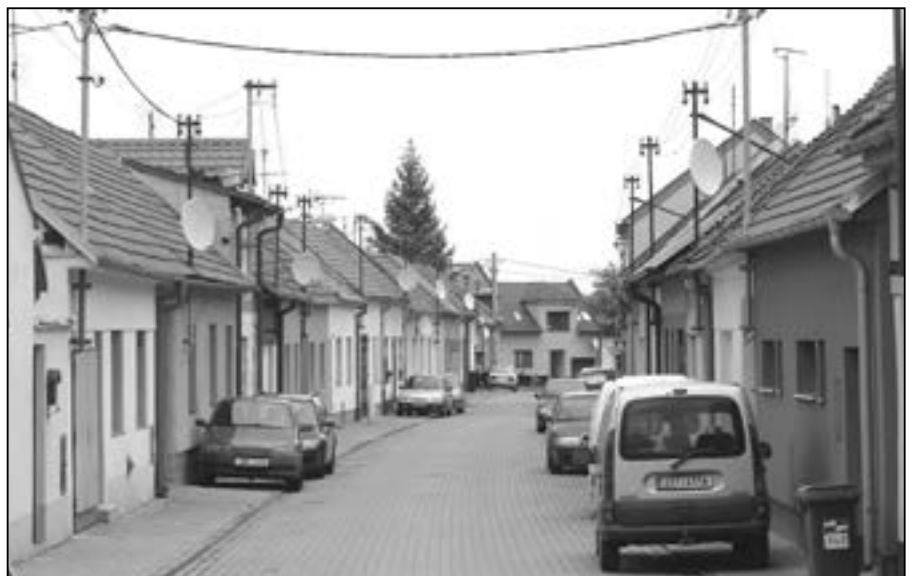
Ulice Mojžírova je pojmenována podle panovníka z období Velké Moravy. V současnosti nám více připomíná ulici „satelitní.“