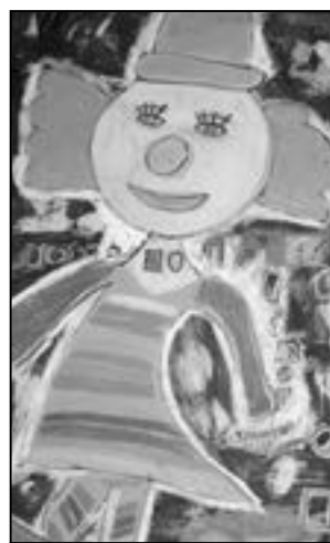
Jak se vám líbí obrázek klauzura?