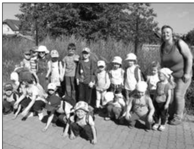
Děti ze 4. třídy Žabiček poznávaly vývojová stadia motýla.