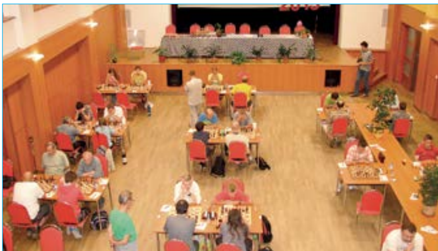
Mezinárodní šachový turnaj FIDE OPPEN 2014 se uskuteční v SKC – sokolovně ve Starém Městě ve dnech 8. - 16. srpna.

Příští číslo Staroměstských novin vyjde 29. srpna, uzávěrka je 15. srpna 2014.