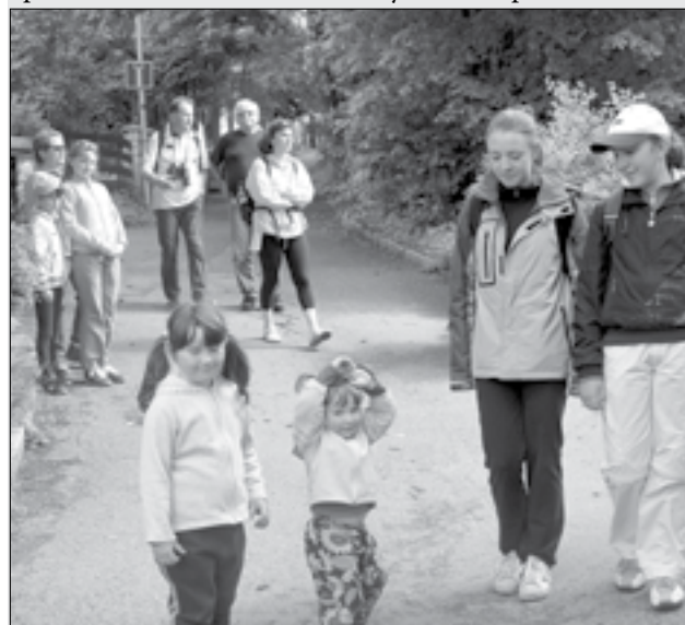
Staroměstští orlí na župním turistickém pochodu.

Na děti po trase čekaly zábavné úkoly. Počasí akci přálo a dobrá nálada všem vydržela i po náročném