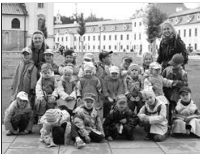
Chlapci a děvčata z KMS se vypravili na Velehrad.