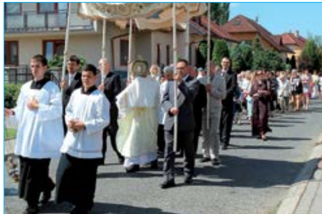
Průvod svátku Božího Těla, ve kterém bylo přítomno téměř 300 věřících.