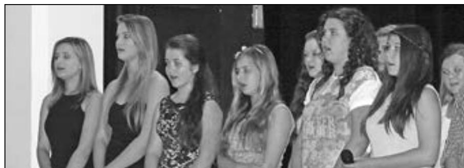
Pěvecký sbor základní školy.