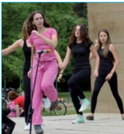
SVČ Klubko – exotická latina.

Střední odborná škola a Gymnázium Staré Město připravila 19. ročník výstavy Zahrada Moravy, která se uskutečnila v sobotu 21. června od 10 do 18 hodin v areálu školy. Součástí programu byl také v pořadí již osmý Staroměstský den, v jehož rámci se představily spolky a zájmové organizace, které pracují na území města.