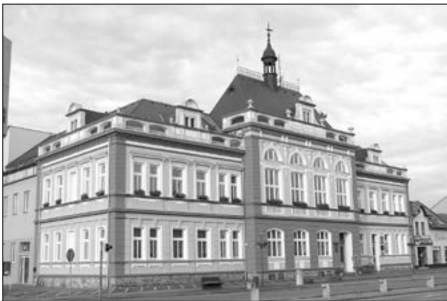
Budovu radnice zdobí záplava květů v oknech prvního poschodí.

2. Taneční klub Tweet, o. s. IČ 01775430, zastoupen Tomášem Horváthem na projekt Pohybový a taneční rozvoj zájemců o tanec na náměstí Velké Moravy ve výši 30.000 Kč,