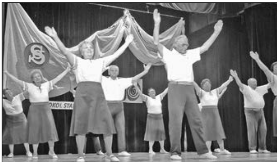
Věrná garda TJ Sokol Veselí nad Moravou.

Na první z nich jsou hosté z T. J. Sokol Veselí nad Moravou. Věrná garda k nám do Starého Města ráda přijela. Veselští sokoli zacvičili na pódiu a obdivovali naši před osmi lety opravenou sokolovnu. V jejich řadách cvičí také bývalý primář plicního oddělení uherskohra-