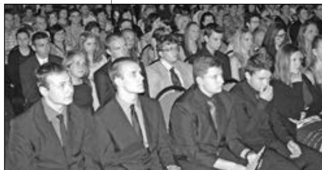
Devátáci poslouchají proslov starosty.