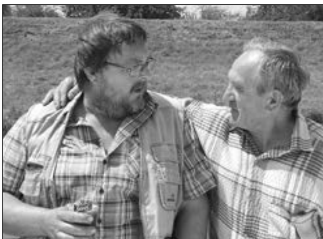
Když se setkají rybáři, je si o čem povídat.