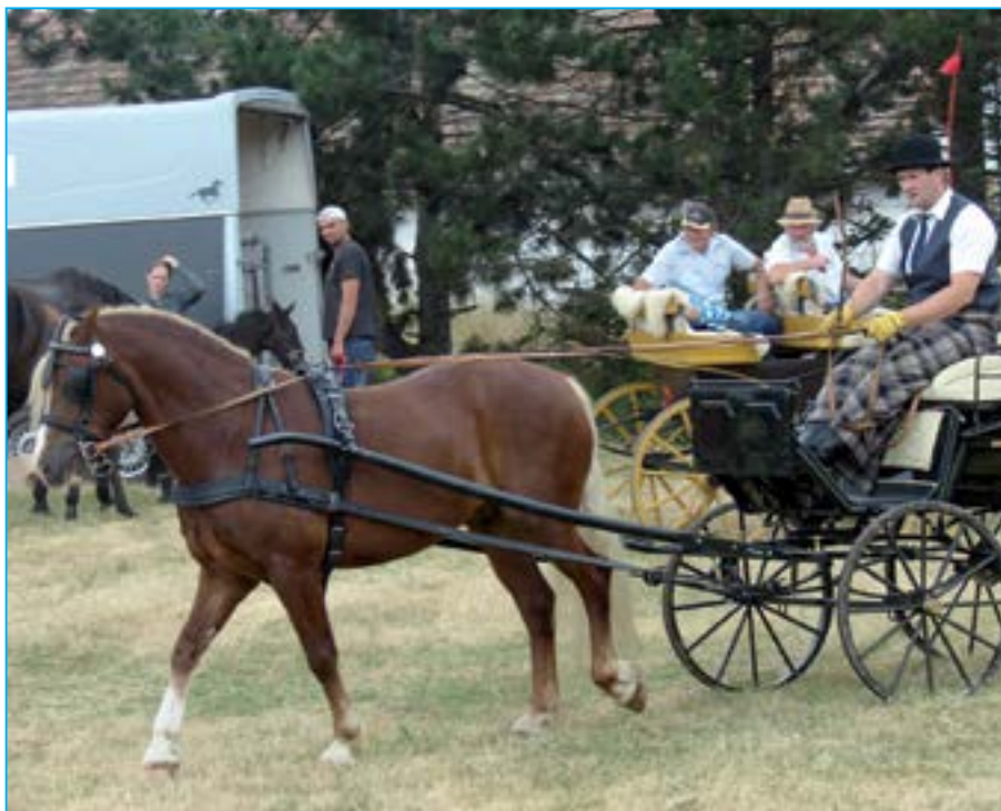
Jezdecké odpoledne se setkala se zájmem diváků.