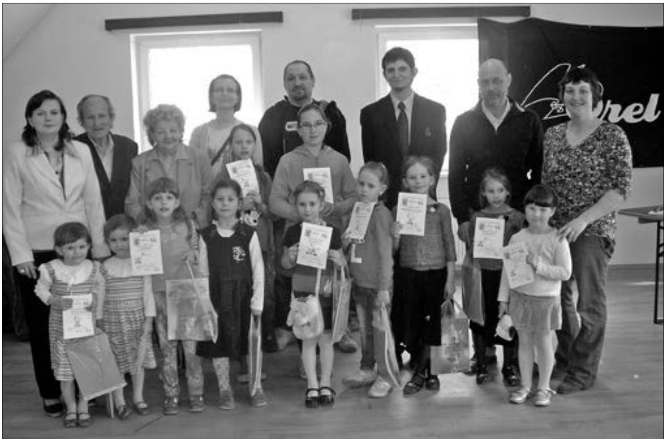
Děti nám udělaly radost na soutěži Orelský slavíček.