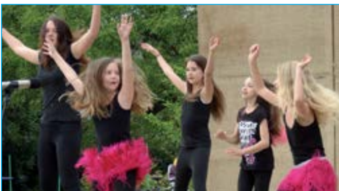
Malé tanečnice z Klubka při vystoupení na Staroměstském dnu.