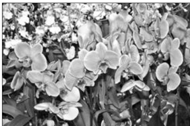
Především ženy obdivovaly azurově modré orchideje.