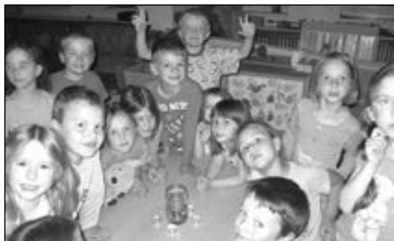
Pro nejstarší děti byla ve školce připravena nejen pyžamková diskotéka, ale i soutěže a hry.