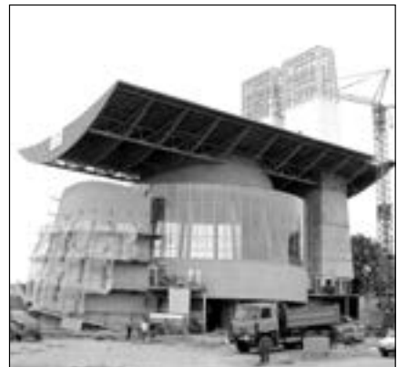
Cílem projektu je vybudovat doprovodnou infrastrukturu cestovního ruchu na náměstí Velké Moravy, kde jsou významnými turistickými atraktivitami Památník Velké Moravy a kostel Svatého Ducha.