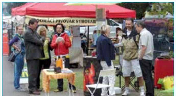
Sedlácké trhy nabýzely regionální výrobky.