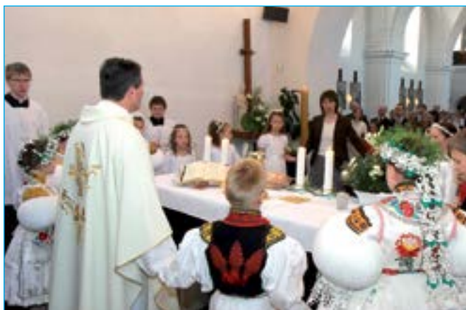
Slavnostní mši sloužil P. Miroslav Suchomel.