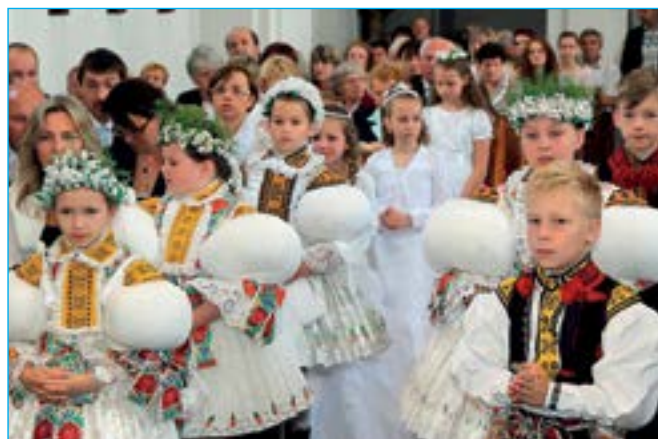
Děti při mši v kostele sv. Michaela.