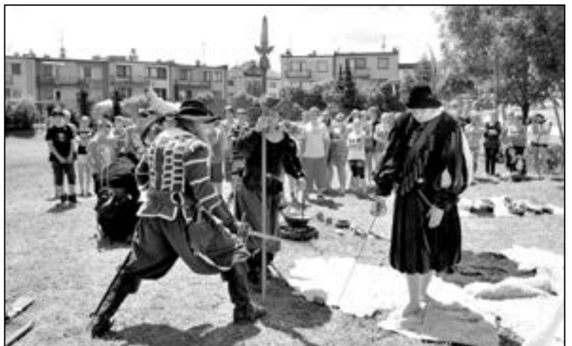
Na školním hřišti si žáci 7. ročníku připomněli období třicetileté války.