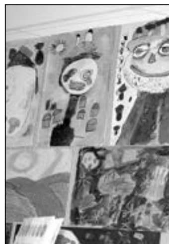
Stěny místnosti knihovny ozdobily výtvarné práce dětí ZUŠ.