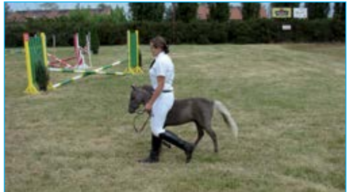
Mini horse je kuriozní plemeno koní malého vzrůstu.