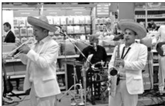
K dobré pohodě zahrál MARATHON BAND.