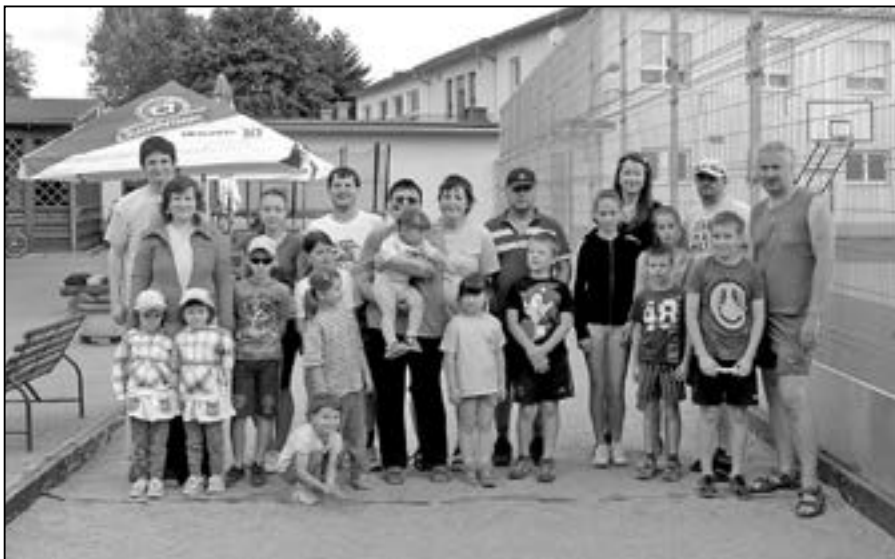
Turnaje župy Velehradské se zúčastnili i orli ze Starého Města.