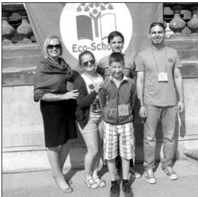
Pětičlenná delegace učitelů a žáků Základní školy Staré Město převzala v Senátu titul Ekoškola.