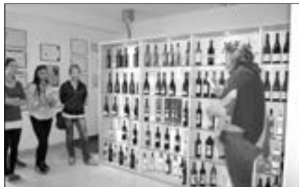
Chlapci a děvčata ze třídy gymnázia 3. H navštívili Zámecké vinařství Bzenec, s. r. o.

Oslovené firmy nám vycházejí vstříc, berou tuto aktivitu jako prezentaci podniku, reklamu svých výrobků a získání nových zákazníků. Jejich pracovníkům patří velké po-