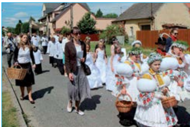
Slavnost byla hojně navštívena, farníkům přálo počasí.