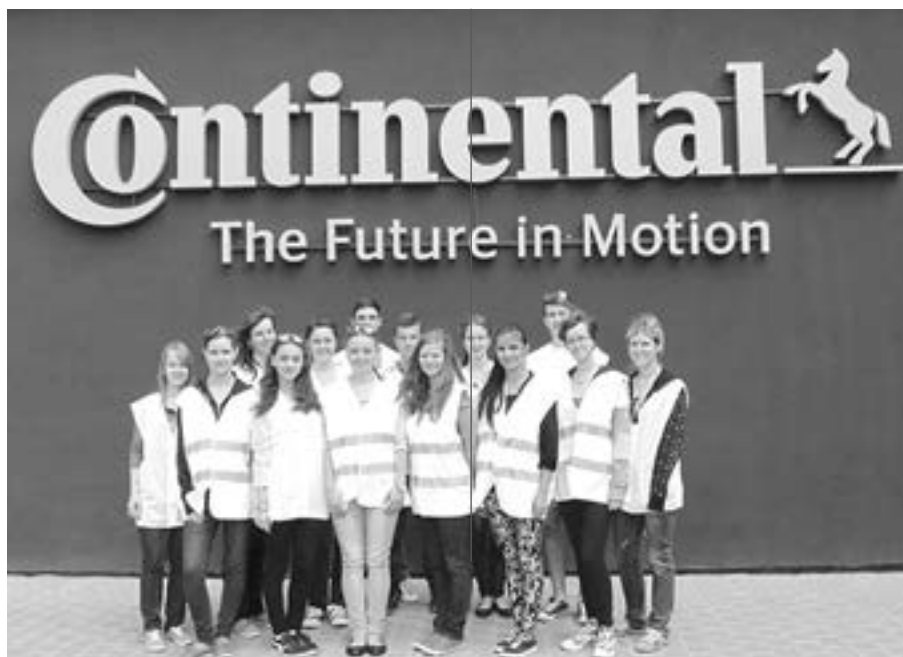
Studenti ve firmě Continental Barum, s. r. o. Otrokovice.