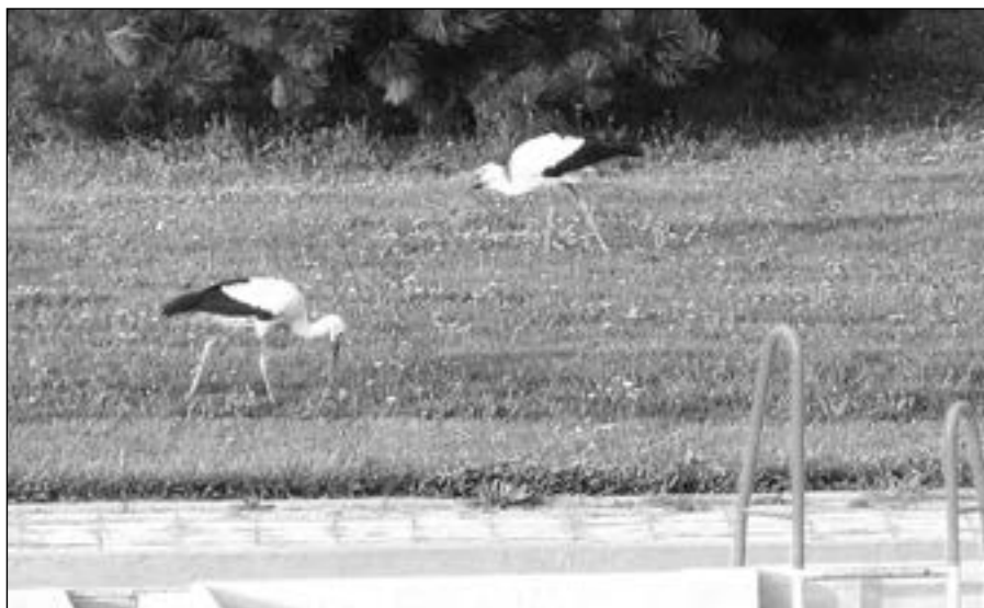
Jakmile to počasí dovolí, na koupališti bude otevřeno. Na snímku první návštěvníci koupaliště - čapí inspektoři.