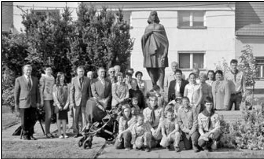
Společná fotografie účastníků pietního aktu.