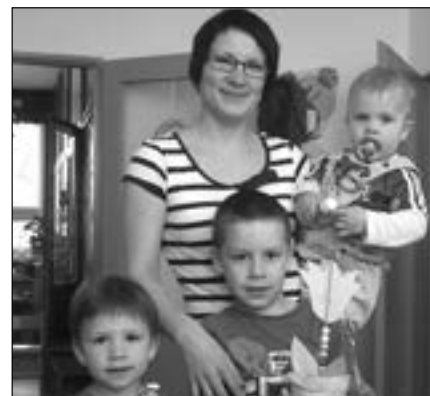
Tak se podívejte, jací jsme šikulové.