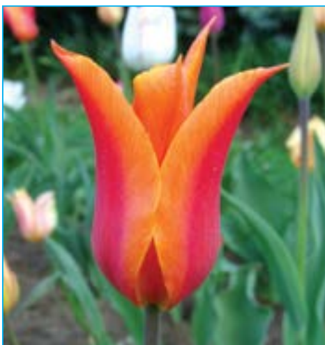
Krásně kvetly tulipány.