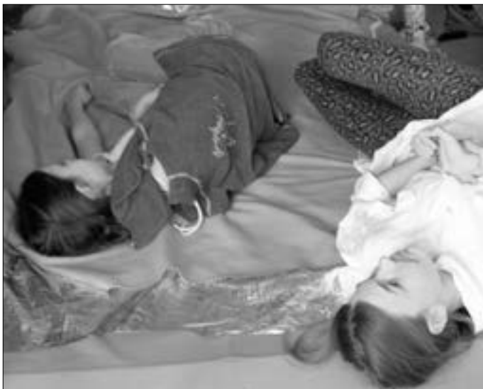
Družstva mladých zdravotníků se zdokonalila v poskytování první pomoci.