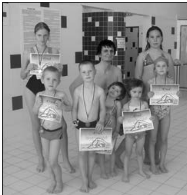
Úspěšní plavci z jednoty Orel Staré Město.