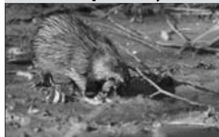
Ondatra se zdržuje v blízkosti vodních toků.