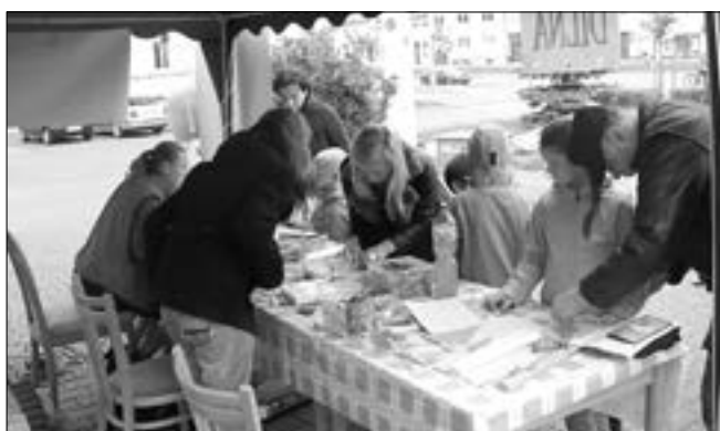
Tvořivá dílna na stanovišti u radnice v rámci prvního Dne rodiny.