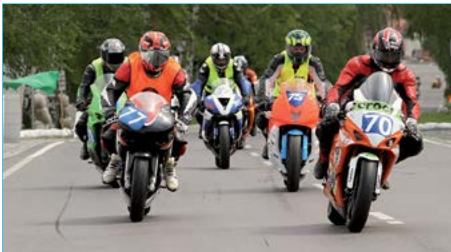
Celkem 36 jezdců kategorie Supermono a TWIN na Slováckém okruhu.