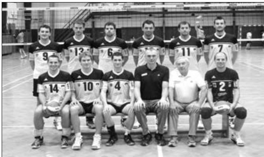
Extraligoví volejbalisté VSK Staré Město v ročníku 2012/2013.