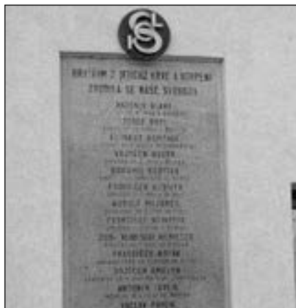
Během 2. světové války bylo vězněno kolem 12 tisíc sokolů, z toho 3390 bylo umučeno nebo popraveno. Sokoli ze Starého Města mají pamětní desku na budově sokolovny.

2005 a 15. září 2006 byla stavba zkolaudována. Nejednalo se jen o rekonstrukci, ale část objektu byla přistavena. Podél Tyršovy ulice bylo odstraněno oplocení a vybudováno parkoviště pro 25 auto-