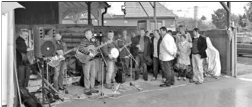
Bylo nevládné počasí, příchozí se chránili před deštěm v přístřešku. Zahrála kapela Štrůdl.