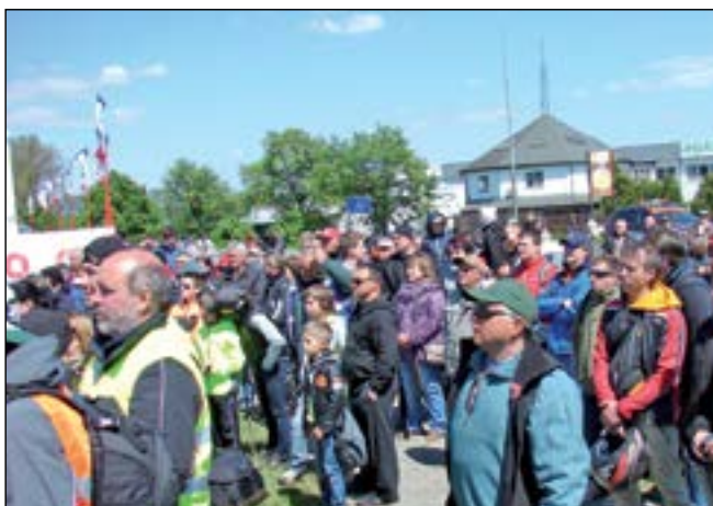
Diváci sledují u Tradixu na Huštěnovské ulici vyhlášení vítězů doprovodního programu.

Třída Klasik do 750 ccm „O cenu Veterán klubu Kunovice“. V nejsilnější kubatuře na nejvyšší stupínek vystou-