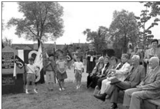
Nejstarší sokolská generace společně s dětmi při zahájení oslav.