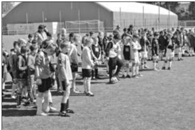
Družstva malých fotbalistů při nástupu.