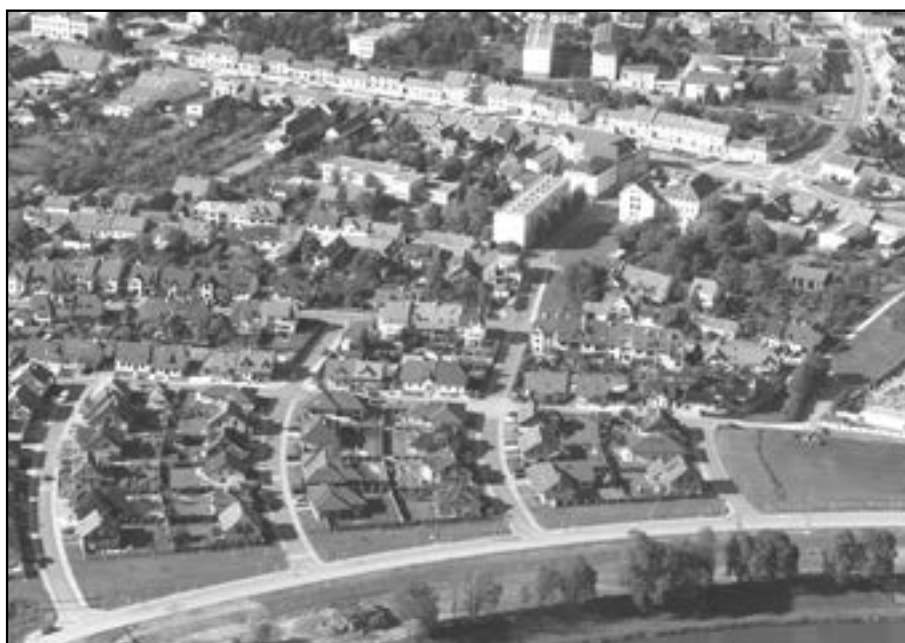
Letecký snímek jižní části Starého Města. V popředí lokalita Trávník, nad ní ulice Sées, ulice Za Radnicí, náměstí Hrdinů, ulice Za Mlýnem a část Velkomoravské ulice.