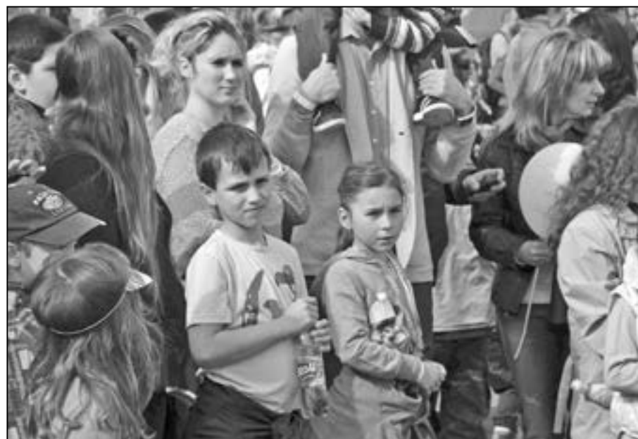
Na Den Země přišlo celkem 9624 návštěvníků.