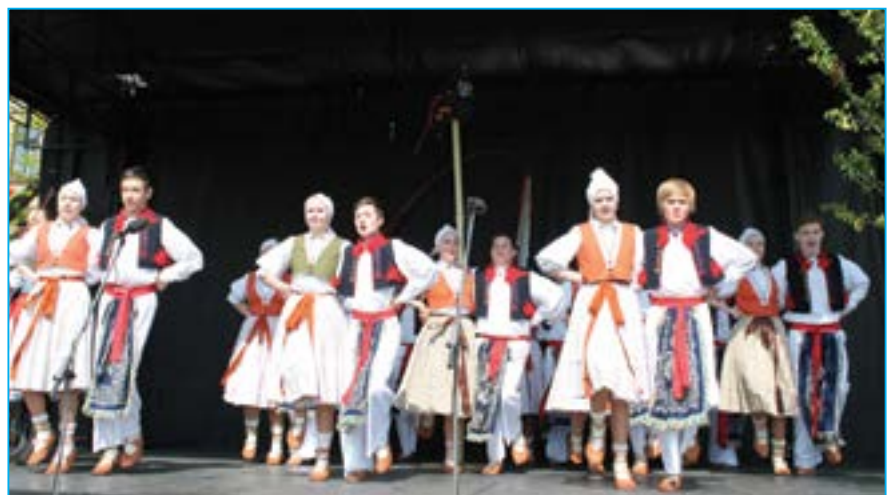
Vystoupení Dolinečky III na Velikonočním jarmarku v Uh. Hradišti.