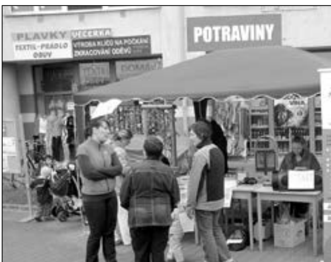
SVČ Klubko mělo informační stánek na parkovišti u radnice. V jeho blízkosti pak probíhaly hry a soutěže pro děti.