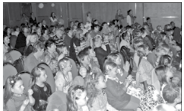
Divadelní sál se zaplnil dětmi, rodiči a prarodiči, kteří se přišli podívat na své potomky.