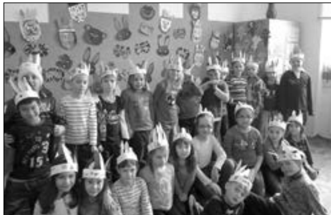
Indiáni z 1. B se vyzdobili pěknými čelenkami.