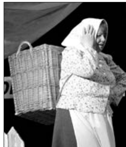
Vzpomínka na divadelní představení Tetička z Radějova.