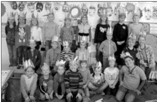
Jak se Vám líbí Indiáni z 1. A?