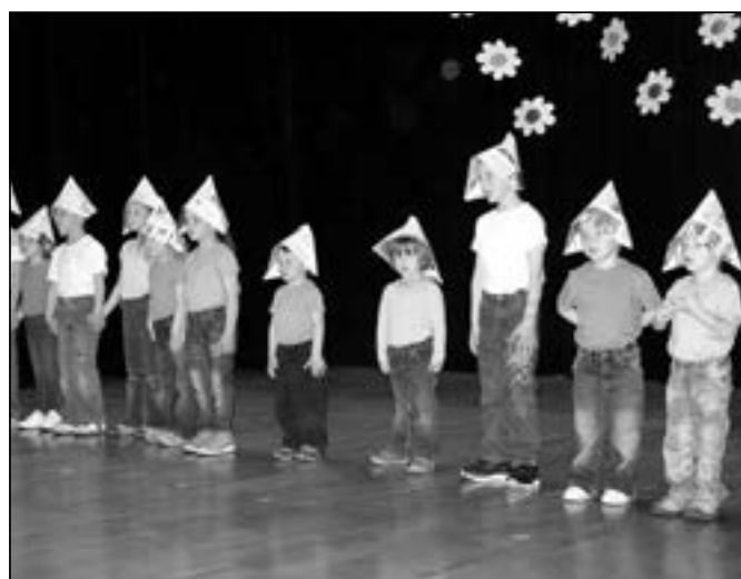
Na jevišti „Večerníci“ z Křesťanské mateřské školy Za Radnicí.