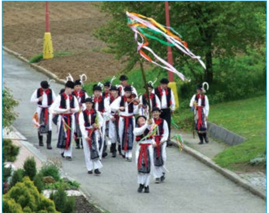
Šlaháči v ulicích Starého Města.