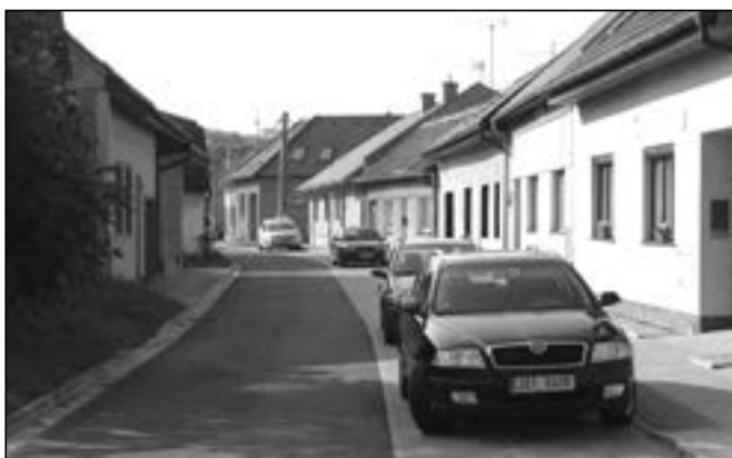
Vnitřní komunikace v Obilní čtvrti s novými parkovacími místy.