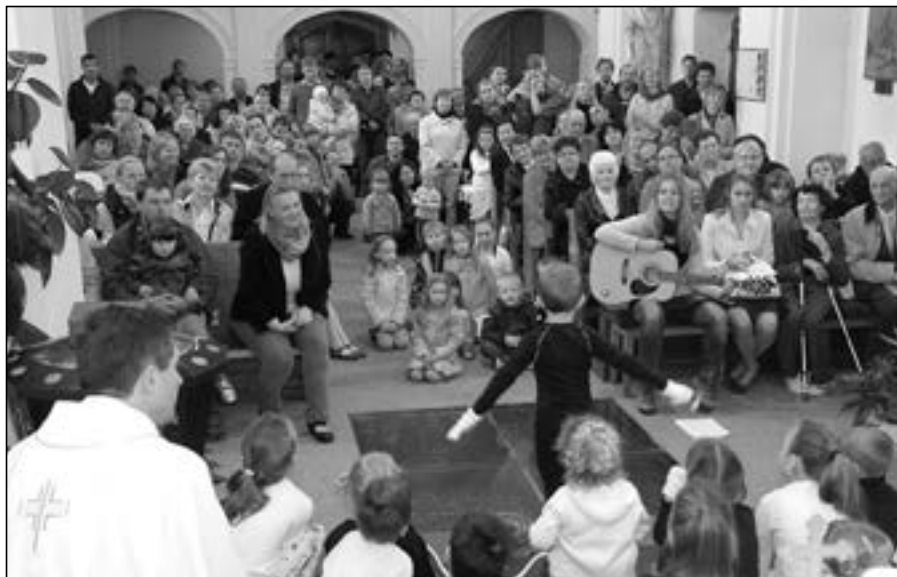
Přání maminkám k svátku na dopolední mši v kostele sv. Michaela. Náš kostelíček na hřbitově je sice malý, ale dobrých lidí se vejde...

Odpoledne bylo na programu ve společensko – kulturním cent-