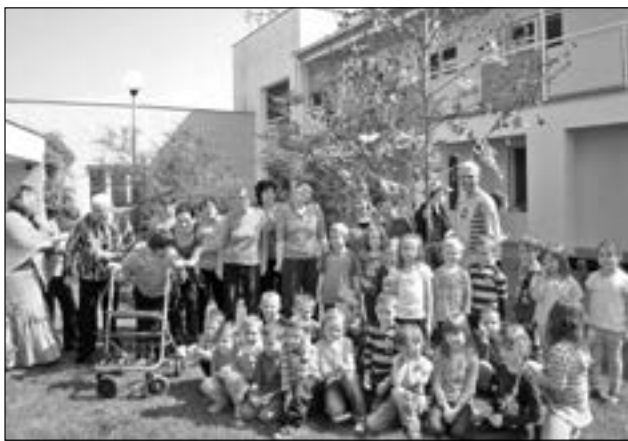
Děti společně s klienty domova na Kopánkách.