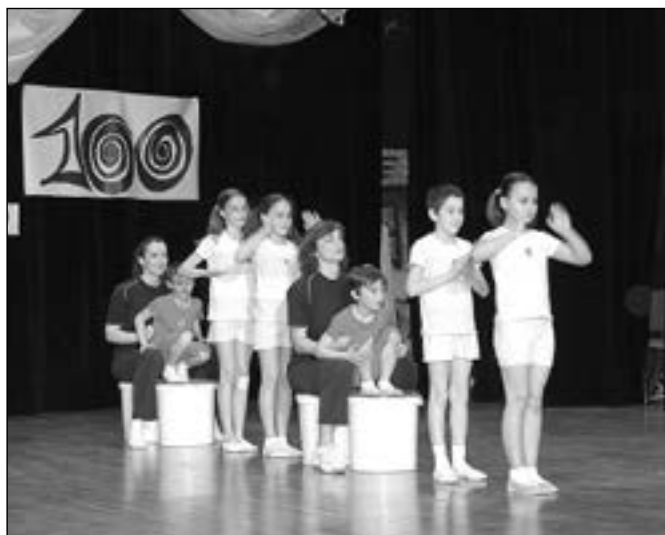
Skladba dětí Ať žijí duchové.