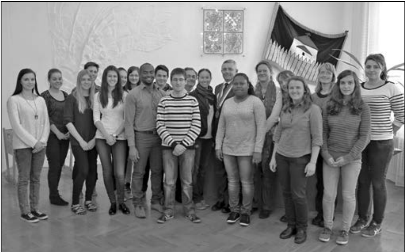
Společná fotografie studentů z města Sées v závěru setkání na radnici.