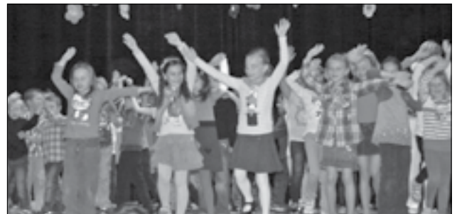
Děti z 1. tříd si zadováděly na pódium.