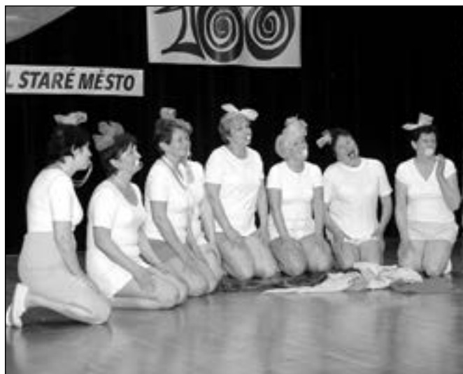
Sokolky si připomněly své dětství v jednom vystoupení a to s humorem sobě vlastním.