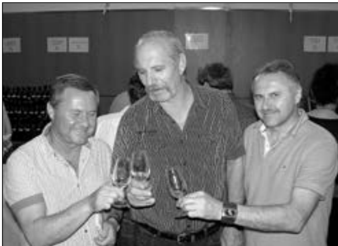
Bílé víno okoštovali i členové Spolku přátel slivovice Staré Město.