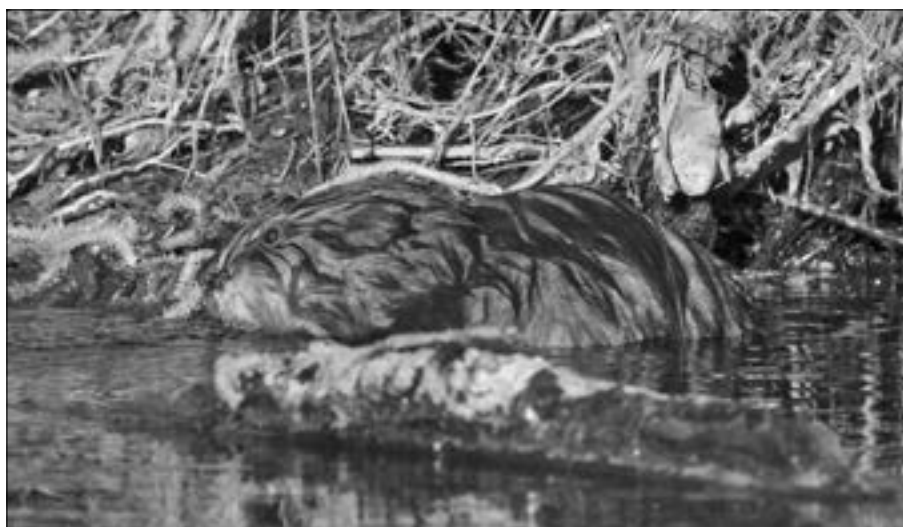
Opravdu to není bobr, je to ondatra.