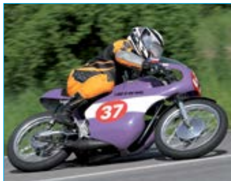
Mílan Šobáň v závodě Klasik 175 ccm.