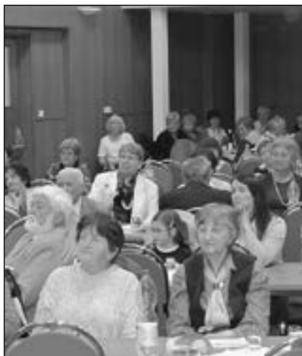
Účastníci oslavy v divadelním sále.