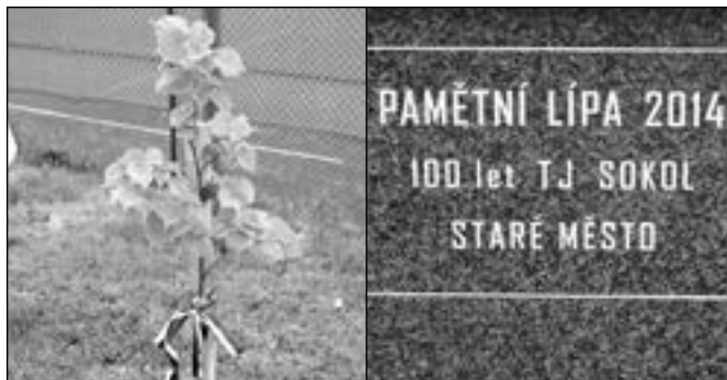
Pamětní lípa 2014.

majetku města a konečně se začalo s rekonstrukcí celého objektu. Hlavní dodavatelem stavby byla firma Stavby Boršice, která odvedla velký kus práce. Intenzivně pracovali od konce roku