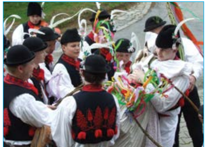
Jedno ze zastavení u děvčice ze souboru.