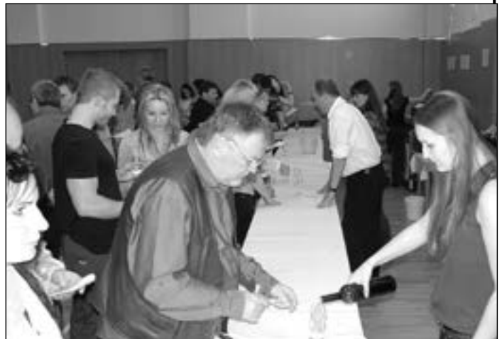
Ve sportovním sále byla připravena k ochutnání bílá vína.