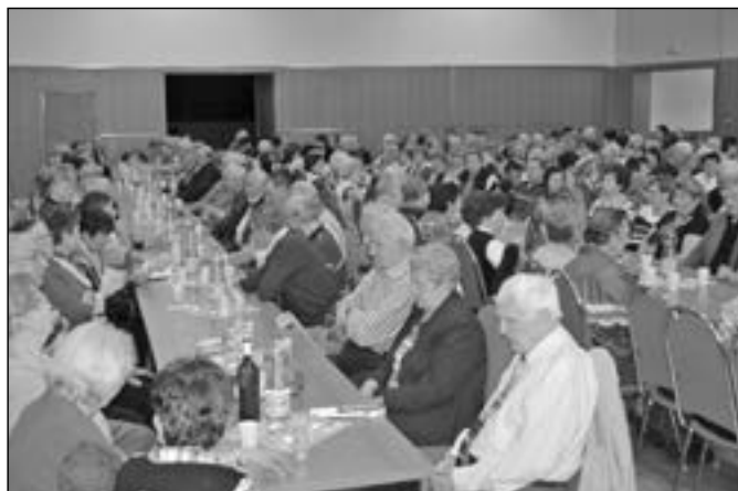
Stejně jako v minulých letech se sportovní sál SKC – sokolovny zaplnil do posledního mísa.