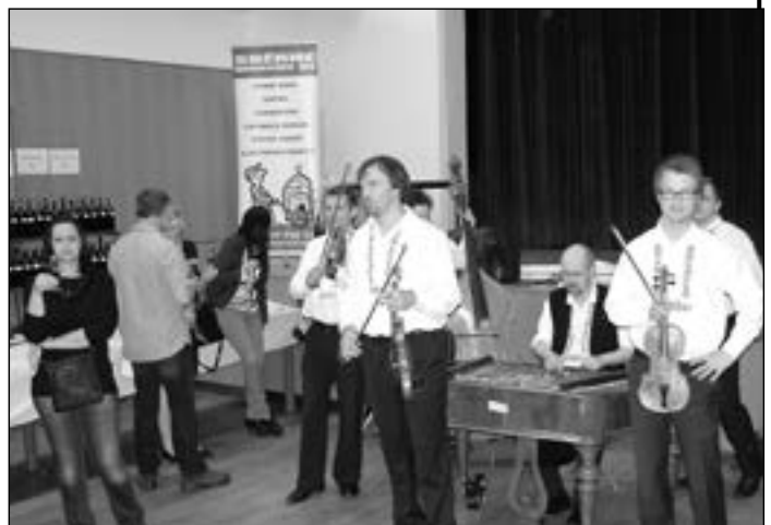
K dobré pohodě zahrála cimbálová muzika Mladí Burčáci.