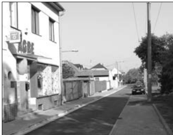
Komunikace, chodníky a nová parkovací místa v Obilní čtvrti v blízkosti potoka Salašky.