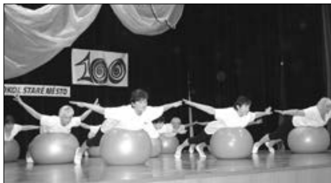
Cvičení žen s velkými míči.

Po úvodní části oslav, které se odehrály na prostranství před sokolovnou, se všichni přítomní přesunuli do divadelního sálu. Na programu byla malá sokolská akademie, viděli jsme vzpomínku na divadelní