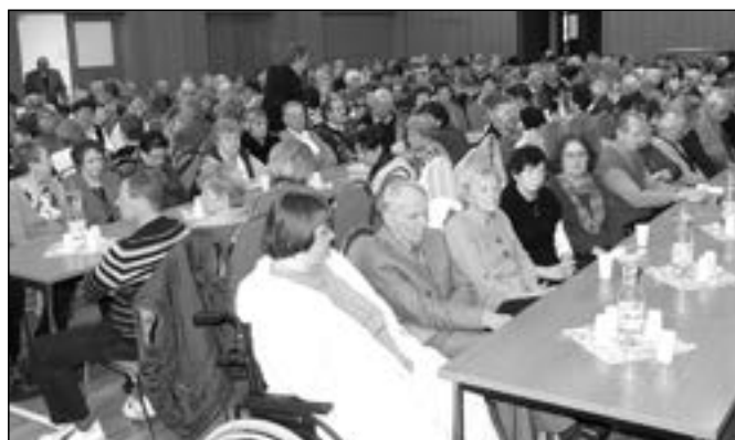
Zdravotně postižení občané se na svou výroční schůzi pokaždé těší. Čeká je totiž velmi zajímavý program, který obětavě připravuje výbor organizace.