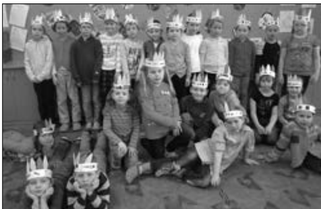
Chlapci a děvčata z 1. C si vymýšleli vlastní indiánská jména.

ný úkol žáci dostávali barevná pera na čelenku. V závěru si žáci vymýšleli vlastní indiánská jména a složili z vypočítaných matematických příkladů obrázek kánoe. Vyvrcholením projektu bylo setkání indiánů a jejich náčelnic na „Indiánském turnaji“ v pátek 25. dubna na zahradě kmene Střediska volného času Klubko ve Sta-