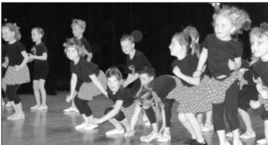
„Berišky a Mravenečci“ z MŠ Rastislavova při vystoupení ke Dni matek.