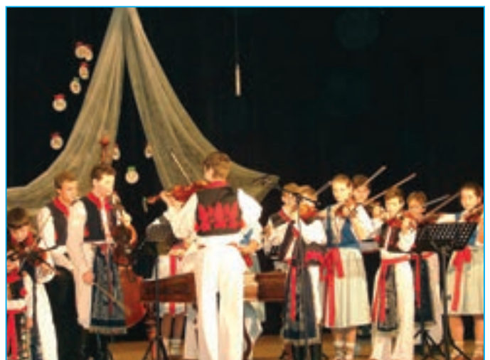
Cimbálová muzika ZUŠ.