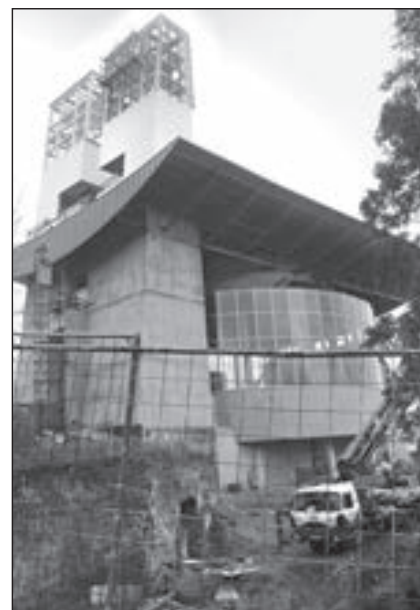
V blízkosti kostela sv. Ducha v prosinci pokračovaly stavební práce při výstavbě Event centra.