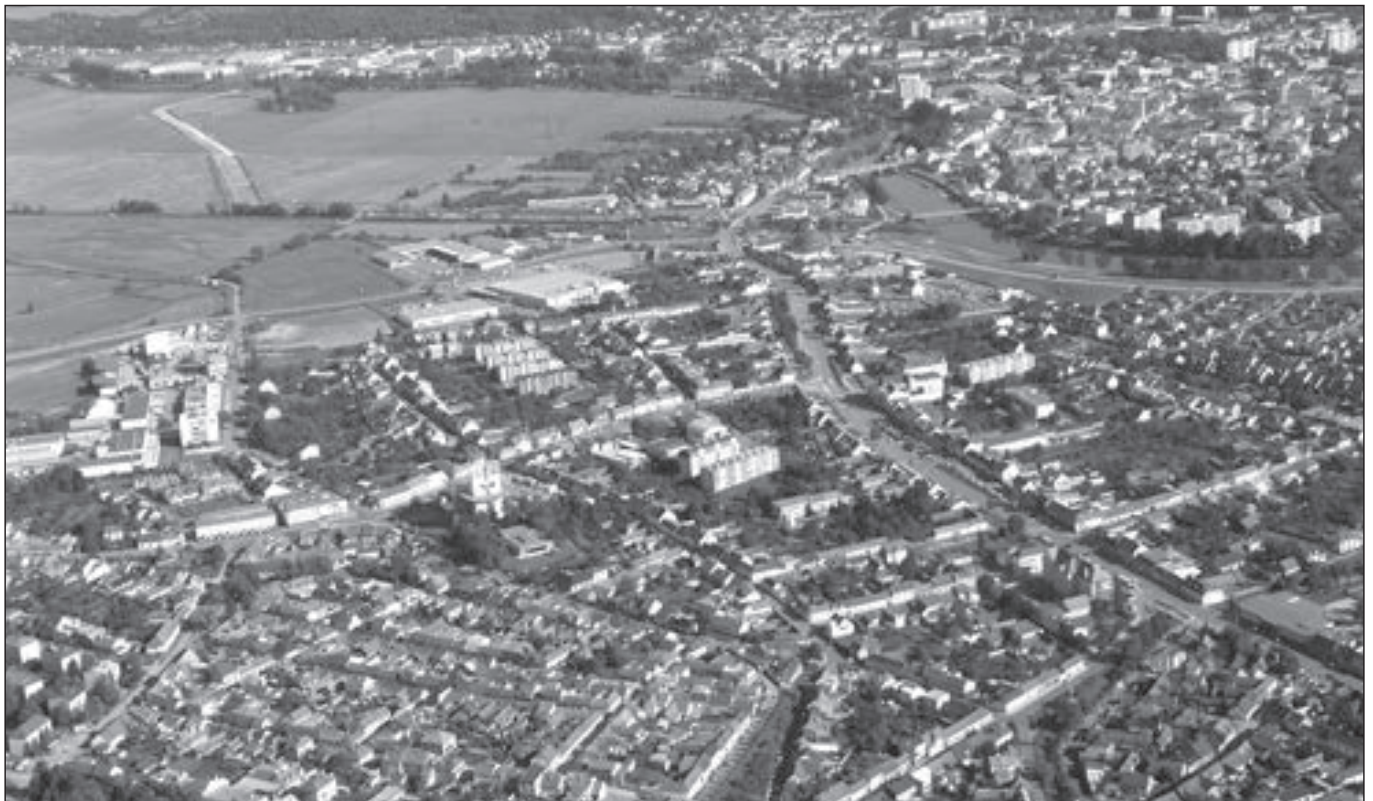
Letecký snímek Starého Města ve směru od řeky Moravy v září 2013.