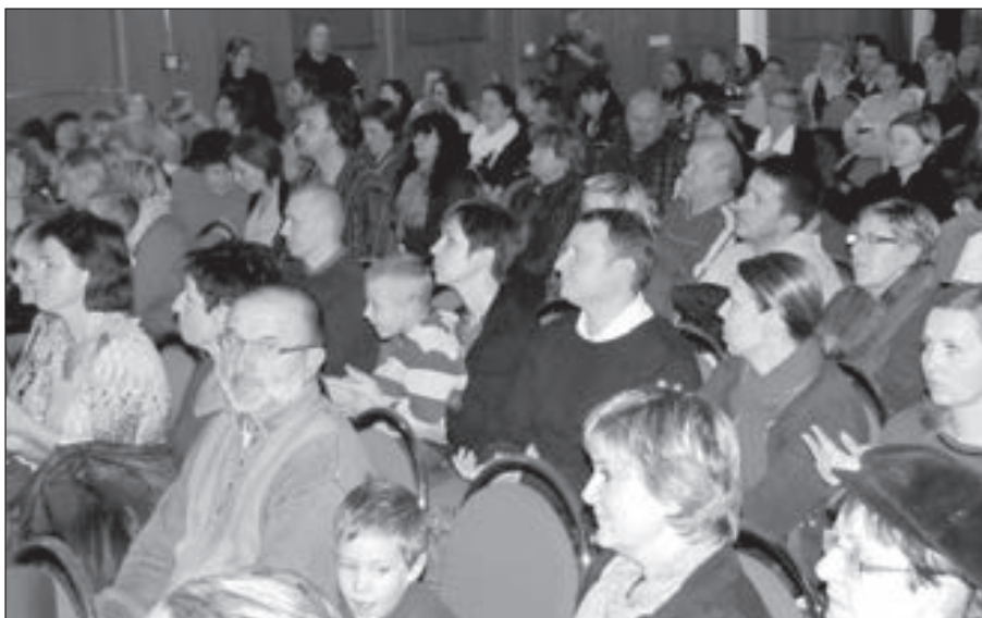
Diváci v divadelním sále SKC sledují malé umělce při vystoupeních.