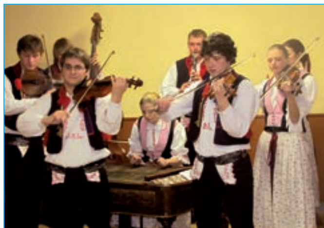
Cimbálová muzika Bálešáci.