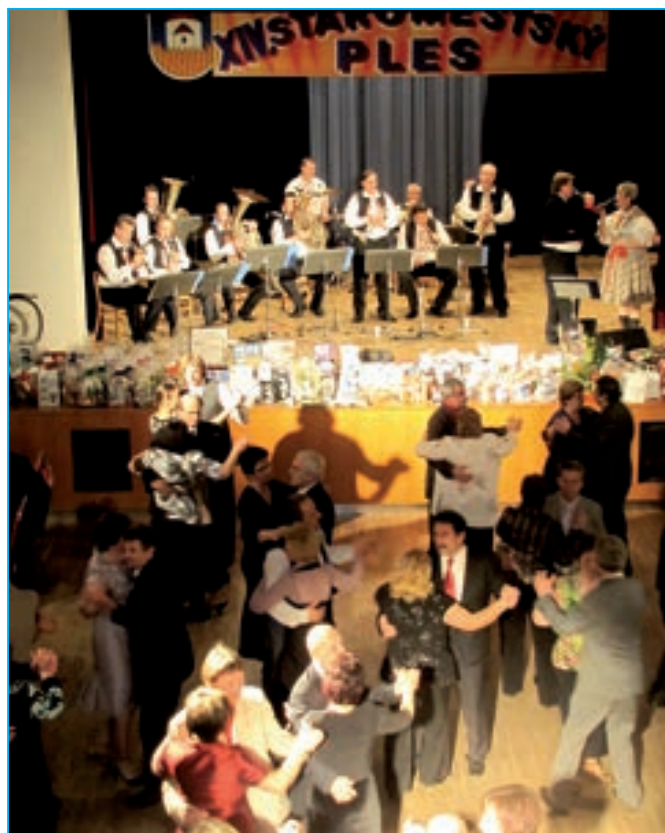
Na plese bývá dobrá nálada a nechybí bohatá tombola.