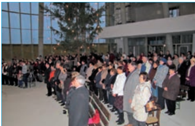
Na rozloučenou si všichni diváci zapívali vánoční koledu Narodil se Kristus Pán.