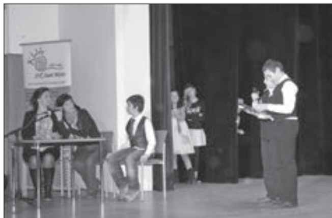
Muzikál byl na programu na konci první části bloku vystoupení.