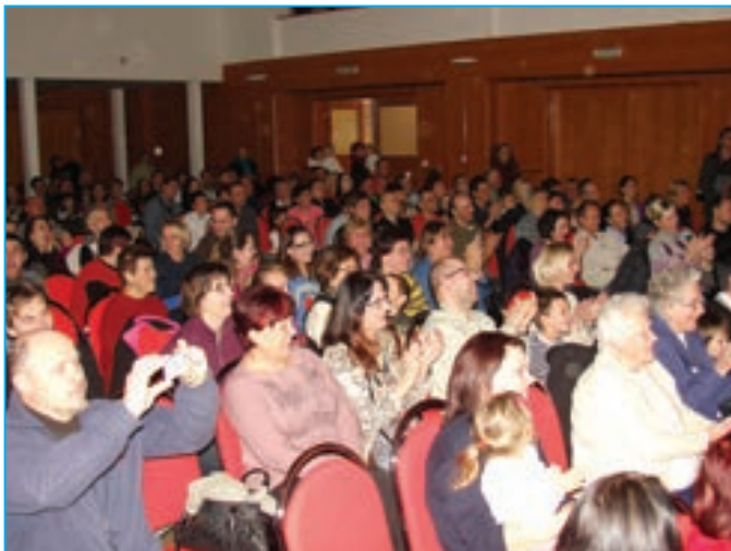
Diváci v sále se velmi bavili.