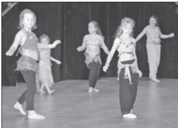
Vánoční besídka Střediska volného času Klubko se uskutečnila v úterý 17. prosince. Více fotografií a informací najdete na straně 26.