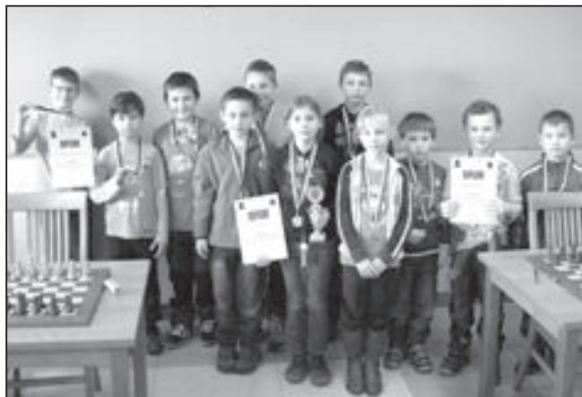
Úspěšní šachisté ze Základní školy Staré Město.