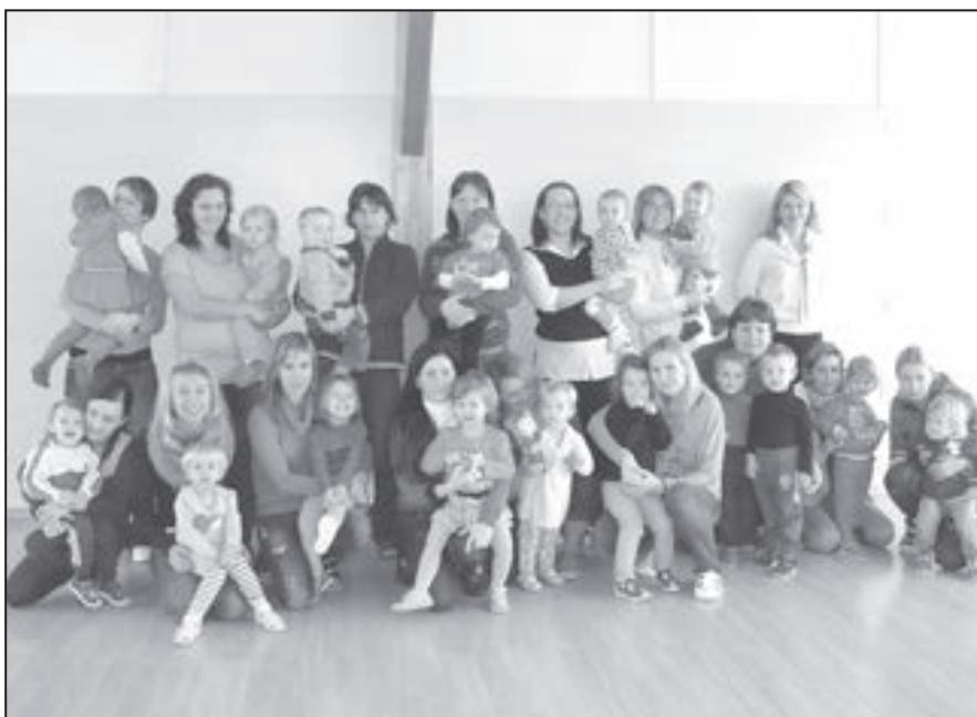
V pondělí 6. ledna se konala ve Čtyřlístku oblíbená Mamkavárna. Na snímku maminky s dětmi.