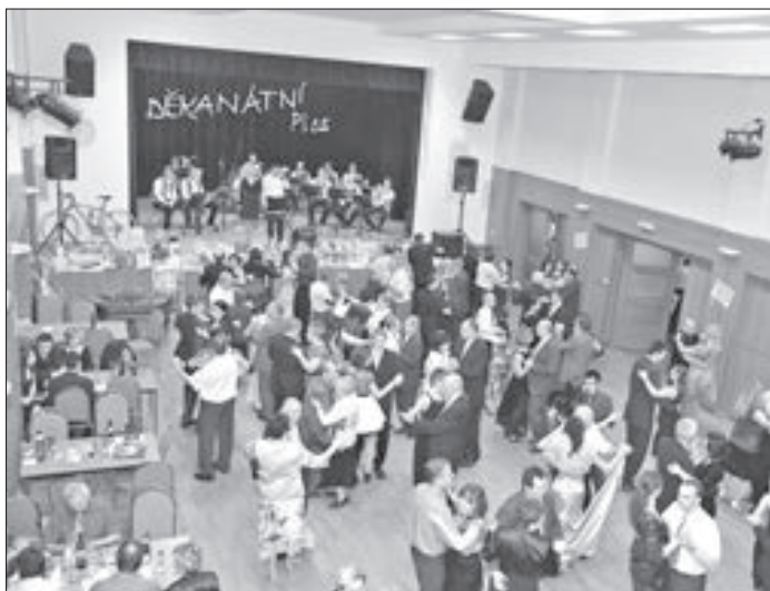
Taneční parket se zaplnil krátce po zahájení plesu. V divadelním sále hrála střídavě Staroměstská kapela a Cimbálová muzika Bálašáci.