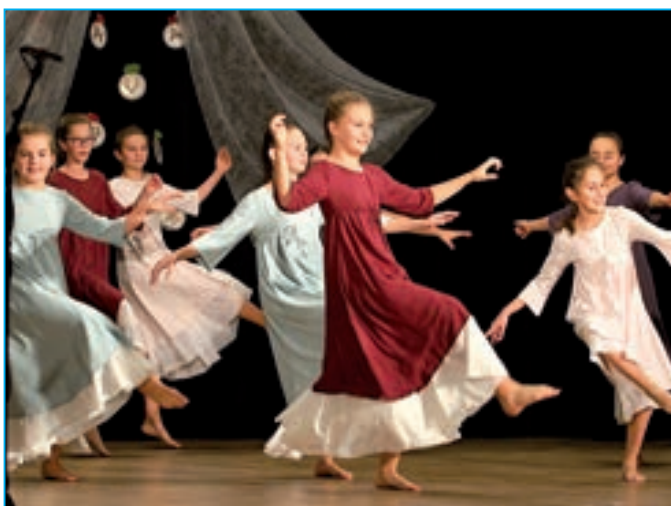
Dívky z tanečního oboru ZUŠ při vystoupení.