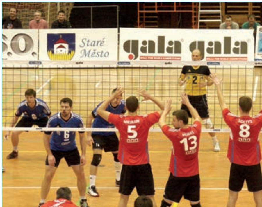
V prvním setu Staroměstšané (v modrých dresech) od začátku těsně vedli a v dramatickém závěru setu strhli vítězství na svou stranu.