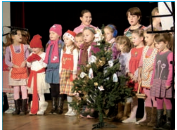
Děti z Orla si připravily malý vánoční stromeček.