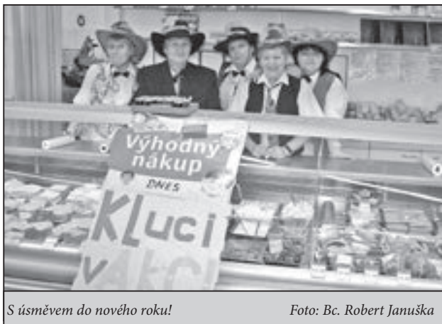
S úsměvem do nového roku!