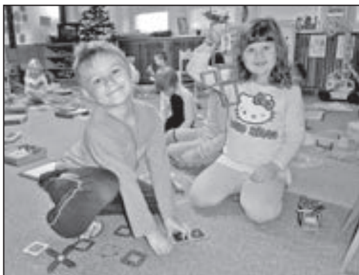
Děti čekalo pod stromečkem radostné překvapení.