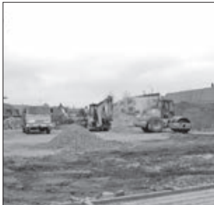
Ve středu 18. prosince 2013 pokračovaly stavební práce při výstavbě Event centra na budovaném náměstí Velké Moravy.

Věcné břemeno spočívá v povinnosti povinného strpět umístění a provozování místní komunikace – chodníku, jehož technické parametry jsou uvedeny a od-