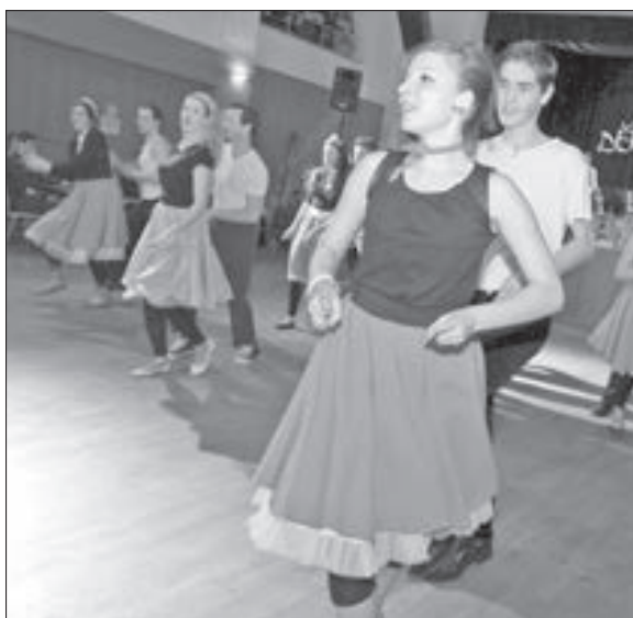
Devět tanečních párů z Uherského Hradiště zatančilo zajímavou scénou z filmu Pomáda.