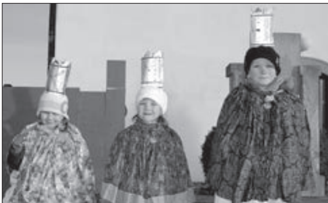
Společné foto před kostelem sv. Michaela.