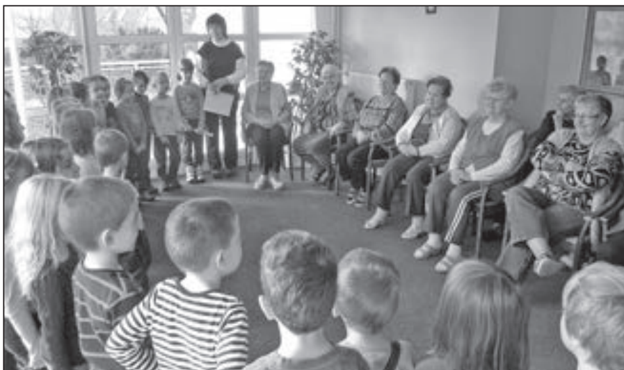
Obyvatele Domu s pečovatelskou službou v ulici Bratří Mrštíků potěšily děti ze školky Komenského.