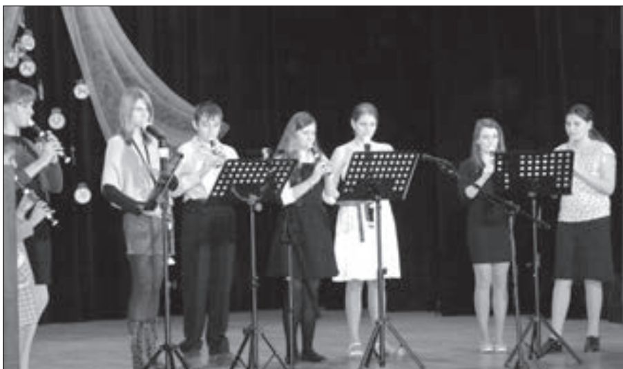
Soubor zobcových fléten ze 4. ročníku hraje skladbu F. X. Grubera Tichá noc.