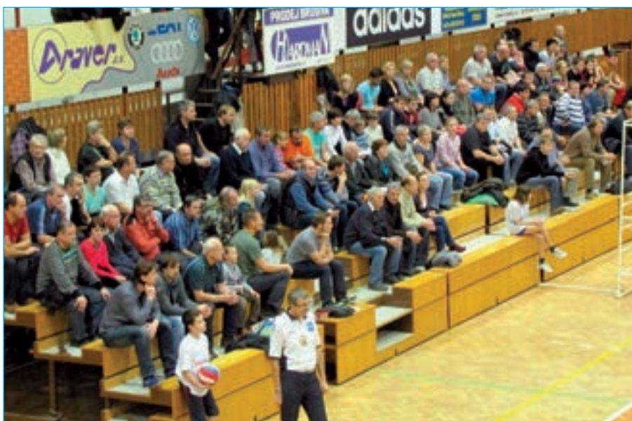
Diváci se dočkali prvního vítězství domácích.

Příští číslo Staroměstských novin vyjde 27. února. Uzávěrka je 17. února 2014.