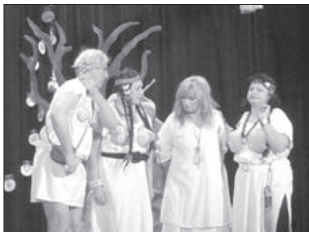
Divadelní představení Dívčí válka sukces.