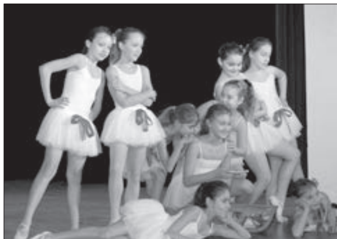
Tanečnice ze 4. ročníku zatančily skladbu Sáňky od Johanna Strause.