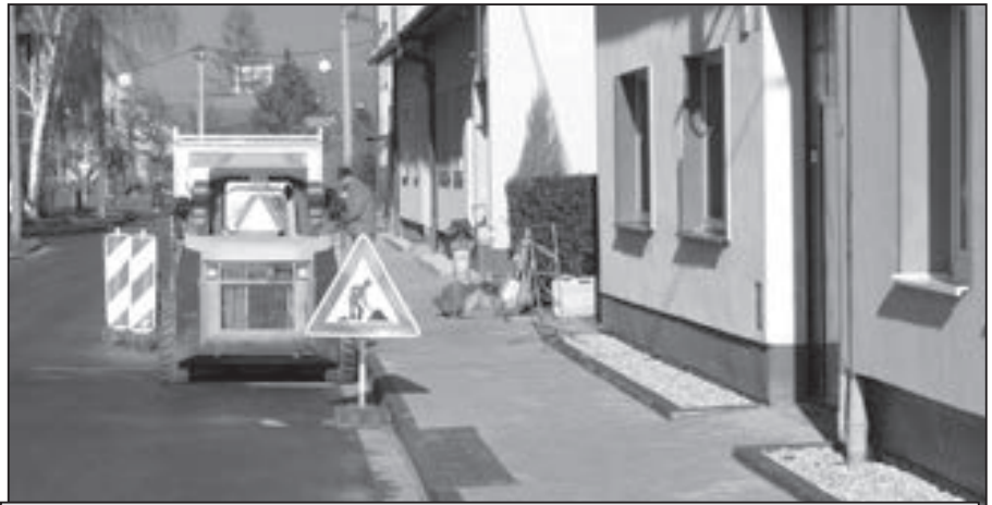
Koncem minulého roku byla v Michalské ulici provedena rekonstrukce chodníků.

1.4 zveřejnit záměr na pronájem zemědělské stavby – garáže bez č. p. na