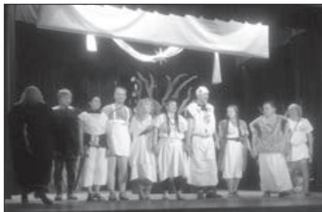
Závěrečná děkovačka byla dlouhá. Představení Dívčí válka je totiž nejnavštěvovanější divadelní komedie všech dob pojednávající o věčném boji mezi muži a ženami.