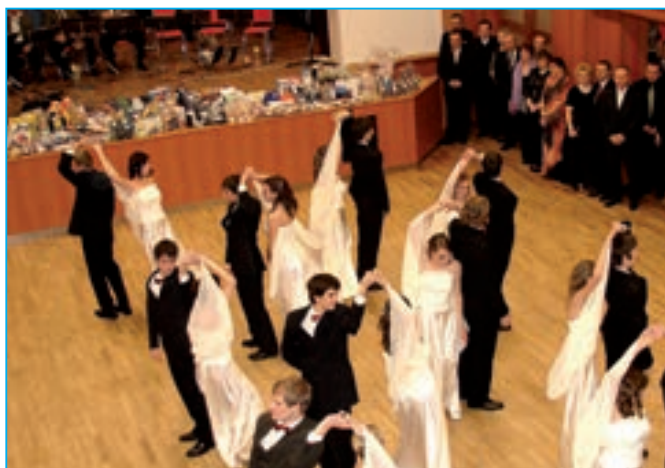
Předtančení studentů SOŠ a Gymnázia Staré Město.