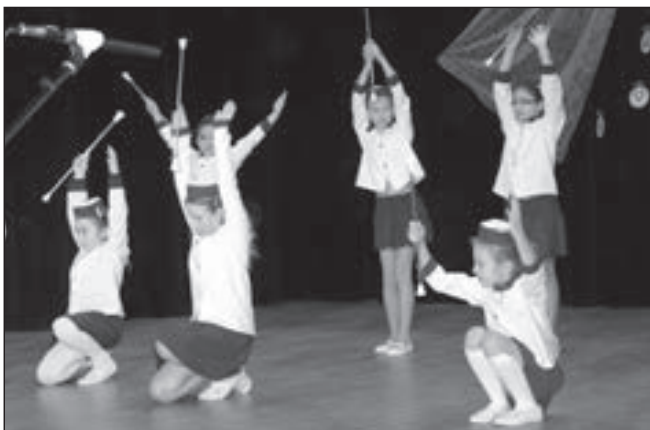
Po skončení vystoupení mažoretok následoval dlouhý potlesk.