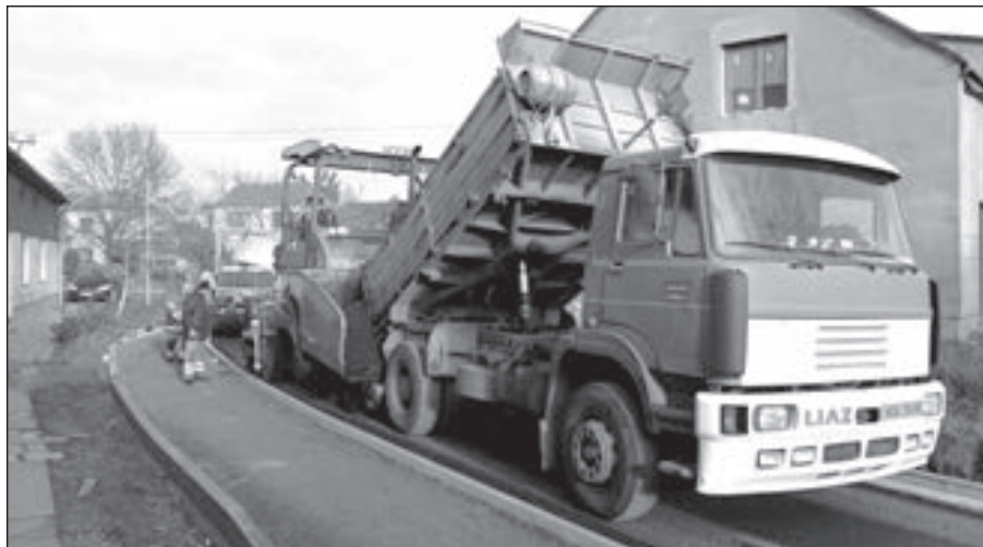
V úterý 10. prosince probíhaly dokončovací práce v Obilní čtvrti. Pracovníci stavební firmy položili živičný koberec na místní komunikaci.