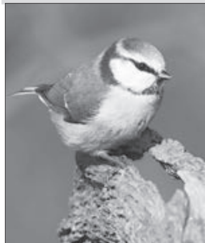
Sýkora modřinka je častým hostem na krmítku.