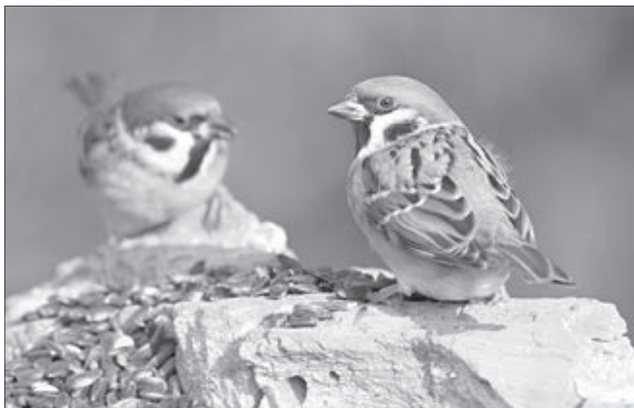
Vrabci přilétají na krmítko a pochutnávají si na semínkách slunečnice.