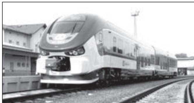
Motorová jednotka Českých drah řady 844.0 dostala podle tvaru název „Žralok“. Zajišťuje také do Starého Města na přímých spojích Vizovice – Zlín – Staré Město (příj. 20:10) – Uherský Brod a ve směru opačném na spoji Bojkovice – Staré Město (odj. 5:01) – Otrokovice – Zlín – Vizovice.