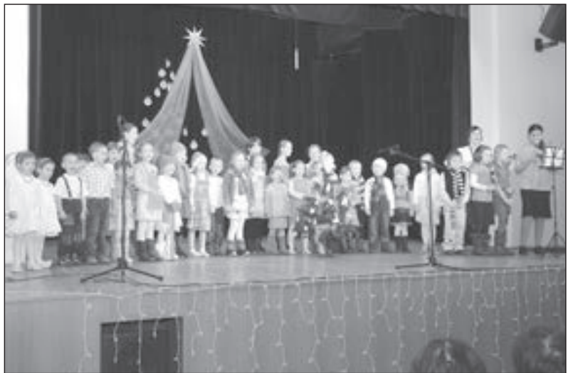
Vystoupení dětí z Orla se divákům velmi líbilo, za což byli chlapci a děvčata odměněni velkým potleskem.