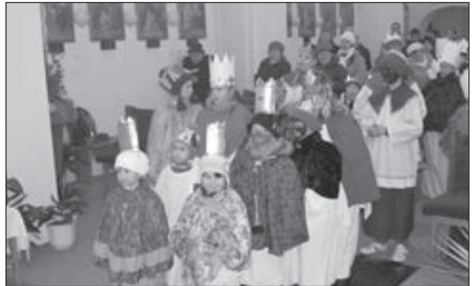
Celkem 23 skupinek koledníků K + M + B se vydalo pomoci potřebným.