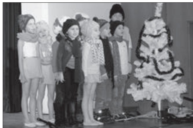
Děti z přípravné hudební výchovy při sborovém zpěvu u stromečku.