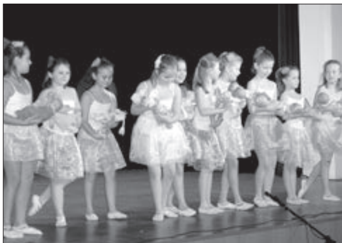
Tanec dívek 3. ročníku s názvem S panenkou od Petra Iljiče Čajkovského.