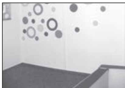
Nová výzdoba herny Čtyřlístku.