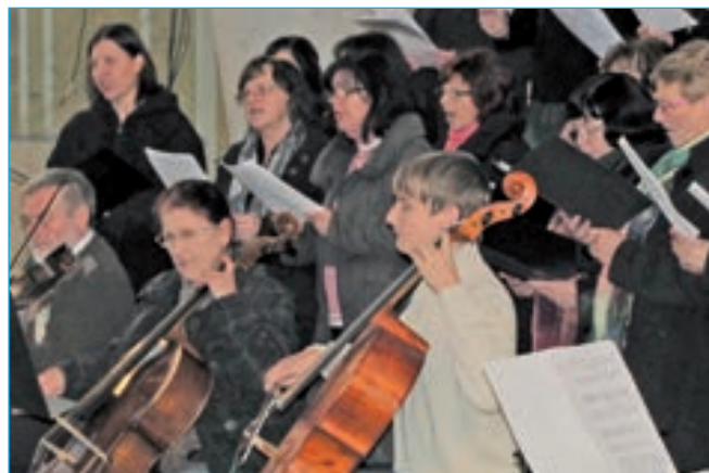
Chrámový sbor v kostele Svatého Ducha.