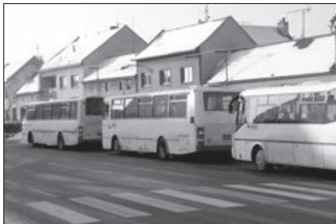
Nejfrekventovanější autobusová zastávka na území Starého Města je zastávka u Lidového domu.

Tři páry spojů jedou v pracovní dny z Jalubí přes Staré Město (odj. ze zastávky Staré