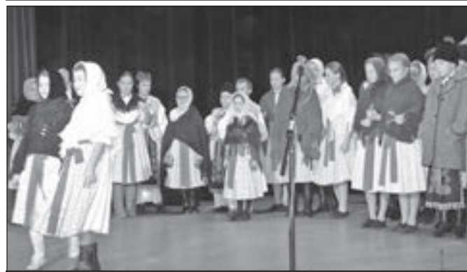
Dolinečka I při vánočním pásmu.