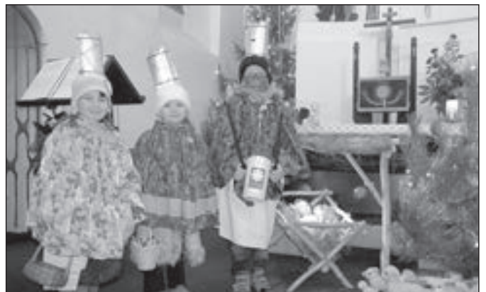
Malí koledníci se těší na občůzku.