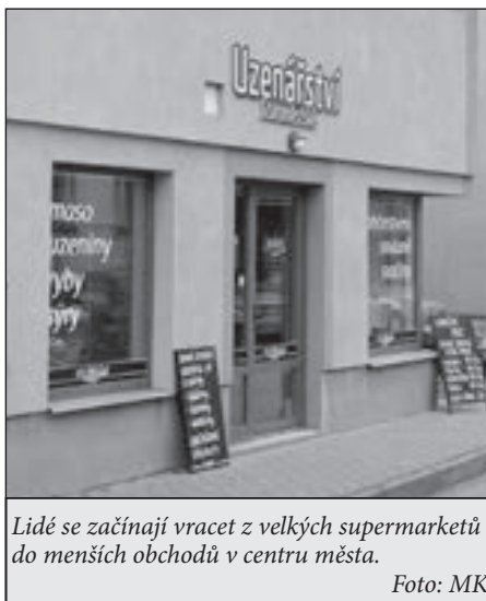
Lidé se začínají vracet z velkých supermarketů do menších obchodů v centru města.