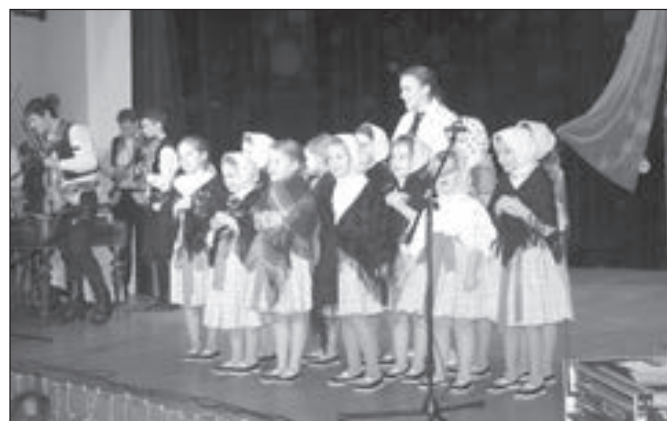
Chlapci a děvčata z Dolinečky II si své vystoupení užívali.