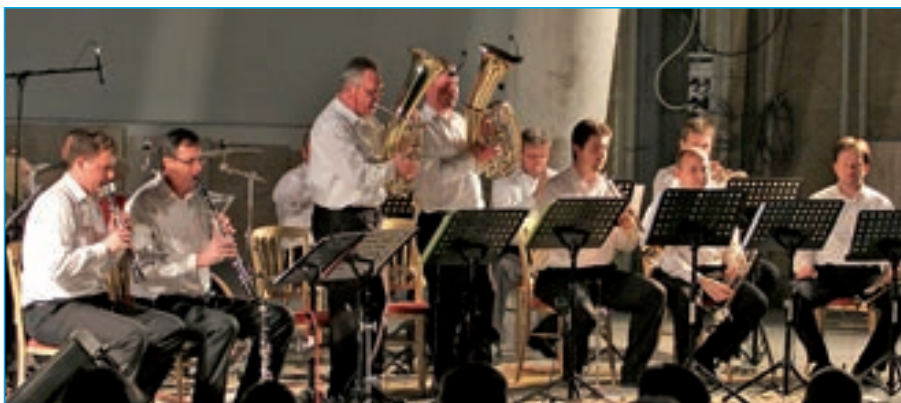
Staroměstská kapela koncertuje v kostele Svatého Ducha.