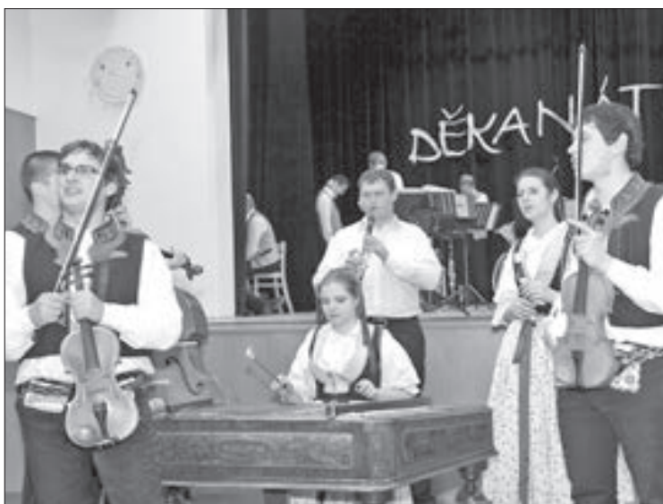
Cimbálová muzika Bálašáci se letos přemístila z horního do divadelního sálu, což přivítala většina návštěvníků plesu.