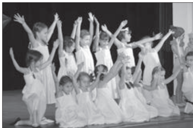
Malé tanečnice se loučí s diváky.