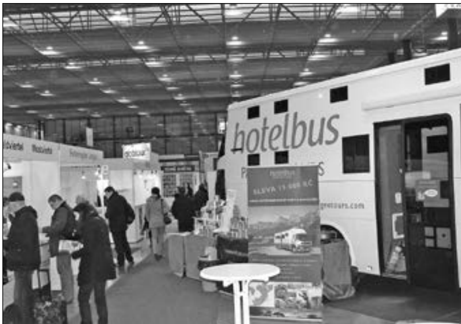
Zájemci o cestování, kteří si zakoupili zájezd přímo na veletrhu, mohli ušetřit mnohatisícové částky.

Staré Město je známo jako křižovatka cyklostezek, které vedou ve směru na Huštěnovice, Kostelany nad Moravou, Velehrad, Uherské Hradiště a Zlechov.