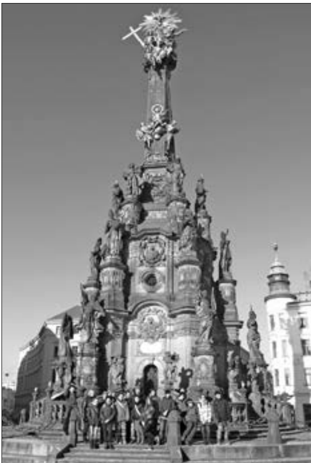
Chlapci a dívky z turistického kroužku v Olomouci obdivovali sloup Nejsvětější Trojice, vrcholné dílo středověkého baroka, který je od roku 2000 zapsán mezi památky UNESCO. Je 35 metrů vysoký a jedná se o nejvyšší sousoší v České republice. Byl postaven v letech 1716 – 1754 jako výraz věčnosti Bohu za ukončení morové epidemie. Sloup byl vysvěcen 9. září 1754 za účasti císařovny Marie Terezie.