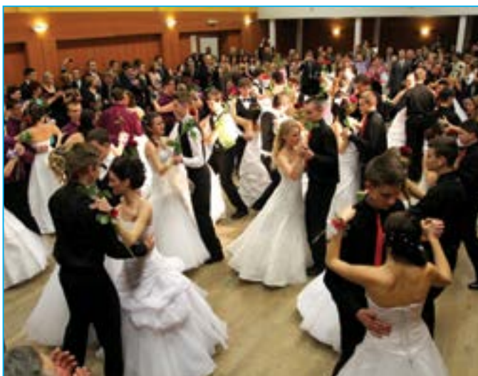
Taneční parket ozdobilo mládí.