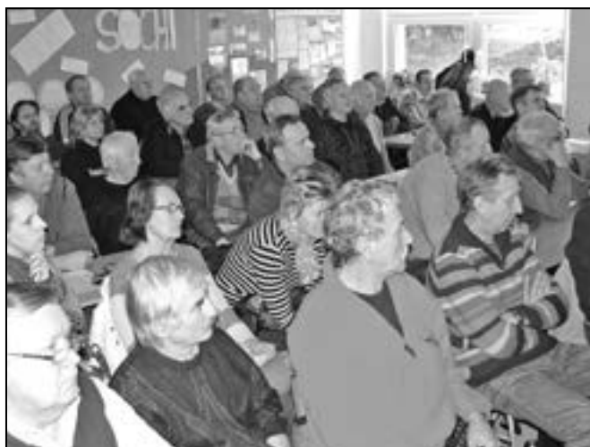
O přednášku byl velký zájem, přišlo 80 zahrádkářů, mezi nimi i několik žen.