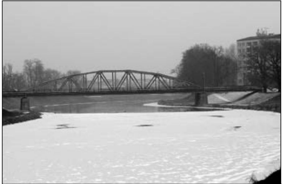
Letošní zima je prozatím nadprůměrně teplá. Po sněhu a ledu ani památka. Přesto jsme 29. ledna zaznamenali zamrzlou řeku Moravu v blízkosti železničního mostu.

Město Staré Město v lednu letošního roku požádalo o dotaci na Státní fond dopravní infrastruktury na lávku přes Baťův kanál. Stejně tak i město Uherské Hradiště na lávku přes řeku Moravu. Obě tyto žádosti se vyhodnocují a čekáme na informaci, zda máme všechno v pořádku. Teprve potom bude následovat vyhlášení výběrového řízení na dodavatele stavby. Taky se nám může stát, že z programu, z kterého chceme opravovat lávku, nebude podpora možná a budeme muset opravu provést bez dotace. To je pak na změnu rozpočtu města a třeba