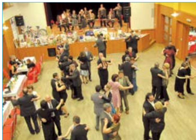
Taneční parket se zaplnil již krátce po zahájení plesu.