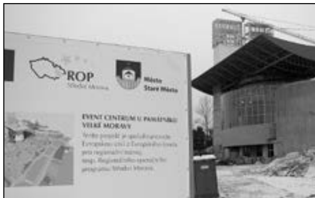
Také přes zimní měsíce pokračuje stavba chrámu Svatého Ducha a Event Centra u Památníku Velké Moravy. Tento projekt je spolufinancován Evropskou unií z Evropského fondu pro regionální rozvoj, resp. Regionálního operačního programu Střední Morava. Text + foto: Milan Kubíček

Je na místě pochválit mladé, kteří pro děti připravují vtipné programy a vydávají časopis Beránek, zábavný a poučný občasník, kde realizují kromě svých svěžích nápadů i příkladný zájem a dobrou vůli, kterou bychom všichni mezi sebou měli vzájemně pěstovat.