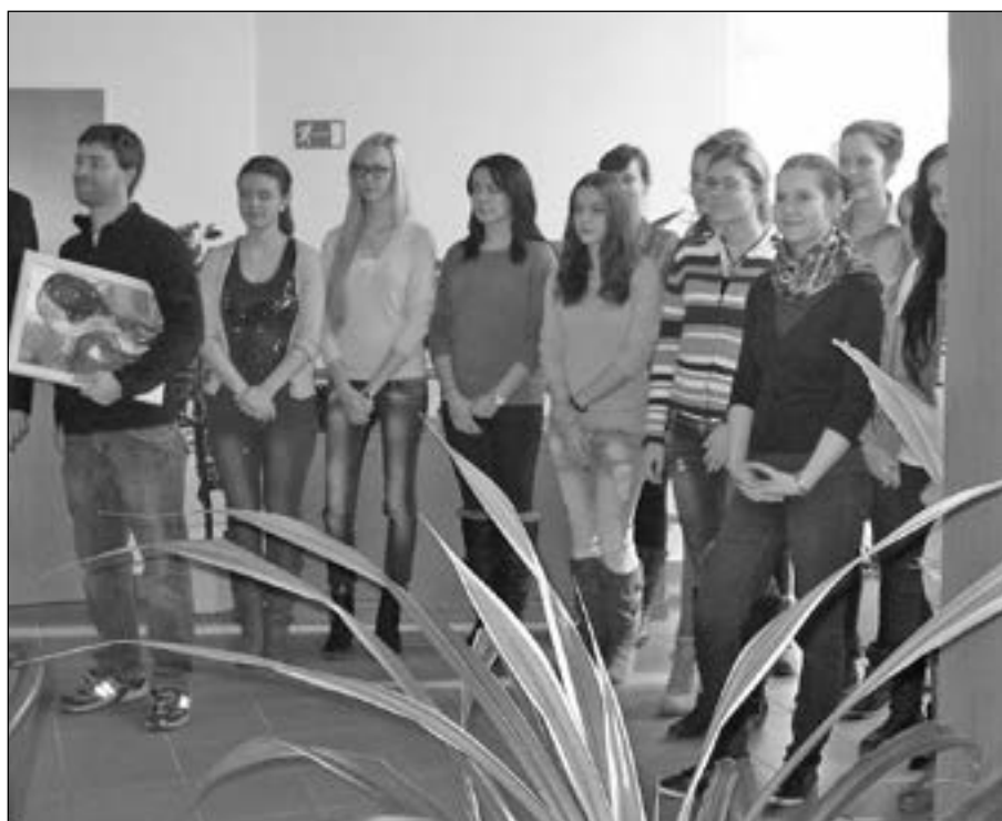
Studenti si prohlédli areál domova.