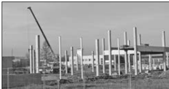
Hobby market je halová stavba se sloupovým nosným systémem kombinujícím železobetonové prefabrikátové a ocelové sloupy. Objekt je založen na velkopřůměrových pilotách. Pohled na staveniště 26. ledna 2014.