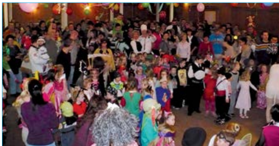
Opravdu bylo letos plno.