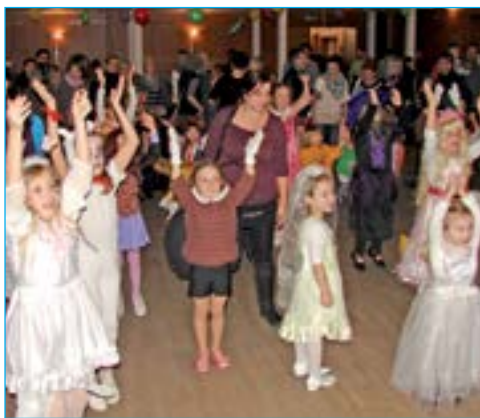
Tanečky na sále.