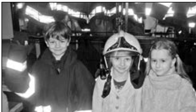
Děti z mateřské školy u hasičů.