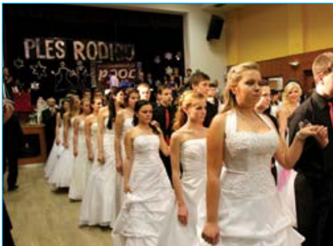
Již od října chlapci a děvčata z 9. tříd pilně nacvičovali.