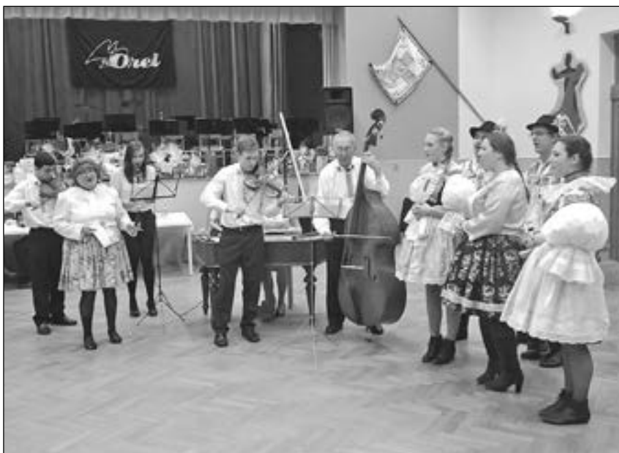
S pásmem písní o víně se představil soubor Písečánek a cimbálová muzika Struna.