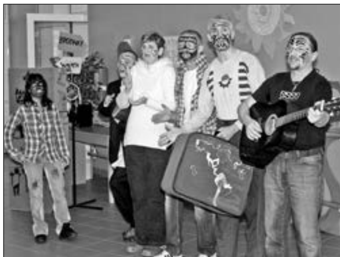
Hostitelé připravili studentům zajímavý kulturní program.