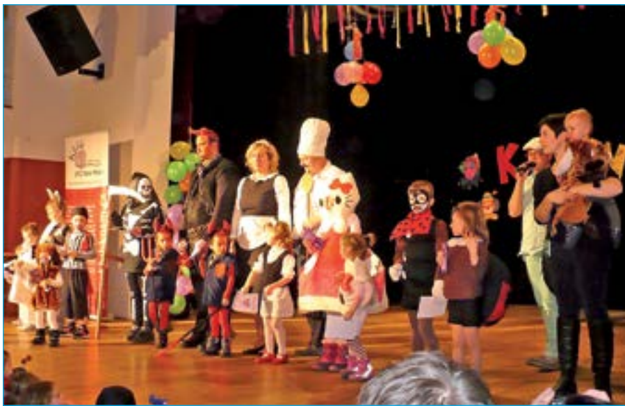
Vyhlášení neoriginálnějších masek.