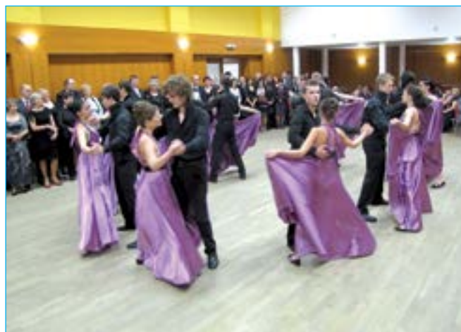
Polonézu zatančili studenti Střední odborné školy a Gymnázia Staré Město.