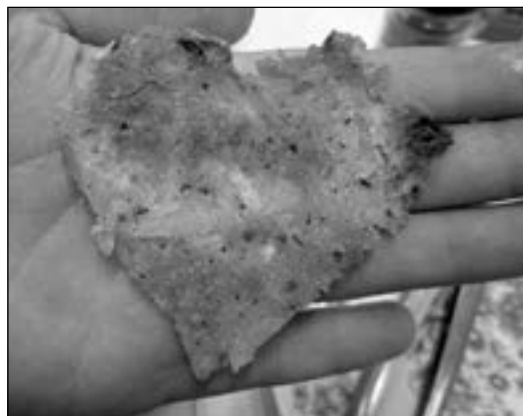
Z vypěstovaných brambor jsme uvařili výtečné pochoutky.