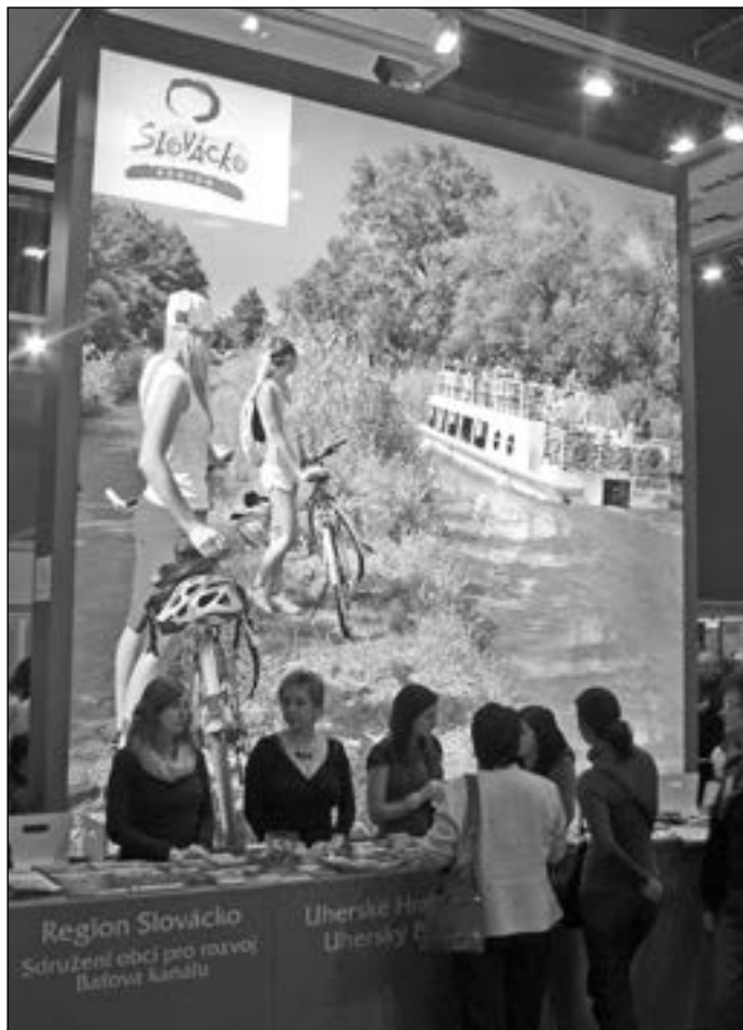
Velkým lákadlem expozice Zlínského kraje byl světelný poutač Bařova kanálu a cyklostezek.

Pro posílení turistického ruchu ve Starém Městě je nutné daleko více využívat potenciálu, který nám přináší historický odkaz Velké Moravy. Dále je velmi důležitá podpora turistické lokality Bařova kanálu a vzájemně provázaných cyklostezek i úroveň gastronomie v místních stravovacích a ubytovacích zařízeních, možnost ochutnávky krajových specialit a dostatečná nabídka volnočasových aktivit.