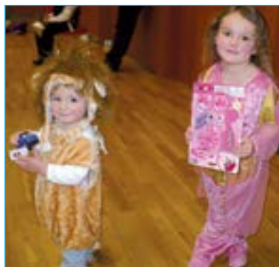
Karolínka a Martínek byli naprosto spokojeni s tombolou.