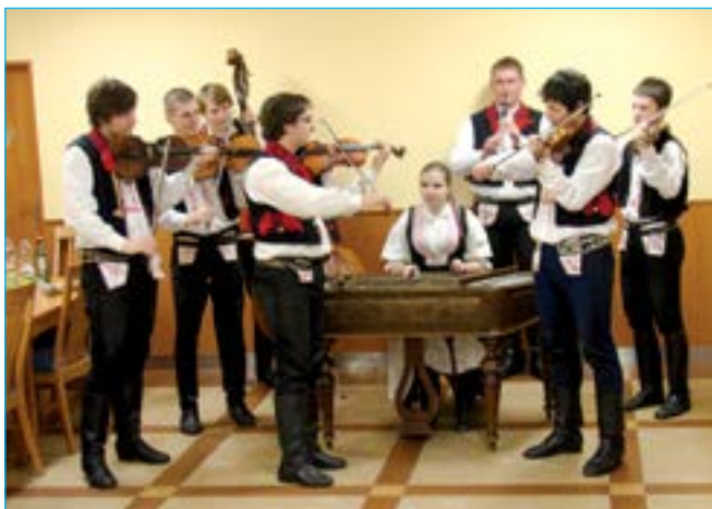
Cimbálová muzika Bálašáci hrála až do časných ranních hodin.