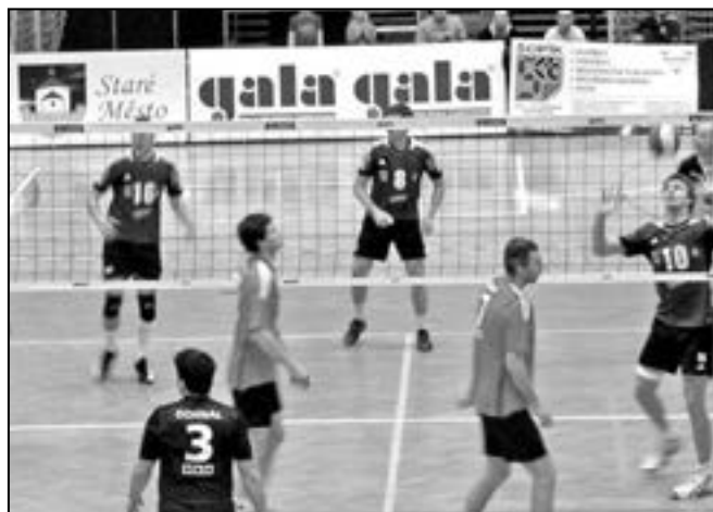
Volejbalisté VSK Staré Město se opět radovali z vítězství.