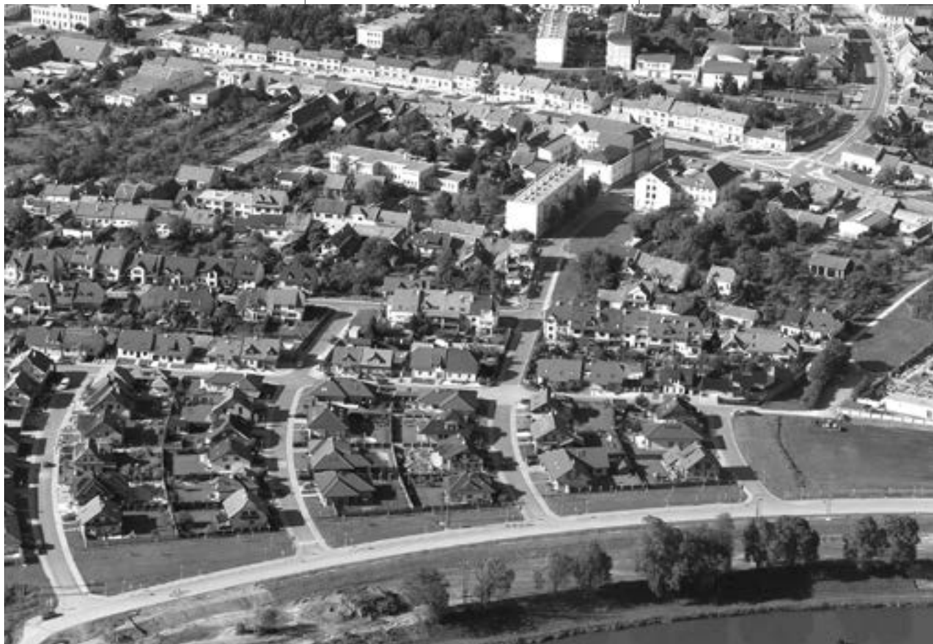
Pohled na Staré Město ve směru od řeky Moravy.