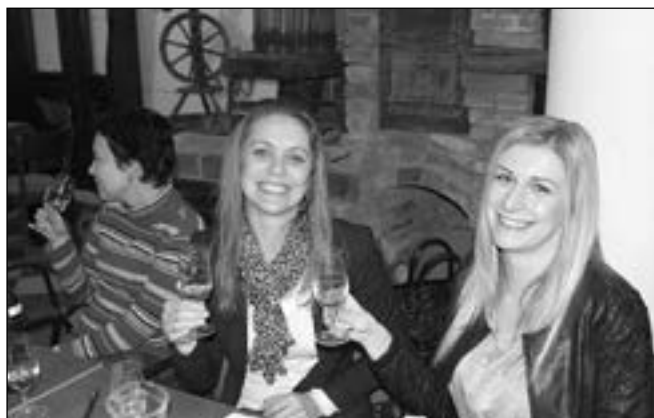
Vinaři připravili ze své produkce více než 40 vzorků, tvořící průřez odrůd pěstovaných na vinicích Slovácka. Víno chutnalo i ženám na snímku.

V přátelské atmosféře bylo na programu především koštování mladých vín a debata o senzoryckých vlastnostech ročníku 2013. Vinaři sdružení do Klubu přátel vína připravili ze své vlastní produkce více než 40 vzorků, tvořící průřez odrůd pěstovaných na vinicích Slovácka.