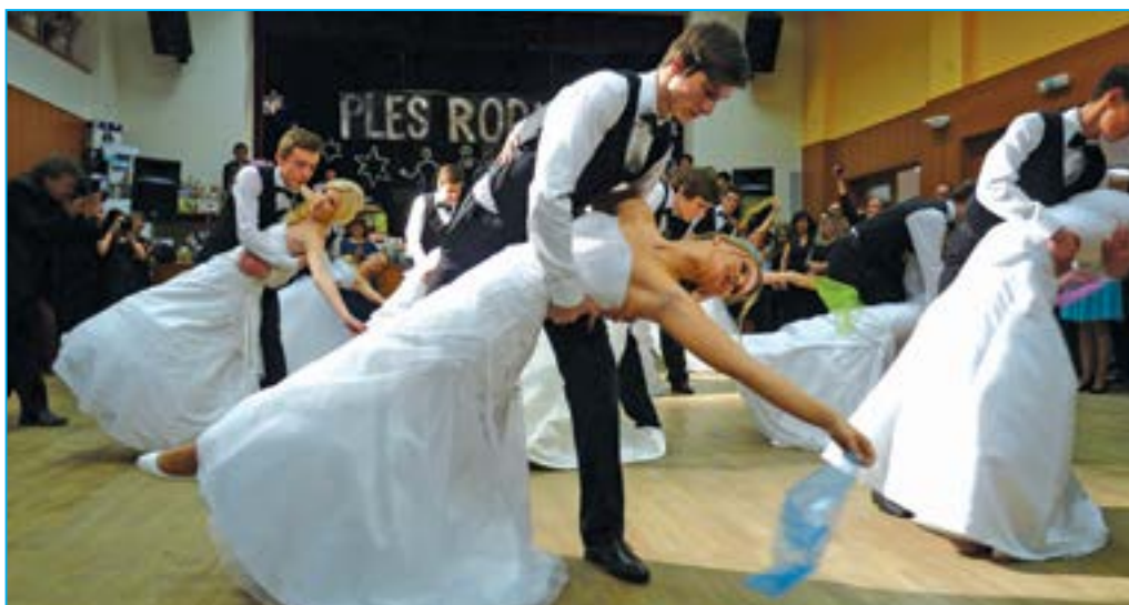
Polonéza je velkým lákadlem pro návštěvníky Plesu rodičů.