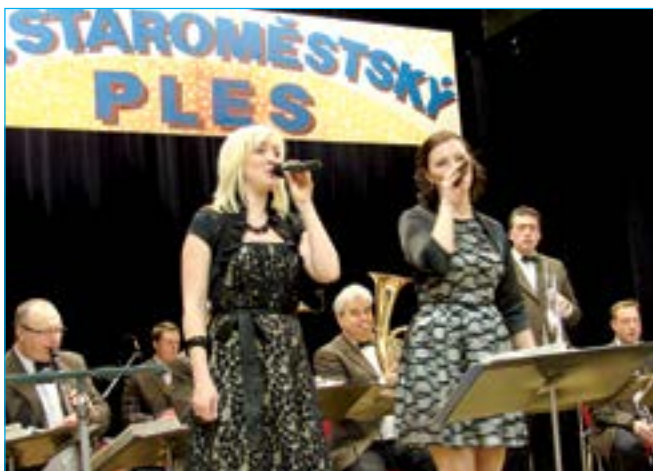
Dechová hudba Skoroňáci se návštěvníkům plesu velmi líbila.