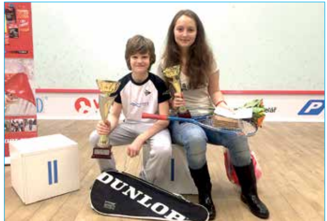
Gratulujeme oběma sourozencům ke krásnému úspěchu.