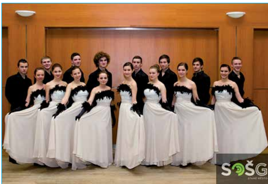
Polonéza na plesu po právu sklídila velký potlesk.

Hosté si mohli zakoupit losy do tomboly rozlišené čtyřmi barvami. Téměř rychlostí blesku neměli žáci třetích ročníků ani jeden lístek, který by ještě mohli nabídnout. Ceny do tomboly věnovali firmy, instituce a rodiče žáků třetích ročníků, kteří se, jak je každoročně zvykem, podílí na organizaci plesu. Zatímco některé ceny byly velmi praktické, např.