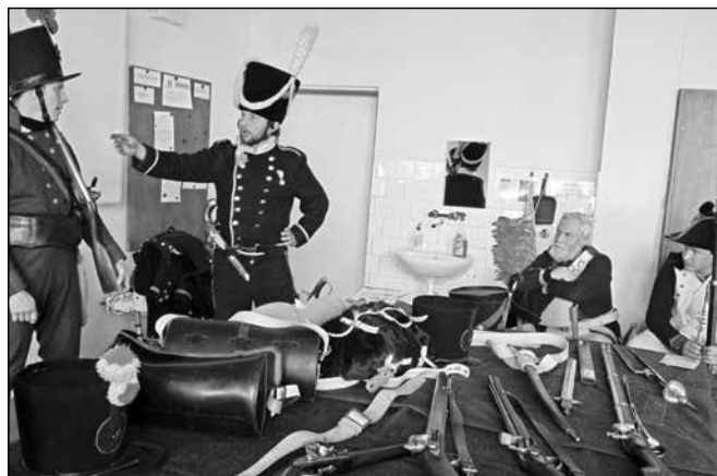
Dobu napoleonských válek přiblížili žákům rodiče některých z nich.

řů přímo na bojišti a vidět střelbu z historických zbraní. A ohlasy? „Není nad to, když si pušku nebo pistoli mohou potěžkat v rukách“.