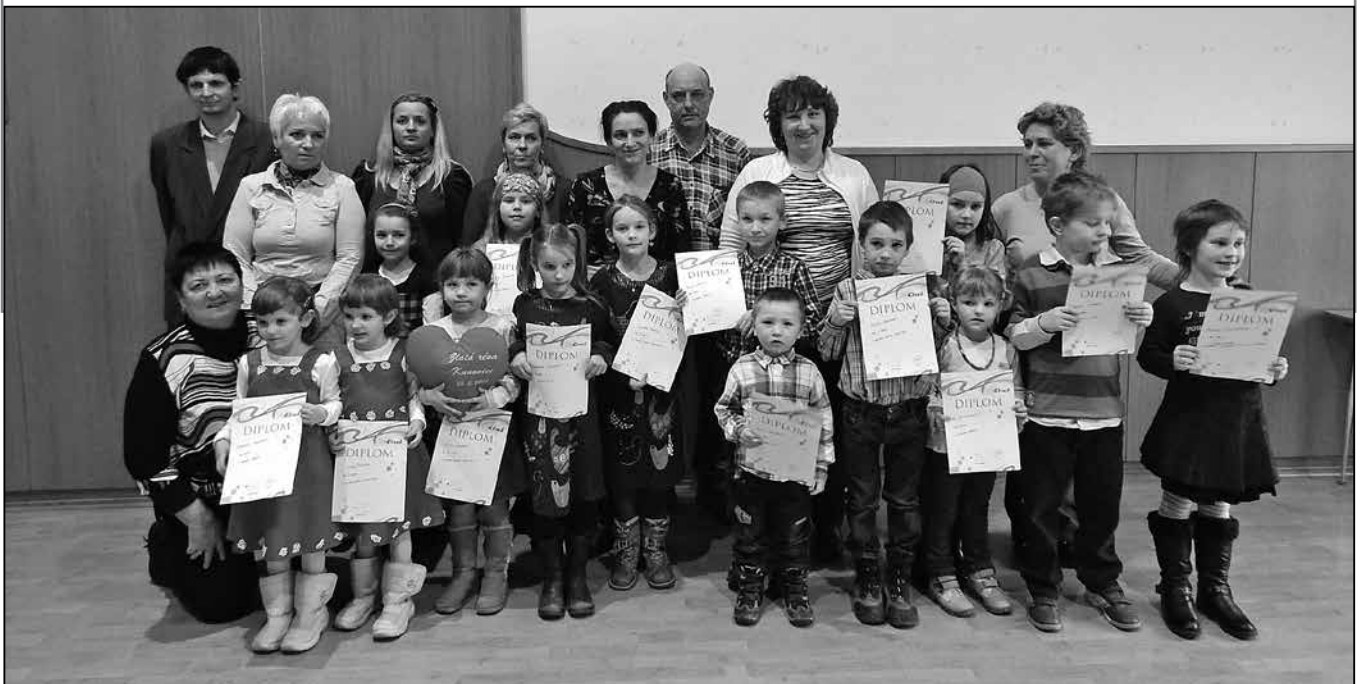
Společná fotografie účastníků recitační soutěže.