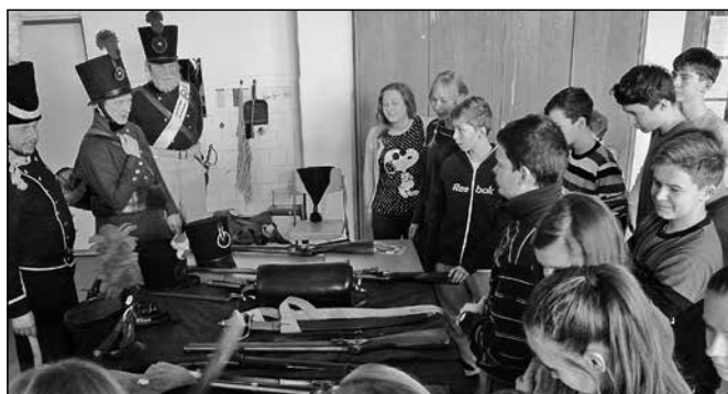
Žáci ocenili především možnost si vojenskou výstroj sami osahat.

Již potřetí předvedli nadšenci pro historii z řad rodičů praktickou ukázkou zbraní, vojenské výstroje i průběhu nejznámějších bitev žákům ZŠ ve Starém Městě. Po husitském období a třicetileté válce v minulém školním roce se současní osmáci účastnili i napoleonských válek. Ukázka se soustředila především na bitvu u Slavkova. Po prostudování taktiky jednotlivých armád si děti osahaly repliky historických braní a výstroje, měly možnost obléci se do vojenských uniforem, seznámit se s prací léka-