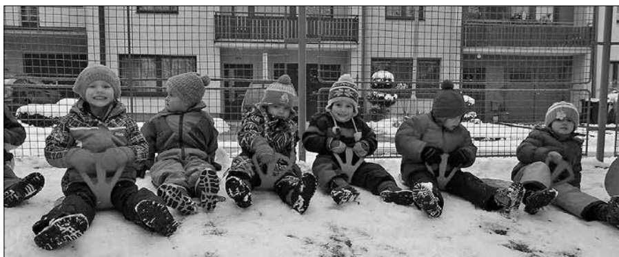
Zimní radovánky v mateřské škole Komenského. Mnoho sněhu nenasněžilo, ale i to málo si děti na zahradě užily.