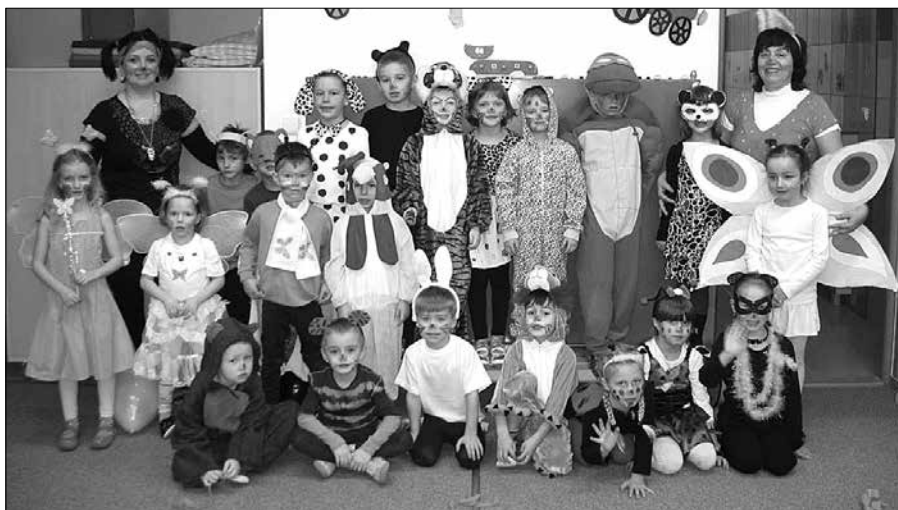
Každoroční únorový karneval se v mateřské škole Komenského konal ve znamení zvířátek. Tančilo se hodovalo a vesele soutěžilo a všichni se výborně bavili.