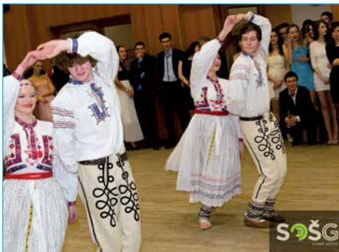
Školní folklorní soubor ukázal vysokou úroveň a nadšení, se kterým se studenti této činnosti věnují.