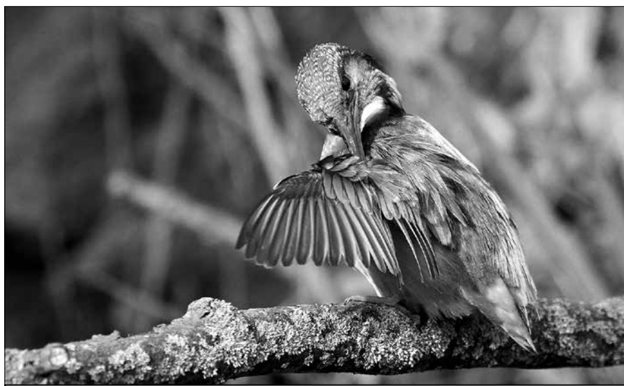
Aby pokryl energetické nároky, spořádá denně ledňáček množství potravy, které odpovídá asi 60 procentům jeho hmotnosti.

metr pod vodní hladinu. Pod vodou se ledňáček orientuje pouze podle dotyku, proto je úspěšný asi jen jeho každý desátý pokus. I přesto, že se počty ledňáčků na našem území zvyšují, stále je rázen mezi silně ohrožené živočichy. Průměrný věk tohoto pouze okolo 40 gramů vážícího překrásně zbarveného ptáka je 7 let.