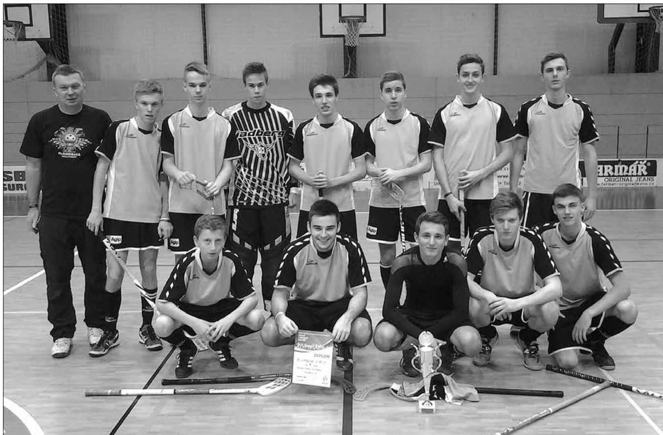
Vítězné družstvo SOŠGSM Staré Město.