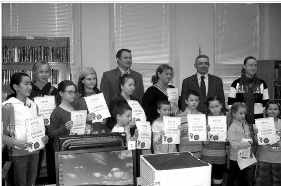
Zástupci vedení města spolu s oceněnými dětmi.