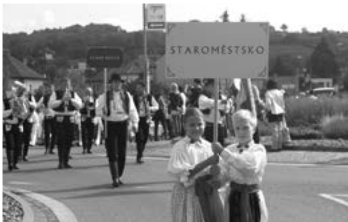
Početný průvod směřoval na Masarykovo náměstí

vydat ke slavnostnímu defilé na Masarykovo náměstí v Uher-ském Hradišti. Kulturní program a představení Staroměstska se pak tradičně konalo na nádvoří Staré radnice.