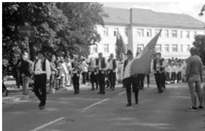
V čele nechyběli představitelé radnice