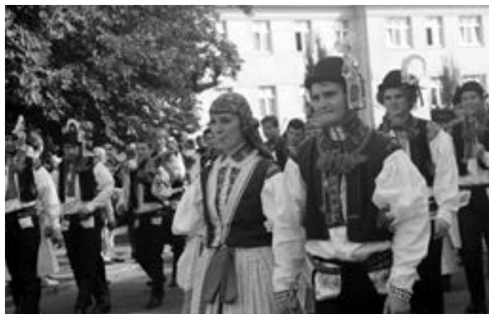
Dolína v průvodu