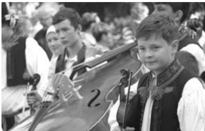
Mládež folkloru fandí