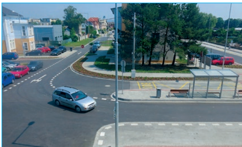
Ulice Nádražní po revitalizaci

U znovuotevření Nádražní ulice tak nechybělo stříhání pásky, přípitek a, jak už je ve Starém Městě zvykem, také požehnání od zdejšího duchovního otce Miroslava Suchomela. „Projekt obsahoval především zabezpečení zdejšího dopravní-