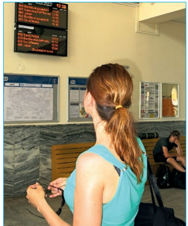
KORIS v praxi

A ještě jedna novinka by měla přispět k plynulosti a přehlednosti dopravy. Ta se ale neskryvá v exteriérech, ale naopak na ni cestující narazí přímo v prostorách nádražní haly. Jde o projekt Zlínského kraje, tzv. KORIS, tedy Komplexní odbavovací, řídicí a informační systém veřejné dopravy ve Zlínském kraji. Pod tímto krkolomným názvem si obyčejný smrtelník asi jen těžko představí, co to v praxi znamená. V zásadě jde ale o velmi jednoduchou věc. Cílem Zlínského kraje je v rámci tohoto projektu dosáhnout zkvalitnění veřejné hromadné dopravy. Mělo by jít o lepší synchronizaci a návaznost spojů, ale také o lepší informovanost cestujících. Právě v odbavovací hale staroměstského nádraží se tak v rámci projektu objevily informační elektronické panely, které cestujícím sdělují odjezdy autobusů i vlaků, číslo