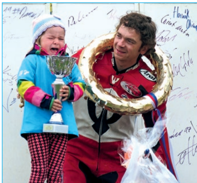
„Zvláštní smůtok vítězů“.