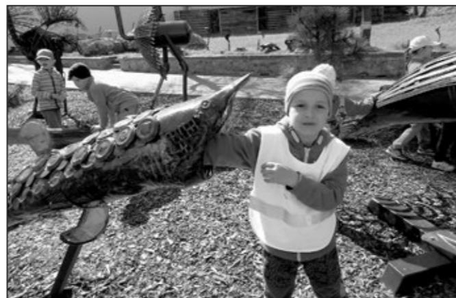
Momentka z návštěvy Kovoovoo.