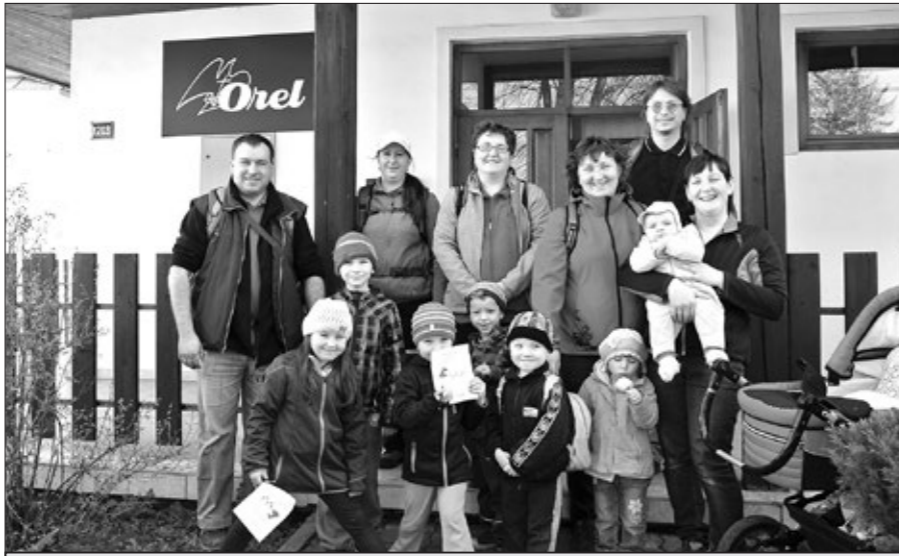
Výletníkům přálo počasí