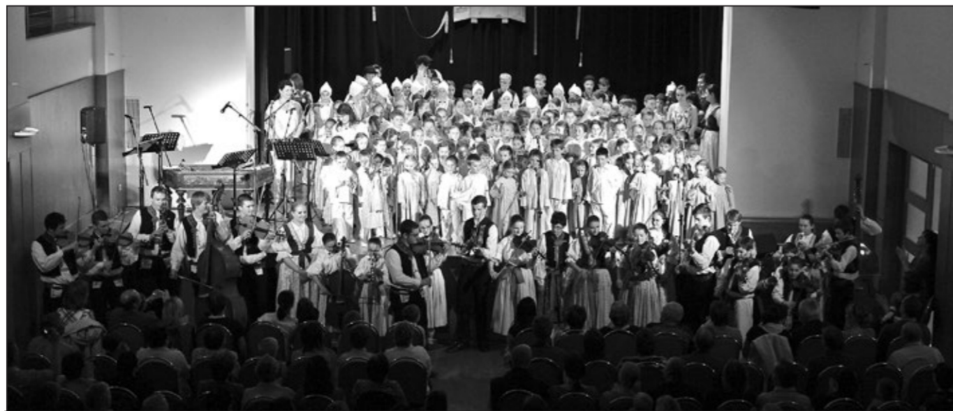
Na pódiu se představily všechny skupinky Dolinečky