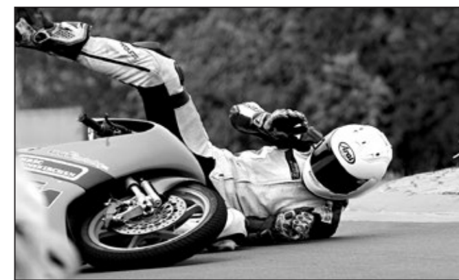
....a padalo se...