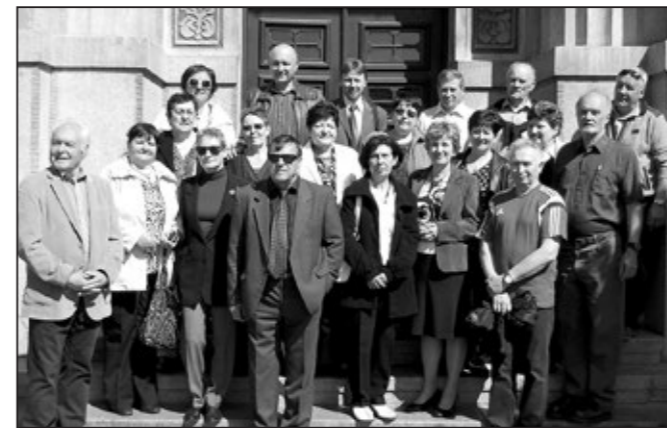
„Áčko“ ročníku 49/50 přede dveřmi školy