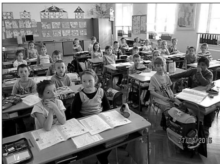
Ekotým prošel všechny třídy