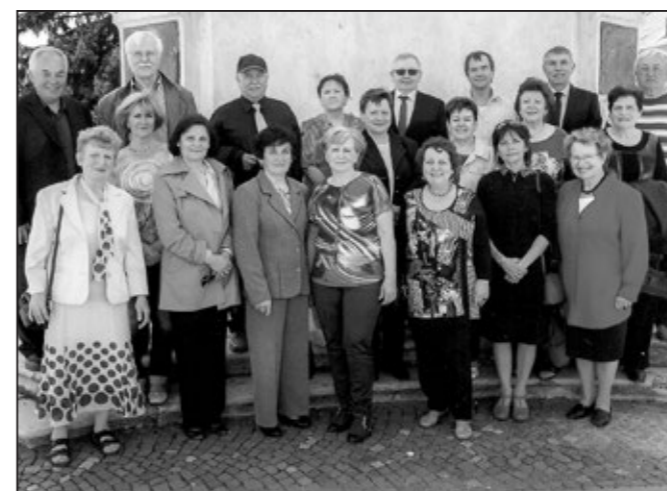
Třídy B a C ročníku 49/50 na Mariánském náměstí v Uherském Hradišti

Tři třídy školního ročníku 49/50 se setkaly ve Starém Městě 25. dubna 2015. Mše svatá za živé i zemřelé pětadesátníky se uskutečnila v kostele sv. Ducha ve Starém Městě v neděli 5. 7. v 7 hodin.