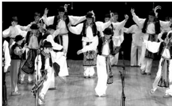
Kluci předvedli verbuňk

Milé děti a vážení vedoucí dětského souboru Dolinečka,