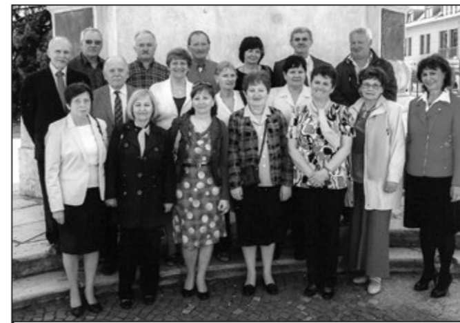
Třídy B a C ročníku 49/50 na Mariánském náměstí v Uherském Hradišti