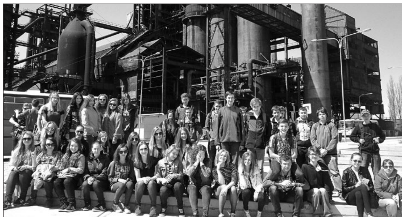
Exkurze do Ostravy.