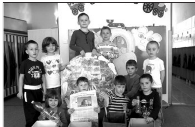
Výuka třídění odpadu ve třídě.