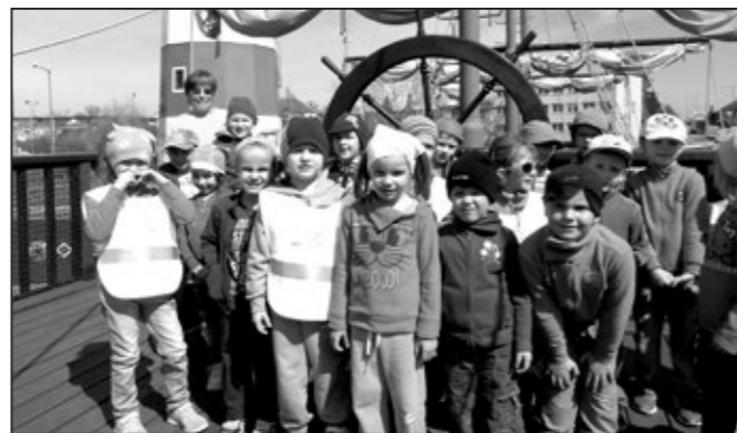
Děti u lodi Naděje.