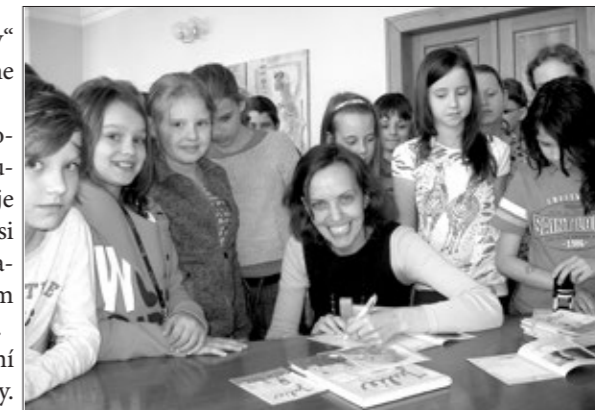
Sympatická spisovatelka v obležení dětí.

Já můžu mít požadavek na ilustrátora, vydavatelství může mít požadavek na ilustrátora, ale záleží na tom, kolik bude chtít ilustrátor peněz. Vydavatelství totiž platí