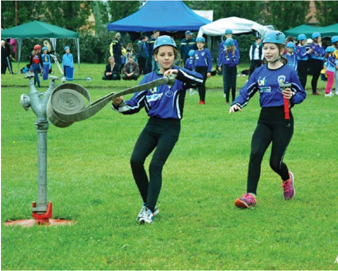
Mladí hasiči na disciplíně Štafeta požárních dvojic