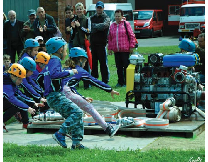
Družstvo mladších žáků při náběhu na základnu během disciplíny Požární útok