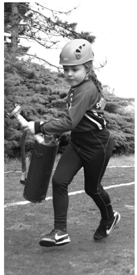
Členka družstva mladších při přenosu PHP