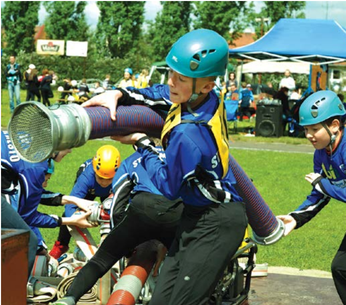
Družstvo starších žáků během Požárního útoku