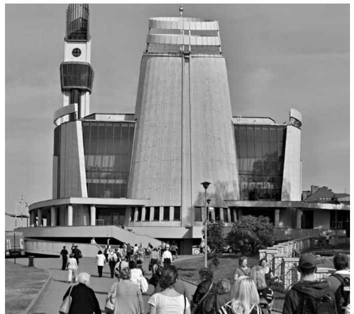
Krakow-Lagiewniki - Chrám Božího Milosrdenství