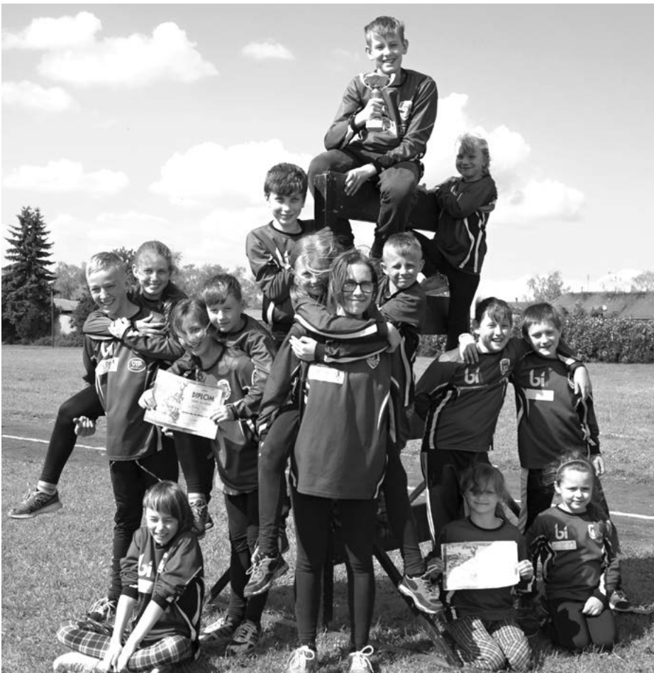
Společná fotografie mladých hasičů Staré Město