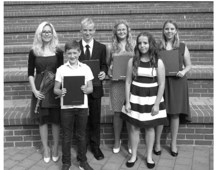
Společná fotografie zástupců okresu Uherské Hradiště po promoci