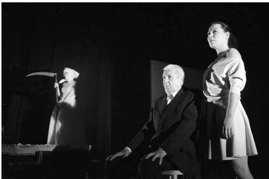
Cena facky aneb Gottwaldovy boty

Inscenace měla premiéru v červnu roku 2014 a ihned se stala