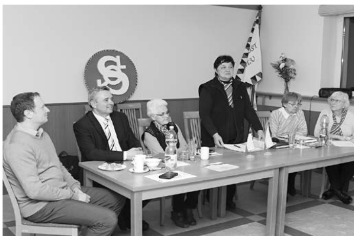
Poděkování zástupcům města