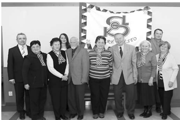
Naše Věrná garda