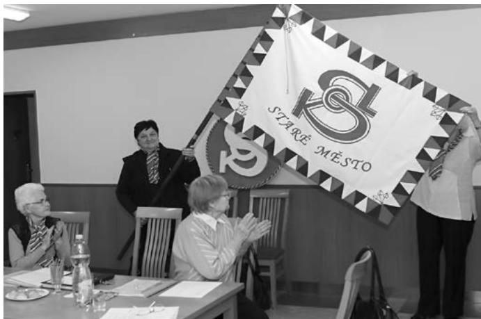
První rozvinutí nového praporu

Text, který zdobí nový prapor staroměstských sokolů „V MYSLI VLASTI V SRDCI SMĚLOST V PAŽI SÍLU“ byl původně umístěn (podle archivních materiálů a svědectví pamětníků) v průčelí staroměstské sokolovny.