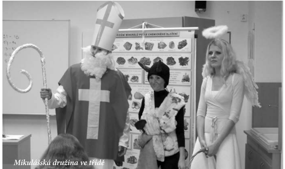
Mikulášská družina ve třídě