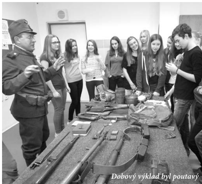
Dobový výklad byl poutavý