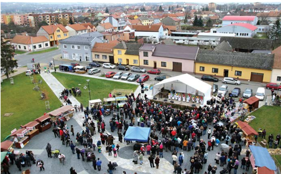
V neděli bylo na náměstí plno