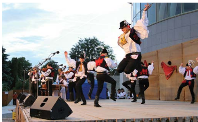
Verbíři na Zahradě Moravy