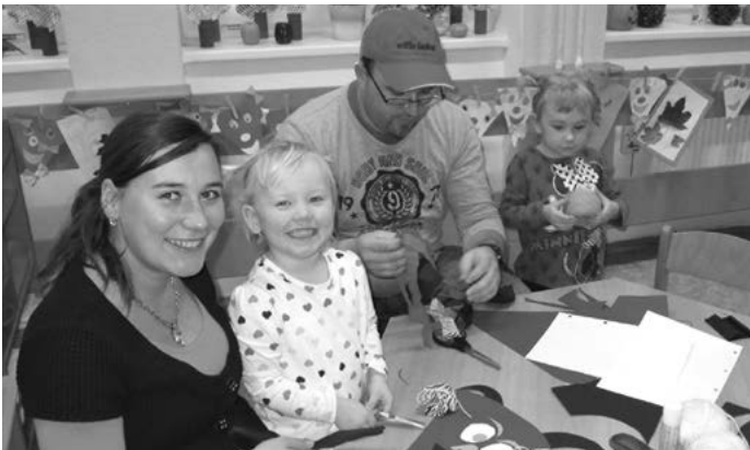
Do výroby se zapojila celá rodina