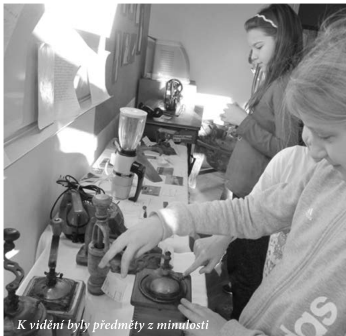
K vidění byly předměty z minulosti