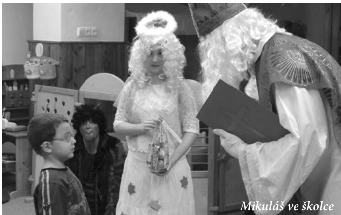
Mikuláš ve školce

7. prosince přišel na návštěvu do MŠ Komenského Mikuláš s andělem a čertem. Z Mikulášské knihy přečetl, v čem by se mohly děti ještě zlepšit a co se jim už podařilo. Všechny dostaly od anděla balíček dobrot a od čerta uhlík. To aby si pamatovaly, že čert nikdy nespí.