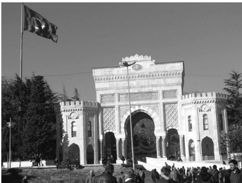
Vstup do paláce Topkapı

Sobota 21. 11. byla opět ve znamení vodního programu. Dopoledne jsme navštívili obrovskou čističku odpadních vod Ataköy s výrobou bioplynu a kogenerační jednotkou pro výrobu energie a tepla. Toto