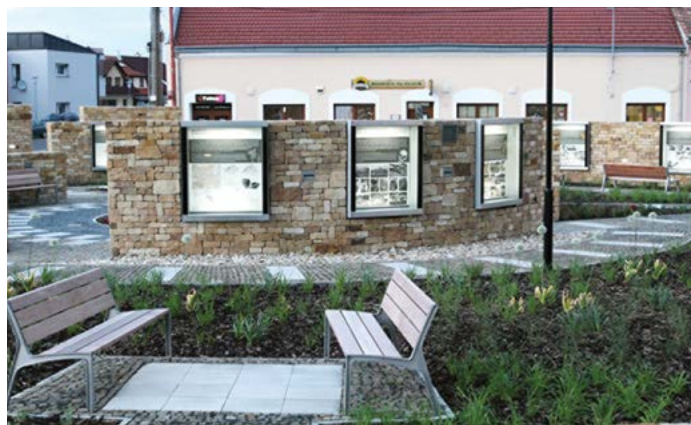
Rozcestí Velké Moravy dokončeno