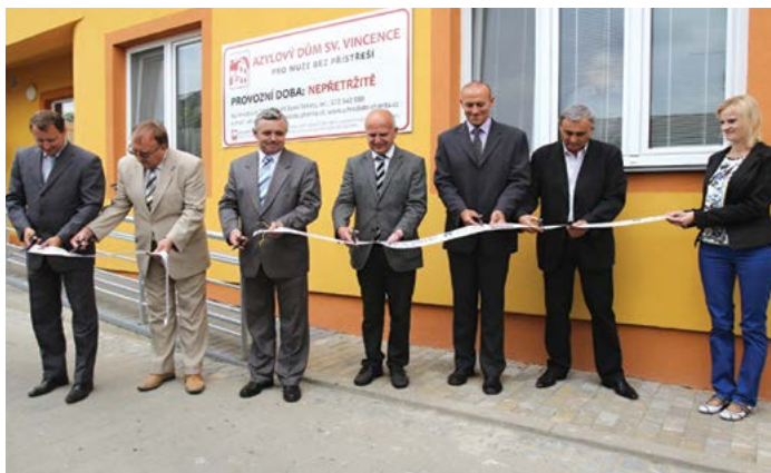
Rekonstrukce azylového domu