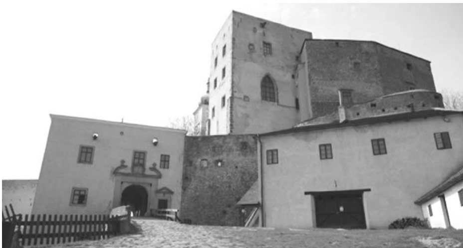
Hrad Buchlov otevře na Štěpána brány

Během svátků bude možné vydat se také do kina. To pro letošní rok přichystalo opět bohatý program. Na sobotu 26. 12. i na neděli 27. 12. se mohou těšit především děti. Právě pro ně jsou tady totiž na programu oblíbené animované filmy, jako třeba Hotel Transylvánie 2, Krtek o Vánocích nebo V hlavě. Dospělejší diváci si pak v pondělí 28. 12. mohou zajít na drama-