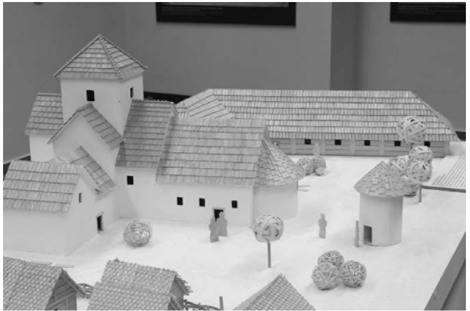
Model Sadské výšiny