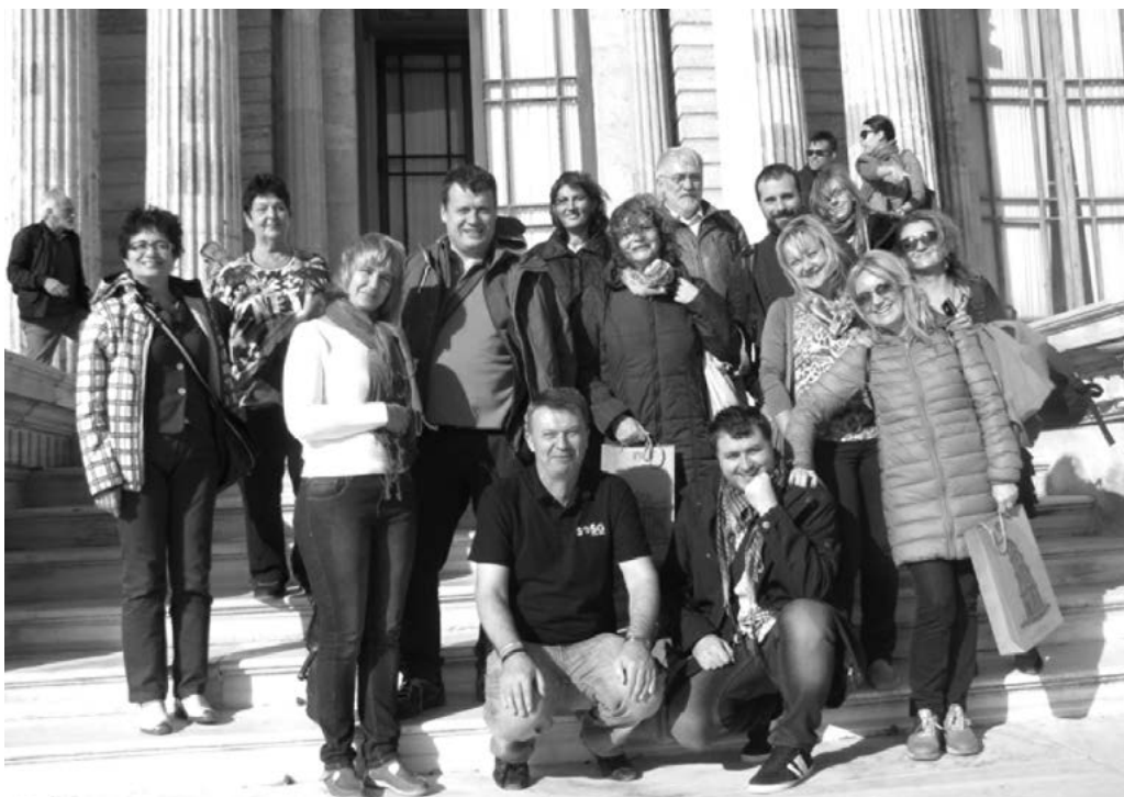
Staroměstská výprava v Istanbulu

zařízení slouží 1 600 000 obyvatel a v budoucnu bude upraveno pro 2 500 000 obyvatel. Istanbul má podobných čistíček 17. Odpoledne jsme se podívali umění dávných stavitelů, když jsme stáli u paty Bozdoğan Akvaduktu, který přiváděl vodu do istanbulských cisteren. Dnes je mnohem nižší než v minulosti, i tak svými rozměry budí respekt. Odpolední program jsme završili prohlídkou Nové mešity, Yeni Cami, která se nachází v blízkosti Galatského mostu. Poté studenti vyrazili užívat volného času a učitelé pokračovali strmě do kopce do čtvrti Galata na prohlídku věže Galata Tower a na večeři.