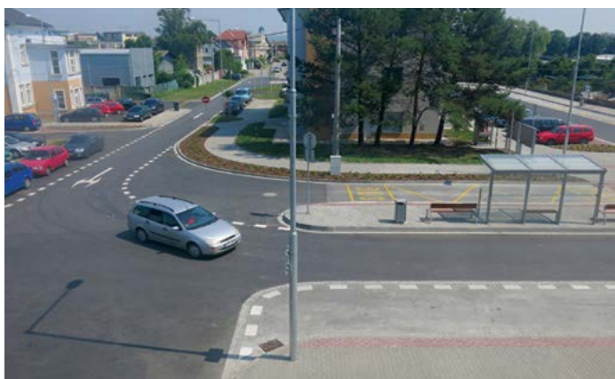
Revitalizace ulice Nádražní