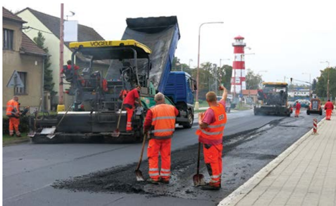
Oprava hlavního tahu