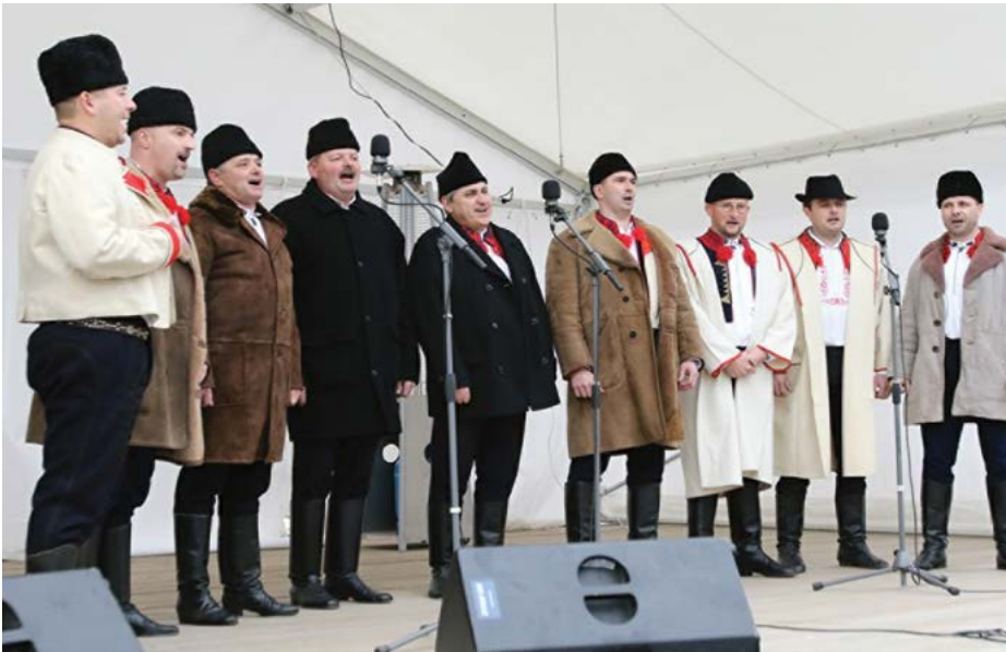
Program obohatil i mužský sbor