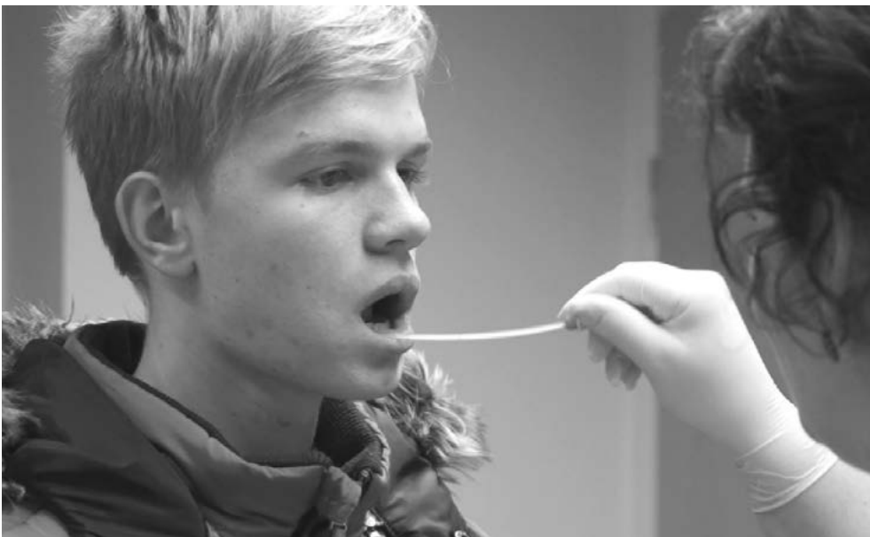
Odběr DNA pomocí slin