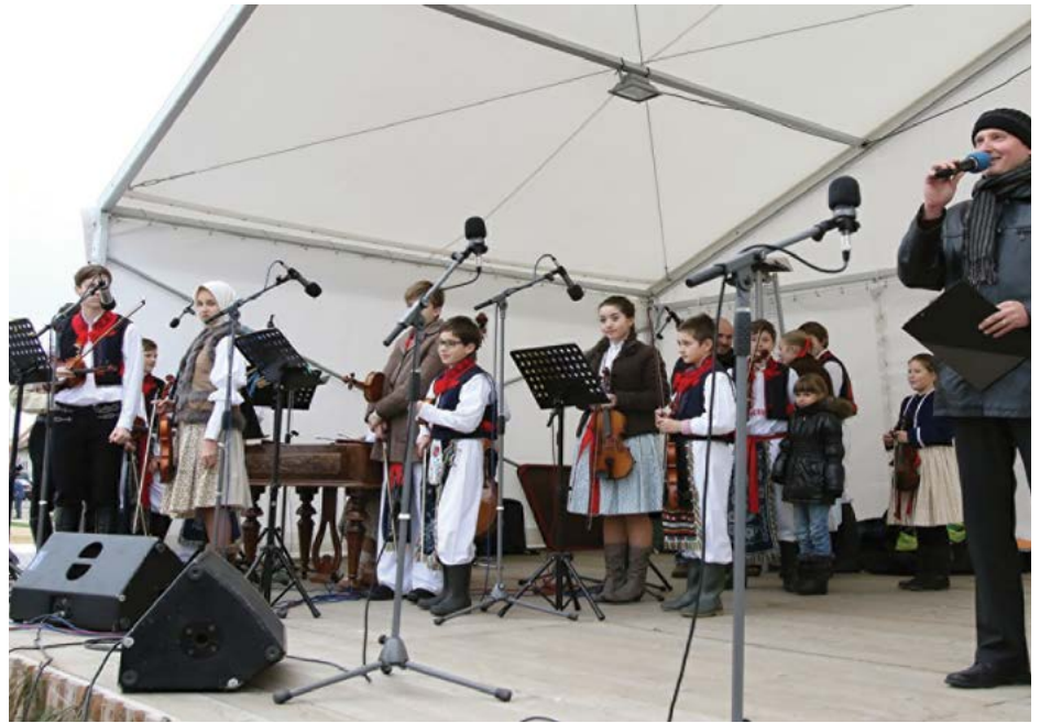
Vánoční jarmark nabídl bohatý program

Předvánoční akce pokračovaly také v neděli 6. prosince Vánočním jarmarkem. Ten opět nabídl několik desítek stánků s tradičními výrobky i pochutinami. Kdo chtěl poctivě pletené ponožky, domácí med, vykrajovátka na perníčky nebo třeba koření, stačilo mu popojít jen několik kroků a měl nakoupeno. Náměstím voněl také svařák a masné speciality. K tomu všemu samozřejmě bavit početné publikum bohatý kulturní program. Zpěvem a tancem jej zahájily děti z Dolinečky, na pódiu se ale předvedli i členové Doliny, Repetilek nebo CM Báležáci. Svůj krátký hudební part představili i klienti Domova pro zdravotně postižené, kteří dokázali, že zpěv rozhodně k jejich koníčkům patří. „My se každý