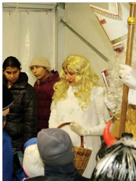
Dárčky dostaly všechny děti