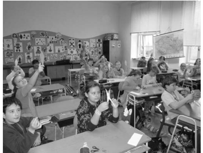
Děti při výrobě papírových jeřábů