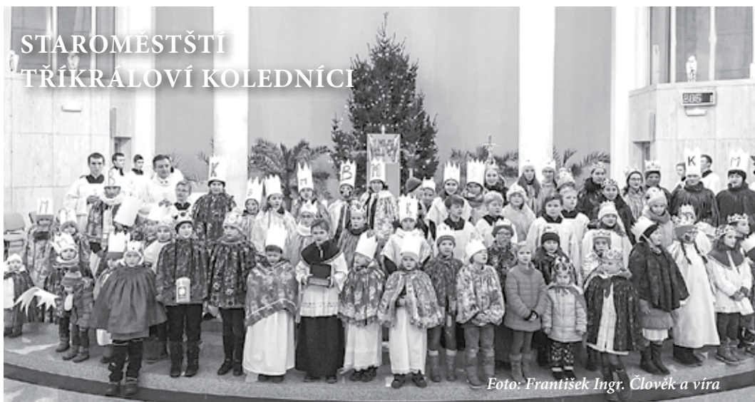
Člověk a víra