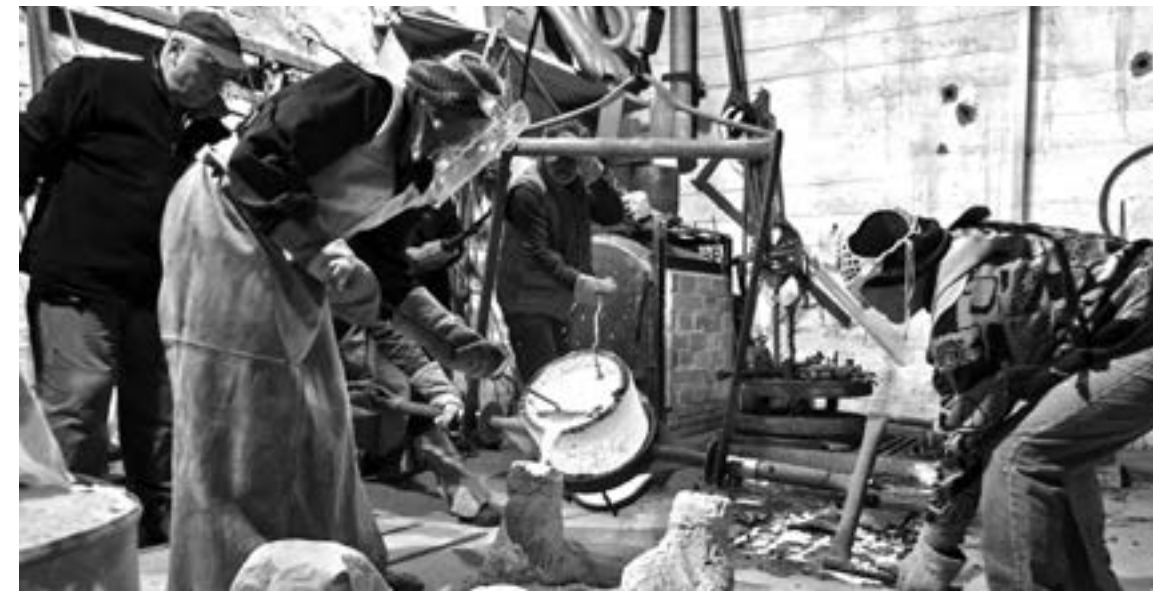
Odlévání do forem