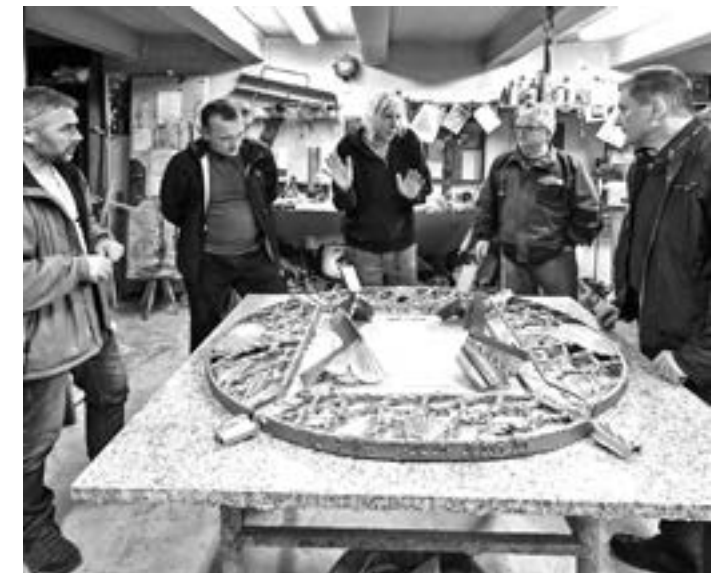
Odlitá část svatostánku před další úpravou