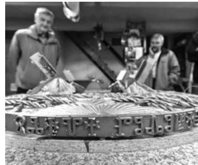
Detail spodní části