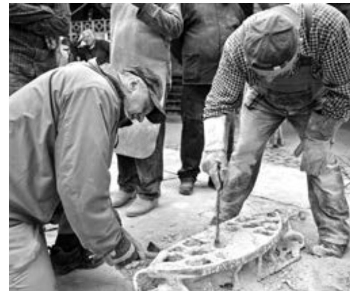
Dolování odlitků z formy